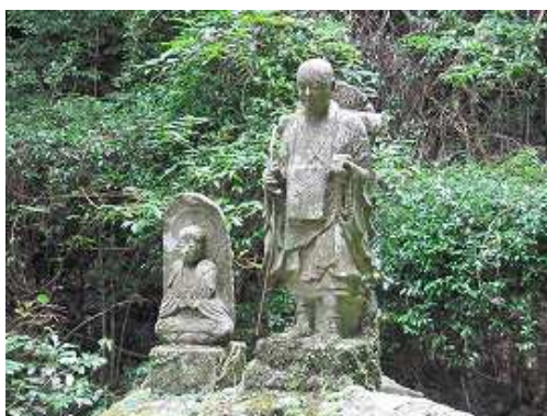
左に石仏と上人像を見る。