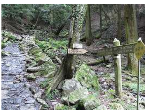
紅葉谷分岐に出会う。