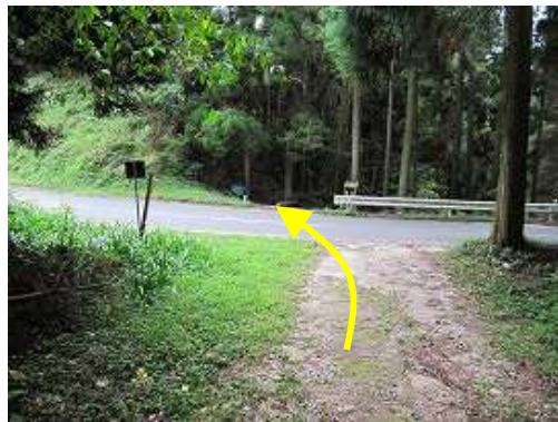
国道322号を横断する。