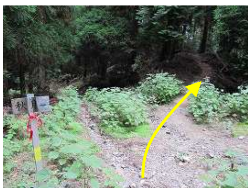
林道から右へ上がる。