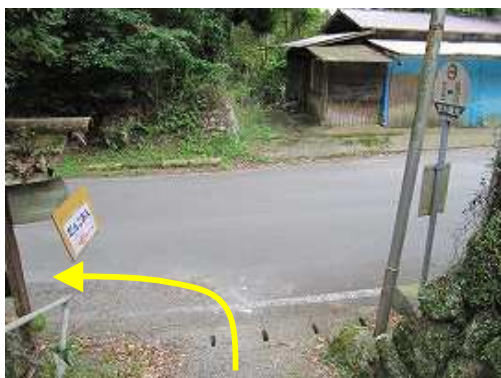
だんご庵入口。左へ向かう。