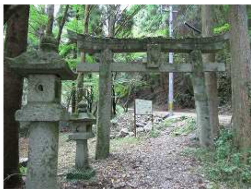
鳥居をくぐり林道を上へ向かう。