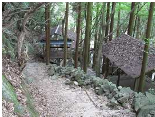
だんご庵の中を抜けて行く。