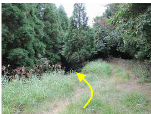
右側の中央部を下って行く。