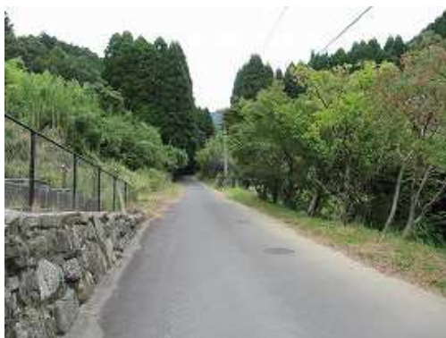
舗装路を緩やかに上って行く。