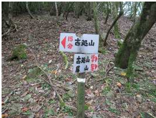
屏山分岐を右見る。