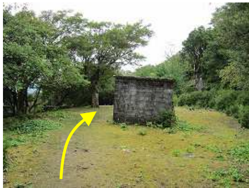
避難小屋のある広場を抜ける。