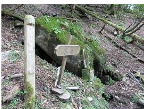
水舟に到着したが、水は涸れていた。