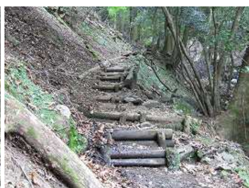
丸太階段を越えて行く。