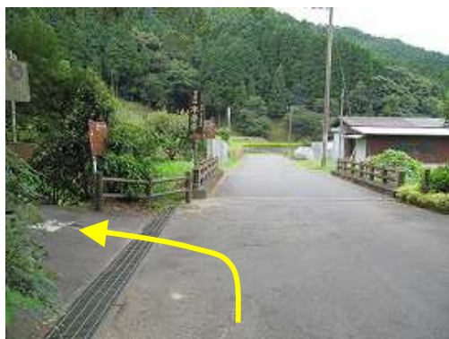
駐車場入口。左折する。