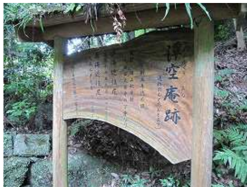
だんご庵の説明板。