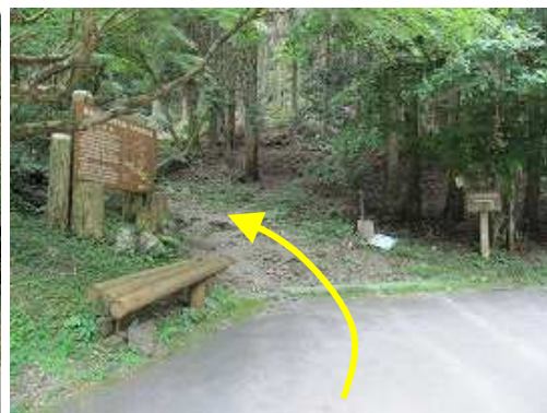
野鳥川を渡ると直ぐに左に折れる。