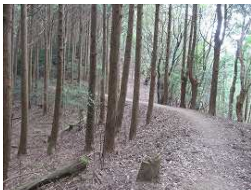
左にスギの植林帯を見て左カーブの平坦路を行く。