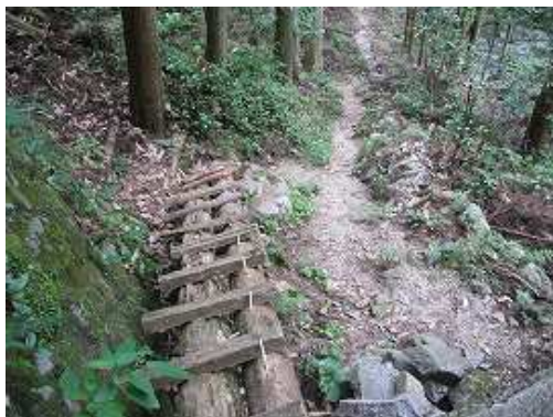
丸太階段を降って行く。