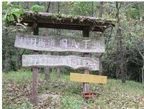
旧八丁道出口の標識から右へ入る。