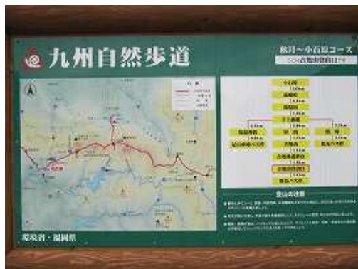
駐車場の地図に目を通し、歩き始める。