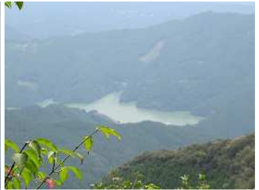
江川ダムを見下ろす。