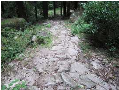
石畳みを下って行く。