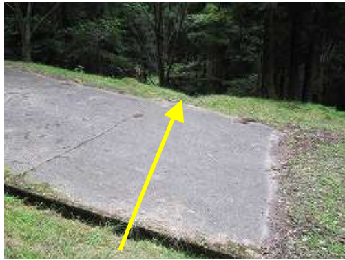
右に広場を見て、横断して下って行く。