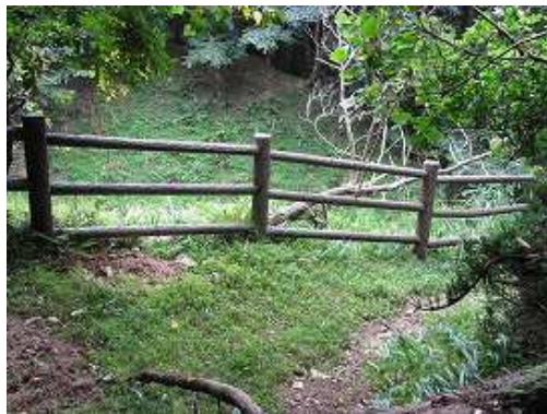
前方に擬木柵が現れるので右に下って行く。