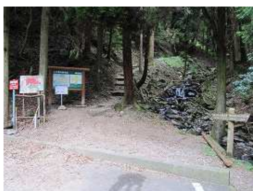
5合目駐車場から始まる5合目登山口。右岸側に取付く。