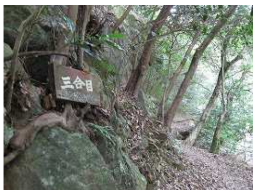
三合目を通過する。