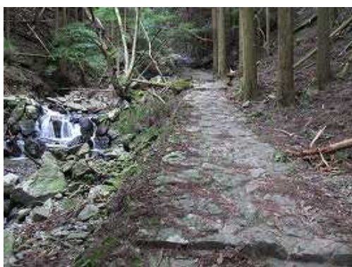
左岸の石畳を詰めて行く。