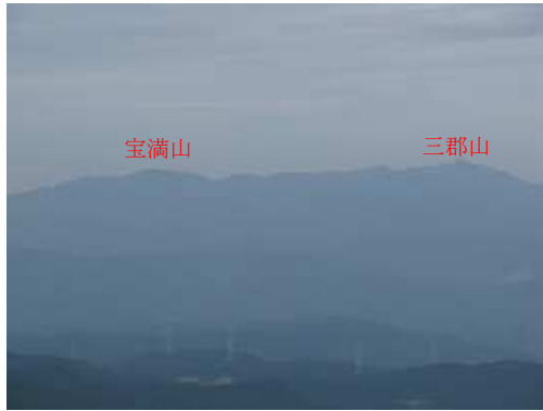
宝満山から三郡山の山並み。