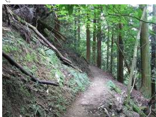
緩やかに左へ巻いて行く。