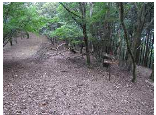
遊人の杜分岐に到着。そのまま直進する。