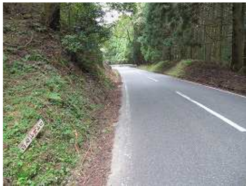
国道322号を秋月へ向かう。