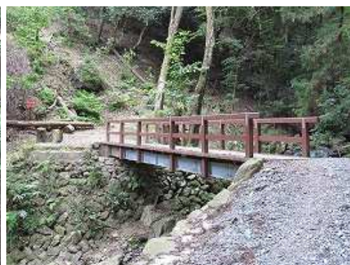
橋を渡り右岸側を歩く。