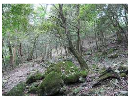
落ち着いた霏雨気の9合目付近を登る。