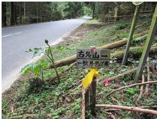
国道取付きの標識。