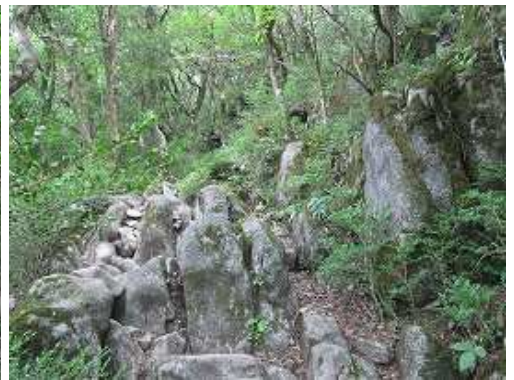
岩場を抜けて行く。