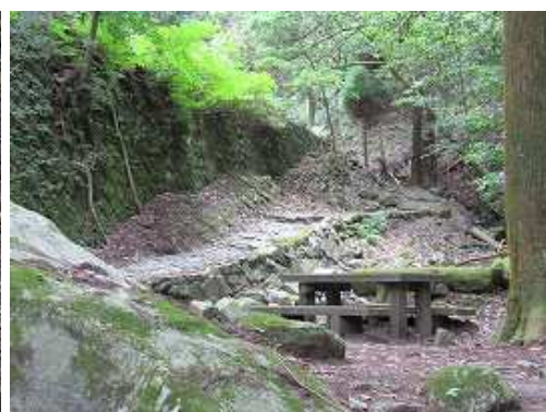
5合目登山口の手前で右上は駐車場。