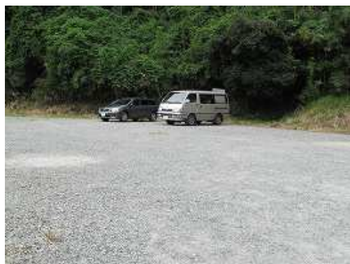
駐車場に帰り着いた。