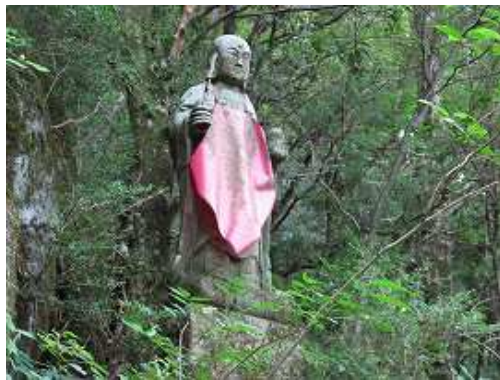
赤い前垂れを付けた地藏さん。