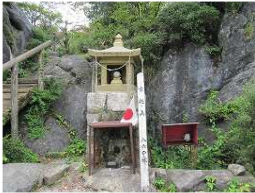
古処山(860m)の山頂部に到着。