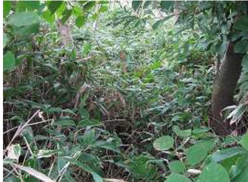
ササに覆われた阿蘇美道なるルートを下る。