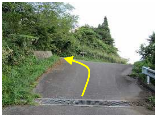
山野草の写真を撮りながら歩くとやがて駐車場への分岐が見えた。