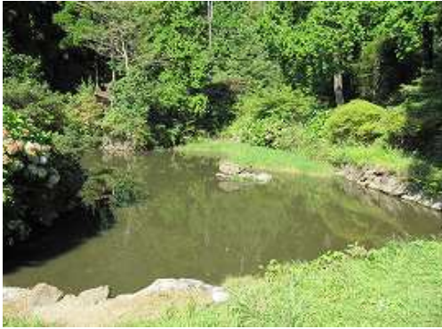
鳥居の右手にある池の淵へ回り込む。覗くと鯉が泳いでいた。