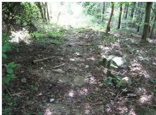
両側に石が並べられており、昔は歩きやすかったのだろう。