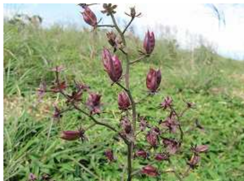
ホソバシュロソウ