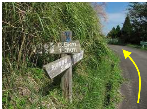
雨山への取付き点の標識。9合目駐車場は上へ向かう。