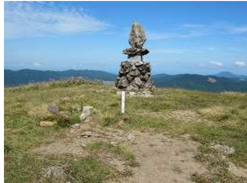
天山(1046m)の山頂。一等三角点で360°の展望が得られる。