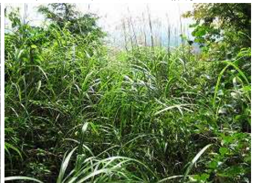
最後の短いヤブ漕ぎが待っていた。