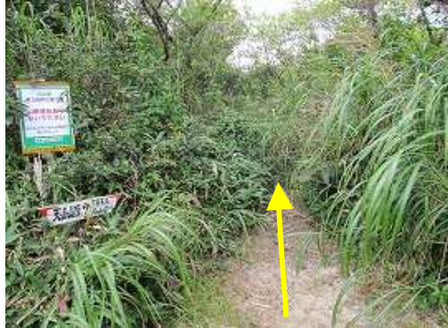
雨山への入口付近は草に覆われている。