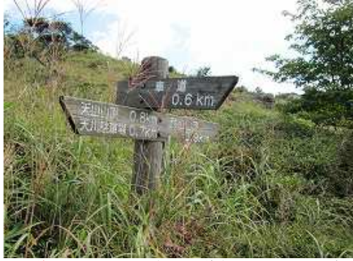
車道分岐の標識に出会う。車道方面のルートもヤブに覆われている。