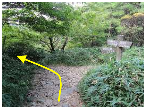
雨山分岐に到着。左のヤブへ入る。