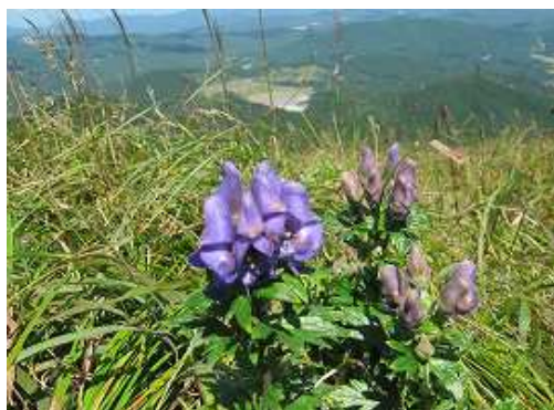
タンナトリカブト