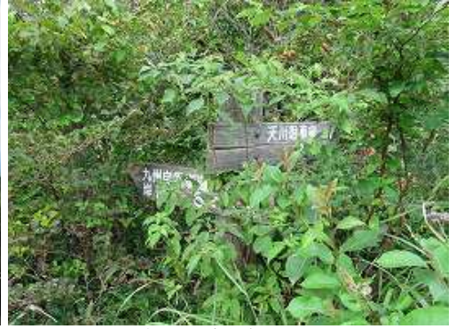
天川分岐に出会う。ヤブ漕ぎはここまで。左へ向かう。右: 自然歩道で岸川の集落へ至る。