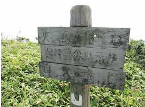
1000m等高線の先にある標識まで、山野草を探しに歩くが、ここで引き返す。