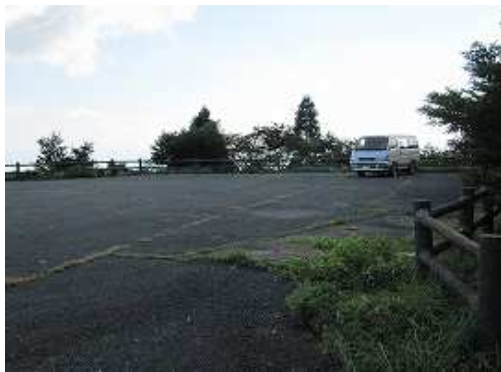
9合目駐車場に帰り着いた。