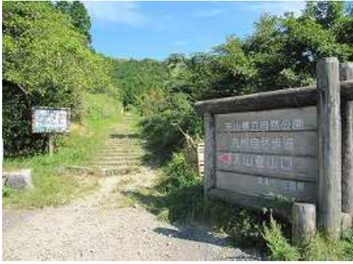
9合目登山口から歩き始める。

9合目登山口～岸川分岐～天山(1046m)～東端～天山(1046m)～雨山分岐～天川分岐～岸川分岐～雨山(996m)～雨山取付～9合目登山口