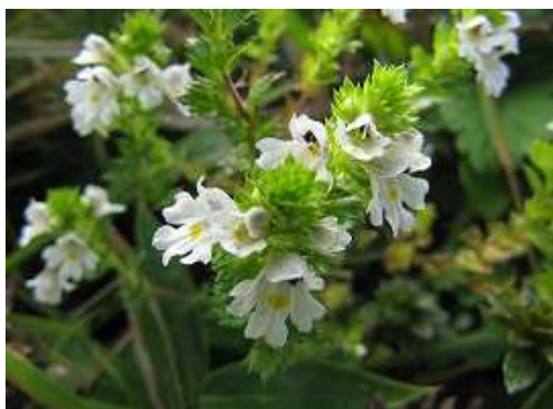
キュウシュウコゴメグサ