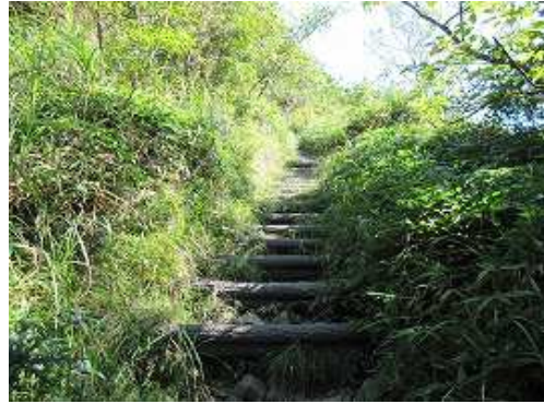
擬木階段を登って行く。