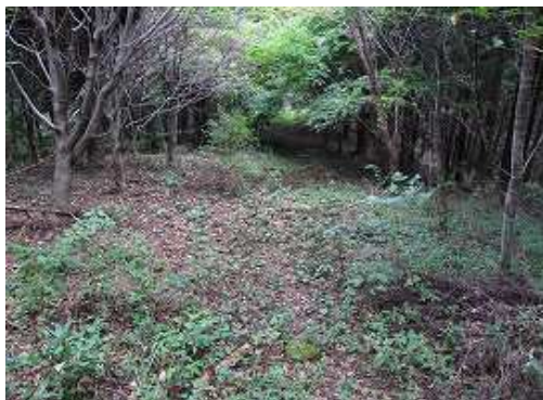
ヤブ漕ぎから解放される。