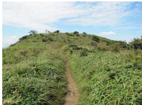
山頂へと引き返す。