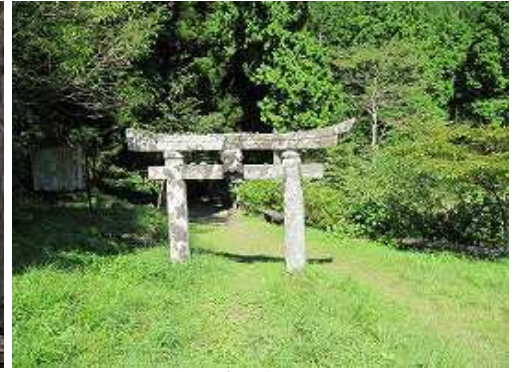
天山神社上宮の鳥居を左に見る。