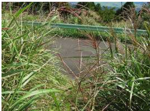
前方下に林道が見えた。