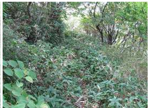
ササに覆われたヤブを漕いで行く。