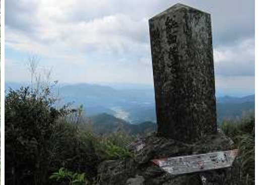
標高996mの雨山に到着。