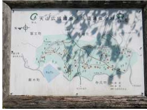
側に建つ案内板に目を通す。