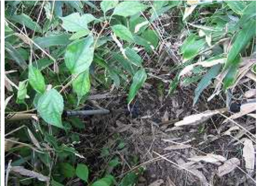
ササを分けると朽ちた丸太階段が残っており、見失わないように時々チェックしながらヤブを漕ぐ。