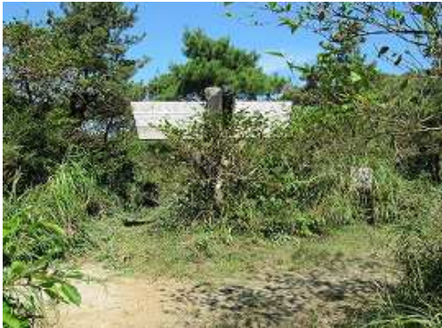
岸川分岐に到着。天山は右へ向かう。左:雨山へ、直進:岸川・天川駐車場へ。