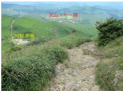
石ころのガレ場を下って行く。天川駐車場や天山スキー場が見える。