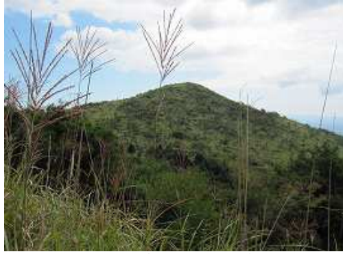
山腹を回り込んで東方向に向かうと、右側に雨山が望める。