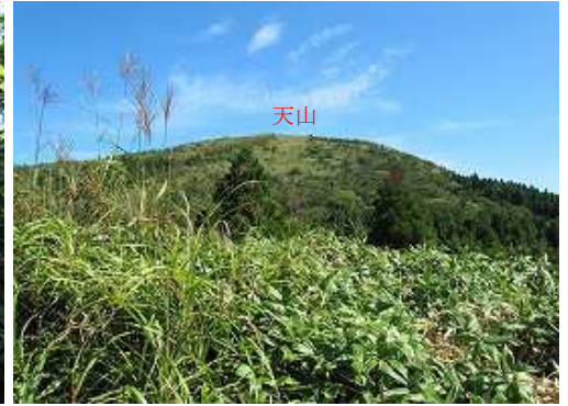
傾斜も緩み小尾根に達すると前方に天山、後方に雨山が望める。