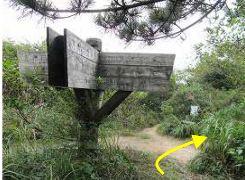
岸川分岐に出会う。雨山は右へ。奥は9合目駐車場へ、左は天山へ至る。