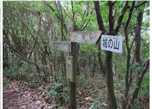
標高846mの城ノ山に到着。四等三角点であるが、樹木に囲まれて展望は得られない。