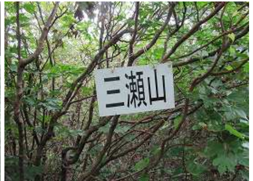
標高790mの三瀬山に到着。樹木に囲まれて展望は得られない。