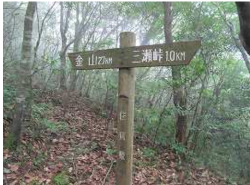
1km地点の標柱を過ぎる。