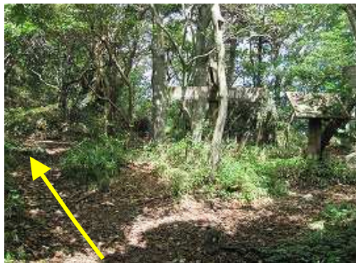
番所跡に到着。金山は左。