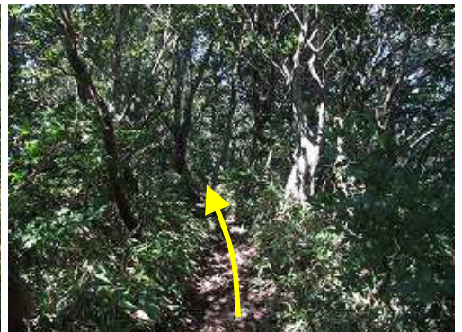
痩せ尾根を抜けると金山。