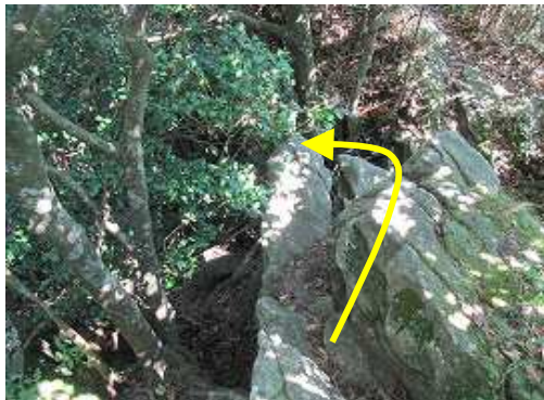
露岩の手前で左下へ2m程岩場を降る。直進すると露岩の展望台で金山が望める。