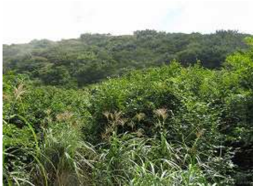
三瀬山から緩やかに下ると弱い鞍部着く。これから向かう城ノ山が望める。