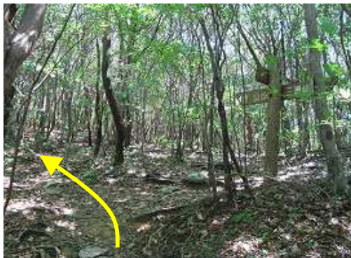
山中分岐を通過する。