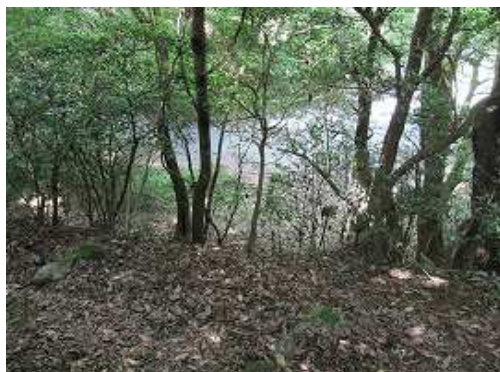
大峠登山口が下に見えた。