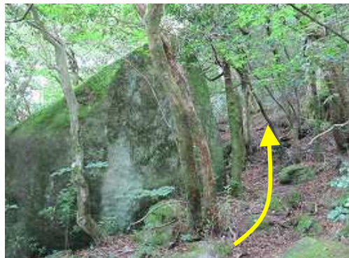
大岩の右を抜けて行く。