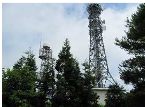
反射板跡から見上げたアンテナ。