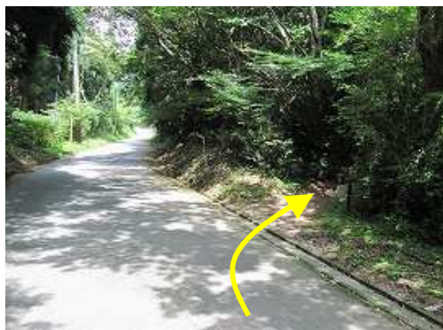
道路から右へ入る。