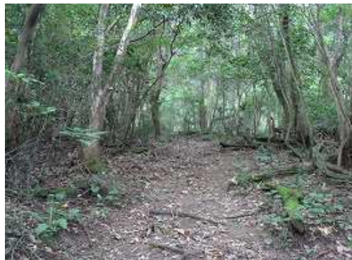
九州自然歩道の道は歩きやすい。