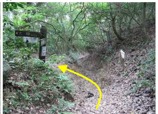
萬歳寺分岐を左折する。