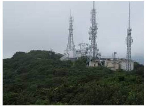
テレビアンテナ群。