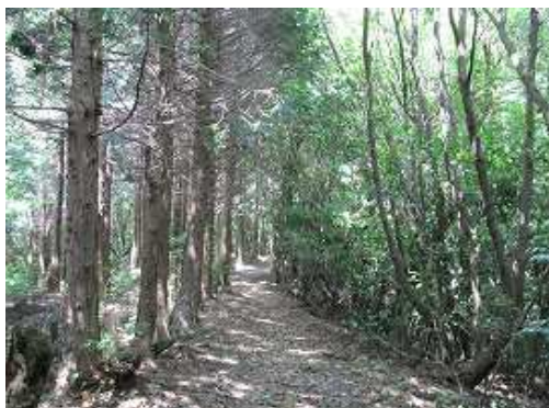
左にヒノキの植林、右に自然林の中に行く。