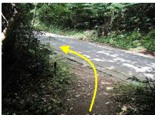
一旦右側の道路へ出る。