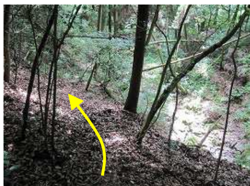
丸太階段を下って行くと右側に沢音が聞こえ、沢が見えて来た。