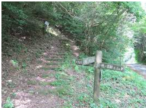
大峠登山口の石段を登って行く。

大峠登山口～萬歳寺分岐～道路～大谷分岐～九千部山(848m)～道路～萬歳寺分岐～大峠登山口