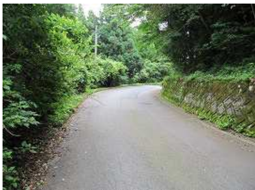
道路を緩やかに下って行く。