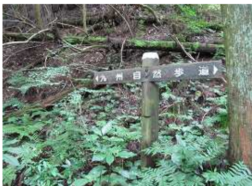
九州自然歩道の標識を見る。