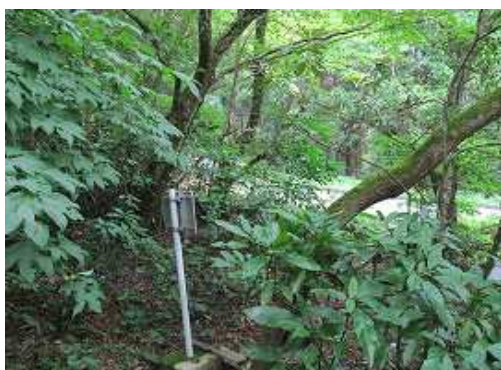
右に道路が最接近する。