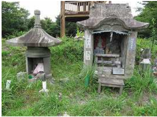
右の祠には右: 弁財天 左: 不動明王が祀られている。