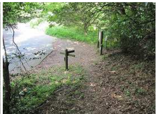
大峠登山口に帰り着いた。