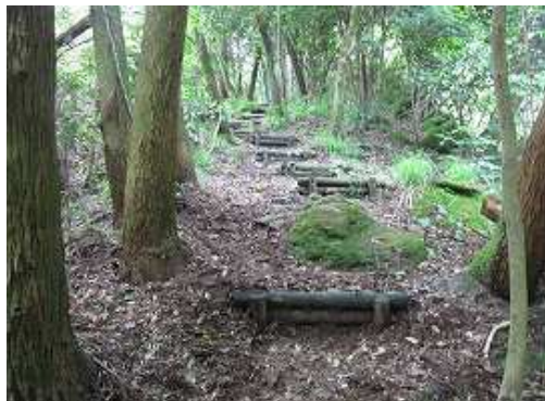
丸太階段を上り返す。