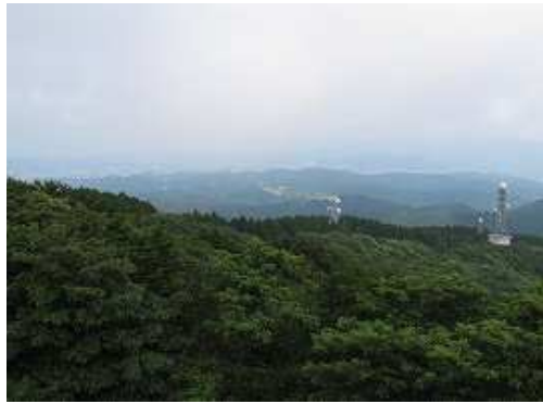
那珂川町・春日市方面の展望。