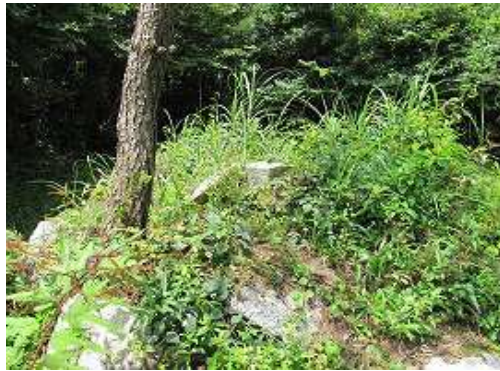
九千部山の二等三角点。