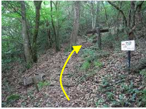
大谷分岐に出会う。右へ上って行く。