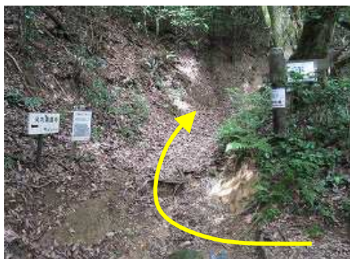
萬歳寺分岐に出会う。右折して緩やかに上る。