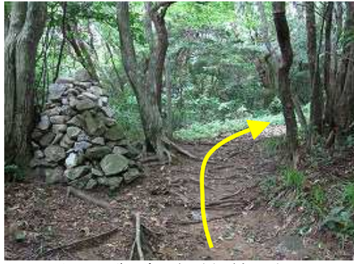
ケルンの先で右へ向かうと頂上は近い。