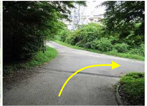
駐車場を抜けて三叉路を右へ下る。左は石谷山へ至る。