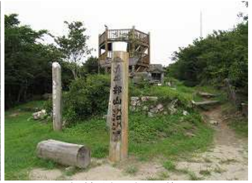
九千部山(848m)の山頂部。