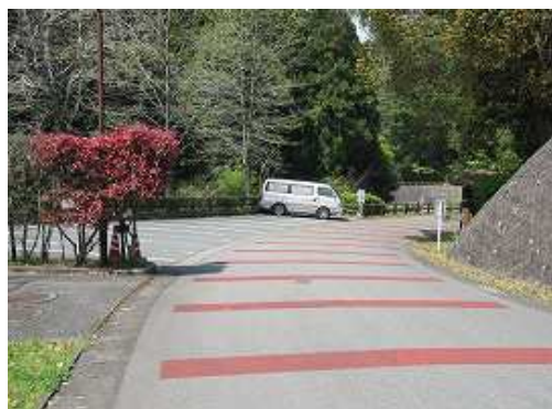
駐車場が見えて来た。