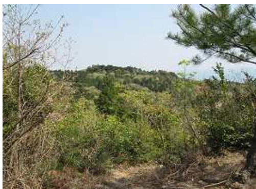
北西に60m程行くと展望が得られる場所がある。