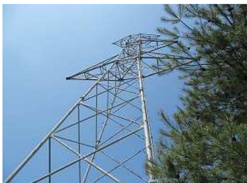
18鉄塔に到着。送電線は撤去されている。