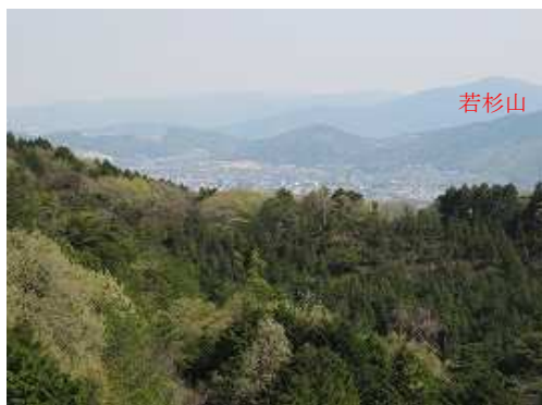
若杉山方面を望む。