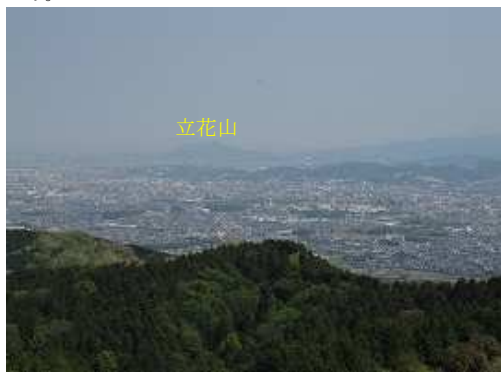
立花山方面を望む。