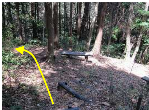
分岐に出会うので、左へ向かう。