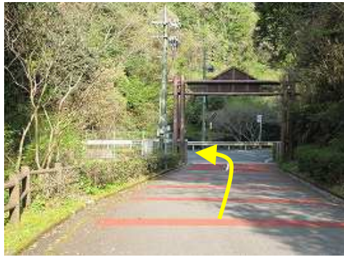
キャンプ場入口のゲートを抜け左折する。