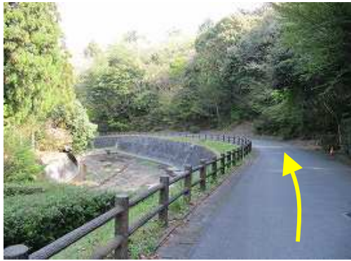
キャンプ場入口の 駐車場 に車を止め、来た道を戻るように歩き始める。

駐車場～林道記念碑～展望所～牛頸山(448m)～黒金山分岐～18鉄塔～三市町山(435m)～牛頸林道～板橋～黒金山(405m)～山口越分岐～分岐～キャンプ場取付～駐車場