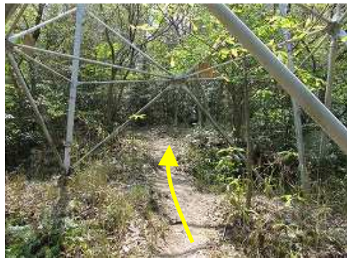
15鉄塔の中を抜ける。