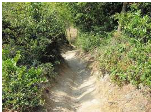
水道のガリーを下ると林道へ出会う。