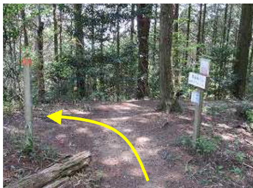
山口越分岐に出会うので左へ向かう。