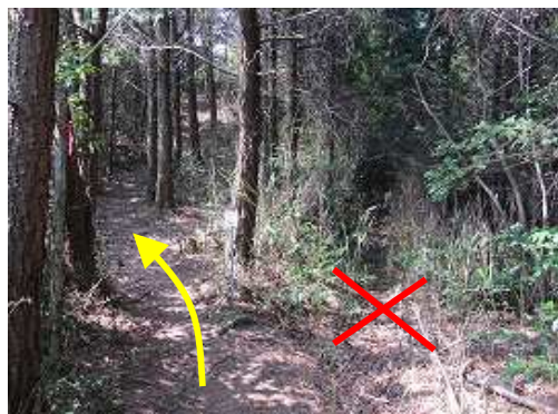
黒金山分岐に着く。左へ向かう。