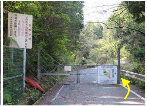
牛頸林道のゲートの右側を抜ける。