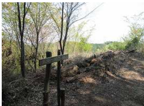
三市町山(435m)に到着。北東方面に展望が得られる。