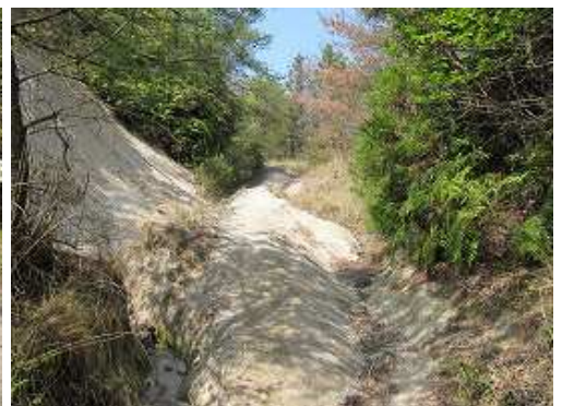
浸食された林道を上る。