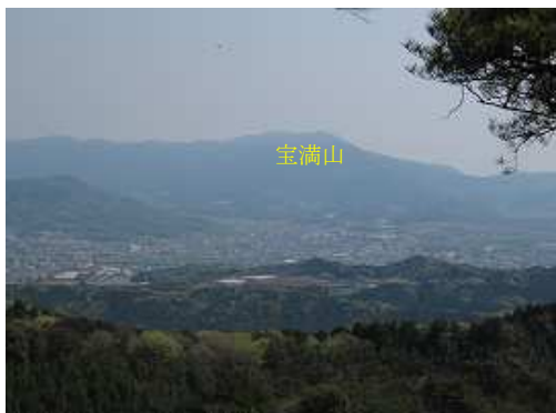
宝満山方面を望む。