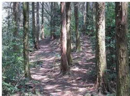
二岐は、どちらを歩いても良い。