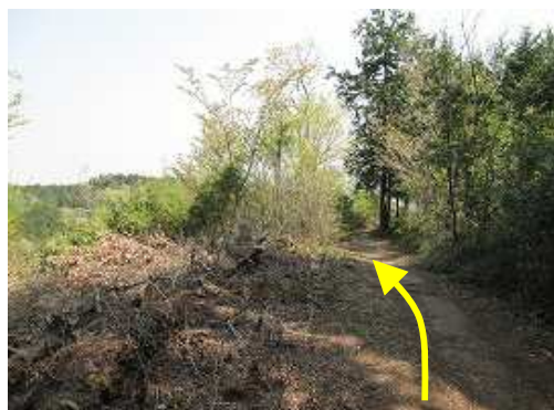
明るい尾根筋を歩く。