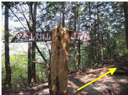
急な登りを終わると標識があるので、牛頸山は右へ向かう。