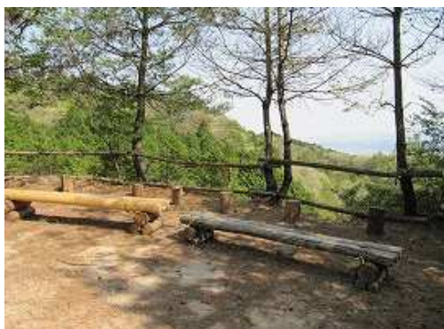
展望所に到着。北東方面に展望が得られる。