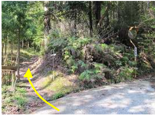
林道から左の旧道へ入る。