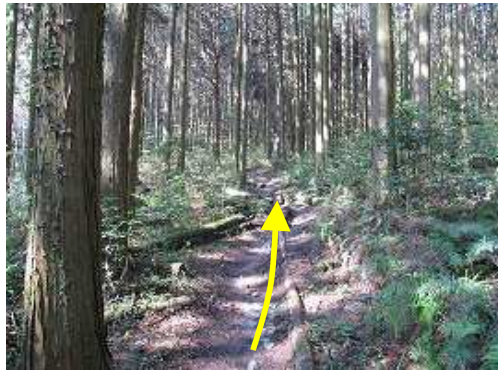
スギの植林帯の中を緩やかに歩く。