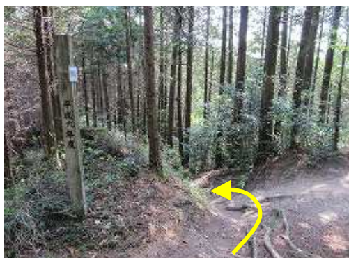
三方分岐に出会うので、左へ向かう。