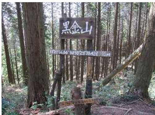
黒金山(405m)の標識。付近の地形で最も高い地点に設置してあった。展望は得られない。