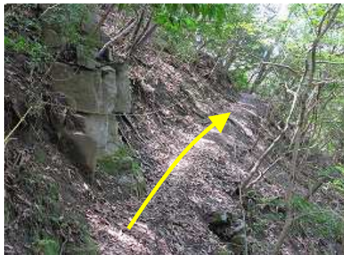
トラロープが張られた斜面を登って行く。