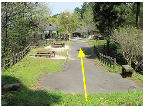
キャンプ場からの取付きに出た。