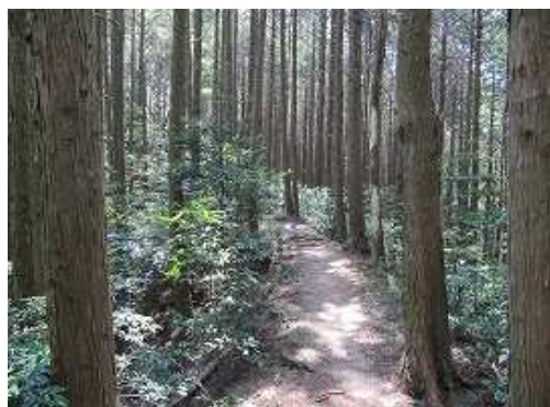
ヒノキの植林帯の中に行く。