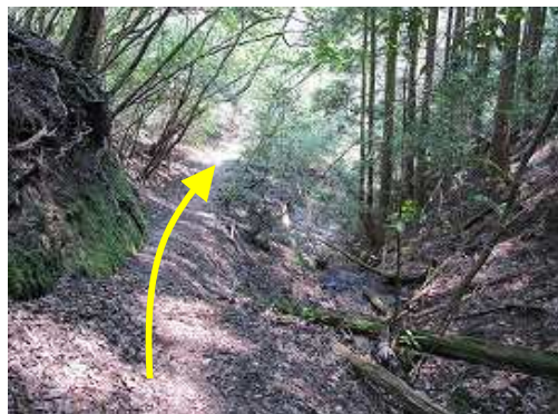
沢の左岸を下って行く。