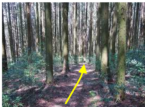
ヒノキの植林帯の中を緩やかに下って行く。