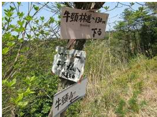
牛頭林道への分岐の標識を見る。