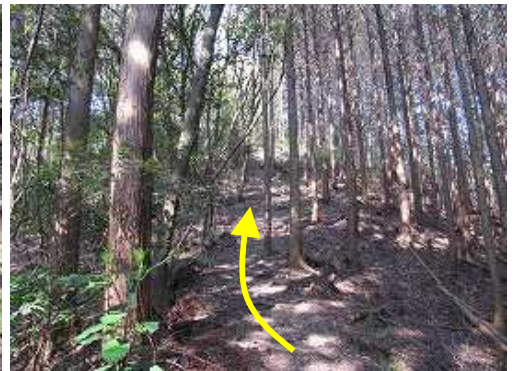
ヒノキの植林帯のやや急な上りが続く。