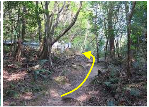
林道に出て左へ向かう。