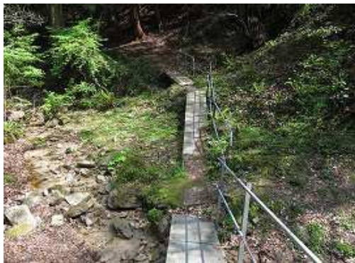
手摺の付く橋を渡る。右より沢が流れる。