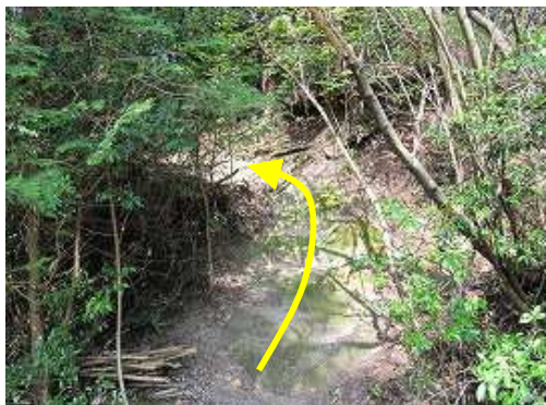
急な登りに取付く。