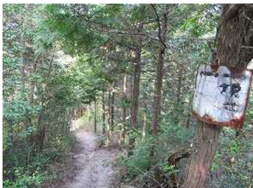
尾根筋を北西へ向かう。