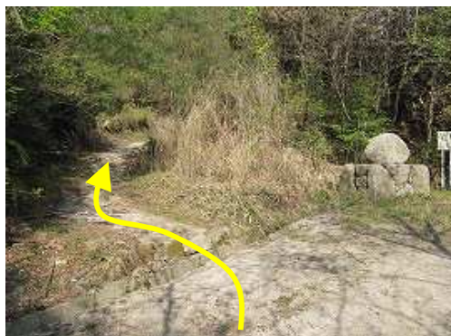
林道記念碑に到着。左に入る。