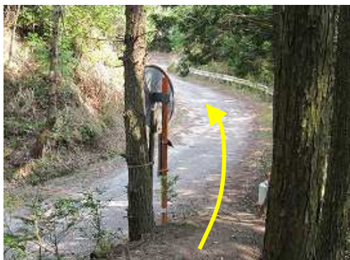
林道に出るので、直進する。