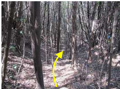
堀切から下る沢状の緩い斜面。最低部を拾いながら下って行く。