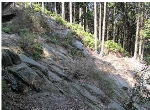
崩落沢下部のトラロープを渡る。