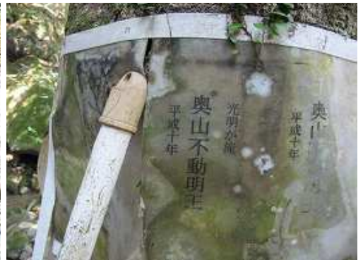
光明が滝に到着。奥山不動明王が祀られている。