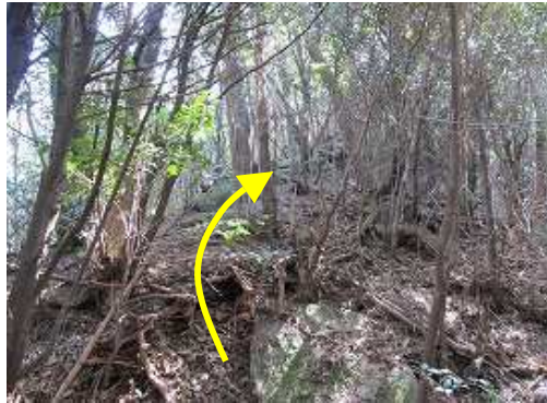
緩やかな弱い沢状の斜面を伝うと堀切のような場所に出会う。右の急斜面をひと登りで一ノ岳山頂である。