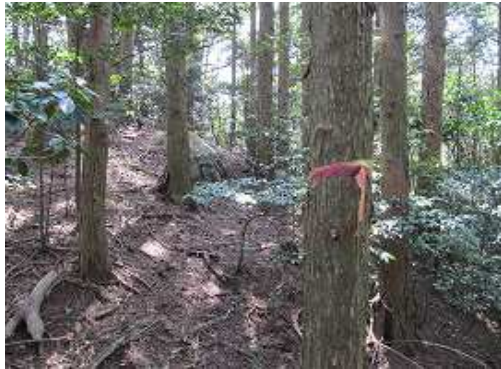
小尾根に上り上がり、尾根筋の植栽帯の際に沿って南方向に向かう。