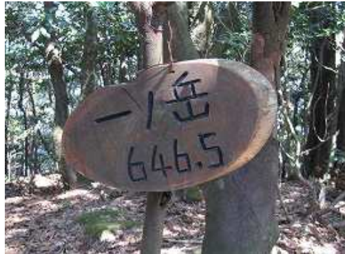
一ノ岳(647m)の山頂標識。