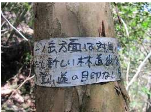
傍の幹に巻かれた注意書き「一ノ岳方面は対岸へ。ただし新しい林道出合後登山道の目印なし」