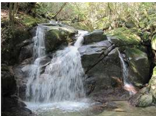
落差3m程の滝が落ち修行場となっている。