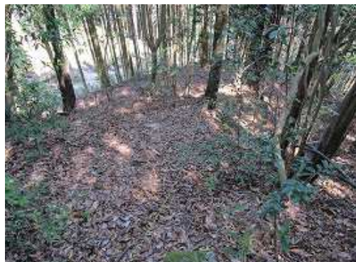
トラロープが張られた滑りやすい斜面を下ると遊歩道に出合う。