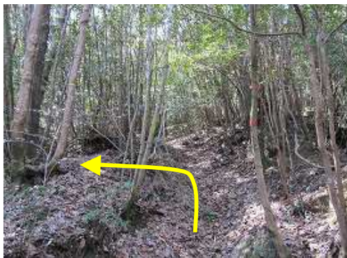
分岐に出会う。左に黄テープが巻いてある。今回は左へ向かう。