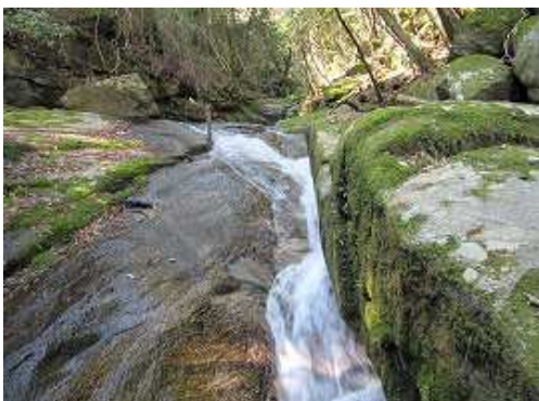
右岸から左岸に渡渉し、沢沿いに上がる。