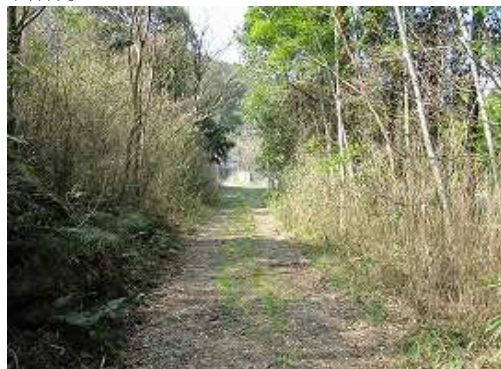
駐車地が見えて来た。