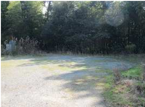
大原山神社駐車場に到着。