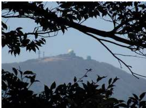
樹間から脊振山のドームが望める程度で展望は得られない。