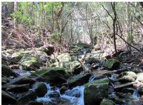
尾根端部から下りやすい所を下ると、対岸分岐の石積み橋脚の下流に降り立ち、渡渉して遊歩道を下る。