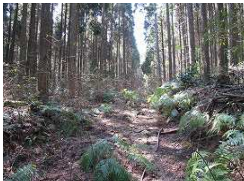
作業道に出会うがトゲのあるヤブ道が続く。