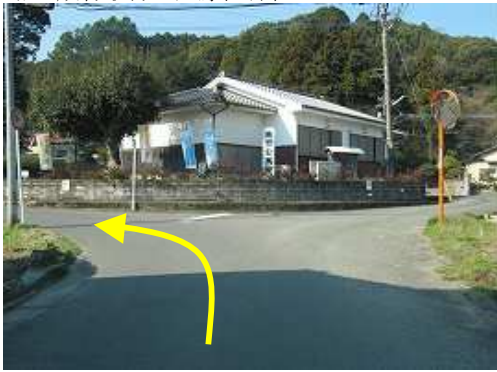
成竹公民館の横を左折する。