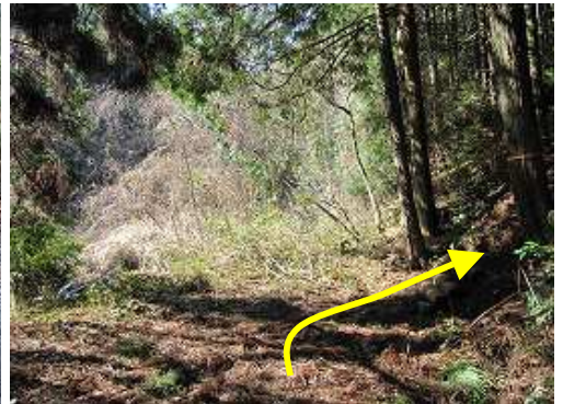
林道終点 右に入口がある。