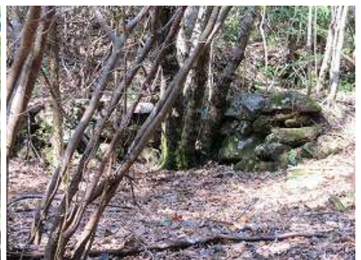
右側に炭焼き窯跡を見る。