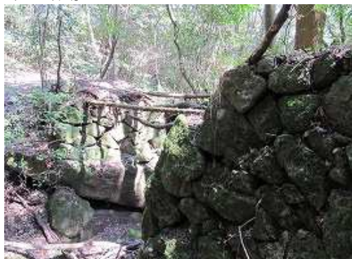
石橋の上流側を渡る。