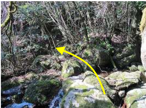
光明が滝入口 対岸へ渡る。