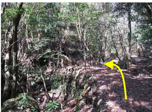
対岸分岐に到着。ここにも石積みの橋脚が残る。沢へ下り対岸の植林帯へ入る。