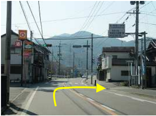
南畑小学校入り口前の信号を右折して成竹公民館の方へ向かう。

大原山神社P～林道終点～光明が滝入口～光明が滝～石橋～対岸分岐～分岐～作業道出合～林道出合～小尾根取付～小尾根～一ノ岳(648m)～丸岩～対岸分岐～石橋～光明が滝入口～林道終点～成竹取付～大原山神社P