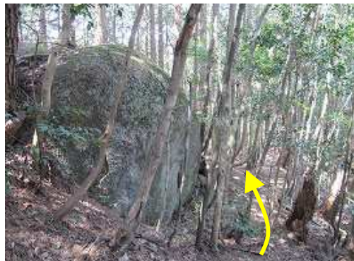
丸岩の右を抜ける。