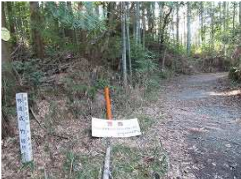
成竹林道終点と書かれ、開設は昭和15年度と書いてあり70年以上前に開通した古い林道を歩き始める。