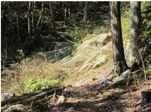
右手に岩盤斜面が現れトラロープが張ってある。