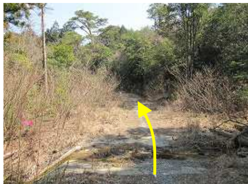
林道出合 これから向かう林道。左へ曲がるヘアピンの先で右の小斜面に取付き、小尾根に出る。