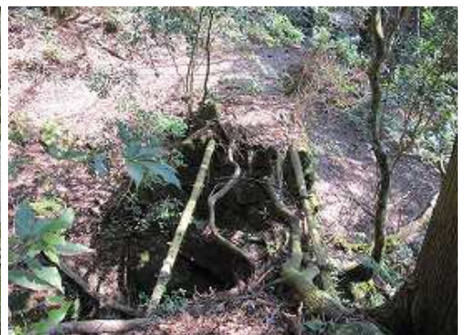
石積の橋脚部分のみが残る遊歩道に出会う。