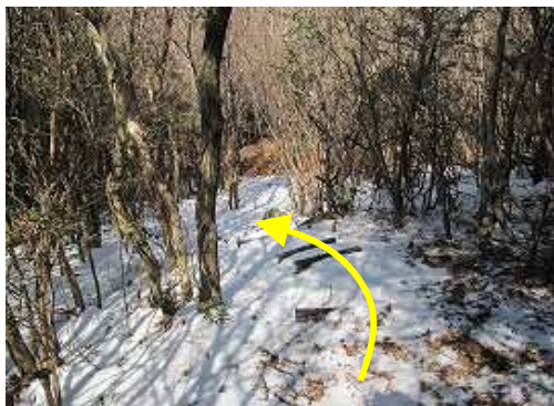
縦走路に飛び出すが目印らしき物はない。北西にブラ階段が樫木畑へと続く。