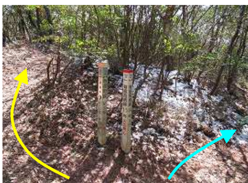
鉄塔周回コース分岐。右へ下れば山腹を周回して樫木畑の13号鉄塔に出る。左は縦走路。