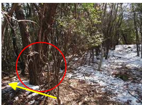
鷲尾根入口まで戻る。左手に尾根が伸びていることは視えるが、丸印の木から左へ入る。