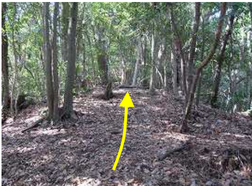
斜面を登ると所々に赤テープなどの目印がある。