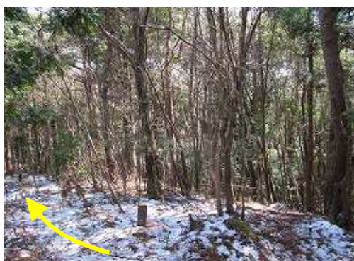
隆岳尾根入口。左の尾根は展望岩を経て隆岳へ。右へ下ると688mの補点へ。傍に九電の鉄塔標識が立つ。