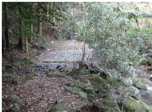
仲ノ畝林道終点に出会いアスファルト道を緩やかに下って行く。