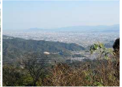
山頂からは北方面が展望できる。