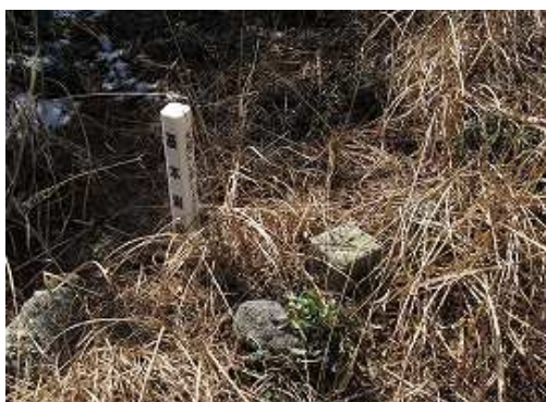
山名はないが樫木畑(かじきはた)748mの三角点に到着。