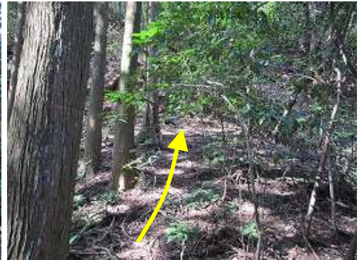
左右に作業路らしき径が交差していた。そのまま斜面を直上するが次第に傾斜を増す。