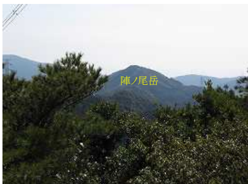
南東方向に陣ノ尾岳(696m)を望む。