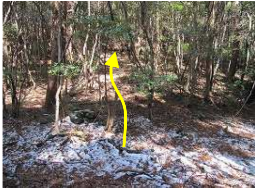
隆岳分岐に到着。隆岳へは直進、右へ涸れ沢を下れば成竹山へ。