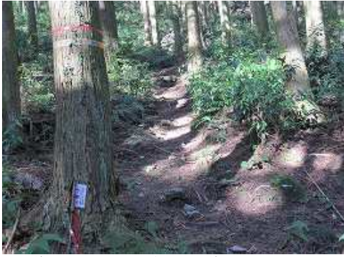
林道脇に車を止めて、仲ノ畝林道の登山口から歩き始める。

仲ノ畝登山口～分岐～鷲ヶ岳(454m)～分岐～尾根取付～大岩～沢～鷲尾根入口～榎木畑(748m) ～鷲尾根入口～隆岳尾根入口～展望岩～隆岳分岐～隆岳(660m)～成竹林道分岐～うちわ分岐～ 沢出合～林道終点～仲ノ畝登山口