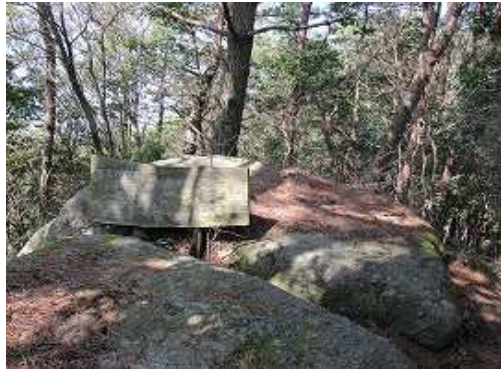
隆岳(660m)の山頂。展望は得られない。