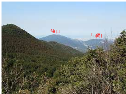
展望岩から油山・片縄山方面が望める。