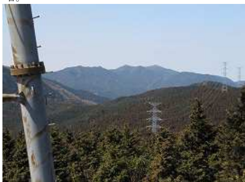
鉄塔の右に金山(1055m)方面を望む。