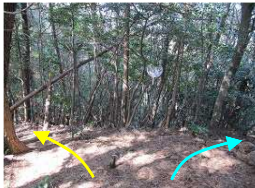
うちわ分岐。右の小尾根に踏み跡、赤テープがあるが出口不明。左に尾根筋を下る。