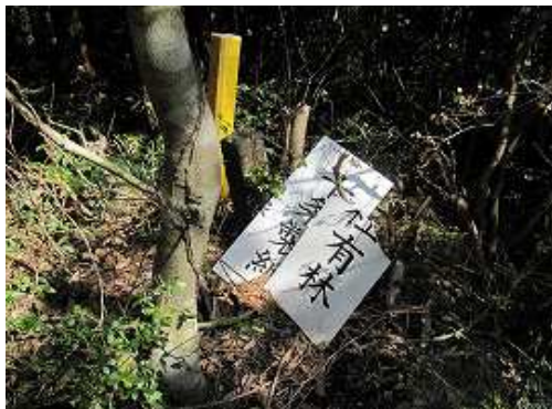
十条製紙の社有林の標識を見る。