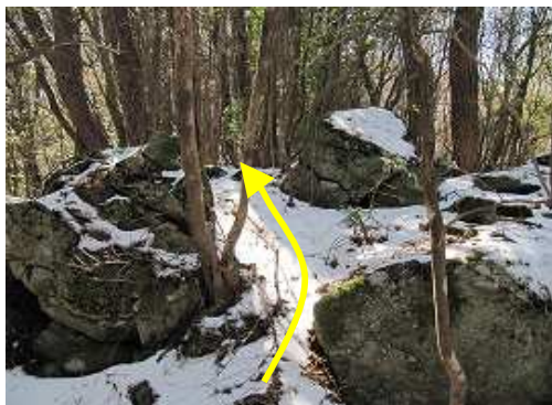
20分程尾根筋に沿って行くと最後の弱いピークらしき所に出合う。ここを越えると出口は近い。