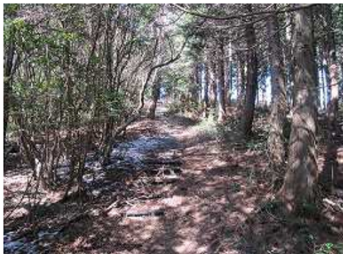
緩やかにブラ階段を上って行く。