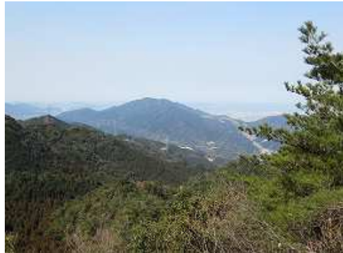
展望地から油山方面が展望できる。