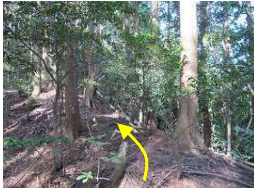
右に弱い尾根の端部が現れる。ここが尾根取付であるが目印となるような物はない。