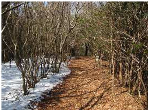
雰囲気の良い散策路といった感じ。