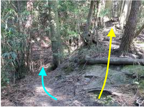
分岐に出会う。右の尾根筋が鷲ヶ岳へのコース。左は縦走路コースと周回コース。