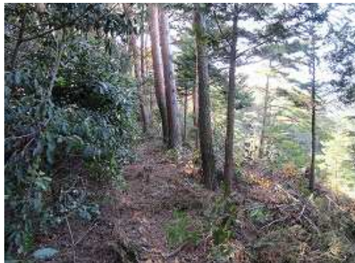
尾根筋に出ると右の斜面はヒノキの植林帯で最近下草が刈り払われたようだ。