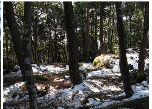
等高線700mの平坦な山頂部を通過する。