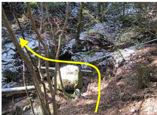
枝尾根を南東方向に赤テープを辿って下るが、途中で右方向へ斜面を下り沢に出合い急な斜面に取付く。