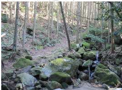
右岸側に作業路が伸びているが何処に出るのか不明。