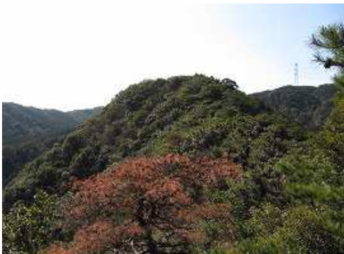
これから向かう617mのピークを望む。