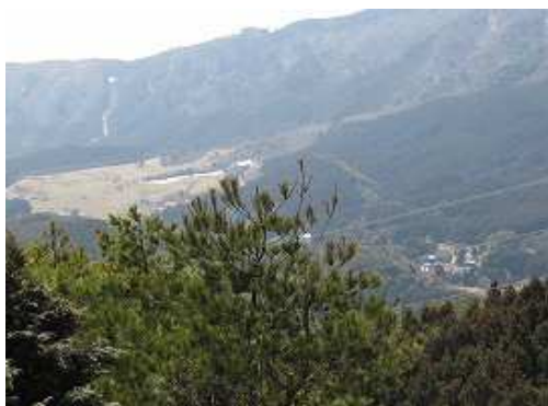
南方面に脊振少年自然の家と板屋の集落を望む。