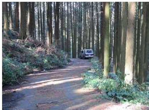
駐車地の仲ノ畝登山口が見えて来た。