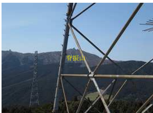
鉄塔越しに脊振山(1055m)を望む。