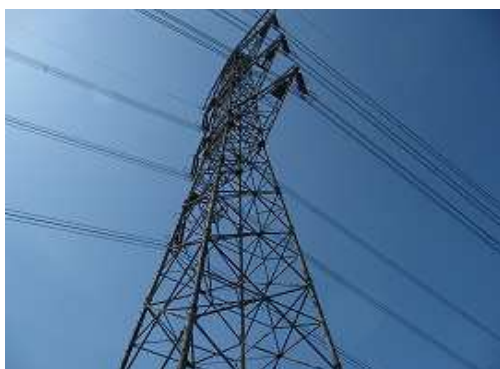
傍に聳える脊振鳥栖線13号鉄塔。