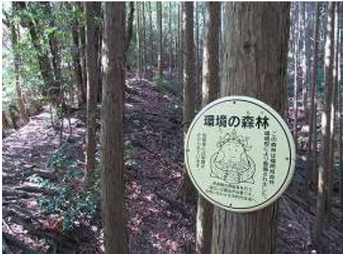
分岐まで戻り、縦走路コースへ入り左に緩く曲がるとこの看板を見る。