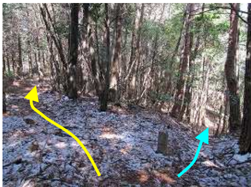
二岐分岐。左が尾根筋で展望台へ、右は山腹を下っているようだが出口は不明。