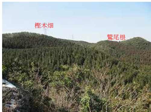
鷲尾根と檜木畑方面の展望。