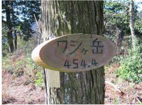
鷲ヶ岳(454m)の山頂標識。