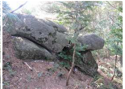
大岩に到着。岩の上に乗る。