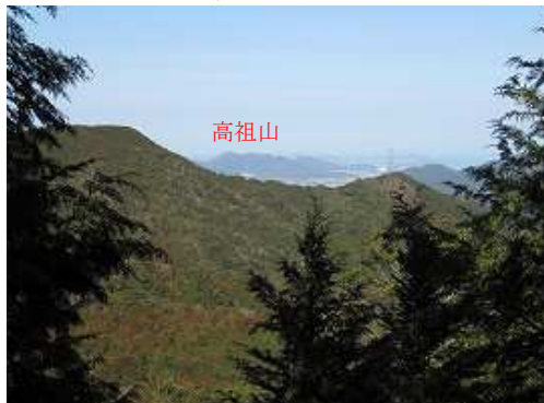
10分程尾根筋を伝うと右側の開けた所から高祖山・叶岳を見ることができる。やがて617mの補点を越える。