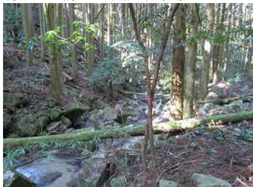
沢に降り立つと赤テープを見つける。これより右岸側を下る。