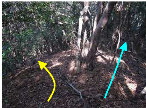
成竹林道分岐。右の小尾根を下れば成竹林道へ出会う。赤テープ有。左の尾根筋を今回歩く。