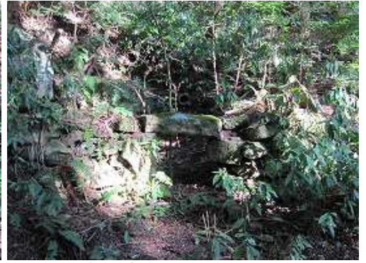
右手に炭焼き窯跡を見て緩やかに上って行く。