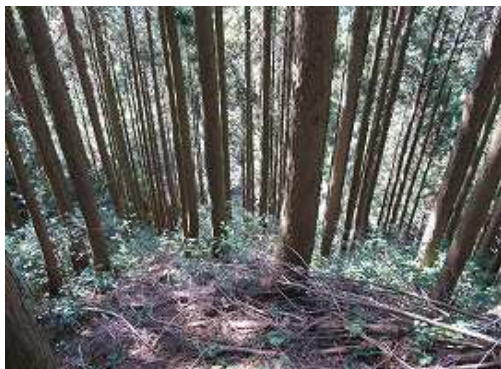
尾根端部は急斜面のスギの植林帯で下に沢音がする。滑りやすい斜面を慎重に下る。