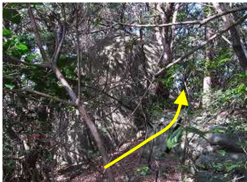
丸岩の右側を抜ける。