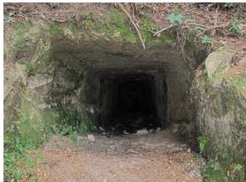
左手山側に2つの塚がある。