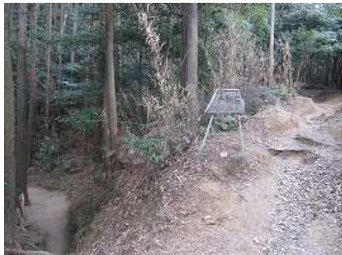
不動岩分岐 左へ24歩とあるが、実際は35歩かかる。