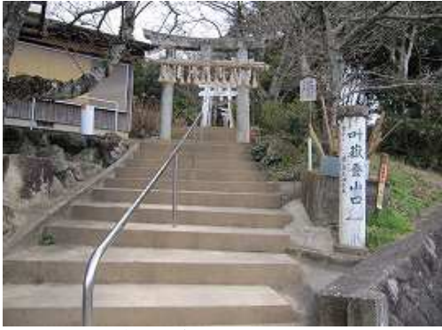
叶嶽登山口 駐車場前が叶嶽登山口である。並び立つ白鳥居をくぐって石段を緩々とする。

駐車場~叶嶽登山口~叶大神~展望台~不動岩~叶嶽神社~叶岳(341m)~高地山(419m)~飯盛山分岐~林道出合~鉢伏観音分岐~高祖山(416m)~鉢伏観音分岐~鉢伏観音堂~センター分岐~駐車場