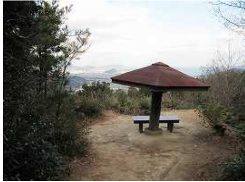
展望台 四阿があり展望に優れる。