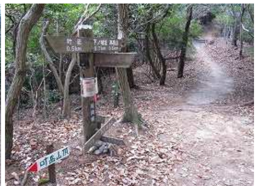
吉野谷分岐 右へ下れば野外活動センターへ至る。