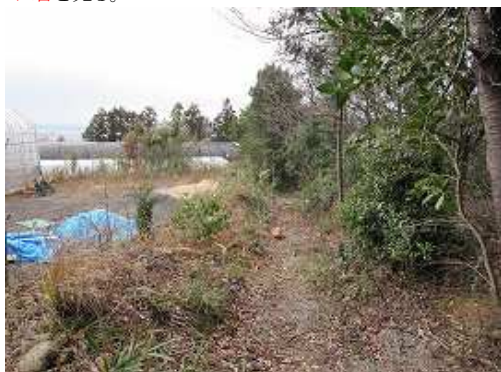
人家が左手に現れてきた。