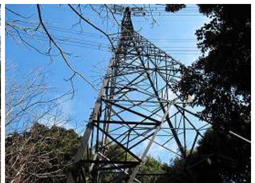
鉄塔の側を通過する。