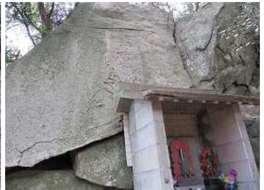
不動岩 壁一面に不動大明神が彫られている。