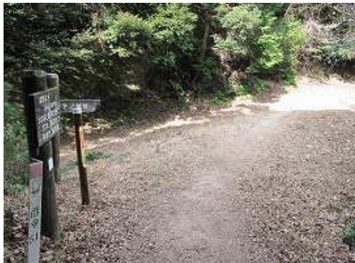
林道に出会う。30mほど先の山側階段が高祖山への取付き。