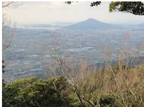
山頂からは可也山(365m)が見渡せる。