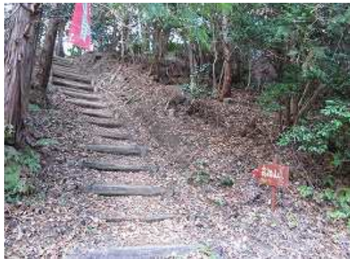
林道からの取付きは階段上りから始まる。