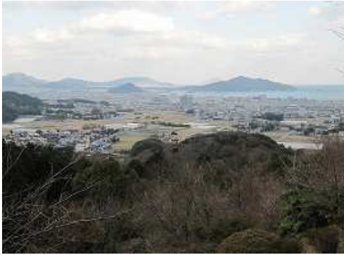
境内から眺める糸島方面。