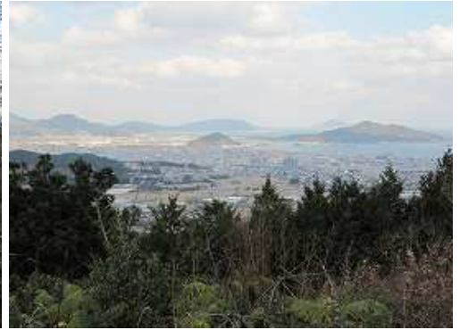
展望台からの眺め。