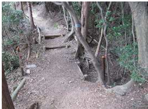
鉢伏観音分岐。高祖山へ往復しここを下る。