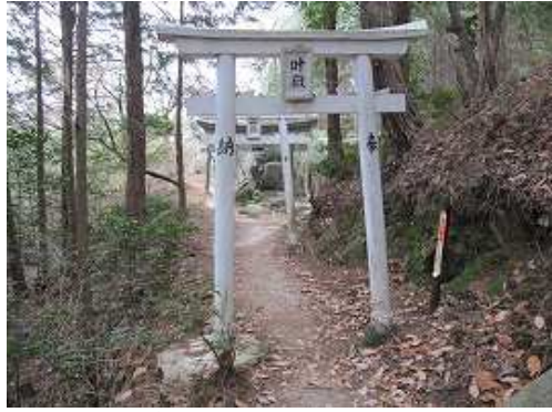
この先を左に向かうと叶大神に至る。