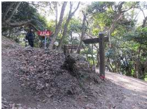
高祖山へは左へ斜面を登る。