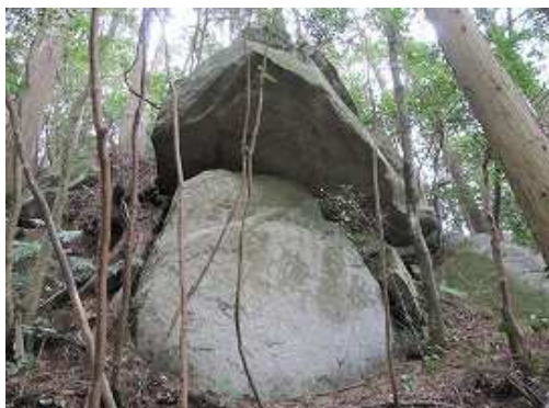
鉢伏観音分岐まで戻り、沢沿いに下ると左手山側に重ね岩を見る。