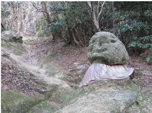
ダルマ石 五合目の先のコース上にあるダルマに似た人面石。