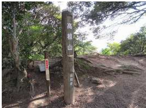
高祖山(416m)。中世の山城跡で糸島地方を収めていた原田氏の居城。