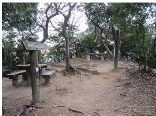
飯盛山分岐 飯盛山への降り口は左側。高祖山へは右の尾根を下る。