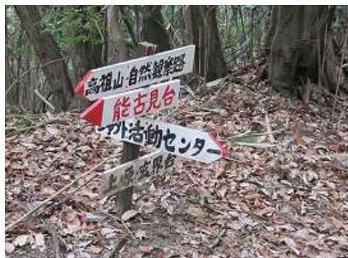
センター分岐を通過して上ノ原へと下る。