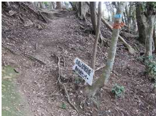
自然観察路分岐を通過する。