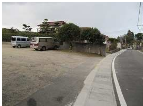
駐車場へ帰り着く。