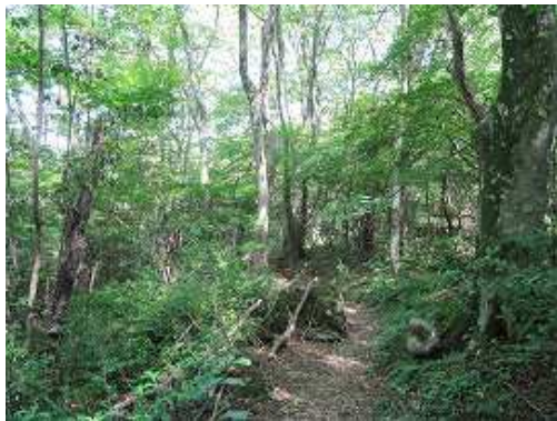
右岸の遊歩道を下る。付近はキツネノカミソリの群生地。