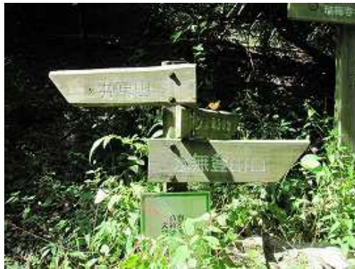
水無分岐に出会う。