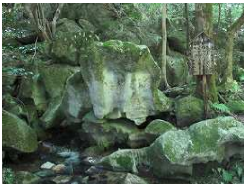
こうぞう岩。湧水の出ている岩を地元ではフクロウに似ていることから「こうぞう岩」と呼ばれている。