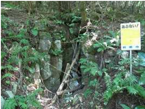
第2鍾乳洞へ立ち寄る。