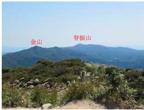
金山・脊振山方面。