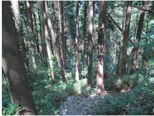
ヒノキの植林帯の下が水無谷で沢音が聞こえてくる。