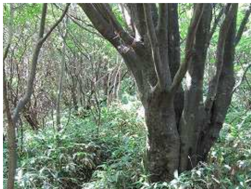
枝ぶりの良いブナの傍を通過。