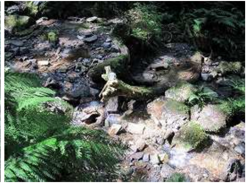
水無谷の沢へ下り着く。沢の流木に柄杓がぶら下がっていた。