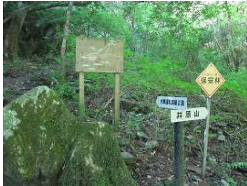
新村越分岐へ到着。新村越へ沢伝いに緩く上り詰める。