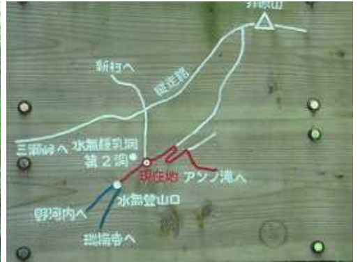
案内板。今回は第2鍾乳洞へ寄り新村越から縦走路を西へ井原山へと向かうコース。