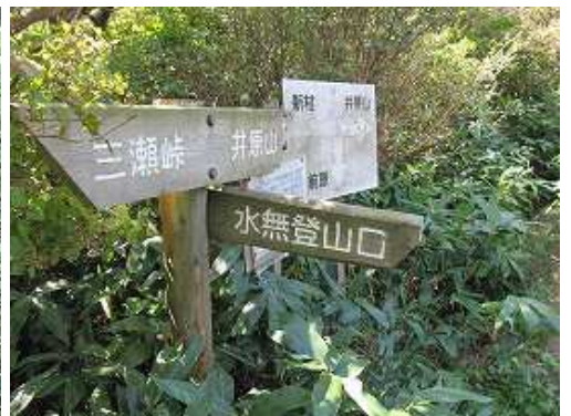
水無谷分岐。帰路にこれを下る。