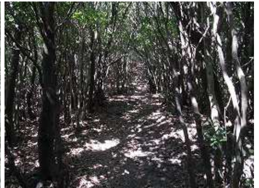
新村越の西側で縦走路に合流。