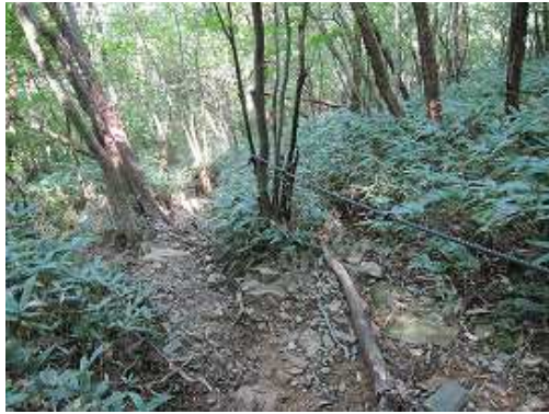
水無谷分岐に戻り、北へ尾根を下ると残置ロープが張られた急な下りに出会う。