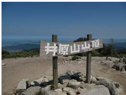
井原山(982m)山頂。360°の展望が得られる。