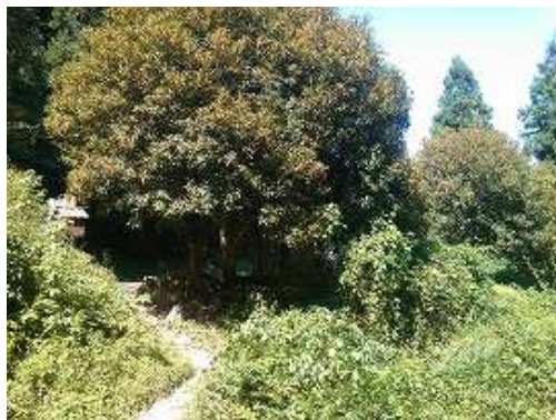
新村越分岐を経て下ると、水無登山口が見えた。