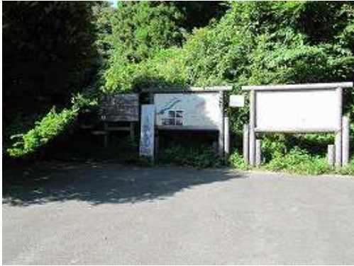
水無登山口。瑞梅寺から林道を上がれば水無駐車場。10台程度駐車可能。左隅を下り対岸へ渡る。