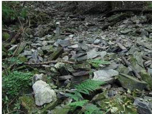
沢沿いに伝うとガレ沢にケルンが積んである。