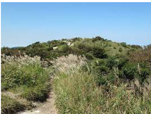
灌木帯を抜けると井原山の山頂が目前に。