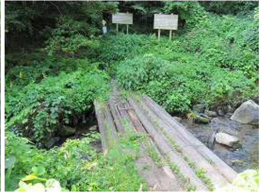
すぐに水無川を渡る。