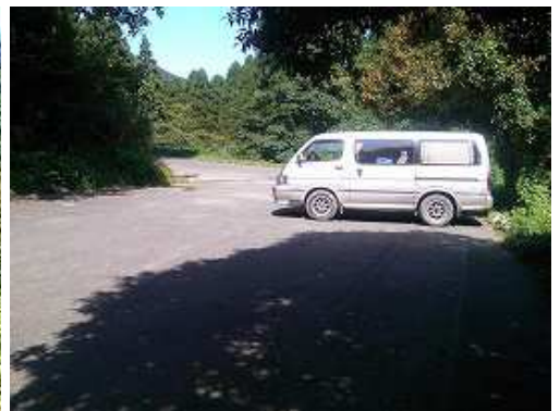
駐車場に帰り着いた。