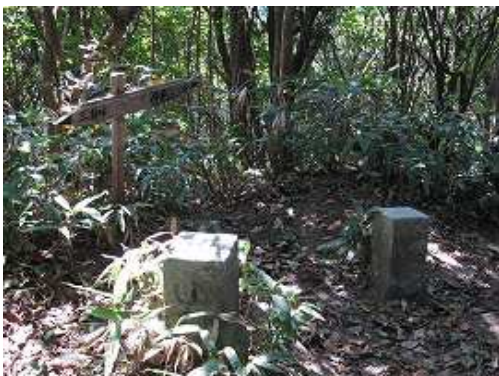
補点。井原山へ20分と書いてある。