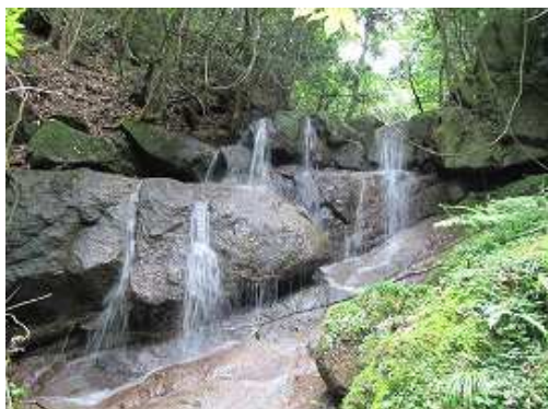
F6 4m2段の滝で中央部を上る。この沢でベストな滝である。