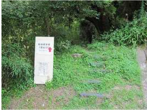
桜谷登山口。桜谷に沿った遊歩道3.3kmが九千部山頂まで続いている。

桜谷登山口～取水場～入溪地～二俣～左側へ～桜谷本谷横断点～縦走路出合～九千部山(848m)～桜谷入口～入溪地～取水場～桜谷登山口