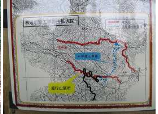
うるしがコースの通行止めと林道計画の告知案内。本谷を横断して桜谷遊歩道へと林道が出来るようだ。