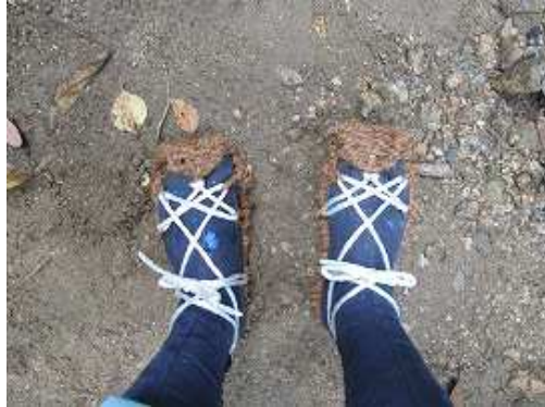
足回りは自作のシュロ縄で編んだワラジを使用した。爪先部は折り返しとしてグリップ力を確保している。