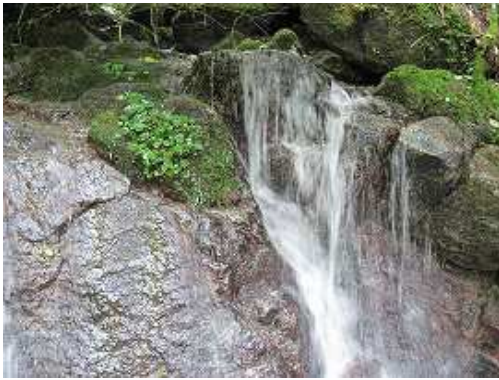
F9 2mの滝で中央部を上る。