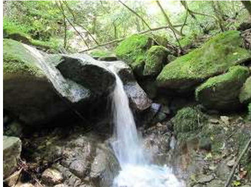
F3 2mの滝で中央部を上る。