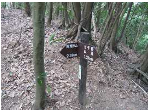
南畑ダムへ2.3km。この辺りまで林道計画がある。