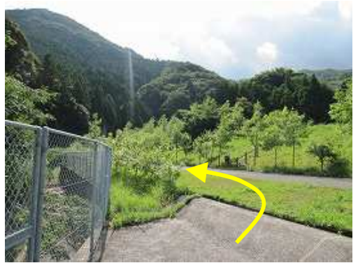
階段上部に出て、左方向へ向かう。