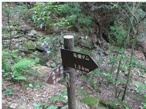
南畑ダムへ1.5km。下の沢が出会う所が二俣。