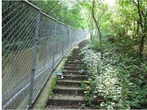
スギの植林帯を抜けると階段を上る。左は水路で水の滑り台となっている。