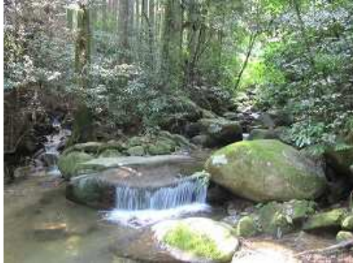
入溪地。遊歩道が右岸に変わる所で桜谷の遡行を始める。