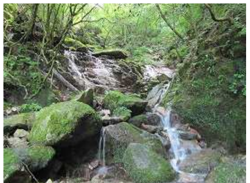
F8 3mのスタレ滝で中央部を上る。