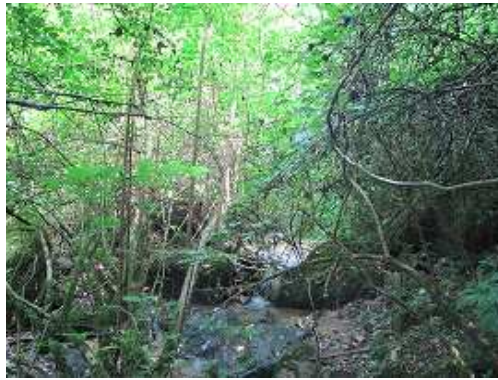
ヤブが濃くなったので右側の尾根へ上がり、沢筋が見えた所で下り沢に入る。