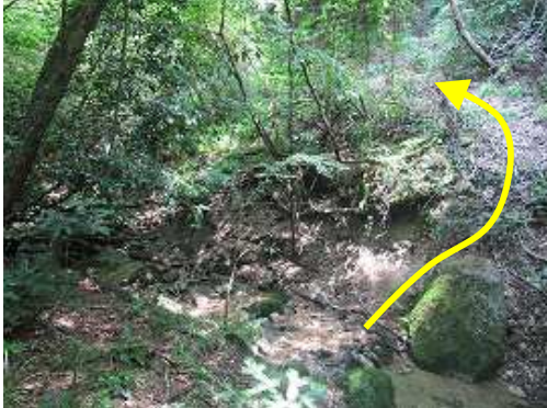
横断点の先の沢。付近に測量杭が打ってあり林道の計画があるのか？沢を渡り疎林の中を歩く。