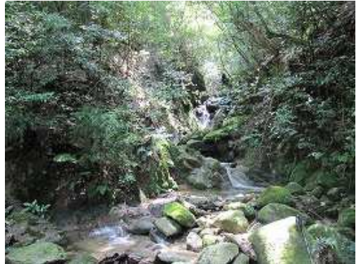
二俣 右沢。水量が多くこちらが本谷である。