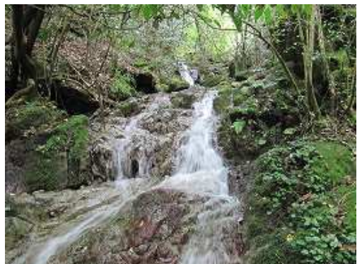
F5 4mの斜滝で中央部を上る。