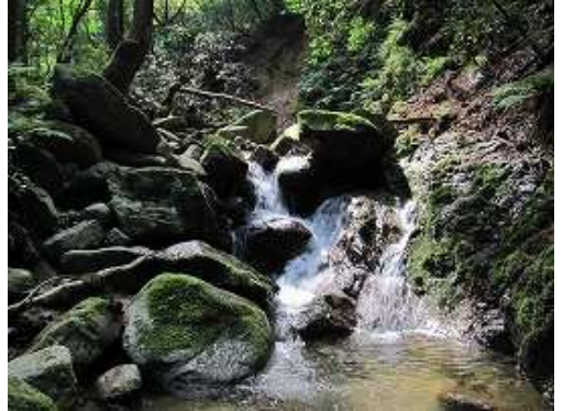
F1 2mの斜滝で中央部を上る。