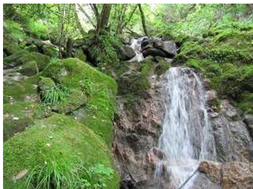
F7 2m2段の滝で中央部を上る。