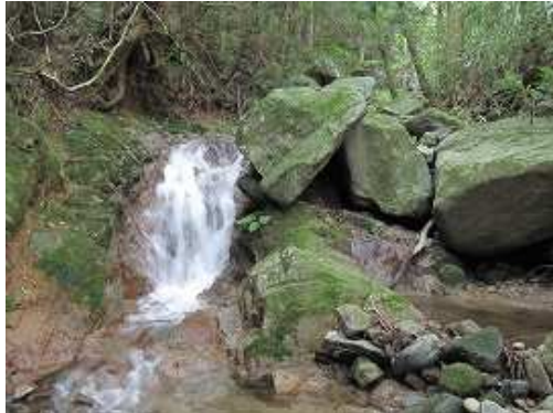
F2 2mの滝で中央部を上る。