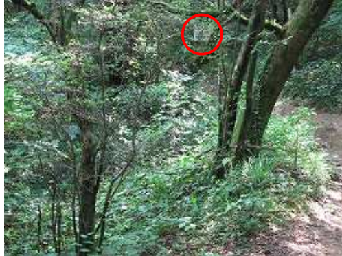
縦走路に出会う。○はうるしがコースの入口。