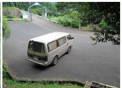
桜谷登山口へ帰り着いた