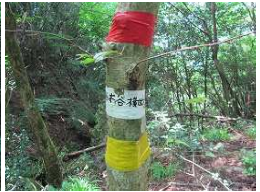
すぐにヤブが現れたので左側の疎林へ逃げる。沢沿いに獣道を伝うと桜谷本谷横断点と記されたテープが