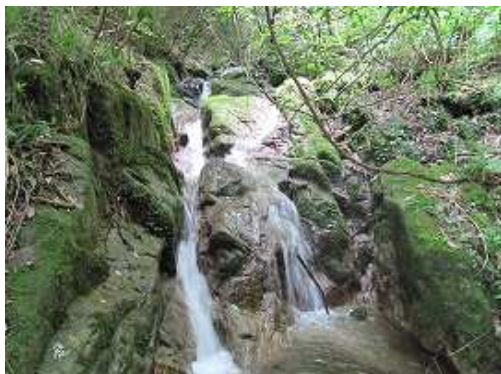
F4 15mの斜滝で中央部を上る。