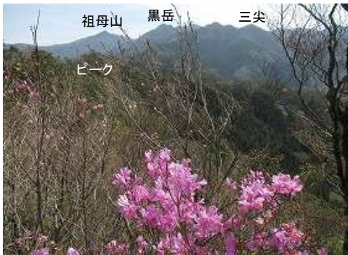
展望地A 東北東の眺望。