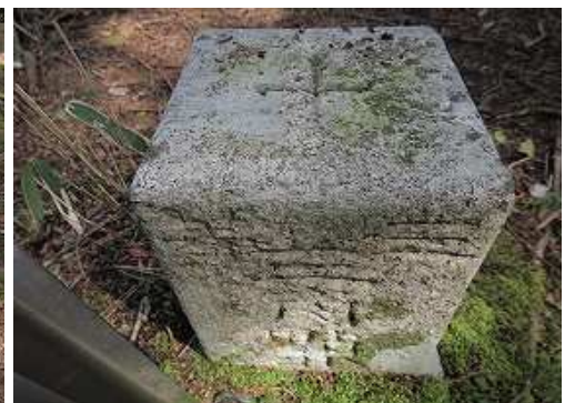
明治32年選点の三等三角点田原越たばるごえ(1232.02m)が設置されている。