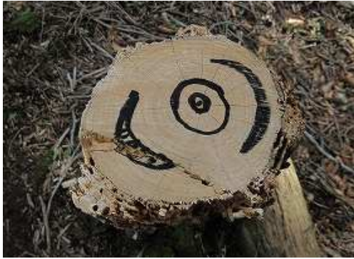
往路では気づかなかった切株目玉。