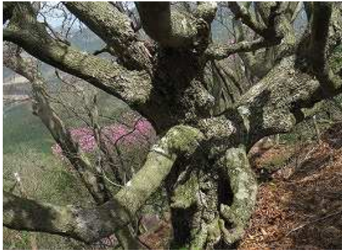
左に千手木を見送る。