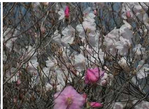
アケボノツツジ 白花