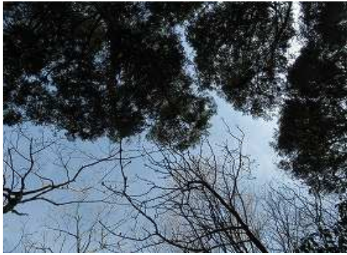
周囲を植林や雑木で囲まれ展望は得られない。