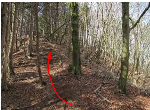
弱いピークへ上って行く。