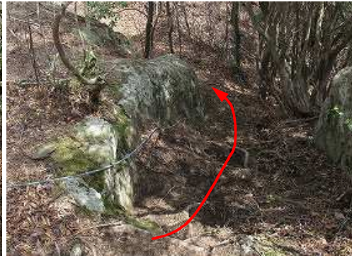
露岩のロープを下る。