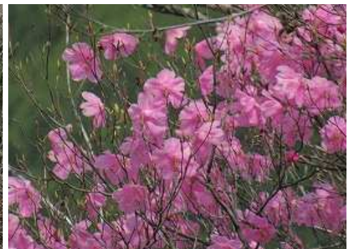
北斜面のアケボノツツジ。