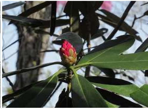
シャクナゲは、まだ蕾の状態。