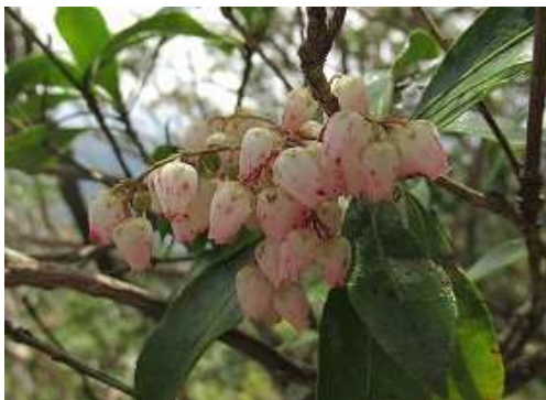
尾根筋で咲くアセビ。