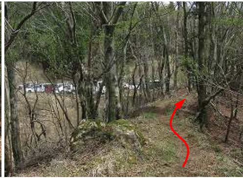
黒原峠Pが垣間見えて来て、帰り着いた。