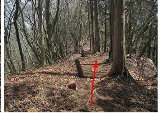
北東へ下って五九杭を通過する。