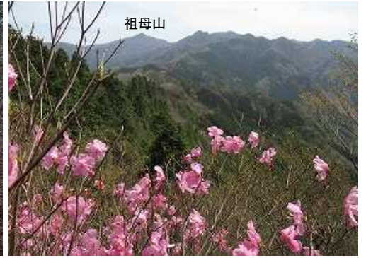
展望地B 東北東の眺望。