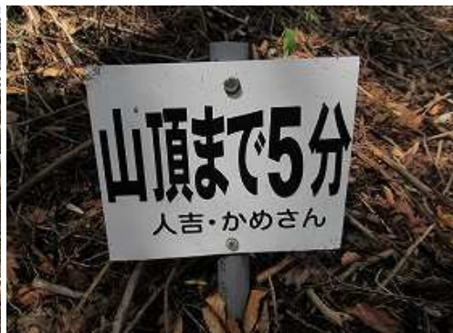
山頂まで5分の案内板を見る。