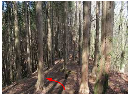
植林尾根筋を西へ向かう。