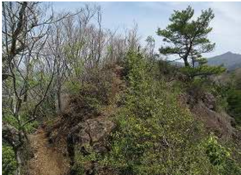
展望岩に立ち寄る。