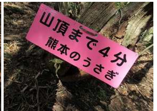
その先で、山頂まで4分の案内板を見る。