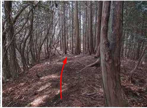
一息ついて、帰路につく。