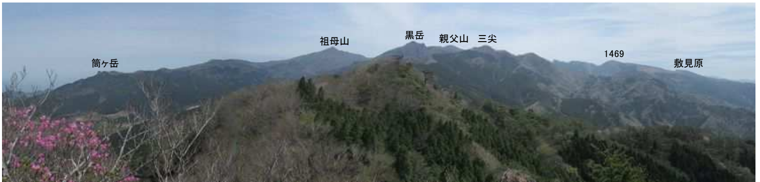
展望岩 北から東の眺望。