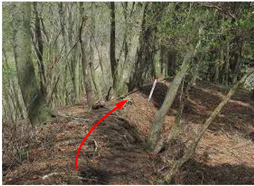
土塁上を緩く下って行く。