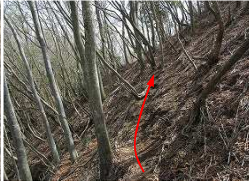
展望地A北斜面の巻道をトラバースする。