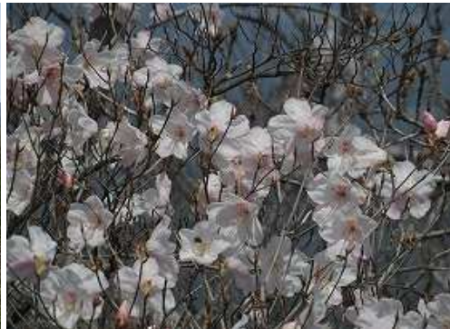
アケボノツツジ白花。