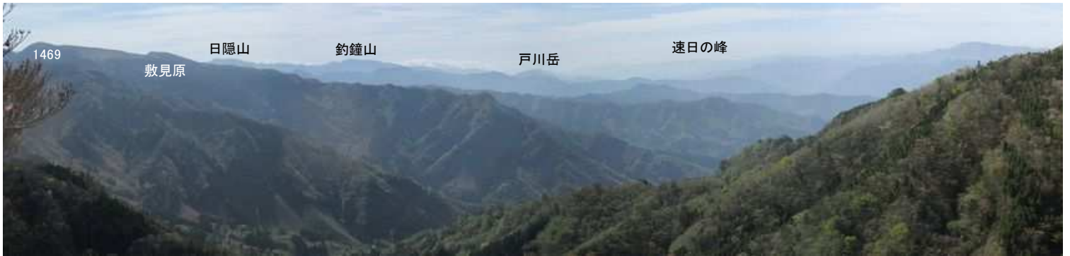
展望地A 東から南の眺望が得られる。