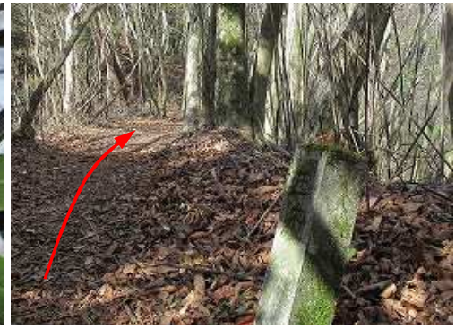
五九杭を通過する。