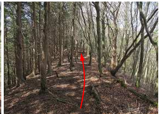
植林際を南西へ緩く上って行く。