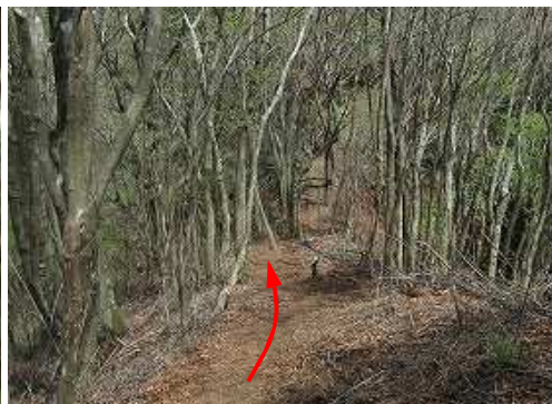
ピークを越え、北東へ下って行く。