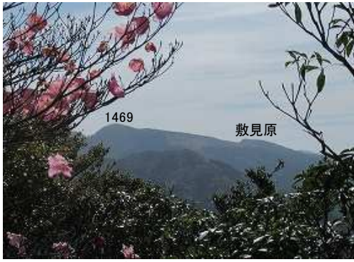
ピークの先で東の展望が得られた。