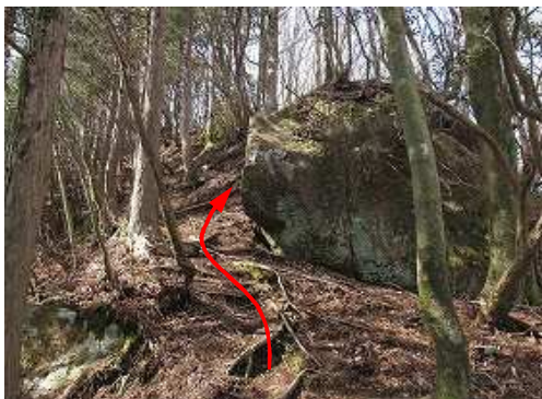
露岩の左を抜ける。