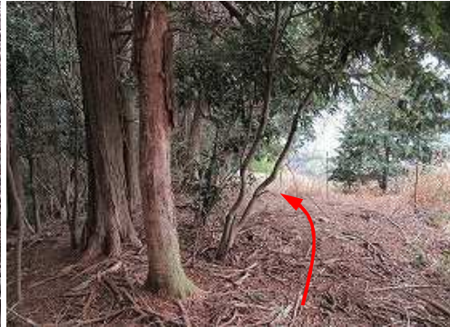
雑木際を西南西へ緩く下って行く。