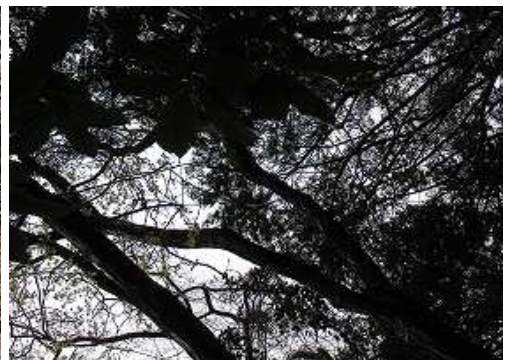
三角点の上空は樹木に覆われている。