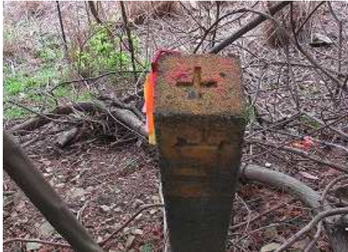
頭を赤く塗られた 境界杭 を見る。