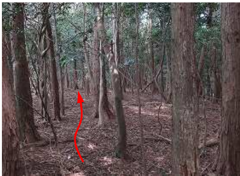
一息ついて、帰路につく。