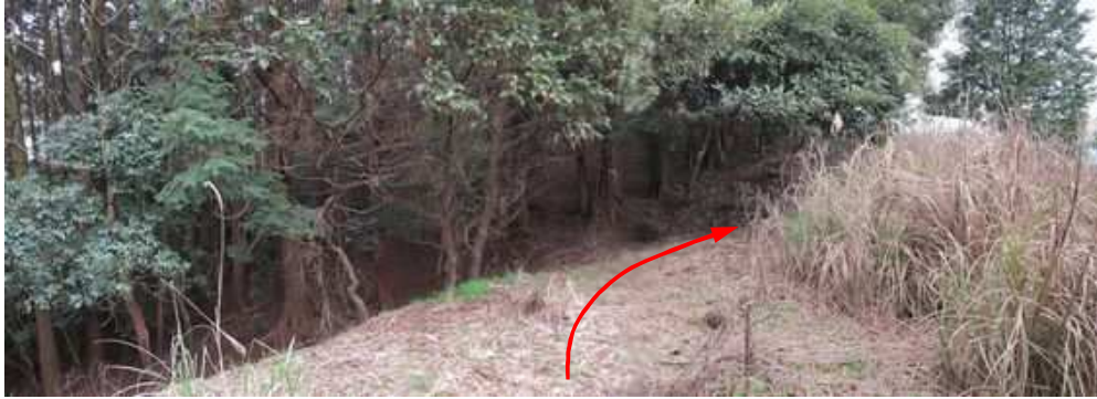
朝倉市の国道386号比良松交差点から北東に位置する八坂集落の南林寺を目指し、八坂山入口から農道を1.7km程道なりに上り詰めると峠に達する。東側に 駐車 し、尾根筋を南西へ向かう。