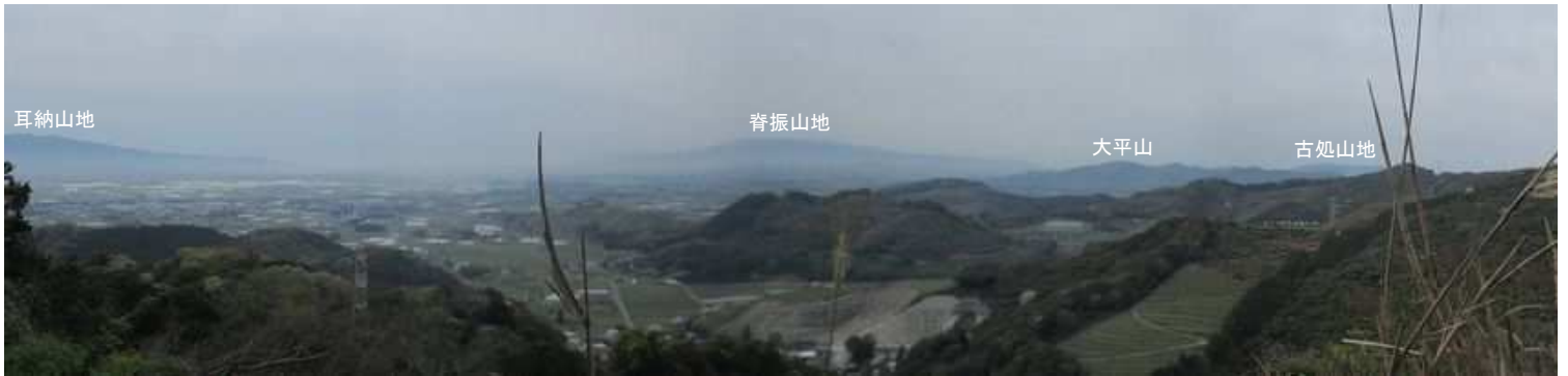
展望地からは西南西から北西の展望が得られる。