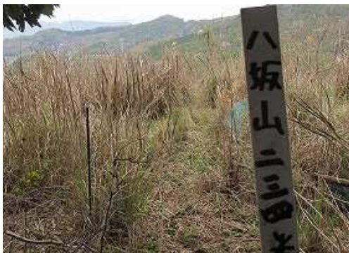
「八坂山 二三四米」と書かれた山名柱を見る。