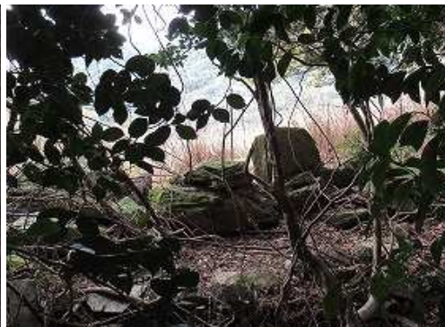
雑木林内を進み、 集材石 の東側を通過する。