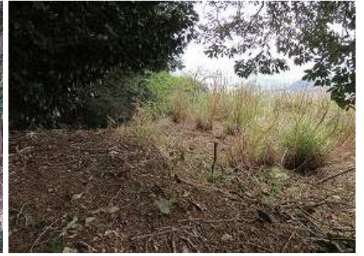
雑木際から西への様子。