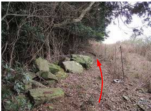
集材石 を見る。右側は作業路跡のようだ。