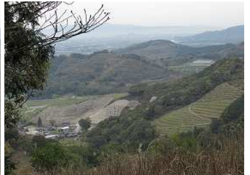
西に八坂集落の端部を見下ろす。