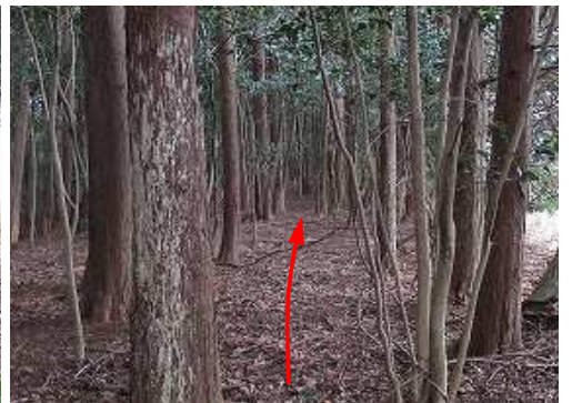
雑木林内を緩く下って行く。