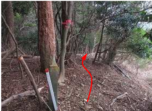
雑木際を南西へ下って行く。