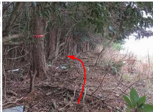
赤テープを辿って南西へ向かうが、途中で南側の雑木林に入る。