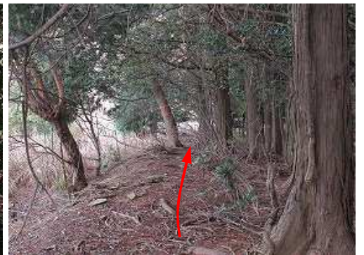
植林際に合流し、戻って行く。