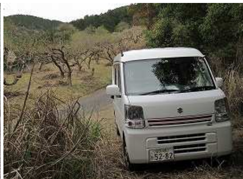
駐車地 に帰っていた。