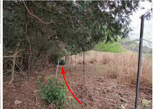
鉄パイプに沿って緩く下って行く。