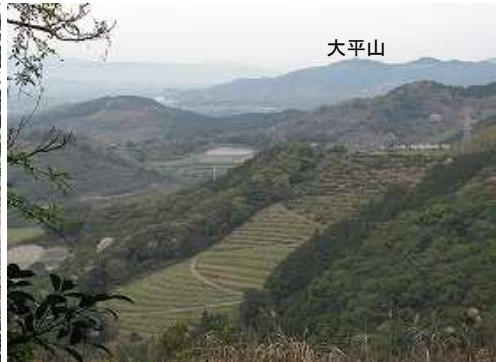
西北西の展望が得られる。