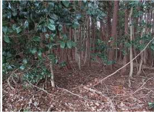
南東側に弱い雑木尾根が広がっている。