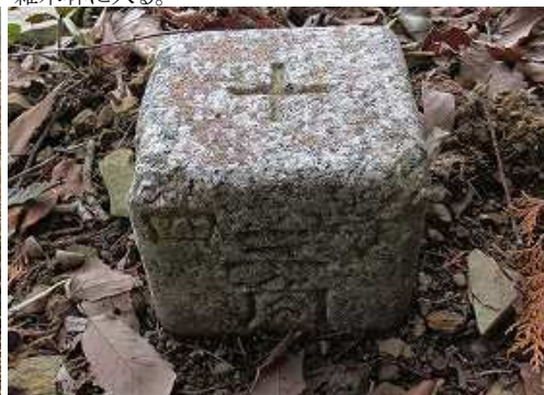
傍に昭和26年選定の四等三角点八坂やさか(234.30m)を見る。