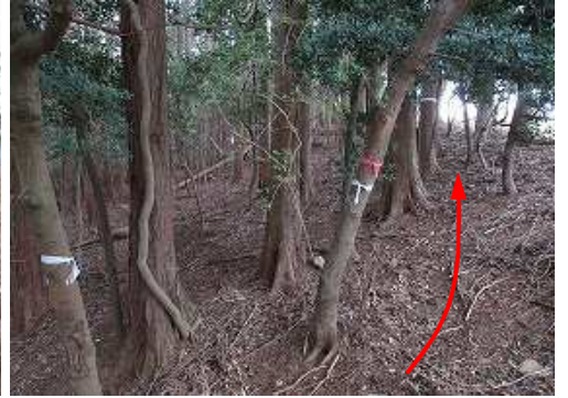
雑木のテープを辿り西へ向かう。