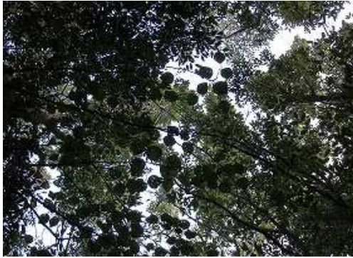
周囲を雑木で囲まれ展望は得られない。