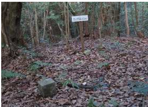
三角点と山名板が見えた。