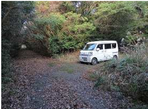
駐車地に降り着いた。