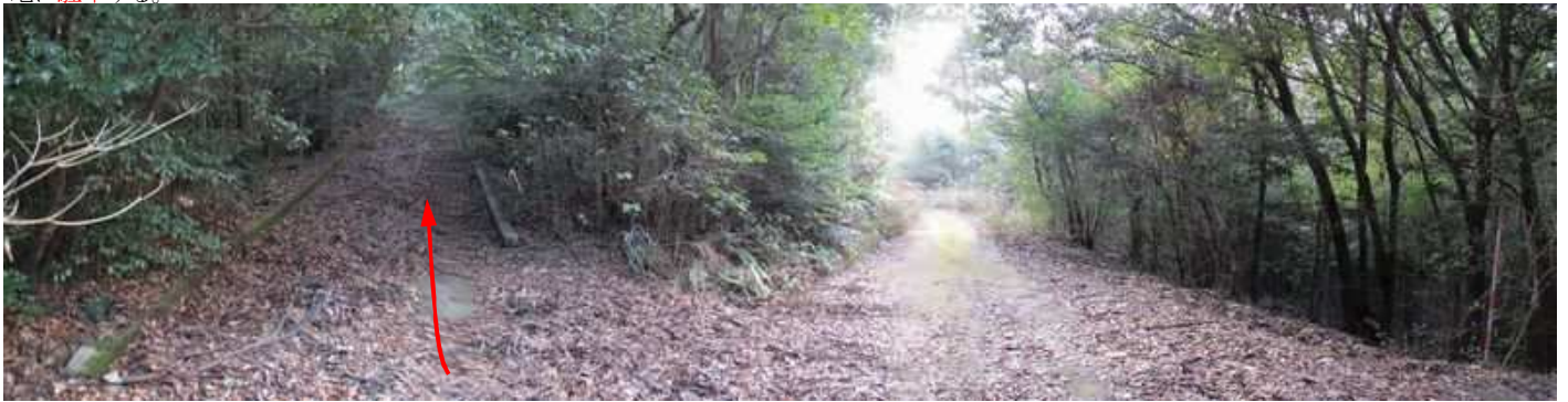
三叉路が取付きである。