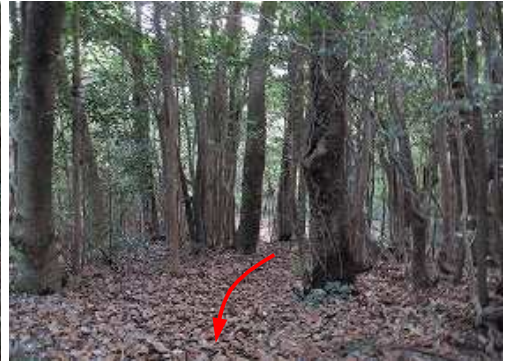
東から上って来た。