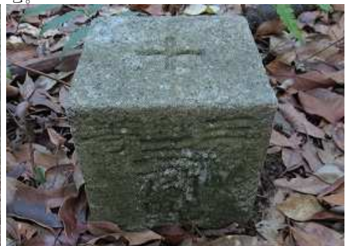
傍に明治30年選点の三等三角点：中尾(なかお)(473.27m)が設置されている。