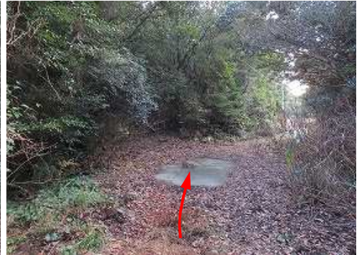
70m程進むと三叉路が見えて来た。