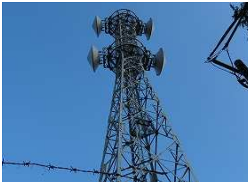
50m程進んで無線基地局を見上げた。