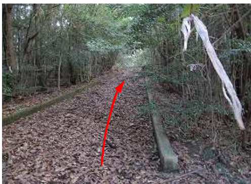
東へ舗装路を上って行く。