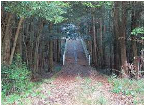
駐車地から北上する。