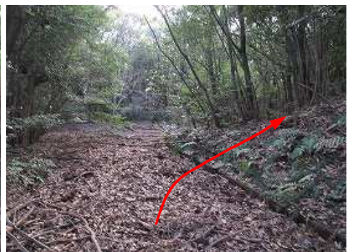
少し上って右カーブする所から右の山中へ踏み込む。