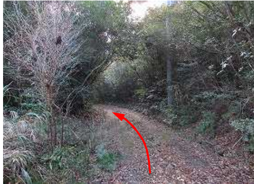
道路を南東へ向かう。