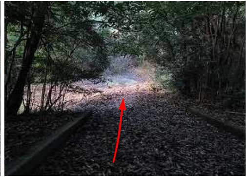
舗装路に下り、下って行く。