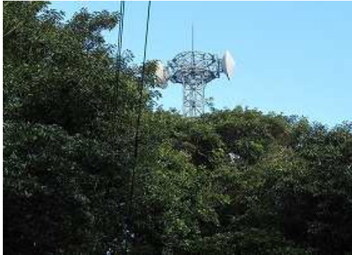
1.1km程走ると右奥上部に鉄塔が見え、鉄塔入口の平地に駐車する。