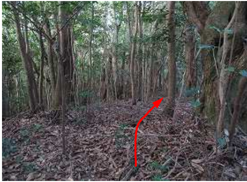
一息ついて、西斜面の雑木林を緩く下って行く。