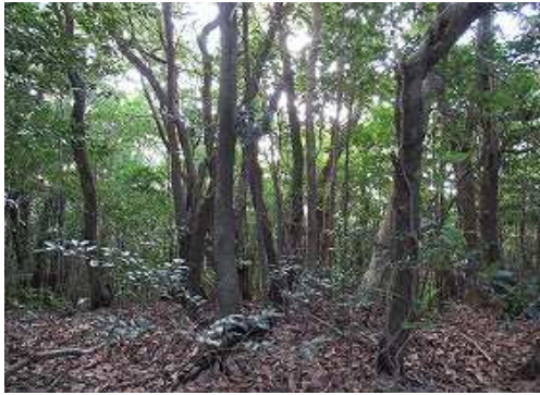
南には雑木斜面が広がる。