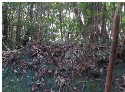
60m程上り右法面奥に山名板らしきものが目に留まる。