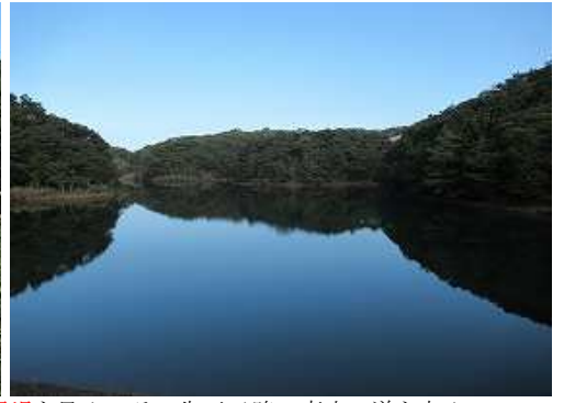
県道57号沿いの神浦扇山町より県民の森を目指しショートカットし集落路を上り、左折すると右に御用堤を見る。その先三叉路の真中の道を取る。