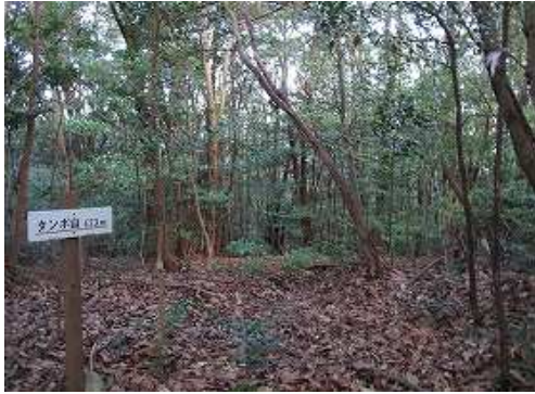
北の縁の下に、上った舗装路がある。