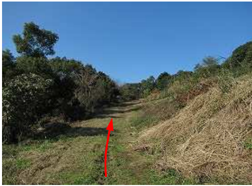
県道12号から城ノ尾岳方面に1.5km程走り、右折して農道を上がって行く。ヌク山を目指し農道を北上し1.3km程走って右の茶畑路を80m程進んだ所に駐車し、北西へ向かう。