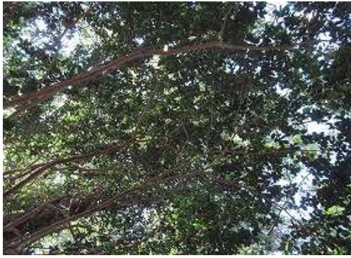
周囲を雑木で囲まれ展望は得られない。