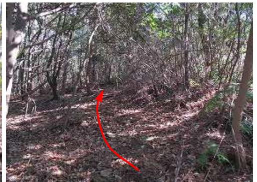
ヤブの薄い所を緩く上って行く。