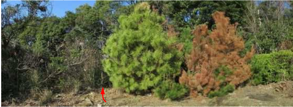
マツの木の左から取付き、山中へ入る。