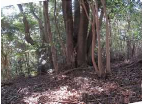
東から最高地点を見る。