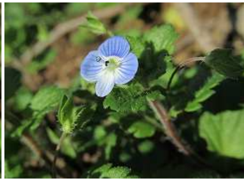
オオイヌノフグリ