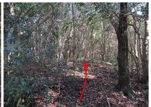
シデの左を抜ける。