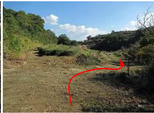
茶畑の作業路を下って行く。