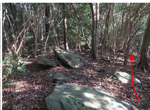
露岩を越えて行く。