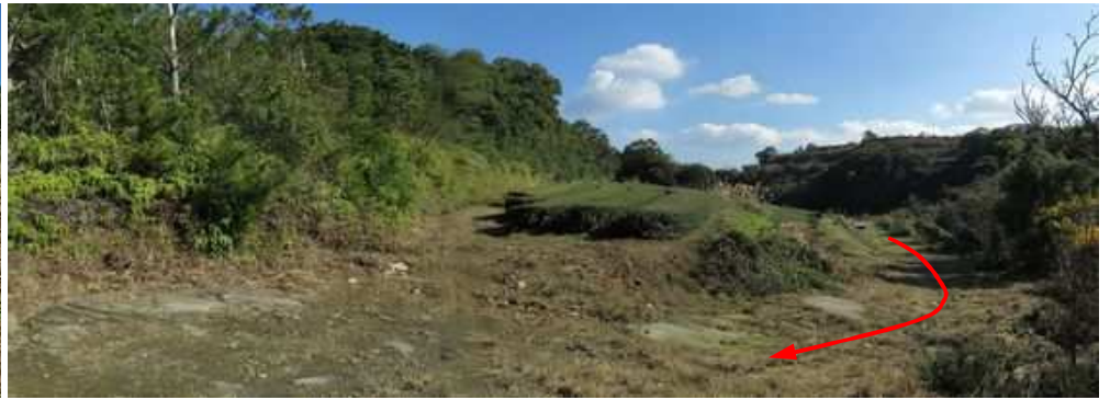
80m程進み茶畑上部から振り返る。