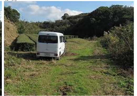
駐車地に帰りに着いた。