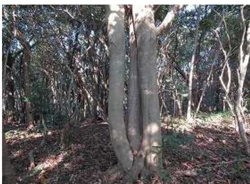
3本一体の寄木を通過する。