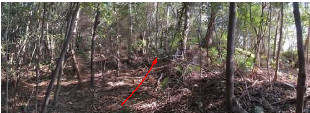
山中に入り、雑木小枝の薄い所を東へと上って行く。