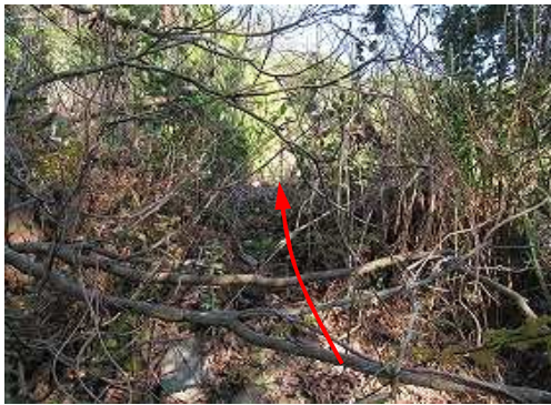
小枝を分けて取付きを出す。