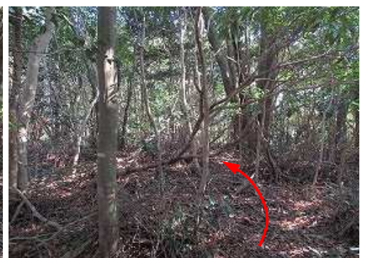
前方に最高地点が見えた。