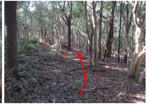
一息ついて帰路につき、歩き易い北斜面を西へ向かう。