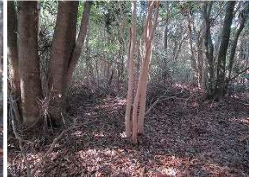
山名板など見当たらず、此処をヌク山(235m)とした。