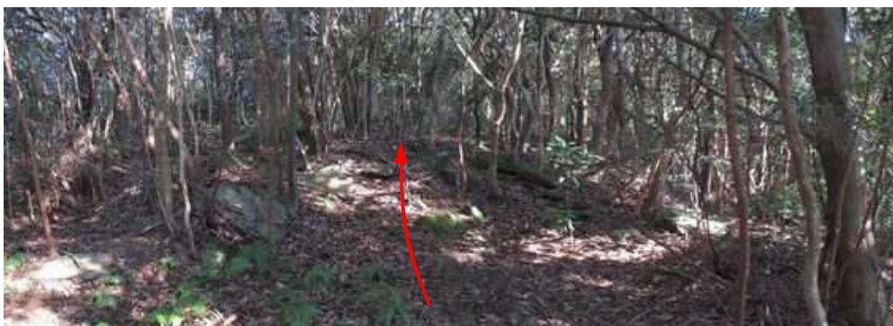
前方が山頂らしき地形になってきた。