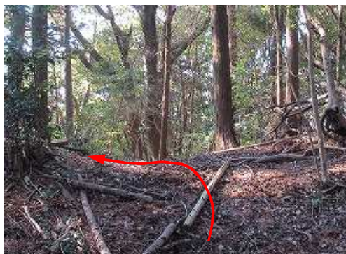
弱い コル に出会う。