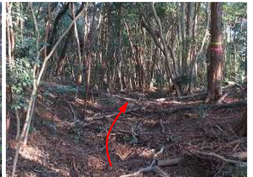
コルから東斜面へ下る。