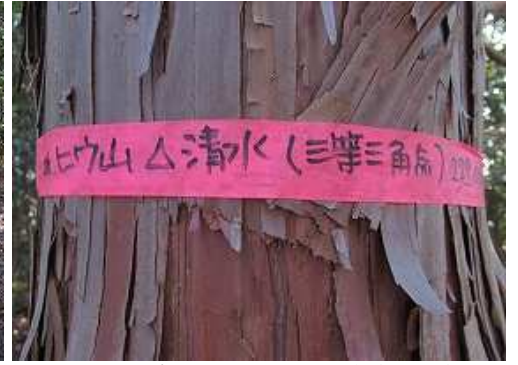
ヒノキの幹の赤テープに山名と三角点名が書いてある。