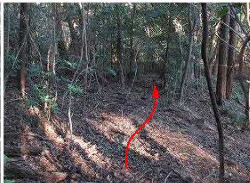
植林際を下って行く。