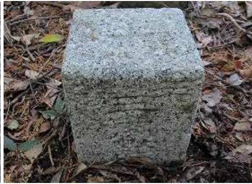
ヒウ山(229m)には明治30年選定の三等三角点:清水(しみず)(228.99m)が設置されている。