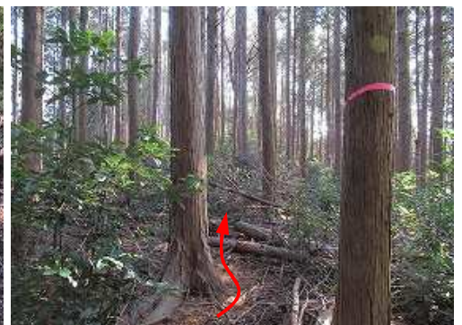
尾根筋を南へ向かう。