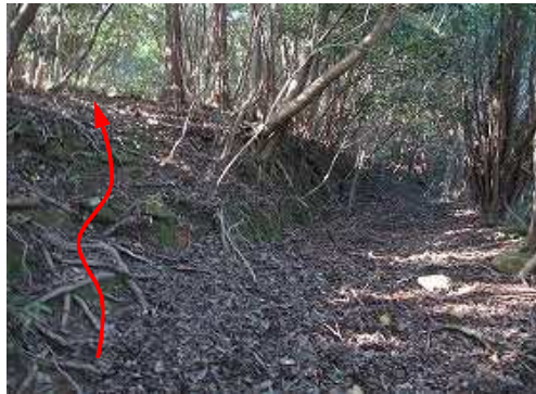
直ぐに左の斜面に 取付 く。