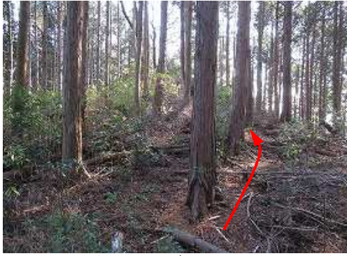
植林尾根を南へ向かう。