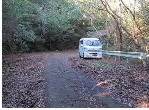
駐車地に帰ってきた。