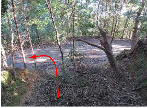
取付きを出て左へ向かう。