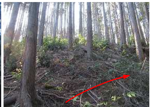
植林際の斜面を西北西へ上って行く。