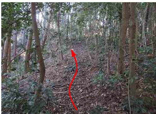
植林際の斜面を上って行く。