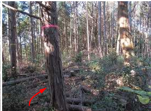
一息ついて、帰路につく。