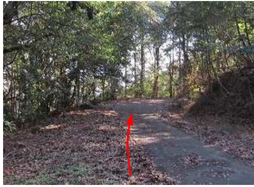
国道202号沿いの清水集落から西へ向かう市道に入り1km程走った所の三叉路を北上し1.4km程走った路肩に 駐車 する。