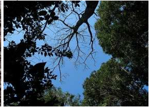
周囲を植林や雑木で囲まれ展望は得られない。