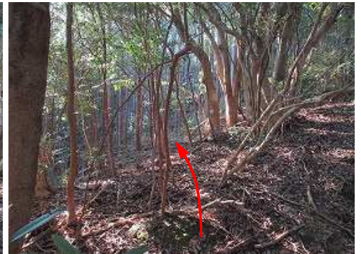
弱い尾根斜面を南西へ進む。