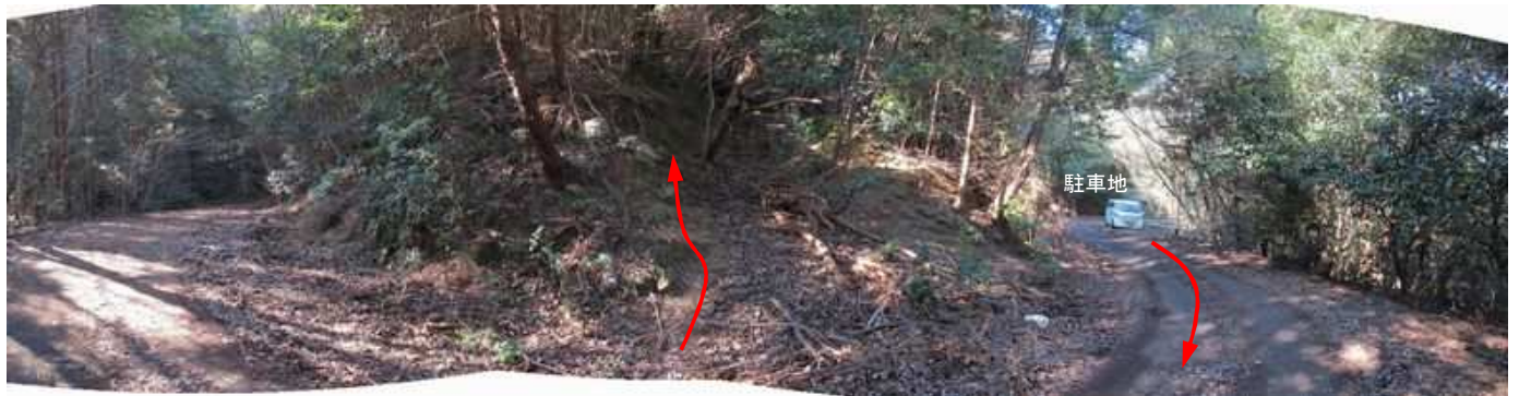
駐車地 から南へ20m程進んだ右カーブ地点山側に作業路跡があり、 取付き である。