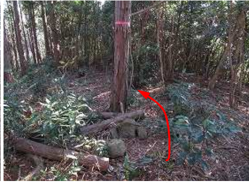
山頂らしき場所に出会う。