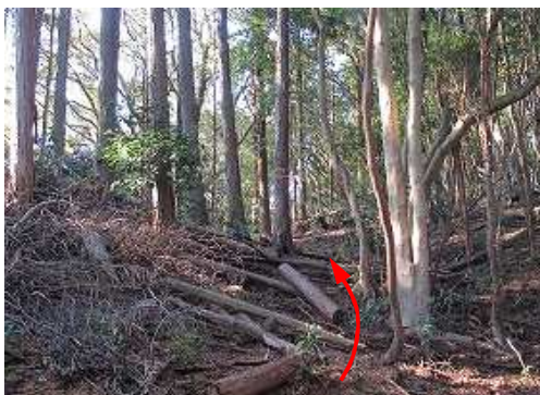
前方に弱い コル が見えた。