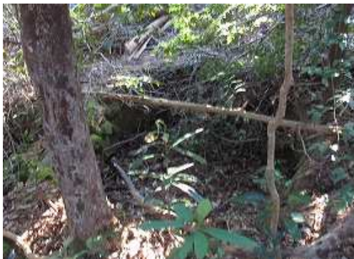
南側斜面に炭窯跡を見る。