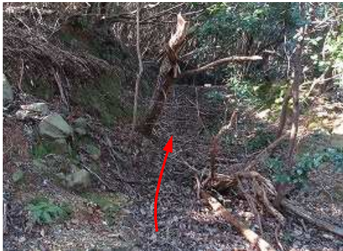
取付き の作業路跡へ踏み込む。