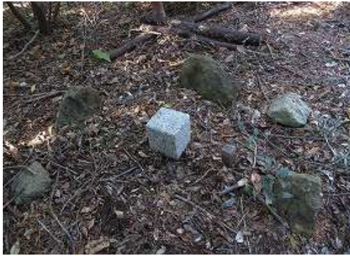
8m程先に保護石で囲まれた三角点を見る。