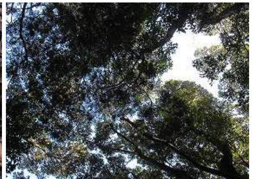
周囲を雑木で囲まれ展望は得られない。