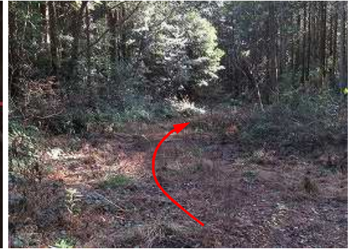
南東へ緩く下って行く。