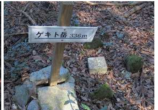
ゲキト岳(336m)山名標柱と三角点。