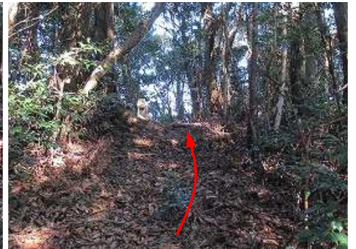
前方に祠が見えた。