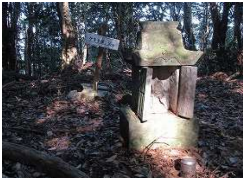
上り詰めると、祠の奥にゲキト岳の山名標柱を見る。