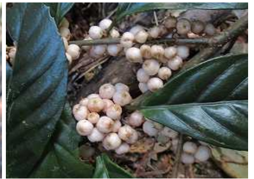
イズセンリョウ 実