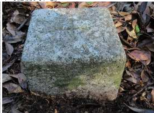
三角点は明治28年選定の二等三角点:多以良村(たいらむら)(335.62m)である。