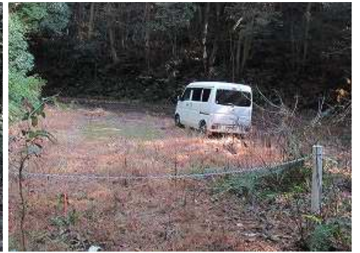
作業路入口に帰り着いた。