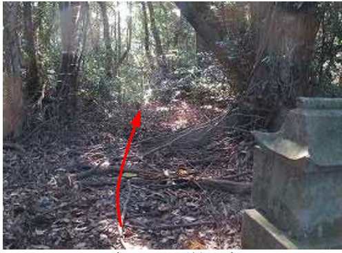
一息ついて、引き返す。