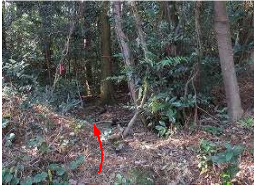
右カーブの西側が取付きで、奥に赤テープがみられる。