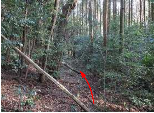
東北東の取付きへ向かう。