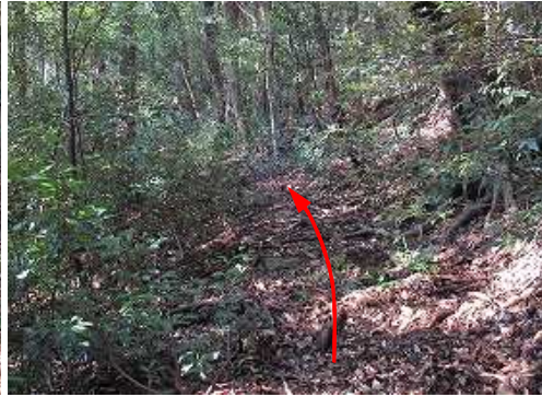
幅一間程の杉道を西南西へ進む。