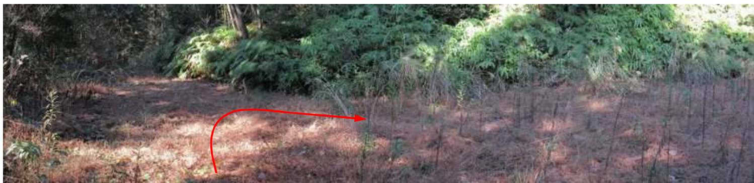
やがて三叉路に出会い、右方向へ向かう。