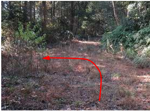
三叉路に出会い、左折する。