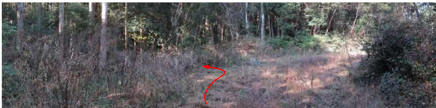
120m程進むと前方に右カーブが見えて来た。