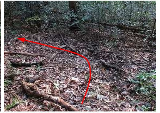
参道入口に下り、左へ向かう。