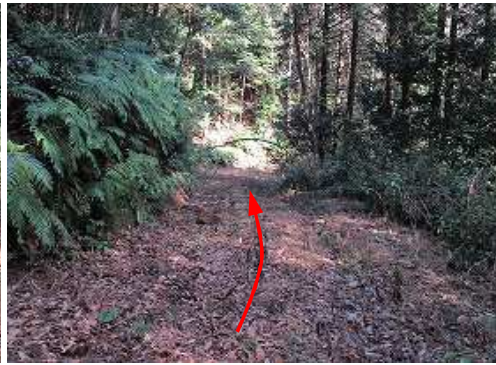
道なりに作業路を緩やかに下って行く。