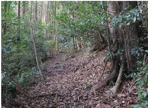
杉道は西南西へと続いて行く。