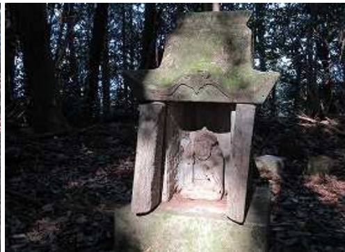
右側面に清水丸尾山之神と彫られた祠が東を向いて祀られている。