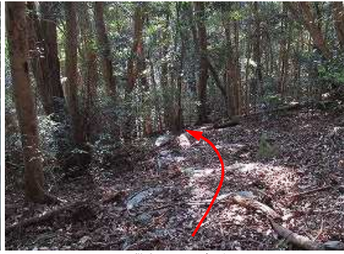
石段を下って行く。