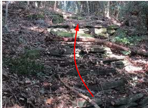
石段を上って行く。