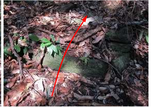
85m程進むと、山側に落葉で隠れた参道入口の石段を見つける。