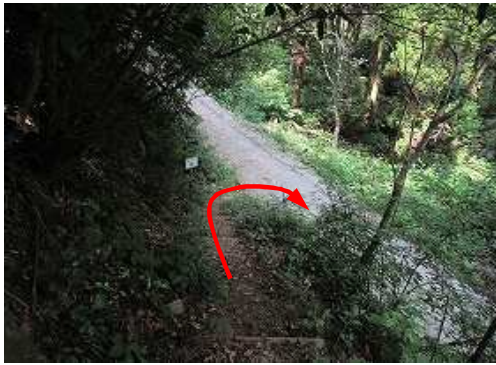
管理道路が見えた。