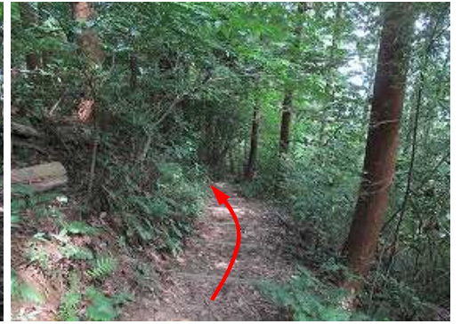
丸太階段を下って行く。