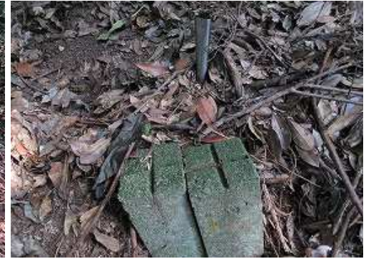
2本並んだ境界杭を見る。