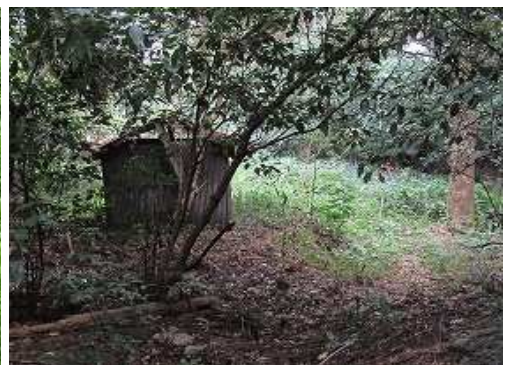
右に 栗島大明神 を見送る。