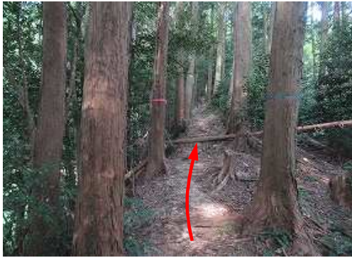
植林に沿って上って行く。