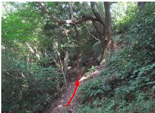
トラバー気味に北西へ進む。