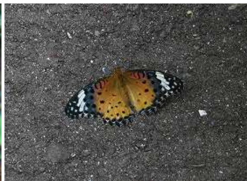
ツマグロヒョウモン 雌