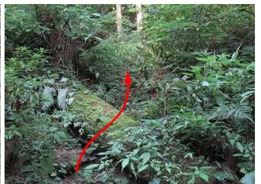
薄い踏み跡を上方へ向かう。