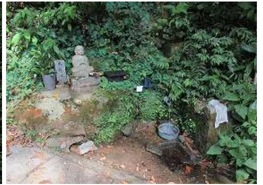
水量が激減した 水汲み場 を通過する。