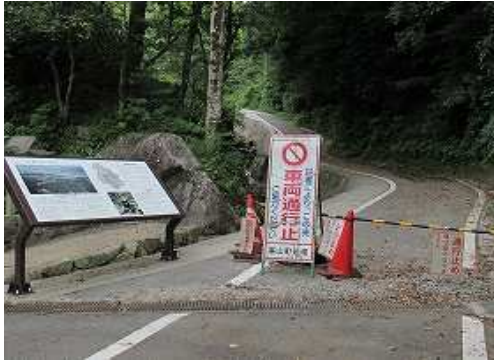
住吉宮から先は通行止め。

以前、南水門登山口の案内BOXに備えられた基肆城跡ハイキングコースのルート図において山頂部南の謎の建物の表示が気になっていたのので、今回確かめに向かった。