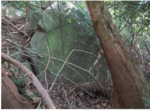
東へトラバーして斜面に 大岩F を見る。