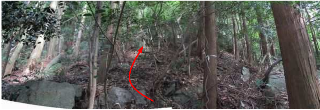
露岩が点在する弱い支尾根斜面を上方へ向かう。