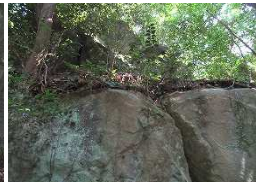
上部を見上げる。 周囲に建物跡の地形は見当たらない