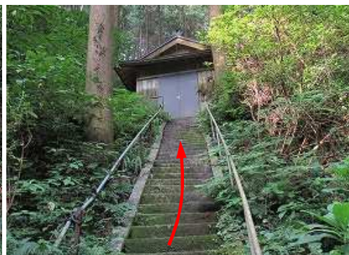
大師堂への石段を上って行く。