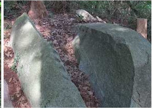
クサビ跡が残る割石を見る。