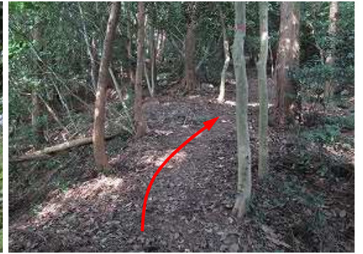
雑木斜面を上って行く。