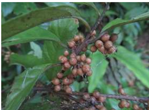
イズセンリョウ 実