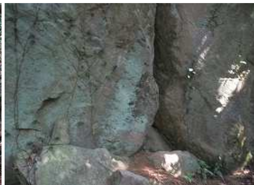
下って大岩Eの下部を撮る。