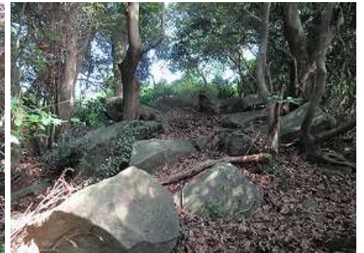
支尾根斜面上部に達する。前方奥に通天洞の一部が垣間見える。