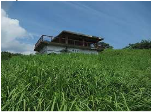
支尾根斜面上部に戻り、北上しヤブを抜けると 通天洞 が見えた。