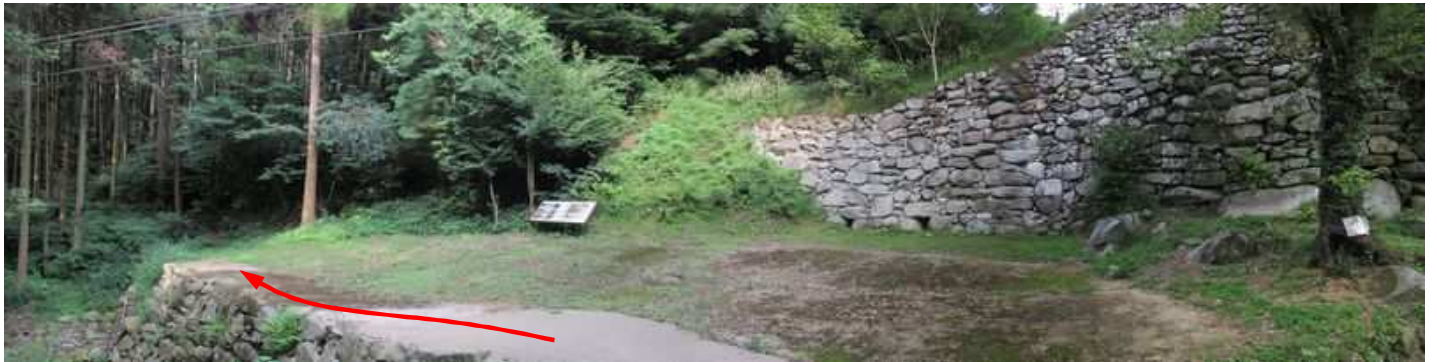
南水門跡の石塁を通過する。