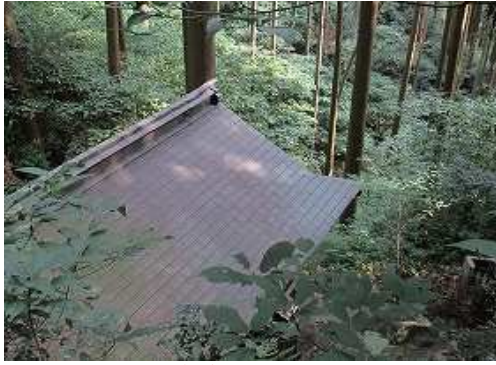
大師堂を見下ろす。