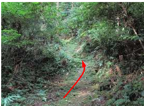
緩やかに上って行く。