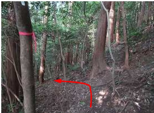
転回点 此処から謎の建物へ向かう。