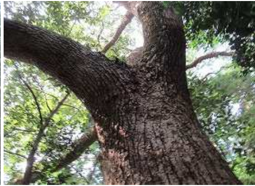
クスノキを見上げる。