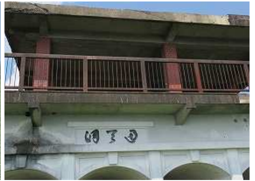
通天洞 を左に見送る。