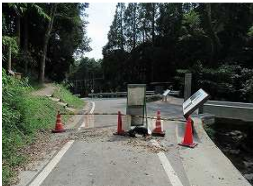
通行止めを抜ける。