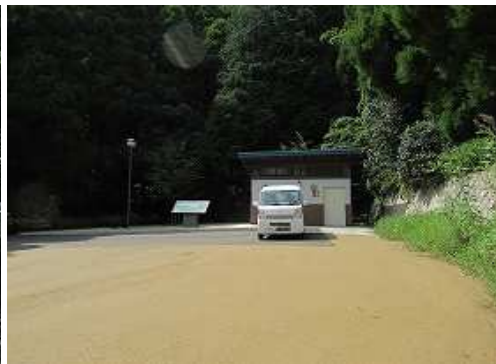
南水門跡P に帰っていた。