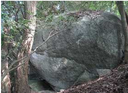
10m程上って大岩Cに出会い、下部を抜ける。