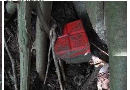
岩の下に国調境界杭を見る。