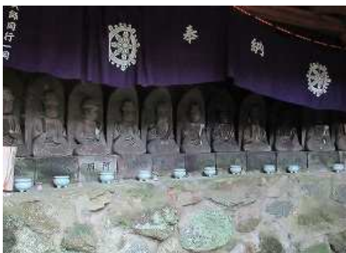
大師堂の山手には各種の菩薩が並んでいる。