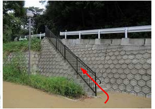
南水門跡Pから歩き始める。

以前、南水門登山口の案内BOXに備えられた基肆城跡ハイキングコースのルート図において山頂部南の謎の建物の表示が気になっていたのので、今回確かめに向かった。