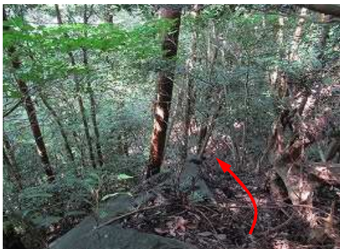
急斜面を下降する。