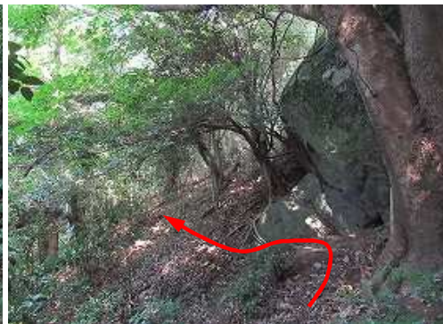
大岩の下を通過する。