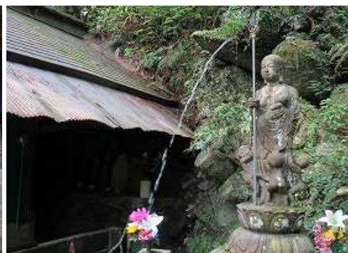
大師堂右側に子観音と水行場を見る。