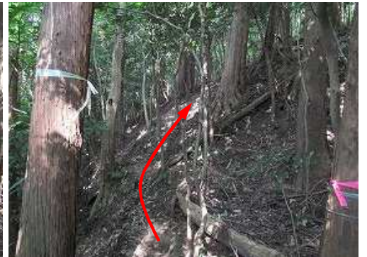
植林斜面を斜上する。