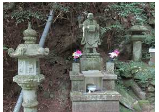
大師堂左側に立つ修行像。