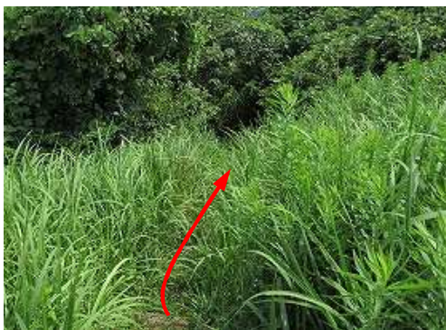
通天洞 傍の丸太階段を下る。