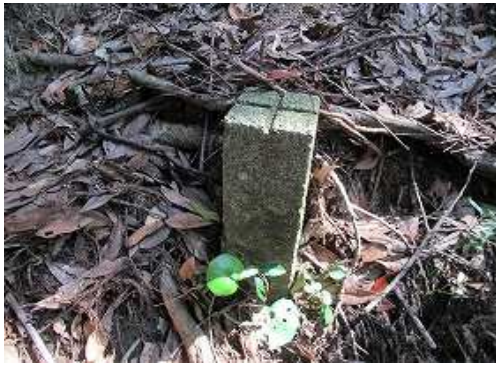
往路の軌跡を辿り、 国調境界杭 の先で境界杭を見る。