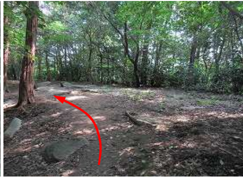
2x5間の 礎石 を通過する。