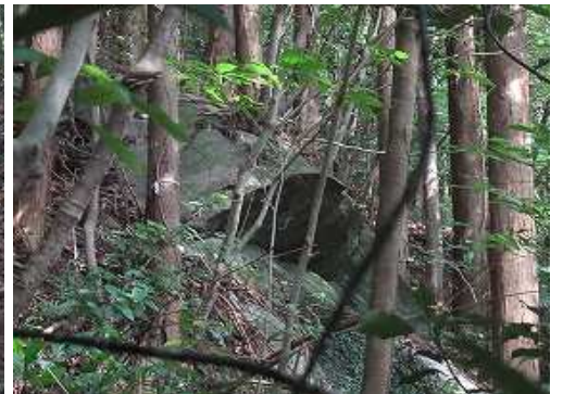
ヒサン岩を振り返る。