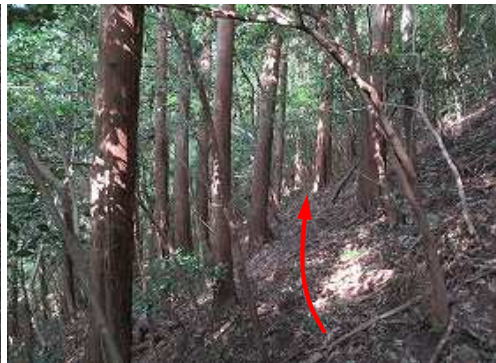
植林斜面の薄い踏跡を斜下する。