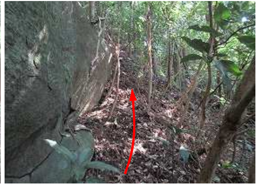
東へ斜上後、北へ斜面を上る。