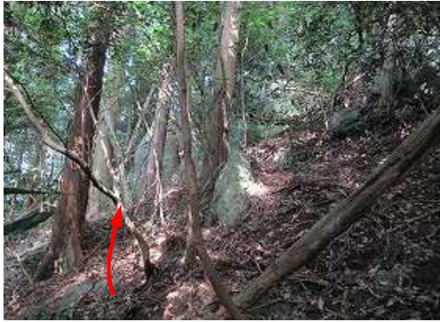
前方の赤テープへ向かう。