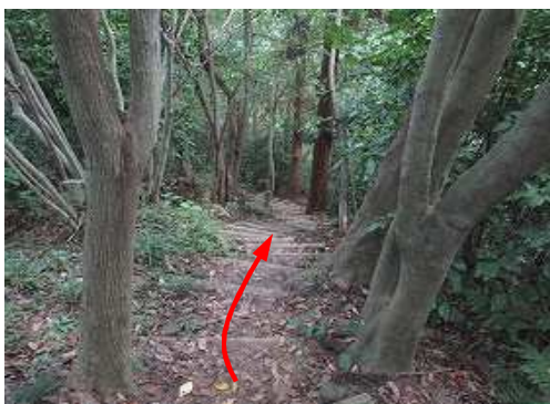
急な丸太階段を下る。