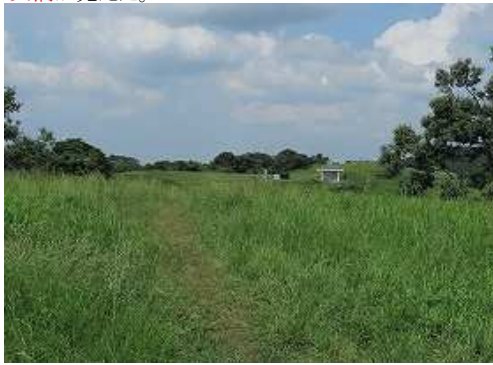
展望台方面の展望。