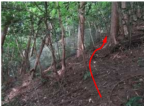
斜面に横たわるナマコ岩を抜ける。