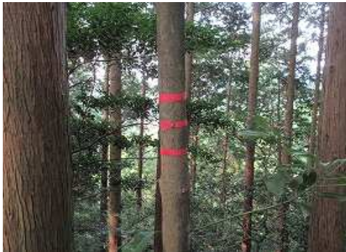
沢側に三本テープを見る。