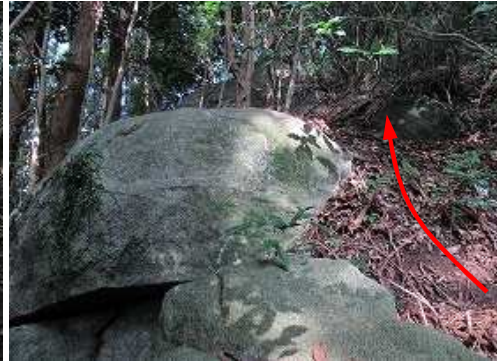
左の大岩Bを通過する。