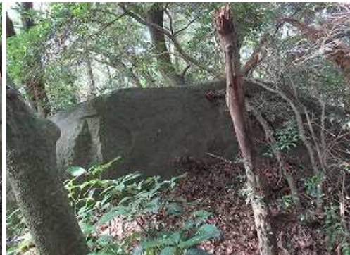
左に大岩Dを見送る。