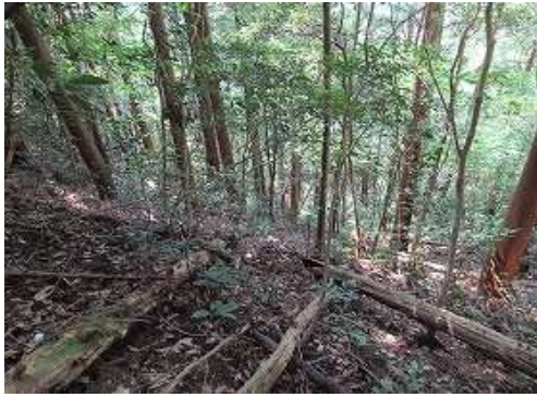
南斜面の様子であるが、建物跡の地形は見当たらない。