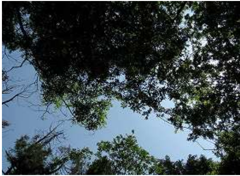
周囲を雑木で囲まれ展望は得られない。