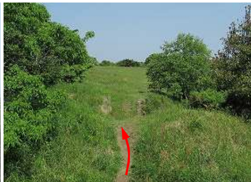
いものかんぎを越えて北へ向かう。