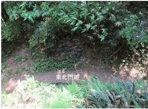
東北門跡を見下ろす。