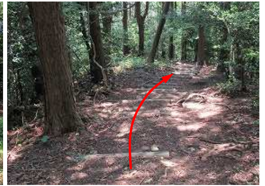
南南西へ丸太階段を下って行く。