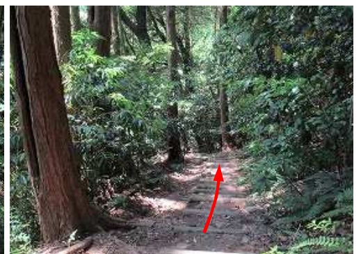
丸太階段を北西へ下って行く。