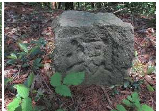
「塚」と彫られた境界石を見る。