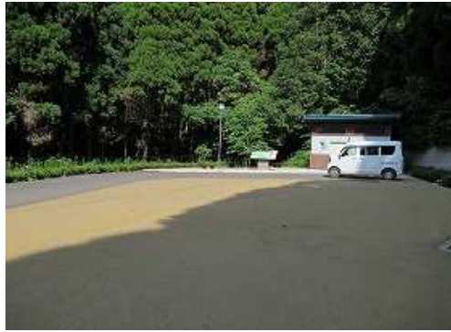
新しい 駐車場 。