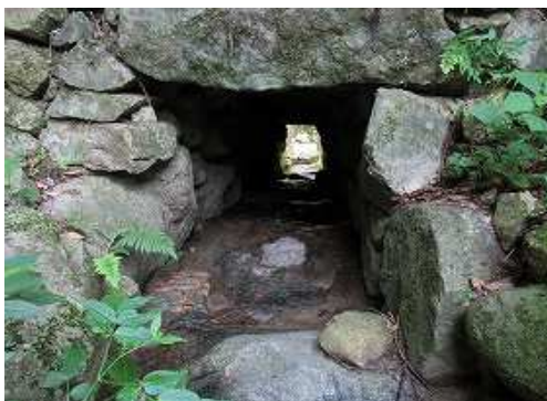
上流から見た樋管。