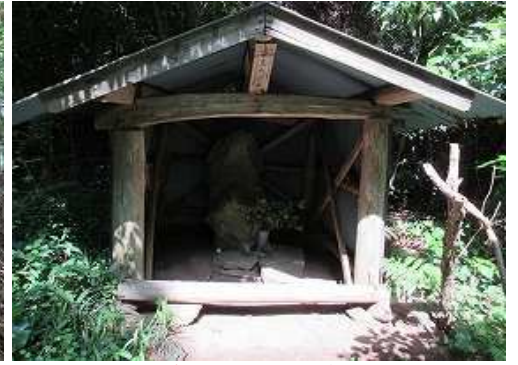
粟島大明神に立ち寄る。