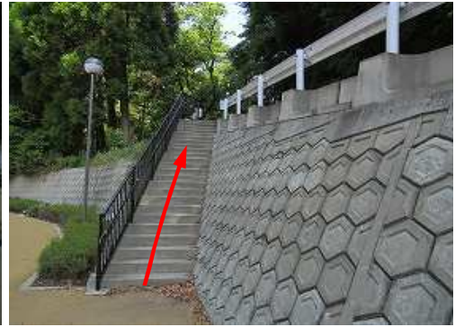
東側の階段を上る。