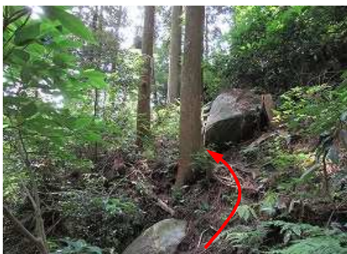
急斜面を上って行く。