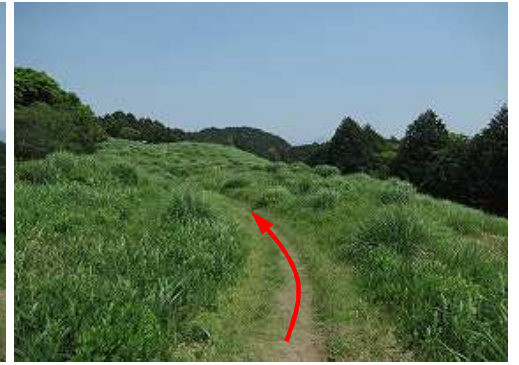
土塁を北へ向かう。