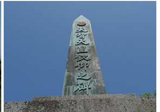
天智天皇欽仰之碑を見上げる。