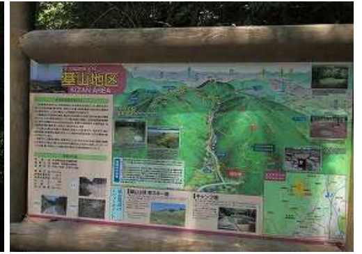
登山口に立つ案内板。