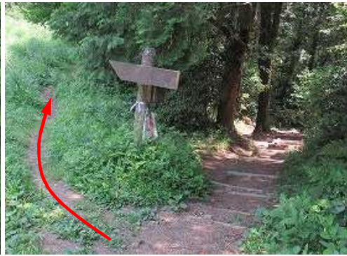
北帝門跡分岐を左へ進む。