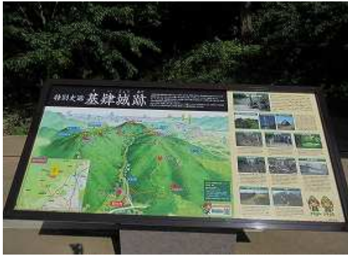
町道脇の旧駐車地から南に30m程の所にトイレのある新しい 駐車場 に駐車し、案内板に目を通す。