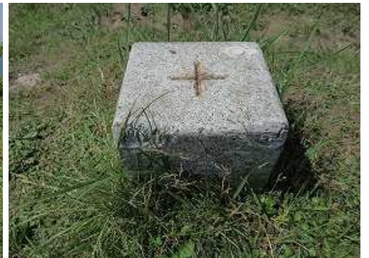
明治21年選点の一等三角点:防住山ぼうじゅさんが設置され、360度の展望が得られる。