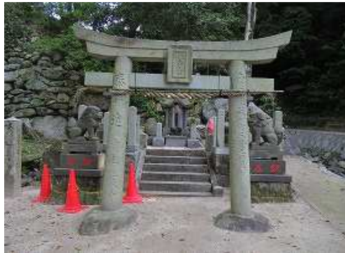
再建された 住吉宮 に立ち寄る。