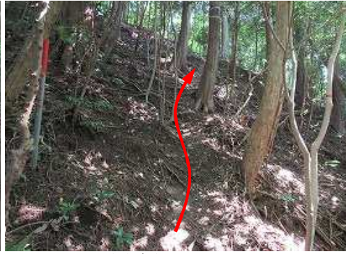
ジグザグに上って行く。