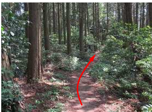
南へ緩く下って行く。