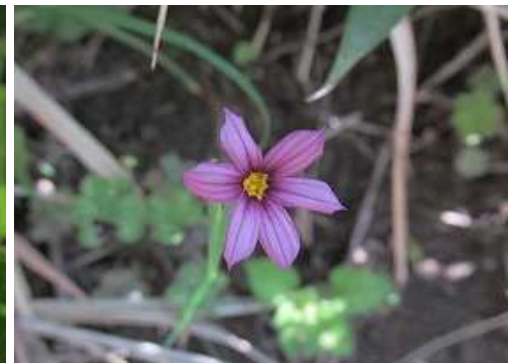
ニワゼキショウ 紫