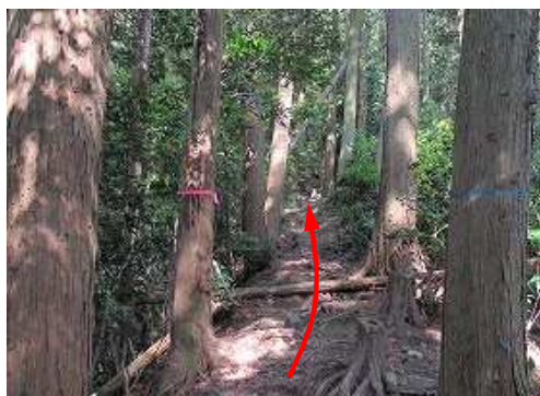
西へ植林された土塁線を上って行く。