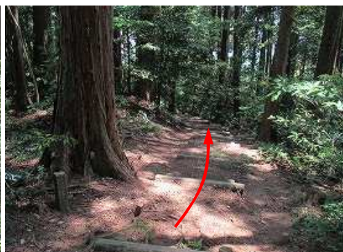
丸太階段を下って行く。