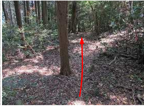
土塁分岐に出会う。