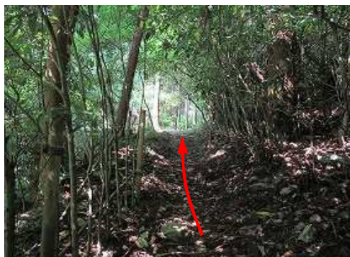
杉道を南西へ向かう。