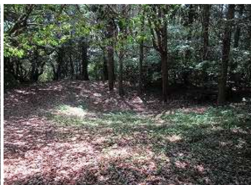
つつみ跡が見えた。