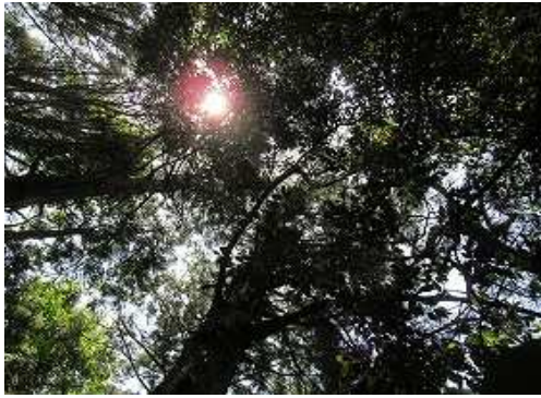
周囲を雑木で囲まれ展望は得られない。