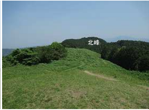
展望台から北北東に北峰を望む。