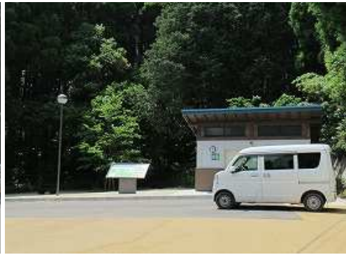
駐車場に帰り着いた。