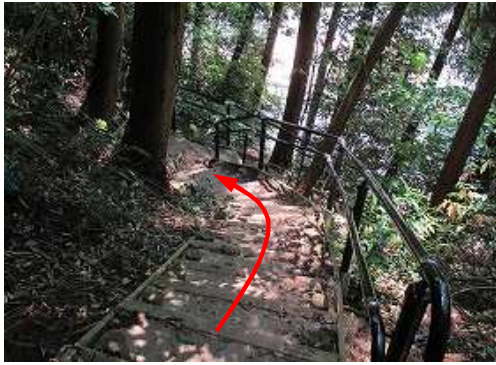
手摺階段を下って行く。