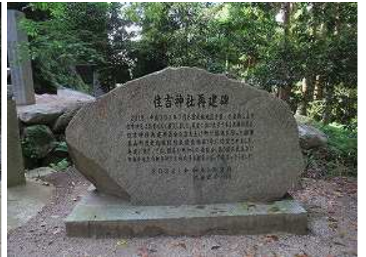
傍に住吉神社再建碑が立つ。