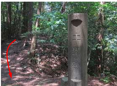
土塁跡の標柱を見る。