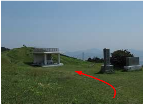
西休息所で一休みする。