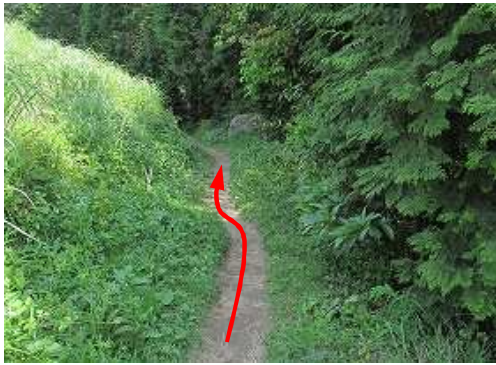
史跡コース分岐に出会う。