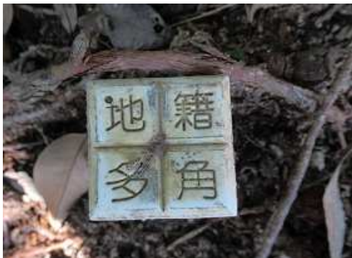
山中で見かけた各種の杭 地籍多角杭