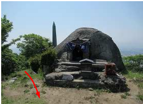
荒穂神社の磐座である霊々石(タマタマ石)。