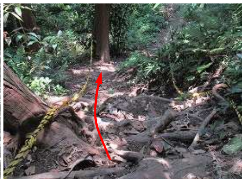
トラロープ斜面を下る。