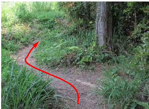
北帝門分岐に出会い、左へ進む。