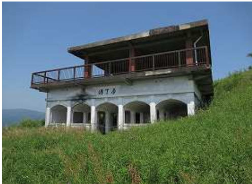
上り詰めて通天洞を見る。