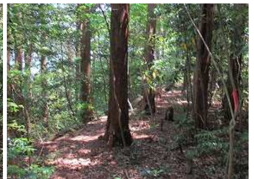
土塁線分岐から土塁線は東へ向かう。