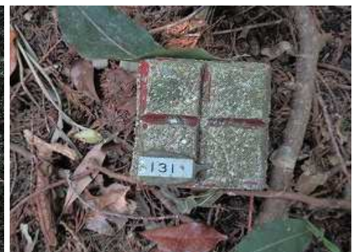
東峰(326m)へ立ち寄り、131杭を山頂とする。