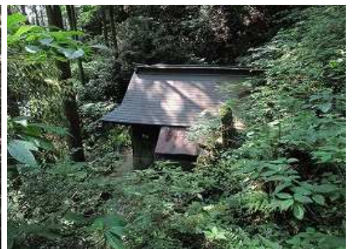
南東に 大師堂 を見下ろす。