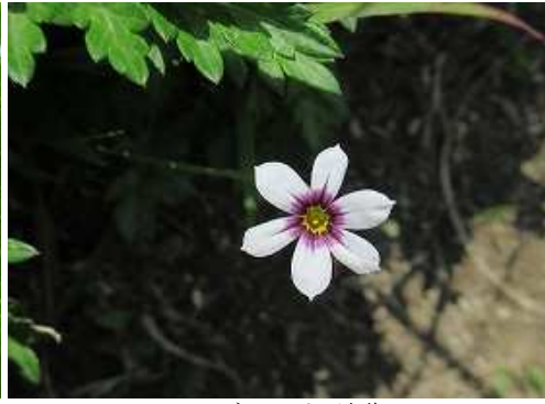
ニワゼキショウ 淡紫