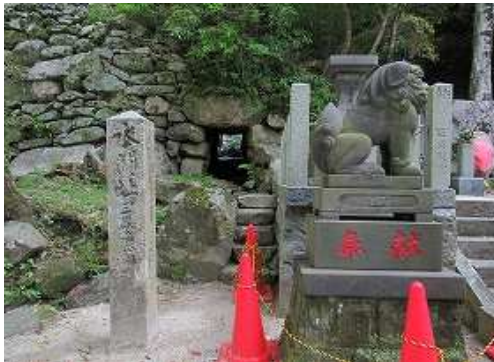
住吉宮左に南水門の樋管を見る。