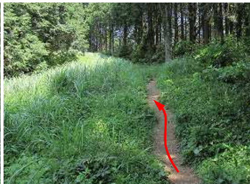
緩やかに上って行く。