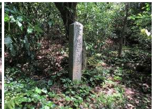
南東傍に北帝城址碑を見る。