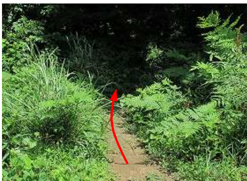
一息ついて、東へ向かう。