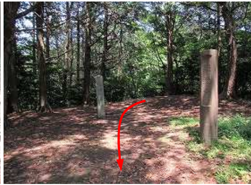
鐘楼跡を振り返る。