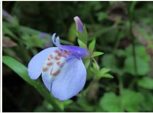
ムラサキサギゴケ