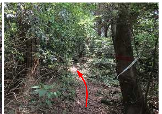
引き返し、十字路から東へ向かう。