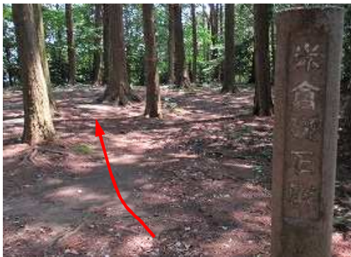
米倉礎石群へ下る。