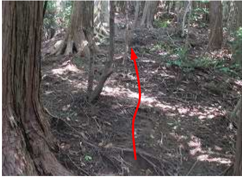
急斜面を上って行く。