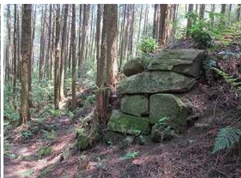
北帝門跡の石垣を見る。