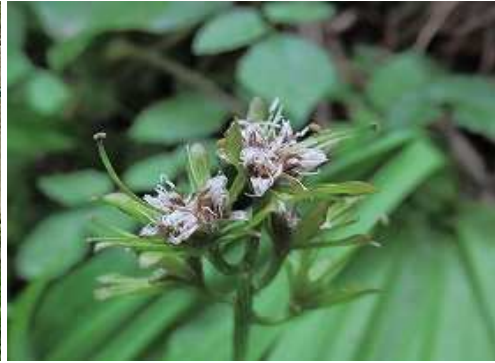
ショウジョウバカマ 花後