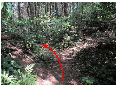
十字路から北に向かう。