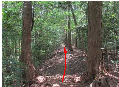
土塁を南東へ向かう。