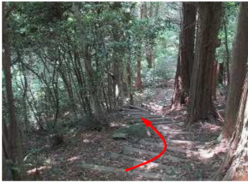
西へ丸太階段を下って行く。