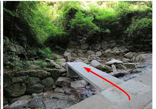
町道を北上し、コンクリート橋を渡る。