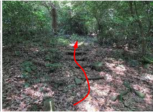
一般路に合流し、雑木斜面を上って行く。