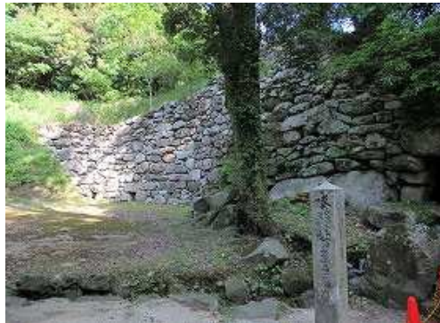
高さ8.5m、長さ26mの石塁が残る。