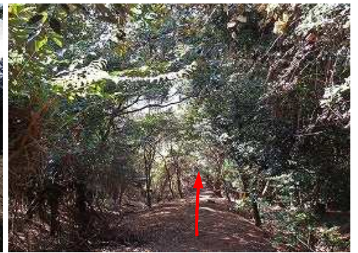
尾根筋を下って行く。