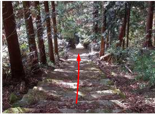
参拝を終え、参道の石段を下る。