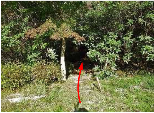
左カーブの所が 奥の院分岐 で北に進む。