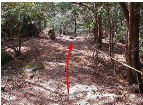
トラロープ斜面を下る。