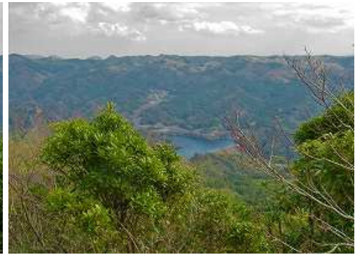
東に並石ダムを見下ろす。