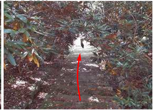
両側から張り出すシクナゲを潜って下る。