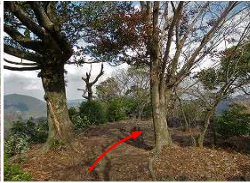
端部のショウケが鼻に着いた。