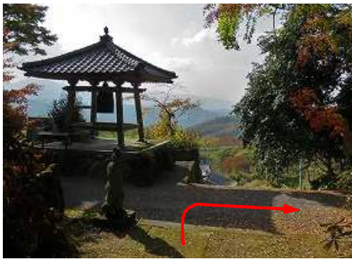
林道を横断し参道を下り終え、長安寺の鐘楼を見る。