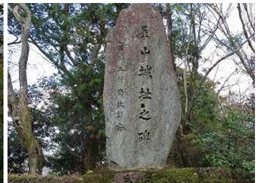
屋山城址之碑を見る。