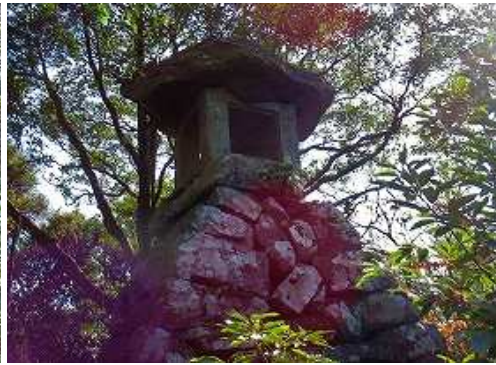
石燈籠を通過する。