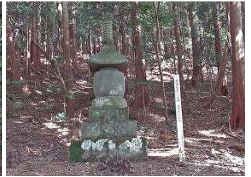
奥の院手前の山側に 県指定有形文化財 長安寺国東塔を見る。