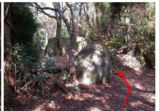
露岩の右を抜ける。