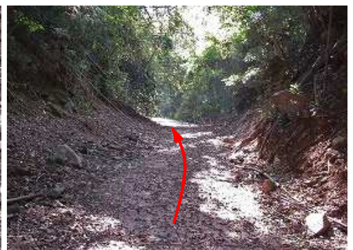
南南東へ上って行く。