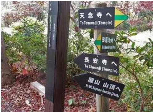
階段を上ると右に案内標柱が立っている。