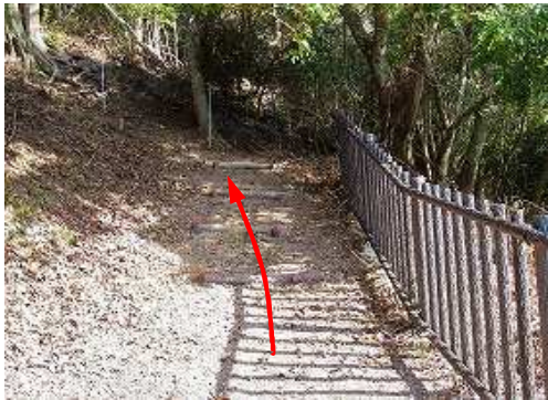
山側の丸太階段へ取付く。