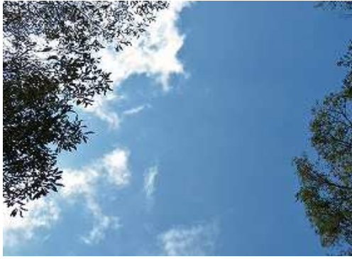
周囲を雑木で囲まれ展望は得られない。