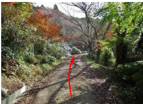
左からの林道に出会い、南東へ向かう。