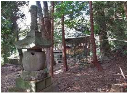
国東塔と 奥の院 。