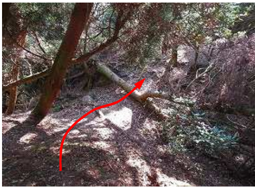
弱い堀切を通過する。