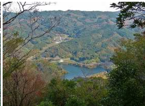
枝の隙間から東に並石ダムを見下ろす。