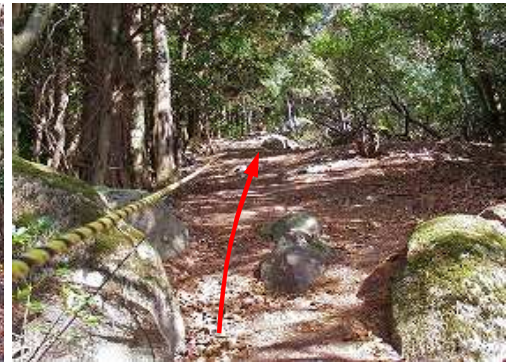
トラロープが伸びる露岩斜面を上って行く。