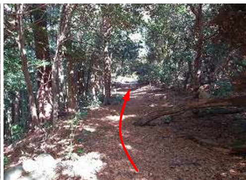
尾根筋西側を北北東へ進む