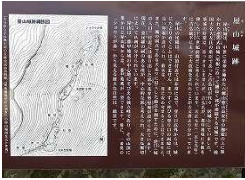
長安寺Pに駐車し、傍に立つ屋山城跡や金剛山長安寺の説明板に目を通す。

長安寺P→林道終点→屋山(543m)→ショウケが鼻→屋山(543m)→林道終点→奥の院→長安寺P