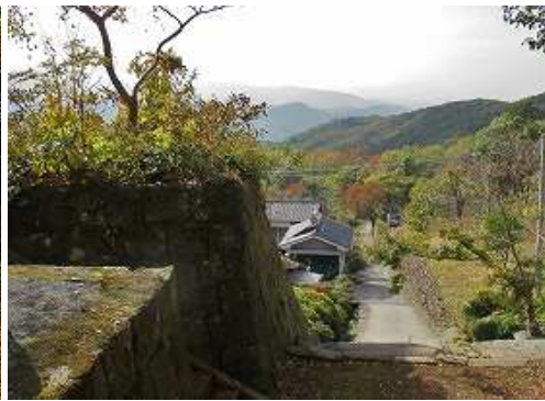
参道は更に西南西へ下って行く。