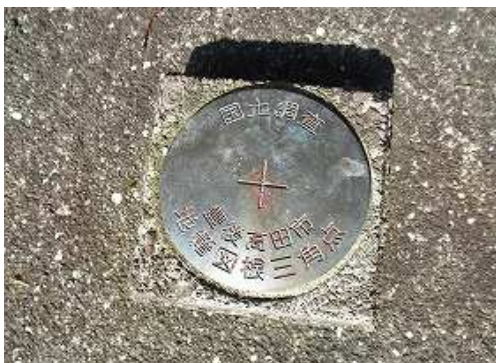
東側に図根三角点を見る。