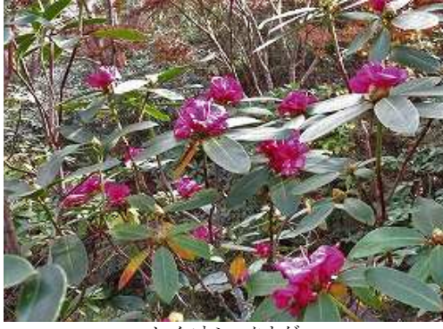
セイヨウシャクナゲ