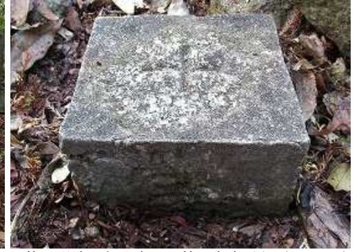
傍に明治30年選点の二等三角点:屋山(543.27m)が設置されている。