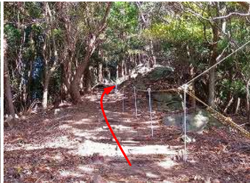
トラロープが張られた斜面を上って行く。