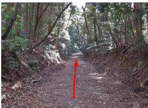
南南東へ緩く上って行く。