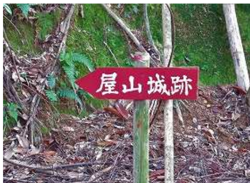
カーブを上って行くと案内板を見る。