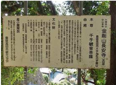
西側に立つ金剛山長安寺の説明板に目を通す。