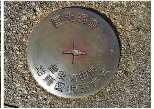
東側の露岩上に図根三角点が設置されている。