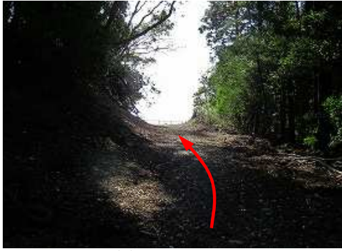
前方が開けて来た。