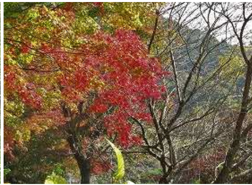
周囲の紅葉を眺めながら 長安寺P へ帰り着いた。