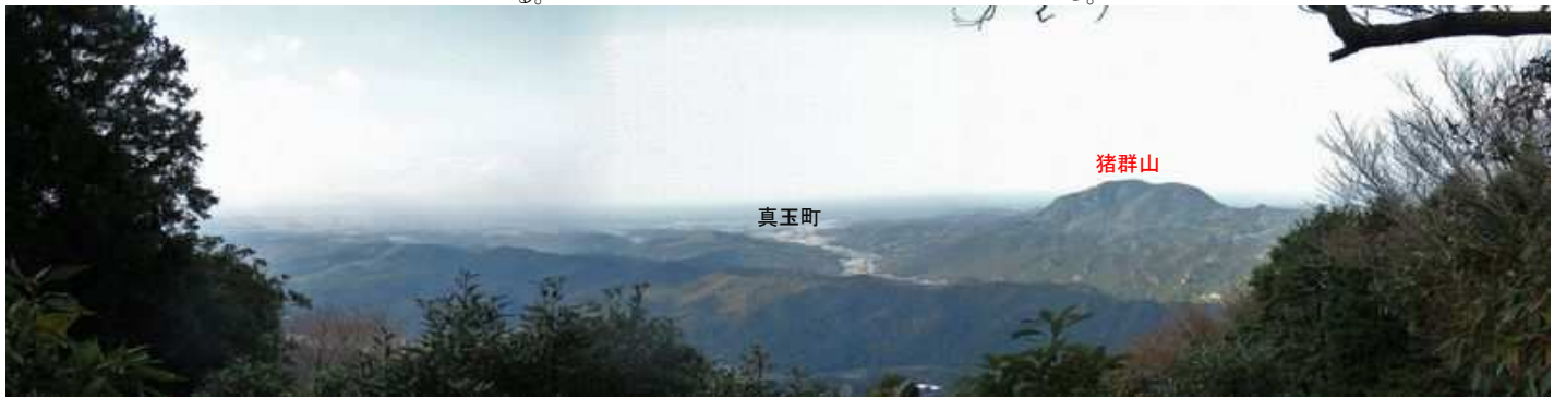
石燈籠から10m程進むと西から北西の展望が得られる。