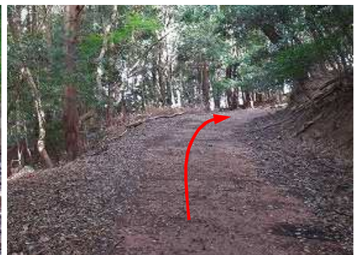
前方が右カーブして来た。