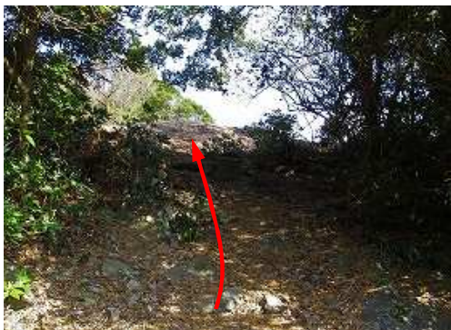
虎口の先が明るい。