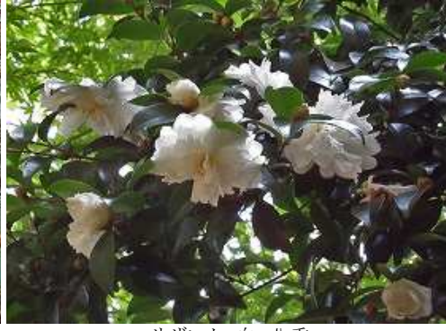
サザンカ 白 八重