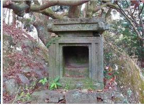
御神体が抜かれた金毘羅社があるが、石屋根は落ちている。