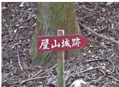
2つ目の案内板を山側に見る。