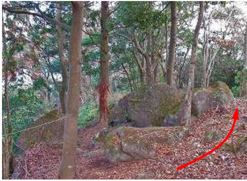
露岩を抜けて北東へ向かう。