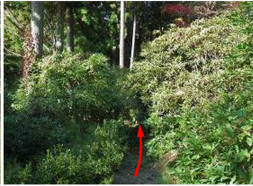
シクナゲ園を横断する。