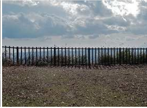
林道終点で南東側に擬木柵がある。