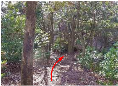
一息ついて、引返す。