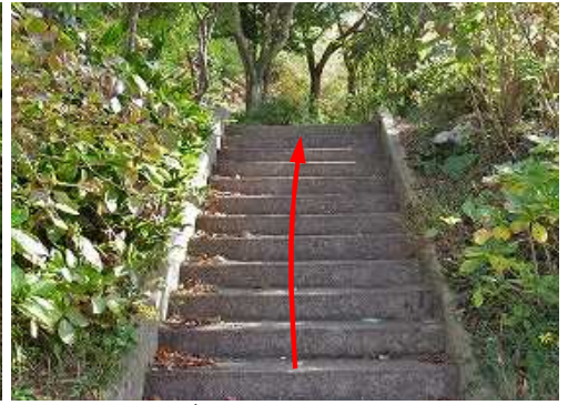
南側の階段を上る。