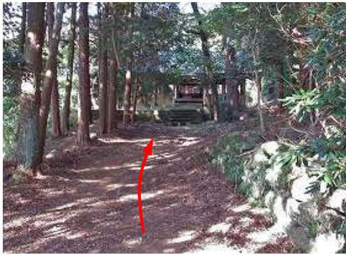
参道に出会い北へ進む。