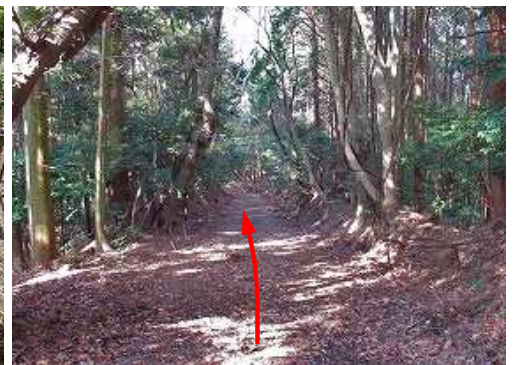
林道を下って行く。