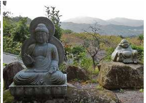
右に大日如来と布袋様が鎮座している。