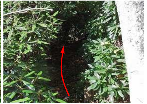
シクナゲのトンネルを抜ける。