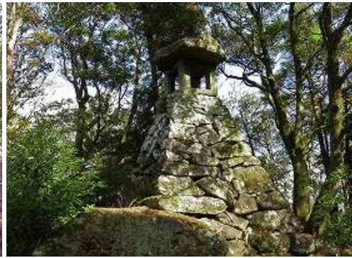
25m程北北東に進むと、高さ5m程の石燈籠を見る。