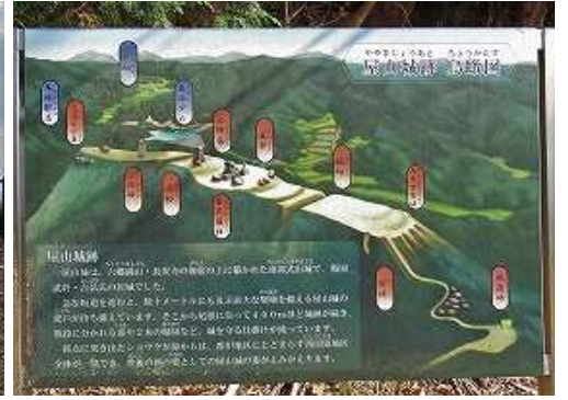
山側に屋山城跡鳥瞰図が立っている。