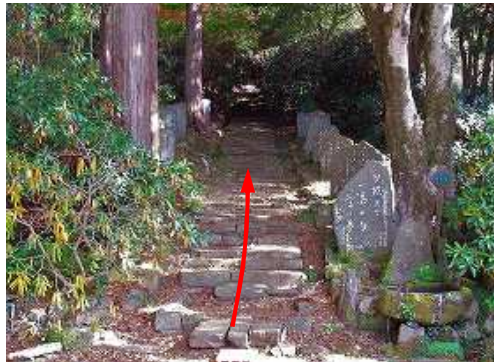
奥の院への参道に取付く。