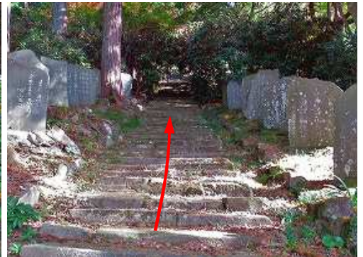
参道の両側に和歌を刻んだ句碑が並ぶ。