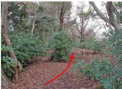
平坦地を北北東へ進んで行く。