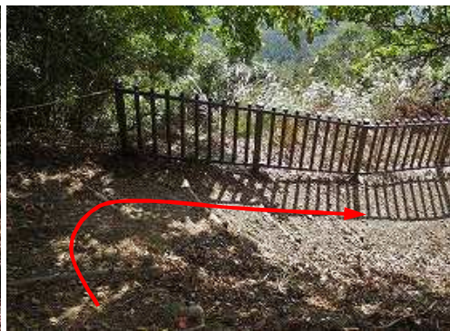
林道終点まで下る。