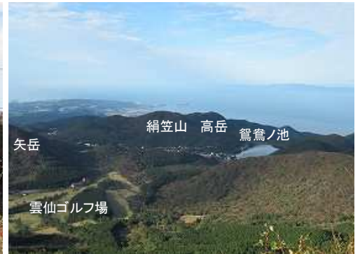
西南西を見下ろす。