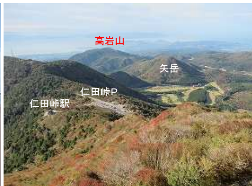
南南西に仁田峠Pを見下ろす。