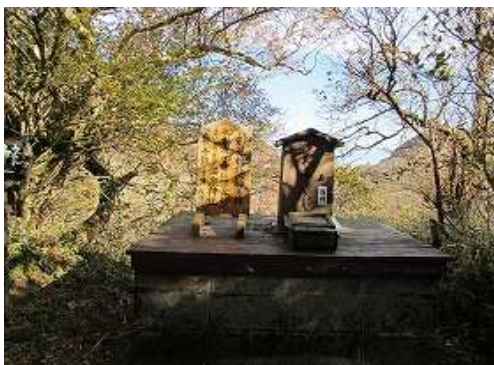
登り上がるとおみくじ広場で、左へ向かう。