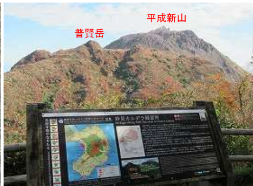
おみくじ広場から北の眺望。