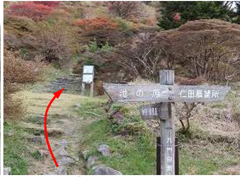
70m程歩くと、「妙見・国見岳」と書かれた標柱の立つ仁田峠登山口で石段に取付く。