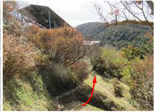
仁田峠駅へ向かう。