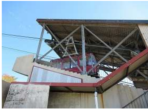
上って行くロープウェイ。