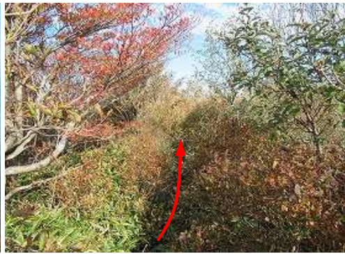
一息ついて、引き返す。