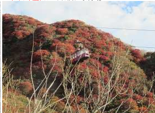
東側を上るロープウェイ。