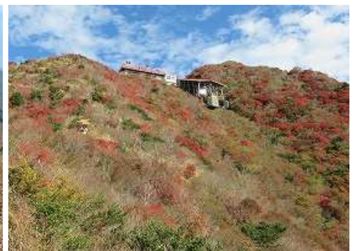
下山路から妙見岳駅を見上げる。