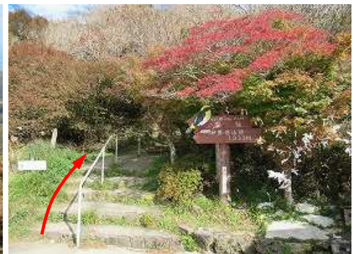
遊歩道を上って行く。