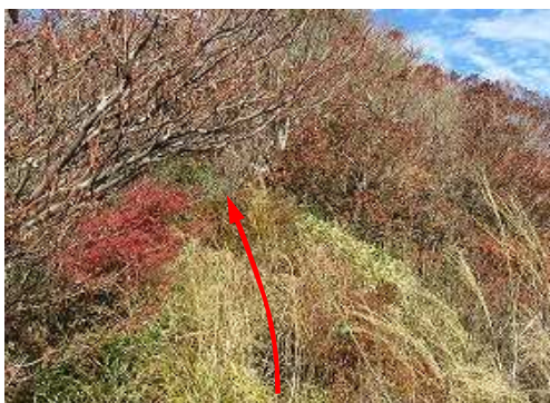
神社東側の尾根筋に踏み込み、ロープ場を抜ける。