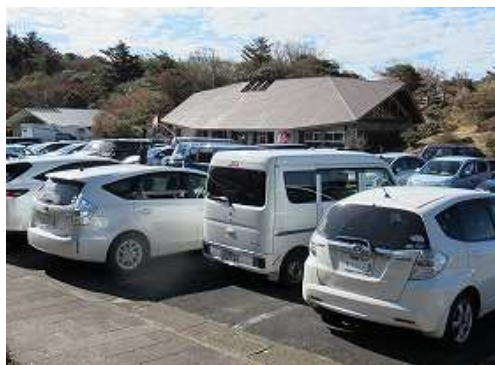
仁田峠Pに降り着いた。