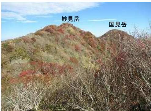
北に妙見岳・国見岳を望む。