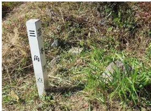
広場の南端斜面に平成13年選点の四等三角点:仁田峠(1079.01m)がある。