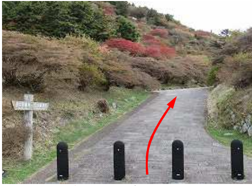
仁田峠Pから仁田遠望所へ向かう。