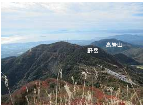
南南西を見下ろす。