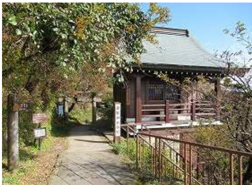
駅東側に薊谷へのルートと普賢神社拝殿がある。