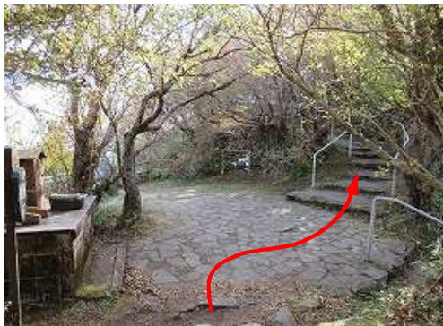
おみくじ広場を下る。