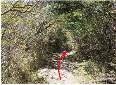
石段を下って行く。