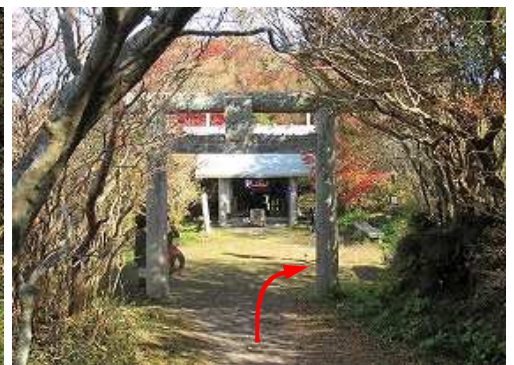
妙見神社が見えた。