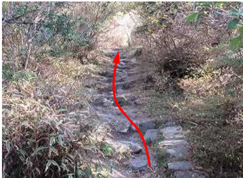
不揃いとなった石段を上って行く。