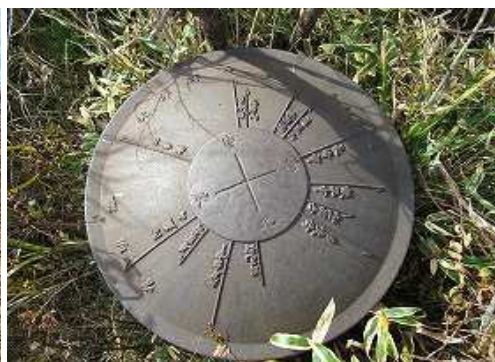
妙見岳(1333m)に到着。方位盤や基準点は撤去されずに残っていた。