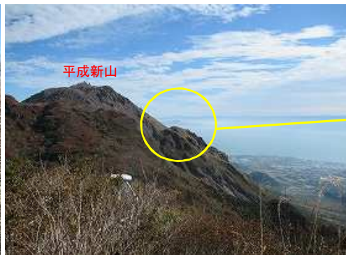
東に平成新山を望む。