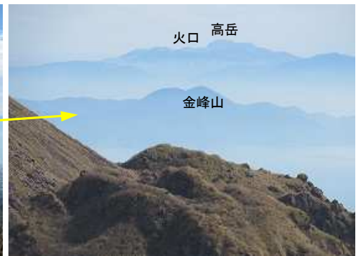
東に阿蘇山を遠望する。