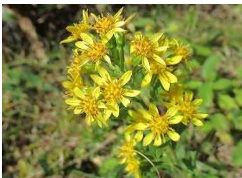
アキノキリンソウ