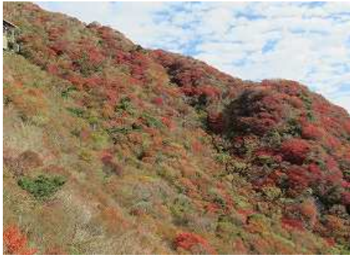
東尾根、西斜面の紅葉。