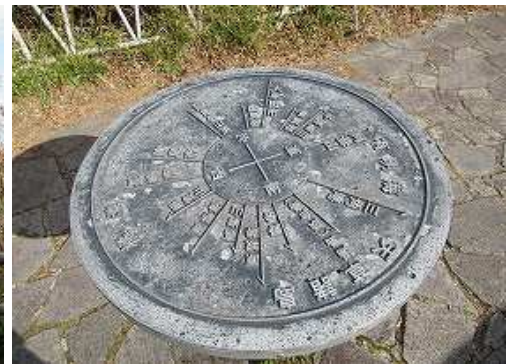
石段をひと上りすると展望台で方位盤がある。