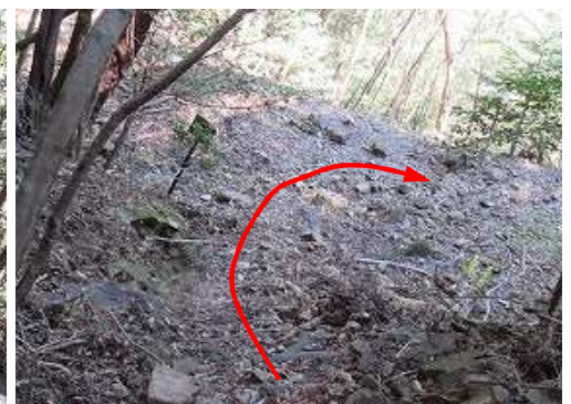
登山道入口に下り着いた。