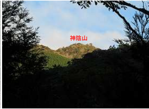
北北西に神陰山を望む。