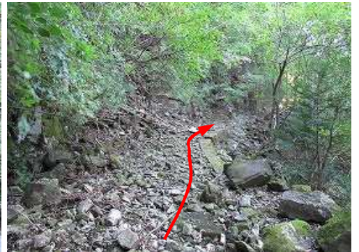
落石が堆積した支線を緩く上って行く。