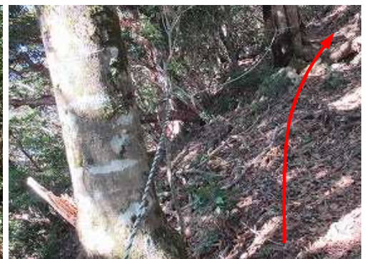
南西斜面に張られたトラロープを通過する。