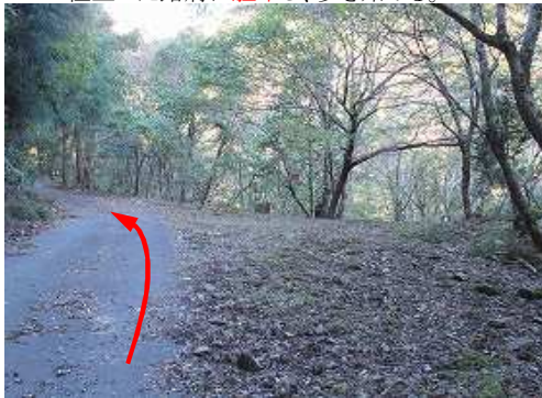
千畳滝傍の駐車適地を通過する。