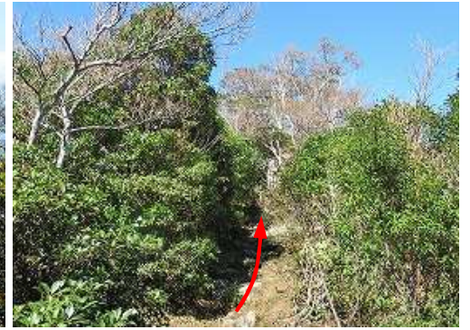
背の低い灌木帯を緩く上って行く。