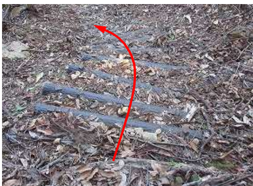
プラ階段終了まで下って来た。