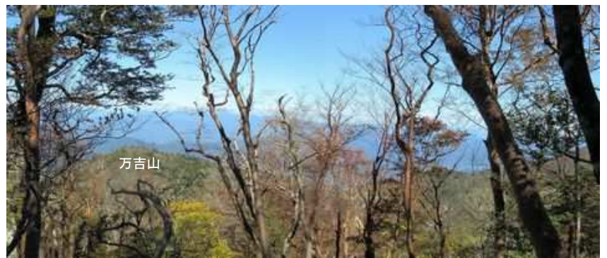
北に万吉山を振り返る。