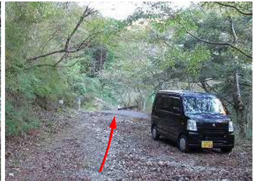
林道分岐の傍で悪路を上って来た車に出会う。