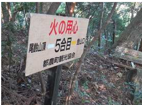
5合目の案内板を下る。