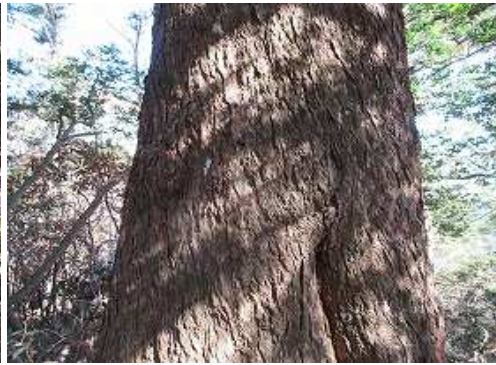
幹回りが3m以上のツガ大木を見上げる。