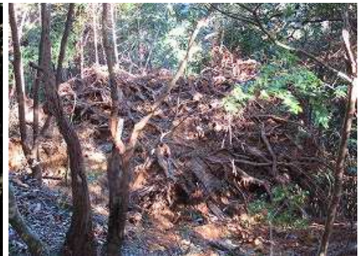
北側に根回りが6畳程の広がりを持つ大木の倒木を見る。