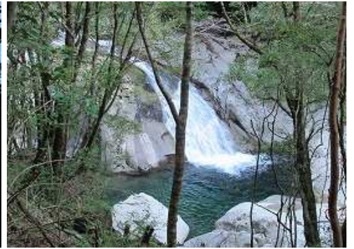
名貫川に掛かる えのは 滝を見下ろす。