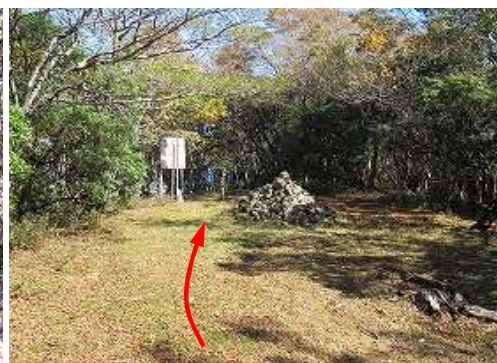
再度、尾鈴山(1405m)に到着。