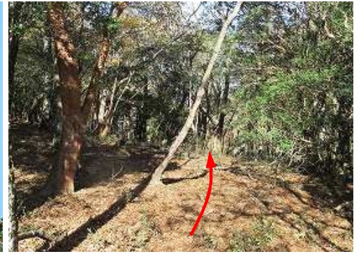
一息ついて、北西へ向かう。