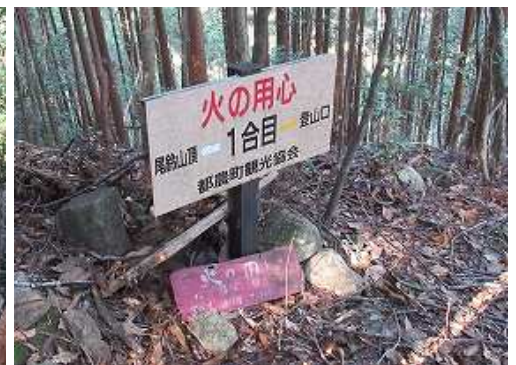
1合目の案内板を下る。