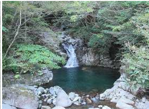
橋上から 甘茶 滝を見る。