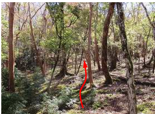
広大な斜面を上って行く。