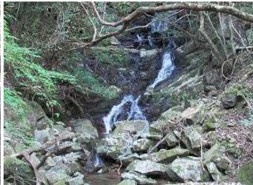
南側の沢から落ちる いこい の滝を見送る。