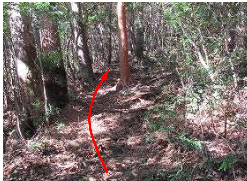
傾斜がやや緩んだ尾根斜面を上って行く。