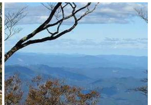
祠近くから、北に祖母の山並みを望む。