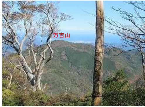
展望地から北に万吉山を望む。