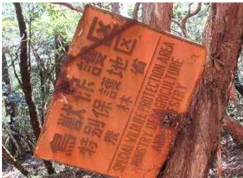
東側に鳥獣保護区の看板を見送る。