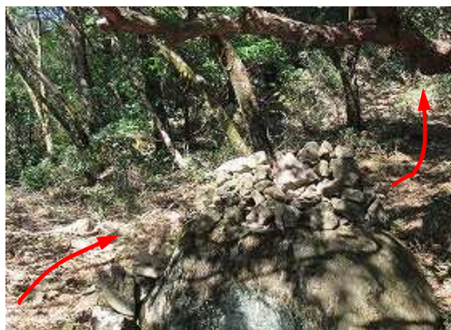
岩に積まれたケルンを通過する。