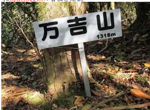
杭の先4m程の所に万吉山(1318m)の山名板を見た。