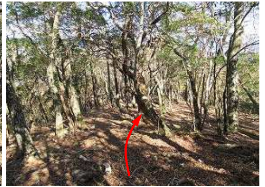
広大な尾根斜面を北へ緩く下って行く。