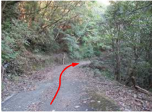
尾鈴キャンプ場北西の林道支線に架かる橋から450m程上った路肩に 駐車 し、歩き始める。

駐車地→登山道入口→5合目→尾鈴山(1405m)→万吉山(1318m)→尾鈴山(1405m)→展望地→登山道入口→駐車地