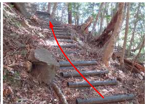
擬木階段を上って行く。