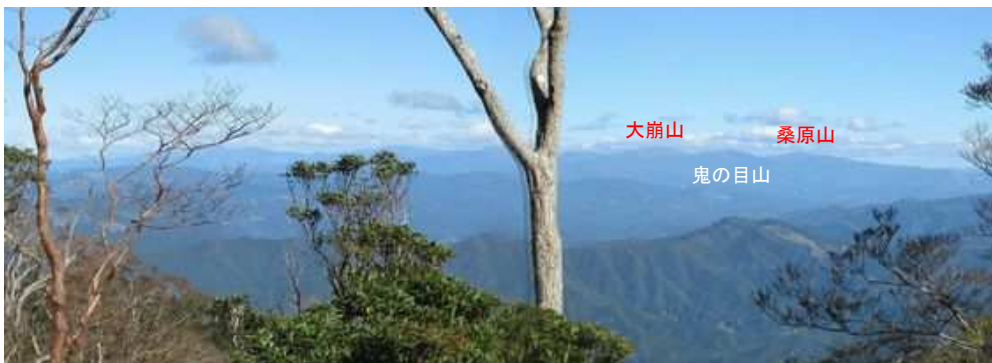
北北東に大崩山を望む。