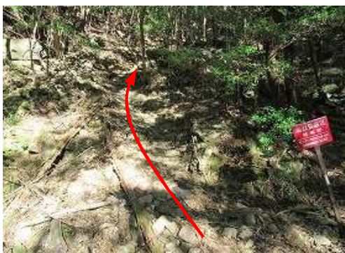
荒れた擬木階段に取付く。