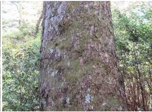
ツガの大木を見上げる。