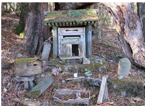
尾鈴神社の祠に参拝する。