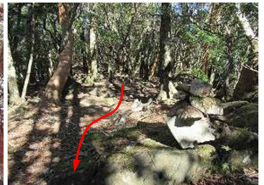
ケルンに積み足しておいた。