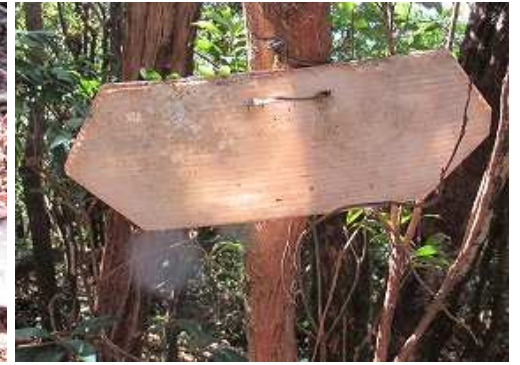
補点杭の西側に文字が消えた案内板を見る。 一息ついて、引き返す