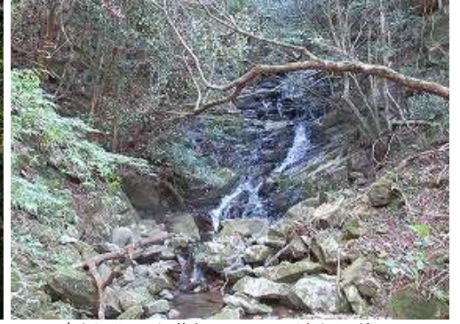
南側の沢から落ちる いいい の滝を見送る。