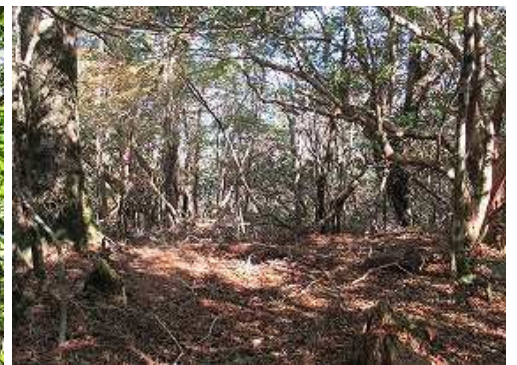
東方向へ赤テープが見られ、神陰山へ向かって行くようだ。