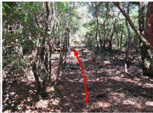
雑木斜面を緩く上り返して行く。