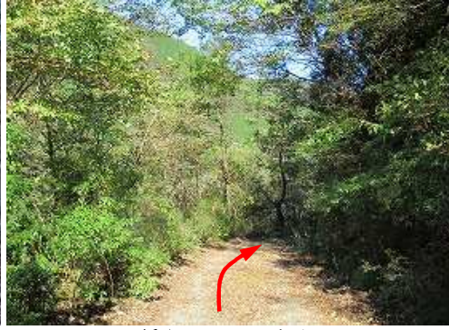
緩やかに下って行く。