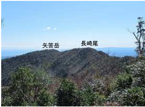
登山道から南に長崎尾(1373m)・矢筈岳(1330m)を望む。