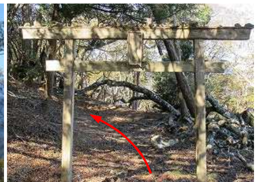
引き返し、鳥居を潜る。