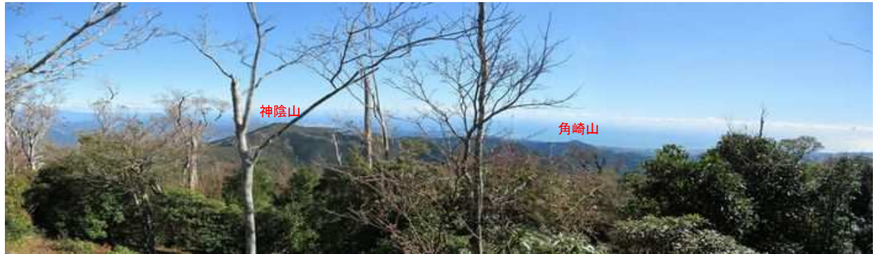
尾根斜面から北東に神陰山(1272m)～角崎山(1071m)の山並みを望む。