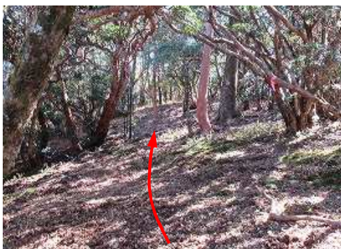
東南東へ斜上して行く。