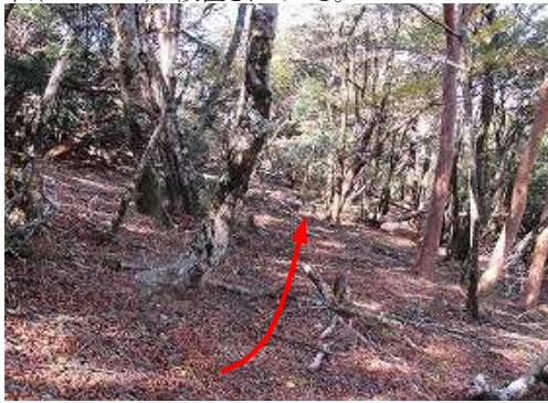
西北西へ斜面を下って行く。