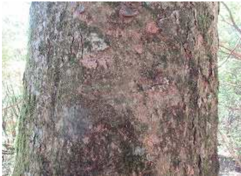
緩く下ってアカガシの大木を見上げる。