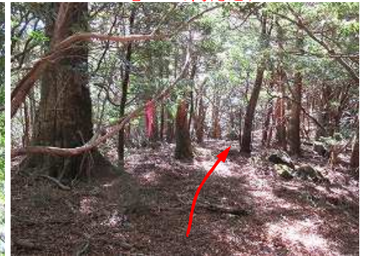
緩やかに下って行く。