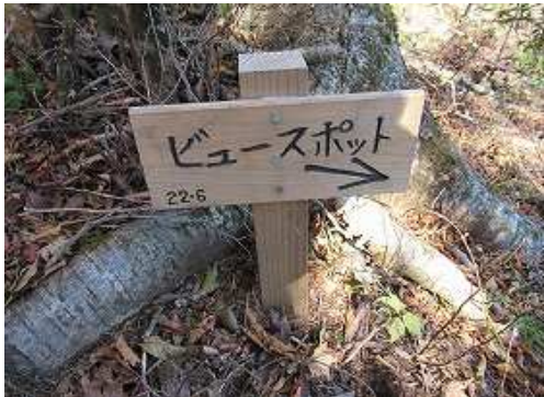
展望地への案内板を見て立ち寄る。