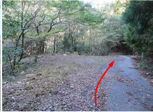
駐車適地を通過する。