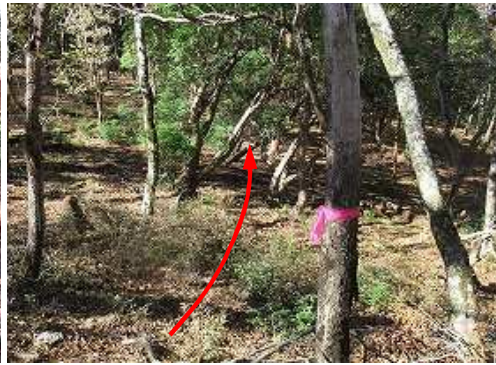
赤テープのある斜面を下って行く。