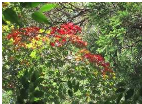
一部が紅葉したモミジを見上げる。