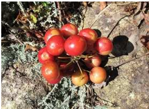
サルトリイバラ 実