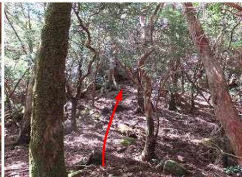
緩く上り返して行く。