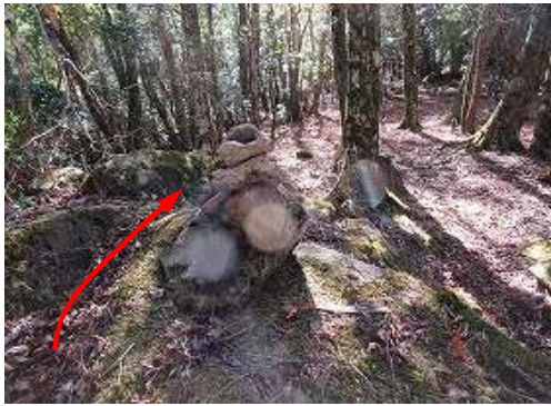
岩に積まれたケルンを通過する。