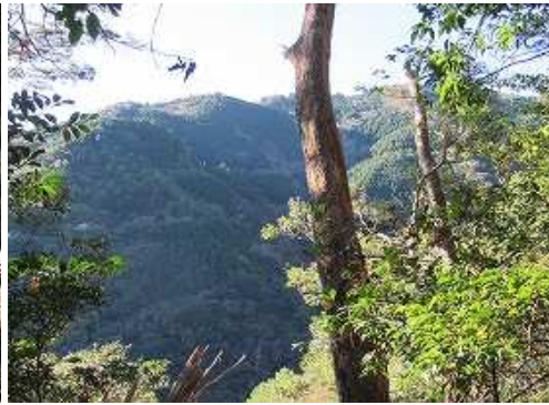
南の尾根筋を垣間見る。