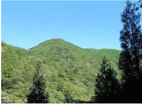
東北東に角崎山(1071m)を望む。