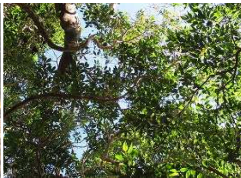
周囲を雑木で囲まれ展望は得られない。