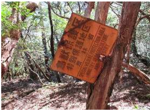
北北東へ緩く下って行くと弱いコルとなり東側の幹に鳥獣保護区の看板を見る。