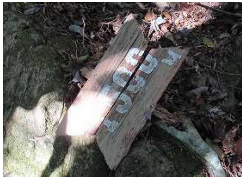
「1500M」と書かれた地面の案内板。