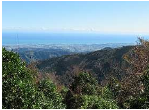
登山道から南東に川南町を見下ろす。