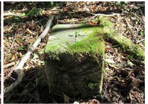
苔むした杭に出会う。