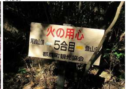
5合目の案内板。登山道入口から50分程要したので、凡そ10分毎に1合上って行くようだ。