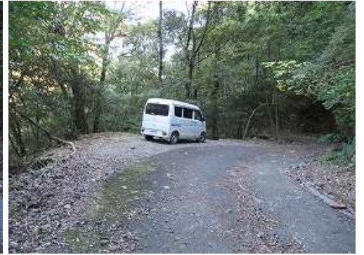
道なりに下って 駐車地 に帰着いた。