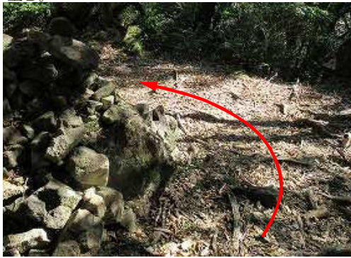
岩に積まれたケルンを通過する。