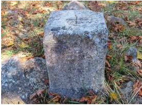
ケルンの傍に明治25年選点の一等三角点:尾鈴山(1405.18m)が設置されている。