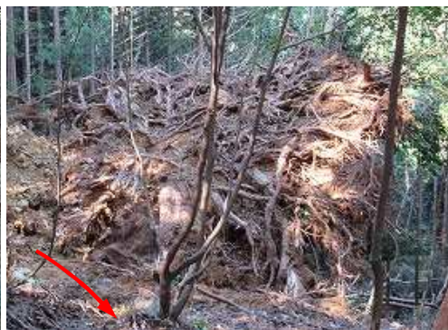
倒木根張りの横を通過する。