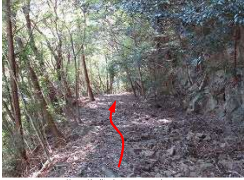
落石作業路を下って行く。