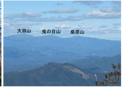
展望地から北北東を望む。