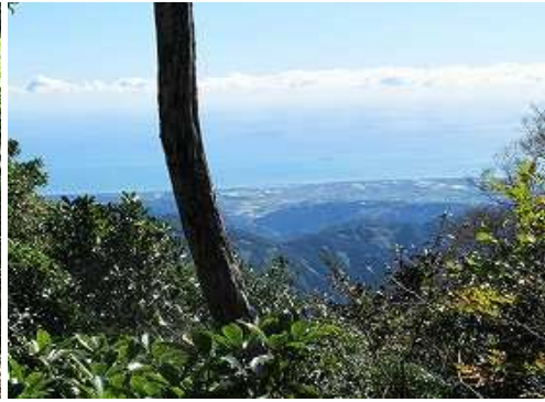
南東が開けて川南町を見下ろす。