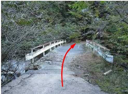
長崎尾への林道分岐から北へ橋を渡る。