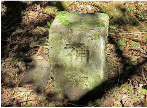
杭の苔を落としたら「補点」「山」の文字が現れ補点杭と判明した。