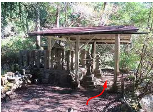
天山神社上宮に参拝する。