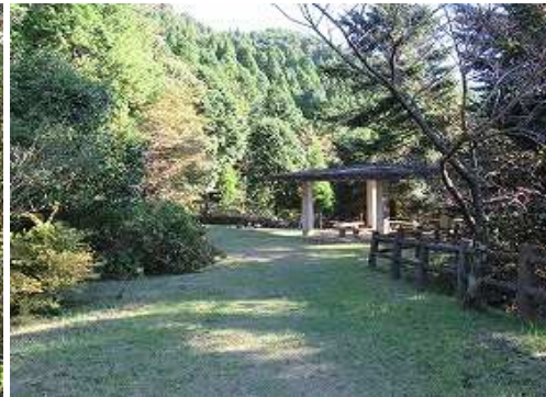
標柱の奥に東屋がある。