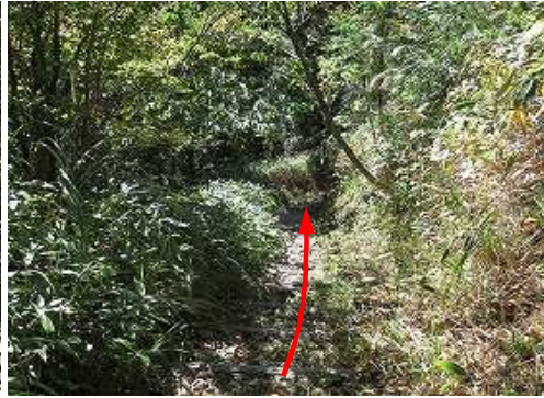
擬木階段を下って行く。