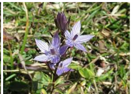
ムラサキセンブリ