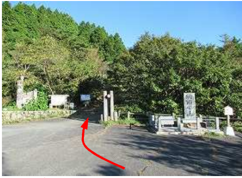
天山上宮Pの駐車場に車を止め、登山口へ向かう。

天山上宮P→天山神社上宮→岸川分岐→雨山(996m)→岸川分岐→天山(1046m)→展望小岩→天山(1046m)→岸川分岐→天山上宮P