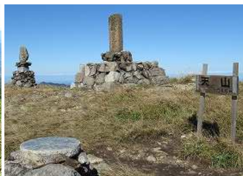
ひと上りして天山(1046m)に到着。