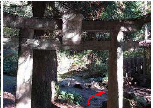
天山宮の鳥居をくぐる。