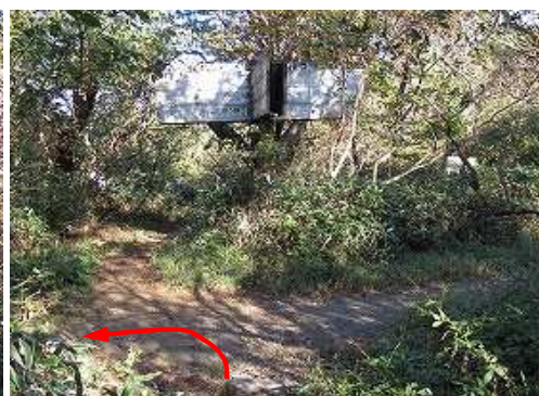
岸川分岐に出会い、左折する。