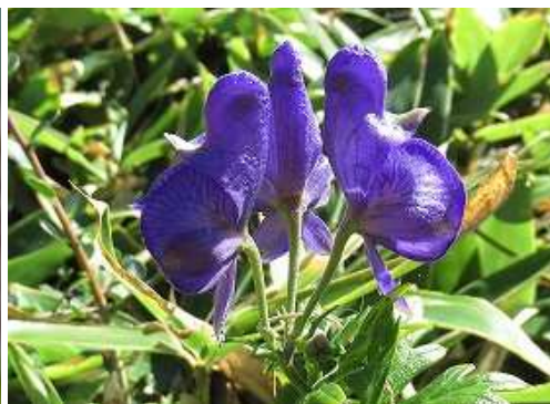
タンナトリカブト