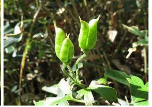
タンナトリカブト 実