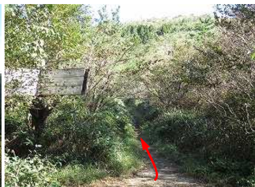
引き返し、岸川分岐を通過する。