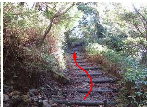
擬木階段を緩やかに上って行く。