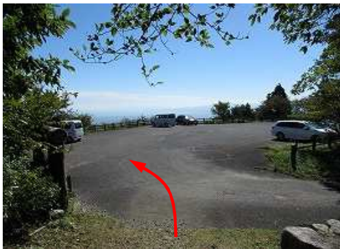
登山口を出て天山上宮Pに帰着いた。