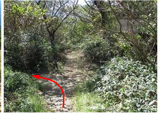
岸川分岐を左折する。