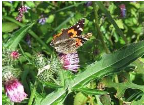
ツマグロヒョウモン 雌