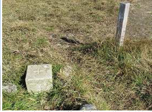
明治23年選点の一等三角点:天山(あめやま)(1046.06m)が設置されており360°の展望が得られる。