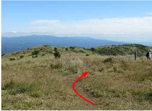
自然歩道を東へ山野草を撮りながら展望小岩で一休みして、引き返す。