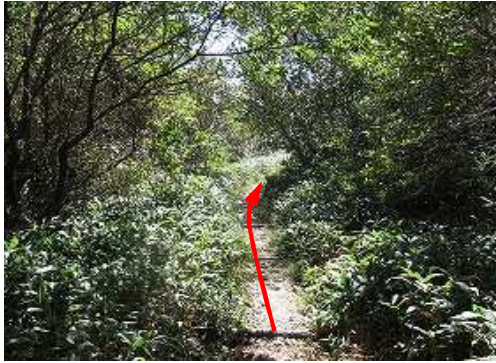
灌木の雑木を南へ進む。