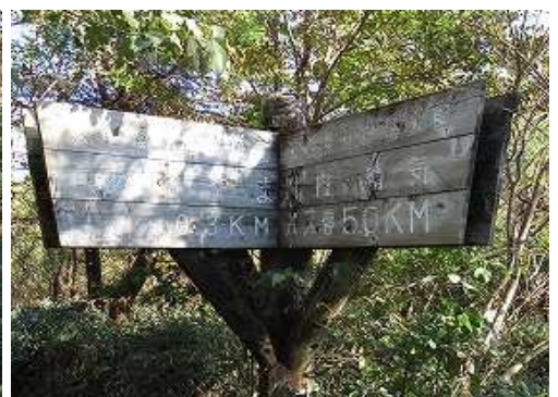
岸川分岐の案内標柱。