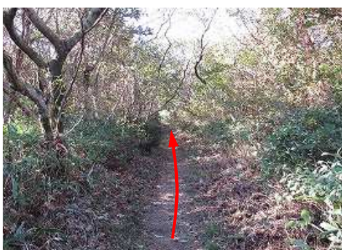
刈り払われた小径を南南西へ向かう。