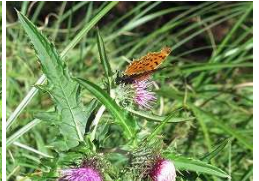
ツマグロヒョウモン 雄