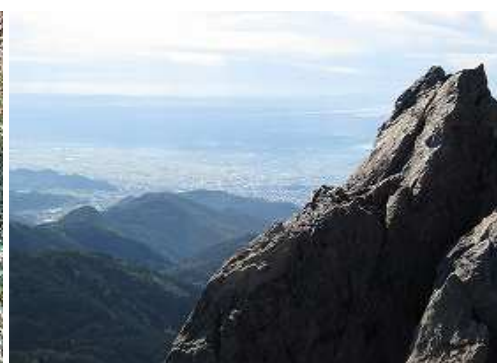
岩場から東南東の八女市方面を望む。