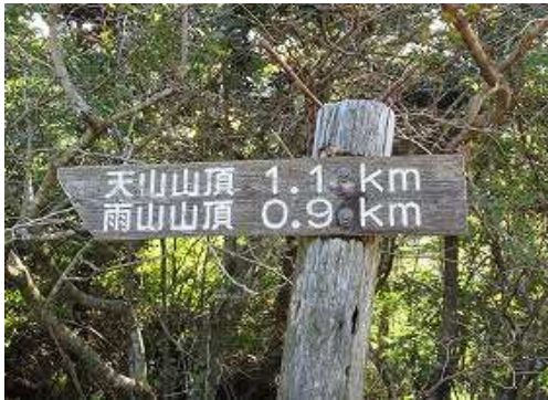
東端に標柱を見る。