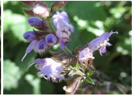
アキノタムラソウ