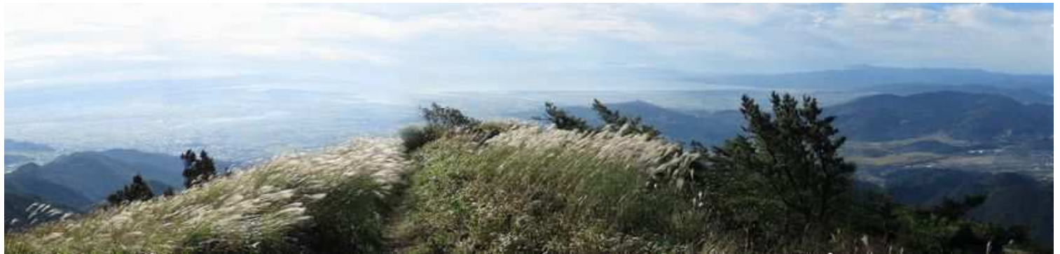
南南東から南南西の展望。