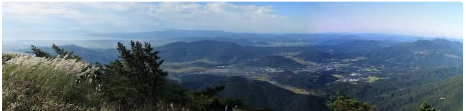
南南西から南西の展望。