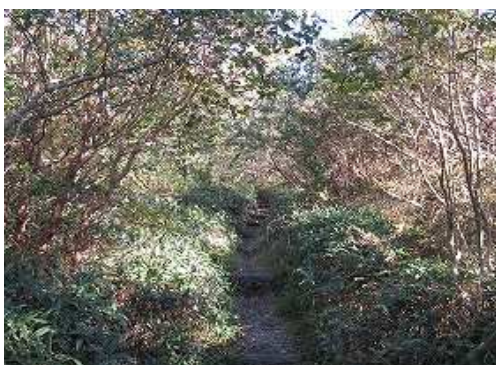
北へ緩く上って行く。