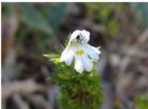
キュウシュウゴメグサ