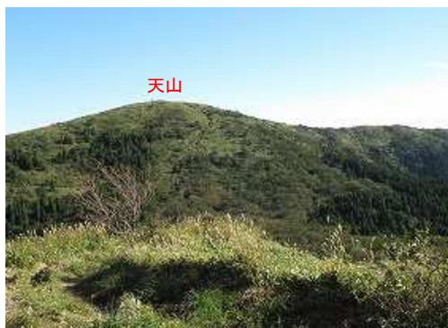
北東に天山を望む。