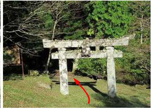
70m程進むと鳥居が現れた。