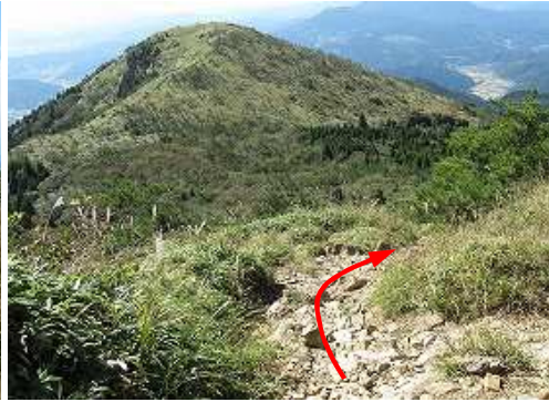
再度、山頂に立ち寄り雨山を望みながら下って行く。