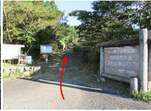
登山口から緩やかに参道を上って行く。