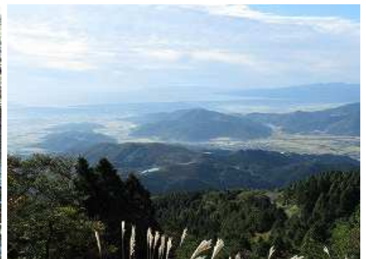
振り返ると、南に雲仙が霞んで望まれた。