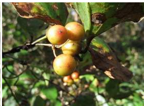
サルトリイバラ 実