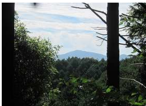
南東に屏山が見えた。