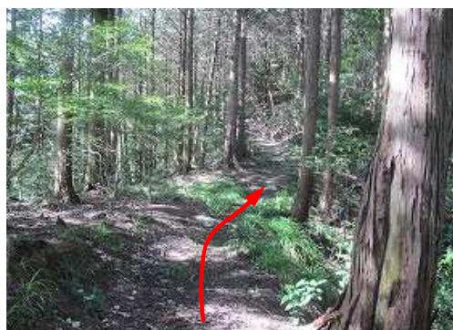
一旦、傾斜が緩んだ。