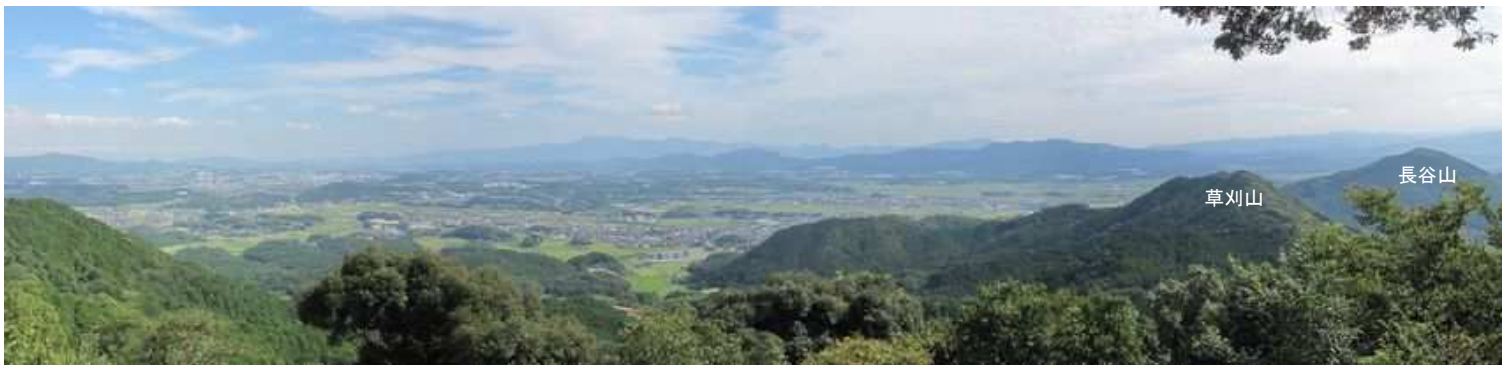
北北西から東にかけての展望が得られる。