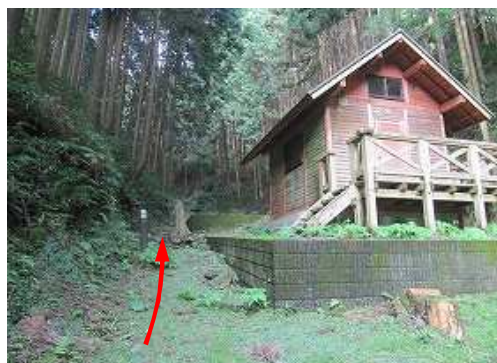
最奥のバンガローの横を上って行く。