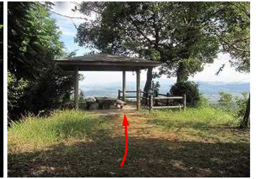
北に展望東屋が見えた。