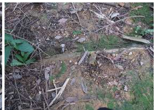
遊歩道であったことを示す丸太階段を見る。