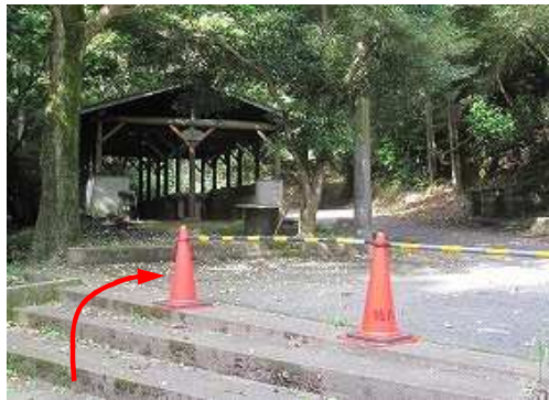
キャンプ場管理棟跡の駐車場に車を止め、歩き出す。