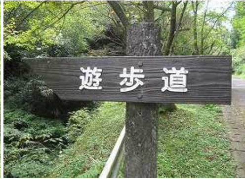
遊歩道入口の案内板。