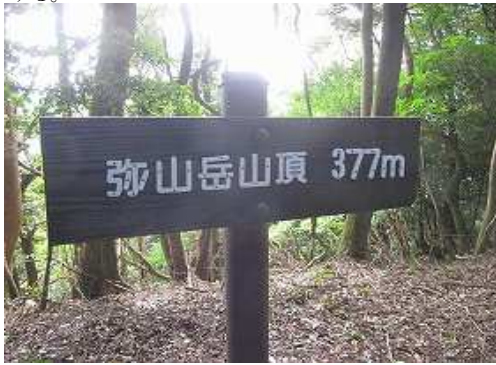
弥山岳(377m)の山名板を見る。