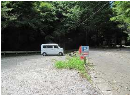
駐車場へ帰り着いた。