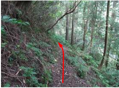
南に転回し、斜面を緩く下って行く。