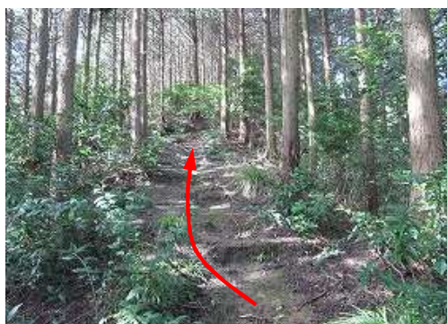
ヒノキ植林の尾根筋を緩く上って行く。