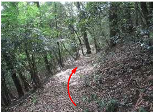
山頂へ50m標柱から南東へ下る。