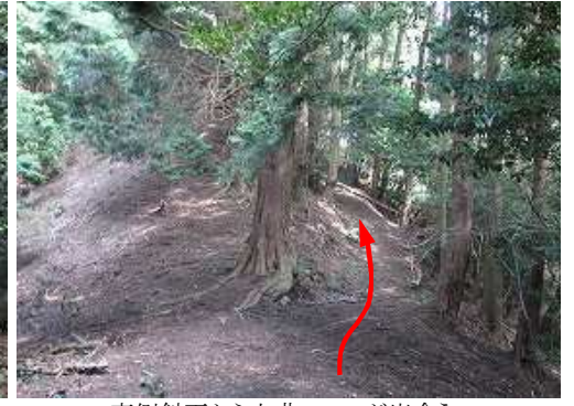
東側斜面から七曲コースが出合う。