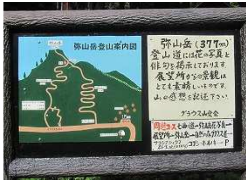
傍に立つ案内図に目を通す。