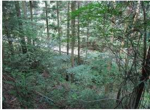
西下に道路が垣間見える。