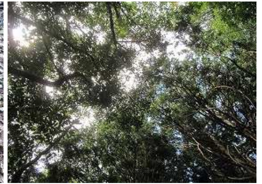
周囲を雑木で囲まれ展望は得られない。