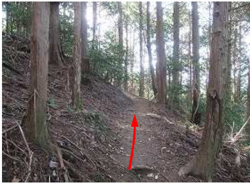
植林斜面を巻くように上って行く。