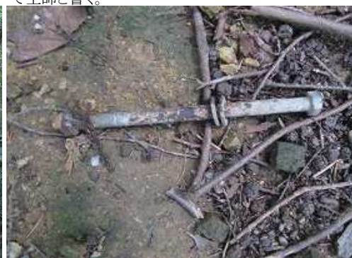
丸太階段を止めていたボルト。