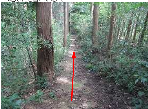
植林尾根筋を緩く下って行く。