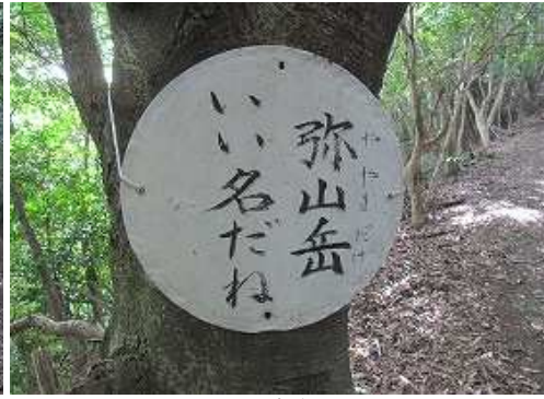
1フレーズの案内板を見る。