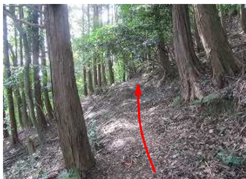
南へ向きを変え斜面を横断する。