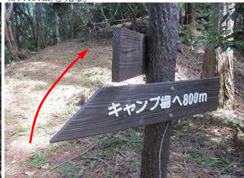
キャンプ場分岐を通過する。