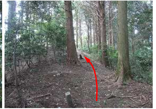
植林尾根を緩く上って行く。