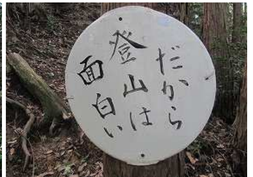
七合目の先から現れた1フレーズ案内板を順に紹介していきます。