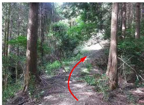
支尾根に出会い、南西へ向かう。