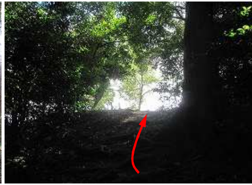
前方が明るくなって来た。