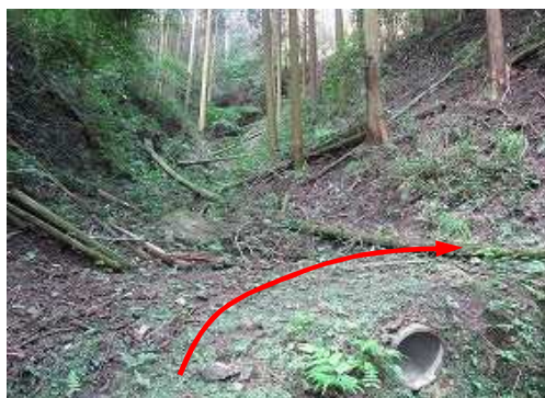
沢を横断し右へ向かい斜面を斜上する。