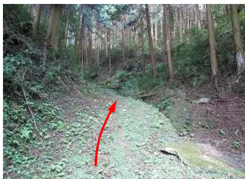
弱い沢沿いの上って行く。