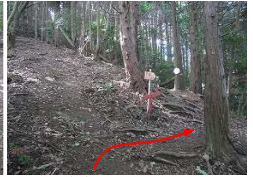
新道分岐から右へ向かう。