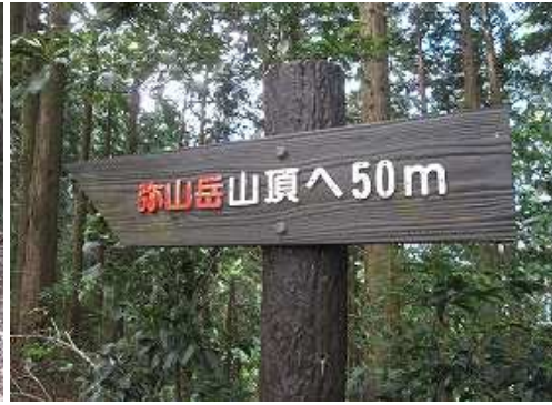
山頂へ50m標柱を見る。