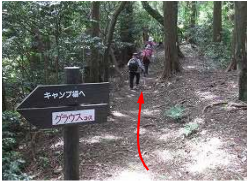
一休みして、弥山岳へ向かいガラス分岐を通過する。