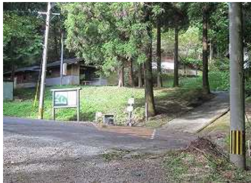
バンガロー入口が見えて来た。