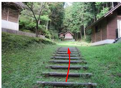
擬木階段を上って行く。