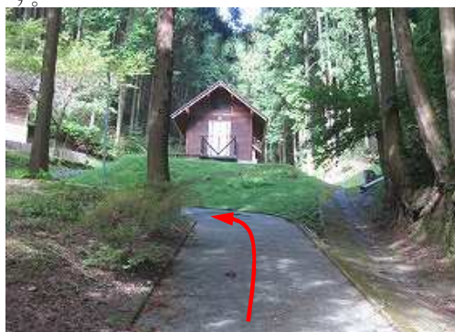
バンガローへと坂道を上って行く。