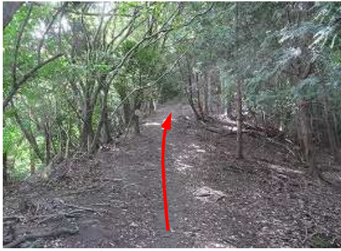
尾根斜面を緩やかに上って行く。