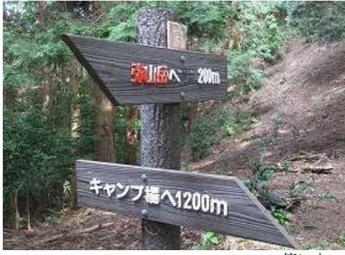
傍に立つ案内標柱。