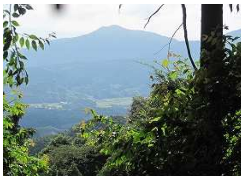
南東に馬見山が見えた。