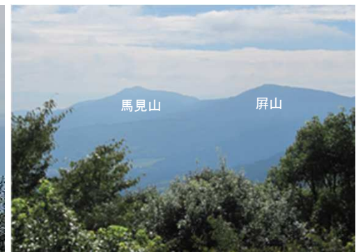
南東に馬見山と屏山。