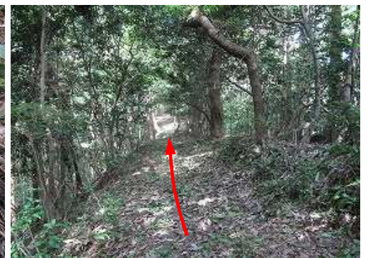
雑木尾根を緩く下って行く。