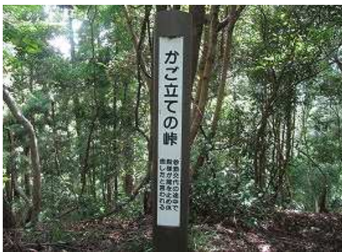
かご立ての峠「参勤交代の途中で殿様が籠を止め休息したと言われる」。