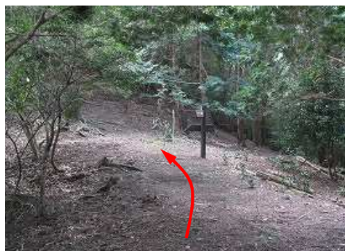
七合目のコルが近づいた。