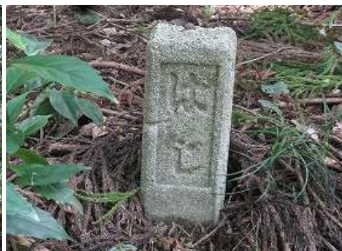
山側にはじ杭を見る。はじとは桂川町にある町名で土師と書く。