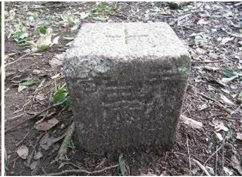
傍に明治30年選点の三等三角点：弥山岳(377.67m)を見る。