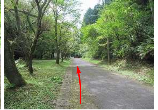
道路を南へ向かう。