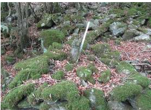
苔むす石が積まれた中に山杭を見る。