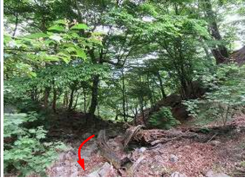
上って来たガレ沢を振り返る。