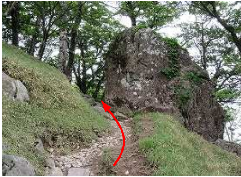
大岩の左を抜ける。