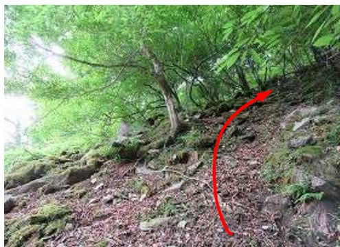
右岸斜面へ取付き上って行く。