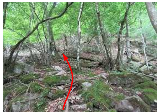
浮石が多く滑りやすい斜面となる。