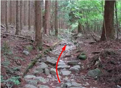
流水で荒れた石畳を進む。