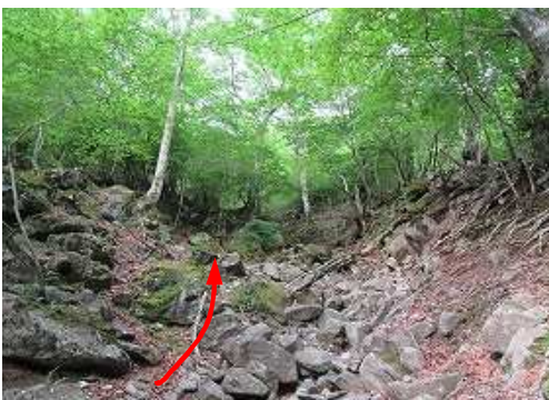
右岸側を上って行く。