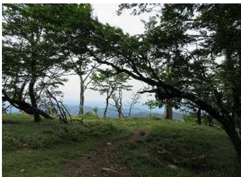
東に展望地を見送る。