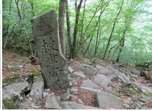
救世安民碑を通過する。