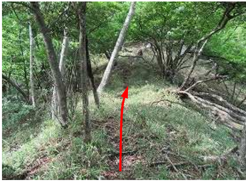
シカ径を上って行く。