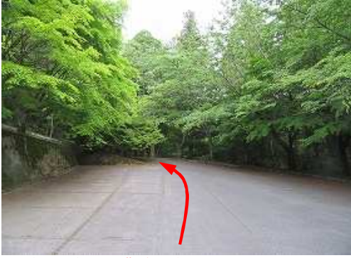
高住神社下の豊前坊駐車場から西へ向かう。

豊前坊駐車場→三ノ沢取付き→ガレ沢終了→合流→中岳広場→北岳(1192m)→高住神社→豊前坊駐車場