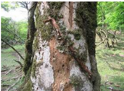
古木ブナの横を抜ける。