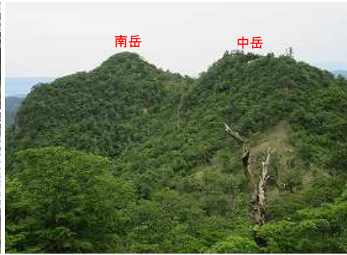
西南西に南岳と中岳を望む。