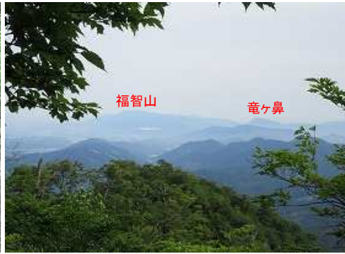
北北西に福智山を望む。