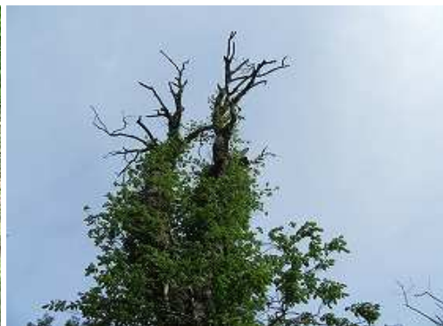
古木ブナは2本立ちの夫婦ブナである。