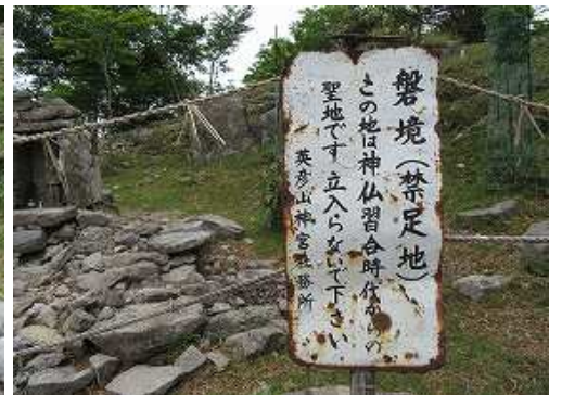
東には結界が張られ、禁足地となっており社や不動明王を祀る祠を見る。