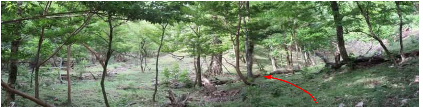
庭園風の景色が広がった。