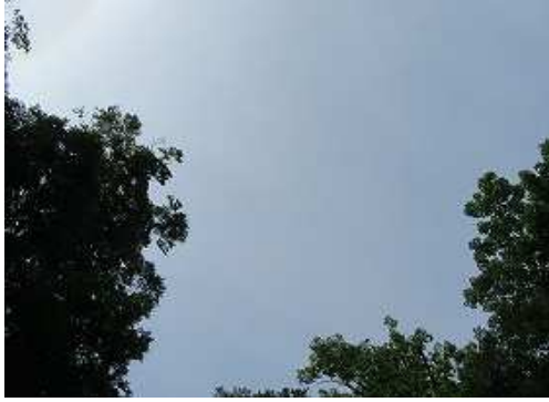
ガレ沢が終了し、上空が開けた。