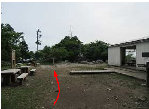
誰も居ない中岳広場に到着。