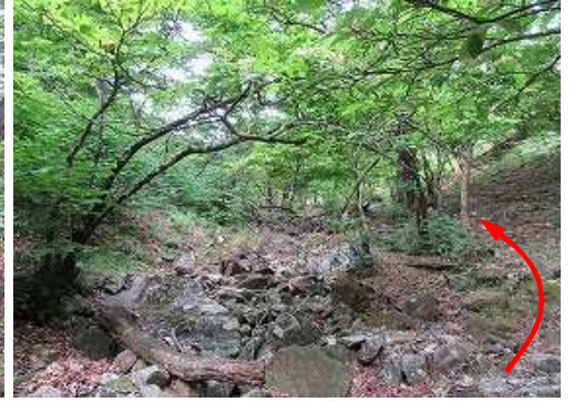
緩やかな沢筋を上方へ向かう。