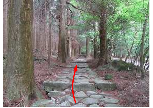
傍に立つ参道の説明板を読んで、石畳を西へ進む