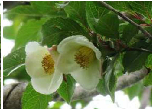
ヒコサンヒメシャラ