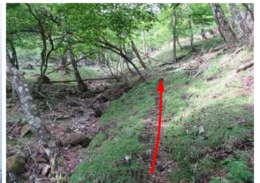
シカの踏跡を辿る。