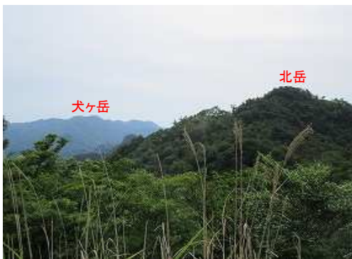
東に北岳と犬ヶ岳。