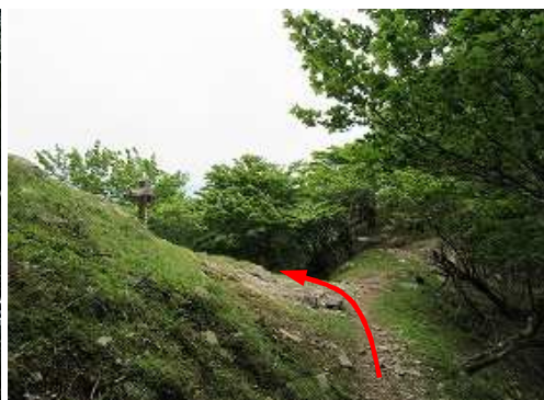
北岳肩の分岐に出会う。