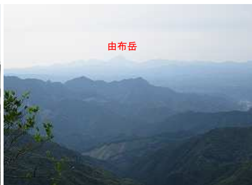
東南東に由布岳を望む。