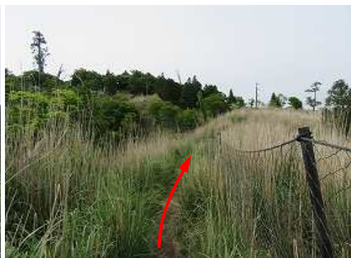
ネットに沿って緩く上って行く。