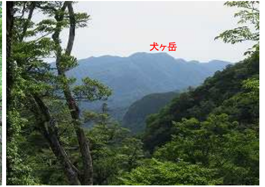
東北東に犬ヶ岳を望む。