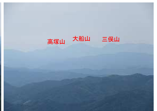
南東にくじゅう連山を望む。