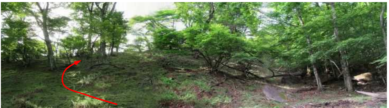
東の尾根筋へと斜面を上って行く。