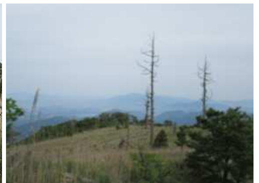
北西尾根を振り返る。