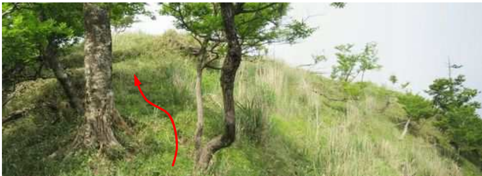
北西尾根が見えた。