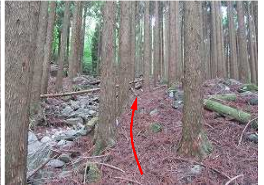
弱い浸食斜面の左岸沿いに上って行く。