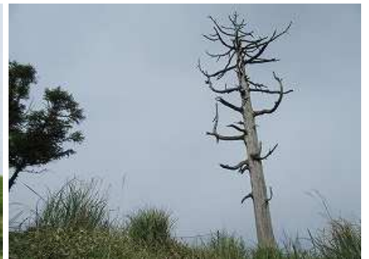
北西尾根に合流すると、眼前に枯死木を見る。