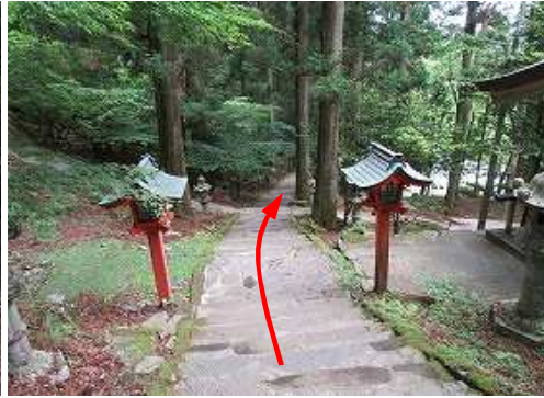
参道の石段を下る。