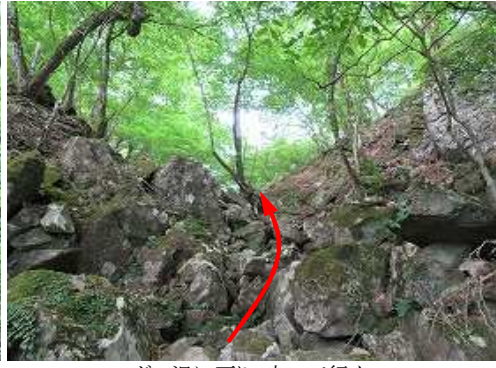
ガレ沢に戻り、上って行く。