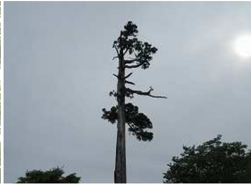
再生スギを見上げて北岳へ向かう。