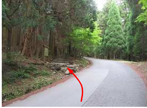
国道500号を100m程歩くと、左に参道入口が見えて来た。