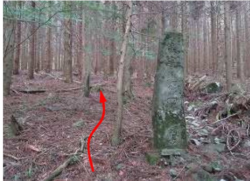
杉一萬本植林立碑が三ノ沢取付きとなる。 この先、目印はなく浮石の多いガレ谷となるので 熟達者のみ踏込可