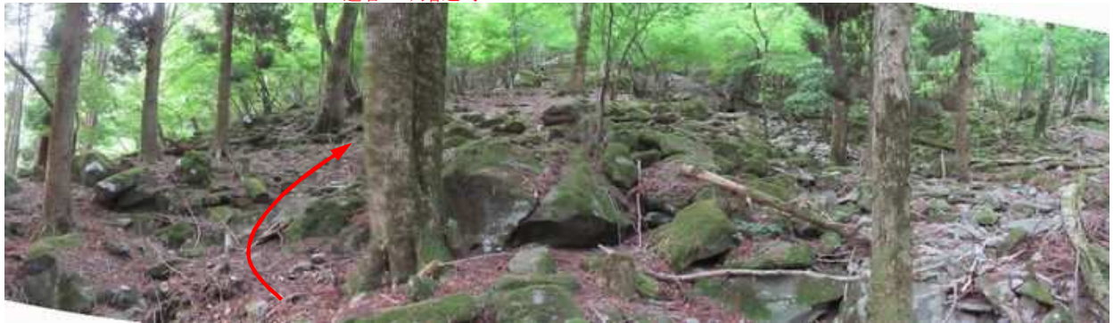
苔むす転石が転がる斜面を上って行く。