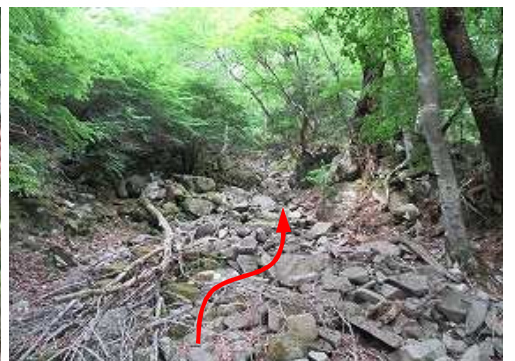
ガレ沢の歩きやすい所を探しながら上って行く。