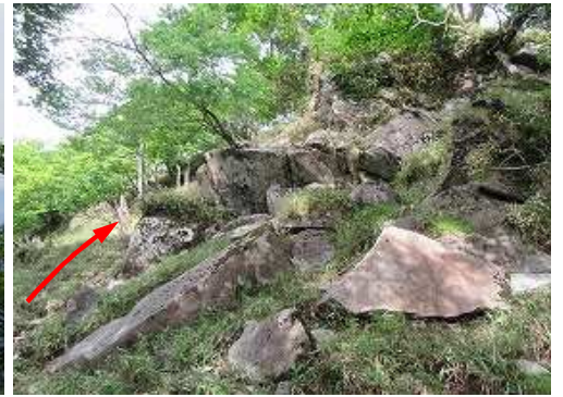
右上方に岩場が現れた。