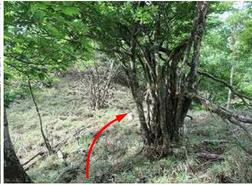
尾根筋を南南西へ上って行く。