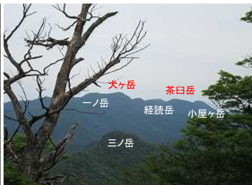
東北東に鷹ノ巣山三ノ岳と犬ヶ岳を望む。