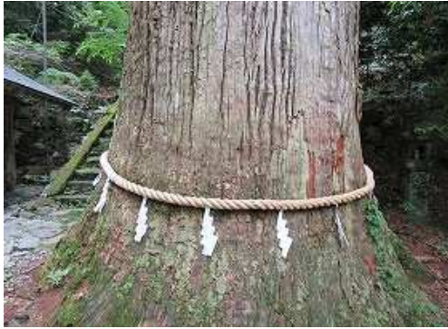
参道脇の御神木のスギ。