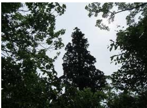
東に一本杉を見上げると北岳肩である。