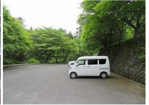
豊前坊駐車場へ帰り着いた。