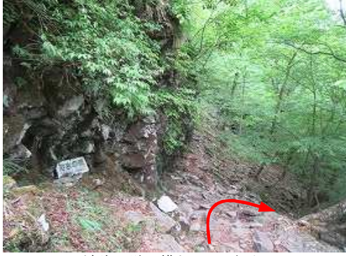
溶岩の壁の横を下って行く。