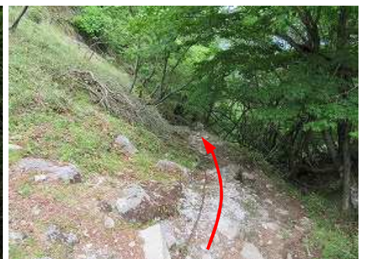
北西へクサリ場を下る。