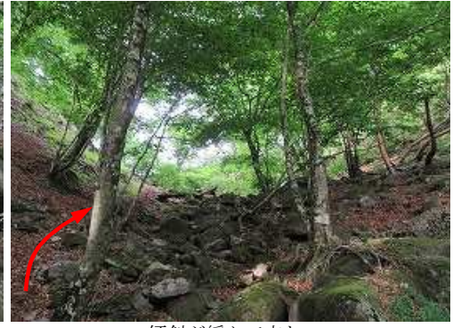
傾斜が緩んで来た。