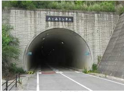
五ヶ山トンネルを抜ける。