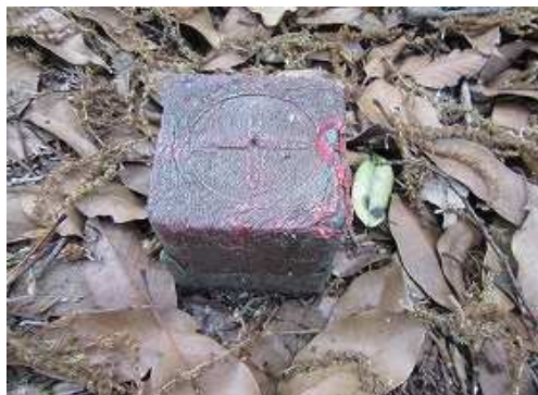
尾根筋に 赤杭 を見る。