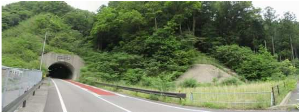
モンベル五ヶ山 ベースキャンプ先の五ヶ山トンネル手前の 駐車場 に駐車する。