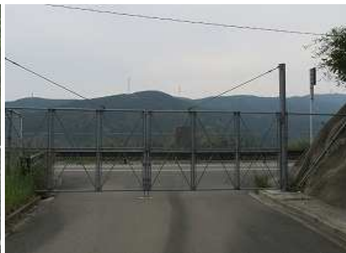
ゲート右斜面を乗り越える。