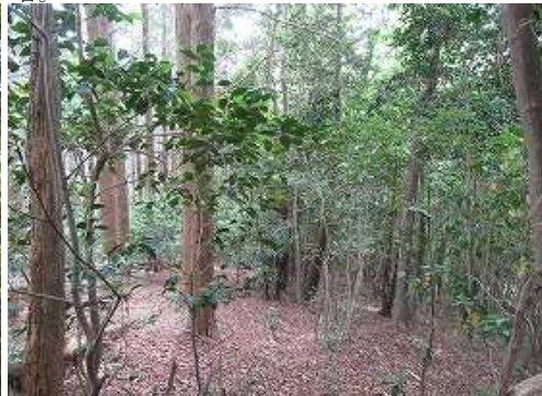
植林際を下って行く。