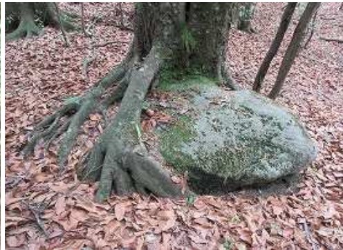
石抱きの木を見る。