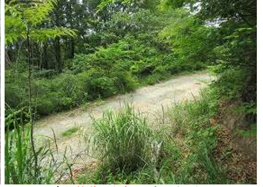
倉谷林道に出会い、右へ向かう。