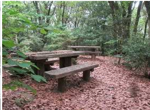
朽ちかけたテーブルとベンチがある。 一息ついて引き返す