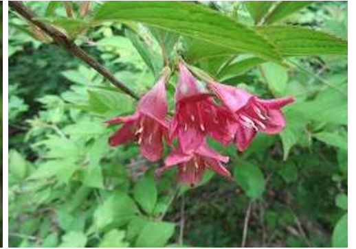
ツクシヤブウツギ