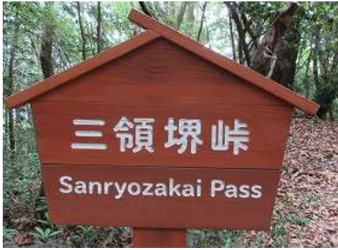
三領塚峠を通過する。