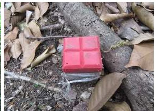
尾根筋に赤杭を見る。