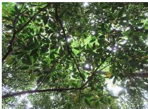
周囲を雑木で囲まれ展望は得られない。