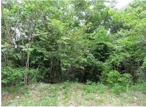
此処から尾根筋へ入る。