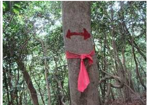
赤テープと矢印を見る。