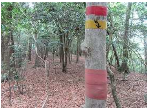
尾根筋に古いテープを見る。