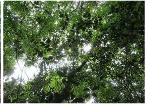
周囲を雑木で囲まれ展望は得られない。