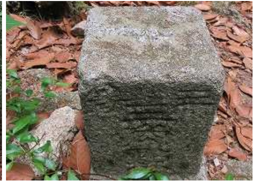
明治30年選定の三等三角点:石谷山を見る。