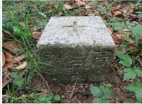
昭和45年選点の四等三角点:倉谷(683.03m)に到着。