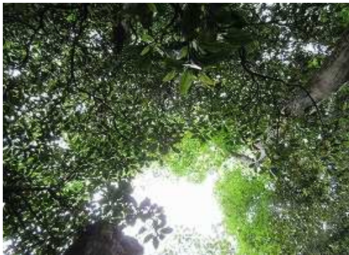
周囲を雑木で囲まれ展望は得られない。