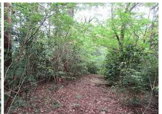
弱い作業路を緩く下って行く。