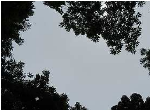
周囲を樹木で囲まれ展望は得られない。