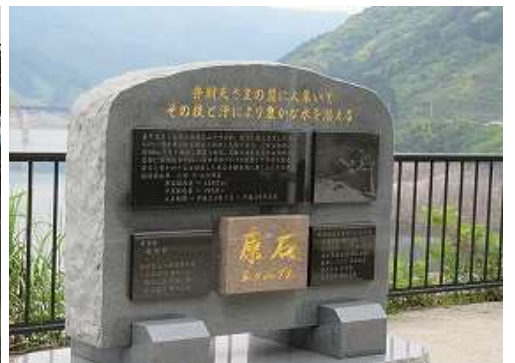
原石碑を通過する。