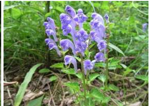
ツクシタツナミンソ