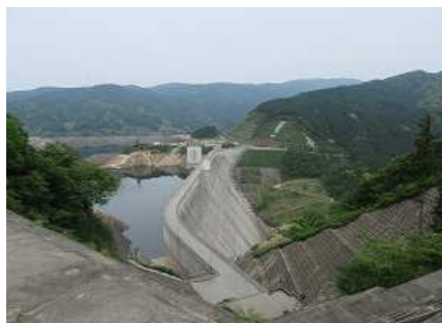
展望地 から五ヶ山ダムを見下ろす。