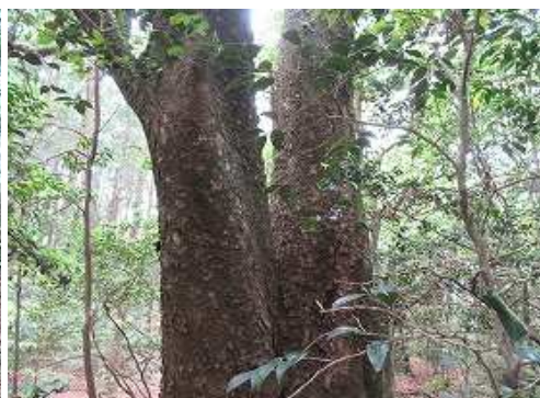
大木の夫婦木を見る。