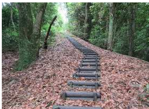
擬木階段を上って行く。