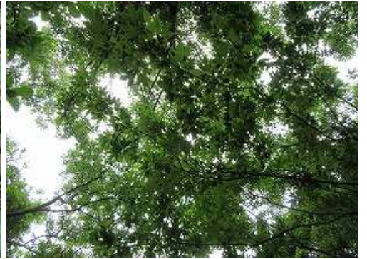
周囲を雑木で囲まれ展望は得られない。