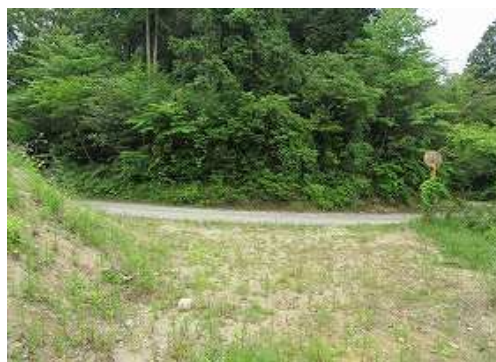
倉谷 林道 に出合い、左へ進む。