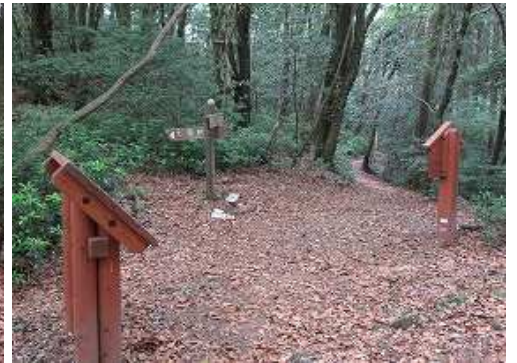
三領塚峠を通過する。