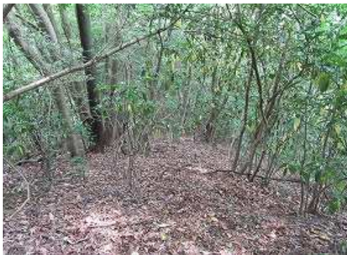
雑木斜面を緩く下って行く。