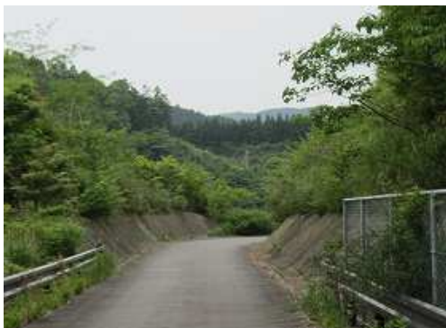
道なりに林道を北西方向へ進む。