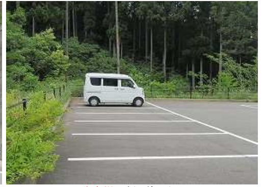
駐車場へ帰り着いた。