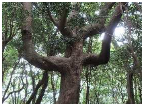
万歳の木 に出合う。