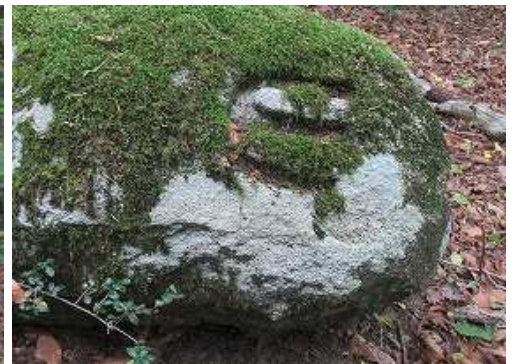
苔むす山印をP819とする。