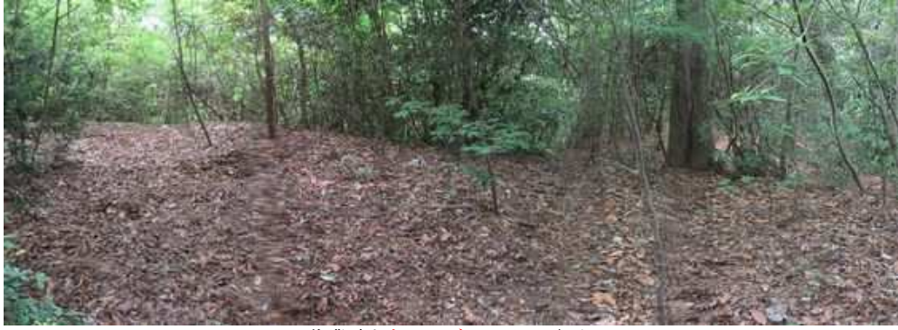
作業路を左カーブして下って行く。