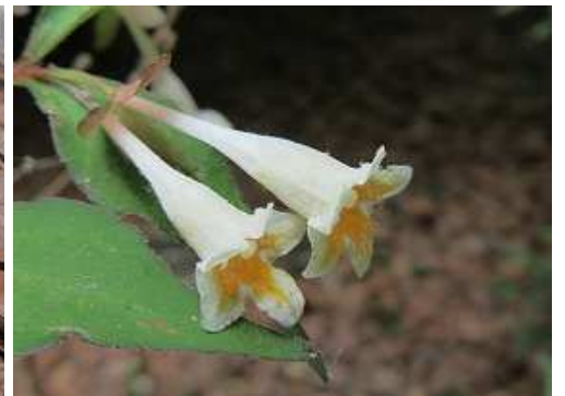
コツクバネウツギ