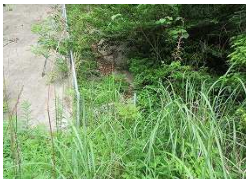
此处が 取付き 。