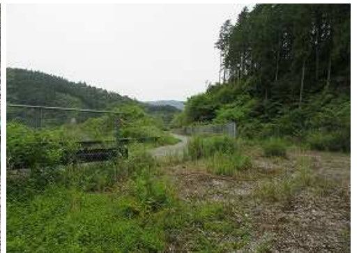
倉谷林道に出会う。