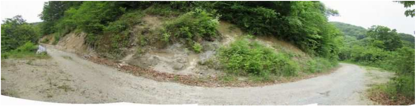
林道カーブに取付きを探すが適所が無い。