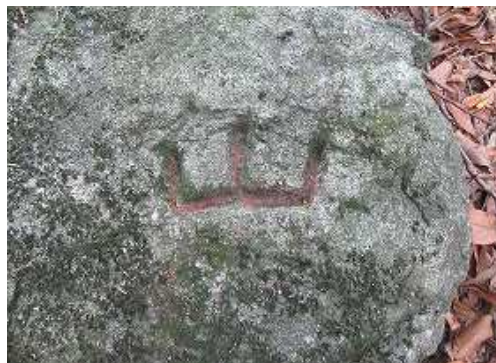
急斜面を上り詰め、 山印 の岩を見る。