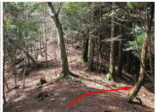
杣道分岐から北側の杣道へ入る。