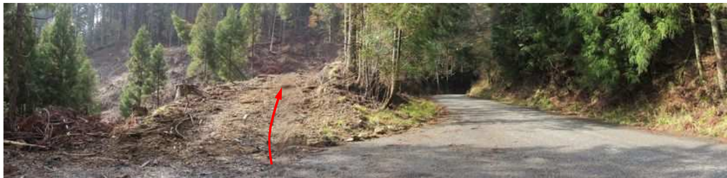
東峰村小石原から芝峠を60m程下ると、東側が広くなり伐採路を見る。路肩に 駐車 し、伐採路に取付く。