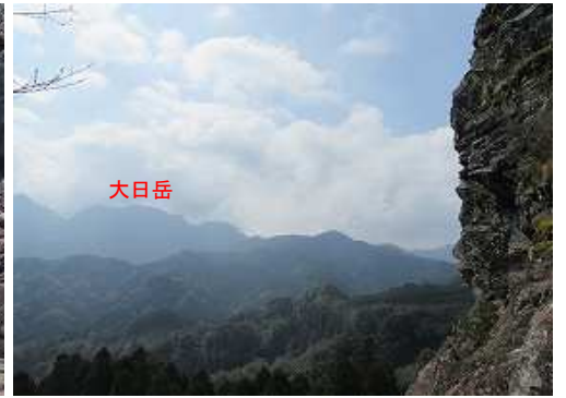
不動岩の岸壁と南の大日岳。