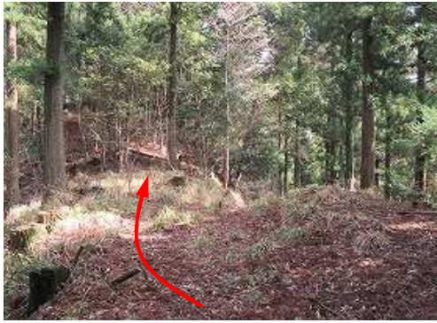
地形図の標高点580付近であるが、奥の方が明らかに高い。