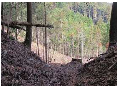
伐採斜面への 切通 。帰路、此处から下った。