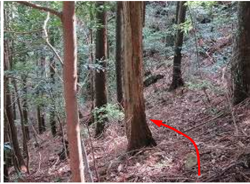
倒木から東斜面へ踏込む。