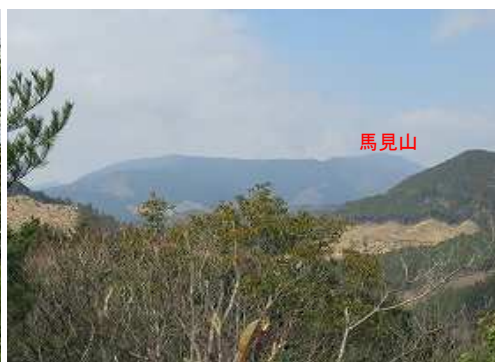
西に馬見山を望む。