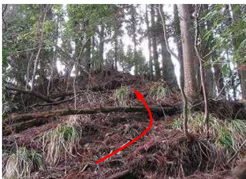
急な斜面を上って行く。