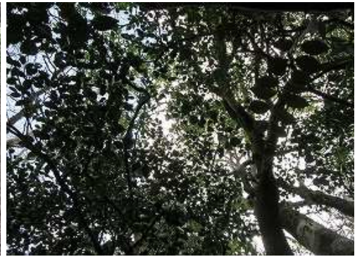
周囲を雑木で囲まれ展望は得られない。