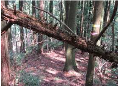
一息ついて倒木まで引き返した。