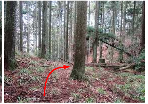
往路に出会い、右へ向かう。