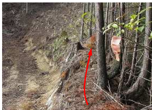
伐採路西側の尾根筋に上がり、枝の赤テープを見る。