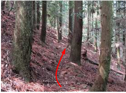
スギ植林斜面に行く。