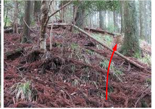
斜面の傾斜が増して来た。