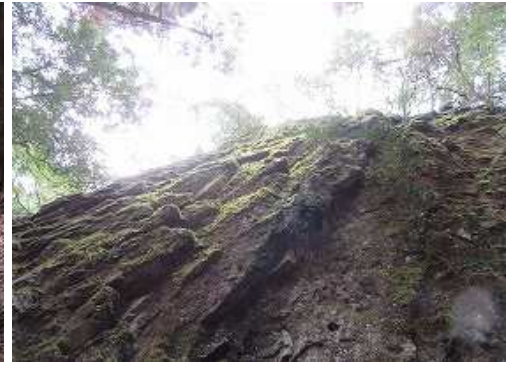
不動岩の苔むす北岸壁上部を見上げる。