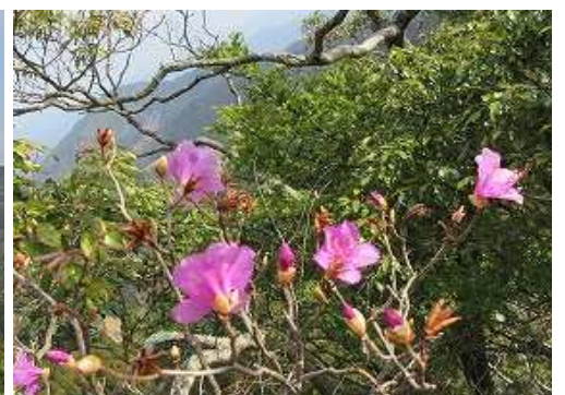
周辺にはゲンカイツツジが見られる。