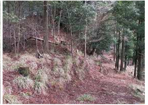
作業路は横断して東に続いて行く。