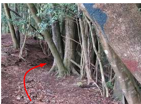
幹にペインティングを見る。