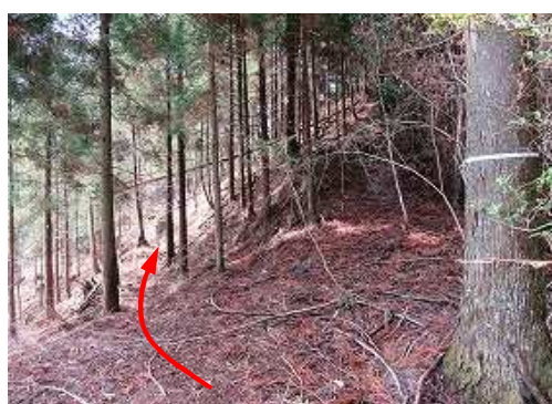
左斜面の杉道を辿る。