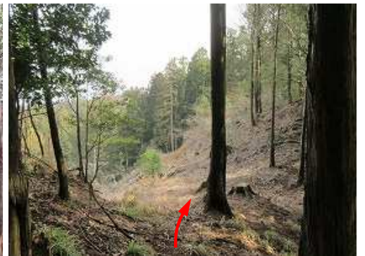
前方に伐採斜面が現れた。