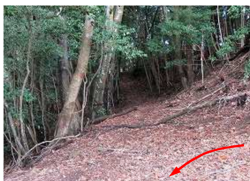
西方向にテープが付けられている。