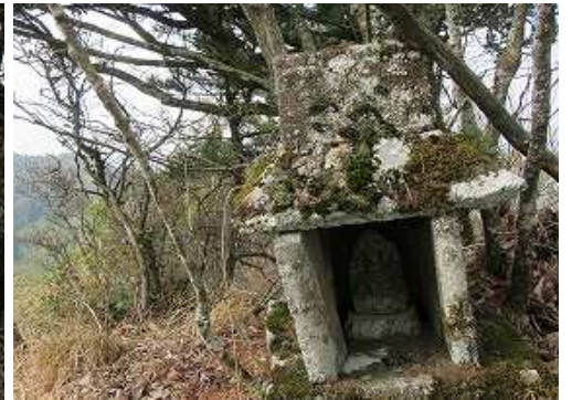
祠があり不動明王が安置されている。