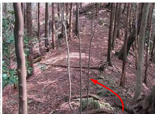
下って作業路に出会う。