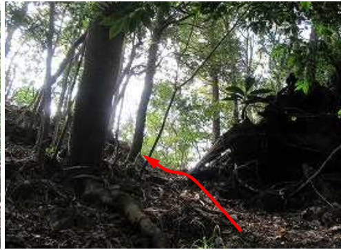
尾根に出会い、左へ向かう。