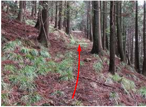
作業路を緩く上って行く。