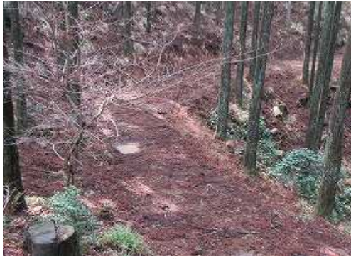
右下に作業路を見る。