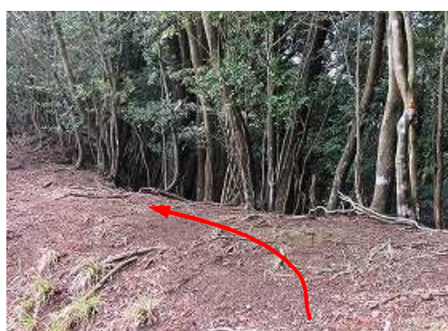
尾根筋の 分岐 に合流する。