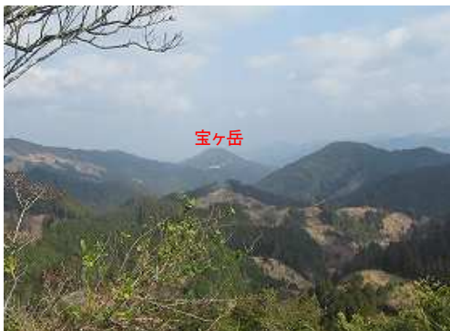
北に宝ヶ岳を望む。