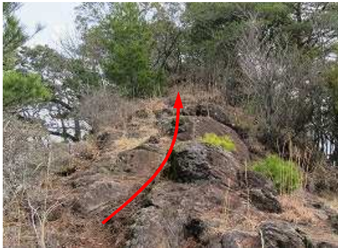
岩尾根を東へ進む。