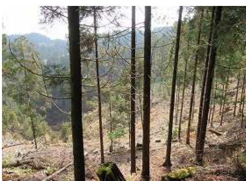
東斜面は伐採されている。