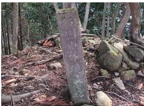
「石川山林境界標」と刻まれた境界杭を見る。