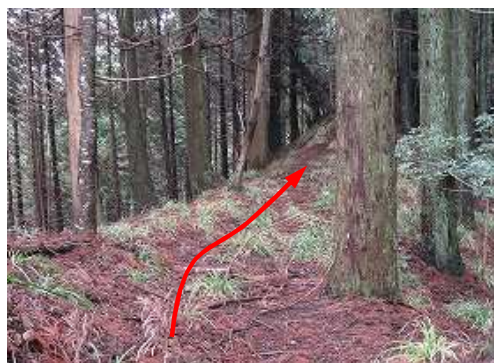
スギ植林の尾根筋を緩く上って行く。