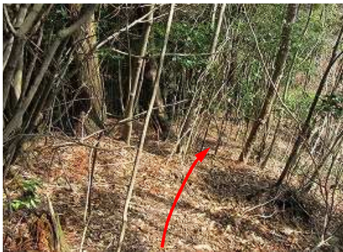
尾根斜面を北東へ下って行く。