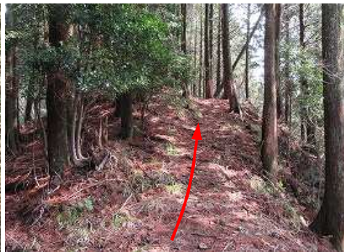
尾根筋の軸道を辿る。