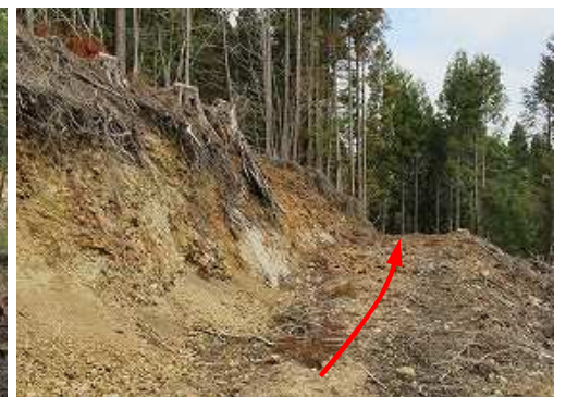
作業路に行く。往路は左上の尾根を上った。