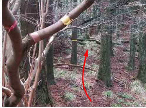
枝に巻かれたテープ。