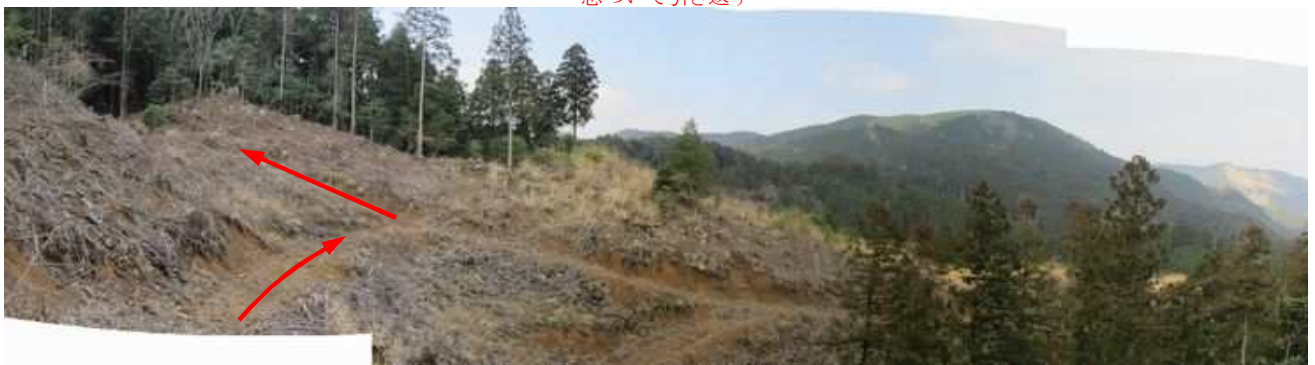
作業路から北西の展望。