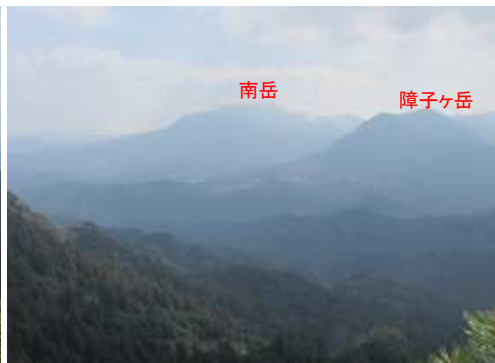
東に英彦山を望む。