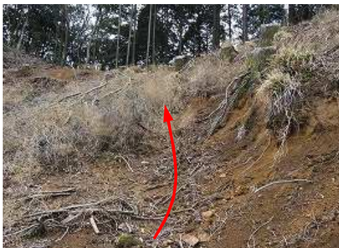
作業路から尾根筋へ戻る。