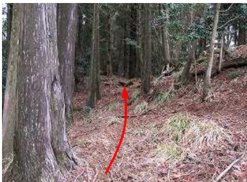
尾根筋の杣道を辿る。