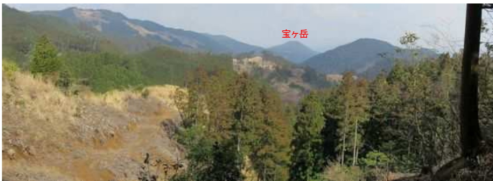
伐採斜面から北に宝ヶ岳方面が望まれる。