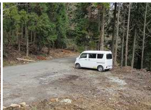
駐車地に帰り着いた。