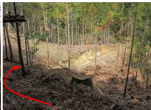
伐採斜面を下って行く。