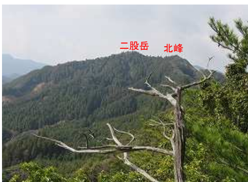
南西に二股岳を望む。