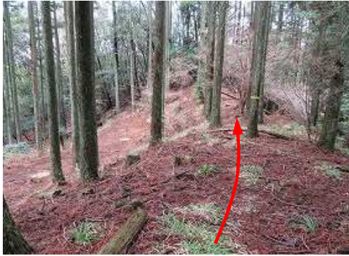
作業路脇の尾根筋を下る。