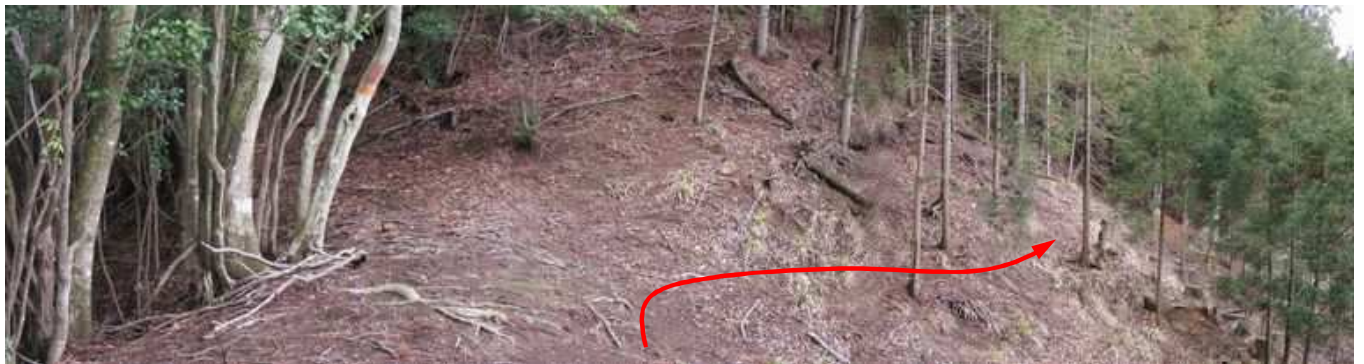
分岐から北の斜面へ進む。