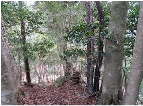
北東下に作業路が垣間見える。 一息ついて引き返す