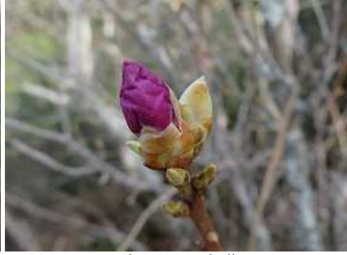
ゲンカイツツジ 蕾