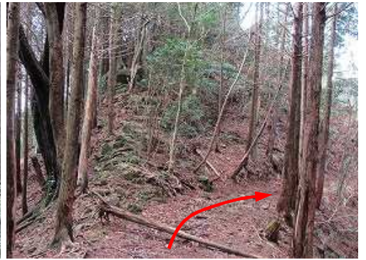
作業路出合から作業路に行く。