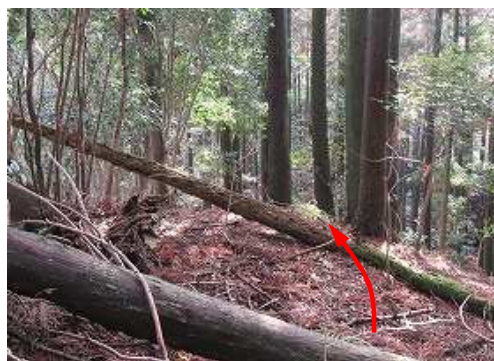
尾根筋に上り上がる。