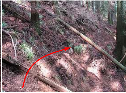
弱い地滑り地を通過する。