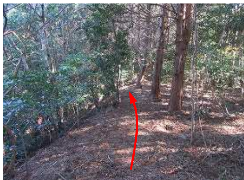
土塁上を北東へ進む。