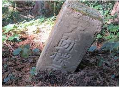
その先で史跡標示杭を見る。