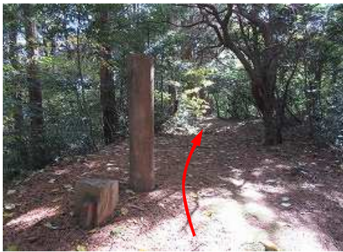
土塁跡の標柱 を見る。