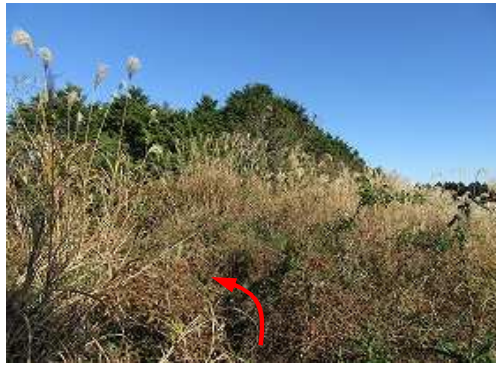
土塁線外側の獣道を分け進む。