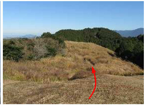
北へ延びる土塁線へ向かう。