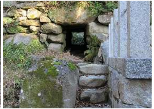
横の樋管に水は流れていない。