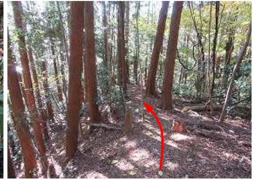
南西へ下って行く。