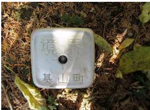
基山町の 境界杭 を見る。