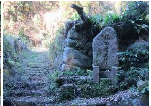
高原川を挟んで対岸には 猿田彦大神 を見る。