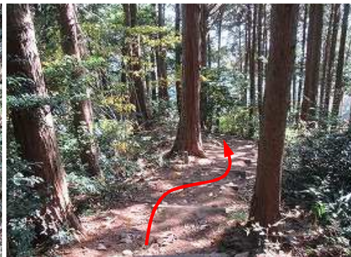
分岐に出会い、南東へ下る。