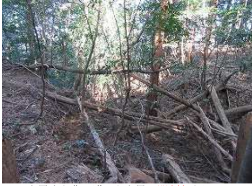
土塁上を北へ進むと土塁の 開削部 を見る。