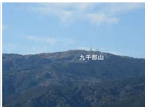
西南西に九千部山を望む。