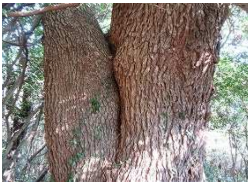
その先で クス大木 を見る。