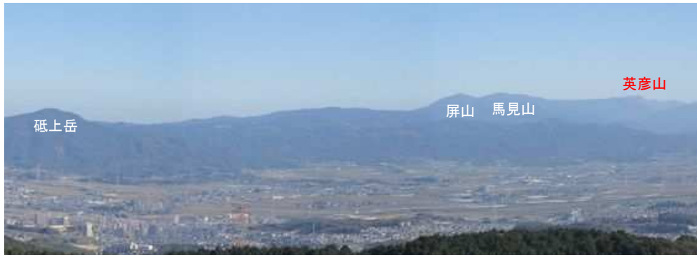
展望台から東の展望。