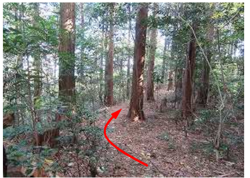
土塁上を東へ進む。