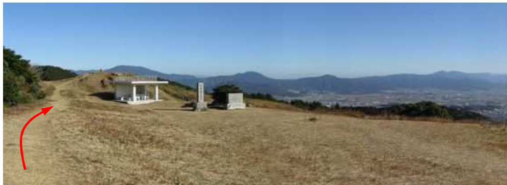
進行方向に西休息所と石碑を見る。