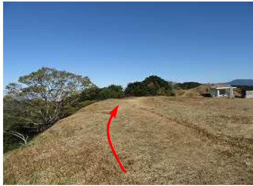
土塁上を北へ進む。