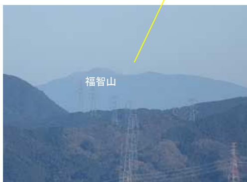
北東に福智山を望む。