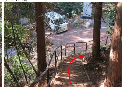
下に駐車地が見えて来た。