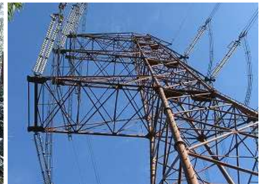
弱い支尾根を東へ下ると佐賀幹線の鉄塔158号を見上げる。