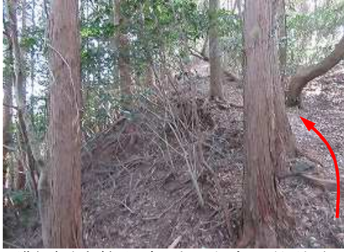
進行方向左斜面は急であるが、右は平坦地形である。