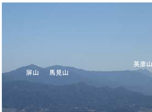
東北東に古処山系・英彦山を望む。