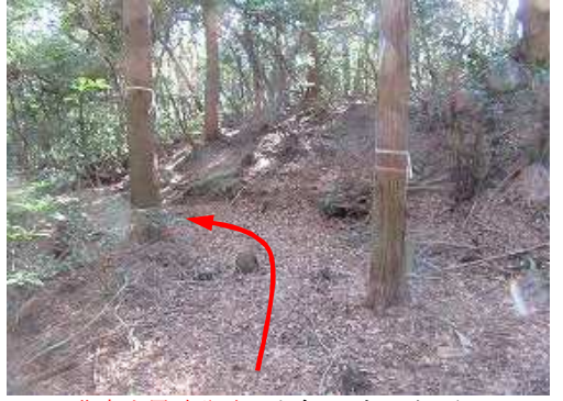
北帝土塁跡分岐 に出会い、左へ向かう。