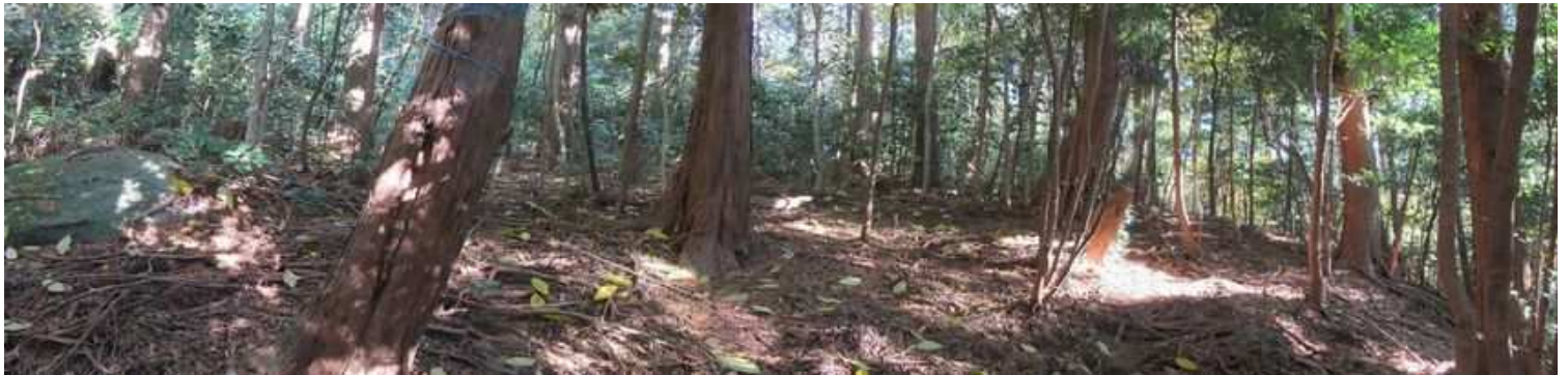
尾根筋の中にも平坦地形が見られる。