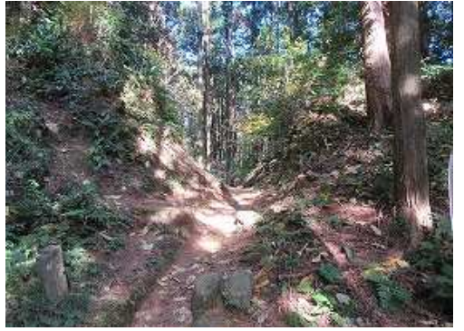
内側から見た 東北門跡 。