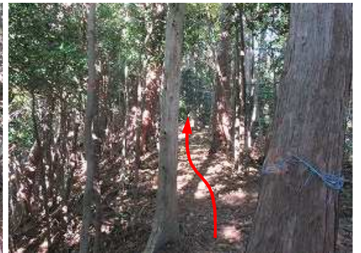
土墨地形となり緩く上って行く。