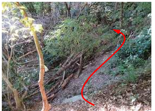
斜面崩落 を抜ける。