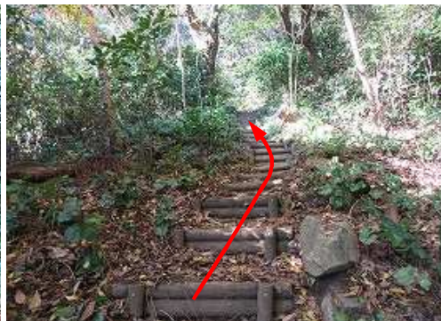
丸太階段を上って行く。