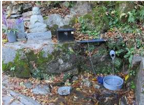
直ぐ右に 水汲場 を見る。