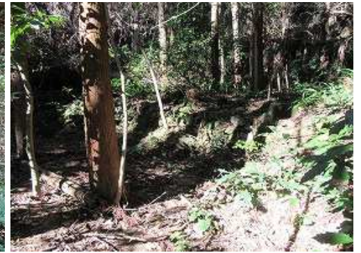
その奥にも70cmほどの石積みが見られる。