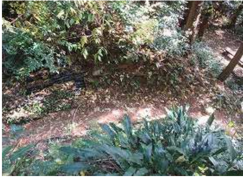
土塁上から見た 東北門跡 。