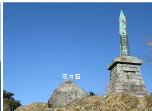
北西に天智天皇欽仰之碑と霊々石を見る。