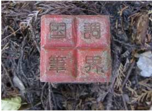
国調筆界杭を見る。