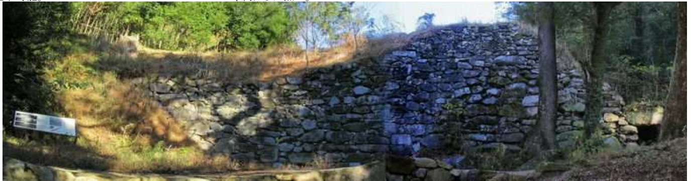
南水門跡の石積み。此処を起点に基肆城土塁線の周回に向かう。