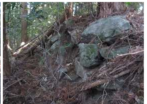
東側に石積を見る。