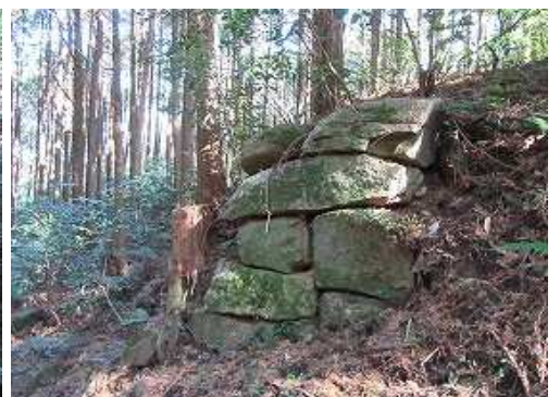
北に10mほど行くと北帝門跡の石積みを見る。