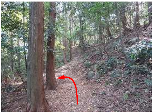
土塁線分岐 に出会い、左折する。