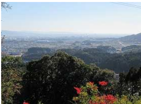
引き返し、土塁上を進むと展望地で南に久留米方面が展望できる。