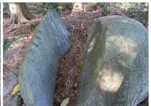
割石 に出会うが、割られたのはクサビの形状から新しい時代のような。