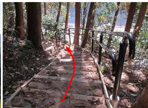
新設の丸太階段を下って行く。