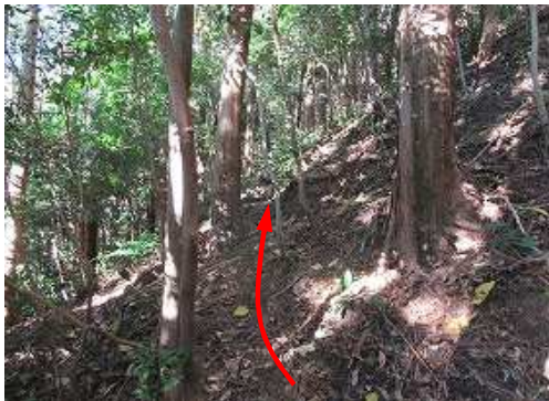
土墨地形が無くなり斜面を進む。