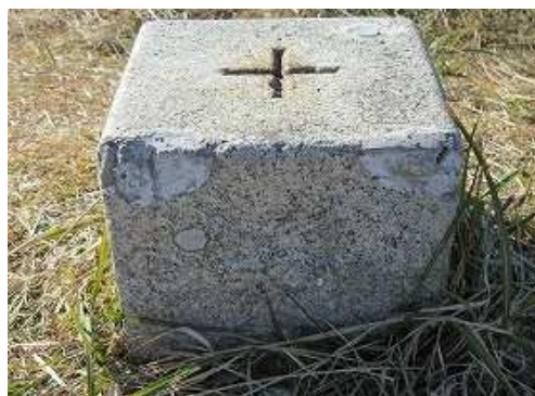
基山(404m)の傍には明治21年選点の一等三角点:防住山を見る。