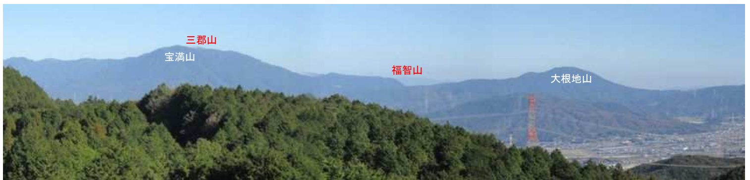
展望台から北北西に福岡市を望む。