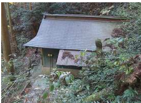
左前方下に 大師堂 を見る。