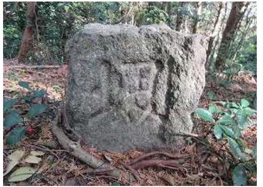
「塚」と彫られた 境界石 を見る。