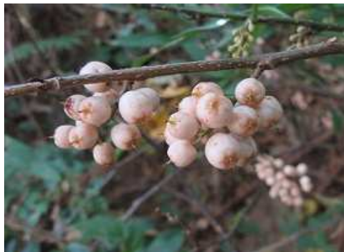
イズセンリョウ 実