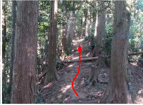
ヒノキ植林尾根を上って行く。