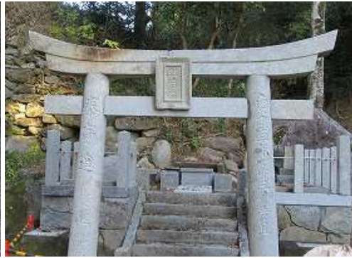
災害により流失していた 住吉宮 が再建されていたが、祠はまだ無い。