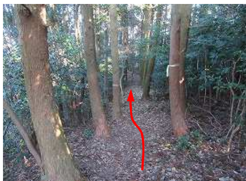
土塁に沿って北東へ進む。