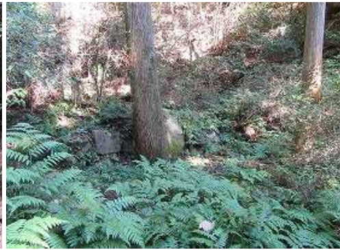
東南門跡の石積みは高さ50cmほど。