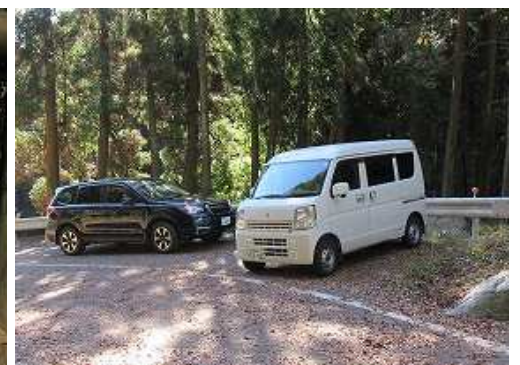
駐車地へ帰り着いた