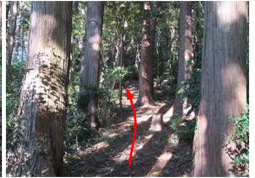
ヒノキ植林の尾根斜面を上って行く。