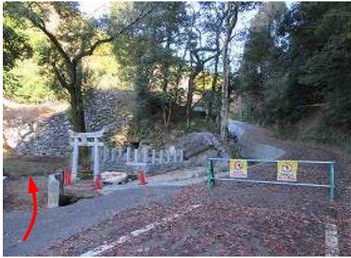
南水門跡傍の道路路肩が 駐車地 となっており3台ほど駐車可能。

駐車地→住吉宮→栗島大明神→ 基山(404m) →展望台→十字路→東北門跡→土塁線分岐→東南門跡→鉄塔158号→駐車地