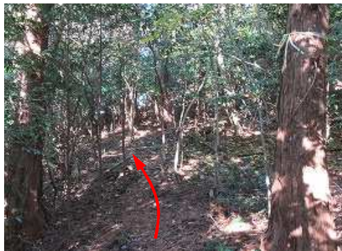
分岐に出会い北西に進む。