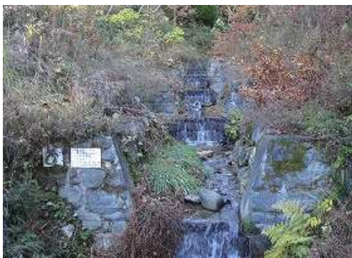
高原川を渡る所から上流に滝路工を見る。