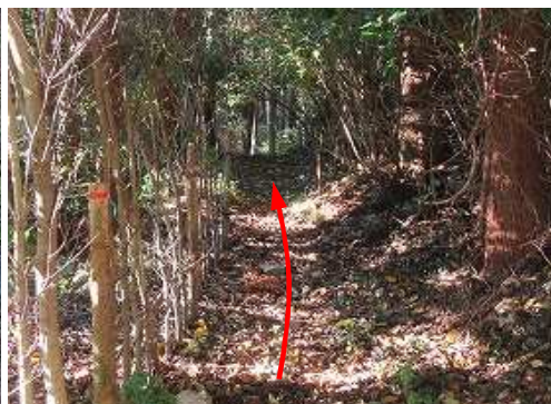
南水門跡の石積み上部から土塁線を進んで行く。