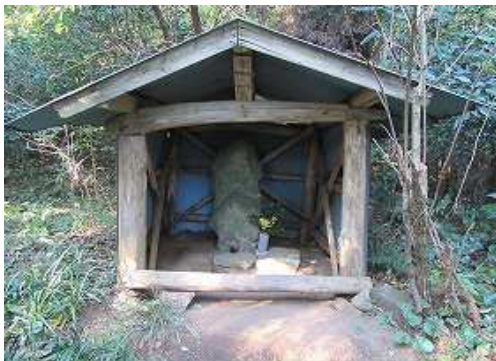
栗島大明神に到着。