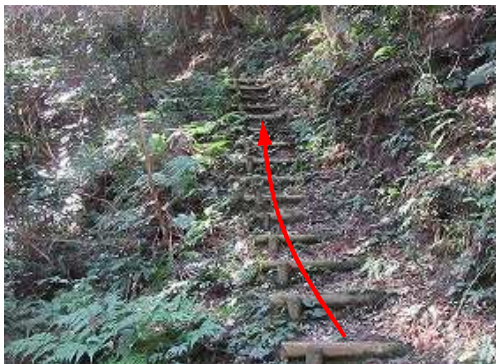
丸太階段を上って行く。