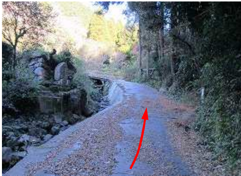
町道を北へ向かう。