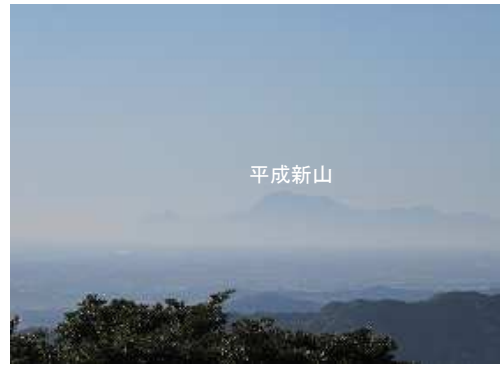
南南西に平成新山を望む。