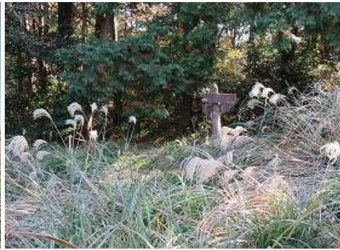
東側に北帝門跡分岐の標柱を見る。