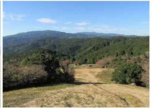
西に草スキー場を見下ろす。