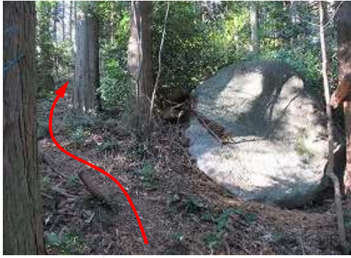
円形転石の左を抜け上って行く。