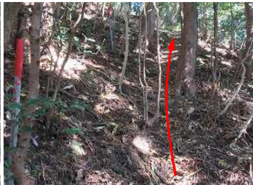
北方向へ斜面を上って行く。