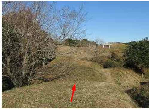
いものがんぎに行く。