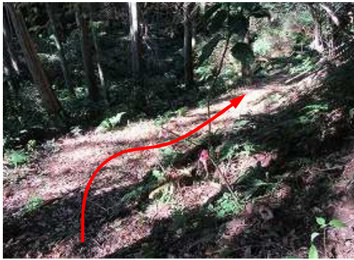
一段下って右方向へ向かう。