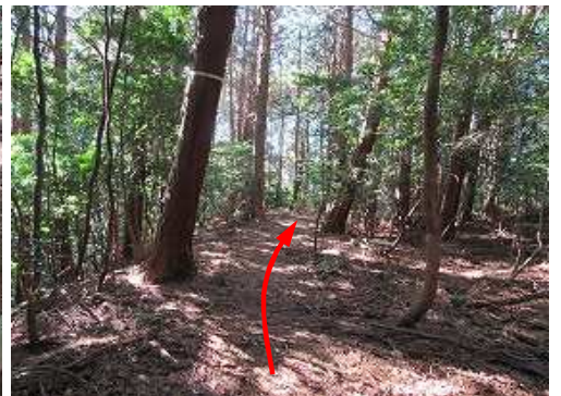
進行方向右側は平坦地形となっている。