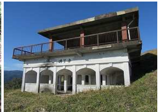
使用できない通天洞を見る。