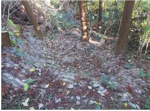
北側の 復旧斜面 を通過する。