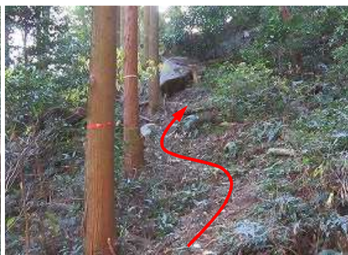
やや急な斜面を上って行く。