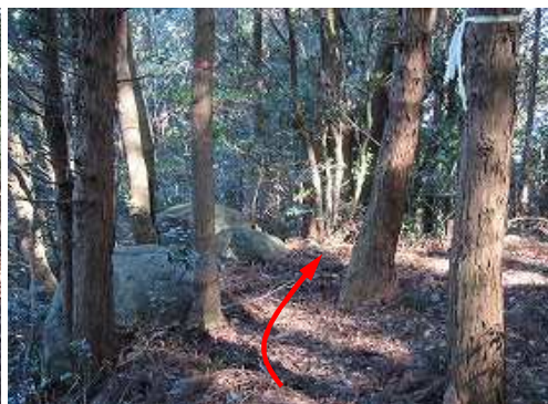
北北東へ弱い尾根筋を下る。