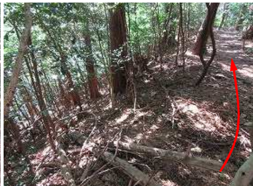
進行方向南側の斜面は急である。