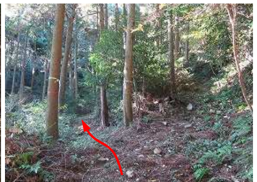
分岐に出会うが、左へ進む。