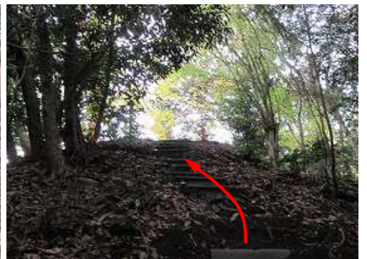
前方が開けて来た。