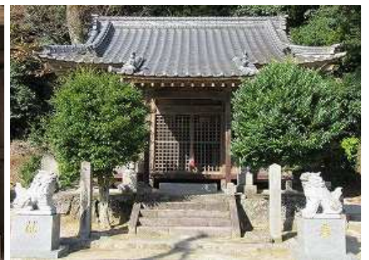
高木神社に立ち寄る。