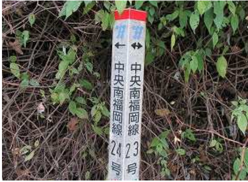
右に 鉄塔標柱 を見る。