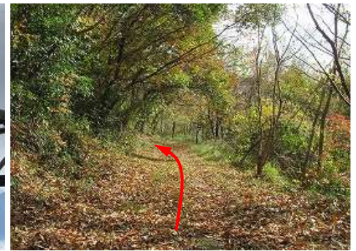
林道を道なりに下って行く。