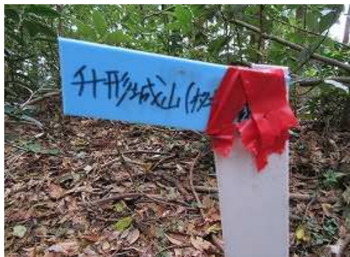
升形城山と書かれた名板を見るが私的に 榊形山 (432m)と称する。