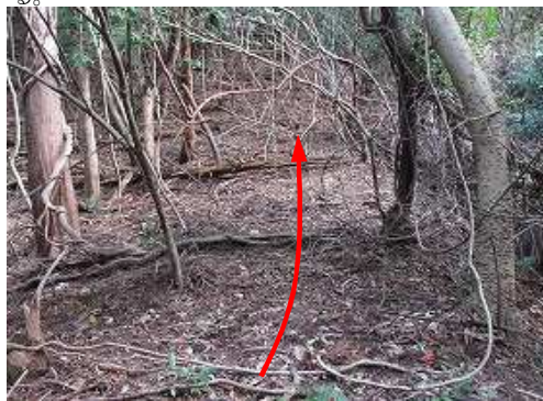
尾根斜面を緩く上って行く。