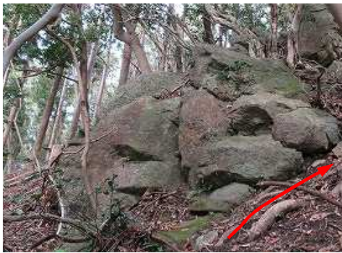
露岩の右を抜ける。