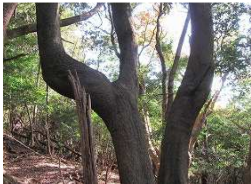
奇木から北北東へと進む。