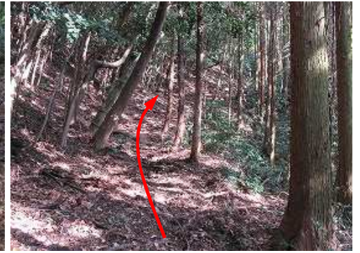
東斜面の古道を行く。