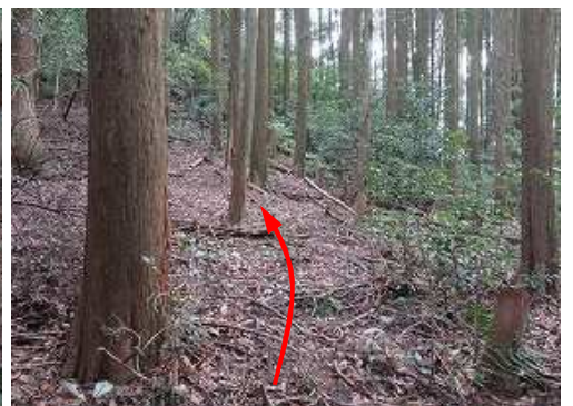
東へ緩斜面を上って行く。