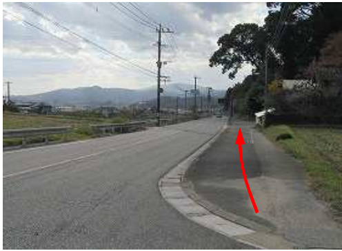
県道65号を下って行く。