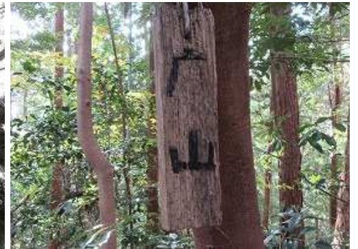
傍の枝の山名板に加筆したが、古すぎて判読不能。