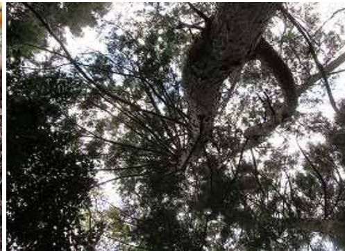
周囲を樹木で囲まれ展望は得られない。