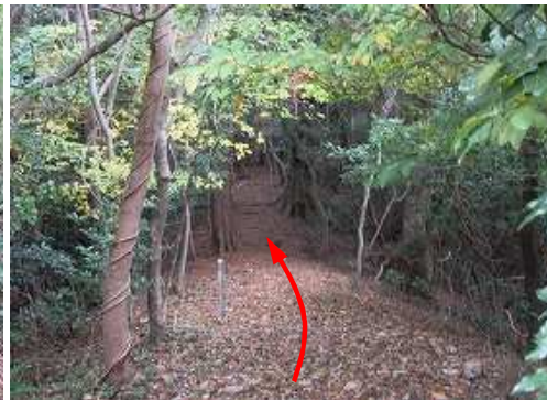
鉄塔24号を通過し北北西へ向かう。