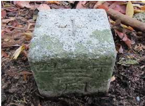
100m程進むと昭和26年に選点された四等三角点:塚口を見る。