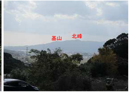
南南西に基山が見えた。