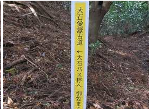
大石愛嶽古道の標柱を見る。