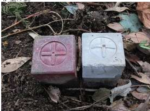
赤白杭を見る。地形図の境界線に沿うよう上って行く。