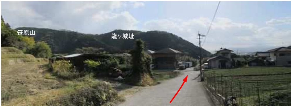
視界が開け南南東に笹原山の山並みを望む。