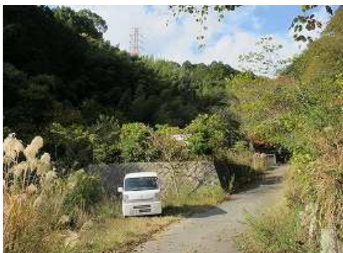
駐車地へ帰り着いた。