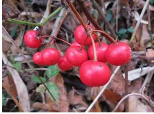
サルトツイバラ 実