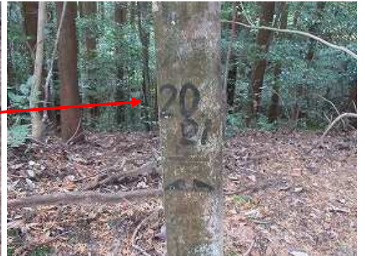
傍に立つ鉄塔標柱。