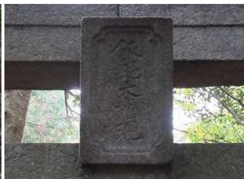
扁額には飯網大権現と彫ってある。