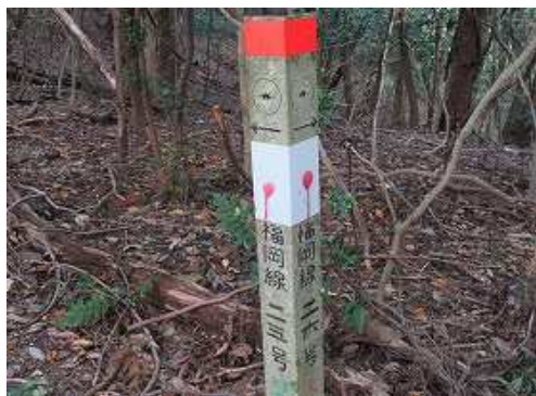
引き返して尾根筋を進むと、26号分岐の標柱を見る。