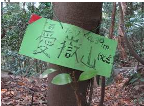
祠の背後に愛嶽山(439m)の山名板を見る。