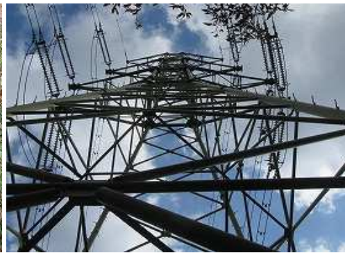
鉄塔17号を見上げる。