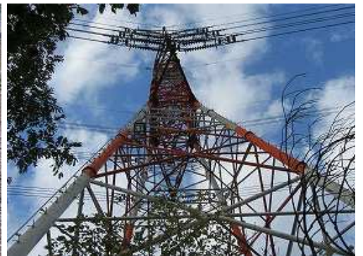
鉄塔25号を見上げる。