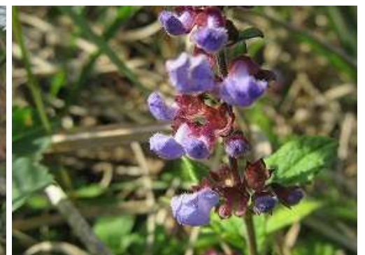
アキノタムラソウ