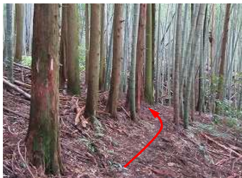
植林と竹林の中、 巡視路 を進む。