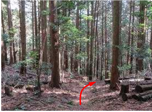
ヒノキ植林斜面を緩く下って行く。