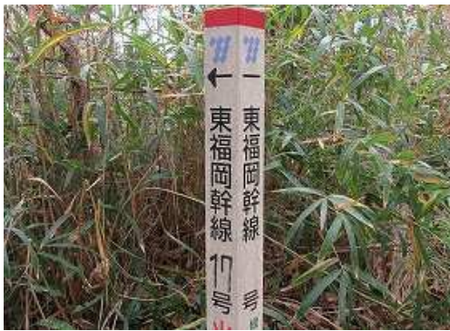
直進入口右に鉄塔標柱を見る。