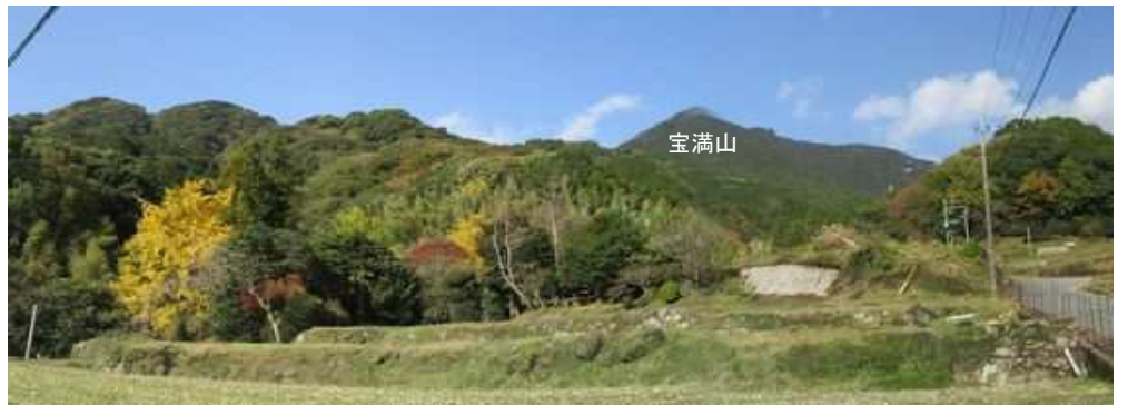
北に宝満山を望む。