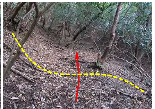
地形から見て里道跡を辿って上って行く。