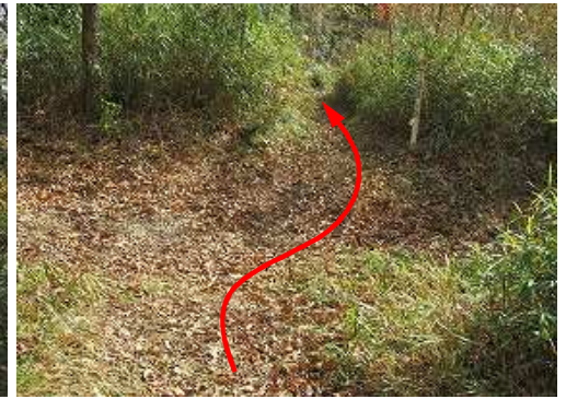
林道に出会い直進する。