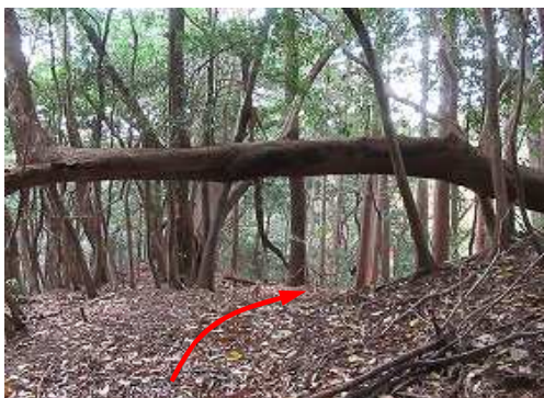
倒木ゲートを抜ける。