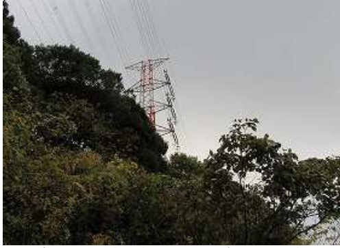
県道65号から犬眠社霊園への道に入り終点下の路肩空き地に 駐車 し、鉄塔24号を望む。

駐車地→鉄塔24号→四等:塚口(201m)→鉄塔25号→大岩→榊形山(432m)→愛嶽山(439m)→鳥越峠→鉄塔18号→林道出合→ゲート→高木神社→大石バス停→駐車地