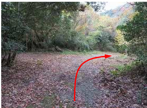
林道本線を下って行く。