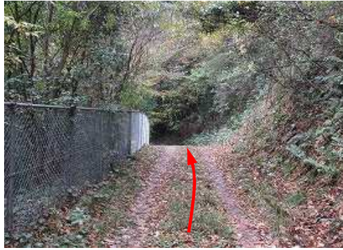
フェンス沿いに緩く上って行く。