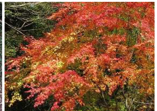
紅葉を見ながら下って行く。