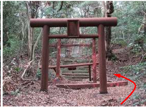
鉄の鳥居は扁額も読めず、奥の鳥居は倒れている。