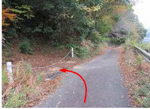
30m程引返すと左に 林道入口 を見る。