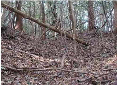
北へ下ると弱いコルで空堀状の地形を見る。