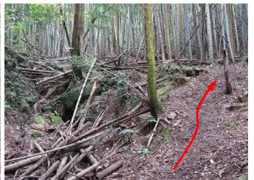
沢筋の左岸斜面を上って行く。