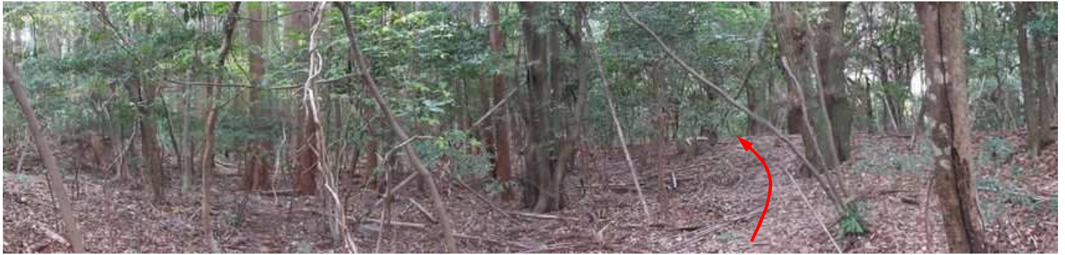
鈍頂の尾根筋を南へ向かう。