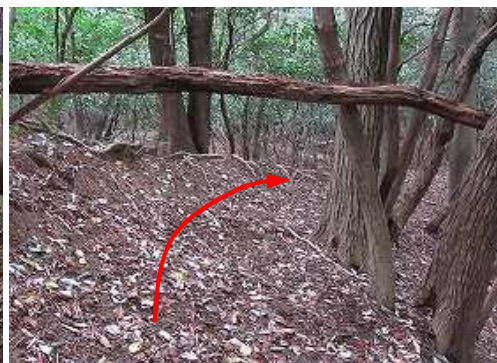
その先でも倒木ゲートをくぐる。