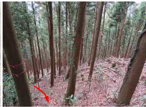
上って来た斜面を見下ろす。