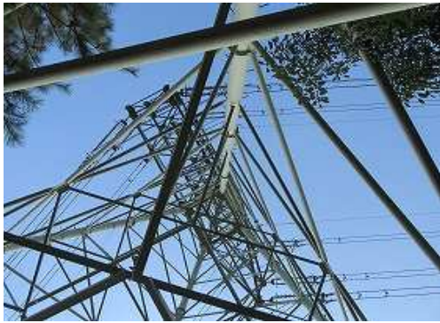
鉄塔18号を見上げる。