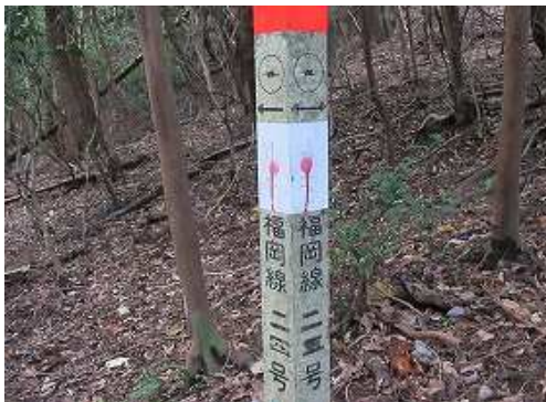
鉄塔標柱を見てプラ階段を西へと上って行く。