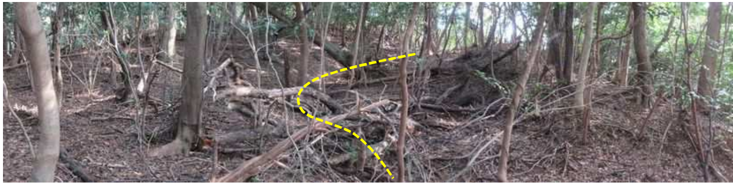
前方の地形であるが、中央部にU字形の地形が見て取れる。