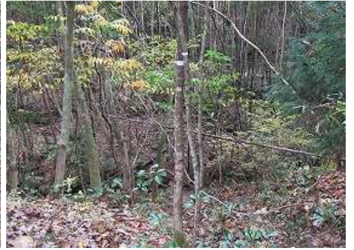
林道を左カーブした先の左に広場有。その奥木立に 沢入口 の白テープ有。