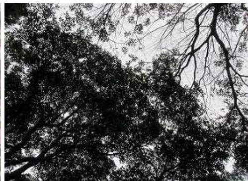
周囲を樹木で囲まれ展望は得られない。