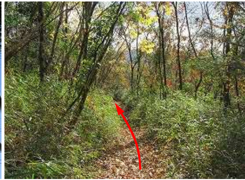
大行事原を緩く下って行く。