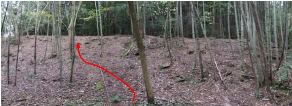
弱い沢を渡渉し対岸の作業路へと斜面を上る。