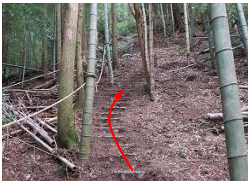
やや急な斜面の プラ階段 を上って行く。