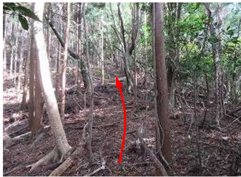
間伐斜面の際に沿うよう上って行く。