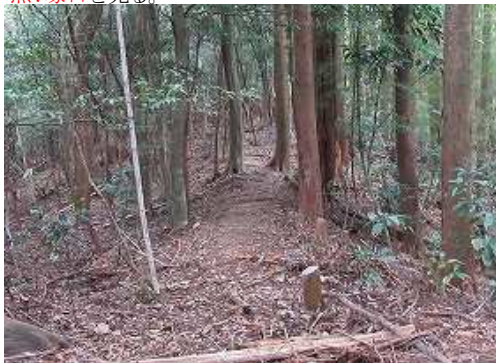
鉄塔24号へと引き返す。