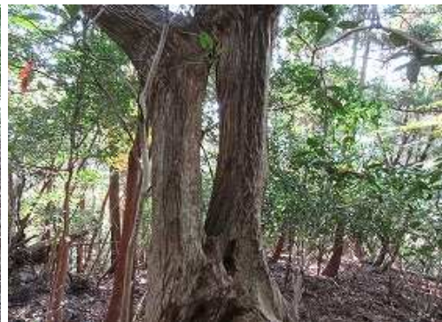
幹の根元が異形で上部で合体する夫婦シデを見る。