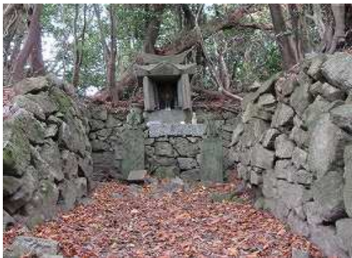
周囲を石積みで囲まれた中に愛嶽神社の祠を見る。