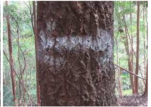
幹に矢印のペイントを見る。