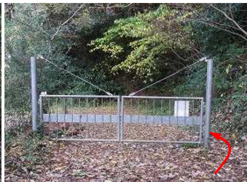
ゲートを通過する。