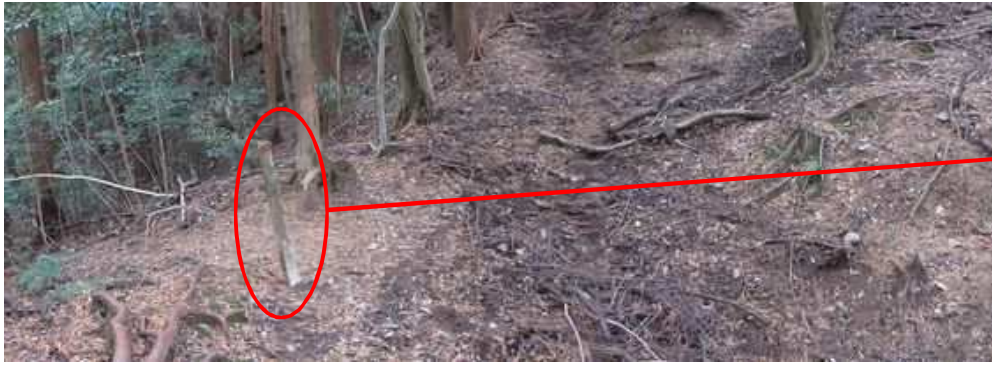
地形図破線の古道分岐に出会う。