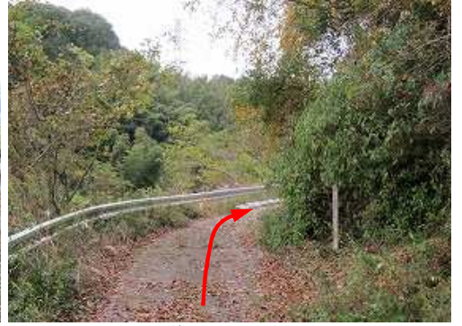
林道を北西に進む。