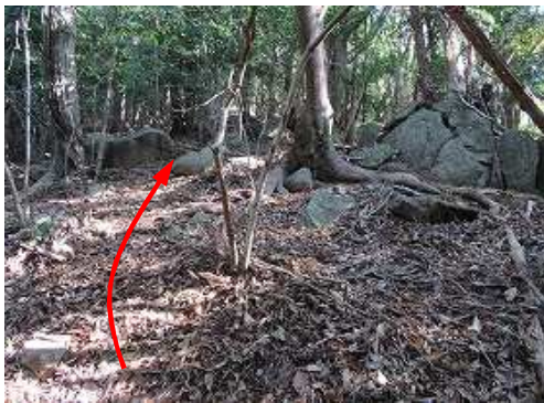
尾根斜面の露岩を抜ける。