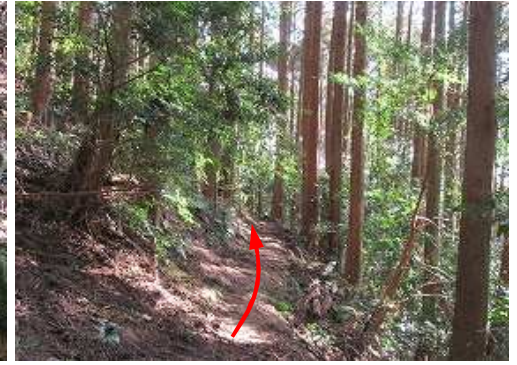
スギ植林地に行く。