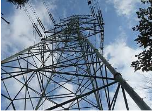
鉄塔19号を見上げる。