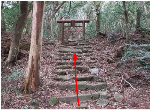
愛嶽神社への参道に出会い西へ向かう。