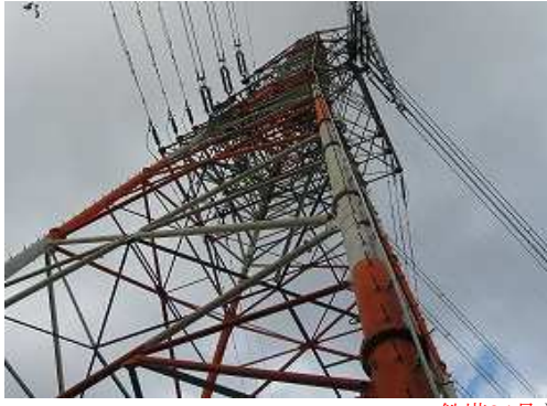
鉄塔24号を見上げる。