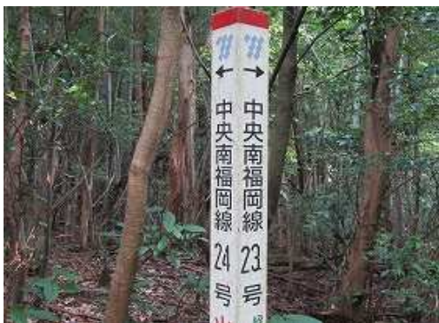
作業路終点に 鉄塔標柱 を見る。