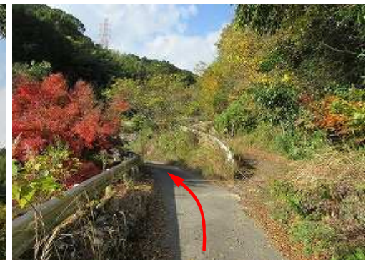
林道入口を右に見送る。