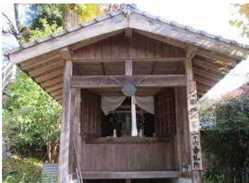
道路脇の26番札所に立ち寄る。