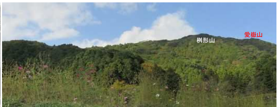
北北西に愛嶽山を望む。