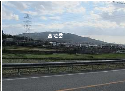
南に宮地岳を望む。