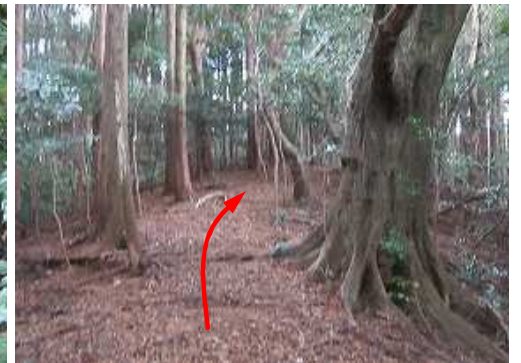
大木の左を通過する。