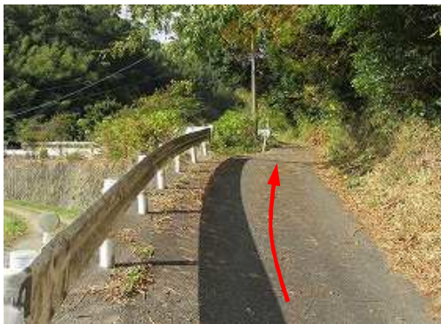
坂道の上って行く。