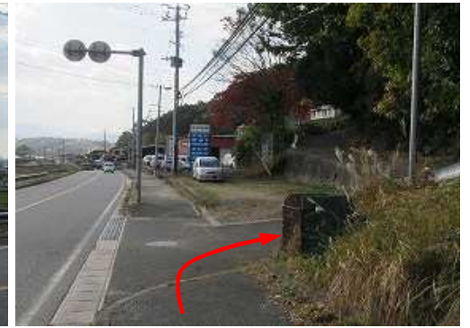
犬眠社へと右折する。