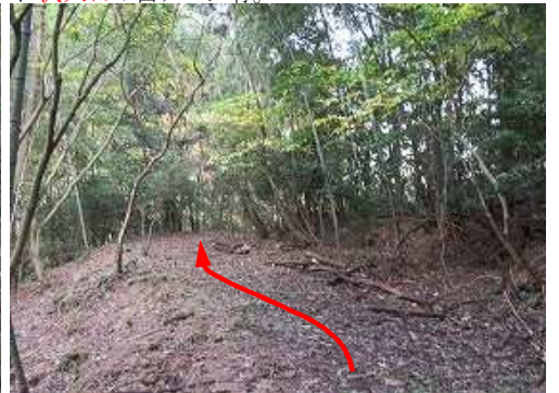
作業路を南東へ進む。