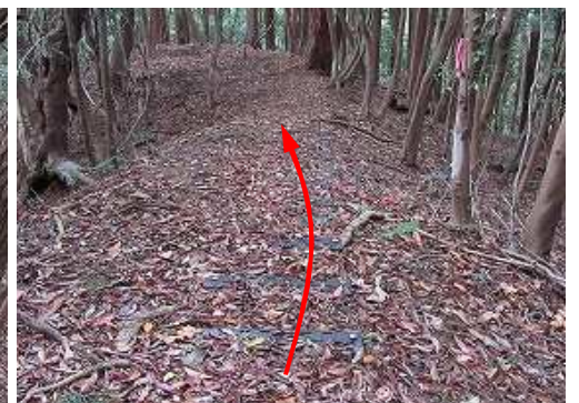
緩くブラ階段を下る。