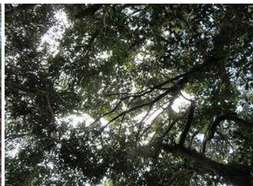
周囲を樹木で囲まれ展望は得られない。