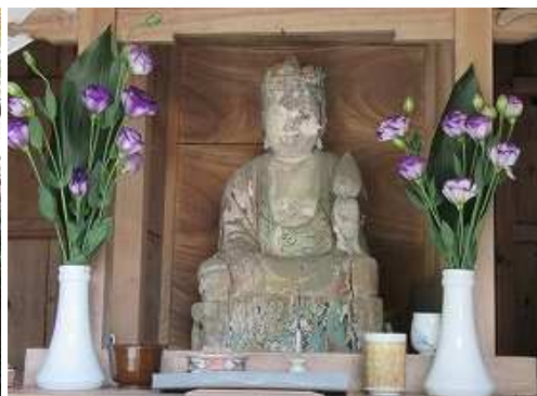
十一面観世音菩薩が祀られている。