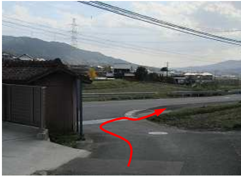
大石バス停を右折する。