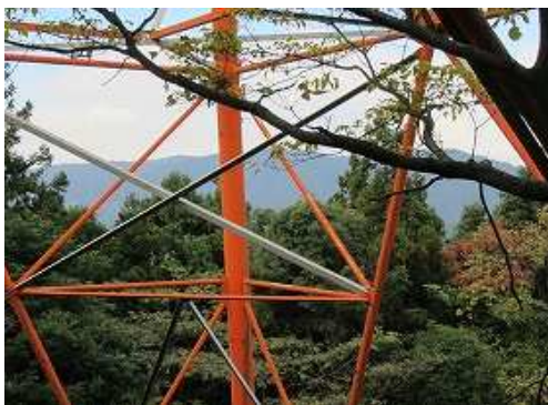
西北西に四王寺山の大原山から水瓶山の山並みが望める。