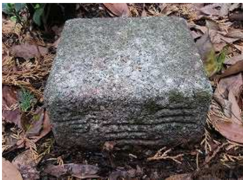
明治30年選点の三等三角点:愛嶽山を見る。