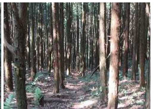
電柱分岐 北北西の奥に電柱が見える。