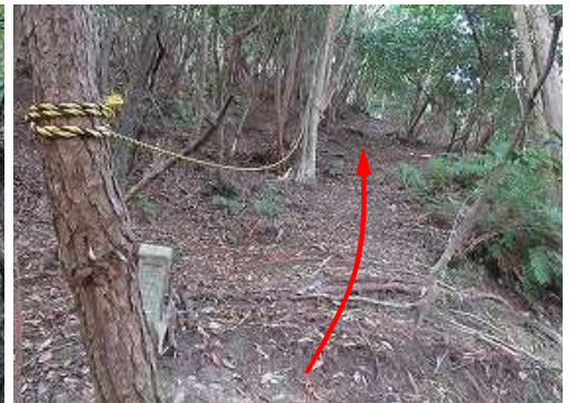
トラロープが現れ、急な斜面を上って行く。