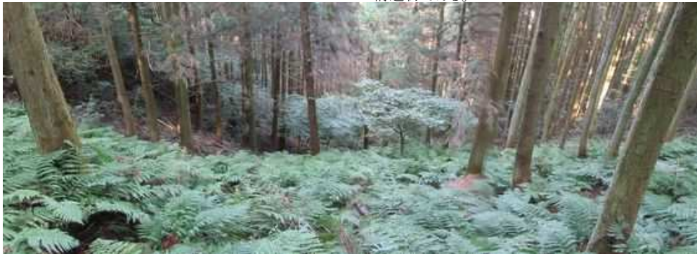
天端から下流を見る。