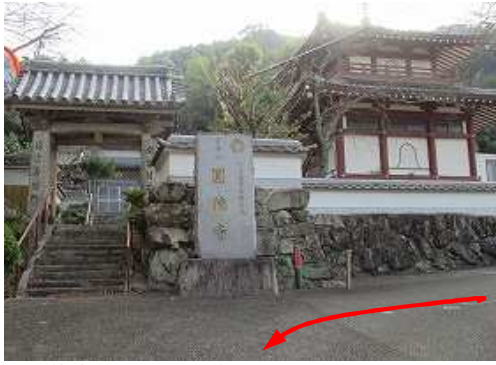
圓徳寺駐車場への駐車許可を得て車を止め、歩き始める。

圓徳寺駐車場→作業路入口→第1水門→鉄塔標柱→宮地岳神社祠→宮地岳(339m)→第3水門→支線出合→圓徳寺駐車場