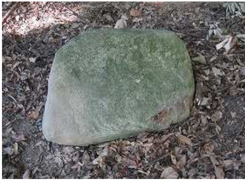
途中からショートカットした斜面に加工された切石を見る。