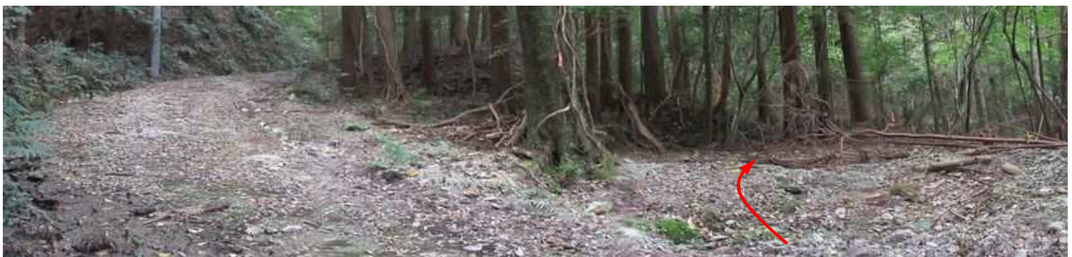
作業路入口 右の作業路に入る。