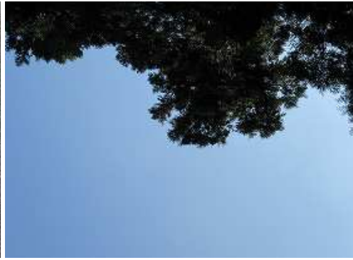
上空は開けているが、周囲を樹木で囲まれ展望は得られない。