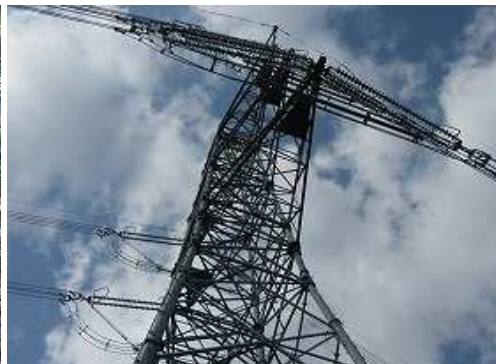
鉄塔63号を見上げる。