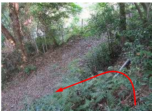
林道支線に出会う。