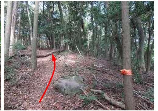
登山道を北へ進む。