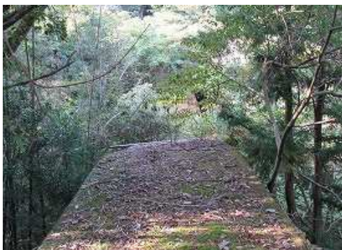
右に砂防ダムを見送る。