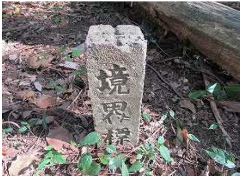
弱い支尾根に境界杭を見る。