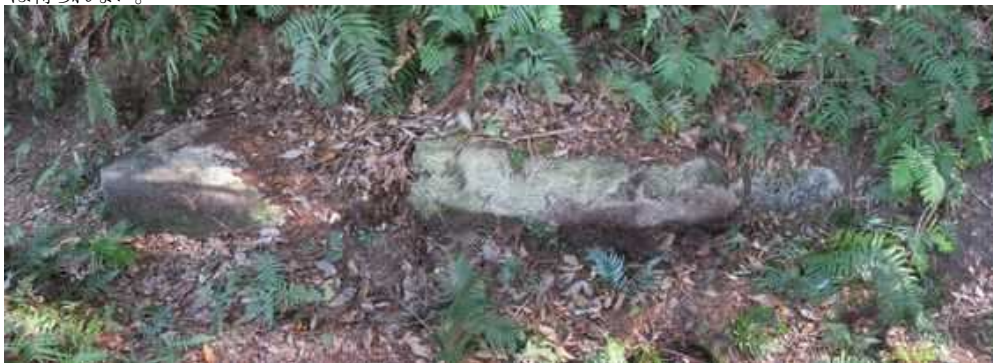
矩形に加工された列石を見る。