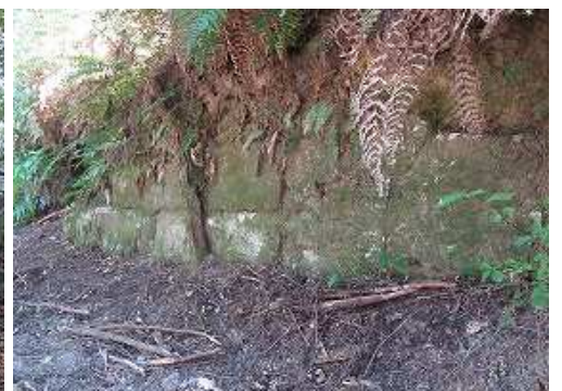
山側に列石を見る。