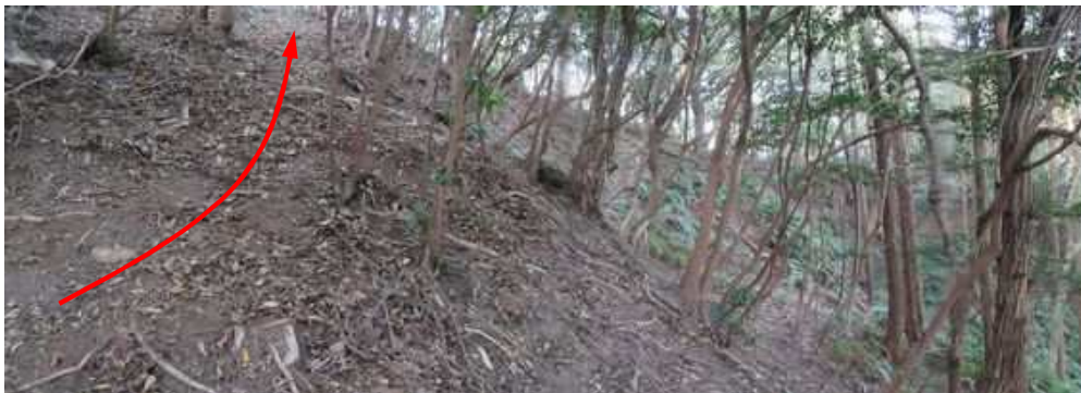
北西に支尾根が派生している。