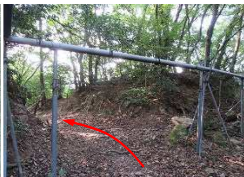
塩ビパイプを抜け、道なりに進む。