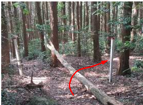
鉄塔63号分岐に引返し、右へ向かう。