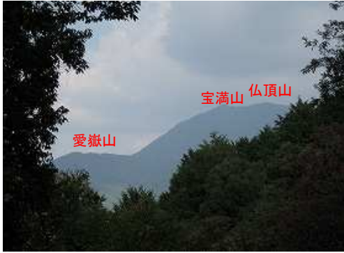
展望Bから北に若杉山を望む。