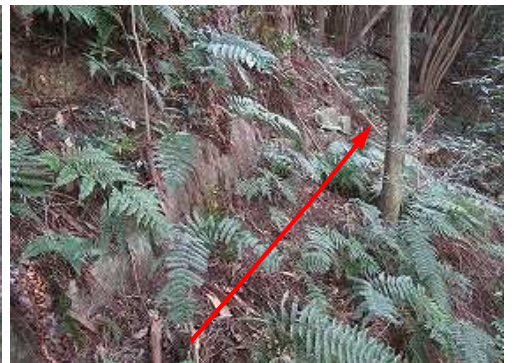
シダに隠れた列石際を上って行く。