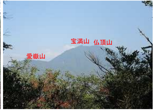
尾根から北に宝満山が望まれた。