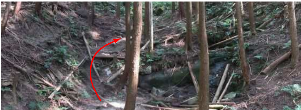
沢地形の中に大岩を見る。