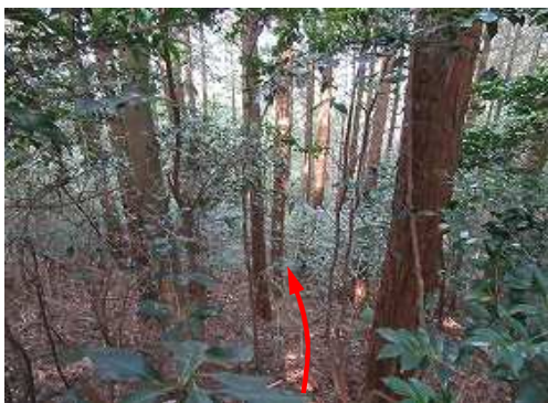
スギ植林斜面の灌木を分け下って行く。