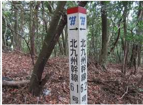
鉄塔標柱に出会う。