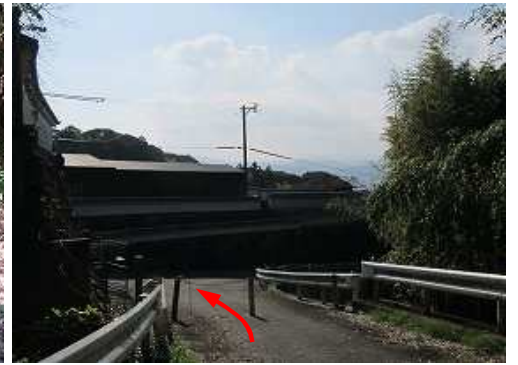
林道のチェーンを抜ける。