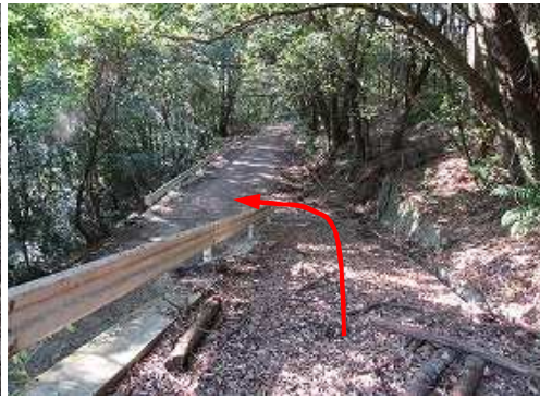
分岐Aに出会い、左折する。