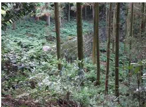
前方に石積みが見えた。