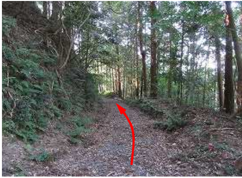
3つ目の左カーブへ向かう。