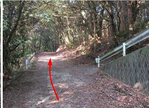
分岐A 右に上って行く支線を通して。帰路、これを下って来た。