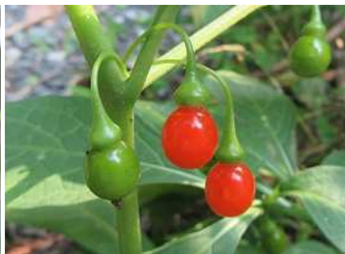
ヒヨドリジョウゴ