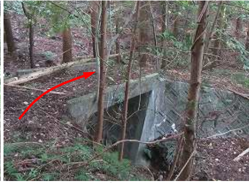
コンクリート製の橋を通過する。