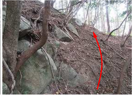
急な斜面を上って行く。