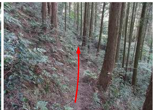
踏跡に出会い、これを辿る。