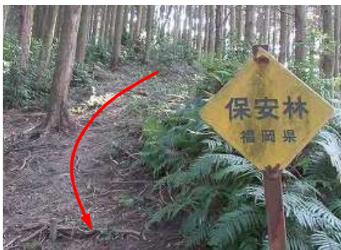
保安林を振り返る。