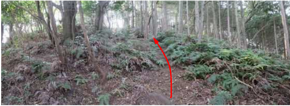
南東へ斜面を上って行く。