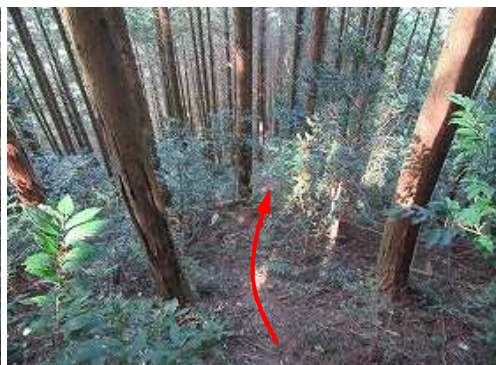
スギ植林内の急斜面を下る。