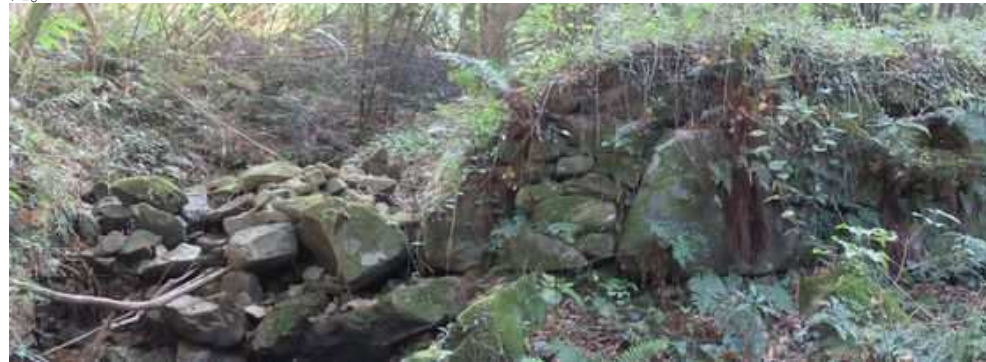
第1水門 右の石積みが残るだけで中央部は崩壊している。