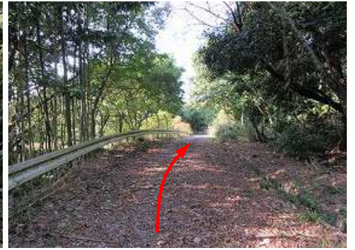
舗装路を下って行く。