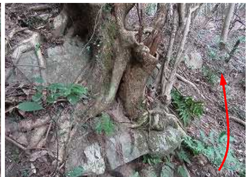
列石を取込む樹木。