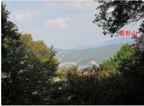
展望Aから北北西に若杉山を望む。