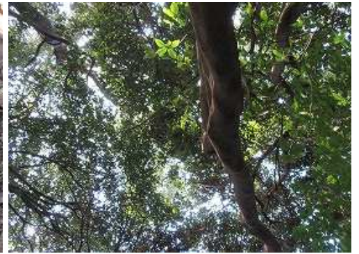
周囲を樹木で囲まれ展望は得られない。