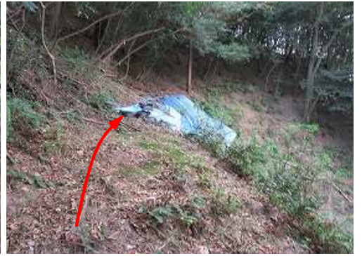
復旧斜面へ向かう。