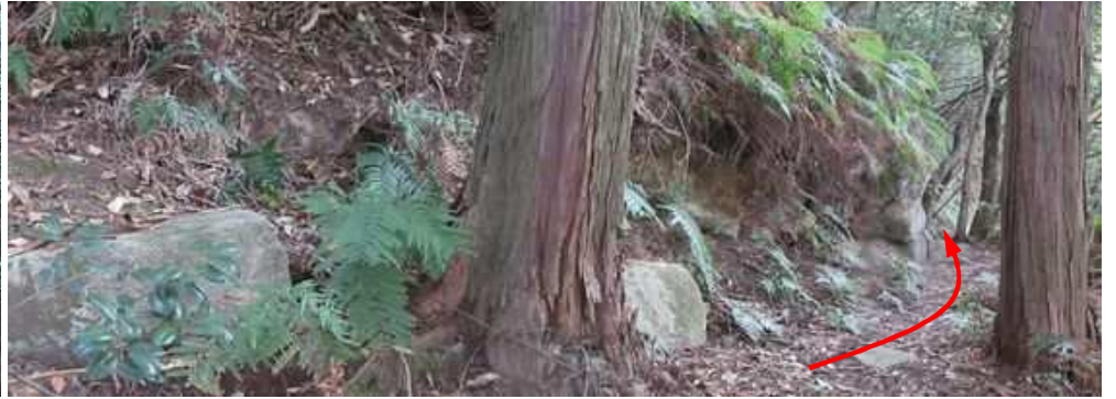
矩形の切石を並べた列石に出会い、これに沿って進む。