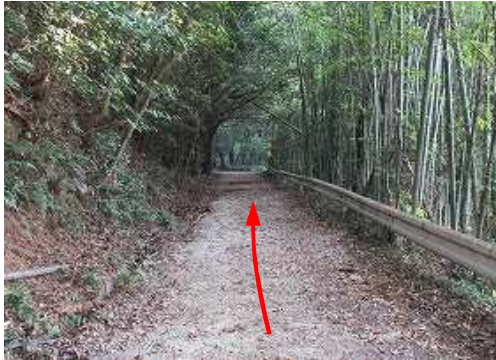
林道を緩やかに上って行く。