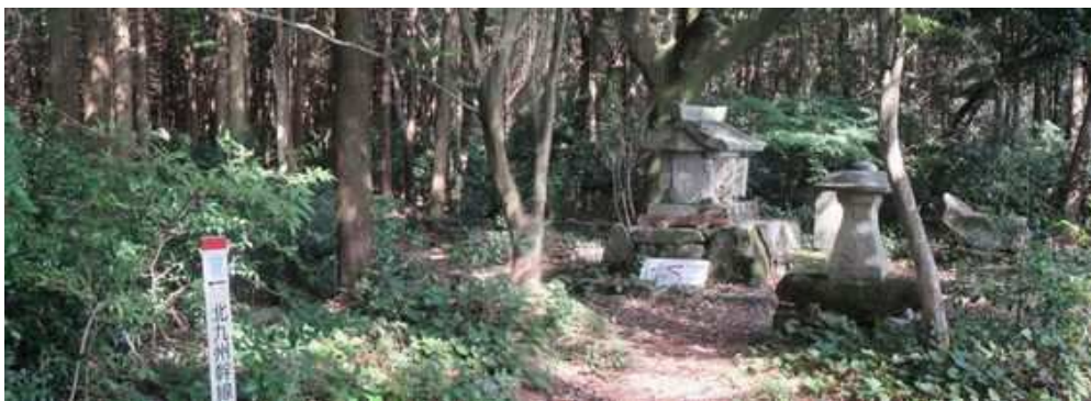
宮地岳神社祠に到着。