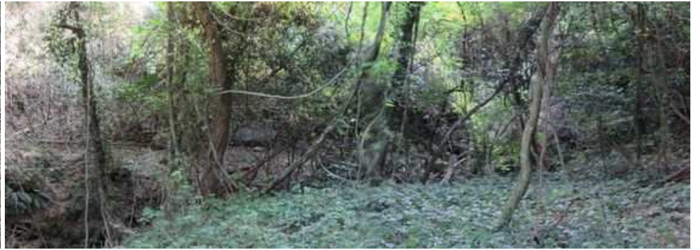
西側に平場の地形が広がっている。