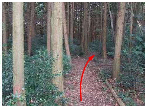
スギ植林内を北北東へ進む。