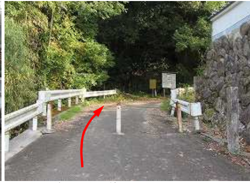
林道中阿志岐線のチェーンを抜ける。