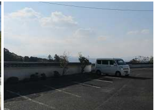
駐車場に帰着いた。