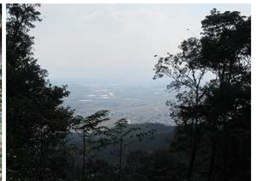
南が開け、展望が得られる。