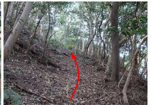
斜面を上って行く。