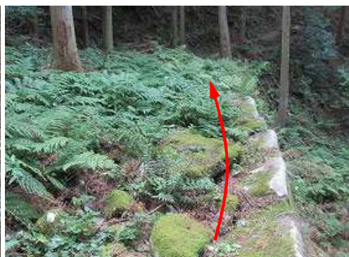
石積み天端を西へ進む。