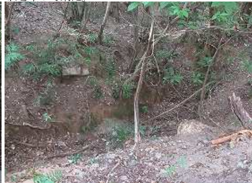
右側道路下に古道が通っている。