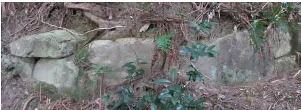
2段積みが見られる列石を通過する。