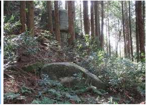
南に2段の角岩を見る。