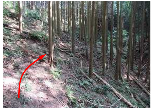
前方が沢状地形となって来た。