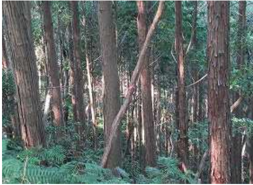
西斜面に赤ヒモを辿る。