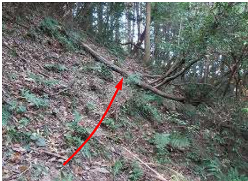
南側の斜面に取付く。