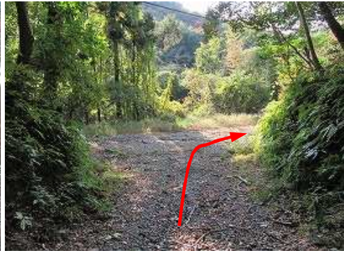
分岐Bに出会い、右折する。