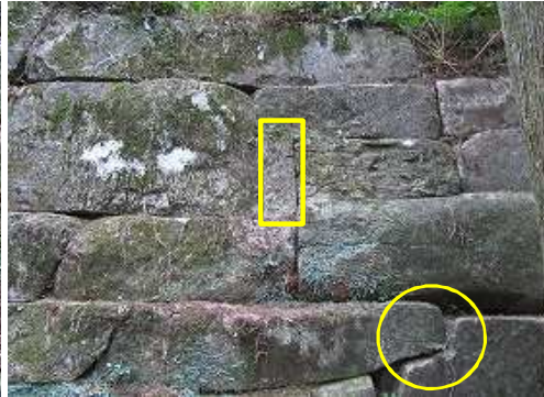
矩形に加工された石材を布積みで施工しており、切り欠き加工や間詰石が見られ施工精度や完成度が高い構造物である。