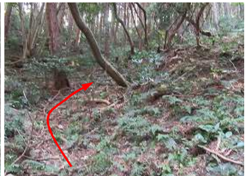
東方向へ斜面を上って行く。