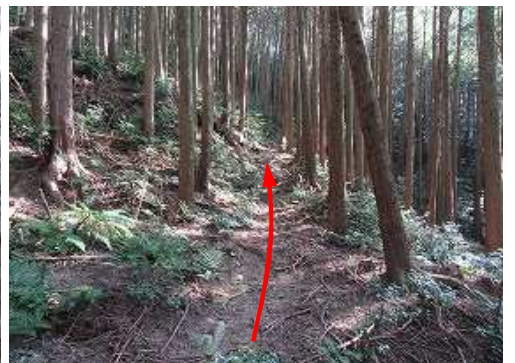
南東へ緩く上って行く。