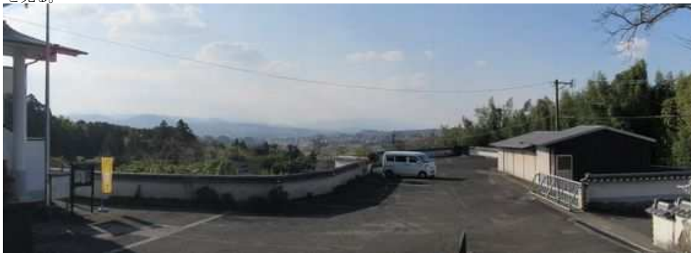
圓徳寺に挨拶し、駐車場を望む。奥に油山が見え、左に脊振山系が連なる。