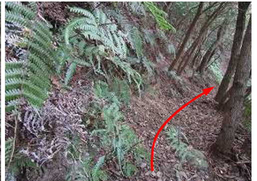
列石に沿うように進んで行く。