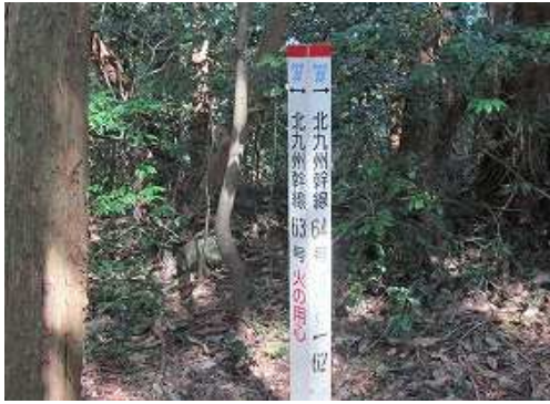
鉄塔63号分岐に出会う。