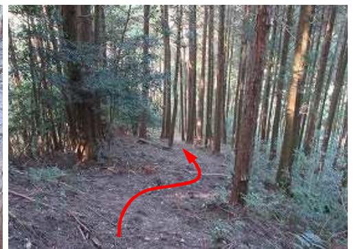
植林斜面を下って行く。