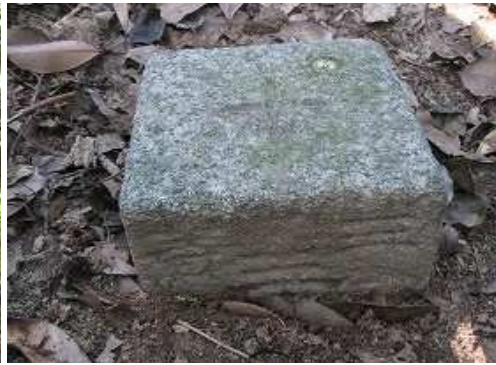
明治30年選点の三等三角点:宮地岳を見る。