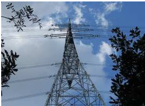
鉄塔62号を見上げる。