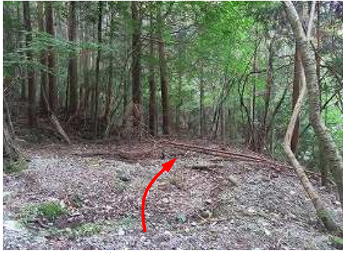
荒れた作業路を進む。