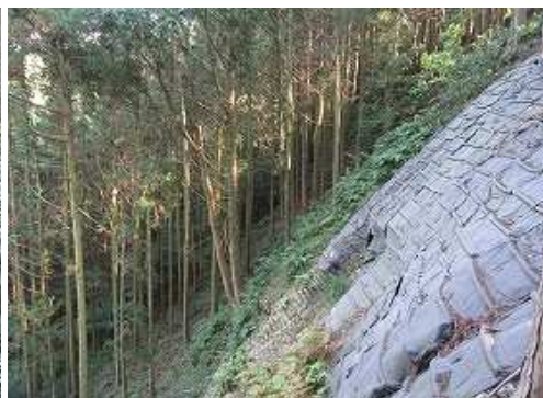
復旧斜面を見送る。