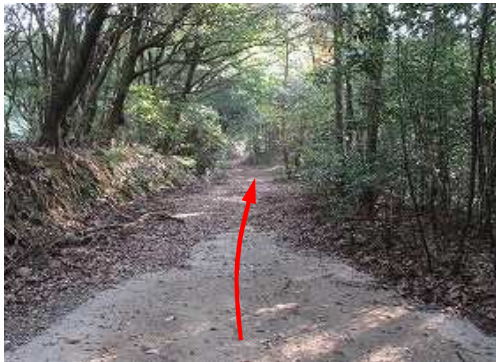
再生碎石転圧路を通過する。