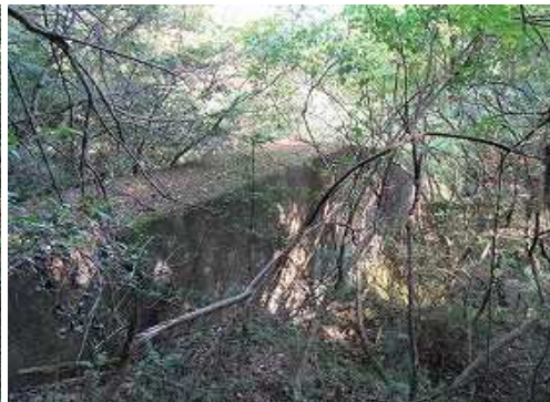
砂防ダムの左岸際を抜ける。