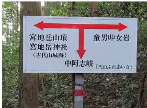
中阿志岐分岐を左に見送る。