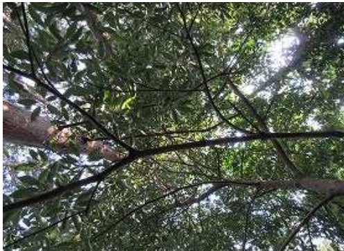
尾根筋に立ち寄ったが、周囲を樹木で囲まれ展望は得られない。