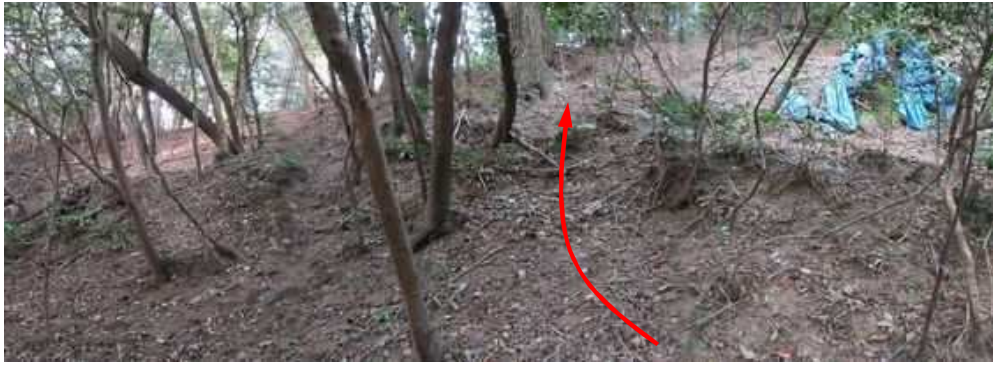
東斜面の上部にブルーシートを見て、駆け上がる。