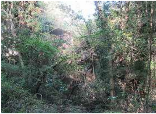
沢に出会い、下流に下ると砂防ダムの裏側が見えた。