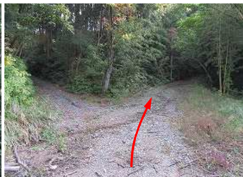
分岐Bに出会い、直進する。