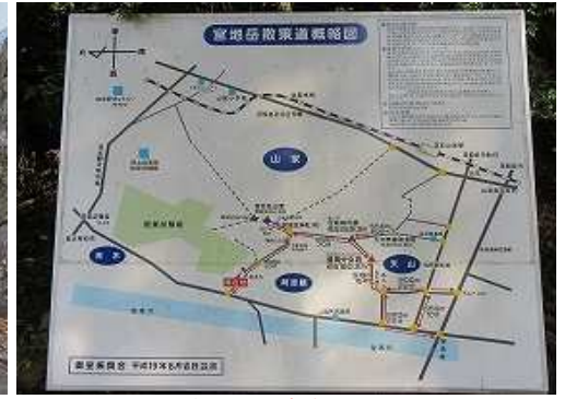
直ぐ先の左に案内板を見る。