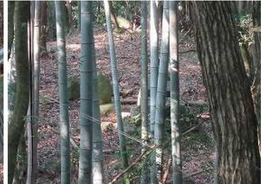
右カーブの所で、西側竹林の奥に墓地を見る。