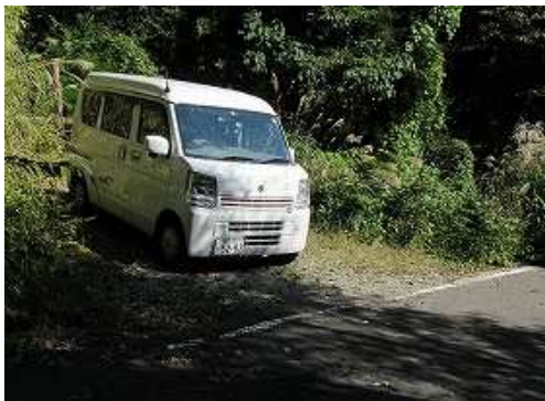
駐車地に帰り着いた。