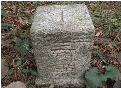
傍に明治30年選点の三等三角点:蛤岳を見る。