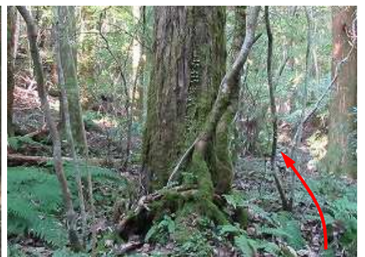
大木の右を抜ける。