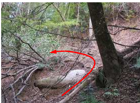
斜面崩壊地を越える。