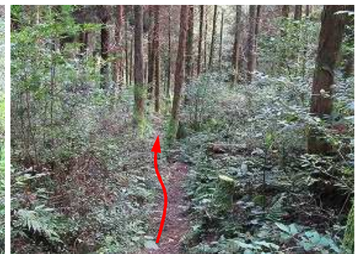
スギ植林地に行く。