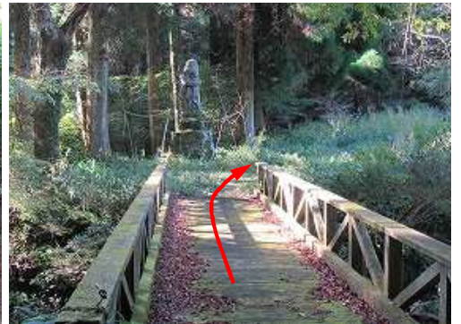
橋を渡ると水功碑を見る。