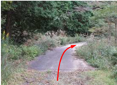
林道広場から道なりに林道を下って行く。