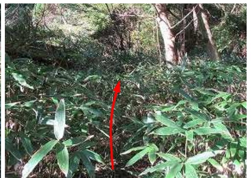
分岐からササを分ける。