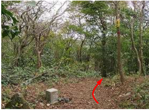
再度、蛤岳(863m)を越える。