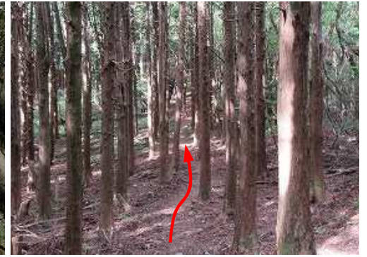
スギ植林の縦走路(九州自然歩道)に行く。