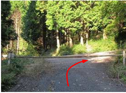
林道ゲートの際に駐車し、ゲートを抜け右折する。