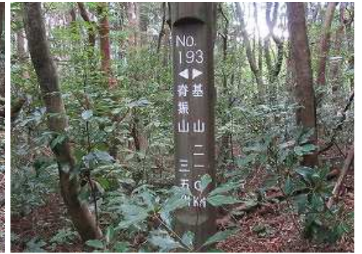
右に標柱を見送る。