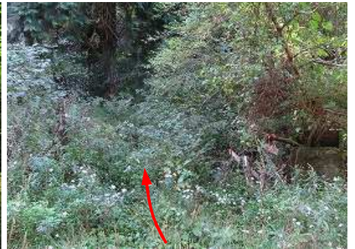
入口はヤブ化している。