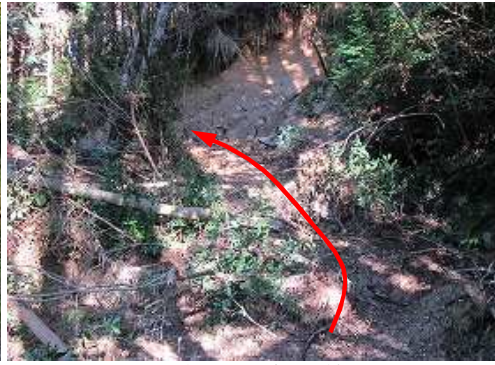
直ぐに法面崩落に出会い、越えて行く。