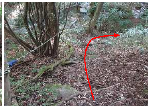
トラロープを伝い右岸際へ下る。