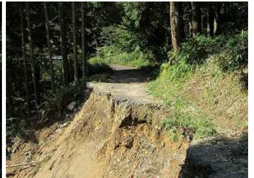
深谷橋方面の路肩崩落。