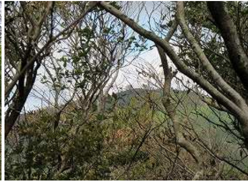
樹間から北西に脊振山のドームが望まれる。