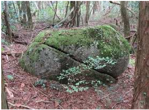
右にシジミ岩を見る。