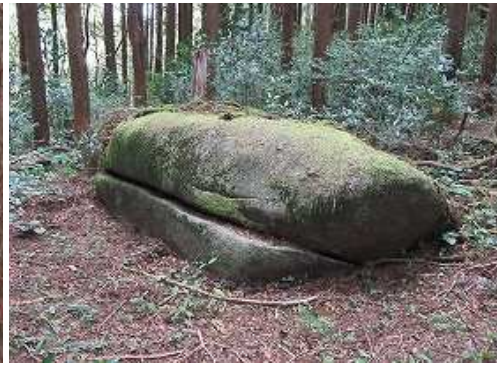
右にマテ岩を見る。