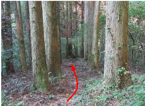
スギ植林地を緩く下って行く。