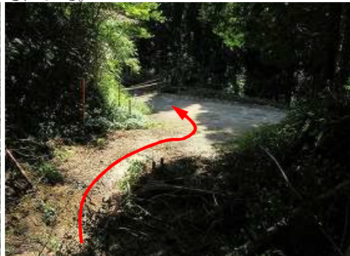
法面崩落の先にゲートが見えた。