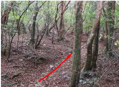
雑木の自然歩道を上って行く。