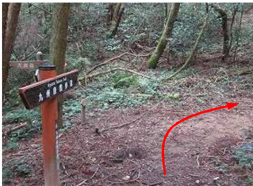
犬井谷分岐を通過する。