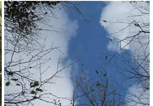
周囲を雑木で囲まれ展望は得られない。