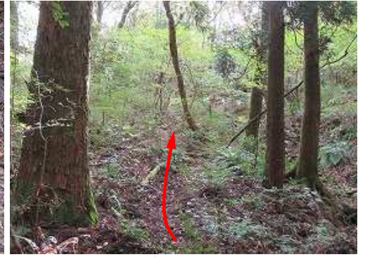
緩く雑木斜面を上って行く。