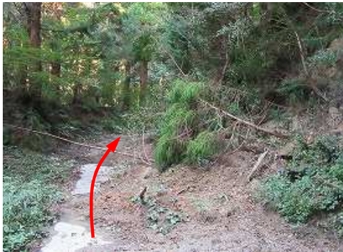
斜面崩落を抜ける。