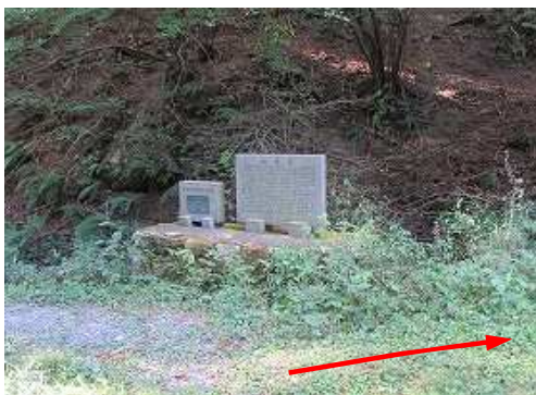
蛤水道記念碑を右折する。