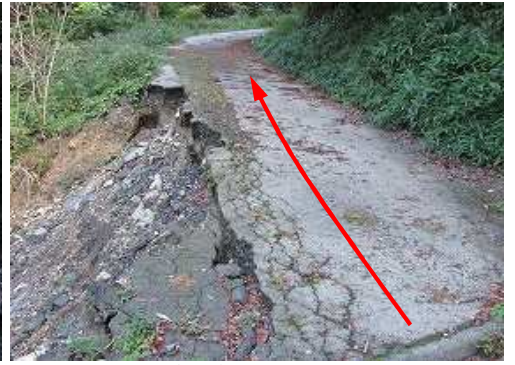
路肩崩落を抜ける。