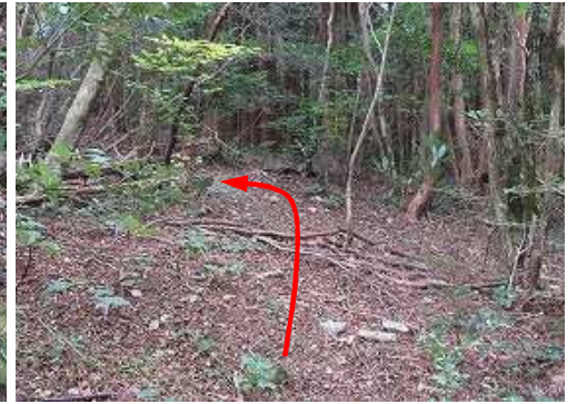
スギ植林斜面を上り詰め、縦走路に合流し左折する。