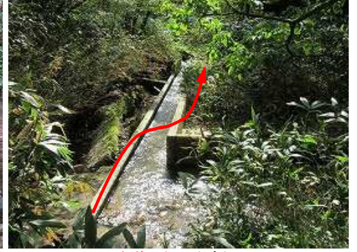
水道二俣に出会う。