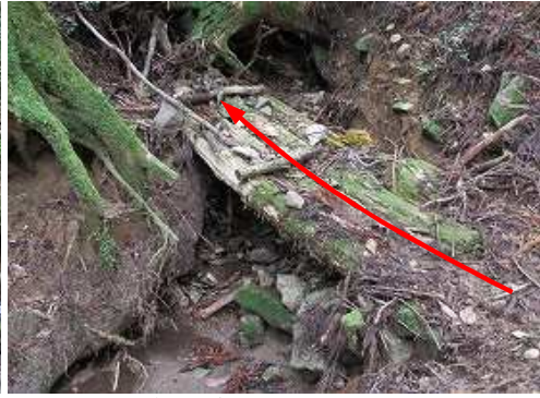
源流部の朽ちた丸太橋を渡る。