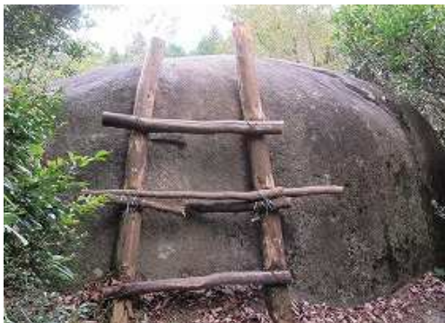
丸太梯子を上ると・・・