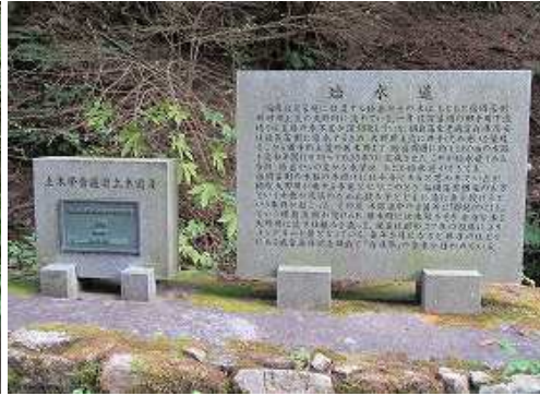
蛤水道は2010年、土木學會選奨土木遺産に認定されている。