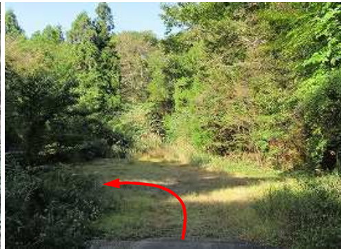
林道広場から左折する。