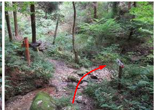
小川内分岐に出合う。