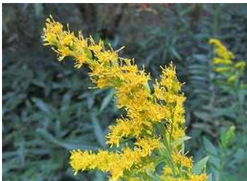
セイタカアワダチソウ