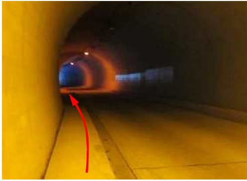
オレンジ灯のトンネルに行く。