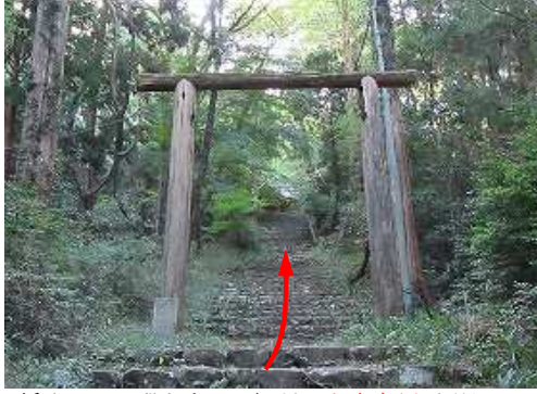
緩やかに石段を上って行くと、丸太鳥居が現れる。