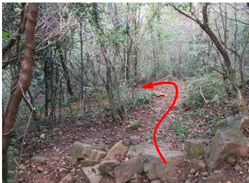
荒宿荘へと斜面を北へ下って行く。