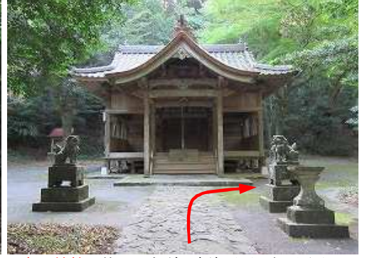
鳥野神社は約1300年前は福智山山頂に祀られていて、1656年頃に現在の場所に遷された。