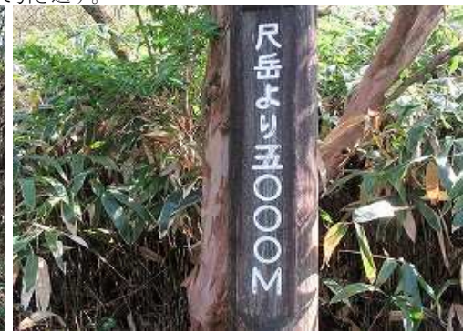
山側に「尺岳より5000M」の標柱を見る。