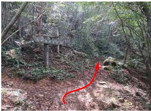
分岐C迄戻り南西へ向かう。