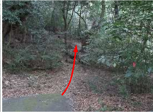
案内板等は無く、枝に赤ヒモ垂れている所が取りきとなる。