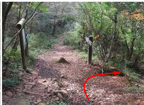
分岐Aから筑豊新道を下る。