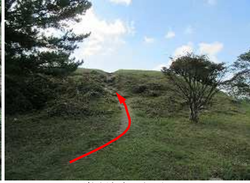
鷹取城跡へ向かう。