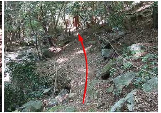
右岸沿いのロープを通過する。