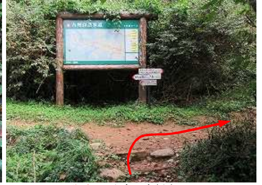
分岐Bに出会い右折する。