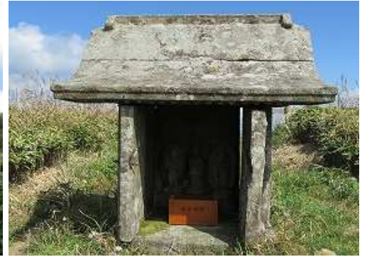
三体の石仏が祀られている祠を見る。