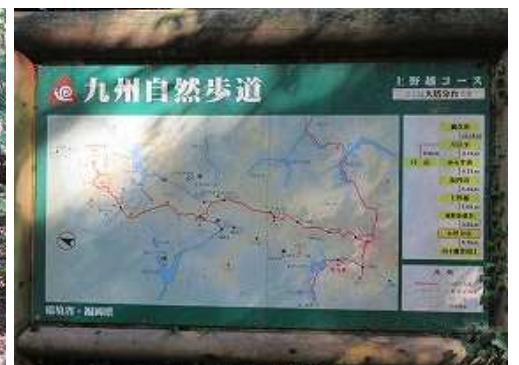
傍に九州自然歩道の案内板が立つ。