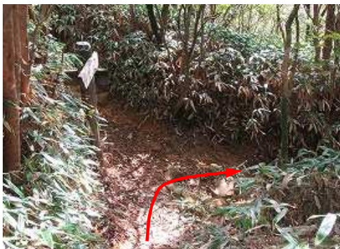
分岐Dに出会い、右へ下る。