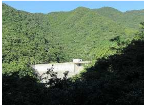
トンネルを出てダム堰堤を振り返る。