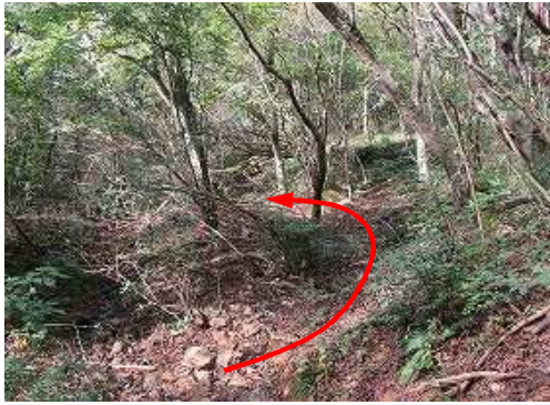
下り始めは緩やかである。