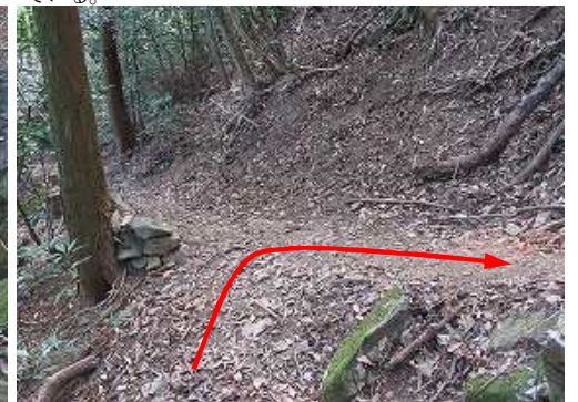
分岐 上野越からのルートに出会い、右折する。