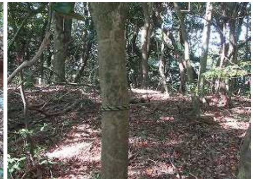
直ぐ先に霊園分岐であろうか西にトラロープが伸びている。