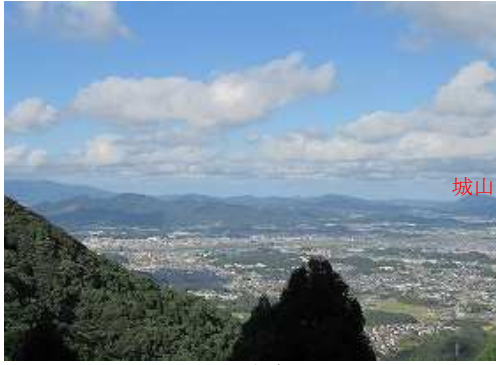
展望地からは直方市が望まれる。