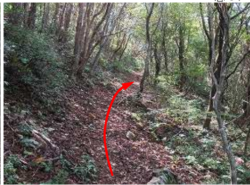
山腹を巻くように緩く上って行く。