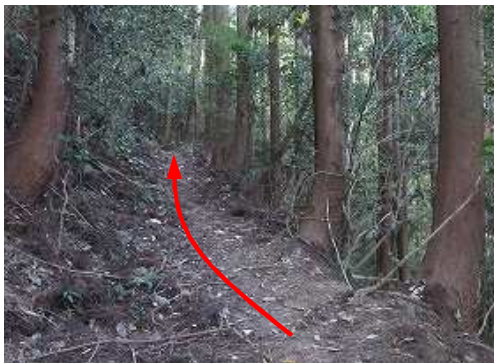
スギ植林の際を緩く上って行く。