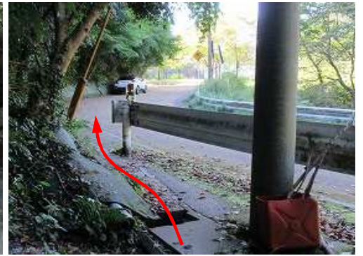
福智山登山口を出る。