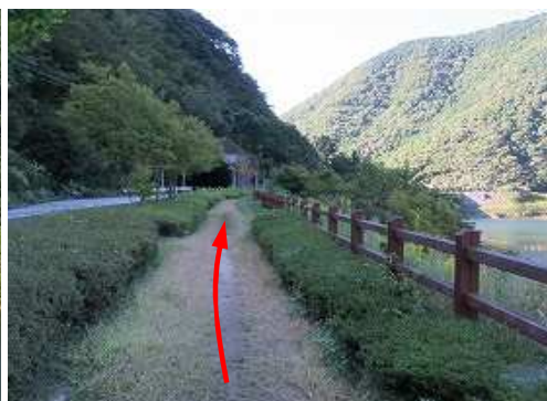
遊歩道を北西へ向かう。