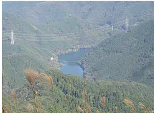
北東に鱒淵ダムを見下ろす。