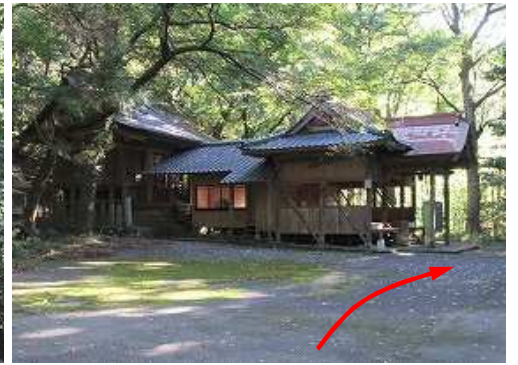
鳥野神社が見えた。