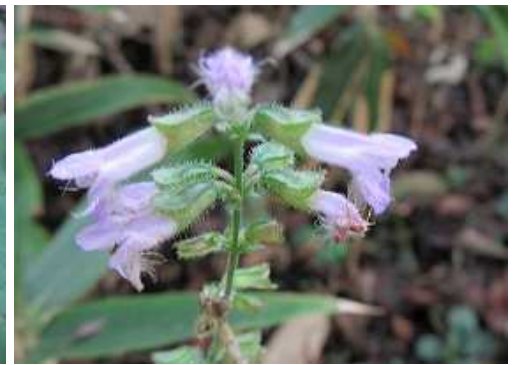
アキノタムラソウ