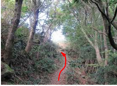
前方が明るくなって来た。