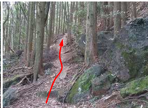
東側山腹を巻くように進む。