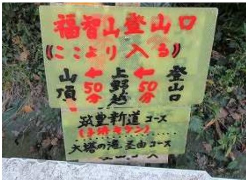
福智山登山口の案内板。