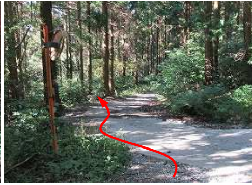
林道に出合うが、直ぐ旧道に入る。