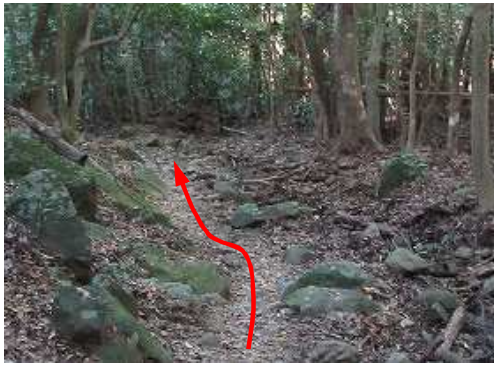
右岸に沿うように緩く下って行く。