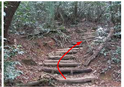
丸太階段を上って行く。