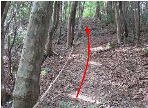
ロープの張られた斜面を上って行く。