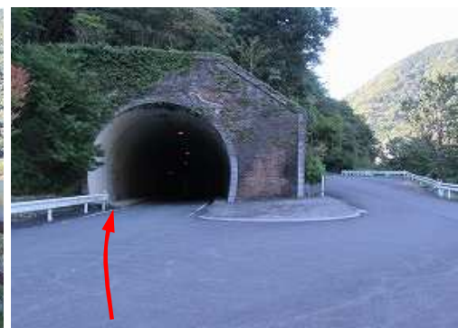
1994年9月に完成した長さ226mの鷹取トンネルが見えて来た。