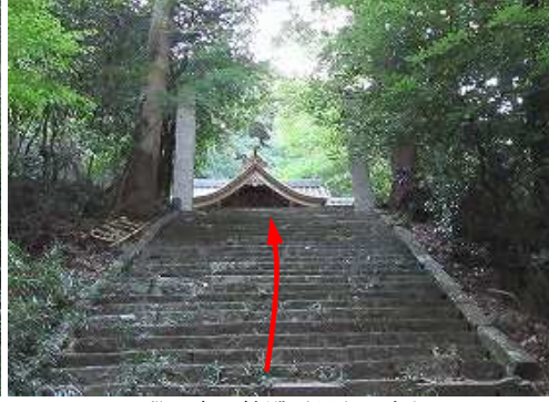
石段の奥に社殿が見えて来た。