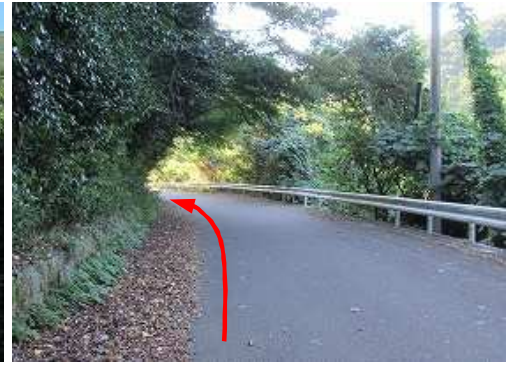
周回路を道なりに進む。