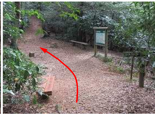
上野越を通過する。