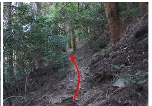
ガレ沢の上部を渡渉し、山腹を斜上して行く。