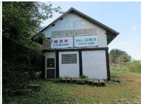
筑豊山岳会の手で建てられた荒宿荘は、内部も綺麗に整理整頓されている。一息ついて引き返す。