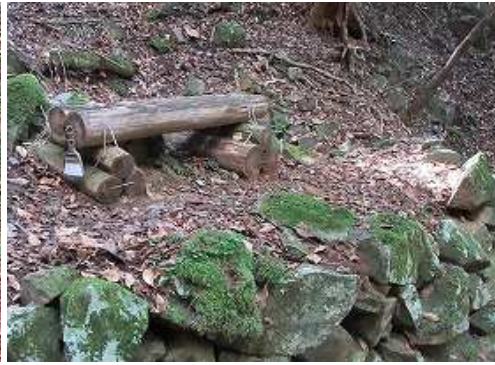
左岸側炭焼窯跡に置かれたベンチを通過する。