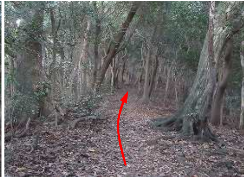
なだらかな尾根筋を行く。