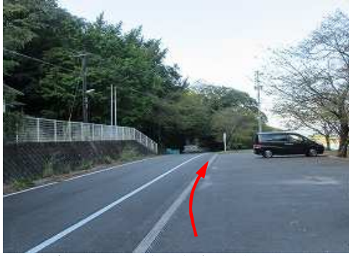
直方市頓野にある内ヶ磯ダムの駐車場に車を止め、南西に歩き始める。

駐車場→鳥野神社→尾根出合→鷹取山(620m)→上野越→福智山(901m)→荒宿荘→分岐A→大塔別れ→福智山登山口→鳥野神社→駐車場