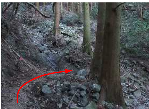
ガレ沢を通過する。