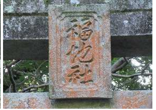
鳥居の扁額には福地社と刻まれている。