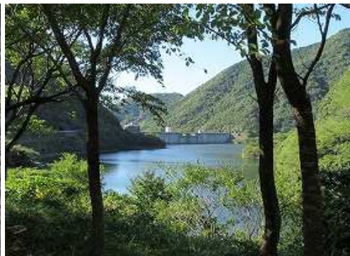
ダム周回路を西へ向かうと福智山ダムが見えて来た。