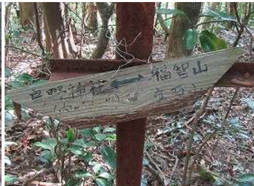
初めて案内板を見る。