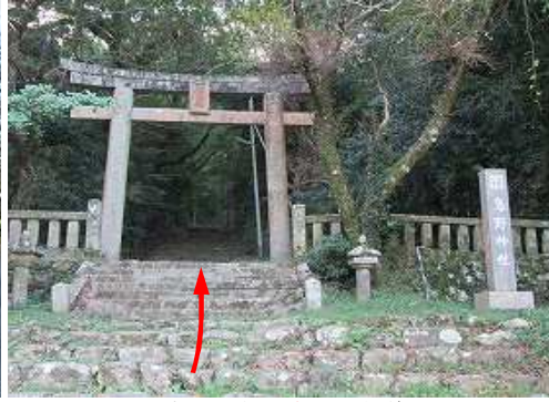
直ぐ、山側に鳥野神社の鳥居と参道が現れ石段を上って行く。