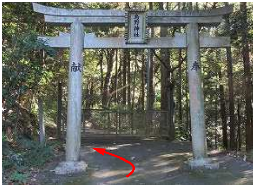
周回路が右カーブして下る所に鳥野神社車道入口の鳥居が立ち、これに入る。