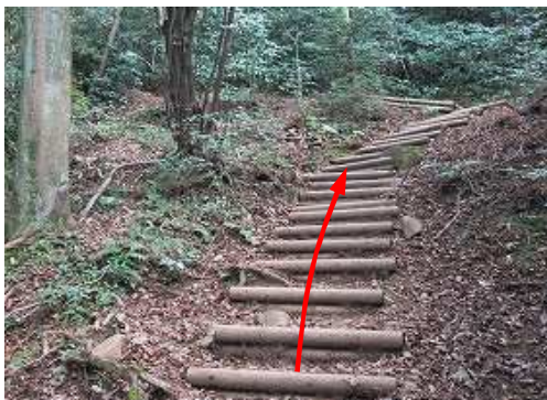
丸太階段を上って行く。