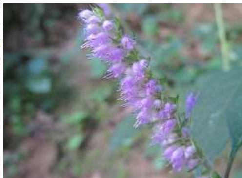
ナギナタクウジュ