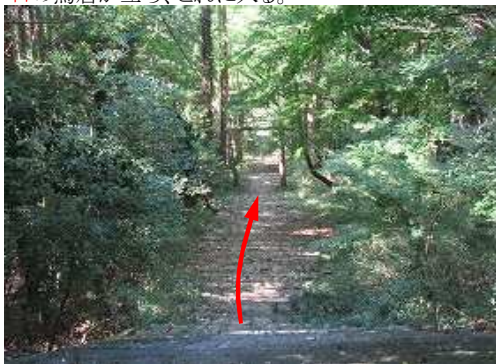
参道の石段を下る。