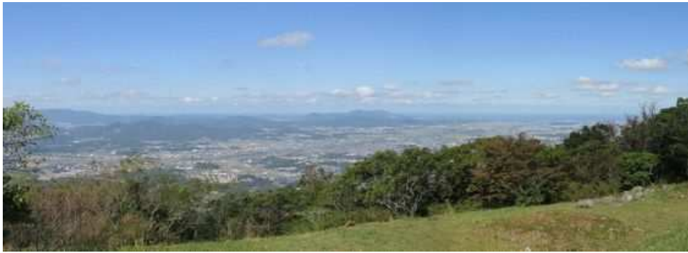
鷹取山から西に直方市を望む。