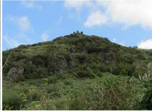
開けて山頂が望め、ススキとササ斜面を巻くように上って行く。