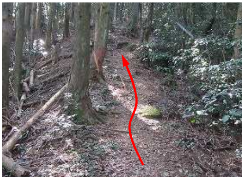
緩くスギ植林の尾根筋を上って行く。