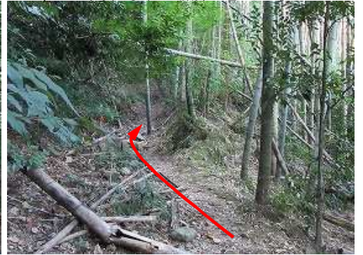
右に竹林を見て緩く上って行く。