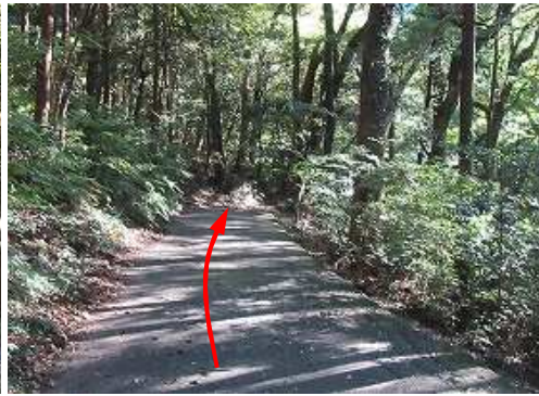
平坦な舗装路に行く。