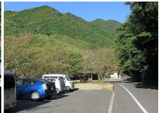
駐車場に帰着いた。