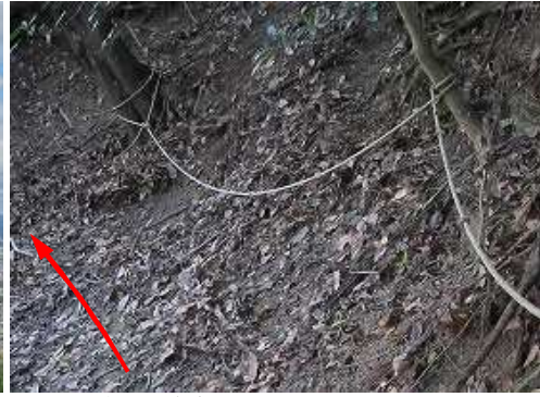
滑りやすい急斜面にロープが張られている。