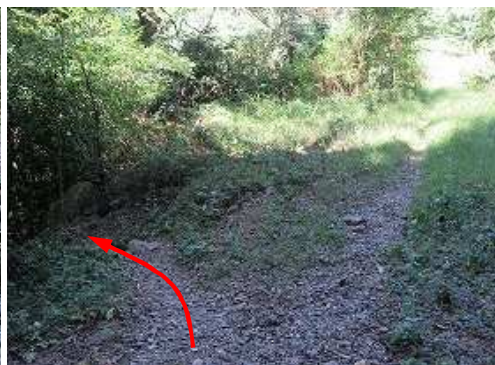
直ぐに沢の右岸側へ下る。