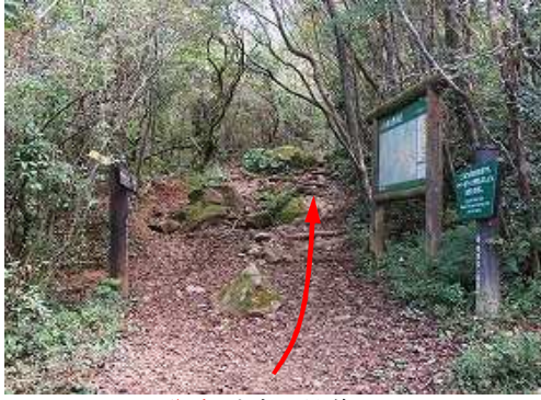
分岐Aを左に見送る。