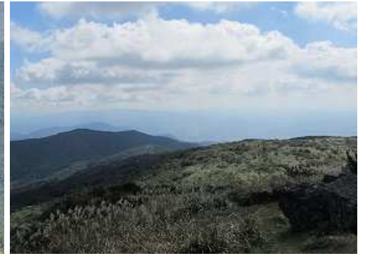
南南東に延びる山並み。