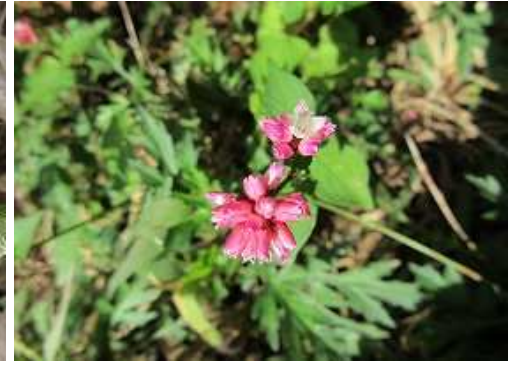
ママコノシリヌグイ