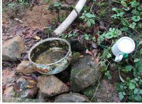
山側に水場を見る。