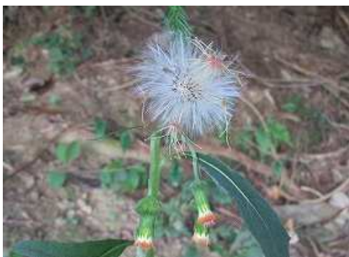
ベニバナボロギク