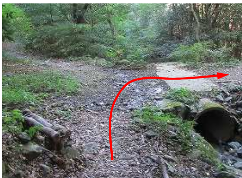
作業路に出会い、右へ向かう。