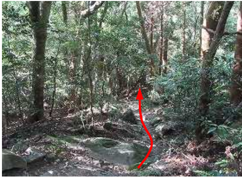
旧道を下って行く。