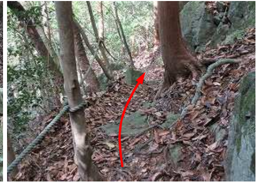
右岸側に張られたロープ場を慎重に下って行く。