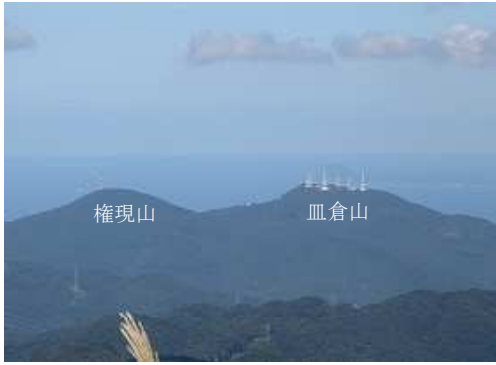
北に皿倉山、権現山を望む。