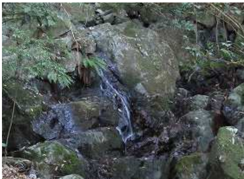
沢に落ちる小滝を見る。