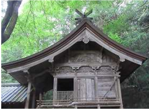
右に回り込むと、本殿の側面に鳥が彫られている。