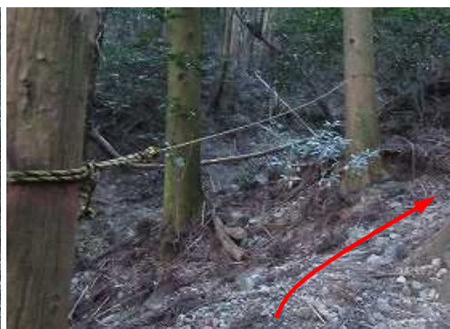
通過した所にトラロープが張られている。