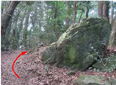
小岩の左を通過する。