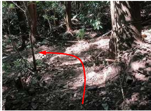
丸太階段の下りにロープが張られている。