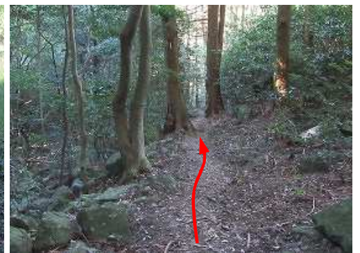
右岸沿いに下って行く。