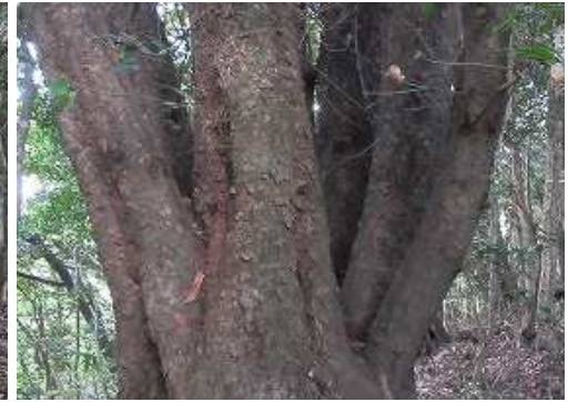
左に多幹木を見る。