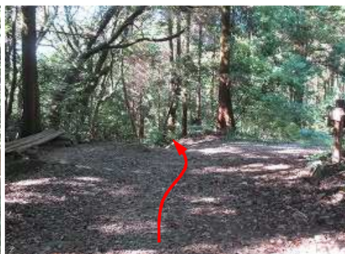
その先で大塔別れに出会う。