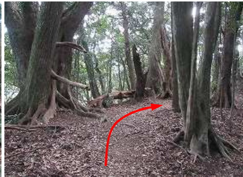
平坦路を右カーブして行く。