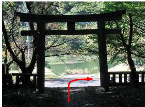
鳥居を出て、右折する。