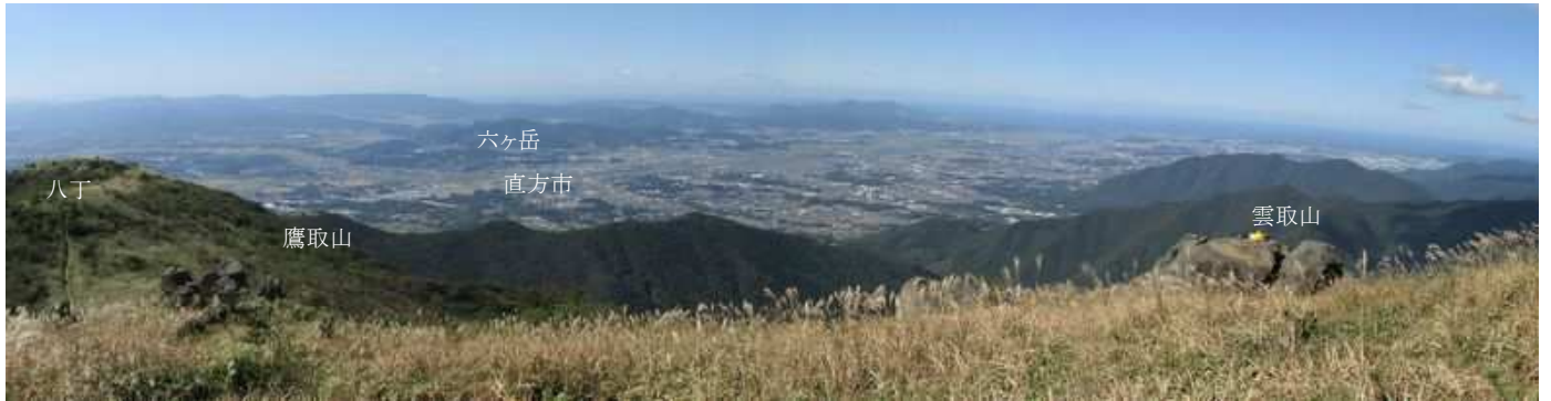
上宮石祠から直方市を見下ろす。