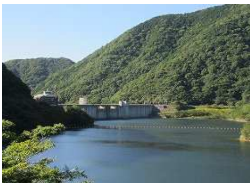
展望台から福智山ダム堰堤。