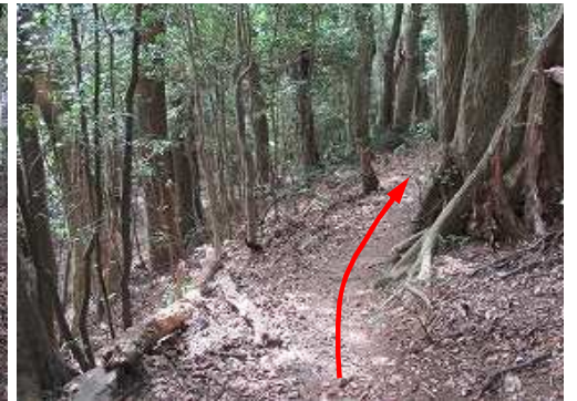
初めて緩やかな下りが現れた。