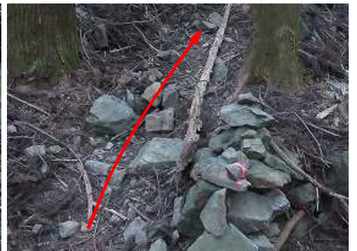
谷側に積まれたケルンを見て上って行く。