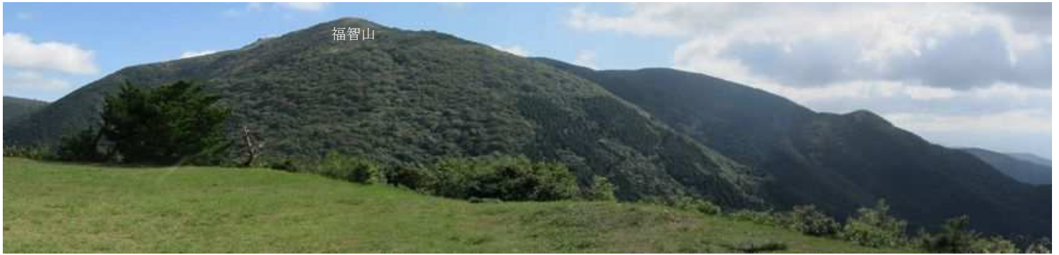
鷹取山から東に福智山を望む。