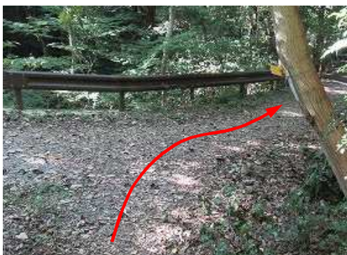
ガードレールのある作業路に出会い、右へ向かう。