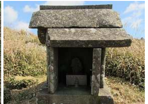
北西斜面に鳥野神社の上宮石祠があり山ノ神が祀られているが何故か不動明王、菩薩坐像も安置。