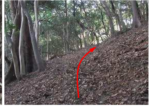
自然林となり尾根筋へ上り上がる。