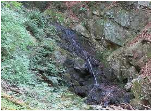
下りきるとベンチから落差7m程の滝を見る。