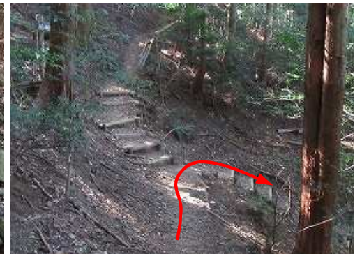
分岐Eに出会い、右へ下る。