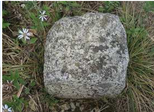
一等三角点:福智山が明治22年に選点されている。