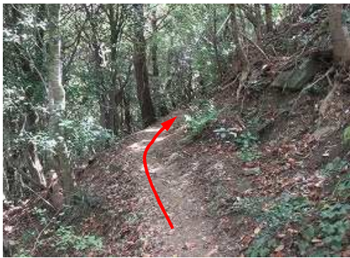
一休みして引き返す。