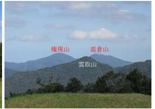
鷹取山から北の展望。