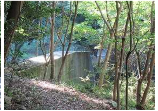
砂防ダムを見送る。