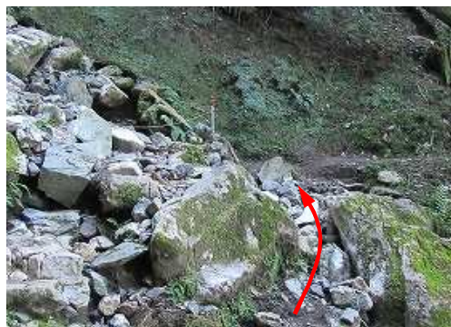
涸れた沢のガレ場を 渡渉 する。