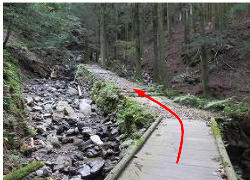
橋を渡り、沢の中州を上って行く。