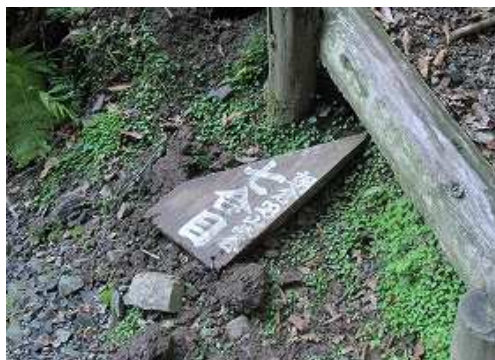
地表に七合目の案内板を見る。