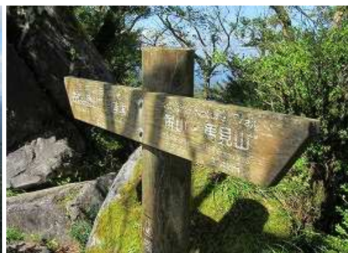
古処山山頂部の標柱。