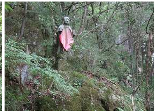
左斜面の上部に赤い前掛けをかけた石仏を見る。