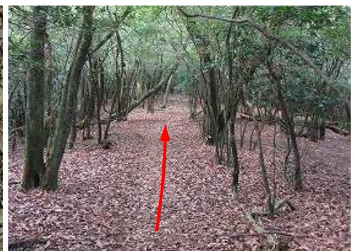
一息ついて引き返す。