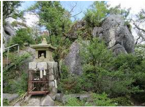
白山権現が祀られている。