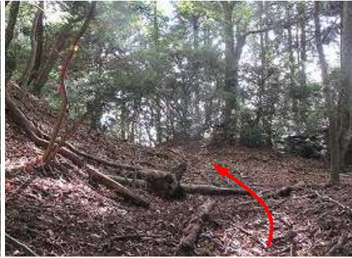
尾根上の水舟分岐に出会う。