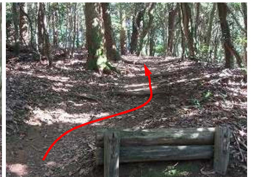
丸太階段が終わった。