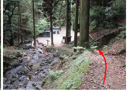
右岸沿いに下って行く。