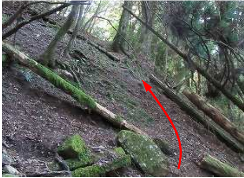
水舟から南へ斜面を巻くように斜上して行く。