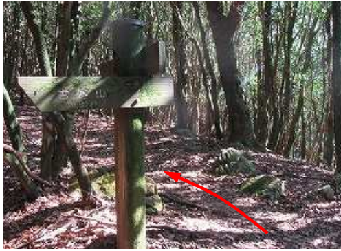
左に直角に折れて進む。