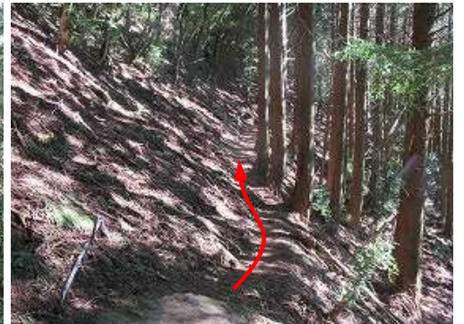
右斜面にヒノキ植林を見る。