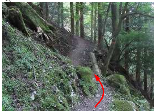
右方向に山腹を巻いて行く。