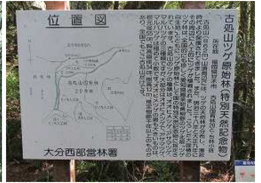
ツゲ林入口に立つ案内板。