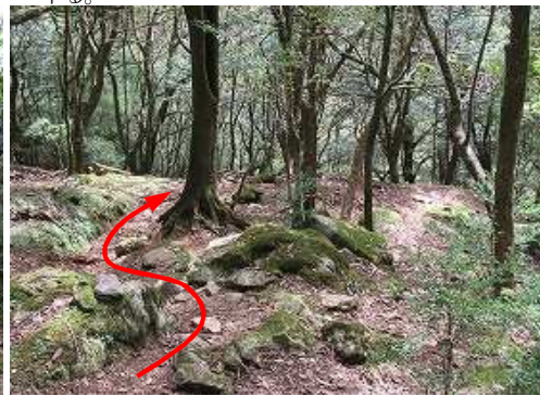
登山道に合流し、下って行く。