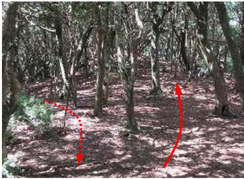
ツゲ林分岐を左に見送る。