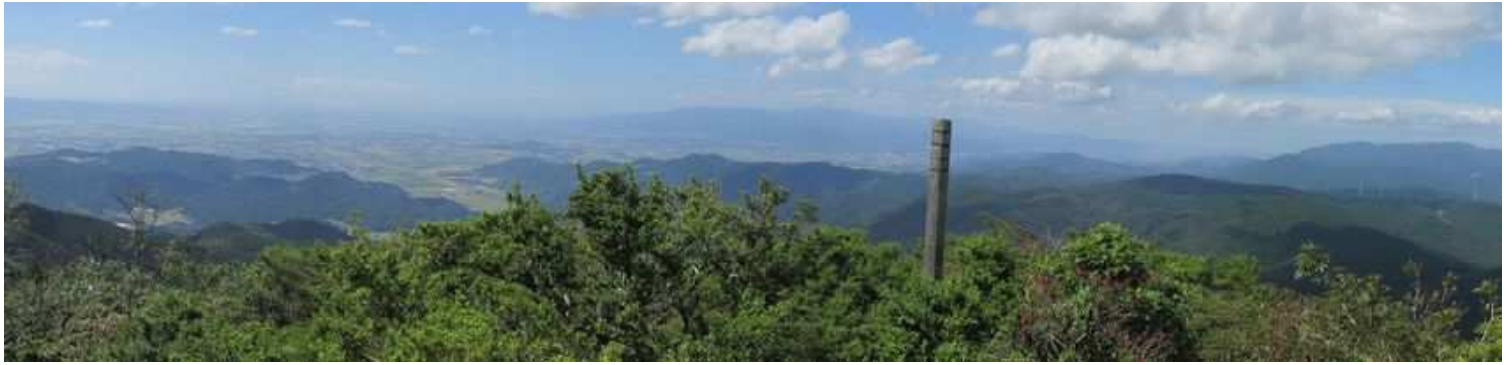
展望岩から南西を望む。