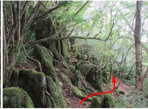
露岩尾根の北側に行く。