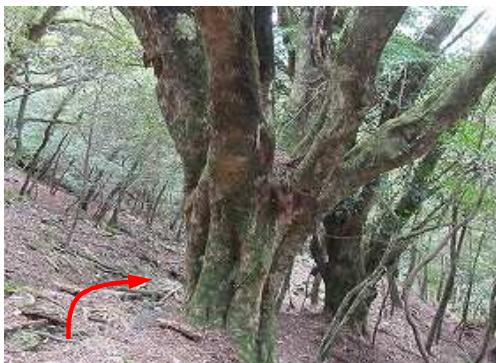
大カエデの左を通過する。