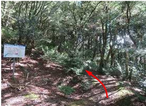
東側のツゲ林へ入る。