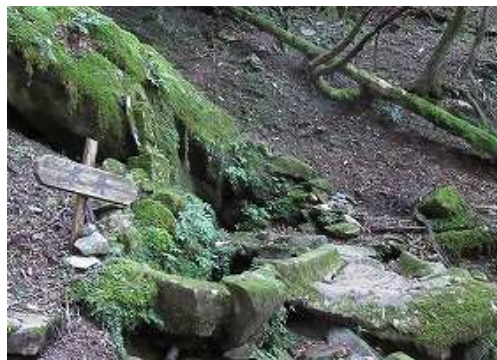
チョロチョロ水となった 水舟 に到着。