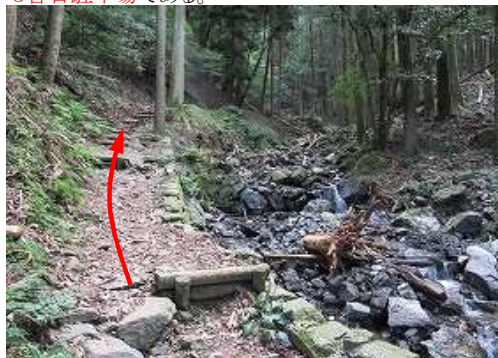
右岸沿いに上って行く。