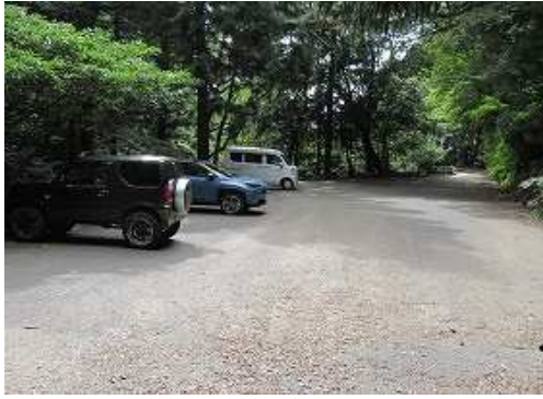
5合目駐車場に帰り着いた。