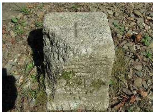
三等三角点: 桶底が明治30年に選点されている。