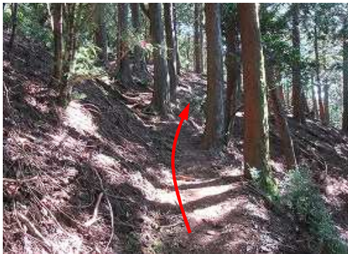
スギ植林と変わり、緩く上って行く。