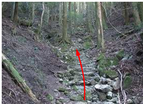
石段を上って行く。