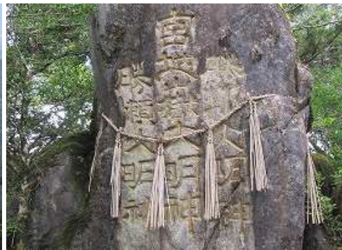
尾根筋を西へ向かうと宮地獄大明神に出会い、南へ下る。