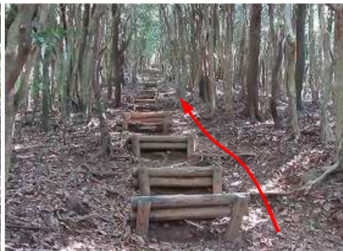
長い(40m)丸太階段を上って行く。