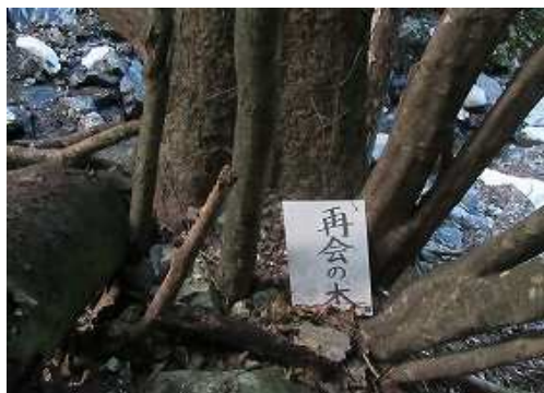
樹木の根元に「再会の木」と書かれた案内板を見る。