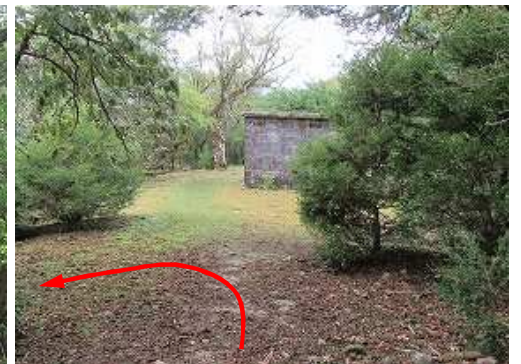
馬攻場の平坦地を下る。