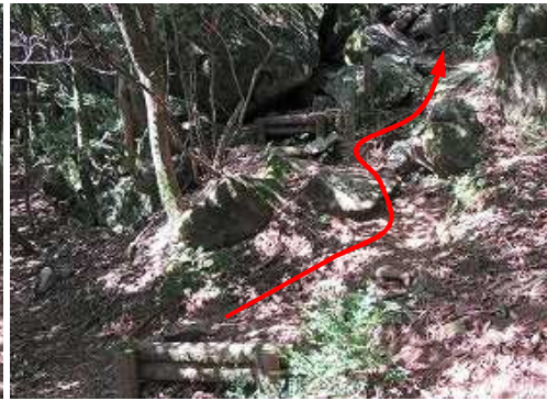
急な丸太階段を上って行く。