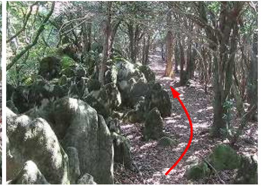
石灰岩の露岩尾根を行く。