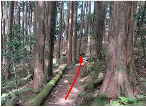
ヒノキ植林地を抜ける。