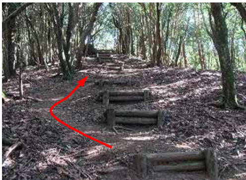
短い丸太階段を上って行く。