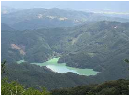
南南東の眼下にエメラルドグリーンの江川ダムを見下ろす。