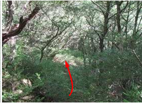
ツゲを掻き分け北へ向かう。