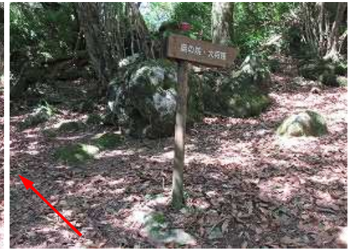
奥の院分岐を右に見送る。