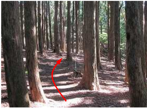
ヒノキ植林地を抜ける。