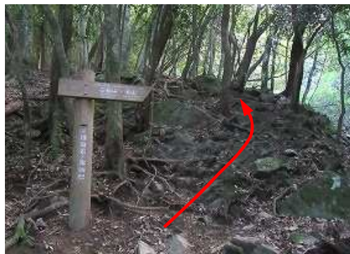
右岸のやや急な斜面に取付く。