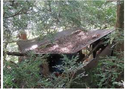
東側にタン小屋が残る。