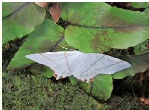
コガタツバメエダシャク