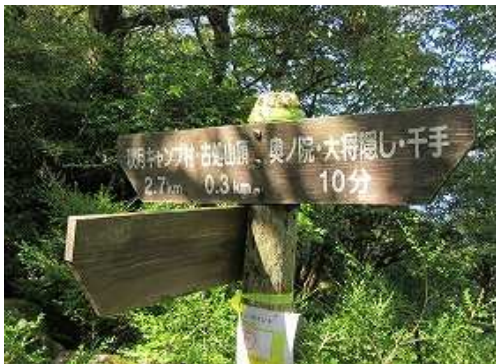
奥の院分岐を右に見送る。