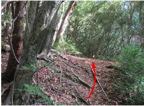
尾根筋を北へ向かう。