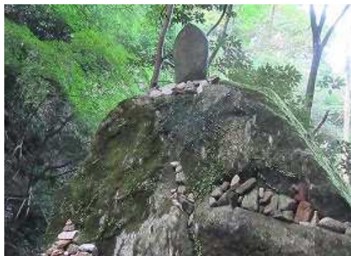
大岩の上に十一面観世音が祀られた牛巖。