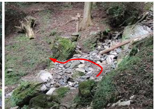
ガレ沢を渡渉する。