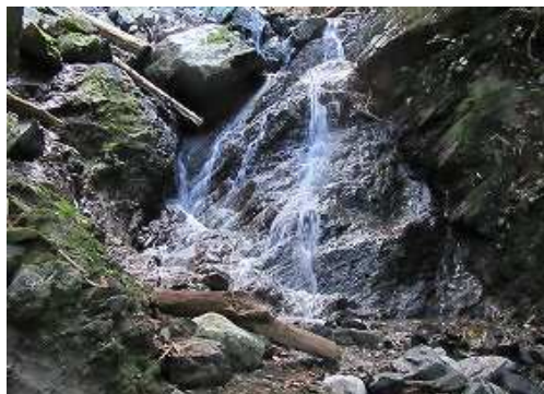
落差3m程の 小滝 を見る。