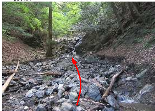
度重なる豪雨により、沢の様子は一変している。