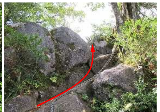
西側の展望岩へとクサリを伝う。