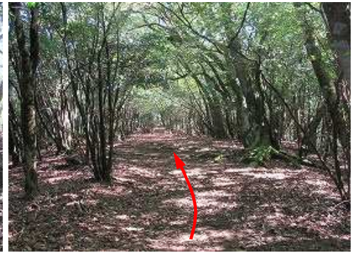
鈍頂の尾根筋を行く。