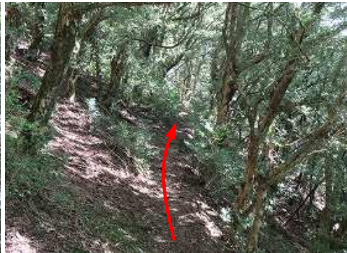
ツゲ原始林の平坦路に行く。