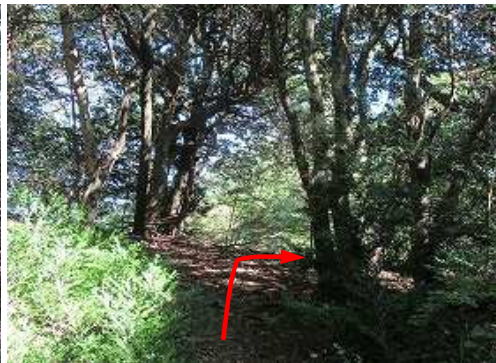
縦走路に合流し、右折する。