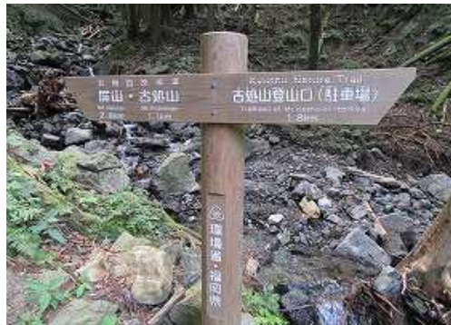
沢側に標柱が立ち、屏山2.8km・古処山1.1kmと書いてある。