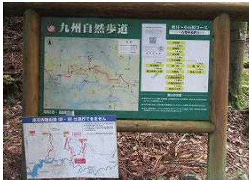
九州自然歩道の案内板が立つ。