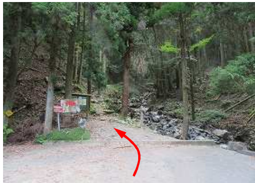
国道322号八丁峠近くの古処林道に入り、終点が 5合目駐車場 である。

5合目駐車場→水舟→ツグ林入口→縦走路合流→ 屏山(927m) → 古処山(859m) →馬攻場→水舟→5合目駐車場