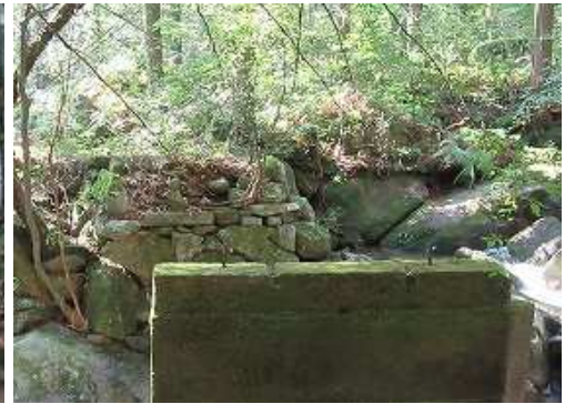
左岸から見た橋脚。