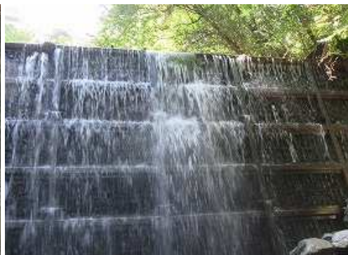
高さ7mのスリットダムが現れ、左岸を高巻く。