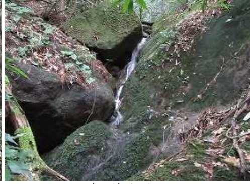
5mの細い滝が見えている。