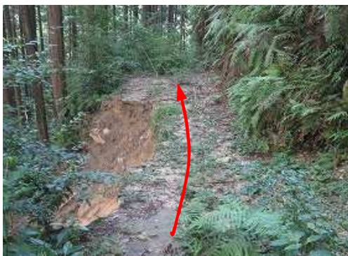
作業路が崩落している。