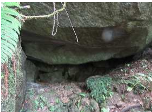
その上部に大岩の岩屋を見て、左を巻いて沢へ戻る。