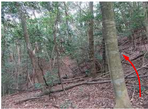
東側の尾根筋へ向かう。