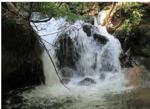
弱いカマを持つ2mは左岸を巻く。