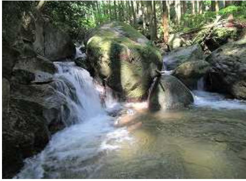
釜を持つ2mを越える。