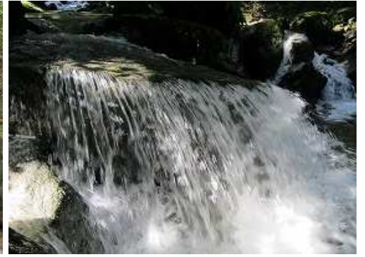
1mすだれは左岸を抜ける。