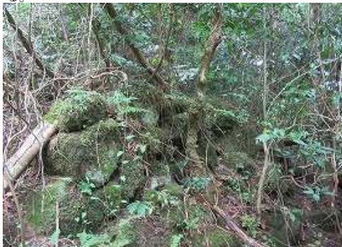
ヤブに埋もれるように苔むす石積と炭焼窯跡を見る。