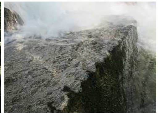
流れの中に石切痕が残る花崗岩の大岩を見る。