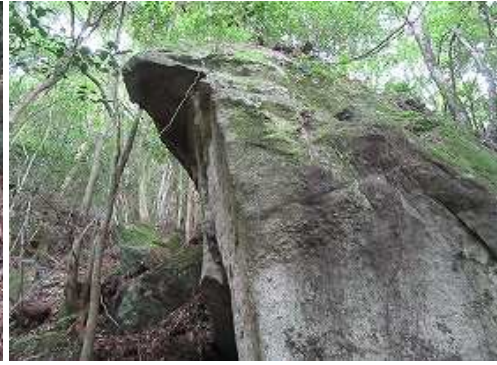
ヒサシ岩の所から沢へ下る。