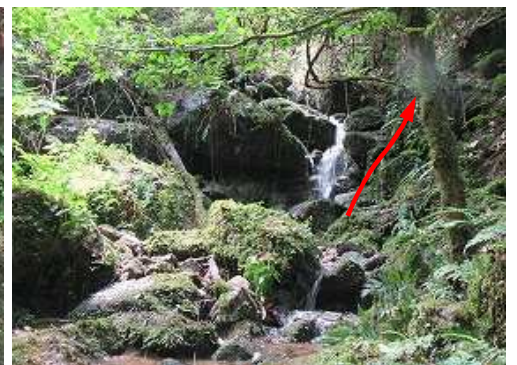
苔むす岩が増え2mの奥が小枝で塞がれており、左岸を巻く。