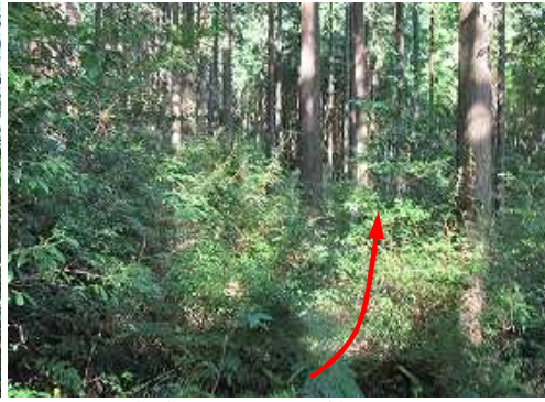
作業路から北へヒノキ植林を下る。