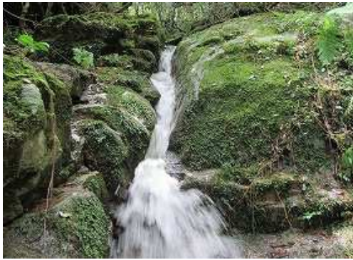
5mトコも流心を遡る。