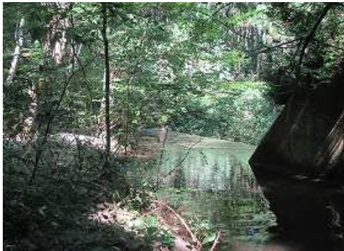
右岸から砂防ダムへ降り立つ。