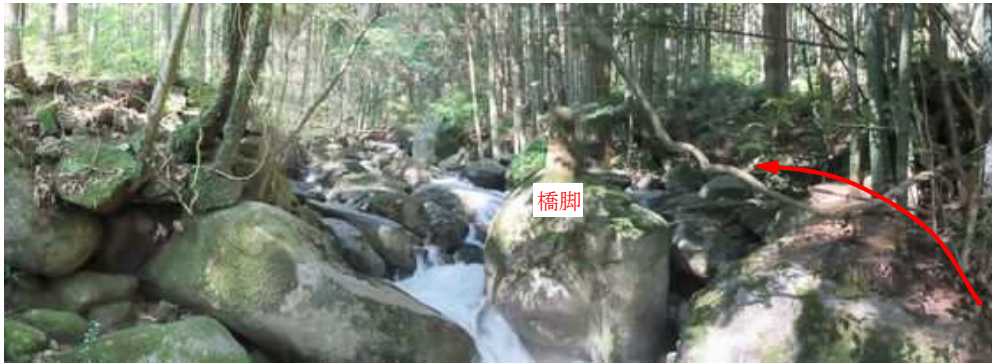
取付いた作業路は昔、対岸へ橋が架かっており橋脚が残っていた。