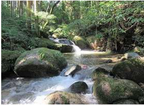
緩やかに遡って行く。