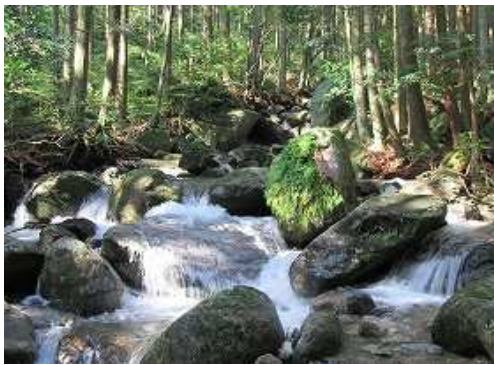
明るい沢を遡って行く。