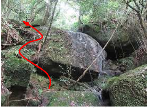
水量の少ない3mは右岸を巻く。