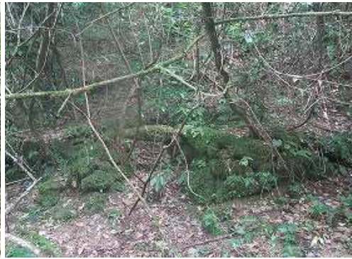
右岸に残る炭焼窯跡。