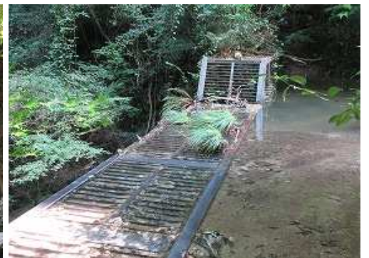
スリットダムの天端。