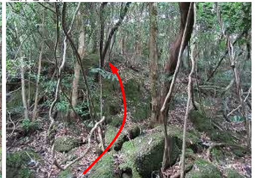
斜面を少し上り、沢へ戻る。