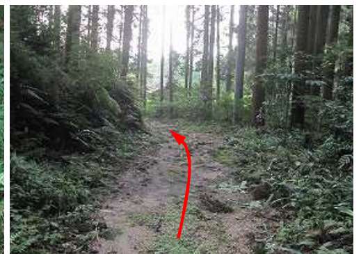
北へ向け下って行く。