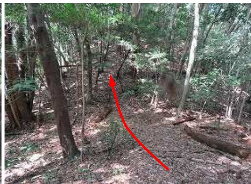
弱いコルに出会う。