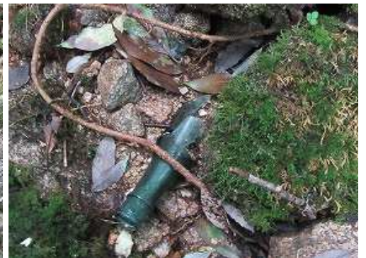
斜面に割れた一升瓶を見る。