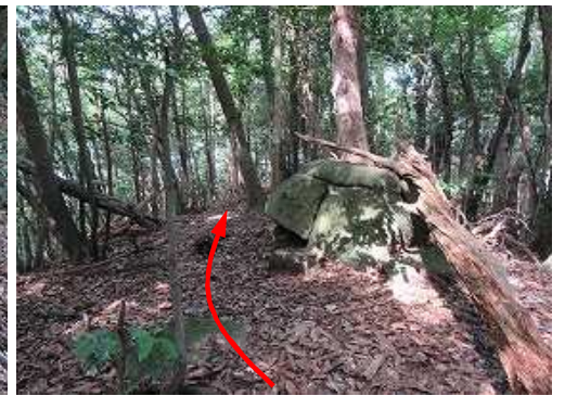
尾根筋のピークを越える。