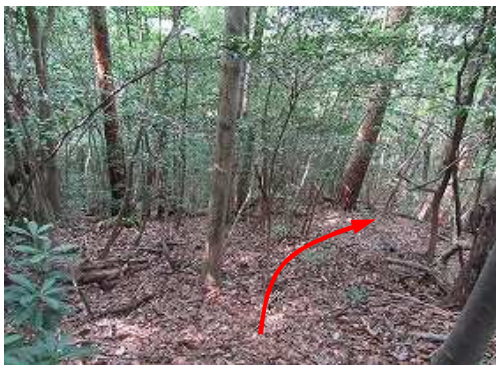
雑木斜面を下って行く。