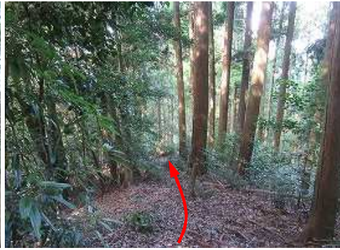
ヒノキ植林斜面を下って行く。