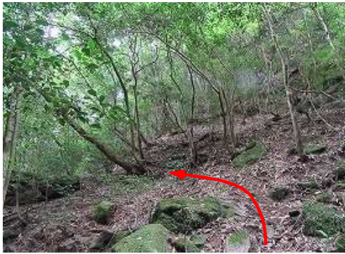
右岸斜面を上って行く。