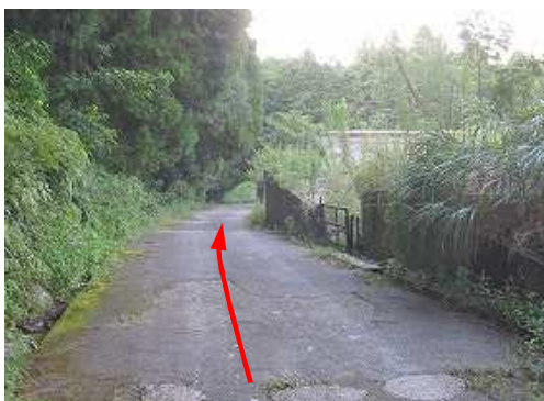
舗装路を緩く下って行く。