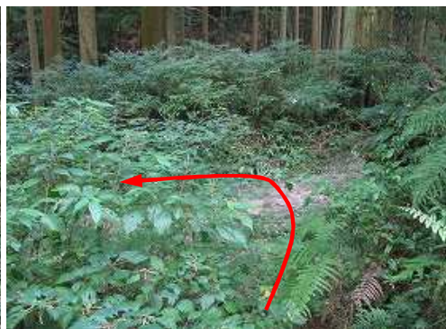
作業路入口に下る。