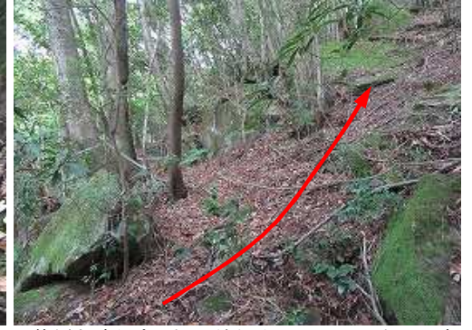
位置を確認すると、西側の沢に入っていたので東側の斜面に取付く。