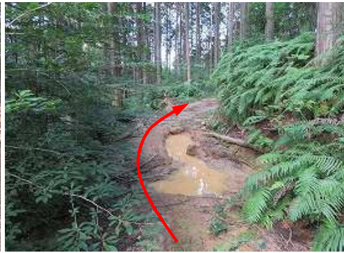
ヌタ場を通過する。