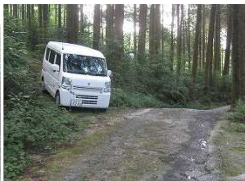
取付きに帰り着いた。