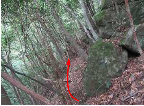
急傾斜の獣道をトラバースする。