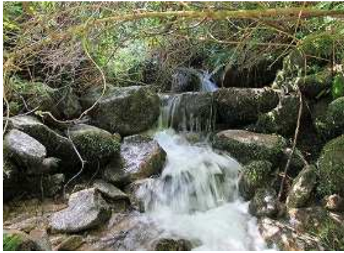
左俣は取付きからヤブを掻き分けて遡る。