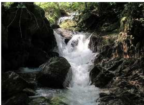
弱いゴルジュを越える。