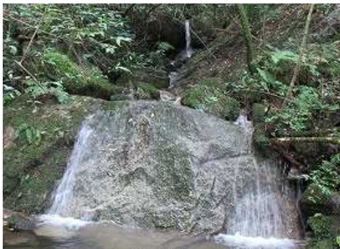
大岩を落ちる1mは左岸を巻く。奥に3mが見える。