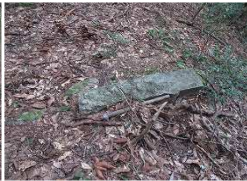
尾根筋に横向山杭を見る。