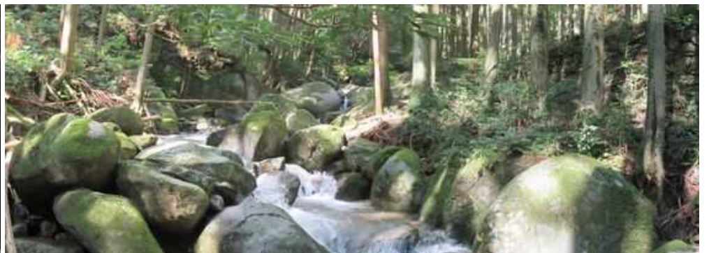
左岸に石積が続く平坦地形にヒノキが植林されている。