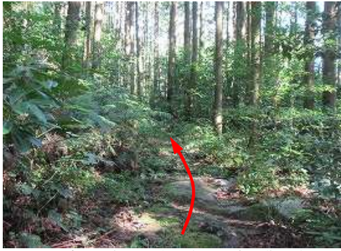
那珂川市中ノ島公園先で右折し猿山集落奥の作業路入口に駐車し取付き奥へ向かう。

取付き→入溪地→砂防ダム→スリットダム→二俣→ヒサシ岩→横向山杭→P440→作業路出合→作業路入口→取付き