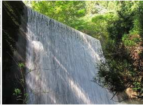
高さ10m程の砂防ダムに出会う。