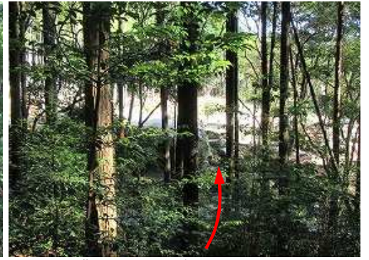
灌木を分けると猿山川が見えた。