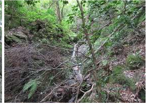
倒木の奥に3mを見るが、此処で切り上げる。