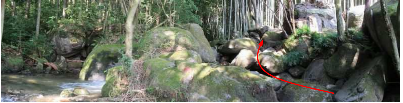
猿山川の入溪地で中央の露岩に赤いマーキングを見る。