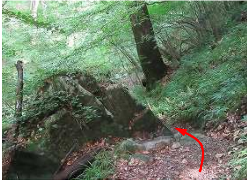
三角岩を通過する。