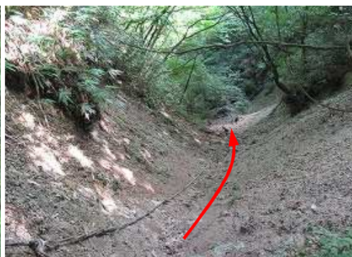
車谷源流部の泥ガリーを下る。