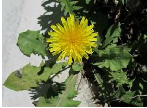
セイヨウタンポポ