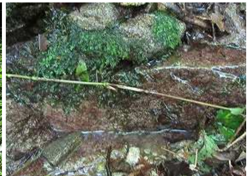
右俣の源流で、此処から流れ始めている。