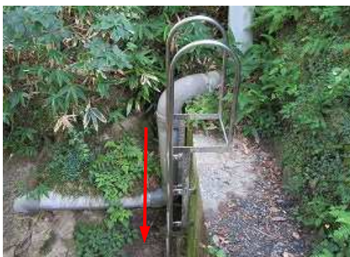
ステンレス製梯子を下る。