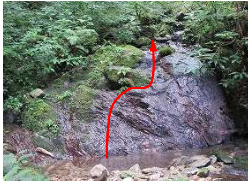
1m斜滝は直登して越える。