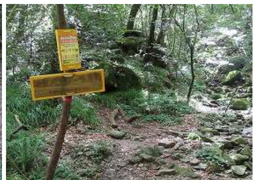
マンサク谷の案内板を通過する。