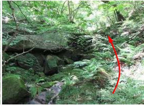
左岸側に弱い踏跡が延びている。