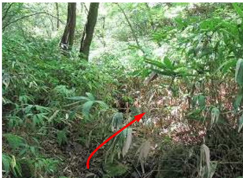
ササを分け沢筋を遡る。