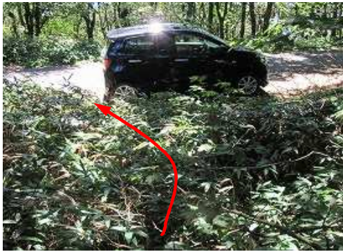
連絡道路に出会う。