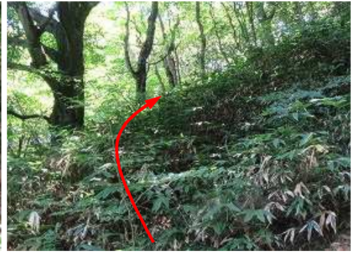
ササを分けて斜上する。