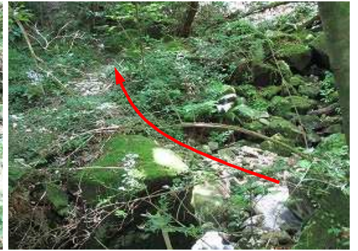
左岸から右岸へ渡渉する。