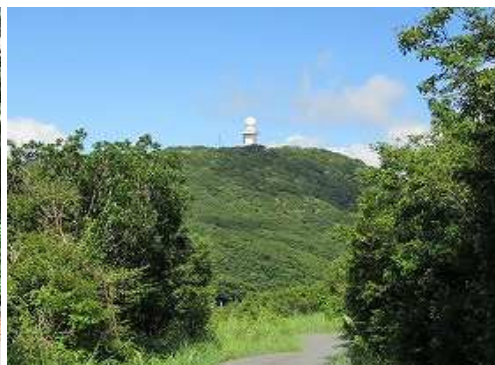
気象レーダー観測所が見えた。