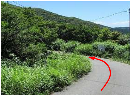
矢筈峠を通過する。