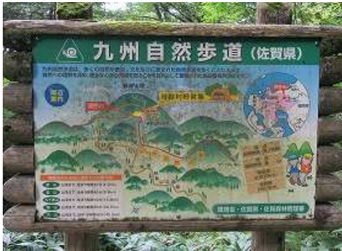
直ぐに九州自然歩道の案内板を見る。