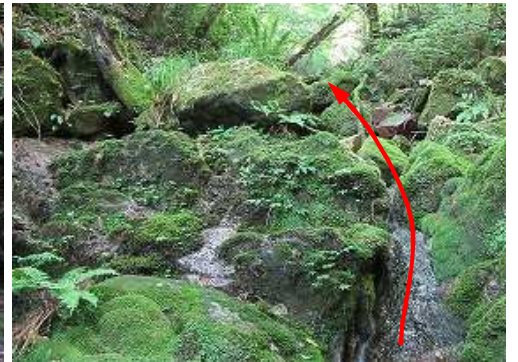
水量が減り苔むすゴースト沢に行く。