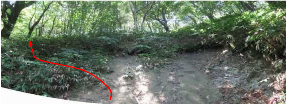
上部に泥壁が現れ、左へ斜上する。