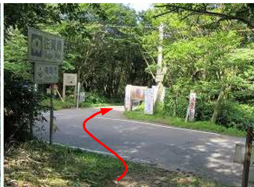
道路を横断し 連絡道路へ入る。