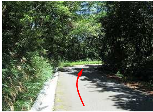
道なりに緩く下って行く。