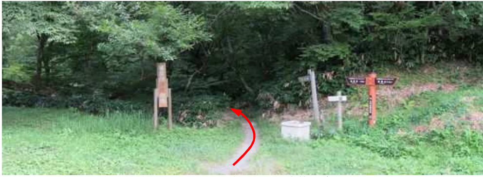
駐車場西下の 広場 の木陰に駐車し、自然歩道へ入る。