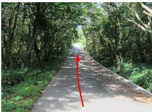
道路を道なりに進む。