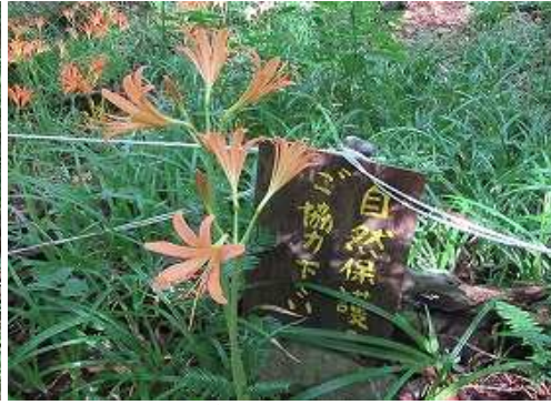
保護区を通過する。