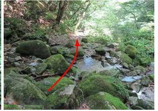
右岸から左岸へ渡渉する。