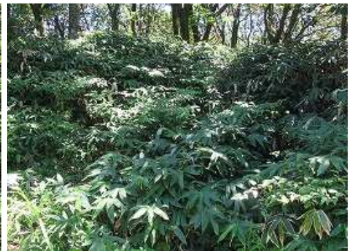
脇道は行止りで引き返す。