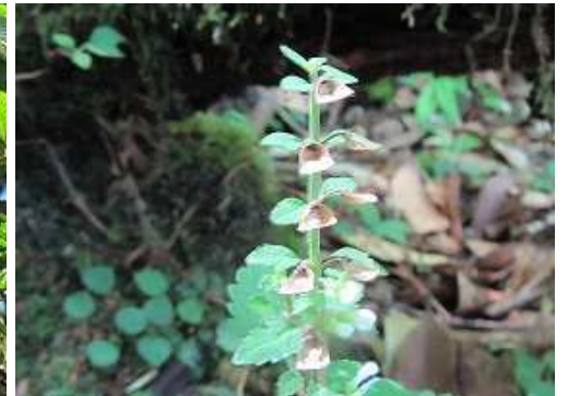
タツナミソウ 花後