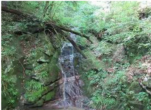
河床に下り、5m滝を見る。滑るので左岸を高巻く。