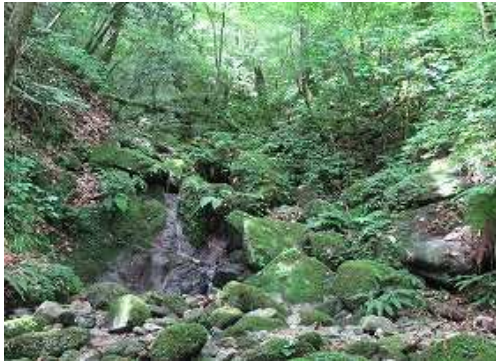
出合から見た右俣。左岸側の踏跡から取付く。