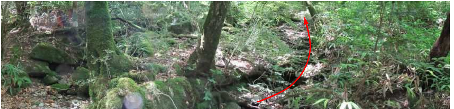
潤沢となり沢筋が狭くなる。