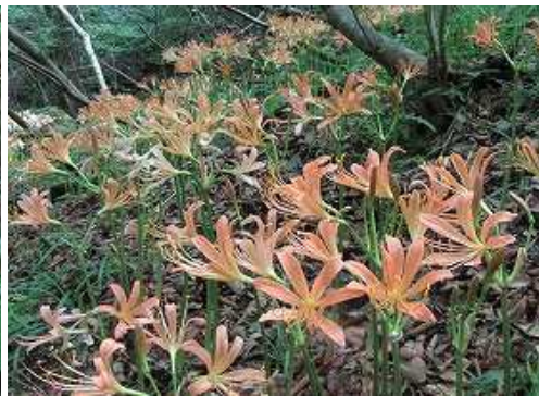
オオキツネノカミソリ