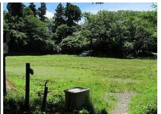
広場へ帰り着いた。