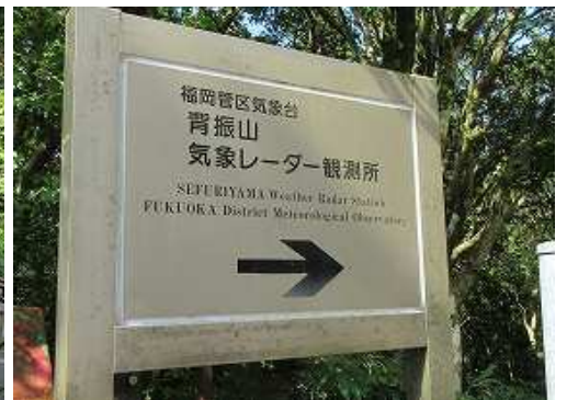
連絡道路入口左に立つ案内板。