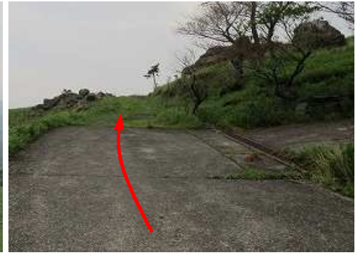
資材路分岐に出会い、直進する。