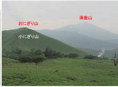
振り返ると涌蓋山が霞んでいた。