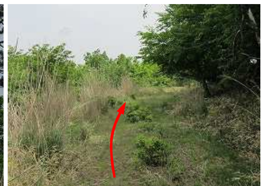
林道を北に向け進む。