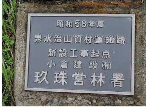
資材路入口左端の工事銘板。