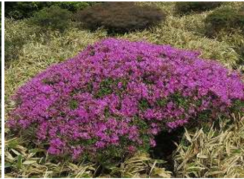
今年最高のミヤマキリシマ。