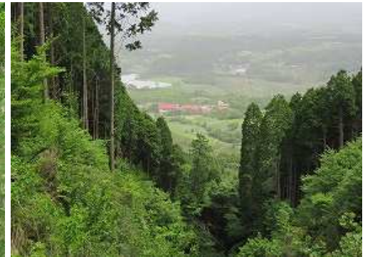
下方に九重青少年の家を見下ろす。