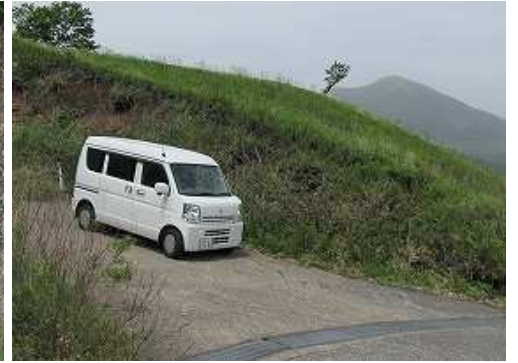
駐車地に降り着いた。