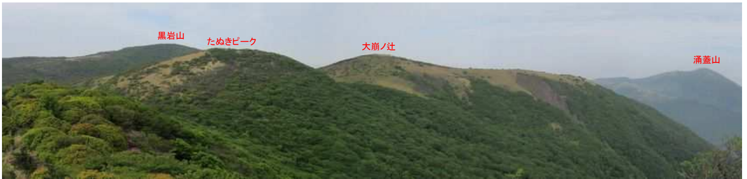
上泉水山から西南西を望む。