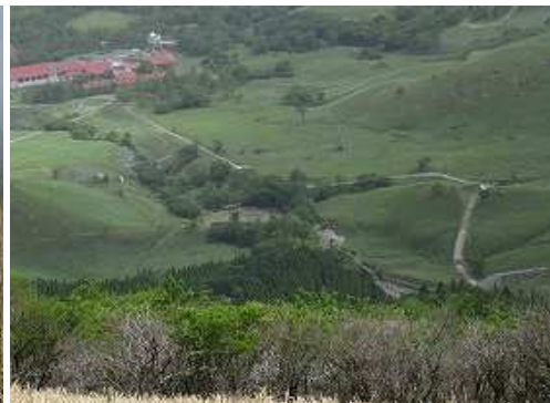
北に九重青少年の家を見下ろす。