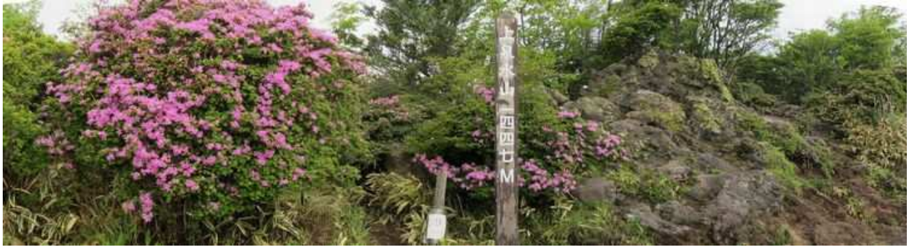
尾根筋にある上泉水山(1447m)の山頂。