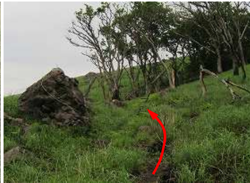
緩やかに牧野を上って行く。