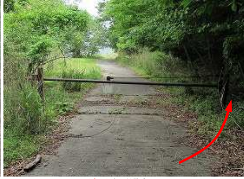
ゲートを通過する。