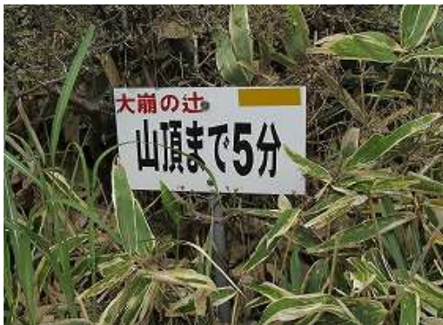
斜面を上って行くと山頂まで5分の案内板を見る。