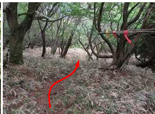
傾斜が緩んできた。