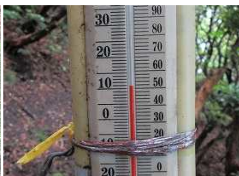
傍の寒暖計は11°Cを示していた。