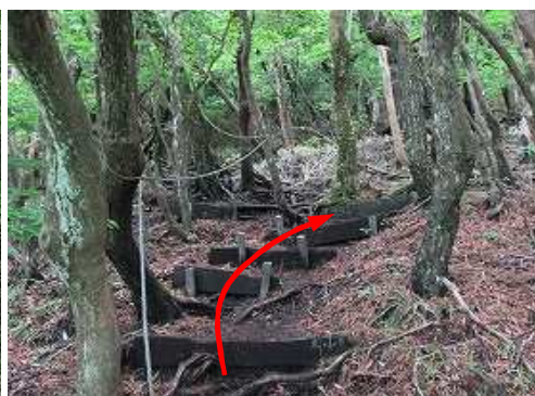
板階段を緩やかに上って行く。