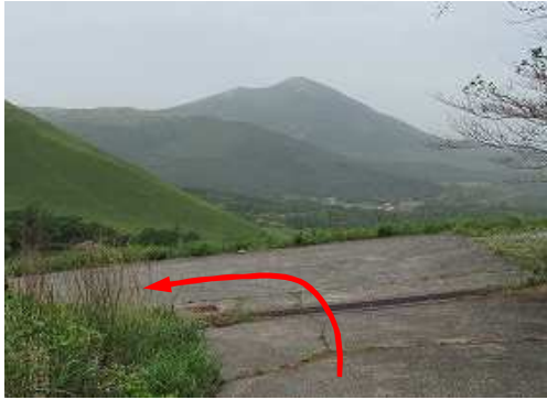
資材路分岐に出会い左折する。