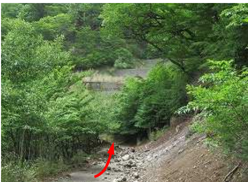
砂防ダム が見えた。