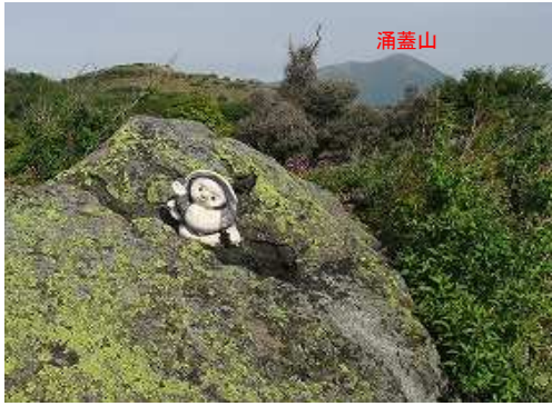
たぬきピーク(1460m)の狸の置物。