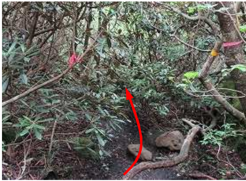
シャクナゲ林を下る。