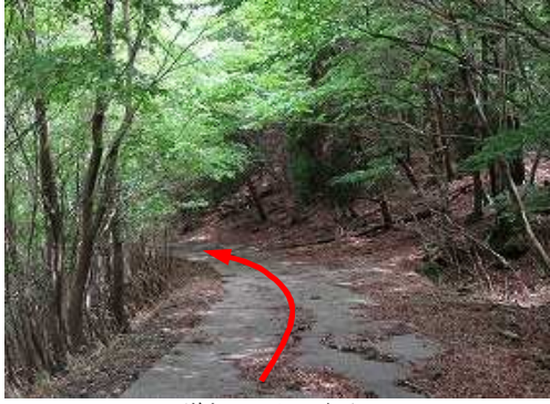
道なりに下って行く。