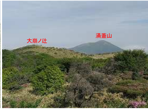
たぬきピークからの涌蓋山。