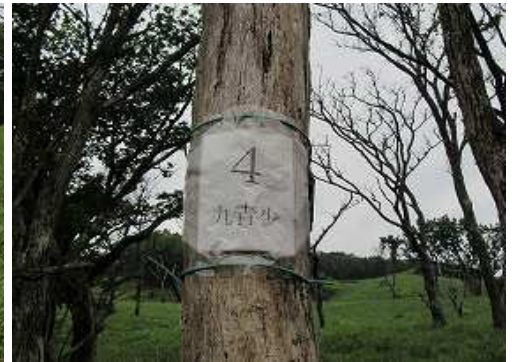
幹に九青少4の表示を見る。