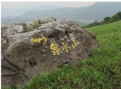
岩に泉水山を通過する。