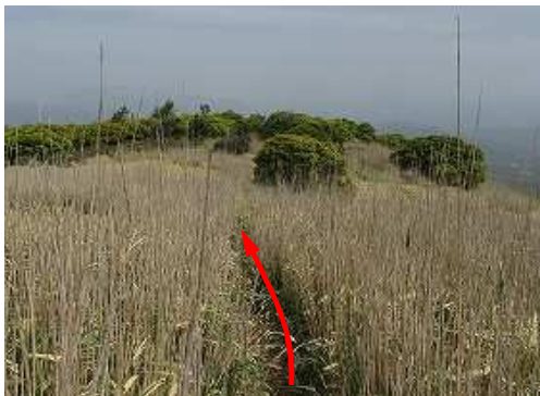
スズタケ帯に行く。