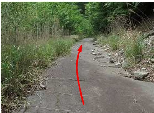
路面が アスファルト舗装路 に変わった。