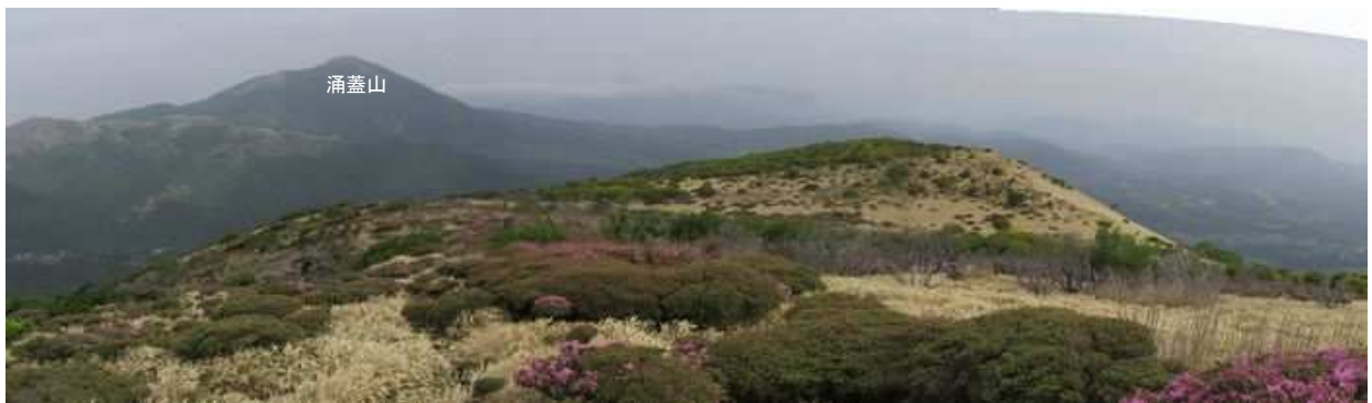
大崩ノ辻から涌蓋山を望む斜面のミヤマキリシマは裏年の様で少ない。