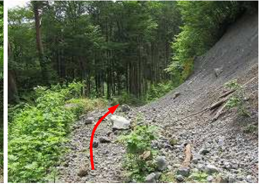
小さな 法面崩落 を通過する。