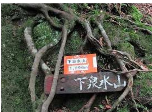
下泉水山(1296m)の山名板を見る。