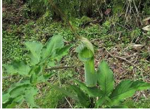
ツクシマムシグサ