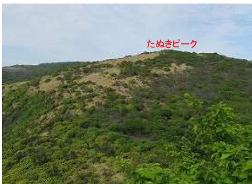
縦走路からたぬきピークを望む。