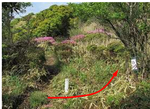
たぬきピーク分岐からササの斜面を上って行く。