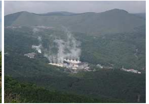
西に八丁原地熱発電所を見下ろす。