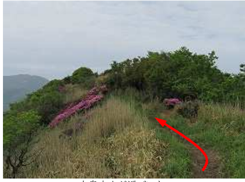
上泉水山が近づいた。