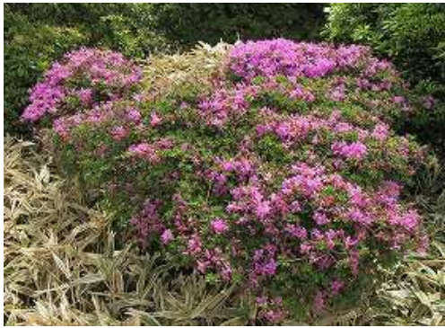
まばらに咲くミヤマキリシマ。