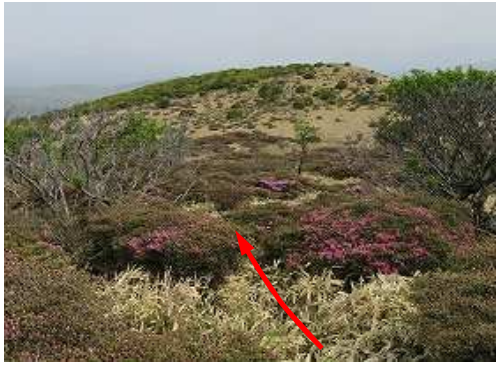
一息ついて北へ下る。