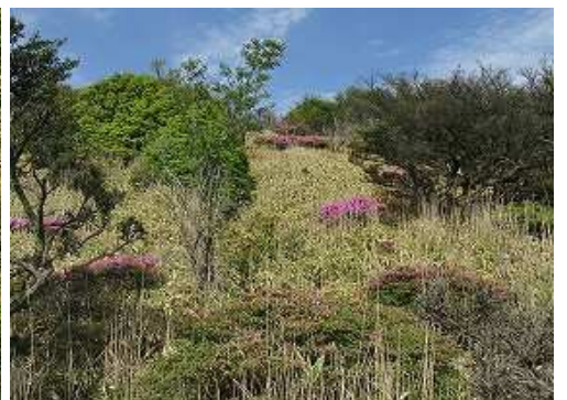
コザサ斜面を登って行く。