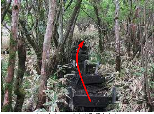
上泉水山への急な板階段を上る。