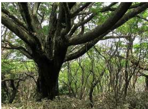
多幹木の右脇を抜ける。