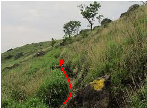
岩にマーキングされた黄色を辿る。