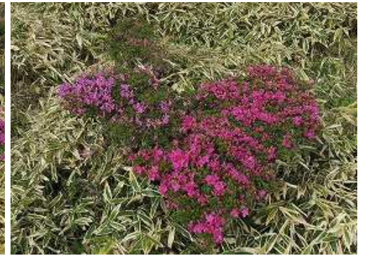
淡紅色と濃紅色のミヤマキリシマ。