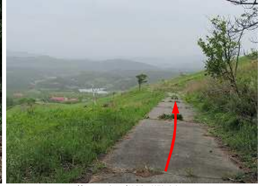
牧野に出て視界が開けた。