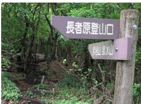
この案内板から山中に入る。