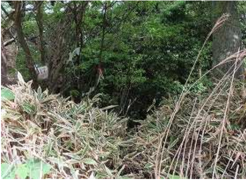
林道分れ の降り口。