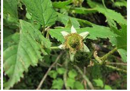
ナガバモミジイチゴ 実