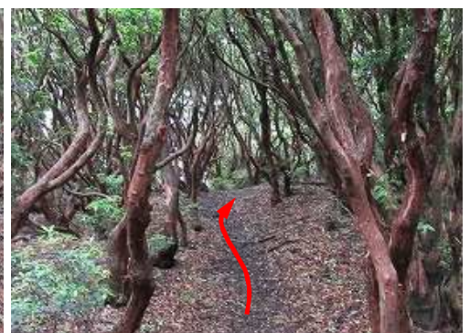
アセビ林のトンネルを抜ける。