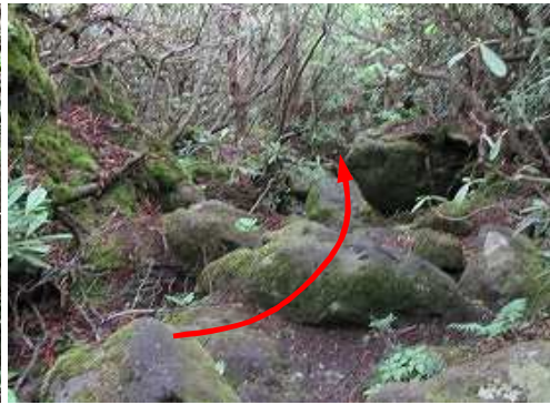
シャクナゲ谷の岩は滑りやすい。