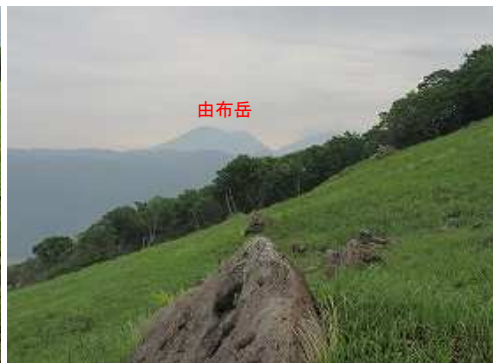
北東に由布岳が望まれた。