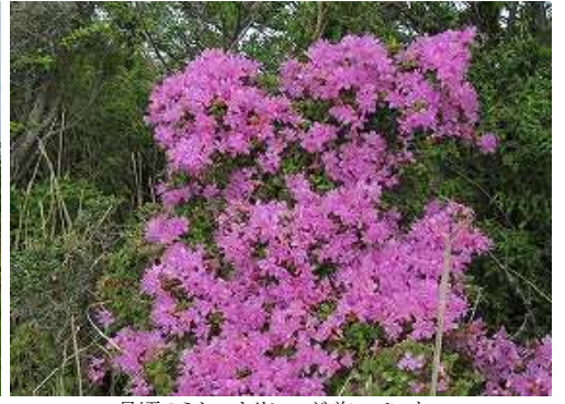
見頃のミヤマキリシマが咲いていた。