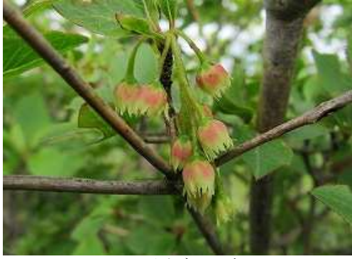
ツクシドウダンツツジ