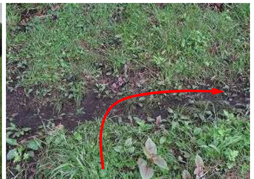
草原を上り詰め縦走路に合流する。