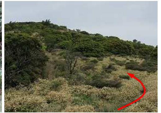
シャクナゲ谷を抜け出る。