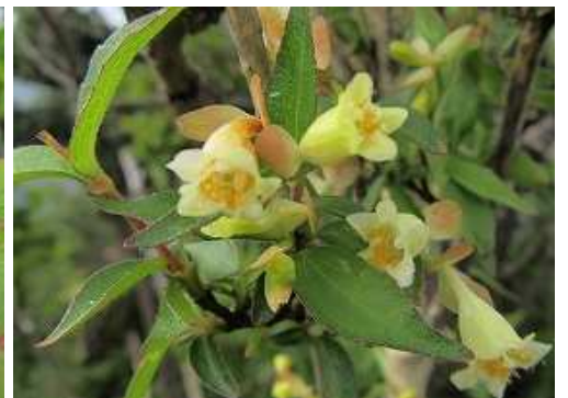
コツクバネウツギ