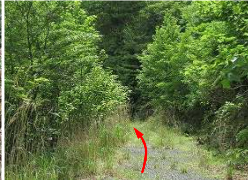
道なりに 林道 を進む。