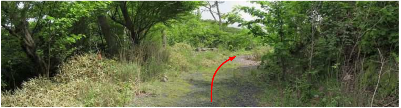
左の 林道分れ に出会うが、今回は直進する。