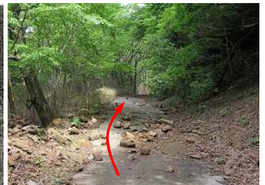
資材路 に出会い、下って行く。