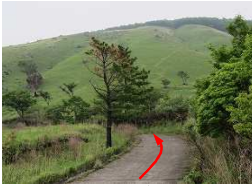
駐車地から緩やかに林道を上って行く。

駐車地→縦走路合流→下泉水山(1296m)→上泉水山(1447m)→たぬきピーク(1460m)→大崩ノ辻(1458m) →林道出合→林道分れ→砂防ダム→ゲート→駐車地