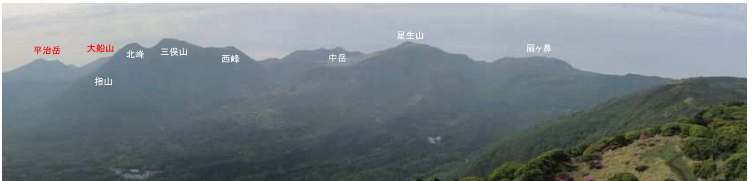
上泉水山から南東に九重連山を望む。