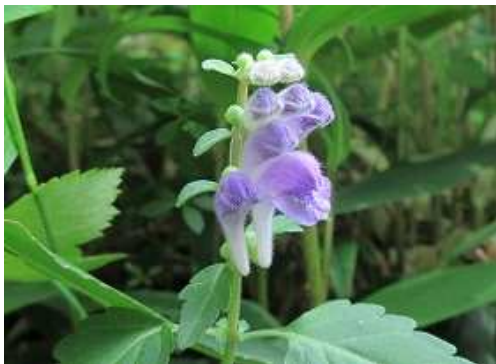
ツクシタツナミノ