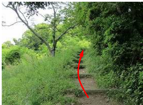
擬木階段を緩く上って行く。