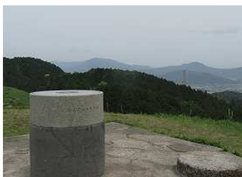
展望台から宝満山方面を望む。