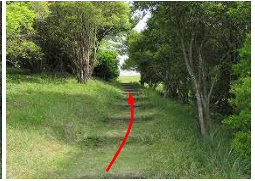
擬木階段を緩く上って行く。