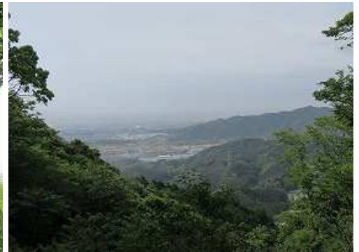
東屋から久留米方面を望む。