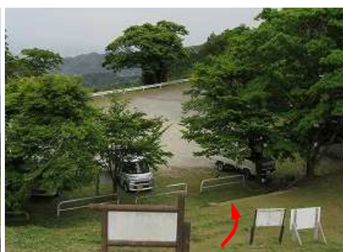
山頂部を周回し、草スキー場を下り山頂駐車場へ戻った。