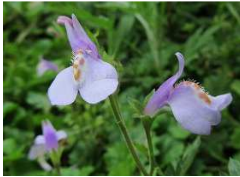
ムラサキサギゴケ