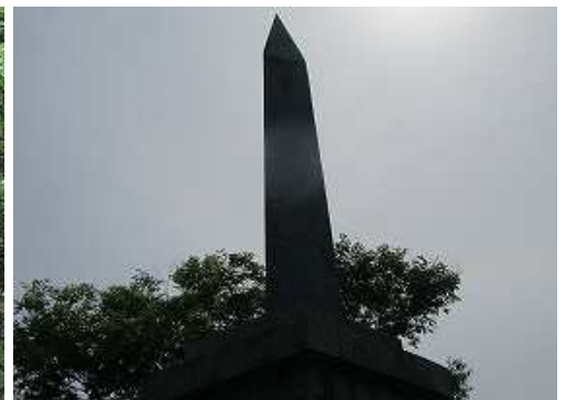
天智天皇欽仰之碑を見上げる。