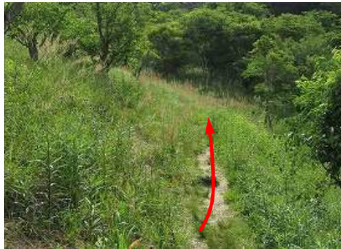
緩やかに斜面を上って行く。