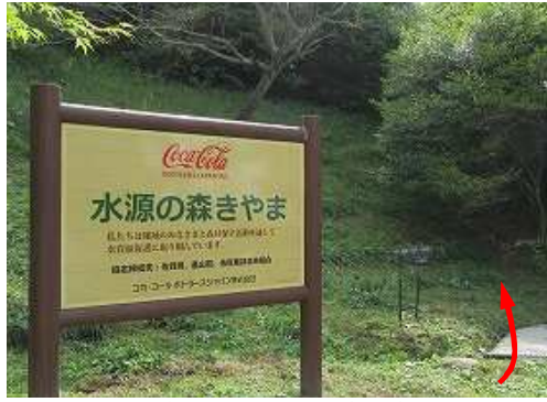
山頂駐車場に車を止め、奥へ進む。