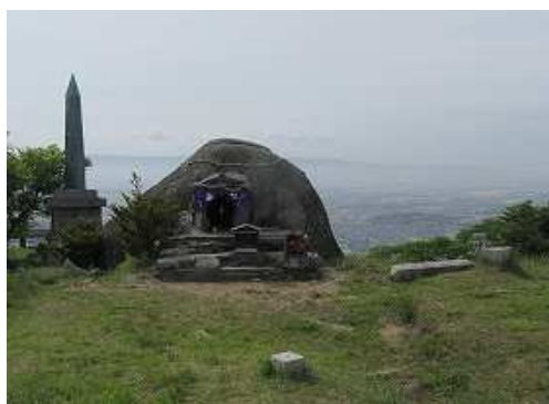
基山(404m)の一等三角点:防住山と壘々石。