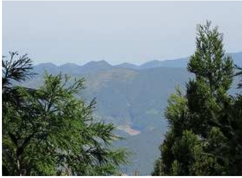
開けた所から北の山並みが望まれた。