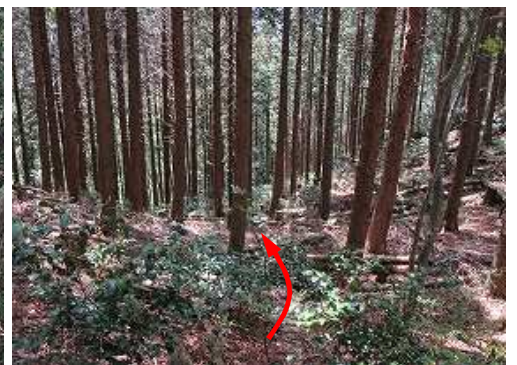
西側下の作業路へ下る。