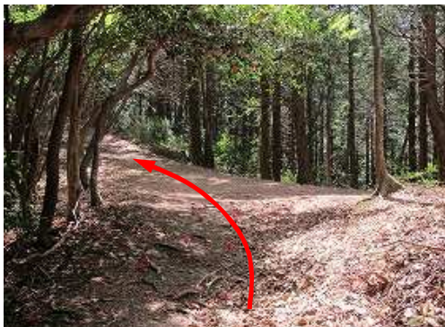
④ポイントの案内板を見る。