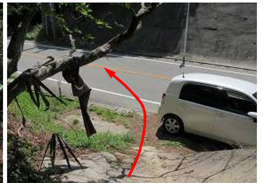
迂回路出口を出る。