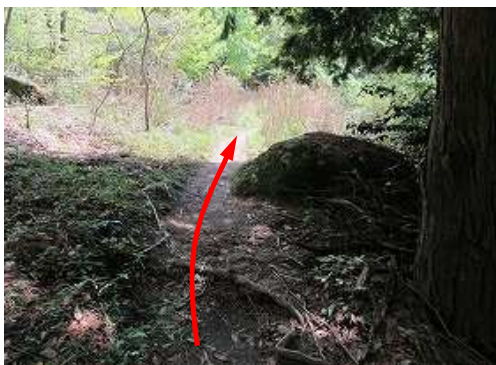
⑤ポイントの案内板を見る。