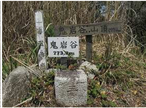
其処は、明治24年に埋標された一等三角点: 鬼岩谷(773.77m)であった。周囲を雑木で囲まれ展望は得られない。