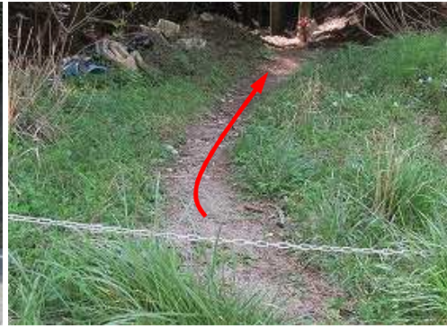
チェーンが張られた所が 東側取付き で、奥へ進む。