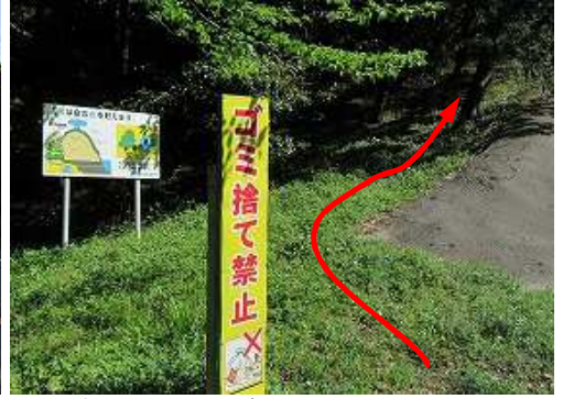
案内板はないが、踏跡があるので上って行く。