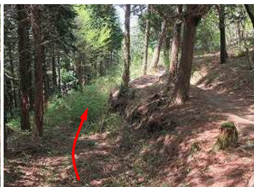
右上を縦走路が並走する。