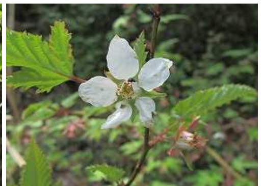
ナガバモミジイチゴ