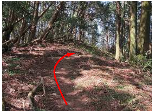
縦走路に引返し、緩く上って行く。