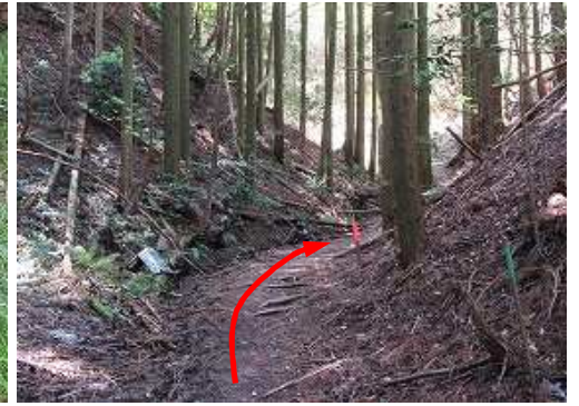
弱い沢沿いに奥へ進む。