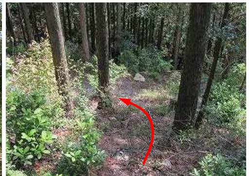
下に林道が見えた。