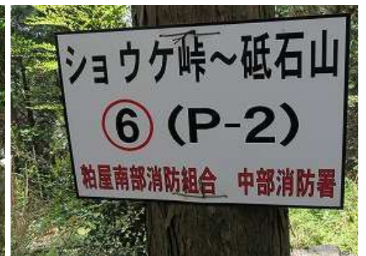
右に⑥ポイントの案内板を見る。