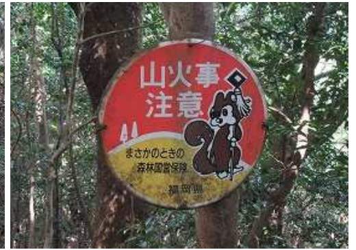
山火事注意の案内板を見る。