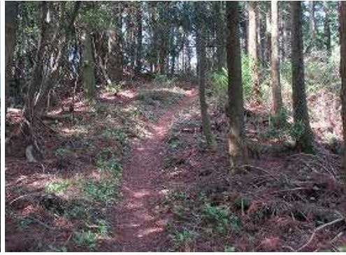
緩やかに上って行く。