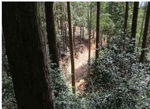
東の下に 作業路 を見る。