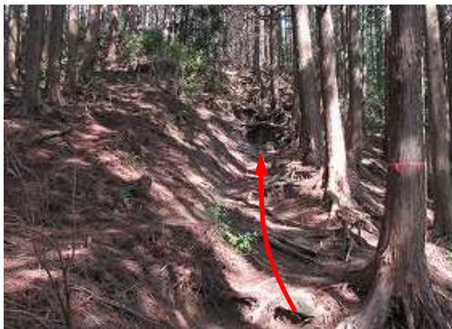
やや急な植林斜面を上って行く。