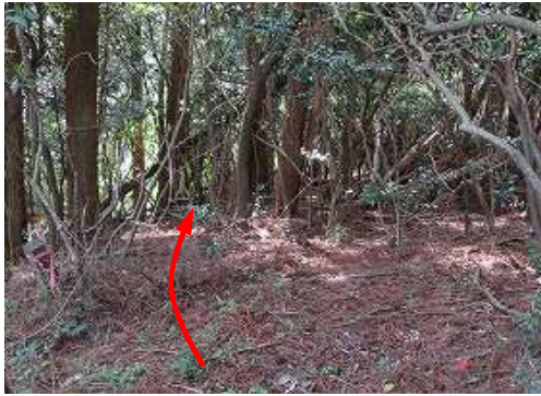
境界杭から南方向へ踏込む。