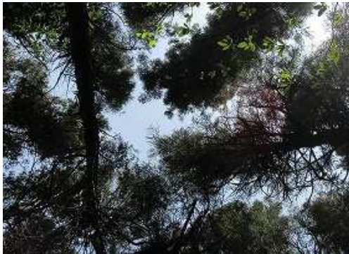
周囲を植林で囲まれ展望は得られない。