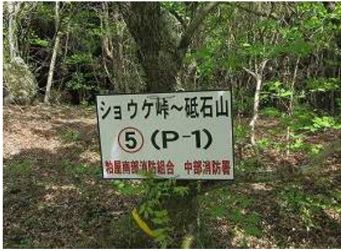
⑤ポイント案内板の所で合流する。