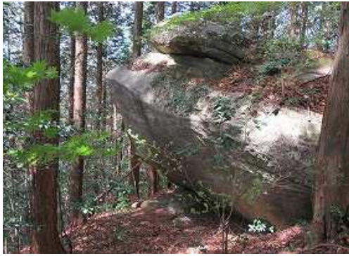
西側に岩屋を見る。