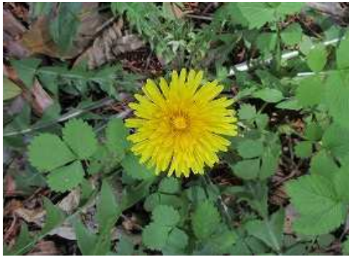
セイヨウタンポポ