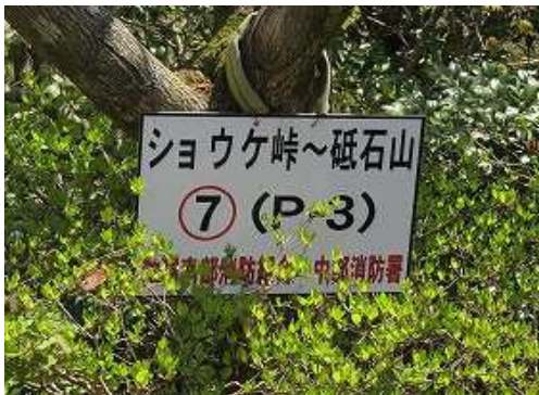
傍に⑦ポイントの案内板を見る。