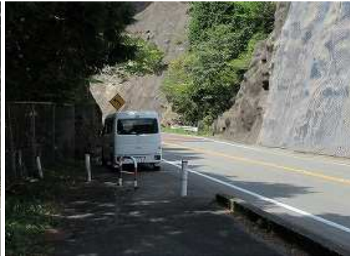
駐車地に帰り着いた。