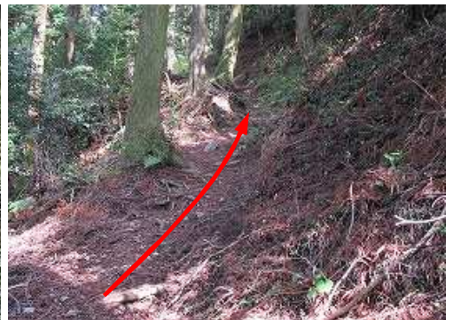
尾根筋の西側を斜上する。