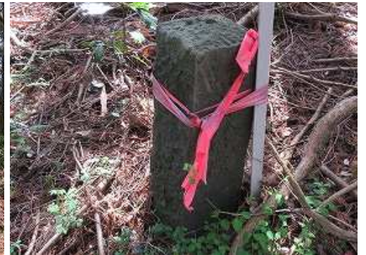
弱いピークに境界杭を見て、引き返す。