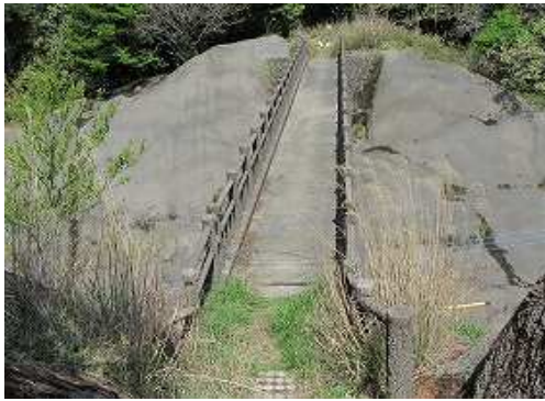
南側から見た歩道橋。