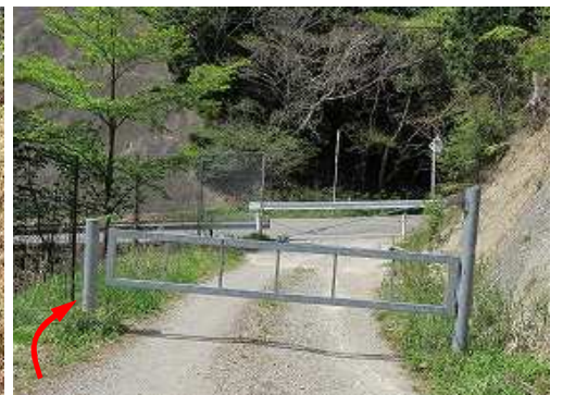
林道ゲートを開ける。