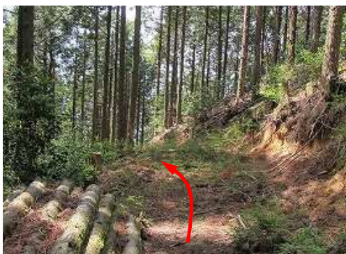
作業路に出合い、これを迎る。