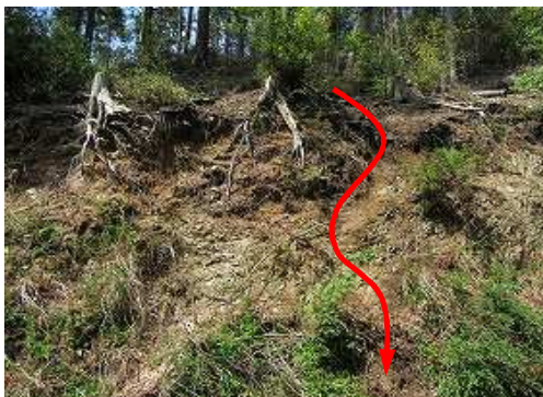
高さ2m程の崖を下る。