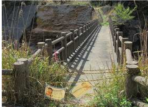
ショウケ越の歩道橋に出合くと、老朽化により通行止めとなっていた。