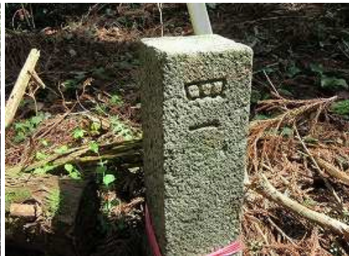
③ポイントを通過する。