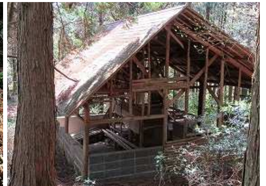
廃屋休憩所を通過する。