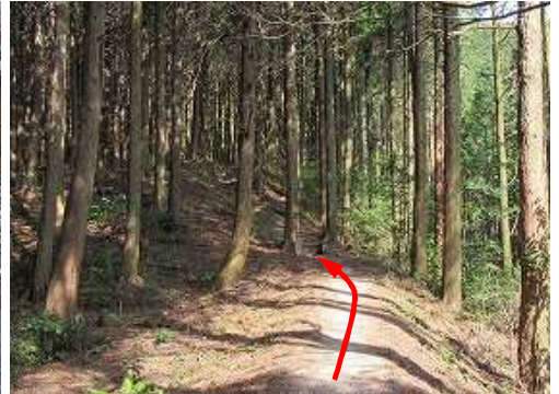
植林尾根を緩く上って行く。