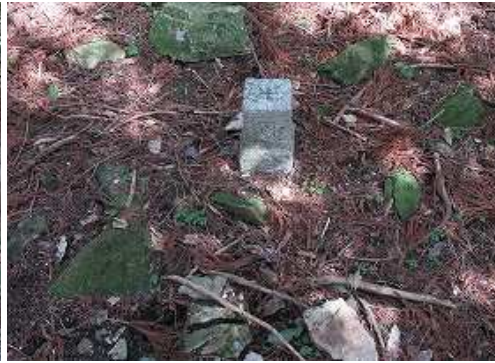
昭和44年に造標された四等三角点:鮎俣(621.20m)を見る。