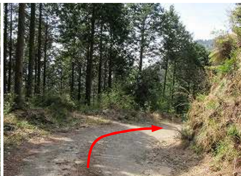
林道に出会い下る。