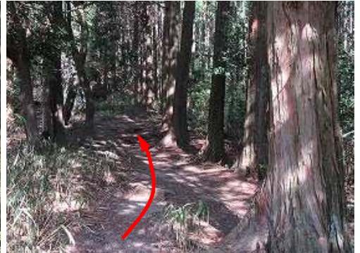
縦走路を北西へ向かう。