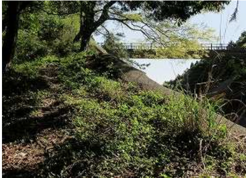
踏跡を緩やかに上って行く。