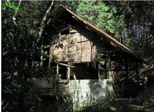
西側には 廃屋 化した 休憩所 があり、とても休める状態ではない。