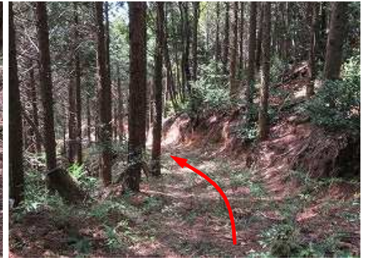
作業路に出会い、これを辿る。