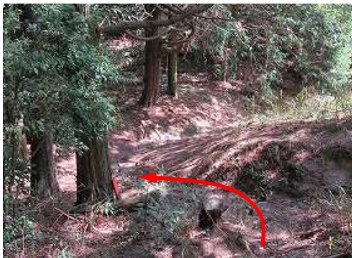
迂回路分岐から東側へ下る。