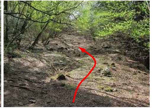
緩斜面を上って行く。