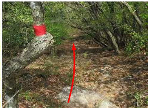
一休みして引き返す