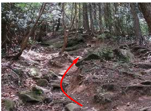
やや急な登りが現れた。