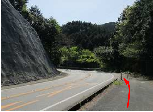
県道60号ショウケ越手前200mの下り線空き地に 駐車 し、ショウケ越へ向かう。

駐車地→取付き→ショウケ越→③ポイント→4等鮎帰(621m)→境界杭→東側取付き→⑥ポイント→鬼岩谷(774m)→作業路へ→作業路へ→林道出合→県道出合→駐車地