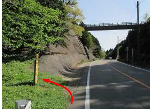
歩道橋が架かるショウケ越が近くなると 取付き である。