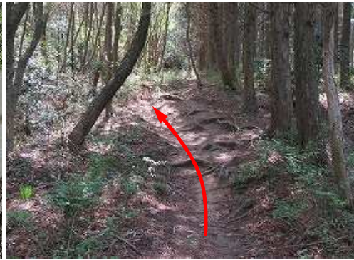
緩やかに上って行く