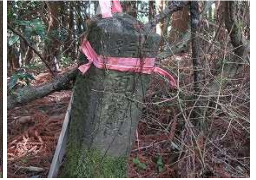
左に「三三号 共有林境標」と刻まれた境界杭を見る。