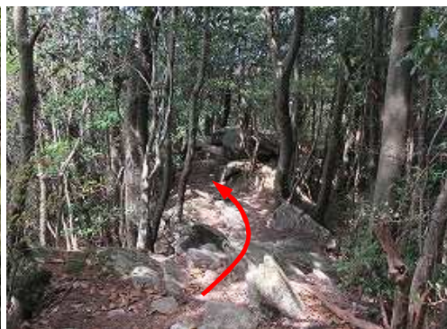
露岩尾根を通過する。