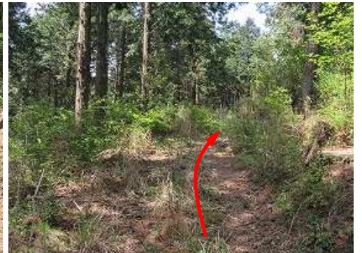
弱いヤブを抜ける。