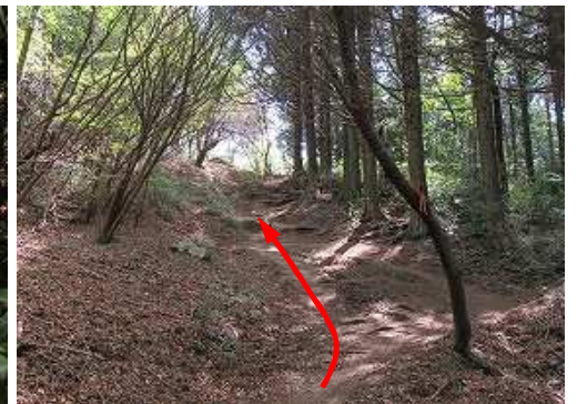
緩やかに上って行く