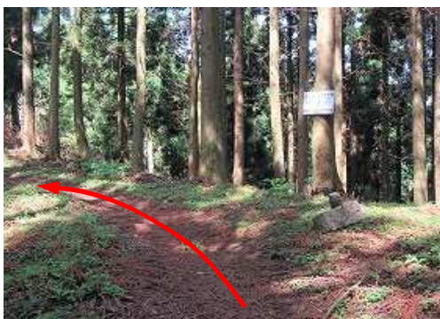
③ ポイント に到着。