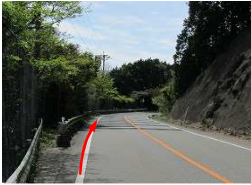
県道に出会い下って行く。