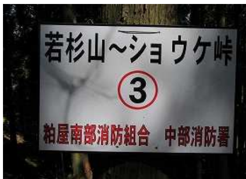
傍の幹に案内板を見る。