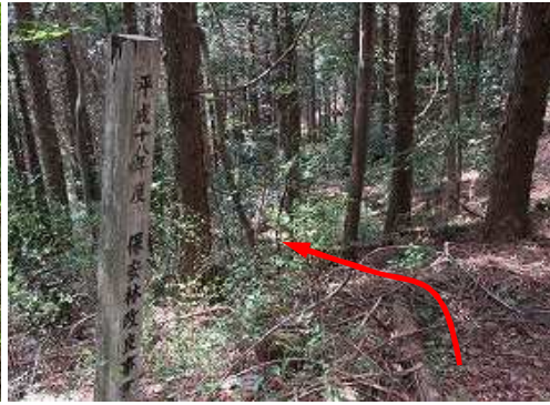
此処から再度、作業路へ下る。