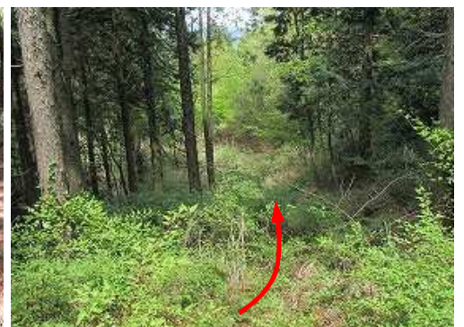
ヤブが濃くなり、この先で縦走路へ合流する。