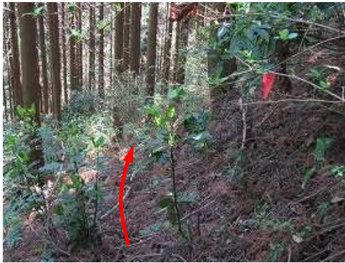
急斜面の細く弱い踏跡を下って行く。