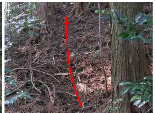
薄い踏跡を辿って行く。