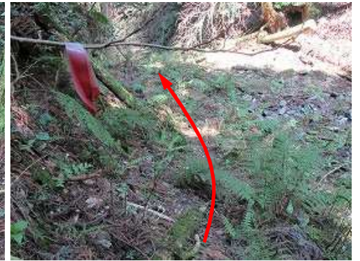
荒れた沢の左岸を下る。