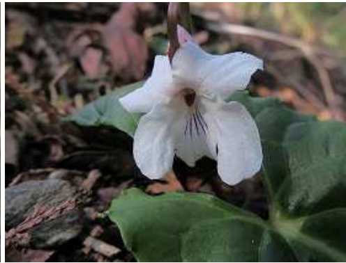
シロバナサクラスミレ