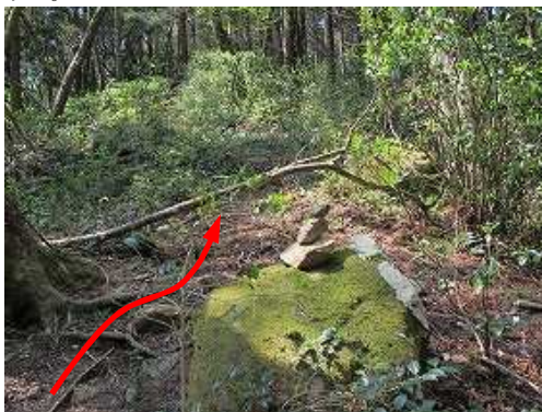
小さなケルンを通過する。