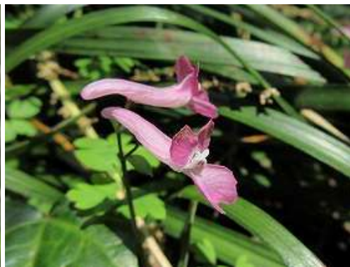
ジロボウエンゴサク