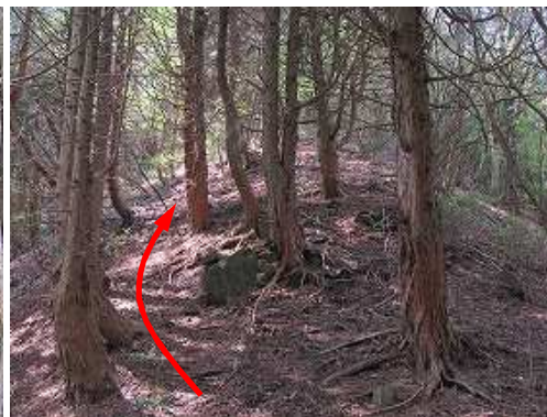
傾斜が緩み、スギ植林の踏跡を辿る。