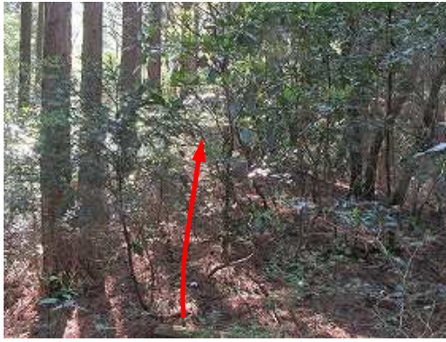
植林際の灌木を分けて緩く上って行く。