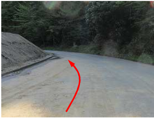
山の神林道の道路幅の広い所の路肩に駐車し、少し引き返す。