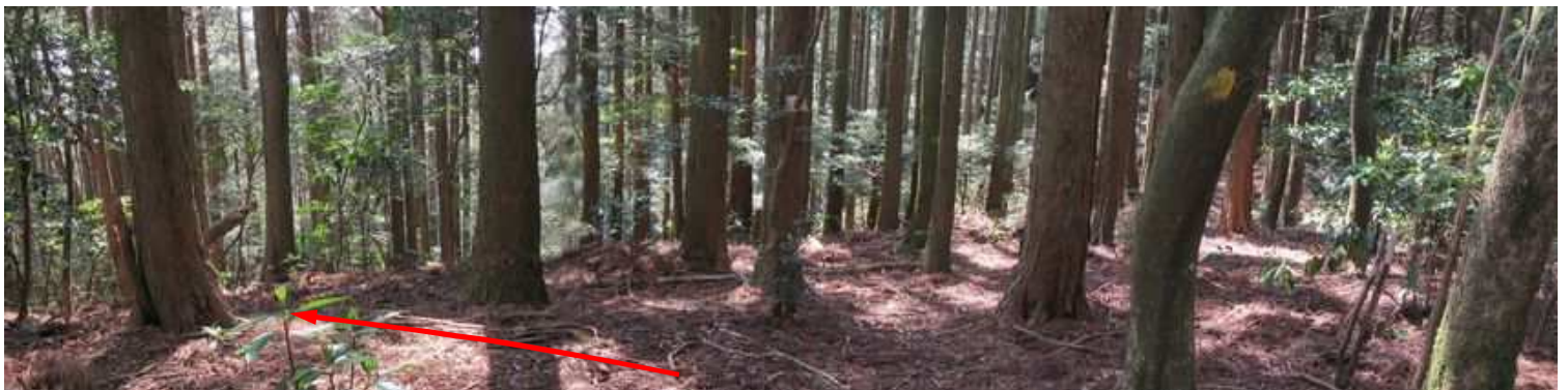
川原山分岐に出会い、左へ向かう。