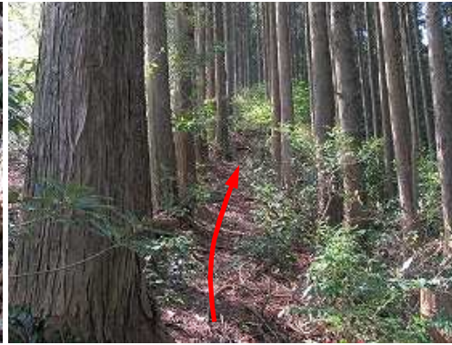
スギ植林の踏跡を辿る。