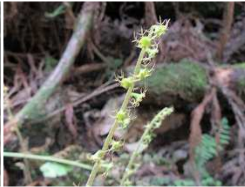
ツクシチャルメルソウ