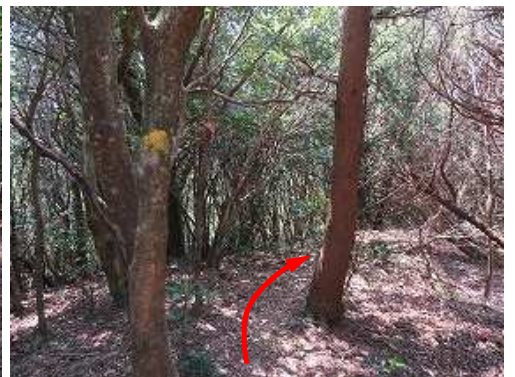
幹に黄色のマーキングを見る。