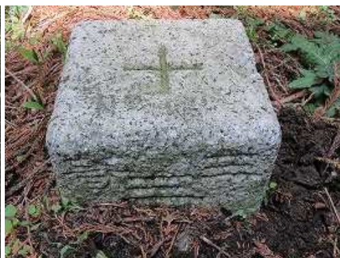
傍に明治30年に造標された三等三角点：水無(700.50m)を見る。