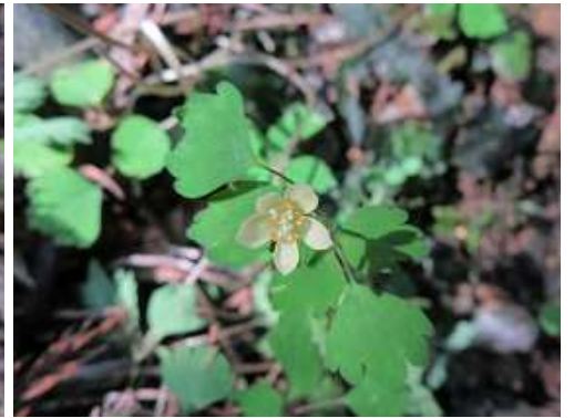
トウゴクサバノオ