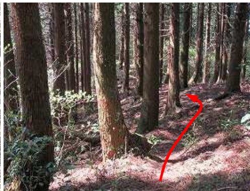
起伏の小さなスギ植林尾根筋を行く。