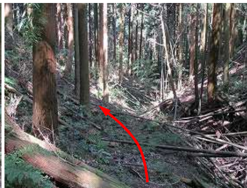
荒れた沢を下って行く。