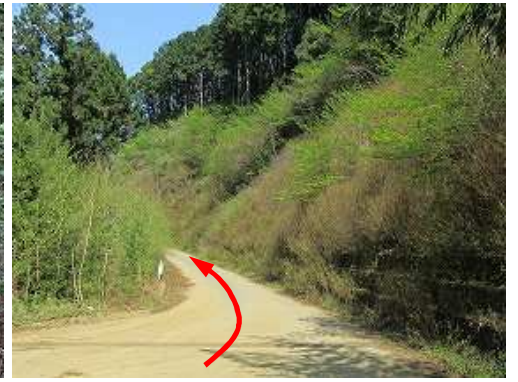
山の神林道を北東へ向かう。