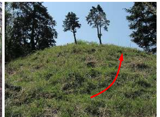
雑木を抜けると草付き斜面となり、上って行く。