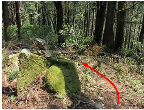
苔岩に小さなケルンを見る。