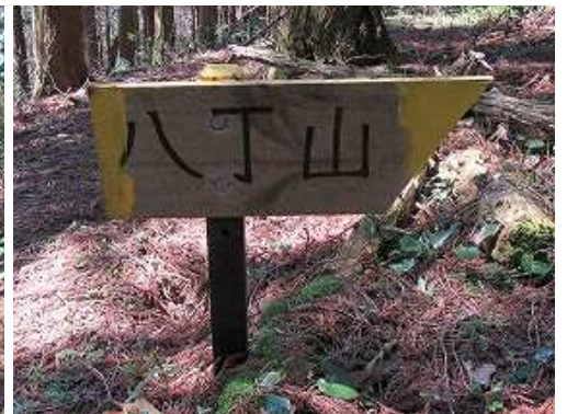
八丁山の案内板を見る。