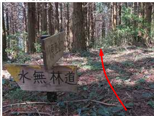
直ぐに水無林道分岐に出会う。