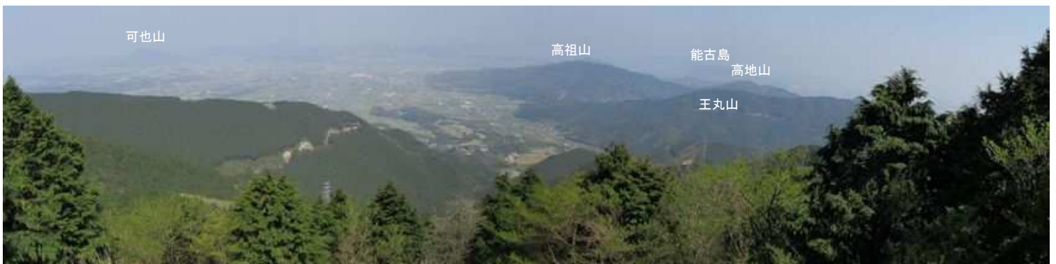
草付き斜面からの展望。