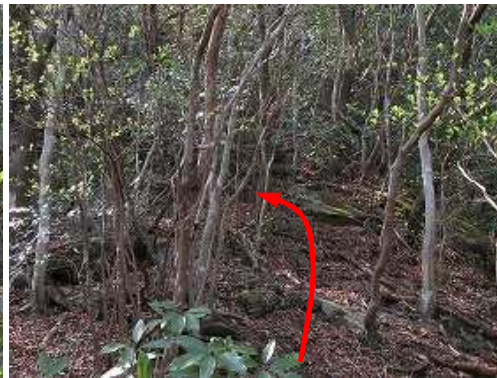
尾根筋を緩く上って行く。