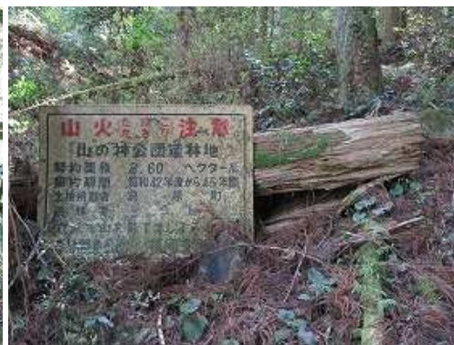
山火注意の案内板を振り返り見る。