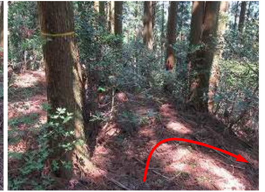
幹に巻かれた黄テープから南東に曲り、斜面を下る。