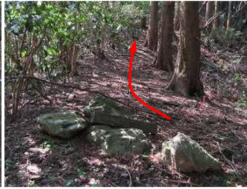
境界石と抜かれた境界杭に出会う。