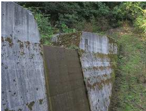
砂防ダム右岸の堰堤際の斜面を上り詰める。