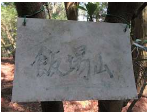
左に飯場山への案内板を見る。