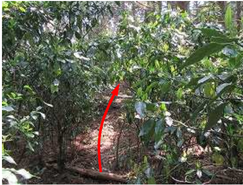
アオキ帯を抜ける。