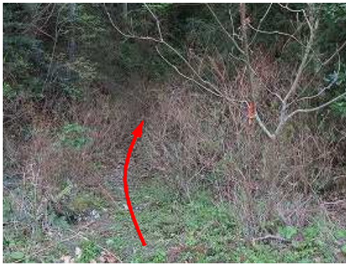
取付右の枝に赤ヒモを見る。