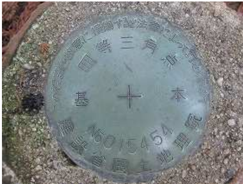
昭和41年に設置された四等三角点:八丁(630.93m)を見る。