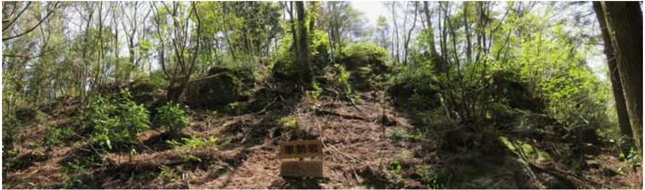
南の小高い地形を岩で囲った軍勢岩を見る。