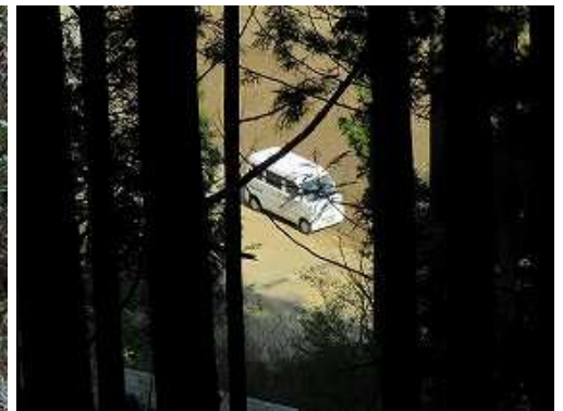
植林の林間から駐車地が見えた。