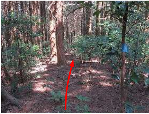
幹に結ばれた青ヒモを見て、北東へ派生する支尾根を下る。