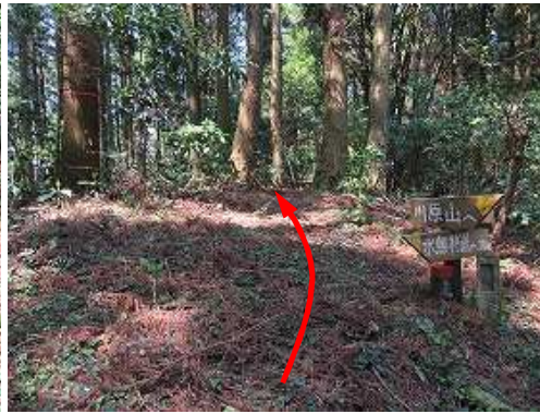
八丁山方面へ向かう。