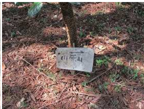
右に川原山への案内板を見る。