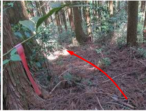
スギ植林の尾根筋を下る。