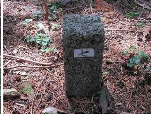
尾根筋の弱いピークに七号杭を見る。