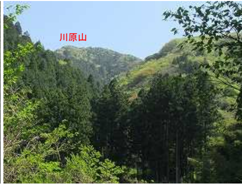
林道からは前方奥に川原山が望まれた。