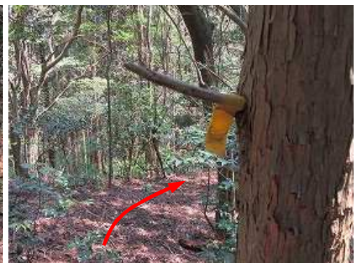
枝に黄テープを見る。