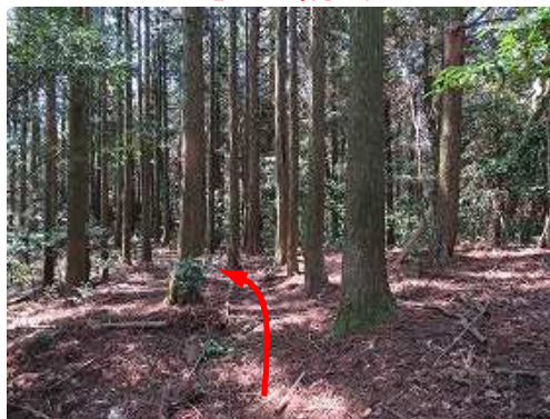
川原山分岐を通過する。