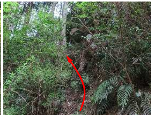
ヤブを漕いでスギ植林斜面に取付く。