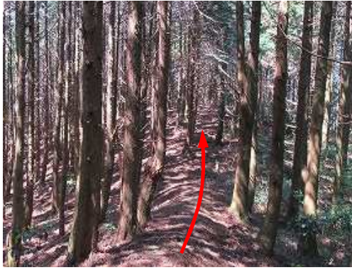
尾根筋を緩く上って行く。