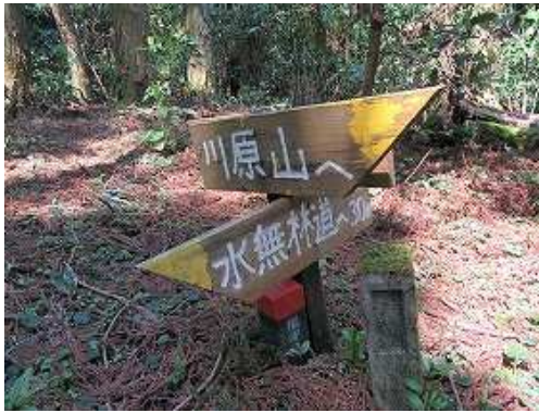
水無林道分岐の案内板。(川原山面)