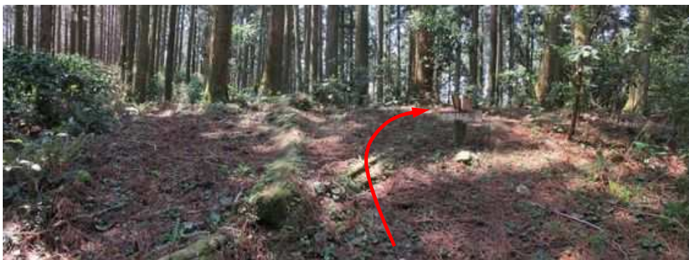
水無林道分岐に出会う。