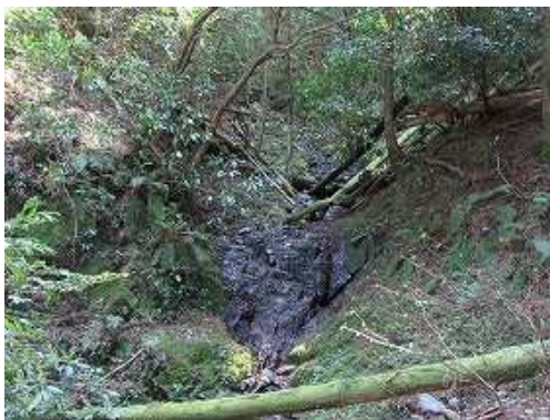
東から合流する沢を見る。