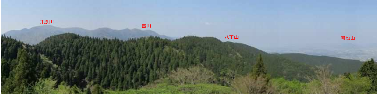
川原山から西の展望。