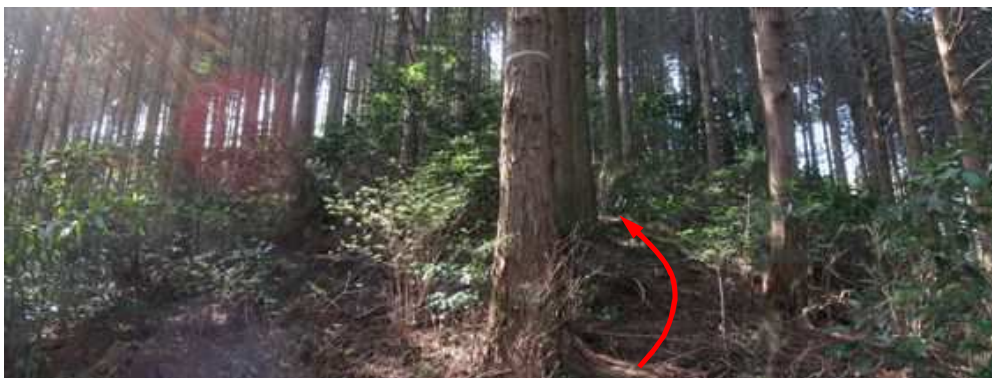
斜面B 尾根筋に達し、幹に巻かれたテープを見て南へと上って行く。