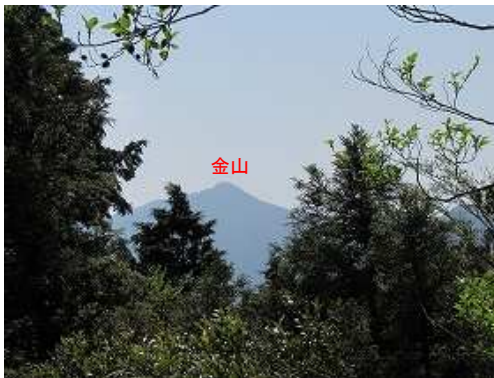
南東に金山を見る。