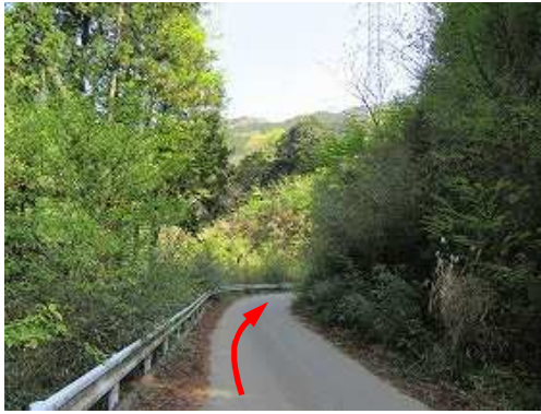
前方に鉄塔が見えて来た。