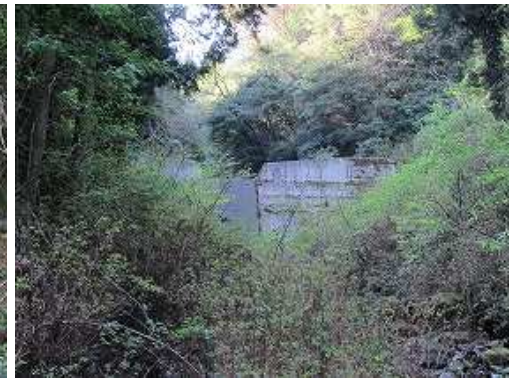
前方に砂防ダムが見えた。