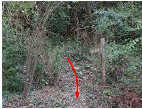
登山口から山中を振り返る。