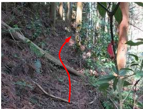
左岸に沿って下って行く。