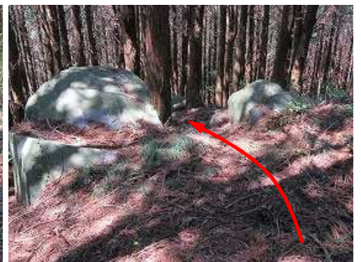
露岩の間を抜け、下って行く。