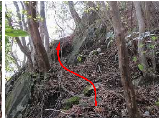
左へ進み、岩場を抜ける。