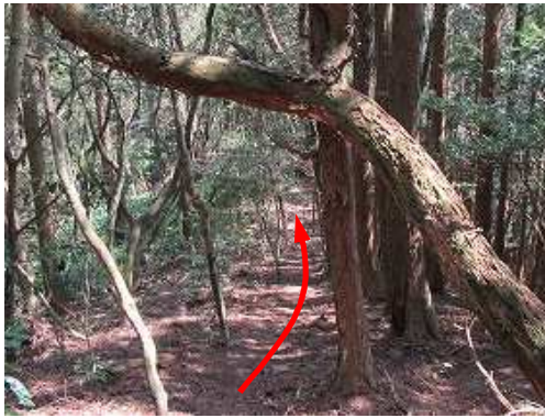
緩やかに下って行く。