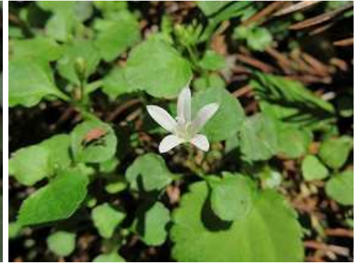
ツクシタニギキョウ