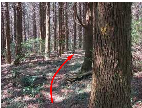
スギの幹に黄色のマーキングを見る。