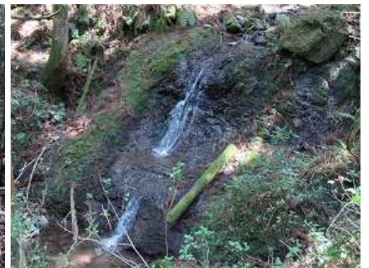
沢に4mの斜滝を見る。