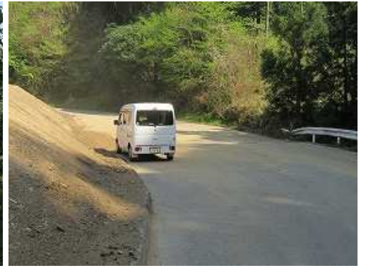
駐車地に降り着いた。