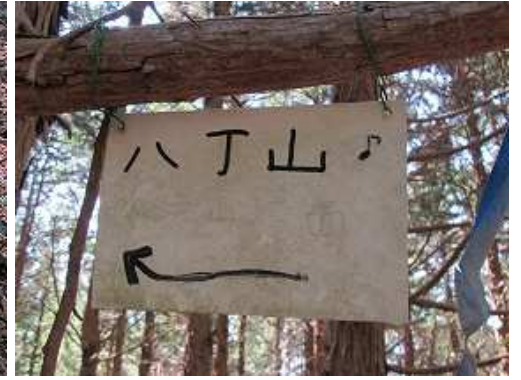
傍の枝に案内板が掛かっている。