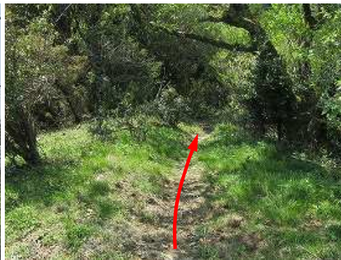
一息ついて南へ下る。