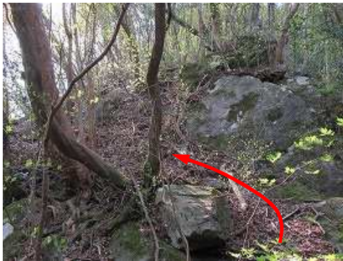
左方向に斜上する。