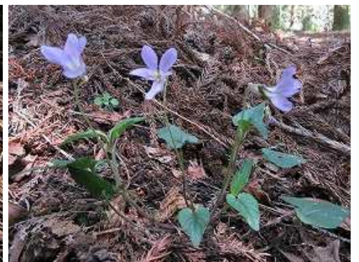
オオタチツボスミレ