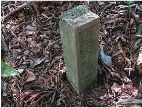
コンクリート製境界杭を見る。