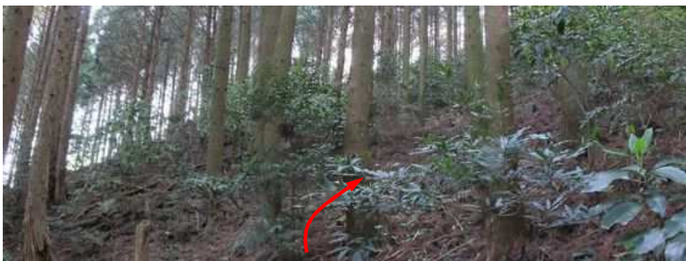
斜面A スギ植林斜面の下草が薄い所を辿り、上方へ上って行く。