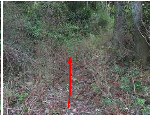
弱いヤブ化した作業路跡を緩く上って行く。