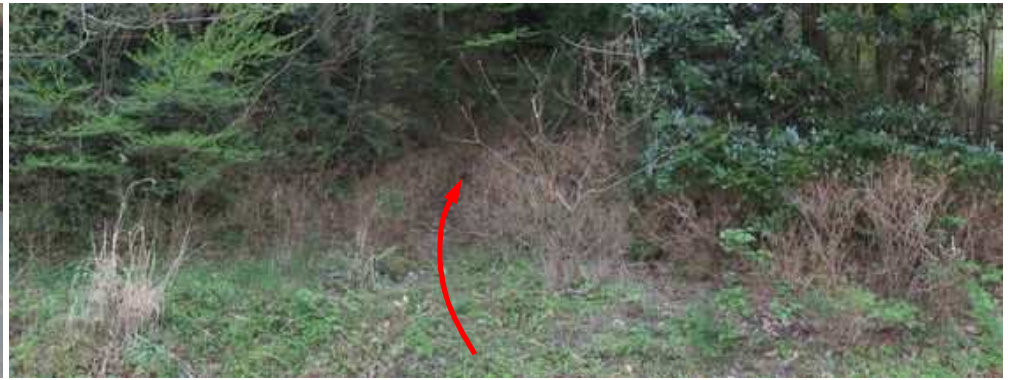
山側の作業路跡が取付きで、中に踏み入る。