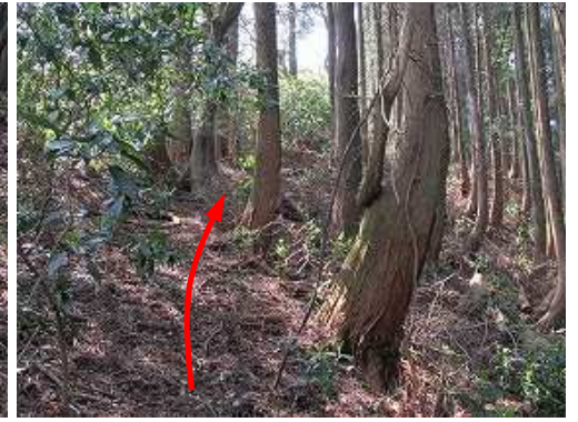
スギ植林際の尾根筋を上って行く。