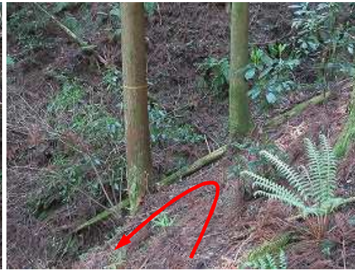
ジグザグに下り沢沿いに転回する。