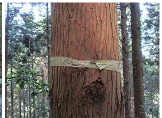
幹に巻かれたテープを見る。