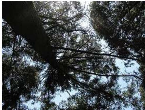
周囲をスギ植林で囲まれ展望は得られない。 一息ついて引き返す