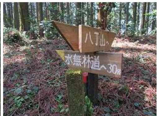
水無林道分岐の案内板。(八丁山面)