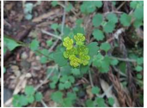
タチネコノメソウ