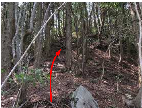
露岩斜面を上り上がり、尾根筋を上方へ向かう。