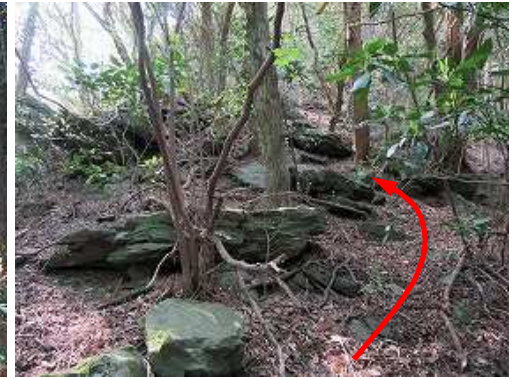
露岩基部に出会う。