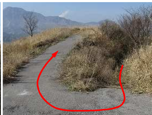
牧野道に出会い、転回して奥へ進む。