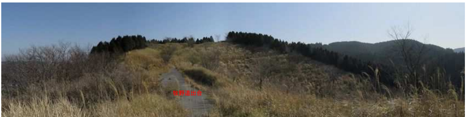
卯の鼻から北東の展望。 一息ついて引き返す