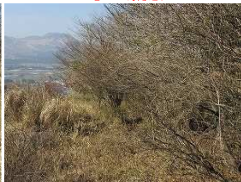
展望地を通過する。