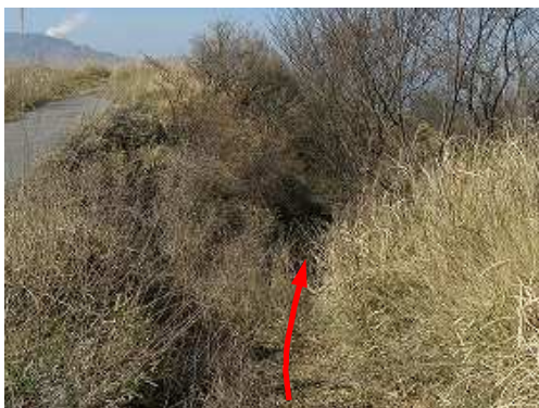
牧野道出合から下る。