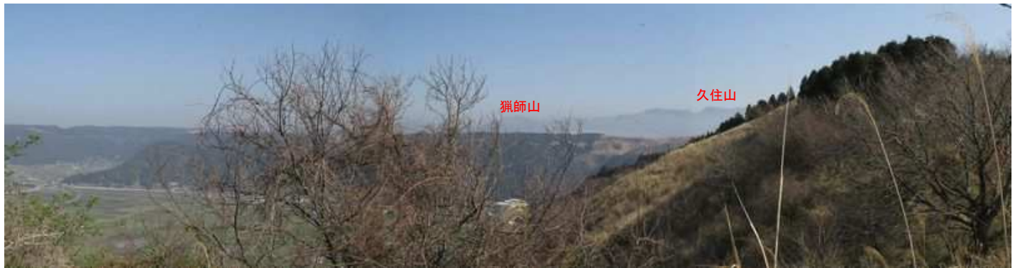
卯の鼻から北に九重連山を望む。