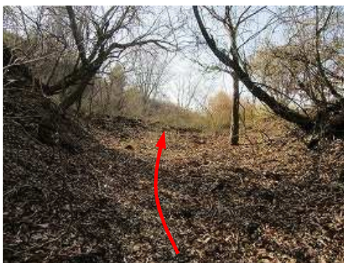
傾斜が緩み、前方が開けて来た。