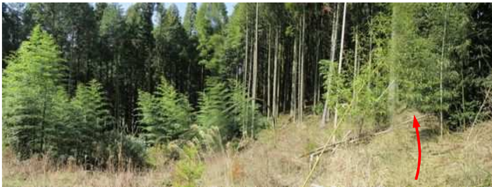
尾根筋取付に下り立ち、ヤブの古道を北西に進む。