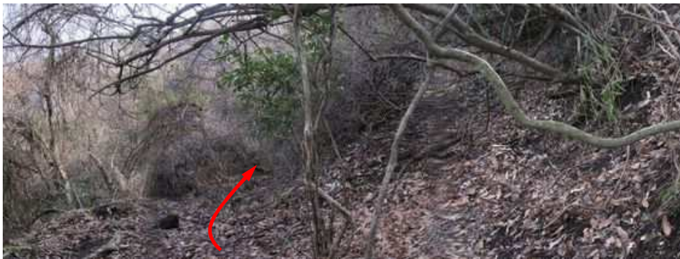
小ピークの北側を巻くように進む。