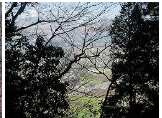
枝越しに南西の方向を見下ろす。