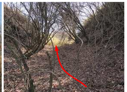
灌木を抜け、東へ向かう。