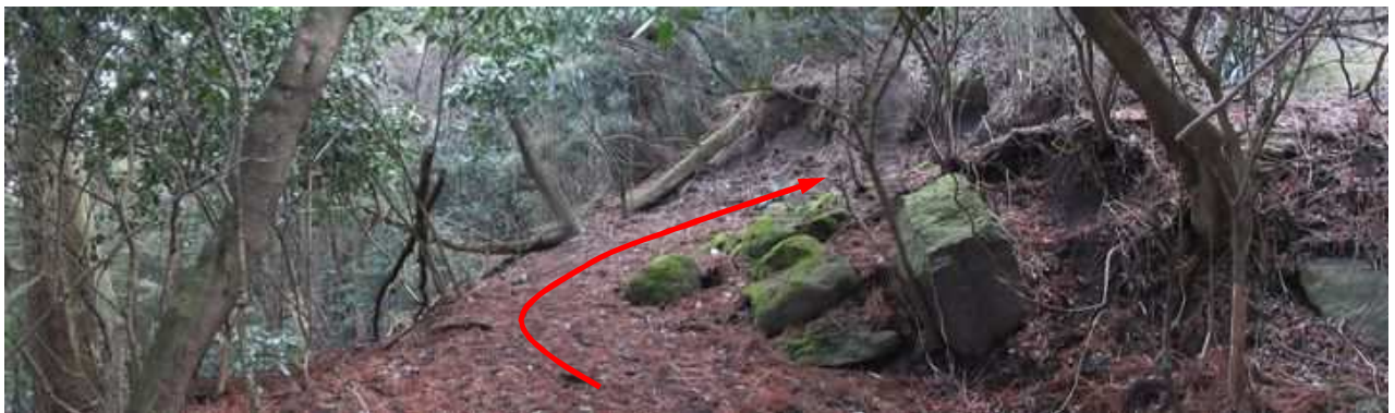
地形から察するに作業路でなく古道の呈をなしている。