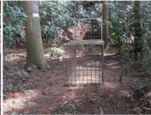
林道東側の近い所にイノシシ捕獲檻が置かれていた。