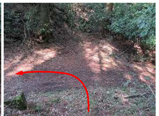
林道に出会い、左へ向かう。