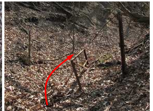
壊れたゲートを通過する。