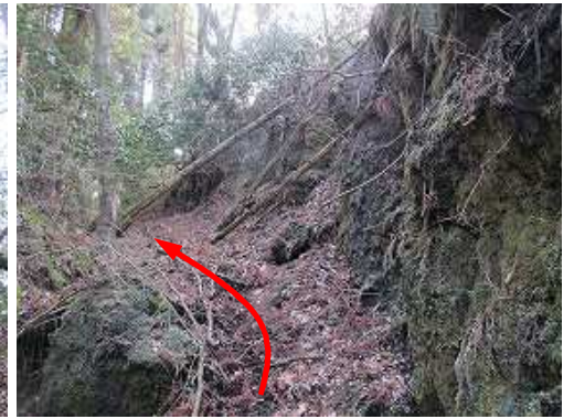
岸壁際を上方へ進む。