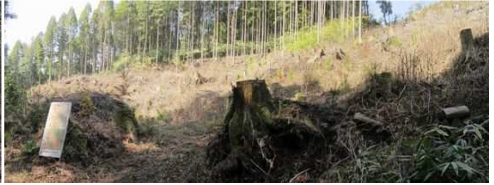
林道西側にスギの新植斜面を見送る。