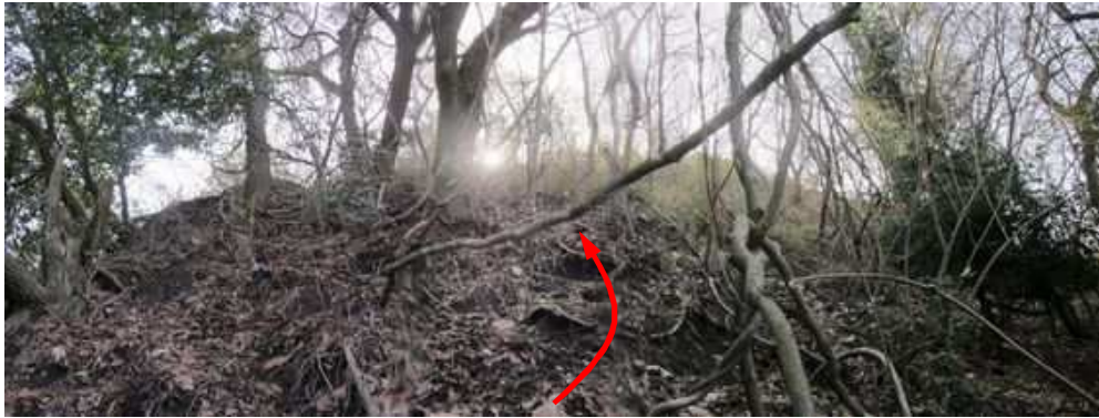
斜面を上って行く。