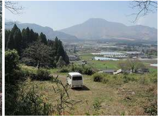
駐車地が見え、帰り着いた。