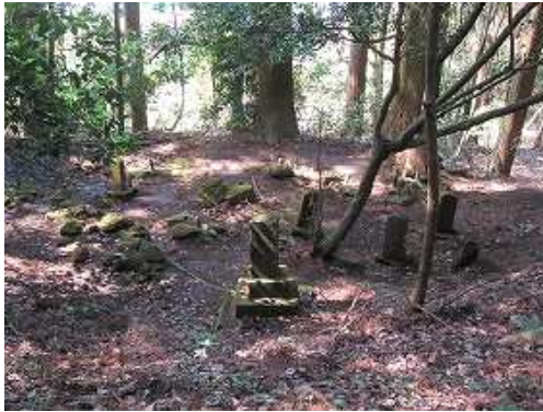
林道西側の下に墓地Bを見る。