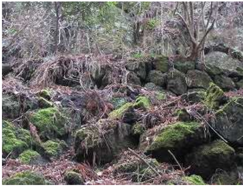
古道の上部に苔むす石積みを見る。