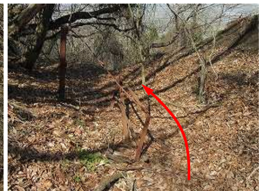
ゲートを通過する。