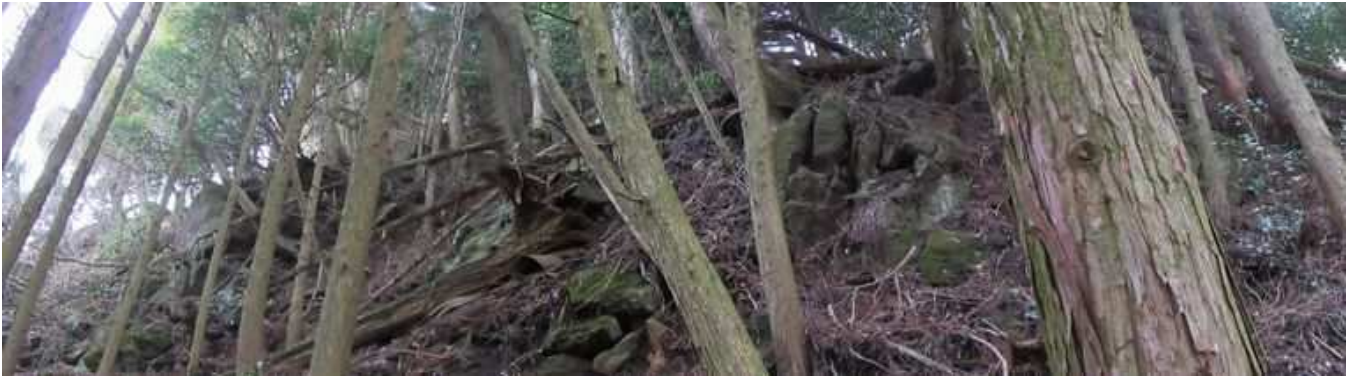
スギ植林斜面の上部は急崖となっている。