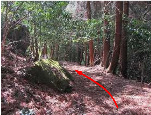
古道を下って行く。