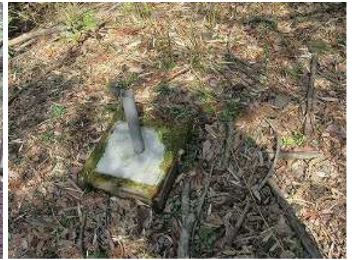
古道中央に置かれた土台を見る。