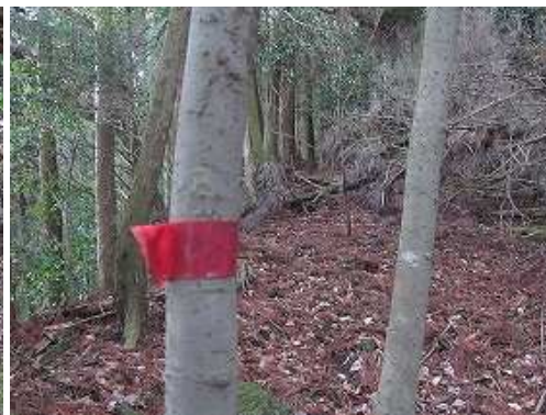
幹に巻かれた赤テープを見る。