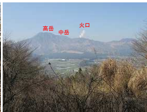
展望地から火口を望む。