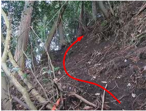
向きを変え急斜面を左に斜上して行く。