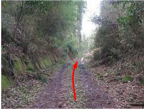
緩やかに下って行く。