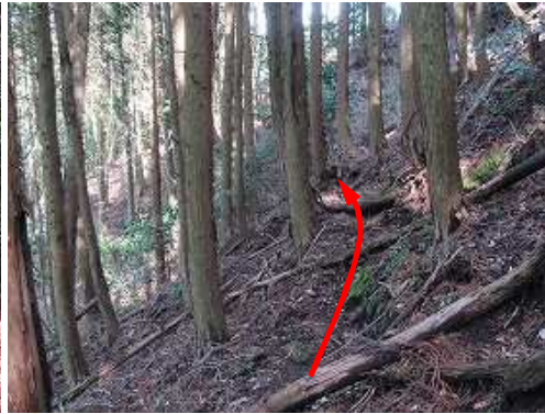
スギ植林斜面を引き返す。