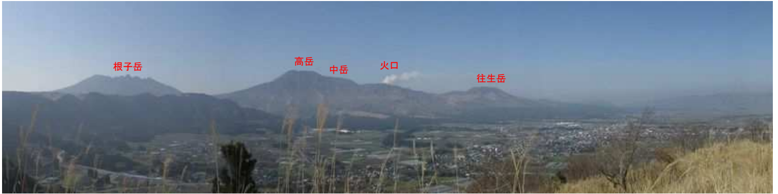
卯の鼻から望む阿蘇山。