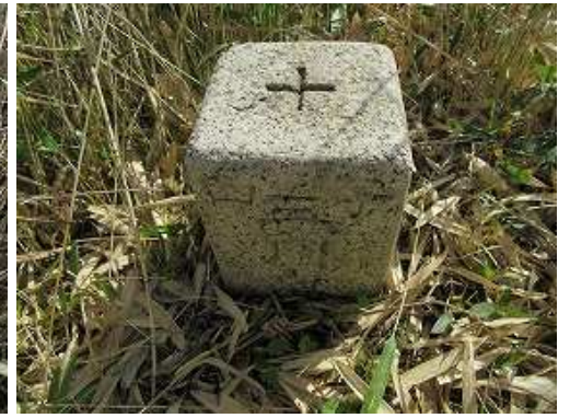
四等三角点:卯ヶ鼻が昭和29年に設置されている。