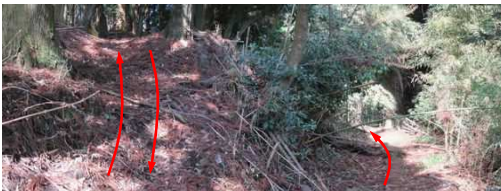
左上に墓地があり、立ち寄り引き返す。