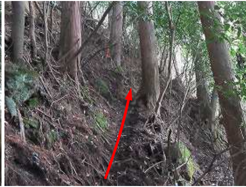
斜面を巻くように斜上する。