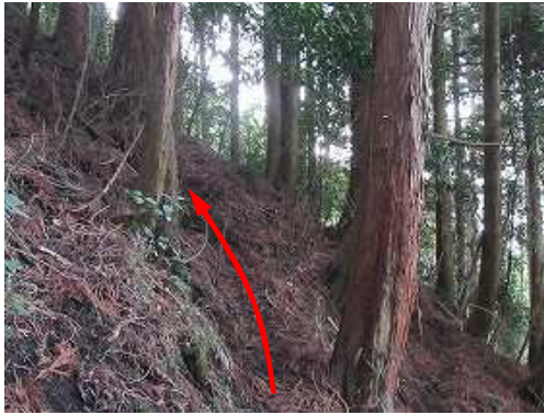
スギ植林斜面を斜上する。