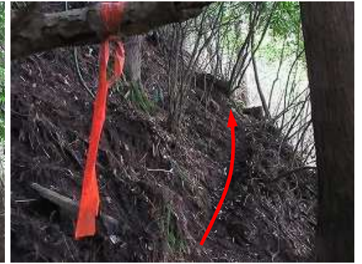
枝に巻かれた赤ヒモを見る。