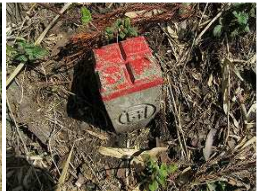
木の根元に赤杭を見る。