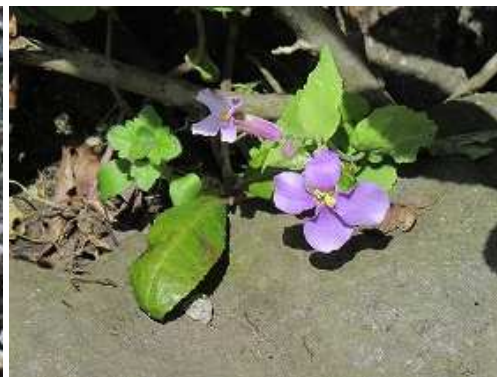
オオアラセイトウ