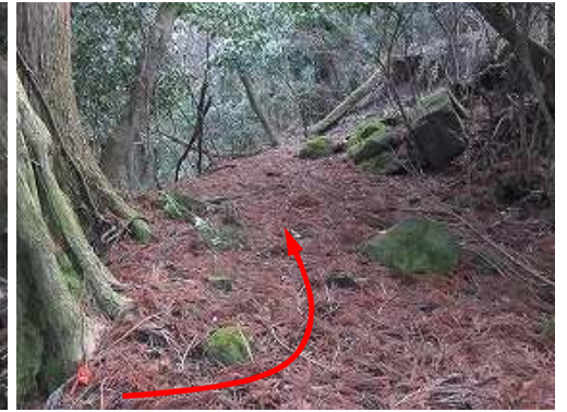
右から上がって来た作業路に出会い、上方へ向かう。