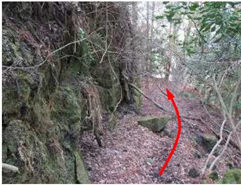
岸壁際を下って行く。