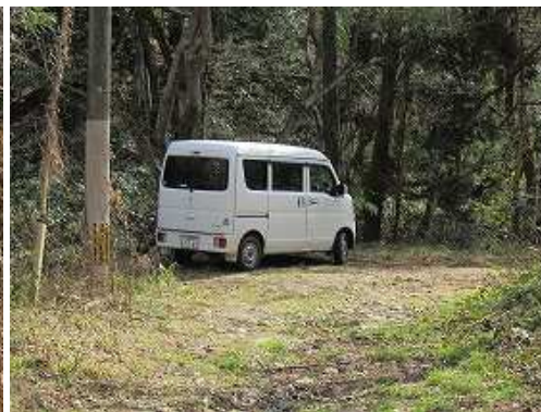
駐車地に帰り着いた。