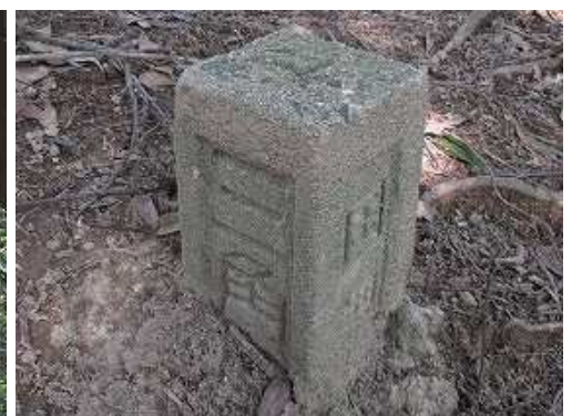
国土調査三角網の測量杭を見る。