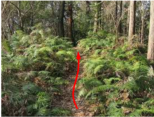
シダ斜面を抜ける。