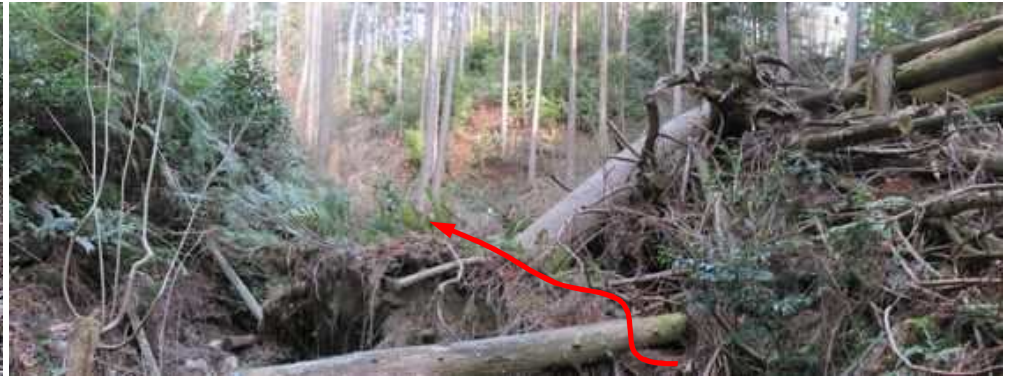
沢筋の倒木を越える。