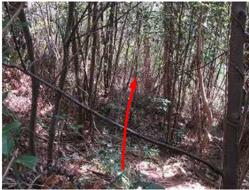
弱いヤブを抜ける。