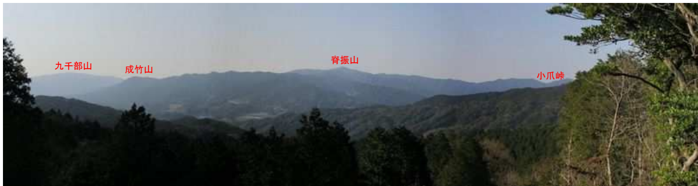
展望地Aからの眺望。