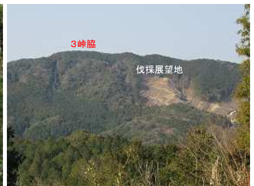
西に2/16に歩いた三等峠(500m)が望めた。