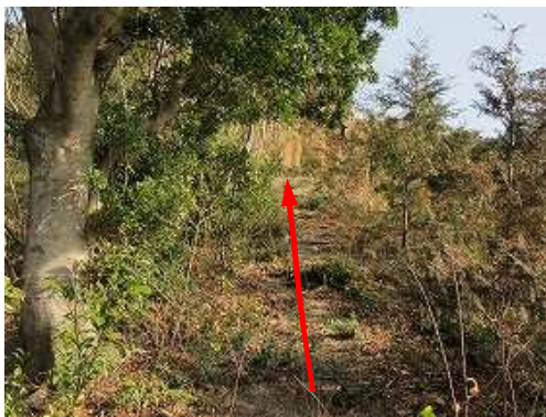
ヒノキ新植際を緩く上って行く。