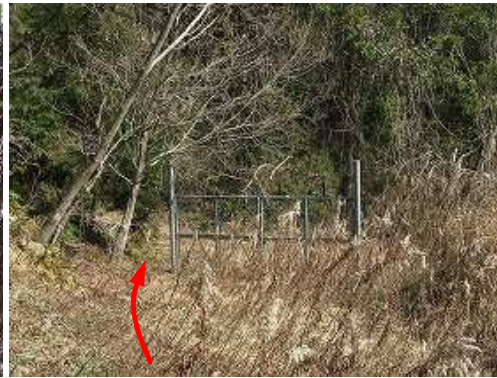
前方にゲートが見えた。