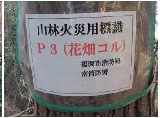
花畑コルの案内板を見る。