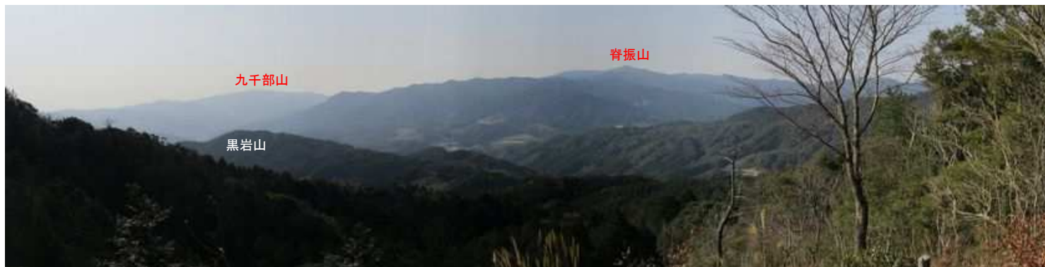
展望地Bからの眺望。