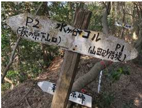
水ヶ谷コルを通過する。