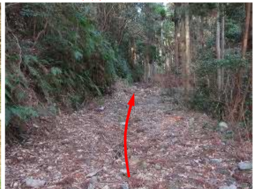
ガレた道路を緩く上って行く。