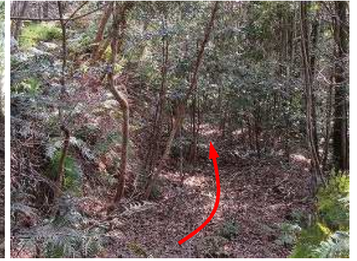
弱い灌木を掻き分け緩斜面を下って行く。