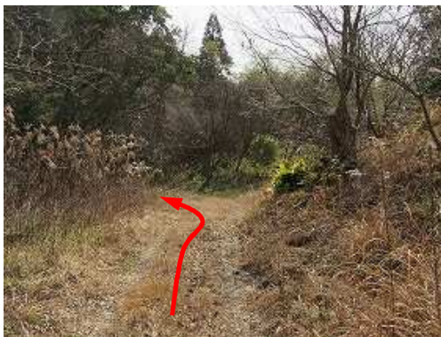
道なりに下って行く。