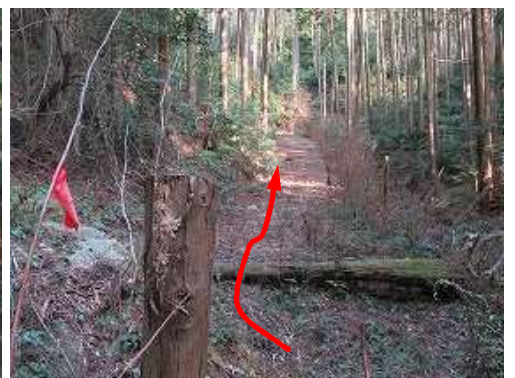
枝に 赤テープ を見る。