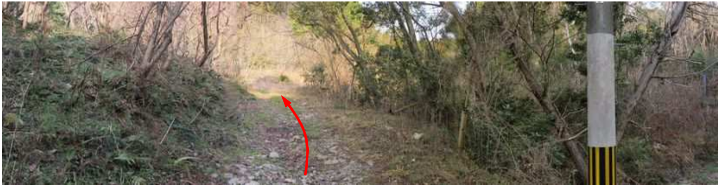
那珂川市柚原の市道を奥へ進み、最後の電柱脇の路肩空き地に 駐車 する。未舗装路を北西に歩き始める。