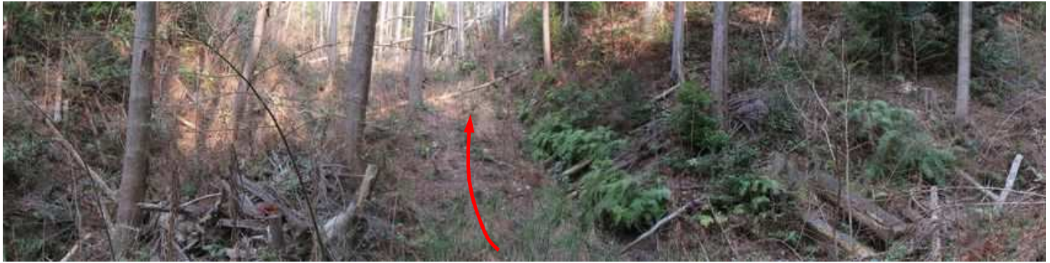
倒木を越えた先で、弱い沢を渡渉して北西作業路へ踏み込む。