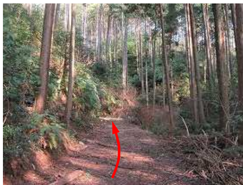
スギ植林地の作業路を進む。