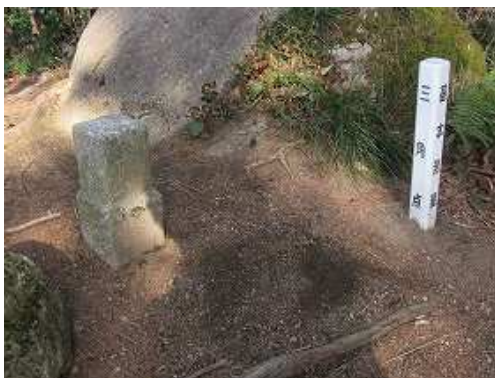
昭和40年に四等三角点:糠塚が設置されている。