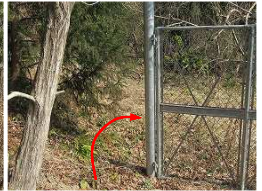
ゲートの左から外へ出る。