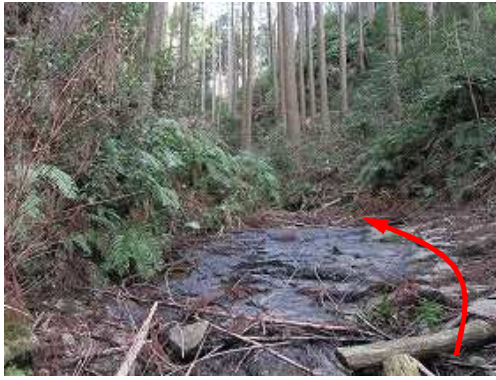
沢に出会い、沢筋を上流へ進む。