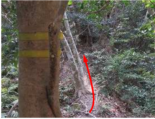
幹に古い黄テープを見る。