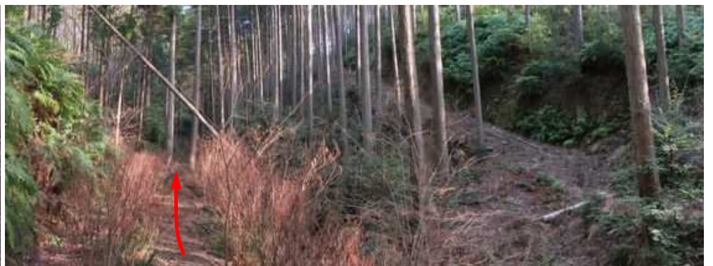
沢の対岸を作業路が上って行く。