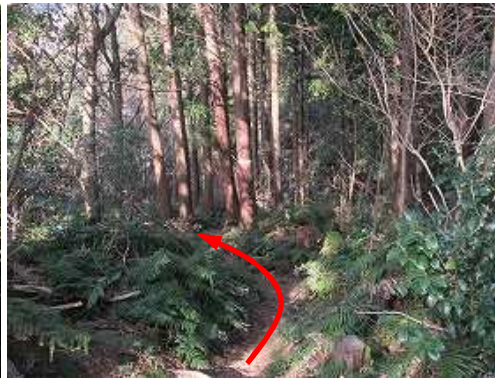
一息ついて萩ノ原峠へ向かう。