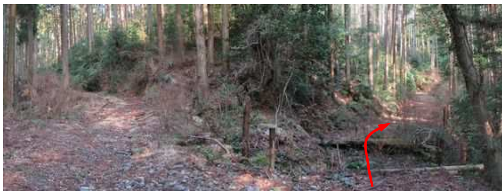
作業路分岐 右へ古い作業路が伸び踏み込む。