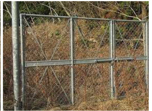
左に ゲート を見る。 帰路、 此处 に下って来た