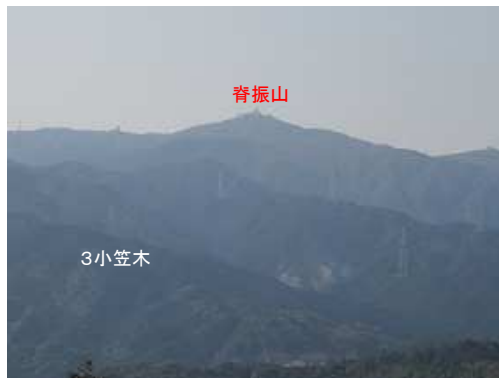
展望地Aから脊振山を望遠で撮る。