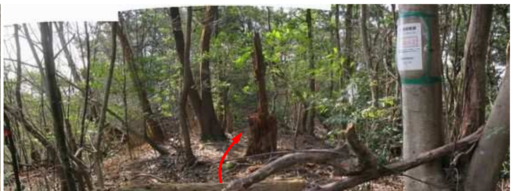
此处から南の支尾根へ踏込む。