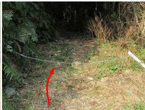
チェーン を越える。