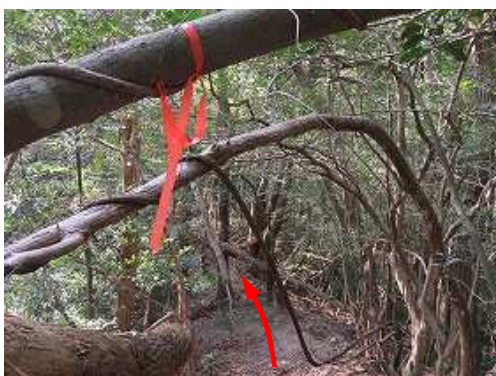
時折、赤テープが見られる雑木尾根筋を進む。