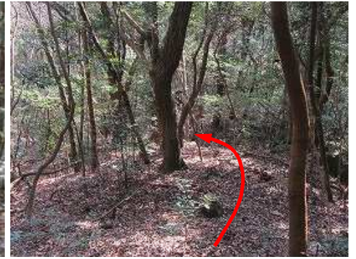
緩斜面を下って行く。