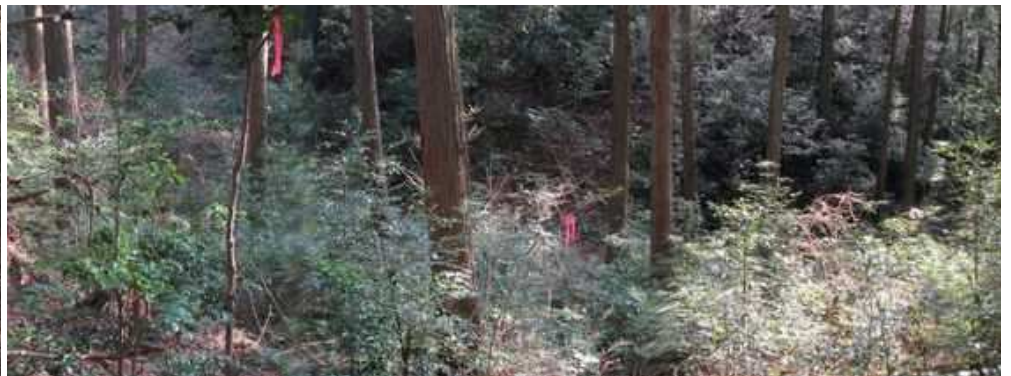
古道分岐 東斜面を下ると那珂川市管理道路に出会う。