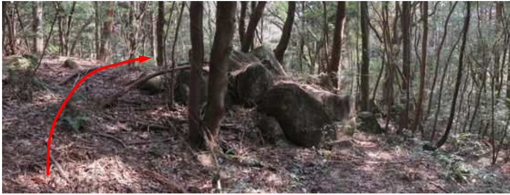
鈍頂の尾根筋に露岩を見て下って行く。