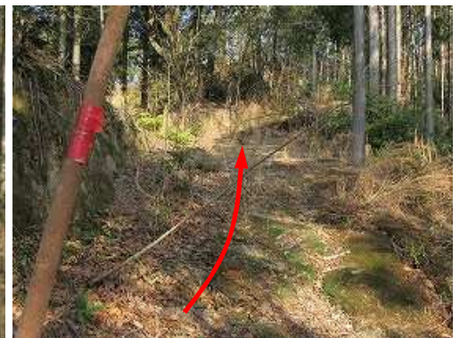
崖よりの幹に赤テープを見る。