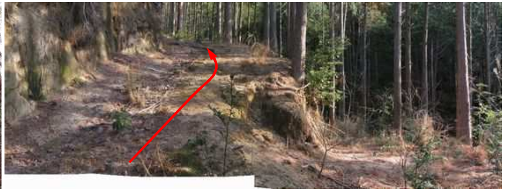
作業路分岐 右から作業路が上って来た。