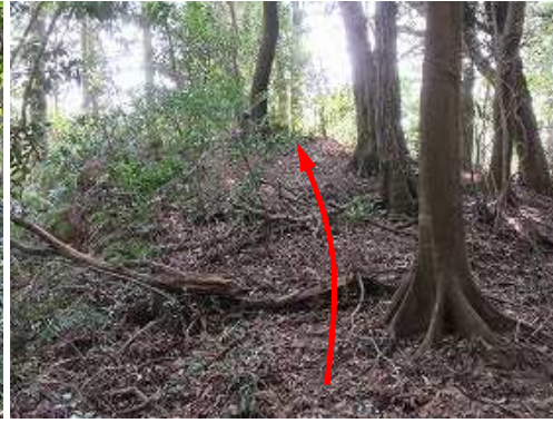
弱いピークを越える。