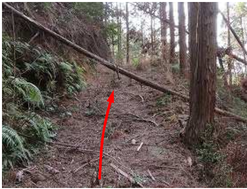
作業路は右へターンし上って行く。