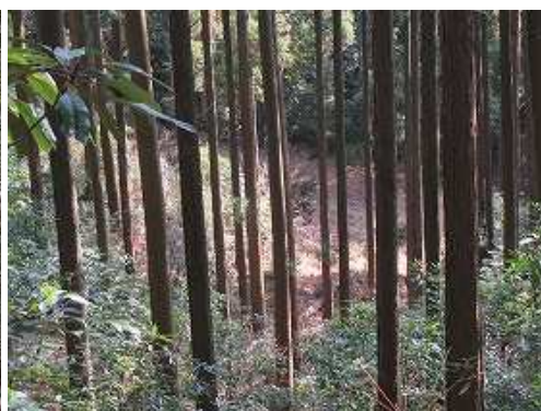
東側林下に那珂川市管理道路を垣間見る。