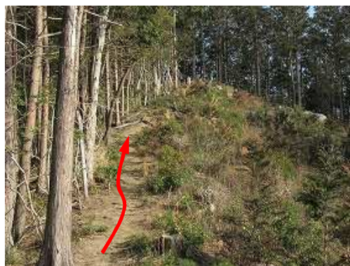
ヒノキ新植際を緩く上って行く。