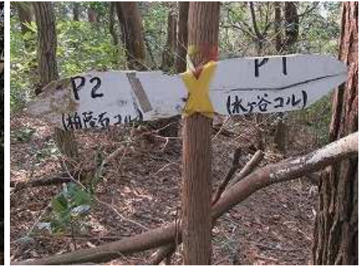
左に案内板を見る。