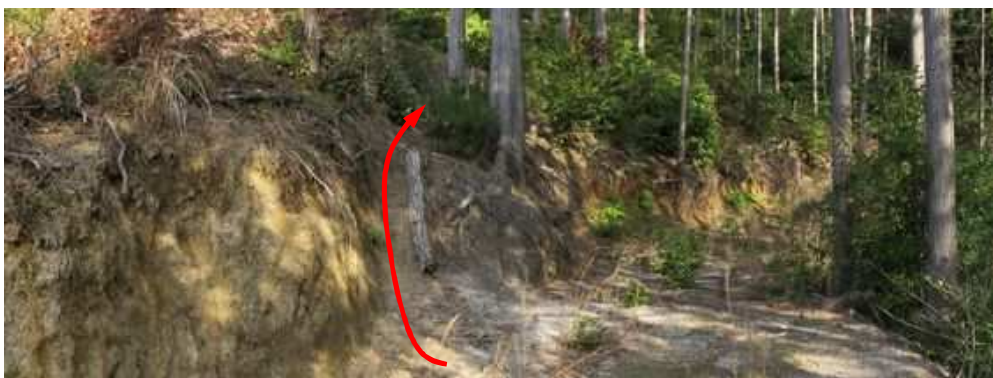
作業路は北北東へ向かうが、西側の尾根筋へ取付く。