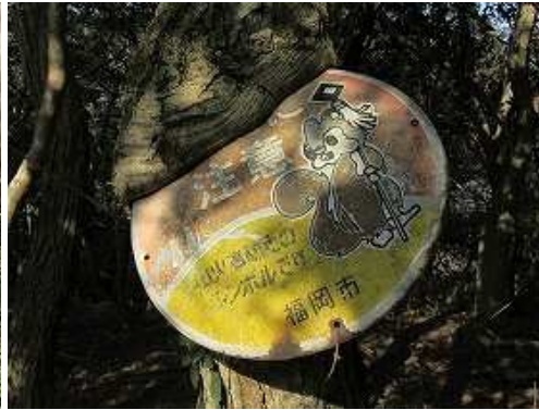
右に食込み看板を見る。