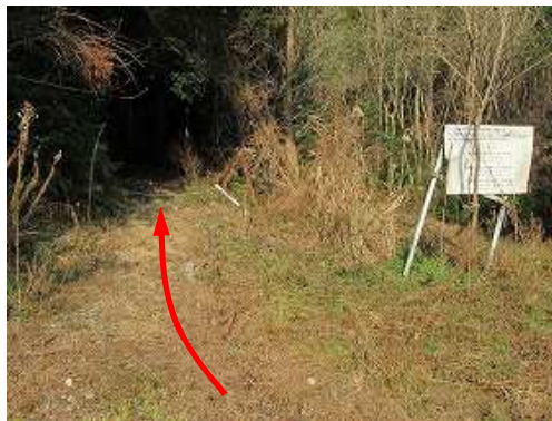
右に道路案内板が立っている。