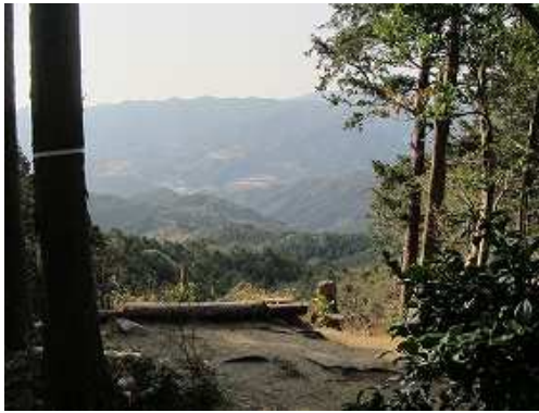
三角点から南を望む。