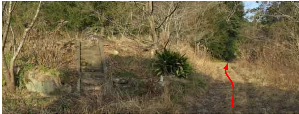
左に 階段 だけが残る屋敷跡を見送り、奥へ進む。