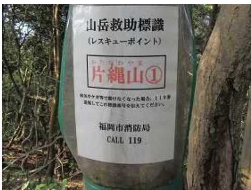
片縄山①の案内板を見る。