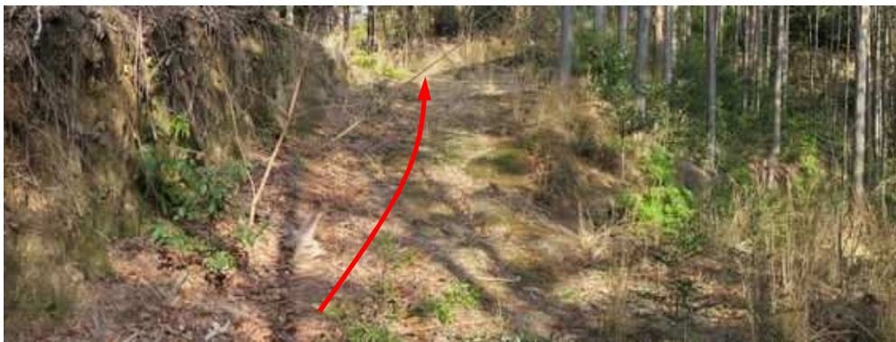
右へ荒れた作業路が分岐するが左作業路へ進む。