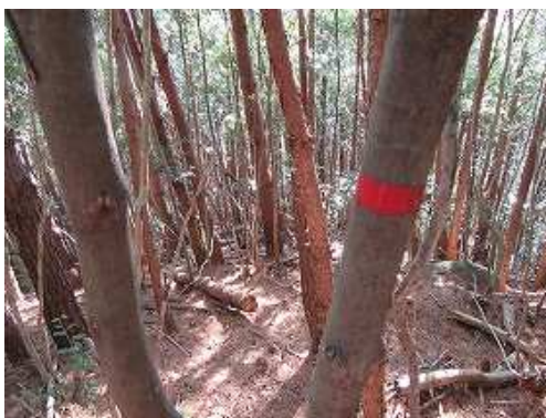
幹に巻かれた赤テープを見る。