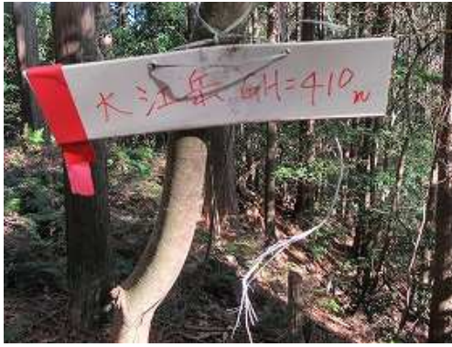
下って来た斜面を登り返すと幹に大江岳(410m)の山名板を見る。此処は山で大江岳は鷲尾根の山であり×。