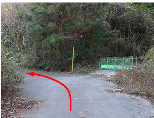
太郎山取付きへの ゲート が右に見えた。