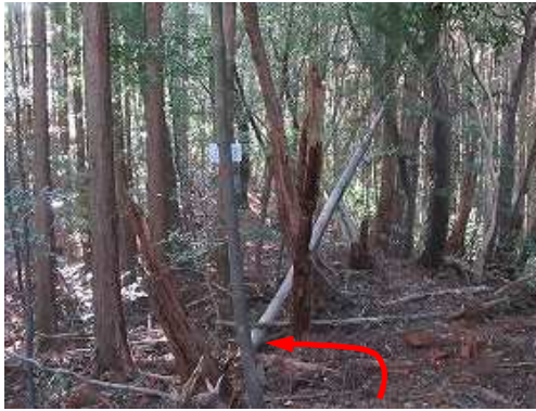
尾根筋を引き返し太郎山分岐に到着し、東へ入る。