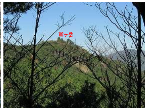
展望地 から 鷲ヶ岳 を望む。