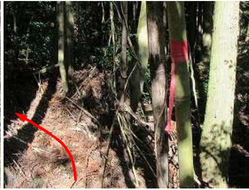
入ると、右の青竹に赤テープを見る。