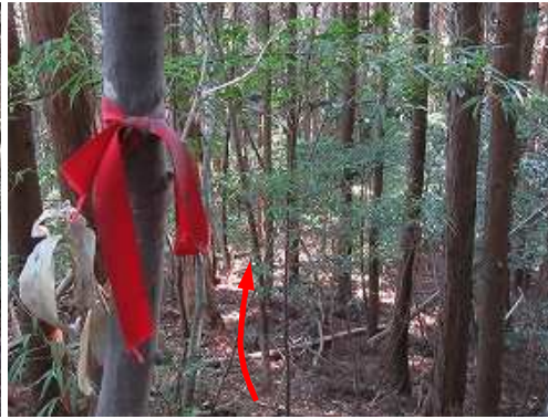
幹に巻かれた古い赤テープが見られ、緩く下る。