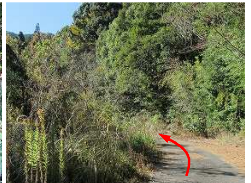
寺倉林道を緩やかに上って行く。