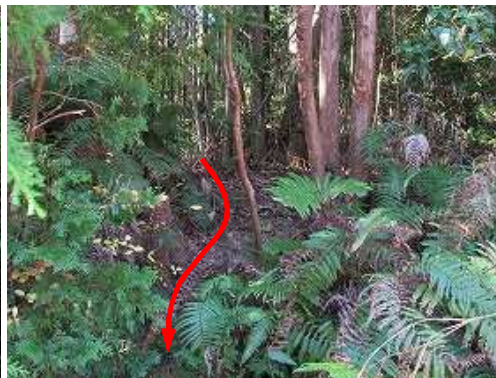
林道から 出口 を見る。