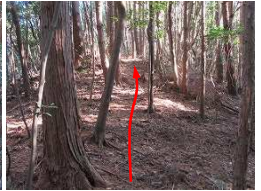
弱い踏み跡を辿り、斜面を緩く登って行く。