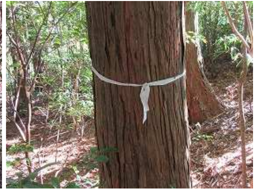
スギの幹に巻かれた 白テープ を辿る。