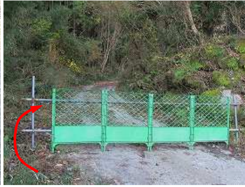
右カーブの左に ゲート があり、脇を抜け場内に入る。