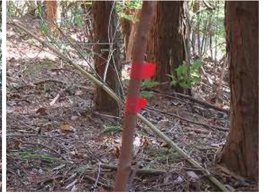
先人が巻いた取付き 赤テープ に出会う。