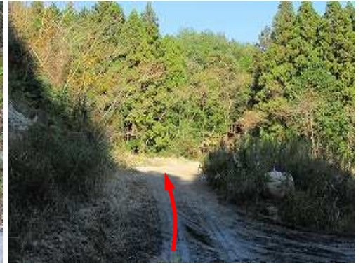
場内を抜け、奥へ進む。