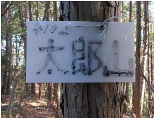
幹に太郎山(410m)の山名板を見る。