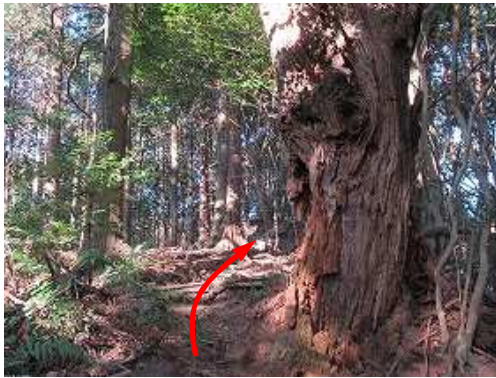
枯死木の左を抜ける。