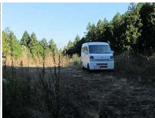
駐車地 に帰り着いた。