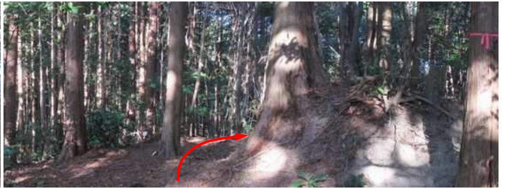
その先で 隆岳分岐 に出会い、尾根筋を北へ向かう。