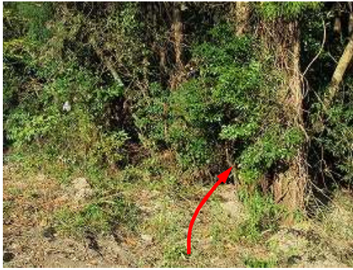
枝に赤ヒモ下がる所が 太郎山取付き で、山中へ入る。