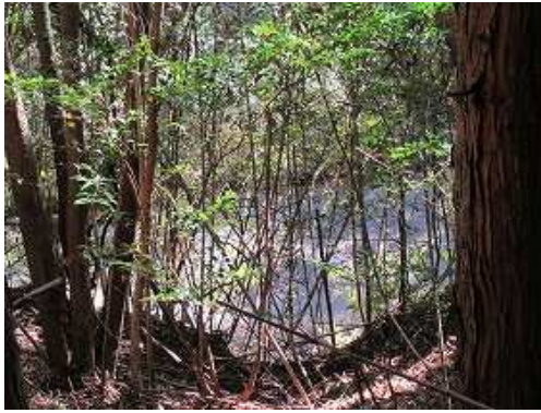
直ぐ下に寺倉林道が見えるが、急崖で降れない。