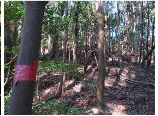
赤テープを辿りながら斜面を登って行く。