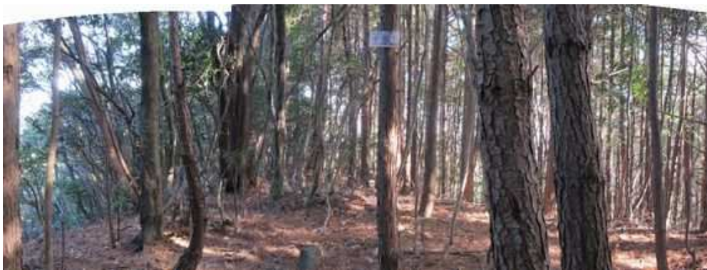
南東から見た山頂部。