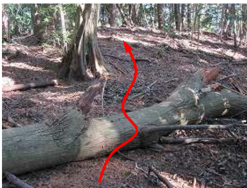
緩い斜面の 倒木 を越える。