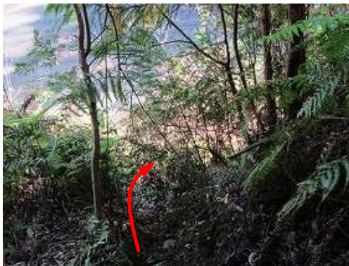
出口 此処から1m降ると林道に出会う。