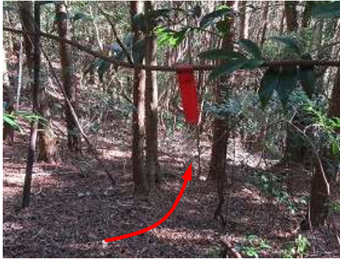
傾斜が緩み、枝の 赤テープ を見る。