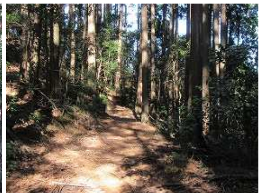
緩く下ると 作業路 に出合う。北へ続いているようだ。 此处で引き返す