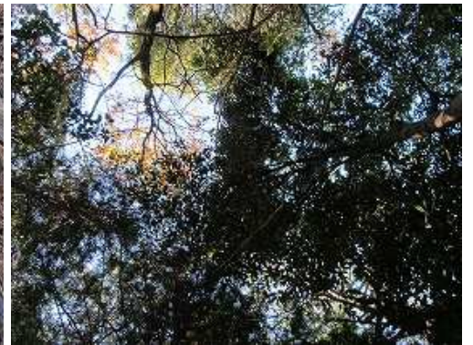
周囲を樹木で囲まれ展望は得られない。