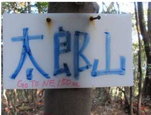
太郎山分岐 を通過する。