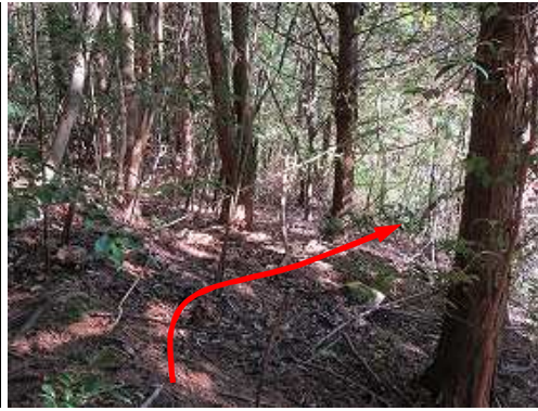
北東に延びる弱い作業路から林道側に降る。