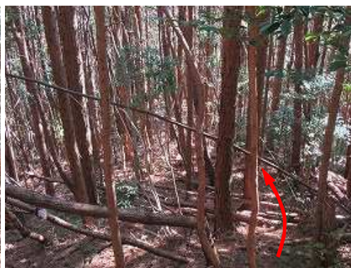
倒木を避けながら斜面を降って行く。