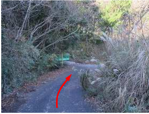
寺倉林道終点手前の右カーブ始点の傍の空き地に 駐車 し、林道を下る。

駐車地→太郎山取付き→隆岳分岐→作業路出合→大江山(410m)→太郎山分岐→太郎山(410m)→赤テープ→出口→駐車地