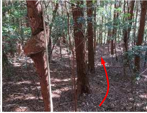
コブ巻スギを抜ける。