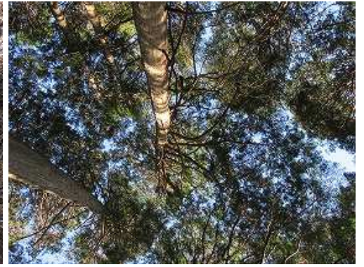
周囲はヒノキ林で展望は得られない。