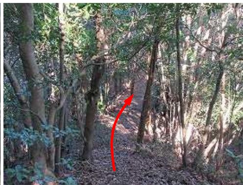
尾根筋を緩く降る。