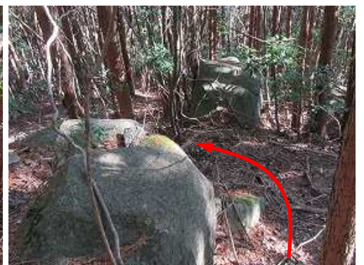
転石を右から左に抜け下る。