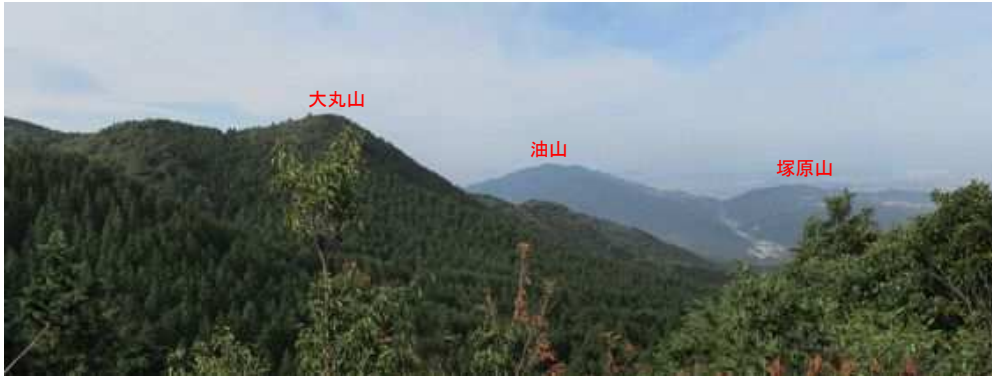
展望岩から北北西の展望。