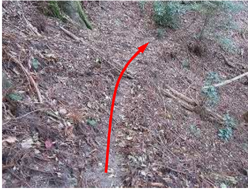
獣道に出会い、これを辿る。