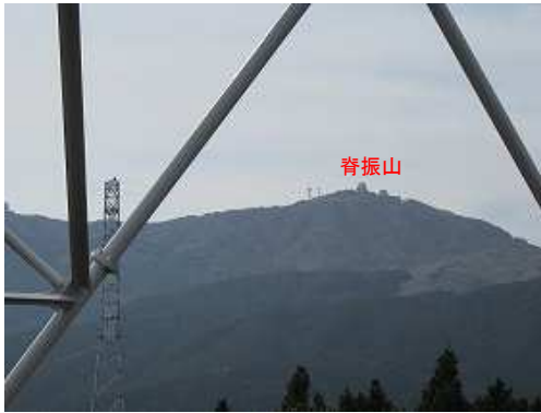
13号鉄塔から脊振山を望む。