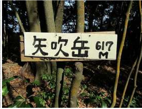
矢吹岳(617m)の山名板を見る。周囲を樹木で囲まれ展望は得られない。