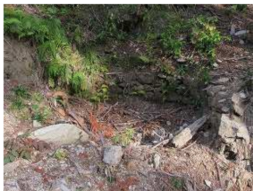
旧登山道脇にあった 炭焼窯跡 は、半分残っていた。