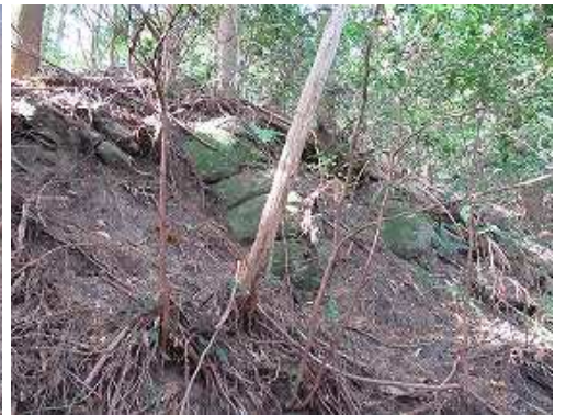
曲輪跡北斜面の石積。