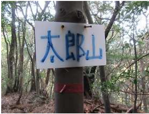
太郎山の山名板を見る。