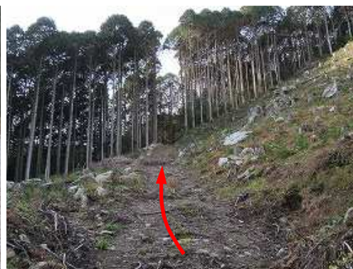
直ぐに転回し、伐採斜面を斜上する。