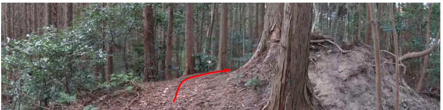
隆岳分岐に出会い、右へ向かう。