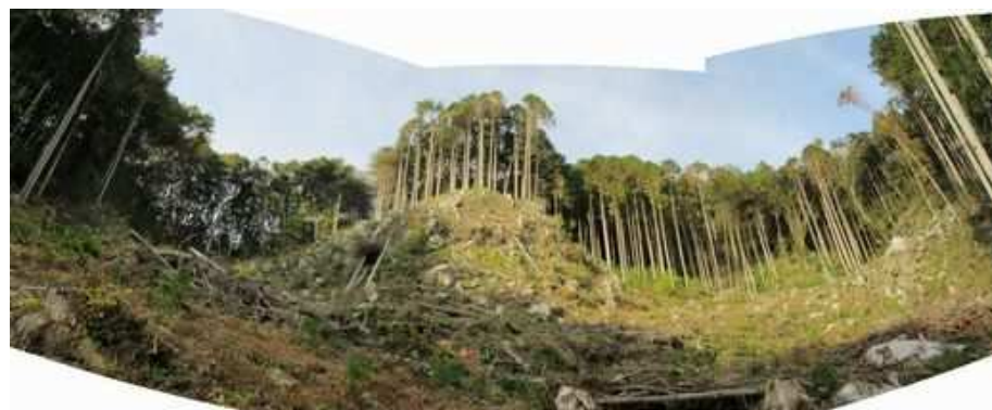
東斜面の尾根筋から下が伐採されている。