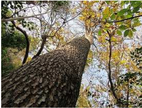
アカマツを見上げる。