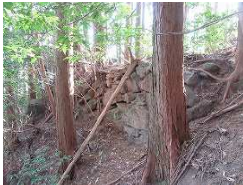
北斜面にも石垣が残る。