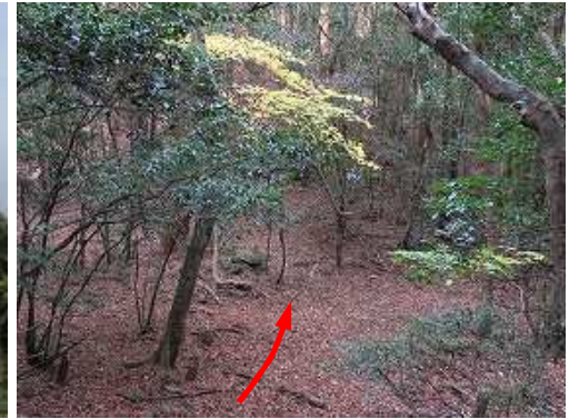
緩く下ると隆岳分岐のコルが見えた。