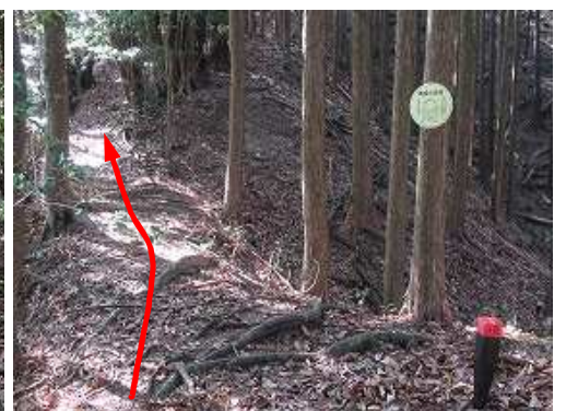
森林標識を見て緩く登って行く。