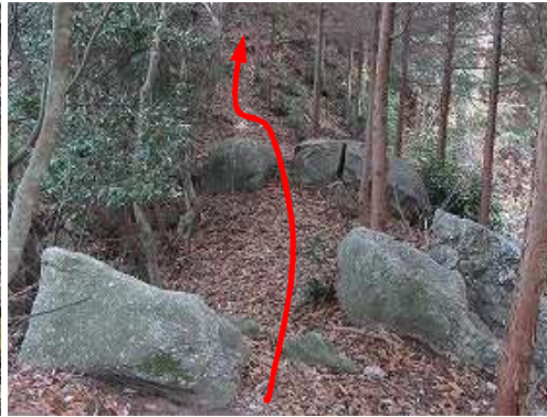
列石の間を抜ける。