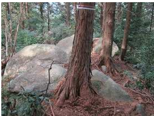
前方尾根筋に露岩を見る。