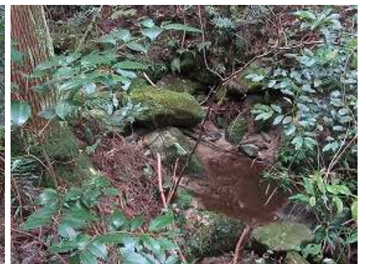
小さな沢沿いに行くと下って行く。