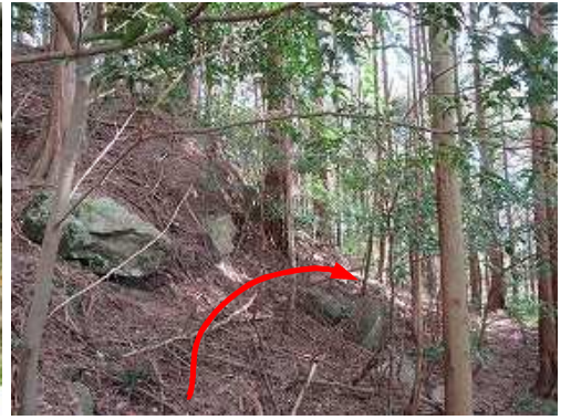
鷲ヶ岳山頂から派生する東尾根に回り込む。