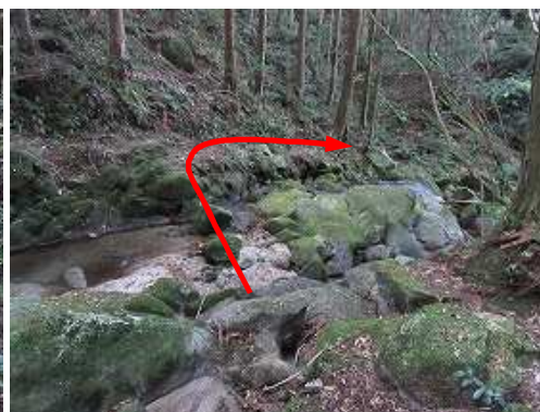
仲ノ畝川を渡渉し左岸沿いにする。