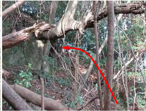
斜面を北へトラバースし、北尾根に登り返す。