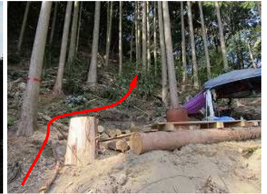
休憩用テントの横から斜面を登る。