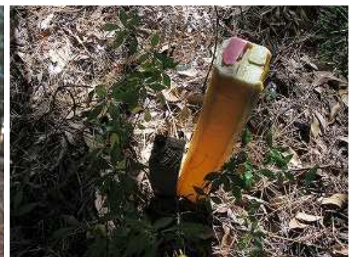
尾根筋の黄プラ杭を見て、南へ進む。