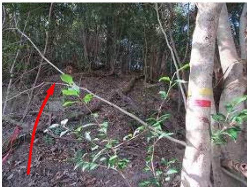
本来のルートに出合い斜面を登って行く。