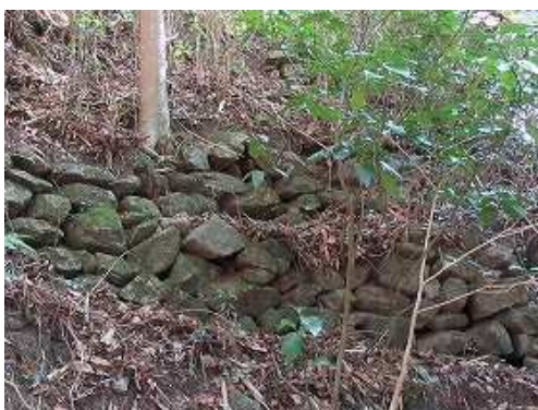
南側斜面にも石垣が残る。