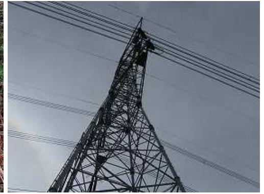
その先に13号鉄塔が聳え建つ。