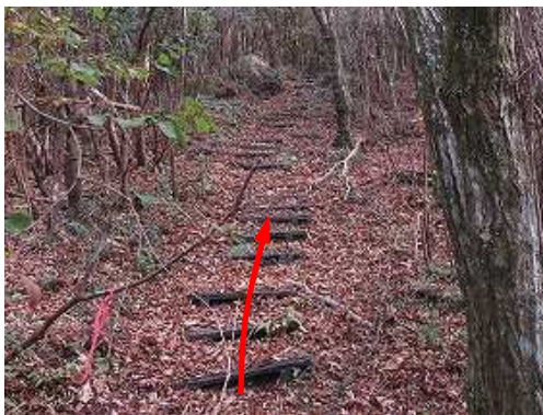
ブラ階段を緩く登って行く。