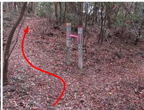
14鉄塔分岐を右に見送る。