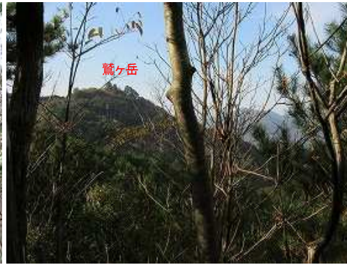
展望地から鷲ヶ岳を望む。