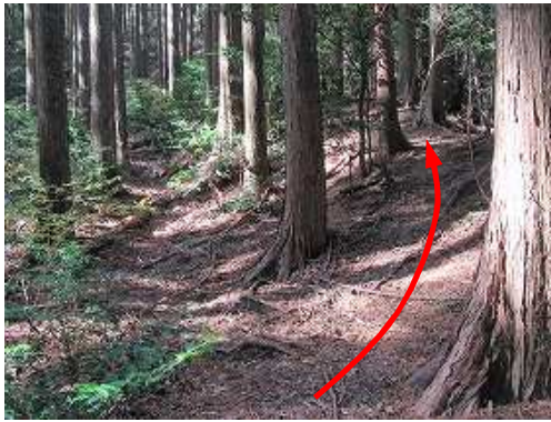
尾根取付 此処から右の尾根筋に上がる。