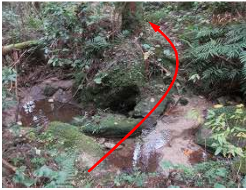
右から降って来た小さな沢を渡渉する。