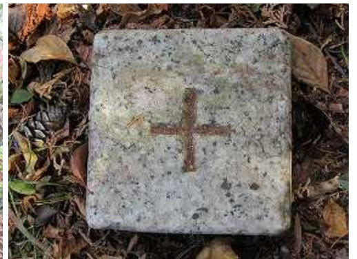
傍に四等三角点:城が設置されている。