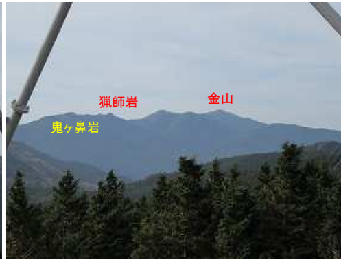
13号鉄塔から西の展望。一休みして、先へ向かう。