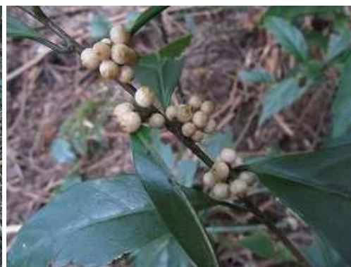
イズセンリョウ 実