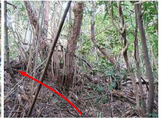
弱い踏み跡の北尾根を登って行く。