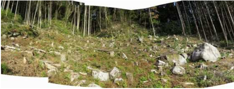
東斜面上部の伐採地を見上げる。