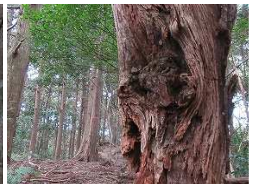
枯死木の左を抜ける。