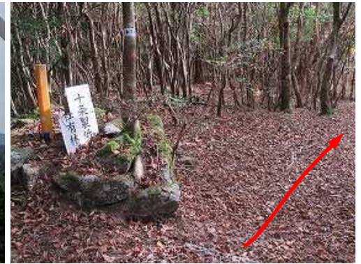
十条製紙分岐を通過する。