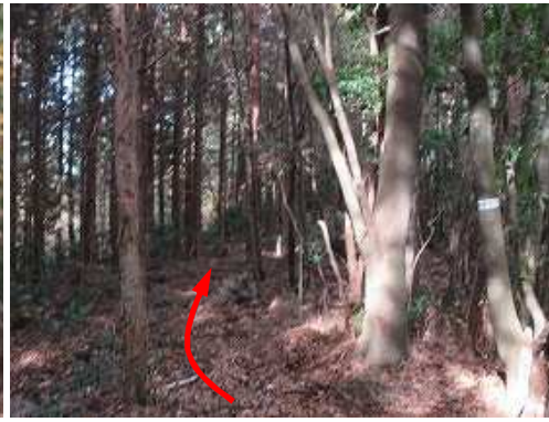
二俣分岐に出会い、左へ進む。