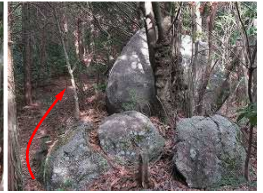
丸岩の左を通過する。