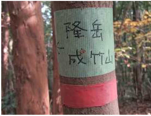
傍の幹に巻かれた案内板。