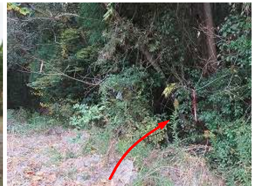
赤ヒモ2本が枝に結ばれた所が取付きで、林中へ入る。