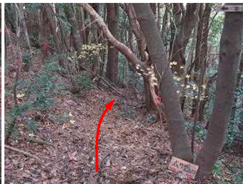
引き返し林道終点分岐へ入る。