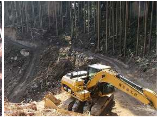
前方下に重機を見る。