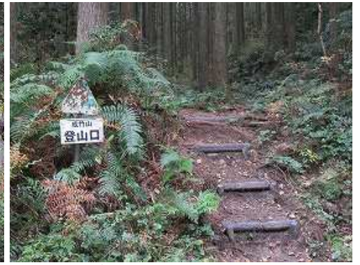
南側に成竹山登山口を見る。