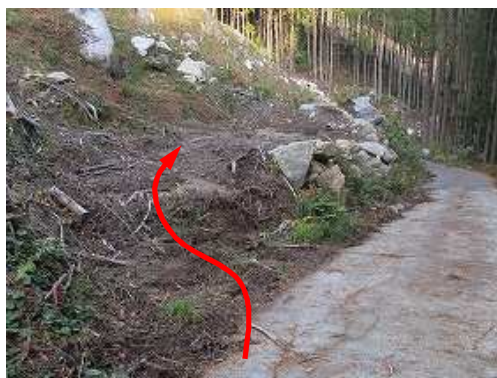
山側に作業路があり、此処から 取付く 。