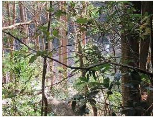
尾根端部の樹幹越しに駐車地を望む。