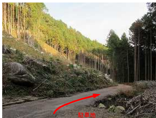
駐車地 駐車地から少し下る。