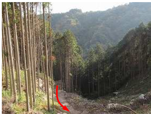
作業路終点から登って来た作業路を見下ろす。これより先初心者、南斜面へ取付き一般道を登って下さい。