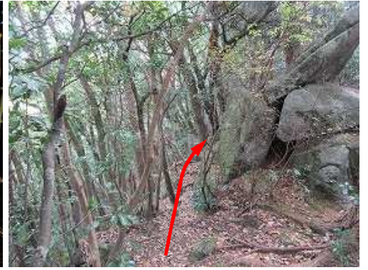
重ね岩の左を抜ける。