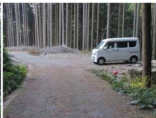
駐車地に帰り着いた。