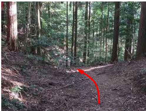
作業路を南東へと下って行く。