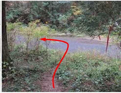
林道終点に出会う。