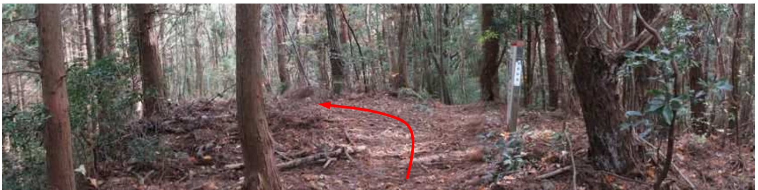
隆岳尾根分岐に出会い、左へ進む。