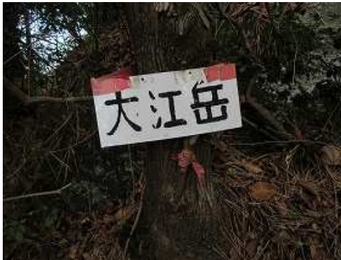
大江岳(標高値687m)の山名板を見る。周囲を樹木で囲まれ展望は得られない。