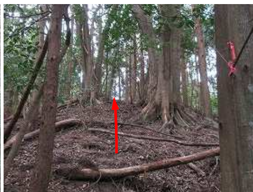
自然林斜面を緩く登って行く。