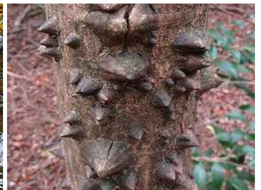
カラスザンショウ 樹皮