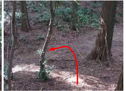
下ると作業路に出会い、左へ進む。