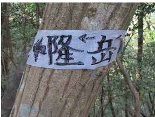
傍の幹に案内板を見る。