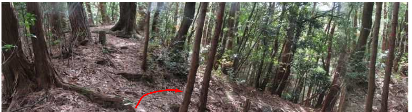
此処から右方向へ向かう。