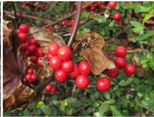
サルトリイバラ 実