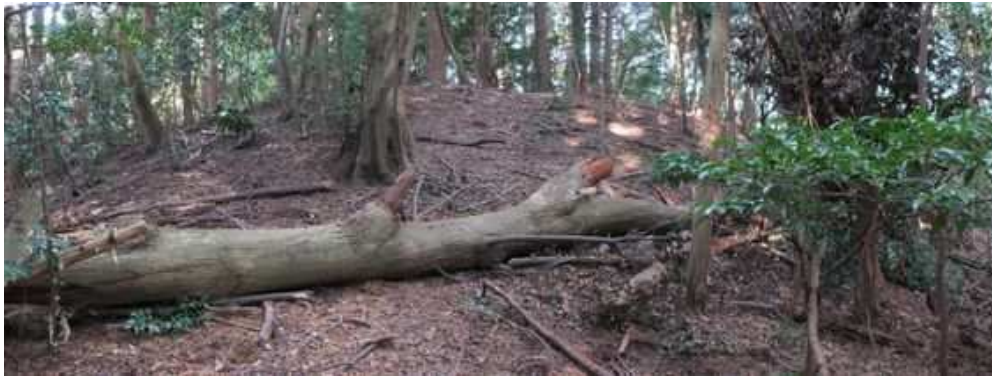
倒木が横たわる斜面を登って行く。