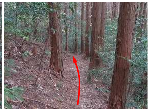
スギ植林地に行く。