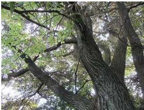
イヌシデの大木に出会う。