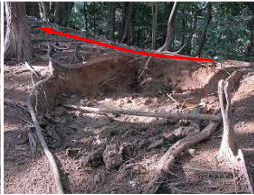
斜面をひと登りした所で、ぬた場を見る。