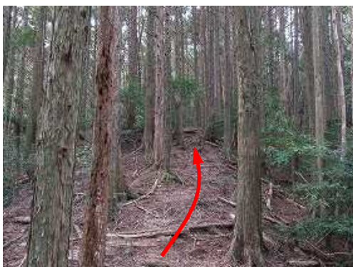
植林斜面を緩く登って行く。