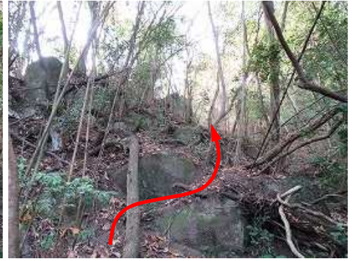
露岩の裾を右へ回り込み尾根上部へ登り返す。