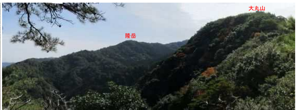
亀岩から南南東の展望。