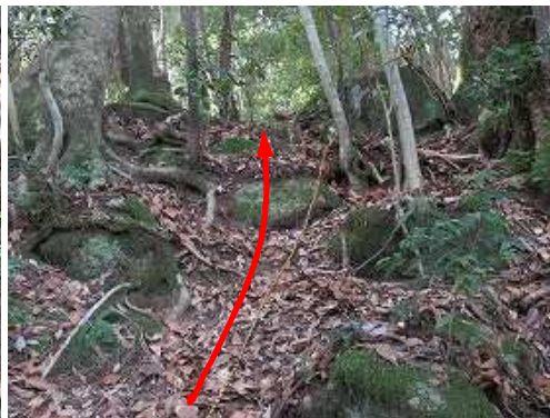
傾斜の急な斜面にはトラロープが見られる。