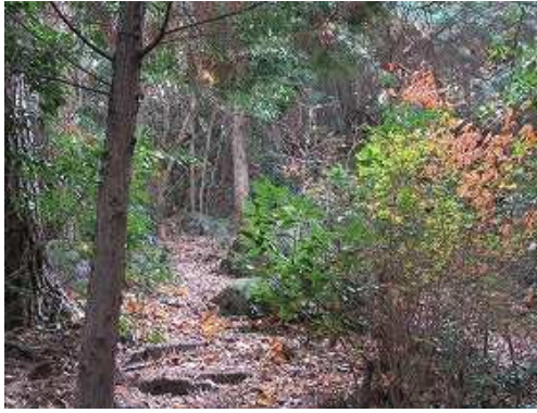
尾根筋を緩く登って行く。