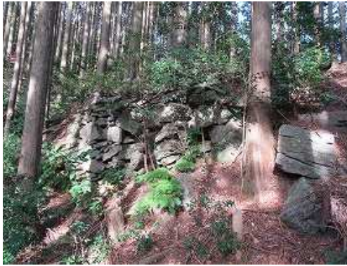
東尾根端部の南斜面に石垣を見る。