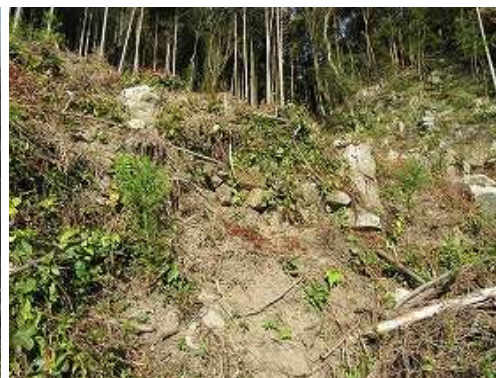
北斜面上部に鷲ヶ岳城の石垣を見つける。是より先は、難路となる。