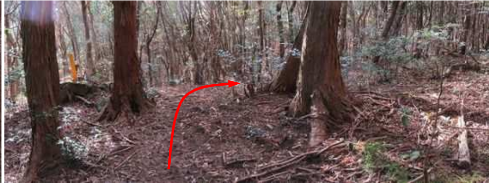
十条製紙分岐に出会い、右へ向かう。