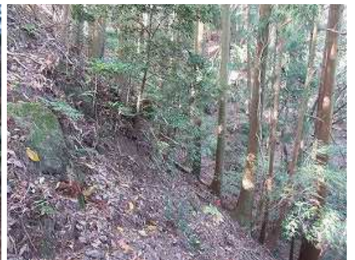
傾斜の急な北斜面に入る。