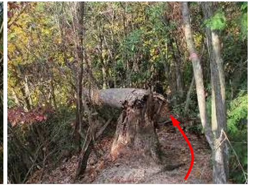
倒れた枯死木の脇を抜ける。