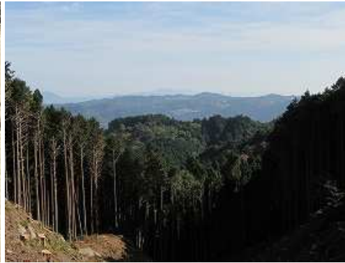
林道から東の展望。