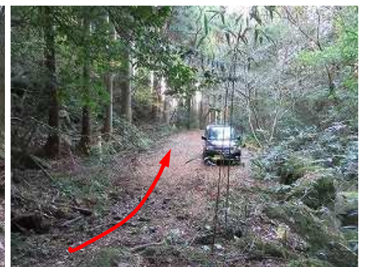
仲ノ畝林道終点に出会う。