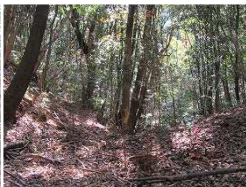
弱いコルに降り立ち、南西へ踏み跡を辿る。