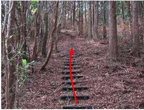
九電巡視路のブラ階段を緩く登って行く。