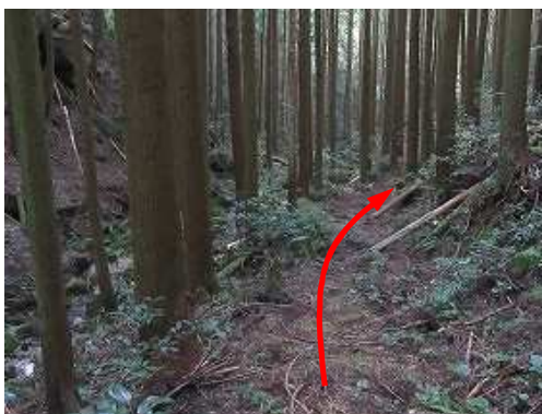
スギ植林地内の作業路を下って行く。