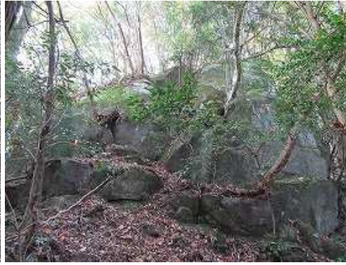
尾根筋北面の露岩を見上げる。