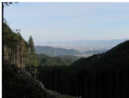
ひと登りして振り返ると、那珂川市等が望まれる。