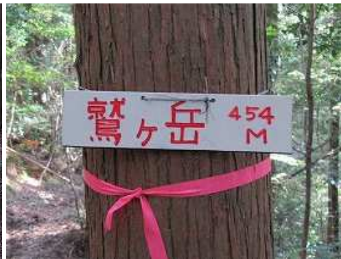
右のヒノキの幹に鷲ヶ岳の山名板を見る。454Mは標高。