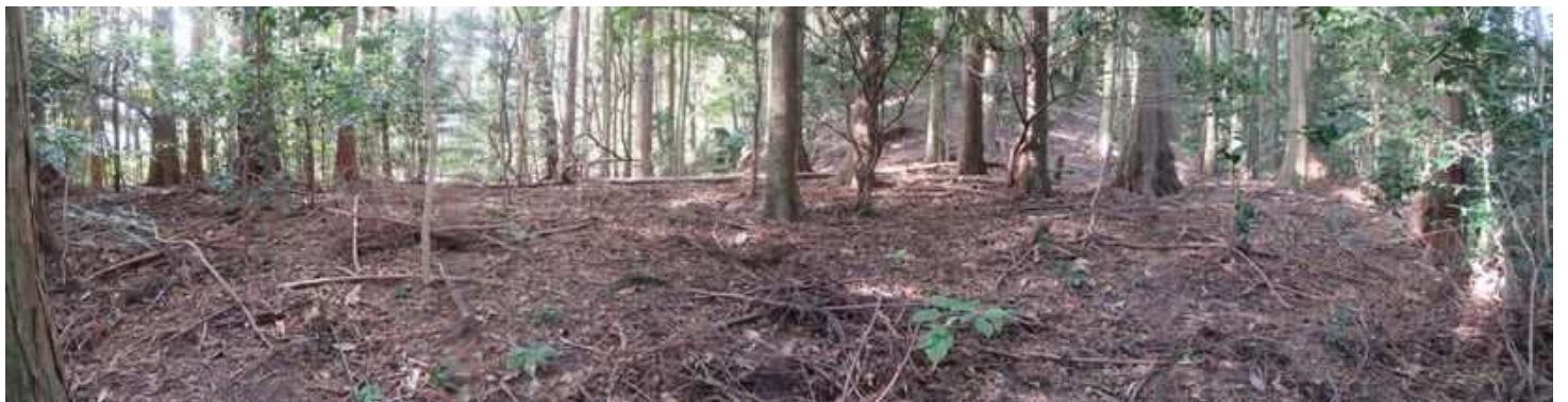
東端部から見た曲輪跡。