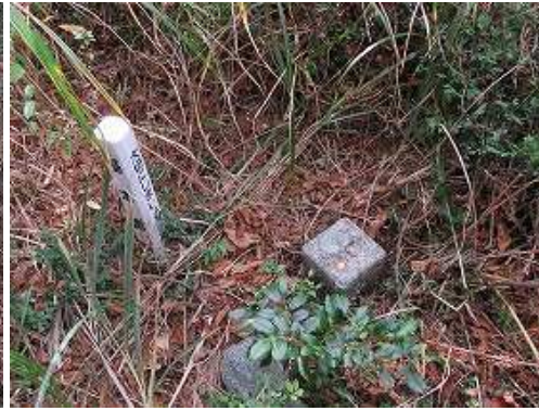
四等三角点: 樫木畑を見る。