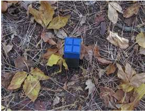
尾根筋に青杭を見る。