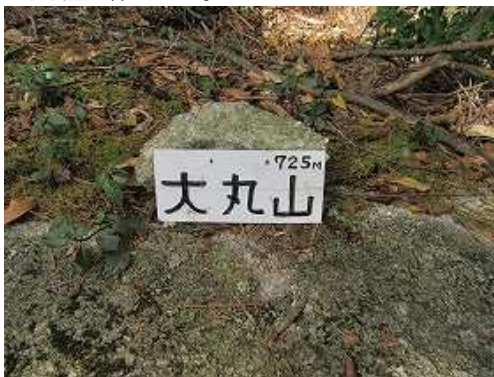
露岩の上に大丸山(725m)の山名板を見る。