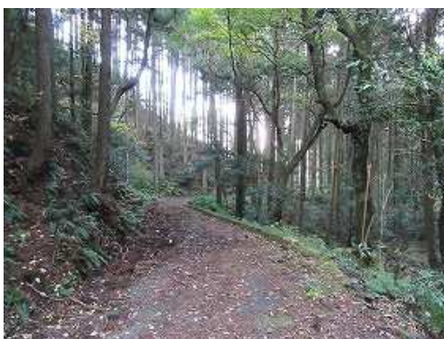
林道を道なりに下って行く。