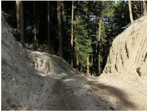
林道出合 林道が南北に通っている。