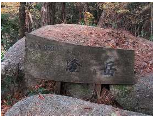
隆岳(660m)の山名板を見る。