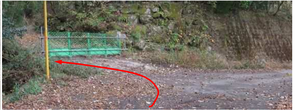
此处から左折し、バイク教習場跡へとゲートの脇を抜ける。