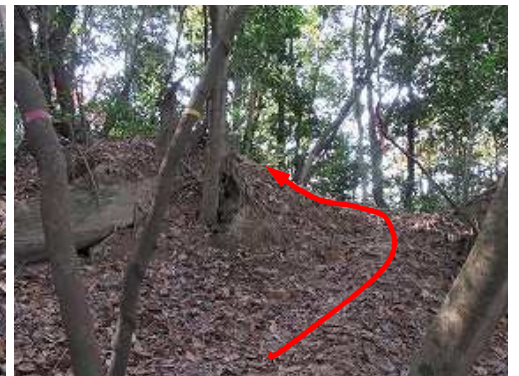
主尾根端部に登り上がり、左へ進む。