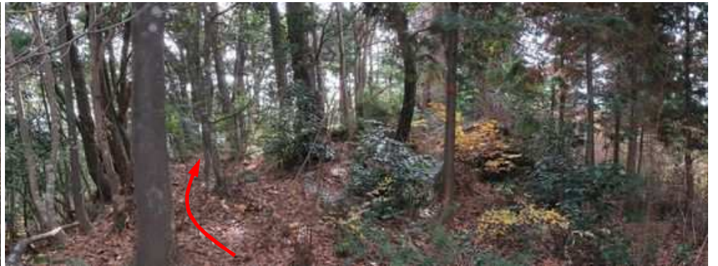
此処のピークが大丸山(標高値700m)と思われる。