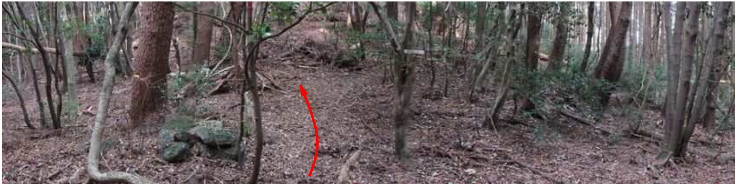
弱いコルにある隆岳分岐から北東の斜面に取付く。