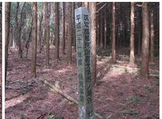
左に植林杭を見送る。