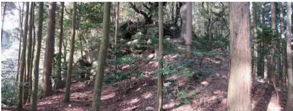
曲輪跡から続く尾根筋の上部。