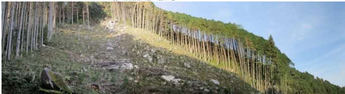
鷲ヶ岳登山口のある仲ノ畝林道を道なりに上がると、以前登山口であった東斜面が伐採されていた。以前の登山口傍の路肩が広げられ 駐車地 になっていた。

駐車地→取付き→作業路終点→曲輪跡→鷲ヶ岳(454m)→林道出合→主尾根端部→亀岩→矢吹岳(617m)→大江岳(690m)→十糸製紙分岐→13鉄塔→隆岳尾根分岐→隆岳(660m)→林道終点→隆岳分岐→作業路出合→駐車地