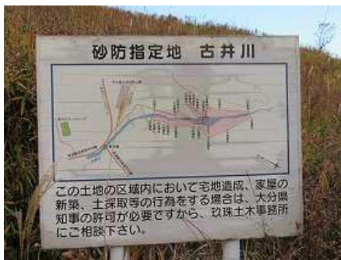
右に古井川の砂防案内板を見る。