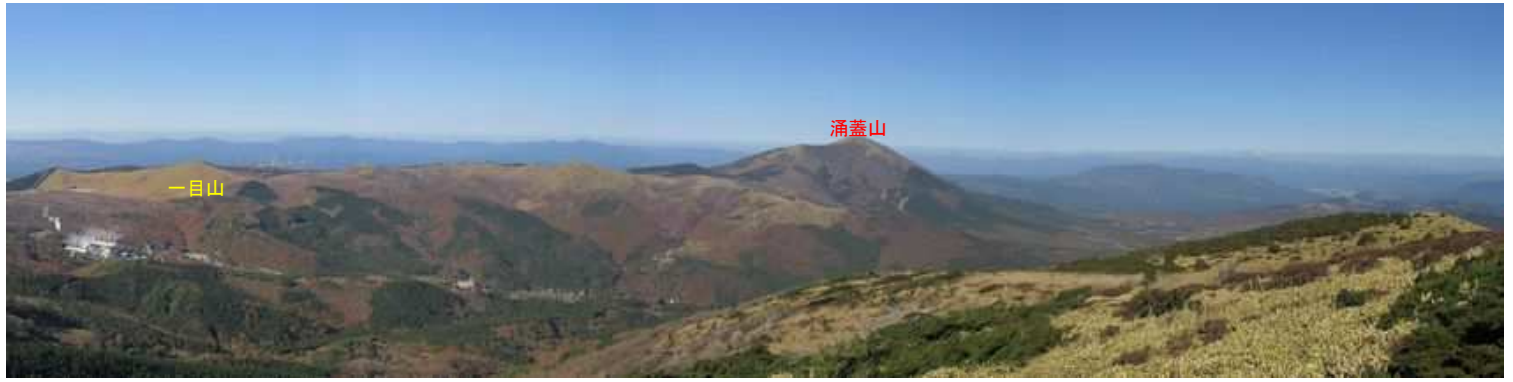
大崩ノ辻からの展望。