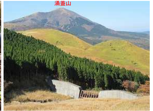
堰堤と涌蓋山を見る。