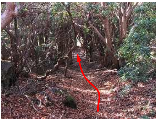
アセビ林を抜ける。