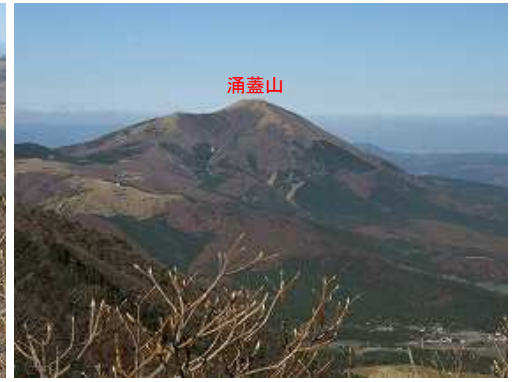
北西に涌蓋山を望む。