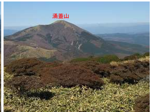
ミヤマキリシマと涌蓋山。