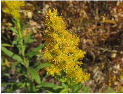
セイトカアワダチソウ