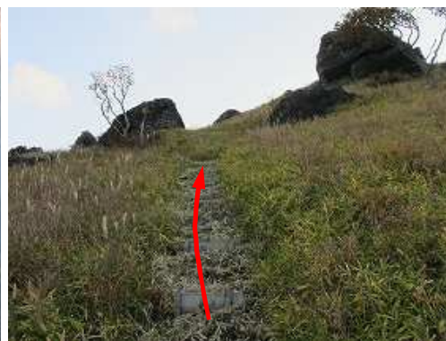
板階段を登って行く。