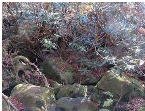
シャクナゲ谷を通過する。