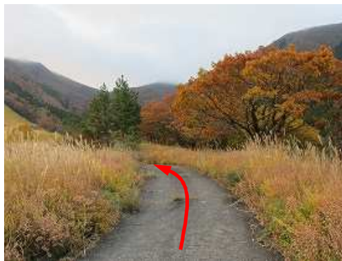
駐車地から南に向かって舗装路を緩く登って行く。