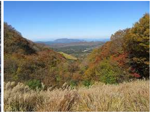
ズリ捨場に出会い、端部からの展望。