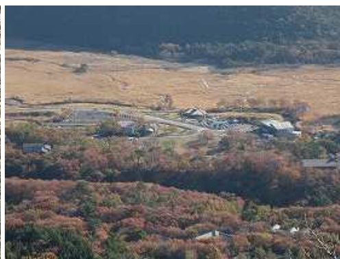
東北東に長者原駐車場を見下ろす。