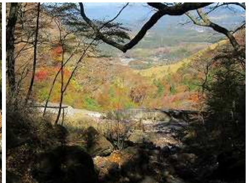
前方に砂防ダムが見えた。