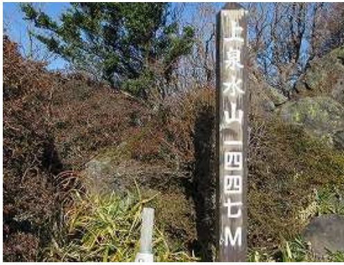
尾根筋にある上泉水山(1447m)の山頂。