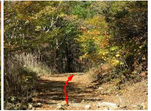
資材路を道なりに下って行く。