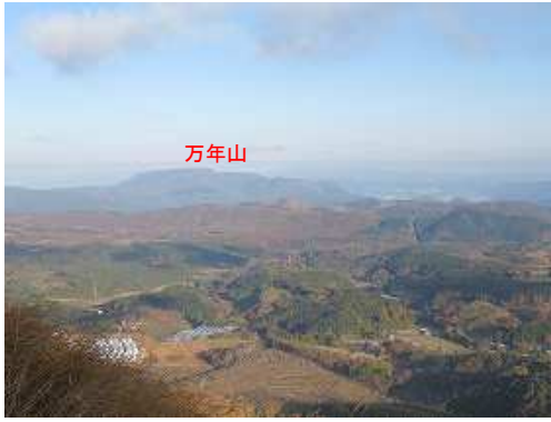
縦走路出合から北に万年山を望む。