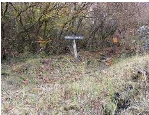
前方に案内板が見え、縦走路に出合う。