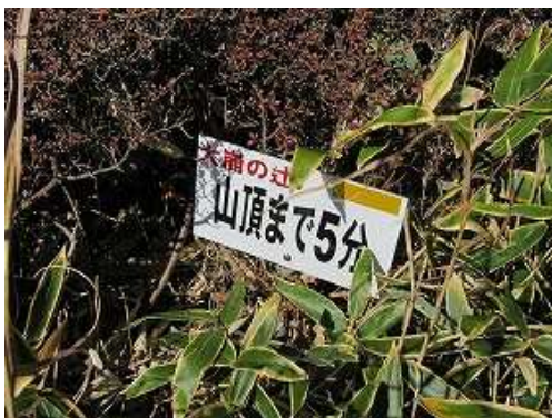
斜面を登り返すと山頂まで5分の案内板を見る。