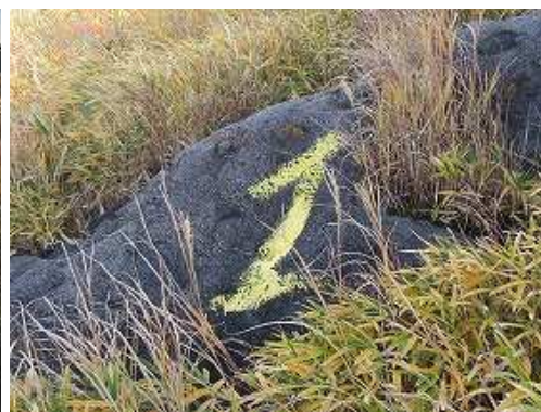
岩に矢印を通過する。