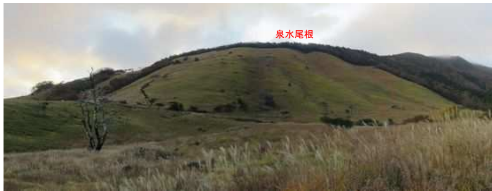
舗装路から東の泉水尾根を望む。