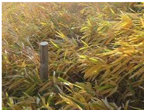
コザサ斜面の丸太杭を伝う。