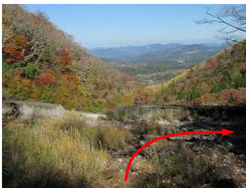
砂防ダムAに出会う。