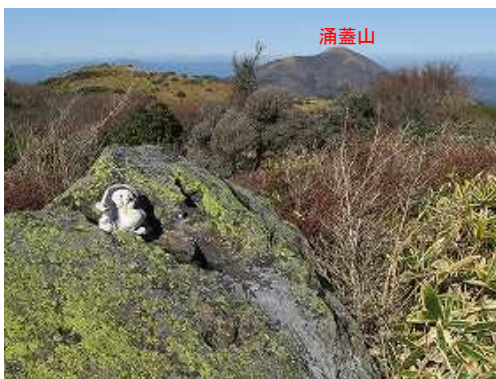
ためぎピークの狸の置物。