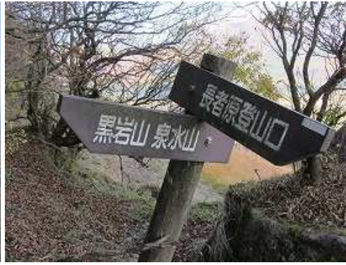
この案内板から山中に入る。