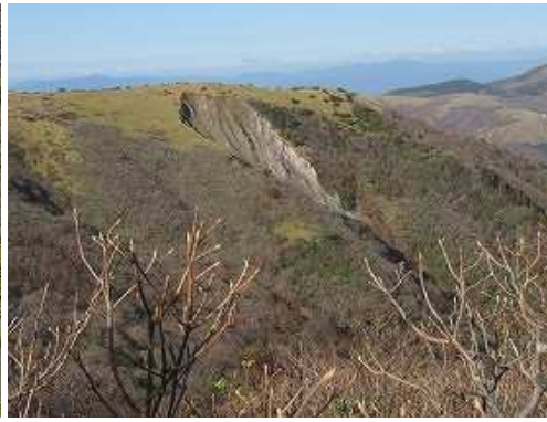
西に大崩ノ辻の崩落地を望む。