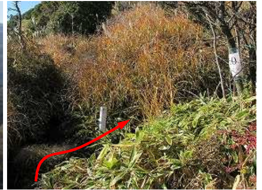
ためぎピーク分岐から南西の斜面に取付く。