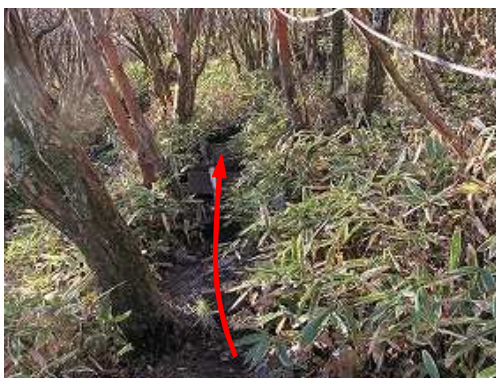
上泉水山への急な板階段を上る。