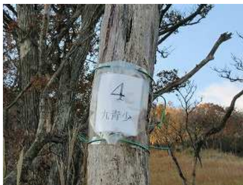
山側の枯幹に丸青少4を見る。