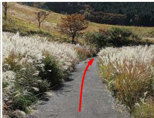
資材路分岐を左折し、スキの舗装路を下って行く。