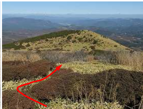
北へコザサを分けて進む。