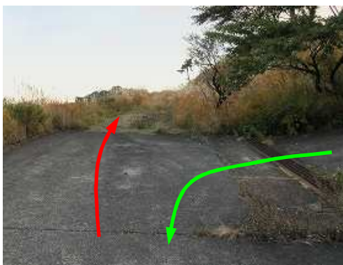
資材路分岐に出合い直進する。 帰路、右から下りて来た