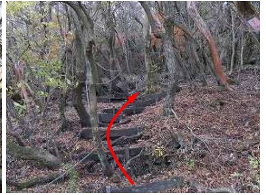
板階段を緩やかに登って行く。