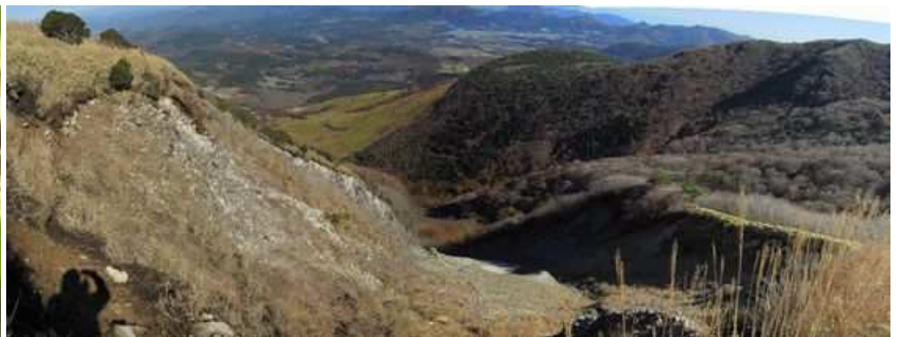
崩落地上部から下流を望む。 これより先は獣道ですので、下らないように！