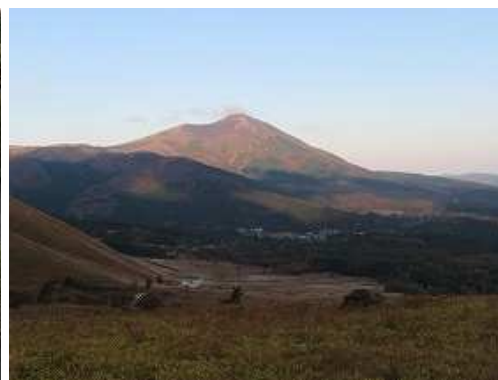
北西に朝焼けの涌蓋山を望む。