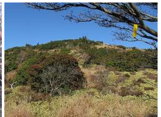
シャクナゲ谷を抜ける。