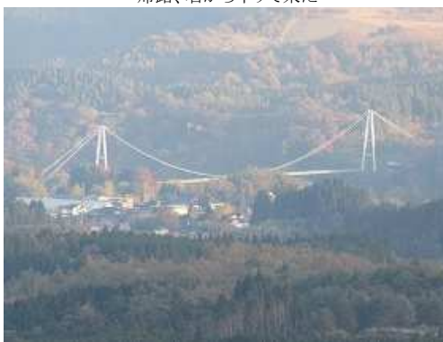
北の夢大吊り橋を望遠で望む。