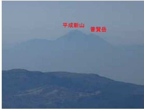
西の普賢岳を望遠で撮る。