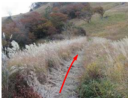
刈り払われたカヤ野を進む。