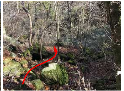
縦走路取付きを出る。此処から沢へ下る。