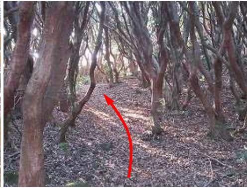
アセビのトンネルを抜け登る。