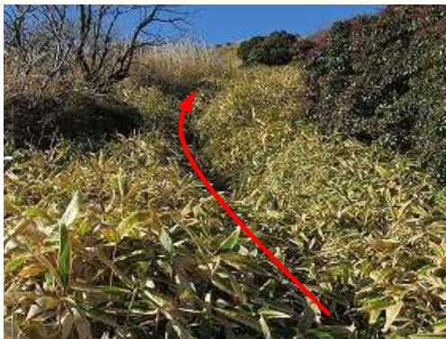
コザサ斜面を登って行く。