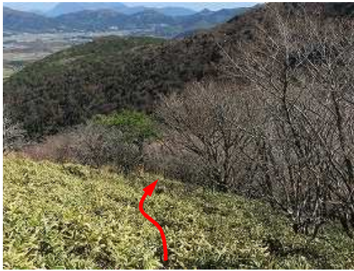
コザサ帯の獣道を下る。