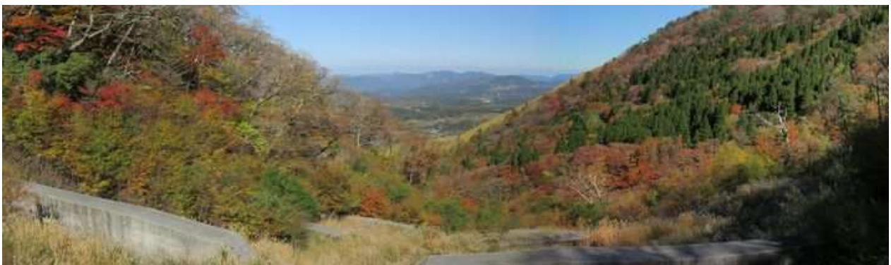
砂防ダムBから下流の展望。右岸側を下る。