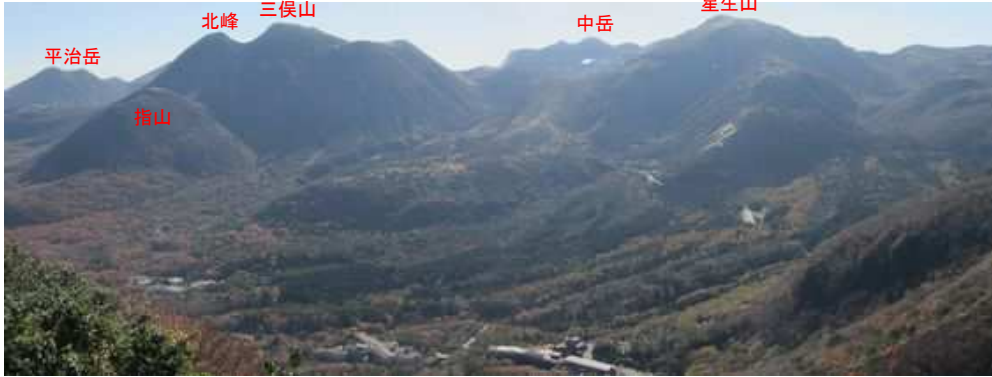
展望地から東～南東の展望。