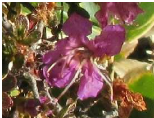
季節外れのミヤマキリシマ。