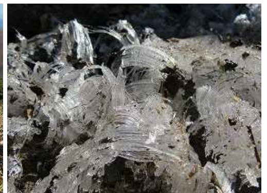
霜柱が立っていた。