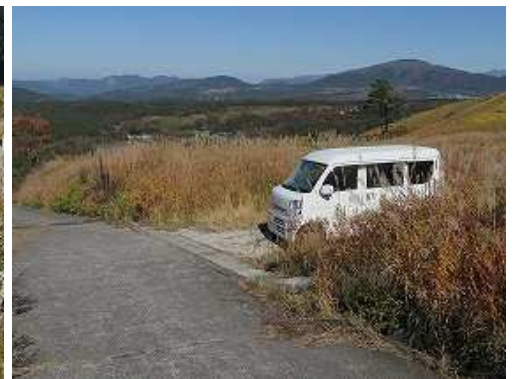
駐車地に帰り着いた。