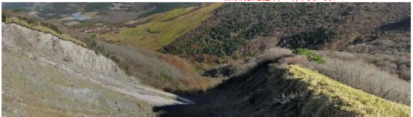
東側のコザサ帯へ回り込む