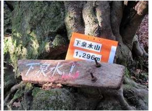
下泉水山(1296m)の山名板を見る。