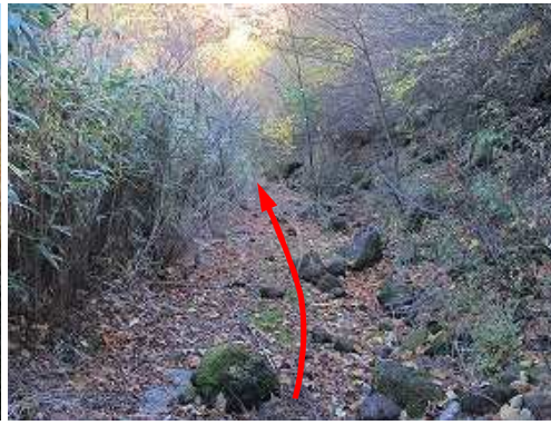
作業路跡に出会い、これを下って行く。