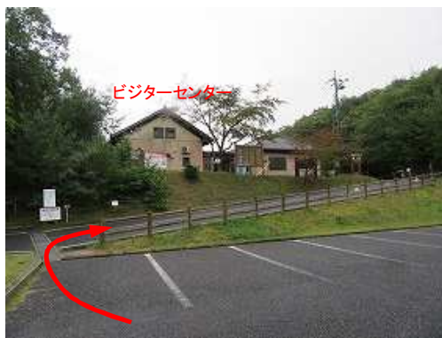
車を止めた鬼ノ城ビジターセンターの駐車場から小雨の中、歩き出す。