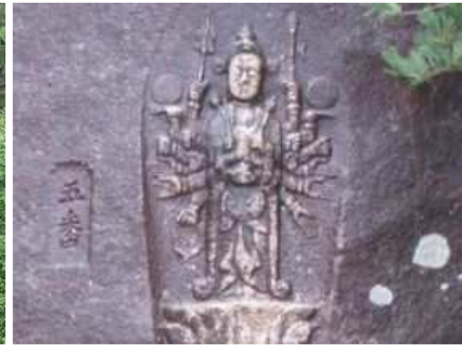
山側の巨岩に千手観音が彫ってある。