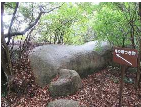
南側に鬼の餅つき岩を見る。