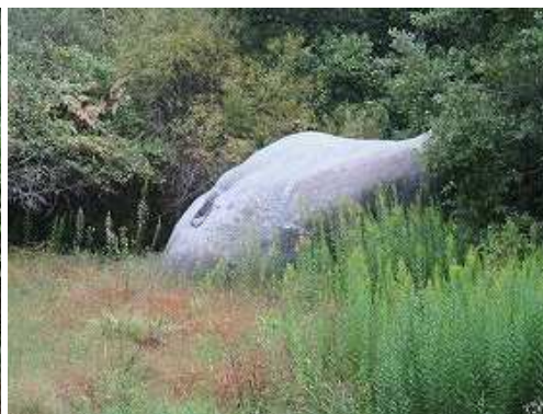
北に鬼の昼寝岩を見る。