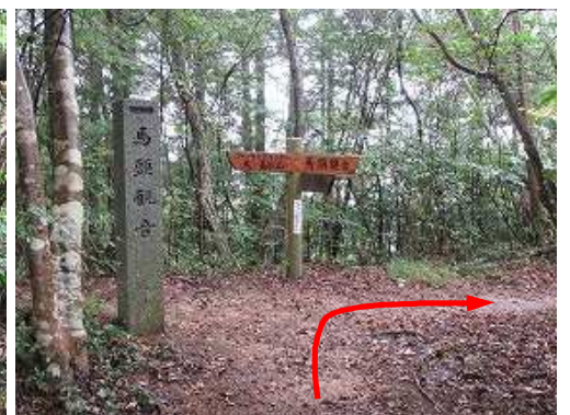
分岐に出会い、馬頭観音へ右折する。