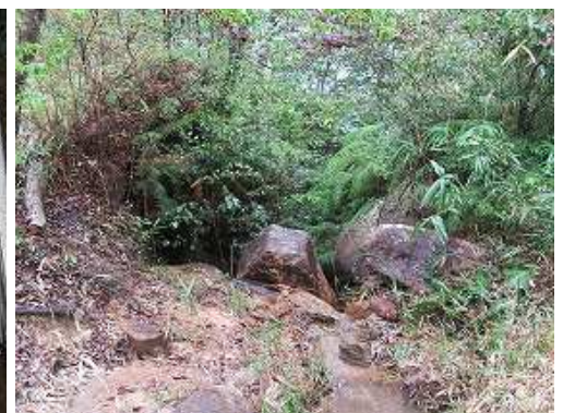
第4水門跡を通過する。