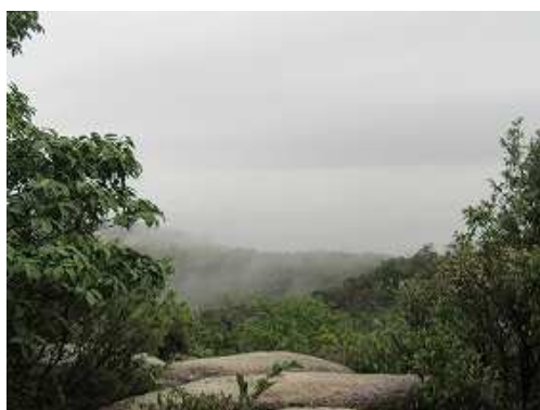
その先で東側に展望岩場を見る。