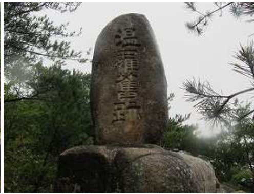
温羅奮跡碑を通過する。