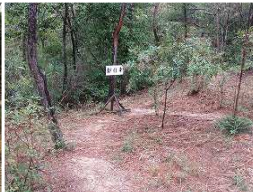
鍛冶工房跡を見る。