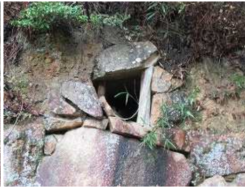
排水口が石積の上部に見られる。