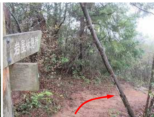
分岐まで引き返し、緩く下って行く。