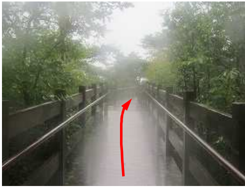
鍵岩展望台へ立ち寄る。