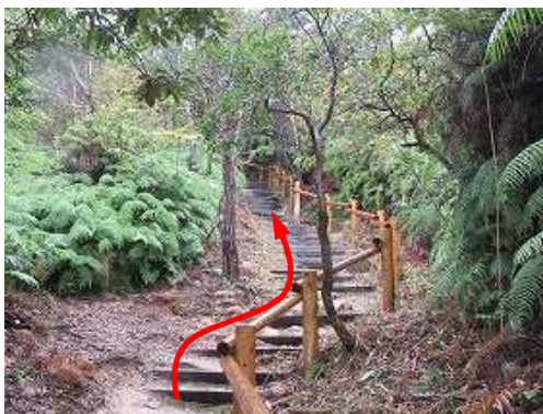
手摺階段を登って行く。