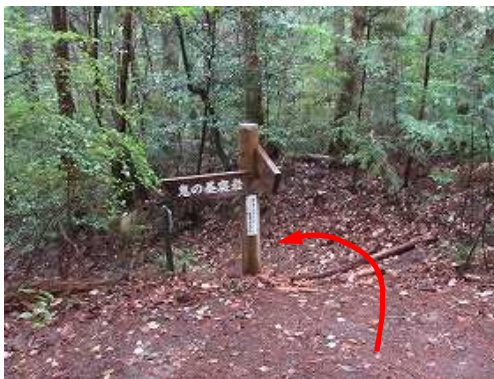
鬼の昼寝岩へと向かう。