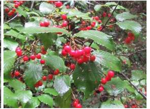
オトコヨウゾメ 実