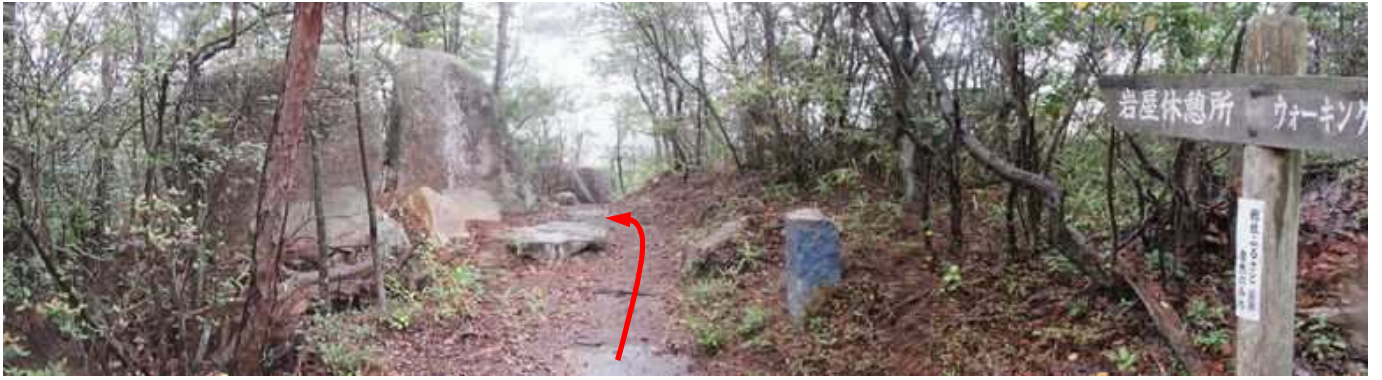
犬墓山直前の案内板。