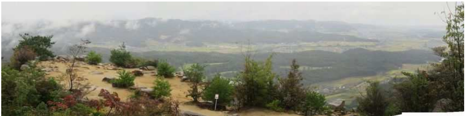
西側の高台から屏風折れの石垣を見る。