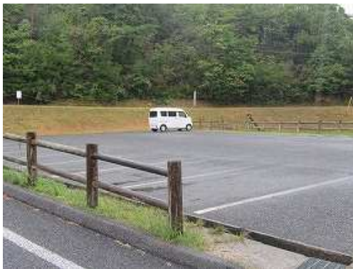
駐車場に帰り着いた。