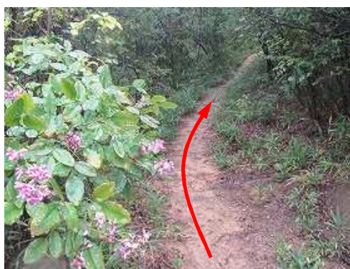
緩やかに登って行く。