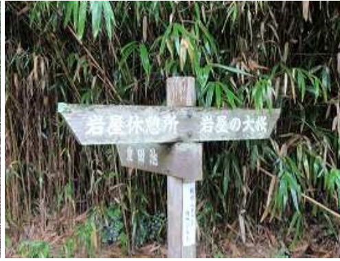
大桜分岐に出会う。