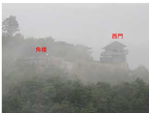
望遠で西門を撮る。