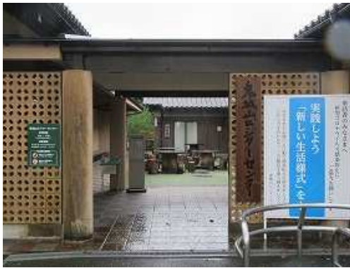
鬼城山ビジターセンターへ立ち寄る。