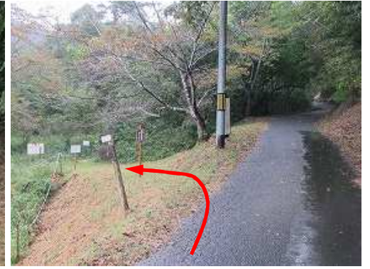
直ぐ左に北門分岐と出会う。