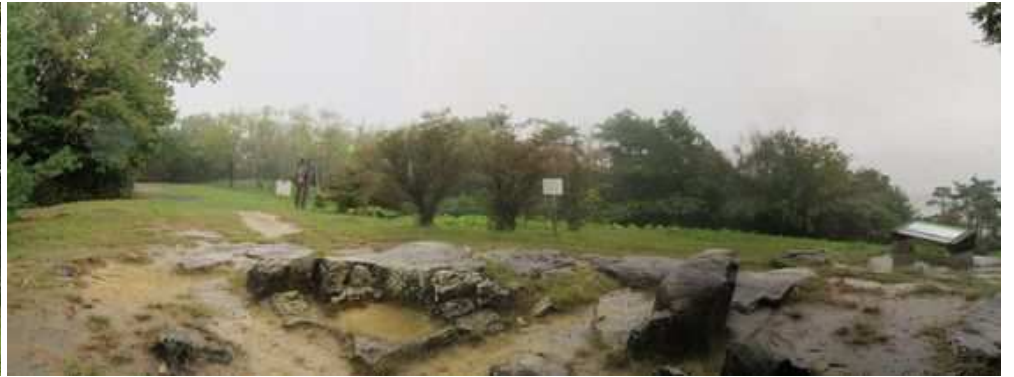
東屋から鬼城山(397m)方面を望む。