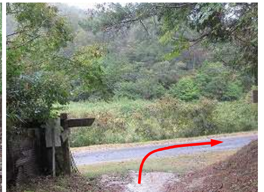
岩屋分岐の市道に出会い、右へ向かう。