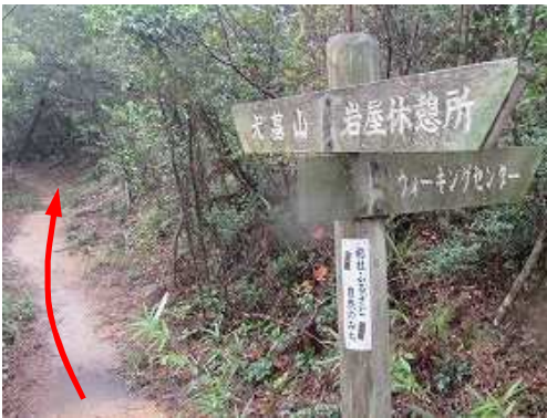
この案内板が立つ分岐を東へ進む。