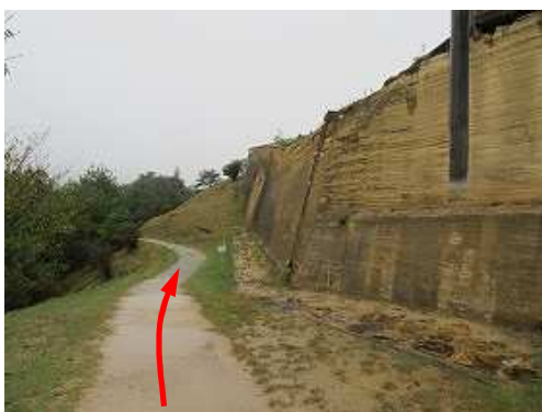
西側城壁に沿って進む。