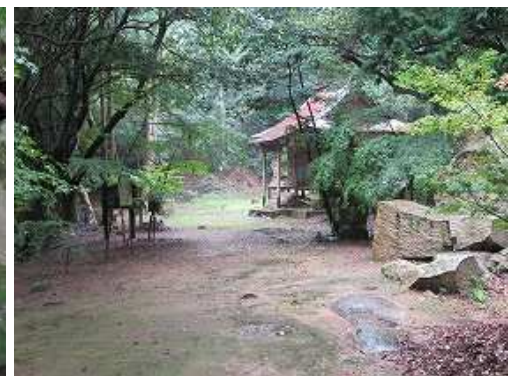
奥に岩屋寺が見えた。