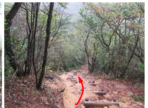
丸太階段を下って行く。