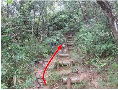
間隔のあいた丸太階段を登って行く。