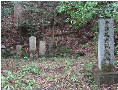
山側に延寿院墓地を見る。