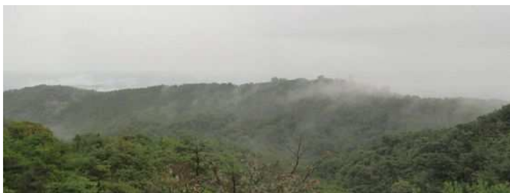
展望岩場から西門を望む。