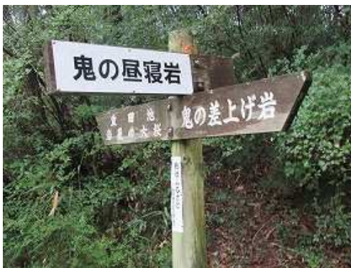
鬼の昼寝岩の案内板を見る。