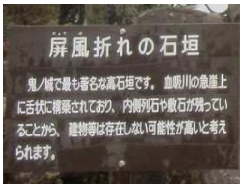
屏風折れの石垣案内板。