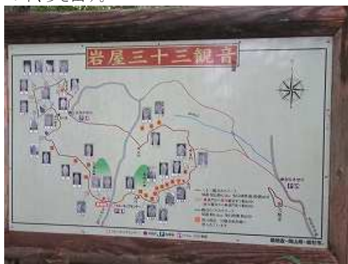
傍に「岩屋三十三観音」の案内板が立つ。