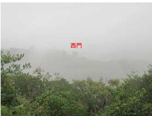
犬墓山展望地から何とか西門が確認できた。