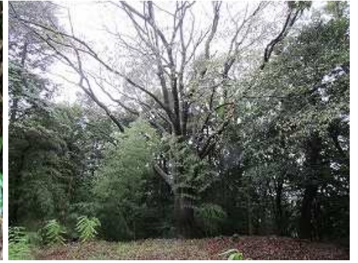
岩屋の大桜に立ち寄る。