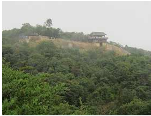
鍵岩展望台からの西門。