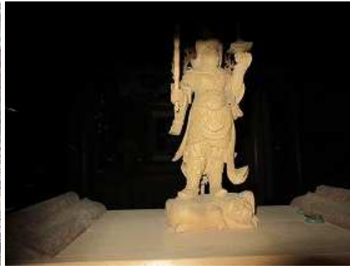
格子から中を覗いて毘沙門天像を見る。