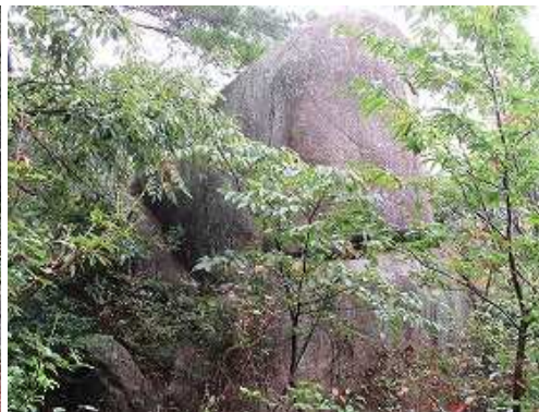
屏風岩へ立ち寄る。