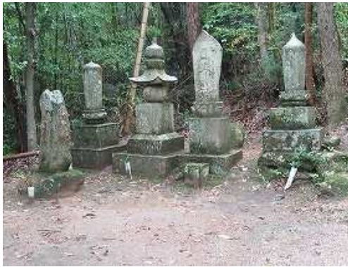
右に墓地を見送る。