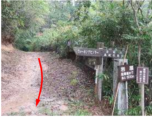
降りて来た道を振り返る。