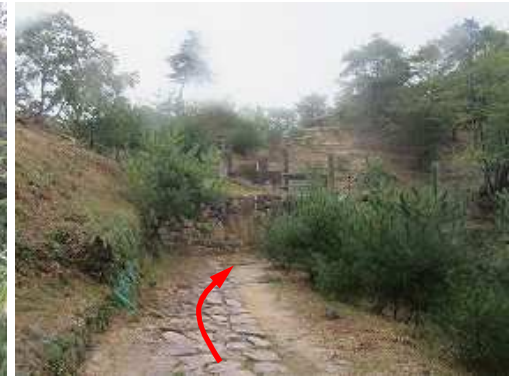
前方に北門の石垣が見えた。