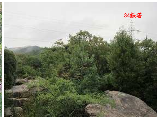
方位岩の岩上から34鉄塔方向を望む。