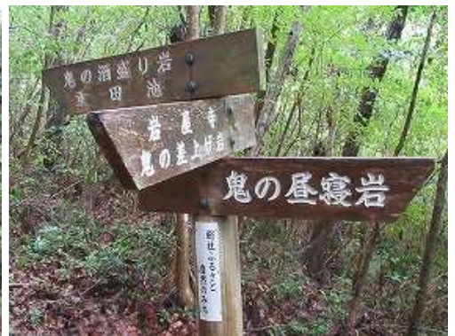
この案内板から右に転回し、緩やかに下って行く。