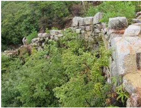
南側東端から見た南面の石垣。