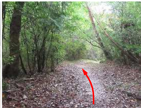
沢沿いに緩やかに下って行く。