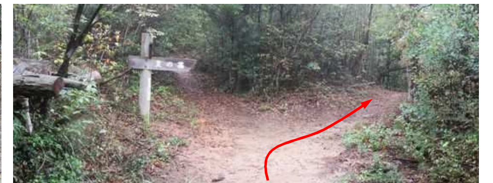
馬頭観音分岐に出会い、右の皇の墓へ進む。