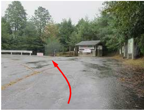
岩屋休憩所に到着。