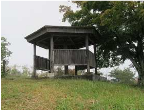
背後の東屋に立ち寄る。