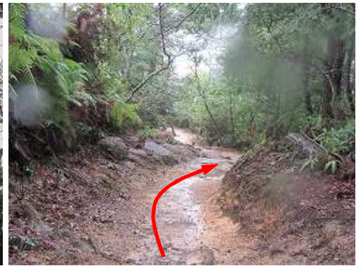
緩やかに下って行く。