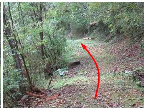
作業路を道なりに下って行く。