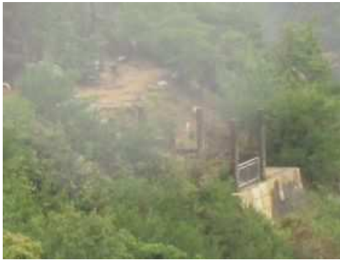
高石垣から東門を見る。