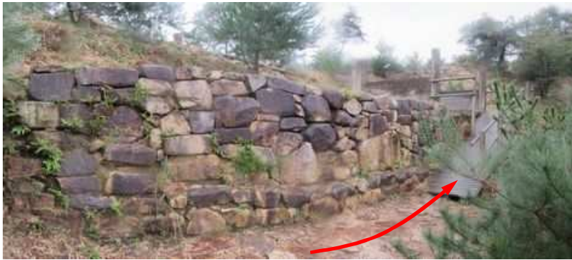
北門の石垣に沿って進む。