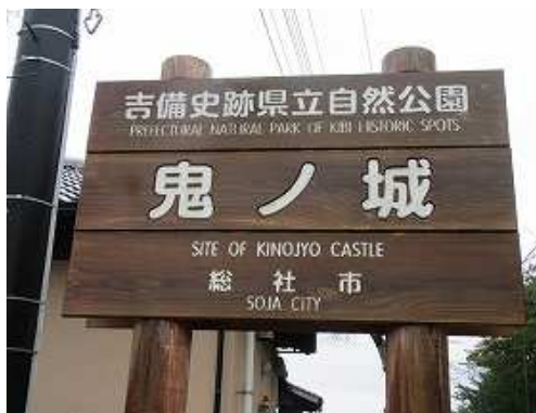
駐車場入り口の案内板。