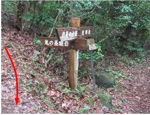
案内板を通過する。