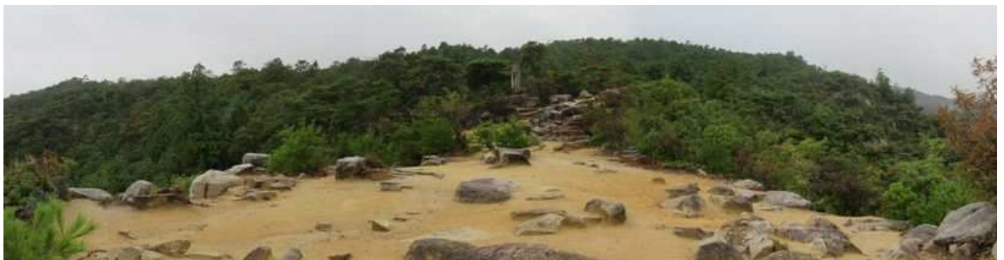
東端から屏風折れの石垣の地上を見る。