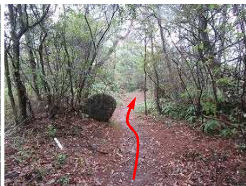
傾斜が緩み平坦となって来た。