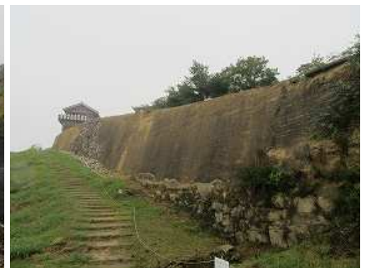
第0水門と版築土塁の城壁の奥に西門を見る。