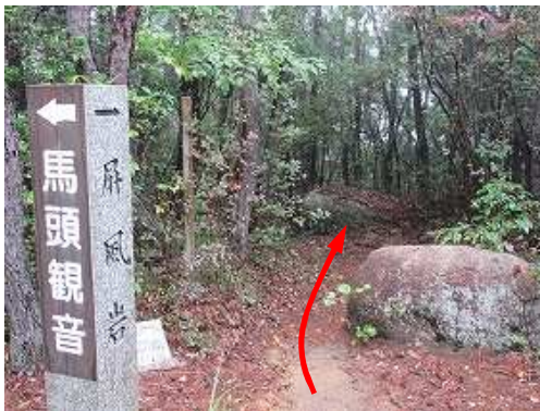
屏風岩分岐に出会う。