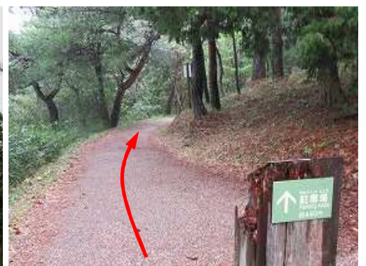
駐車場へと緩く下って行く。