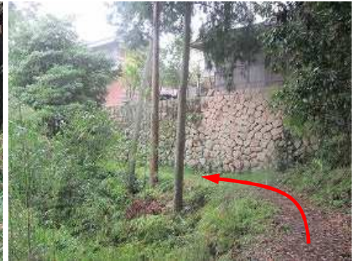
民家が見え石垣の下を通過する。