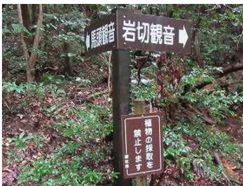
岩切観音分岐Aを見送り、馬頭観音へ。