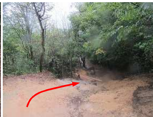
マサ土の下り坂に行く。