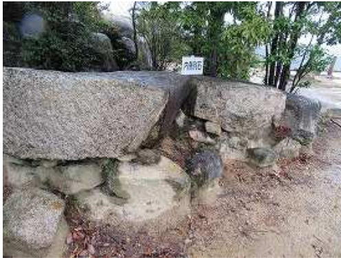
高石垣の内側列石。