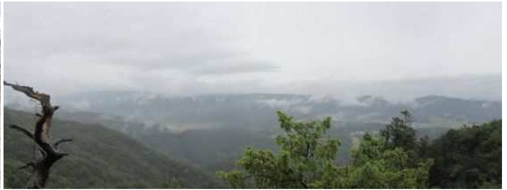
展望B 北東の山並みが望まれる。