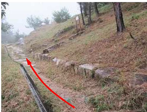
神籠石状列石が続く。