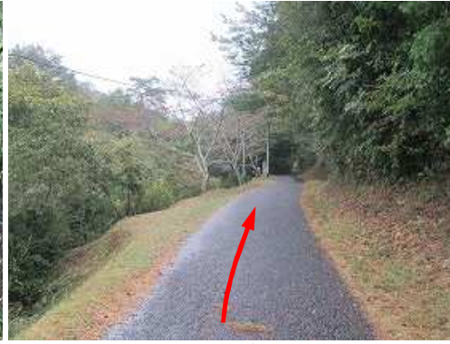
市道の舗装路を南西に進む。