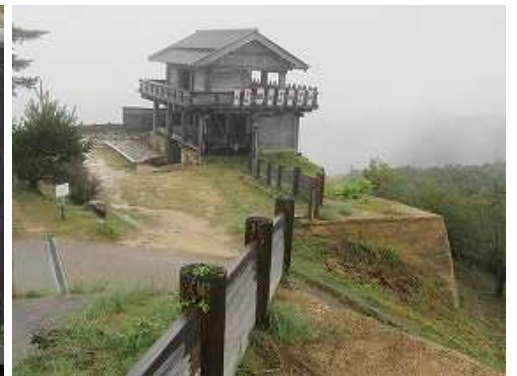
角楼跡から見る西門。