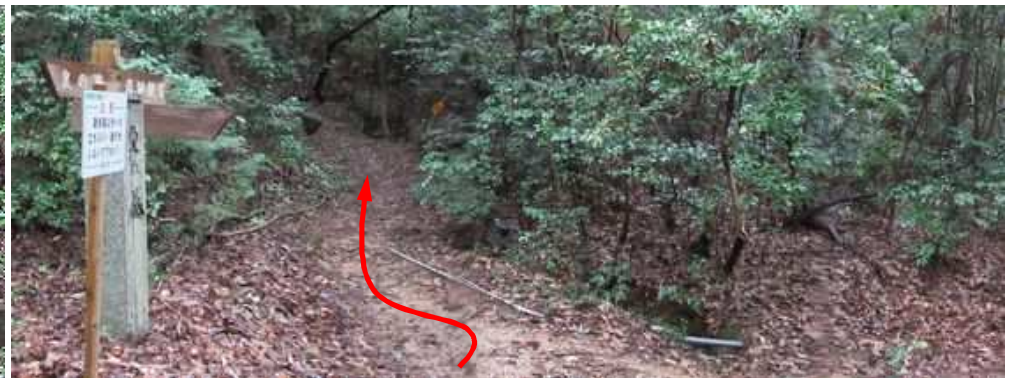
岩屋休憩所分岐に出会い、西へ進む。