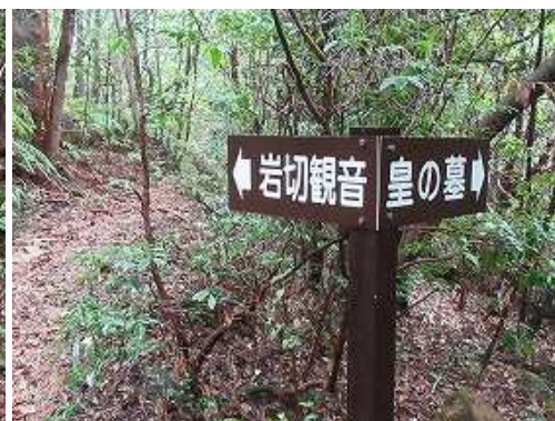
岩切観音分岐Bを見送る。