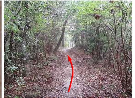
東へ緩やかに下って行く。