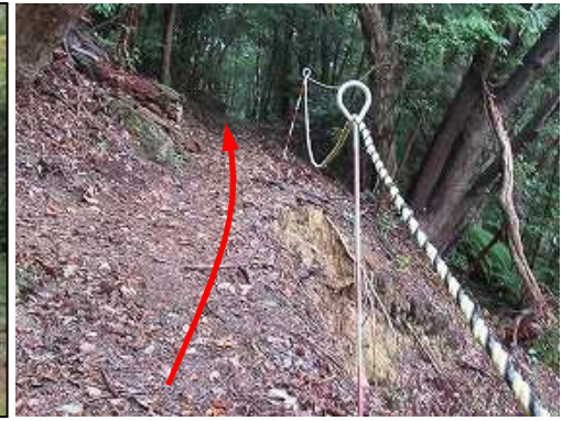
トラロープが張られた崩落斜面の上部に行く。