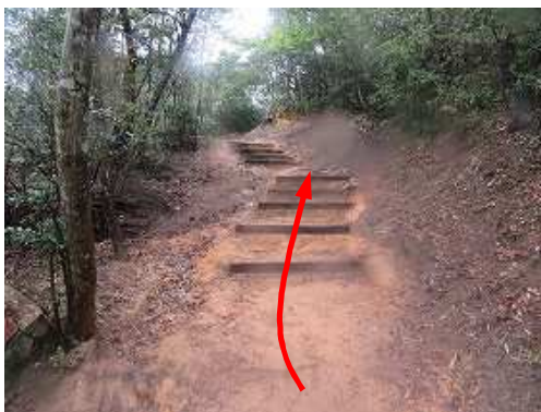
赤土の上り坂に行く。