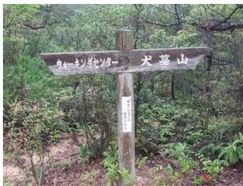
最初の案内板を見る。