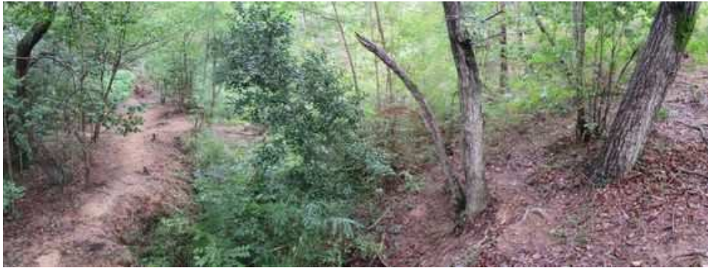
土手状遺構を見る。