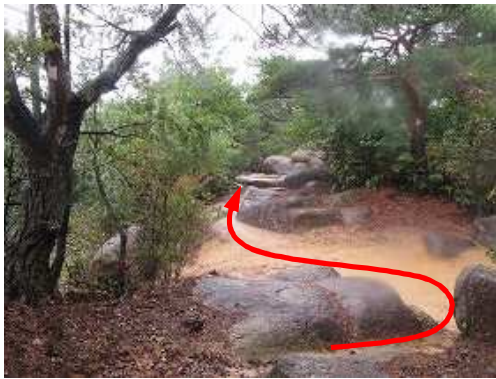
石垣際の露岩帯を進む。