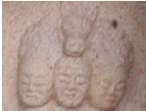
拡大した馬頭観音頭部。