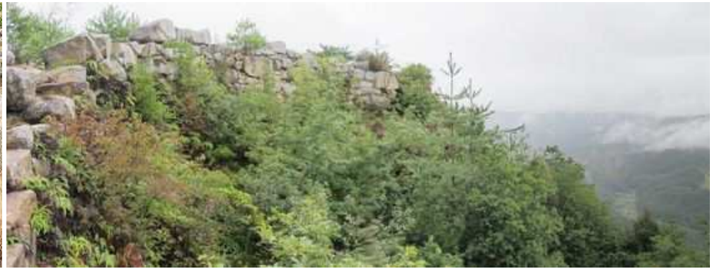
南面中間点から見る東端方面の石垣。