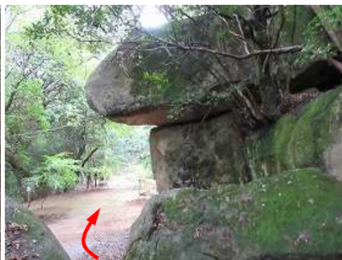
此処から岩屋寺へ降る。