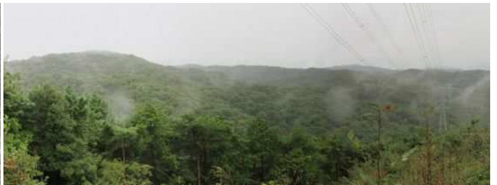
送電線直下から見た北の山並み。