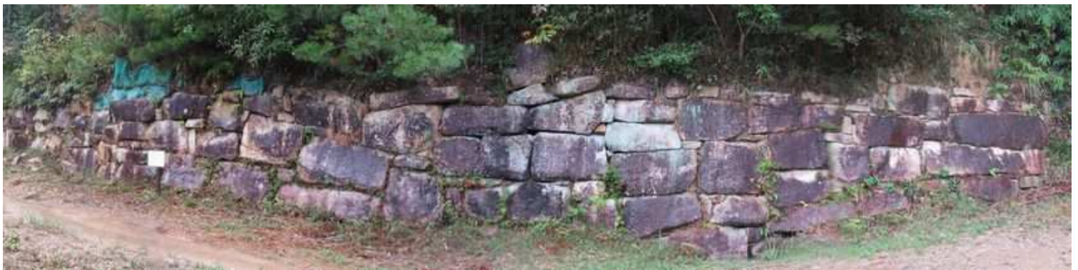
直ぐ先の第1水門は排水口を持たない。