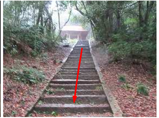
参道の石段を下り岩屋寺を振り返る。