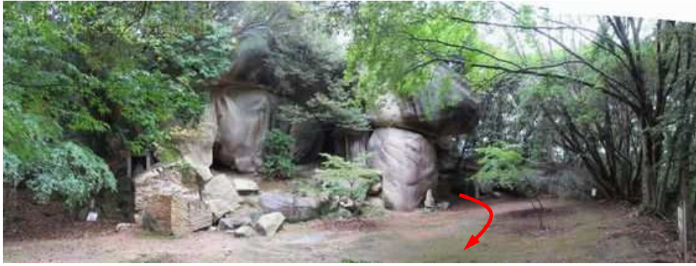
大きな岩の鬼の差し上げ岩。