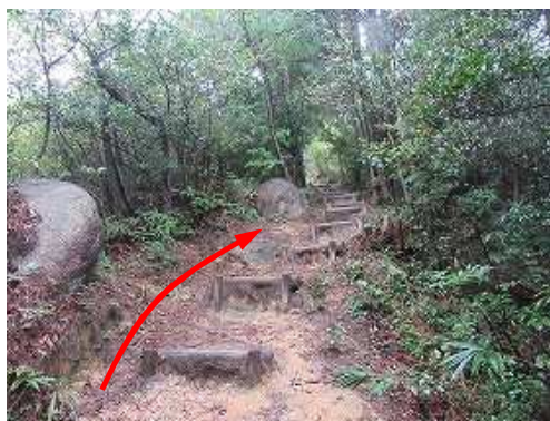
間隔のある丸太階段を登る。