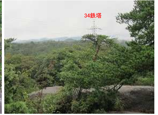
汐差岩の岩上から34鉄塔方向を望む。