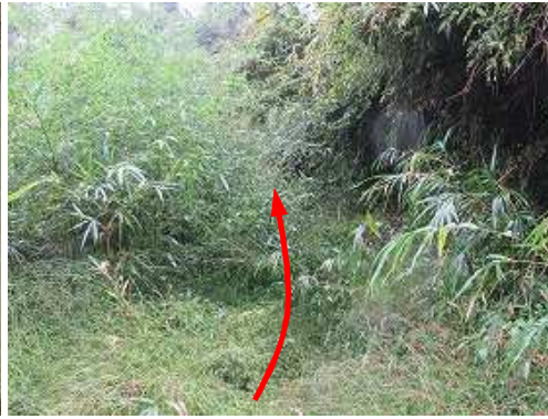
引き返し、ヤブを抜ける。