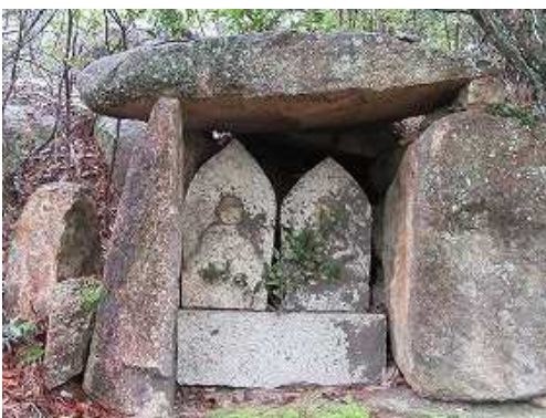
最初の屋根付き石仏に出会う。