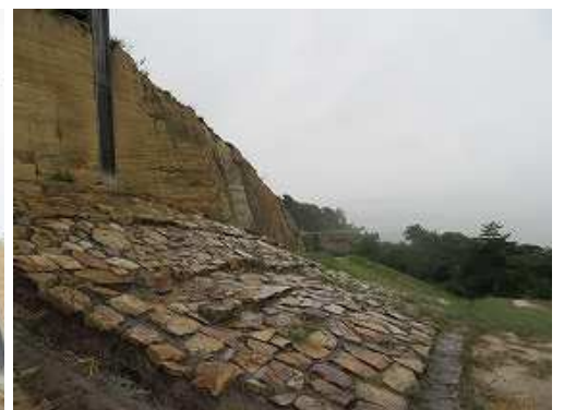
東側の城壁と敷石。