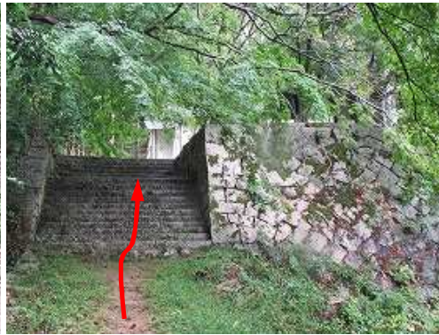
岩屋へ石段を登る。