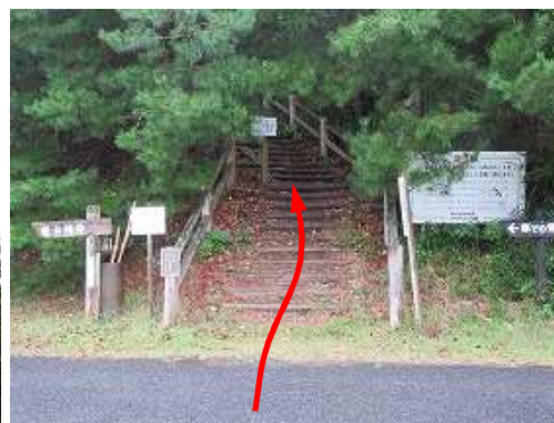
道路の西側が登山口で丸太階段に取付く。