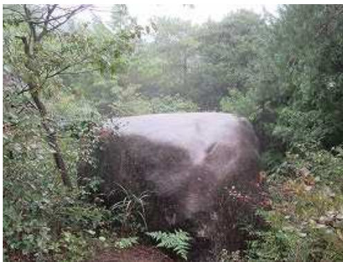
北側に鯉岩を見る。