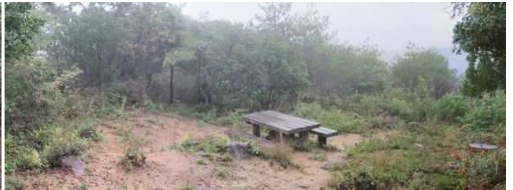
犬墓山展望地があり、東の展望が得られる。