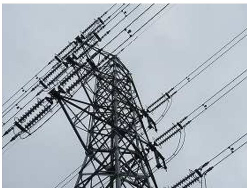
中国電力新倉敷岡山線34鉄塔を見上げる。