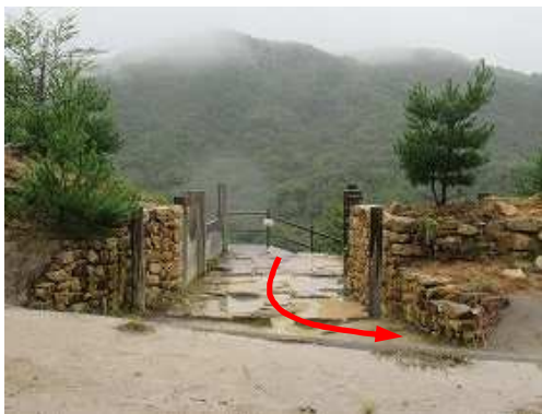
内側から見た北門。