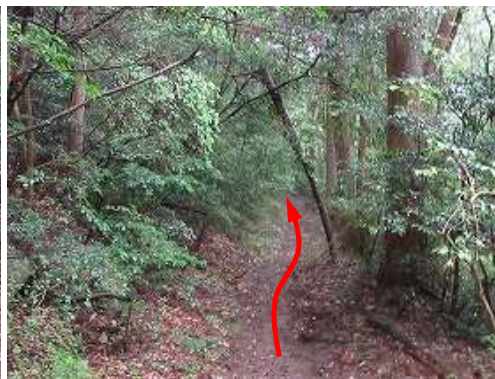
斜面を緩やかに下って行く。