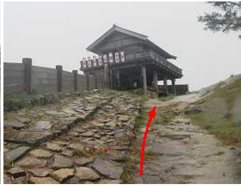
敷石伝いに西門へ向かう。