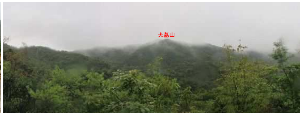
展望A 西の山並みが望まれる。