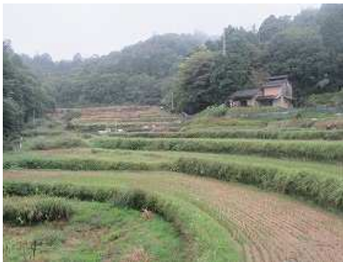
南西を振り返ると棚田が広がる。