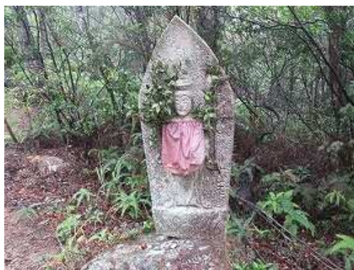
最初の石仏に出会う。