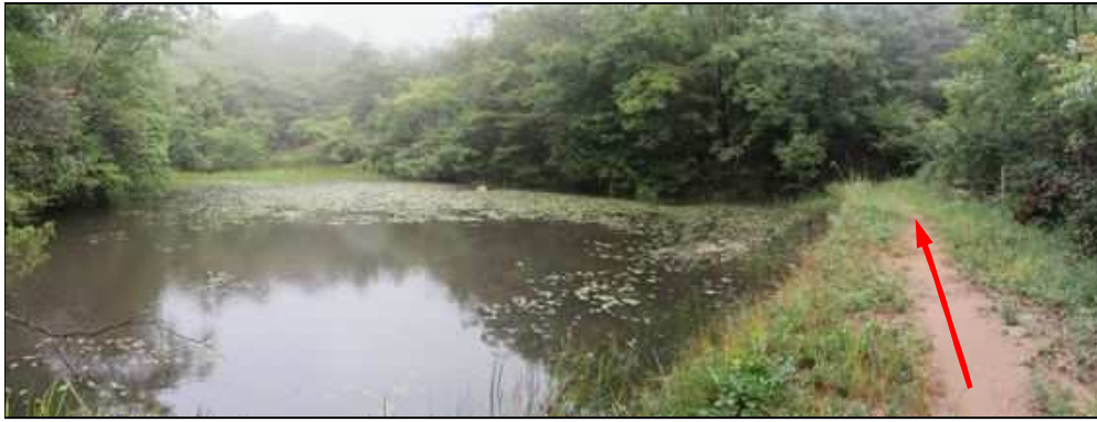
ため池の土手を進む。