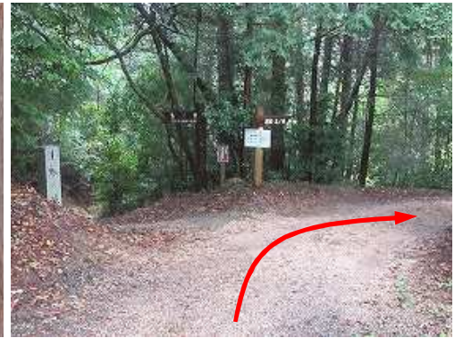
分岐に出会い、右へ向かう。