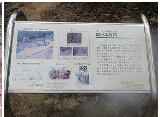
鍛冶工房跡の案内板。