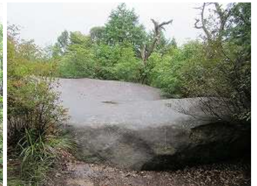
北側に八畳岩を見る。