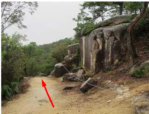
トラロープを通過する。