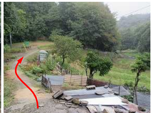
最後の民家から直角に折れ、農道を緩やかに下って行く。