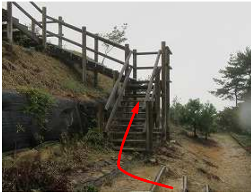
木製階段を上がる。