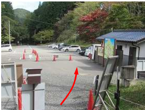
立雲峡駐車場に帰り着いた。