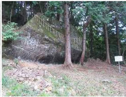
夫婦檜に立ち寄る。