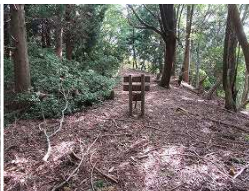
平坦な尾根筋に立つ杭に出会う。表に回ると「この先行き止まり」と書いてある。登って来たルートは一般路ではないようだ。