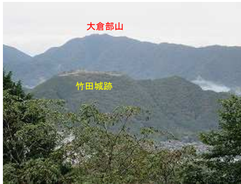
天上岩からの竹田城跡。