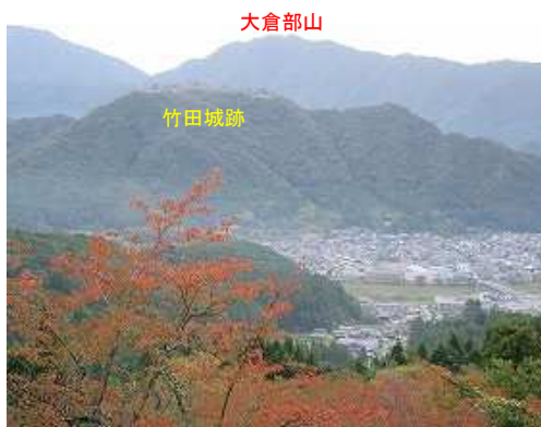
第2展望台からの竹田城跡。