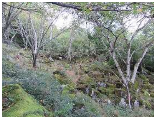
山桜と苔むす巨岩を通過する。