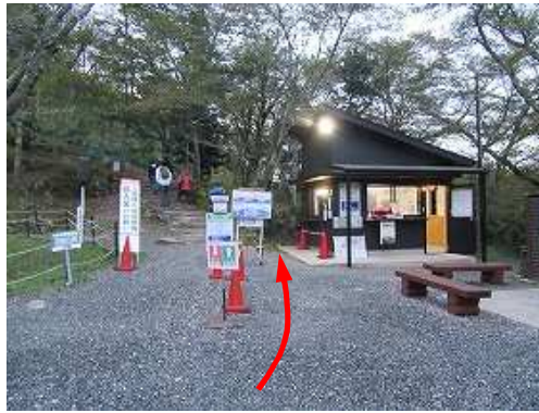
立雲峡駐車場に車を止め、料金所で協力金¥300を払う。

立雲峡駐車場→第3展望台→第2展望台→第1展望台→林道分岐B→取付け→朝来山(756m)→朝来山展望台→登山道入口→林道分岐A→愛宕神社→立雲峡駐車場