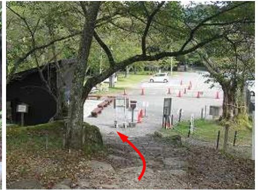
登山口が見えて来た。