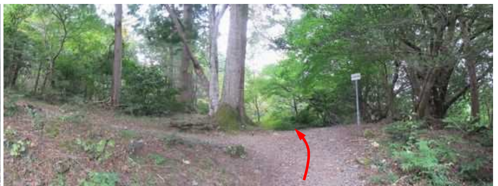
愛宕神社分岐に出会い、直進する。