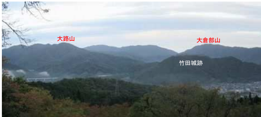
硯岩からの竹田城跡。