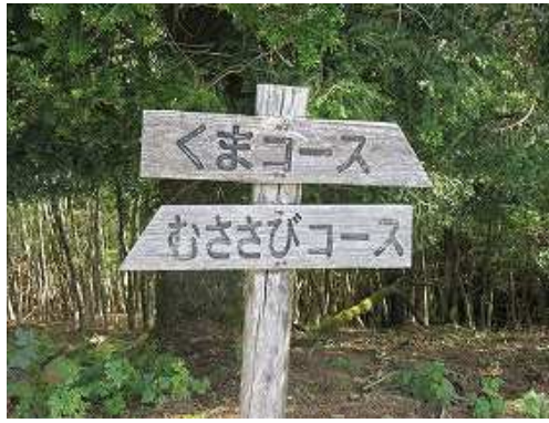
むささびコースへ擬木階段を降る。