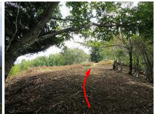
前方が開けて来た。