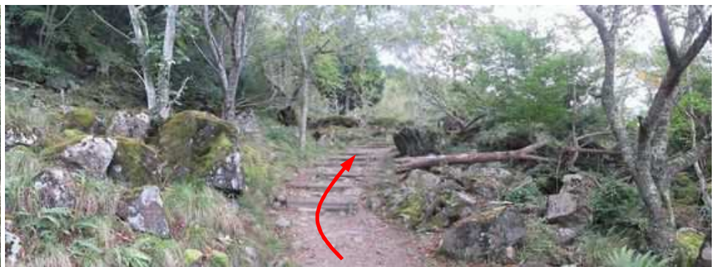
登路A 庭園風の遊歩道を緩やかに登って行く。