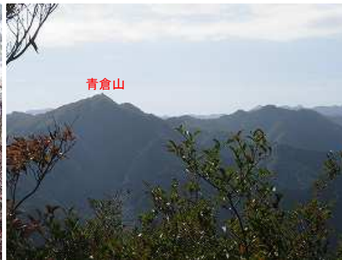
展望地から南南東の青倉山を望む。