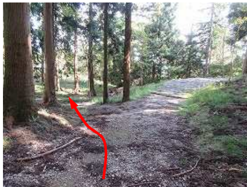
東屋分岐を左折する。