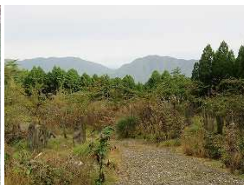
北から上がって来た作業路が合流する。