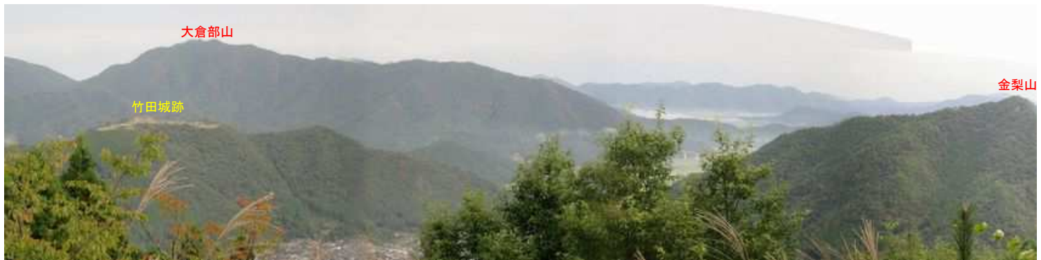
第1展望台からの竹田城跡。