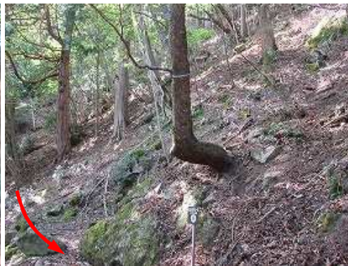
幹が直角に曲がったうですもうの桜を通過する。