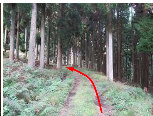
スギの植林地を抜ける。