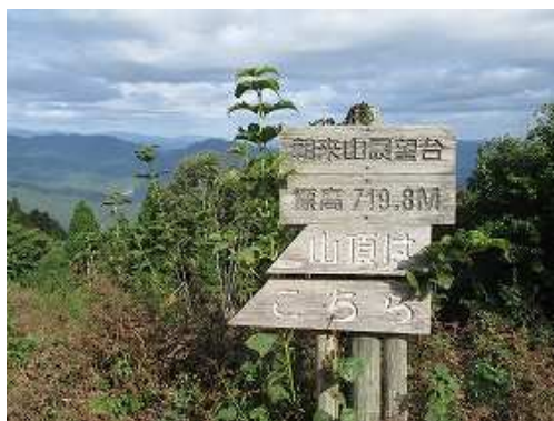
朝来山展望台に到着。