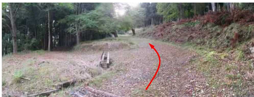
林道分岐Aに出合い、直進する。