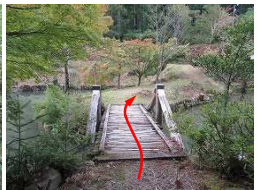
中央に架かる木橋を渡る。