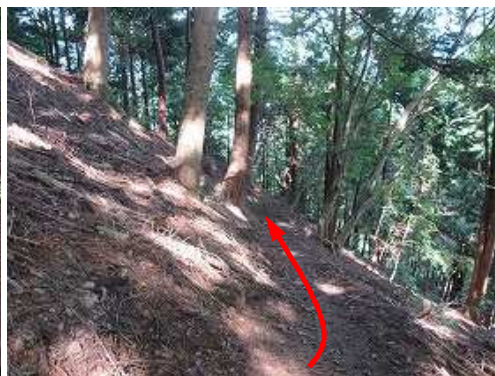
もみの木坂を下る。