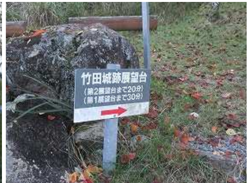
展望台までの案内板。