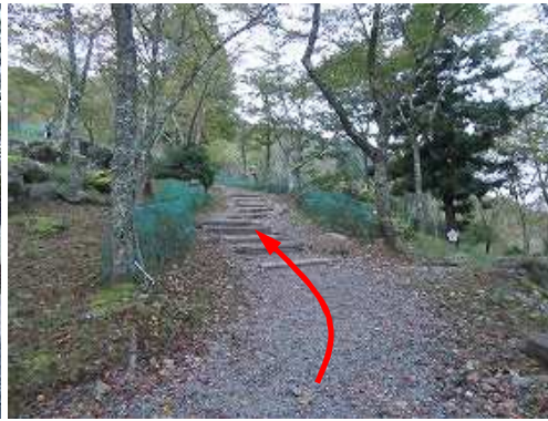
丸太階段を緩やかに登って行く。