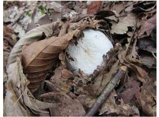
シロタマゴテングタケが出始めている。