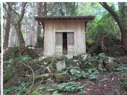
左奥に愛宕神社が見えたので立ち寄る。