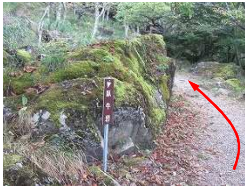
臥牛岩を通過する。