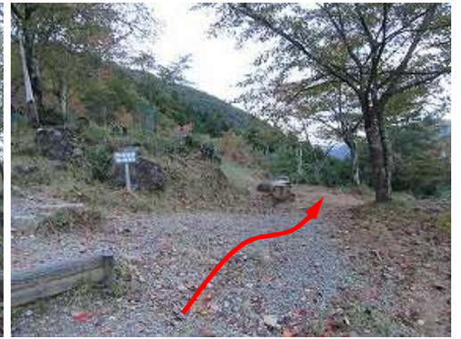
程なく第3展望台に到着。