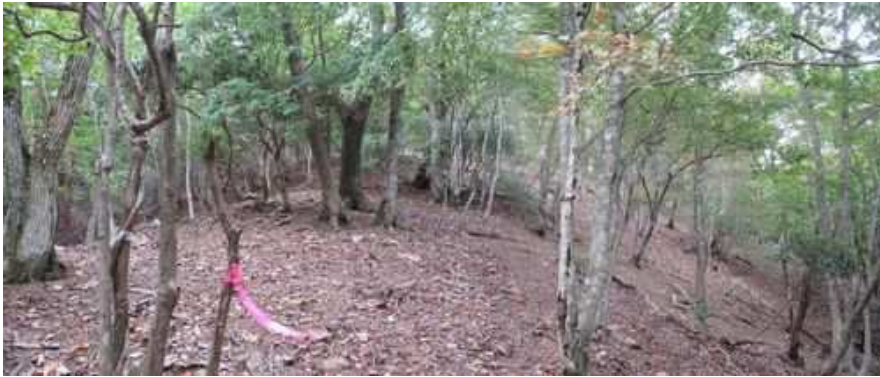
斜面A 傾斜が緩み鈍頂の尾根筋を緩く登って行く。