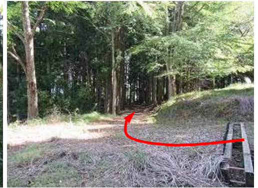
林道分岐Aを右折する。