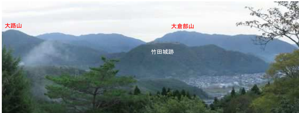
第3展望台からの竹田城跡。