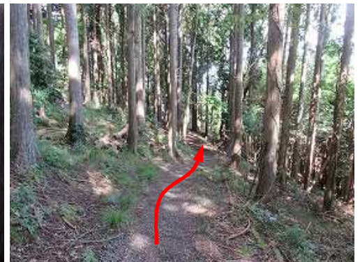
引き返し、スギ植林帯に行く。