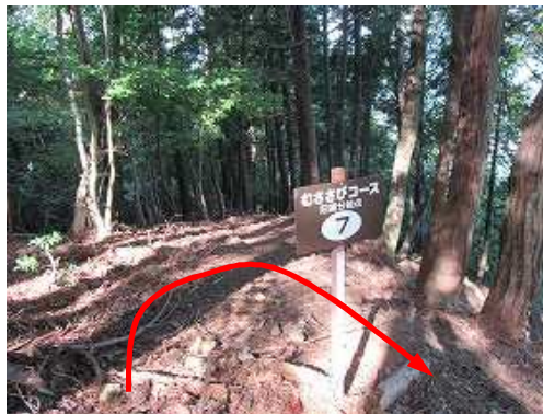
旧道分岐で右に転回する。