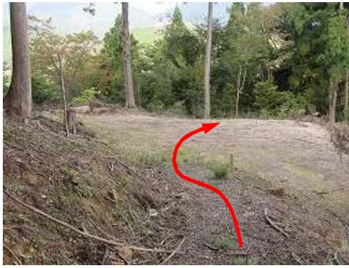
作業路に出合うが直進して、踏み跡を辿る。