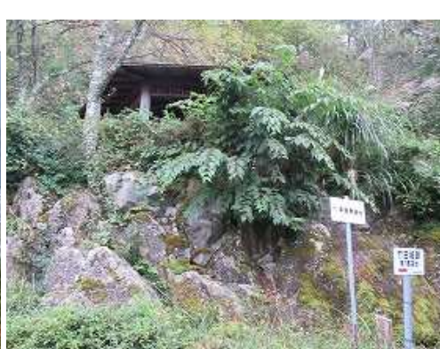
東屋展望台が見えた。