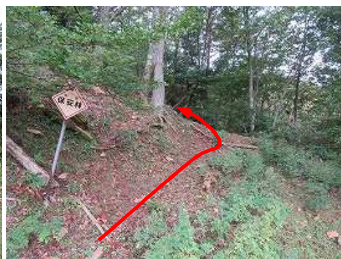
取付きは保安林標識右である。