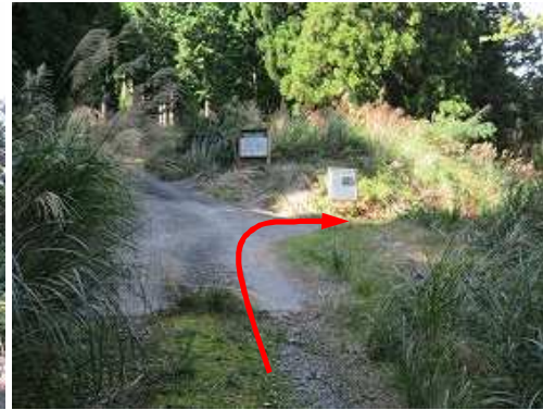
林道分岐Bを右折する。