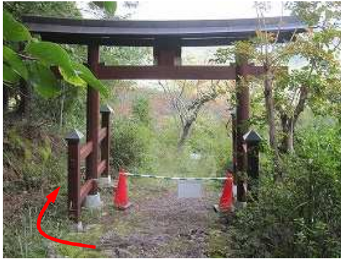
下ると鳥居に出会い、振り返ると扁額に「愛宕神社」と書いてある。