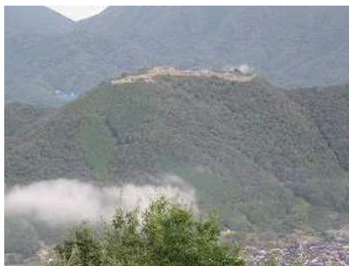
望遠での竹田城跡。