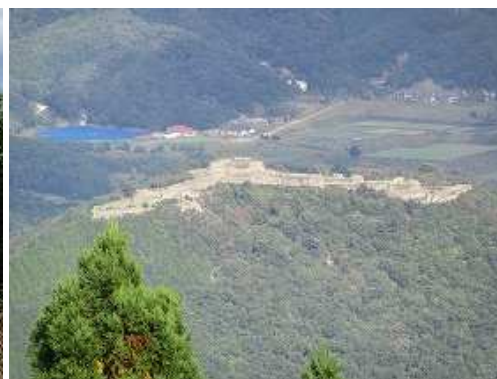
此处からも竹田城跡が見下ろせる。