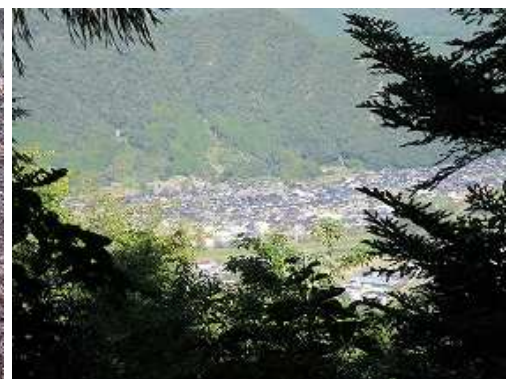
大岩の先の展望地から山東町迫間の町並みを見下ろす。