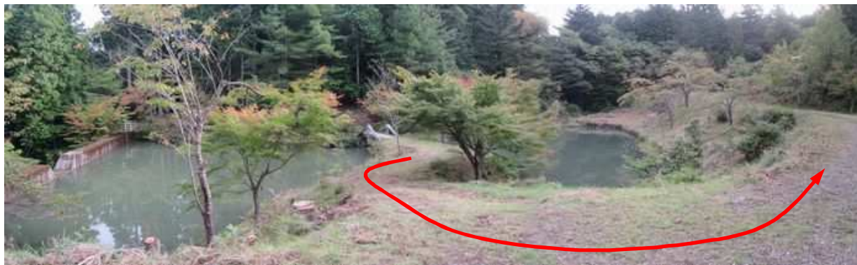
大成池T字路から大成池を見て左へ向かう。