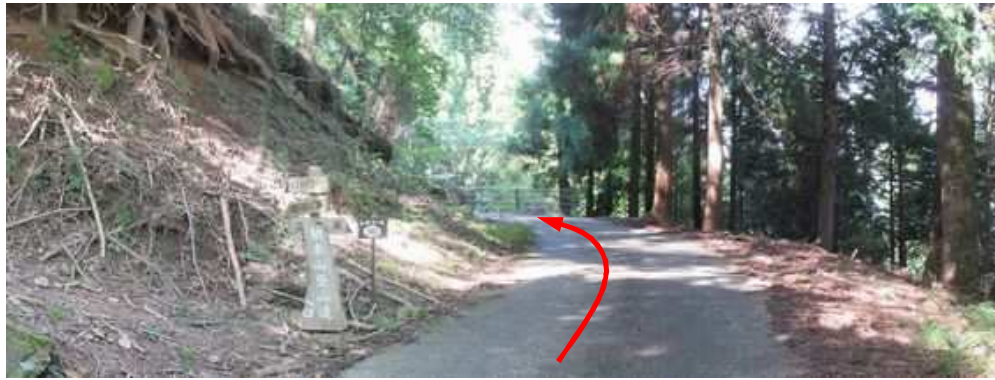
朝来山登山道入口に降り立ち、林道を奥へ向かう。