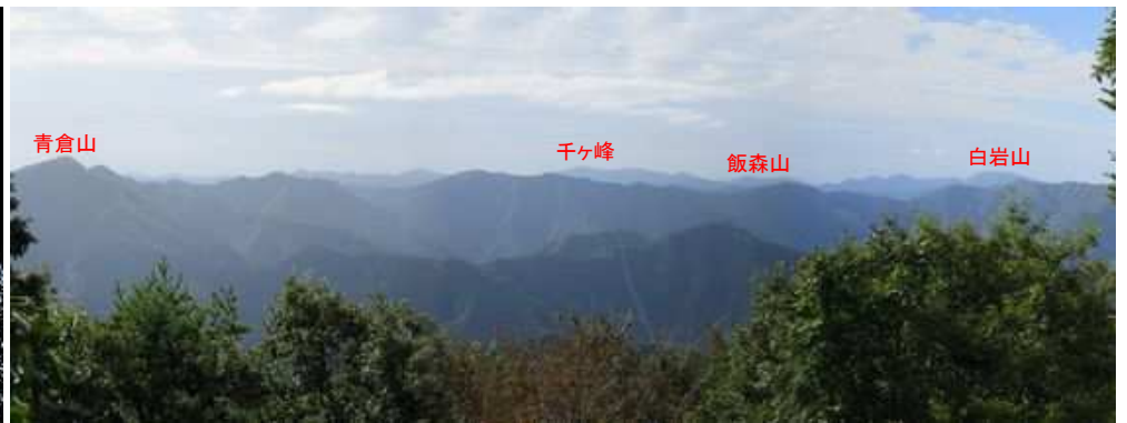
南に開けた展望地からの遠望。