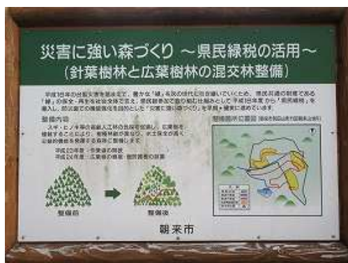
分岐の右端に立つ案内板。