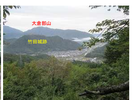
東屋展望台からの竹田城跡。