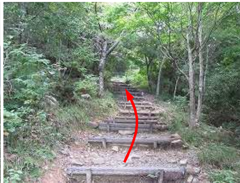
擬木階段を緩やかに登って行く。