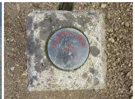
南側に図根三角点が設置されている。