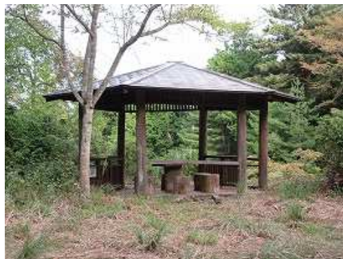
東屋に立ち寄る。正式には立雲峡休憩所のようなだ。