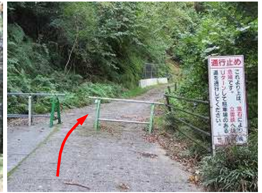
通行止めのゲートを抜ける。