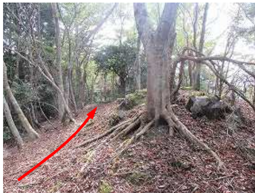
小岩ピークを越える。