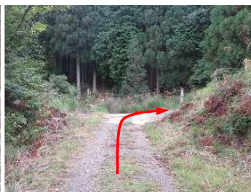
程なく林道分岐Bに出合い、右折する。