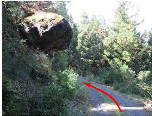
林道にセリ出たハング岩を通過する。