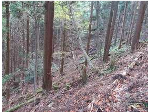
水晶沢を通過する。