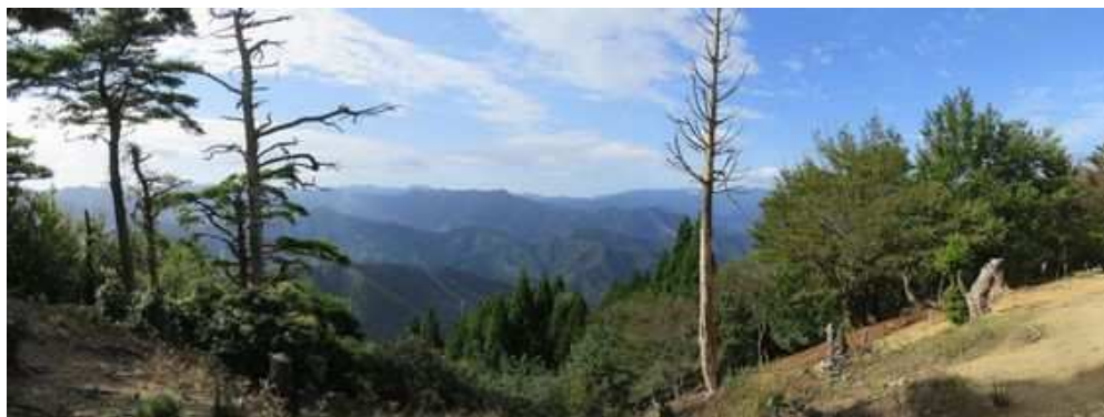
南側斜面から南の展望。