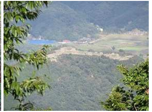
むささび展望台から竹田城跡を見下ろす。