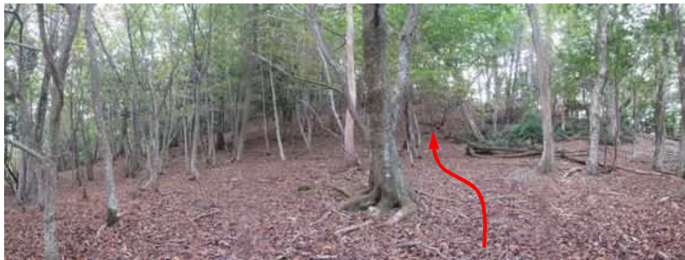
斜面B 尾根筋の前方が明るくなってきた。