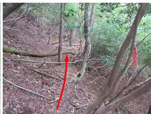
枝に赤テープを見て薄い踏み跡を辿る。