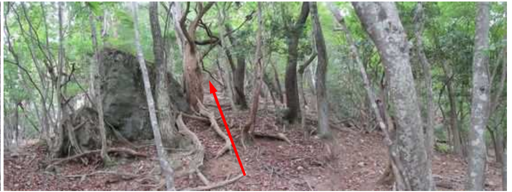
大岩を通過すると、やや急な登りとなる。