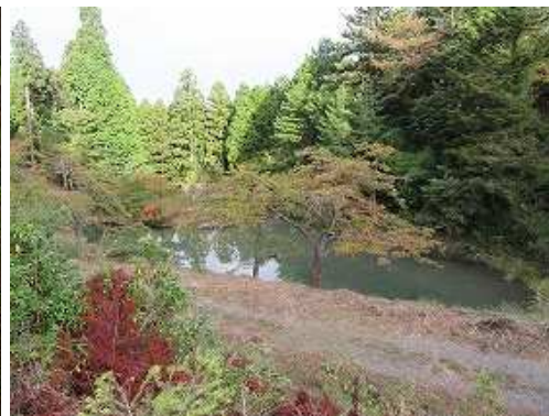
東屋から大成池を見る。