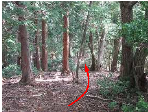
山頂を後に東へ尾根筋を進む。