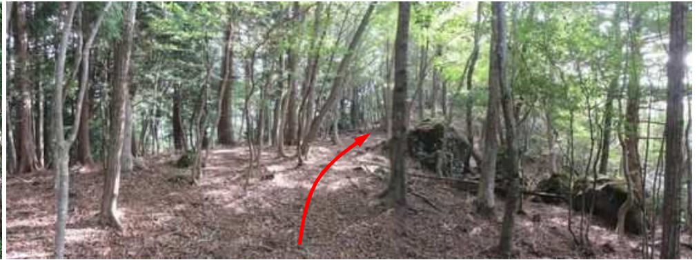
尾根筋A 平坦な尾根筋を進む。