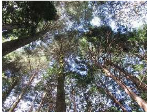
もみの木平のモミの木を見上げ、モミの木林を下る。