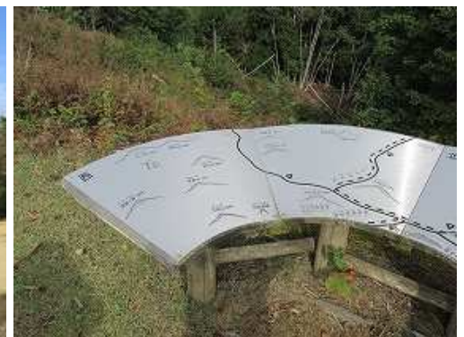
展望台に設置された展望板。