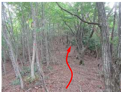
朝来山への尾根筋に登り上がり、東へ向かう。