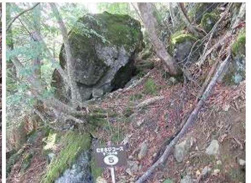
きつねの館を通過する。