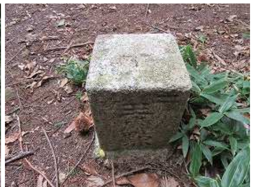
山頂には二等三角点:朝来山が設置されている。