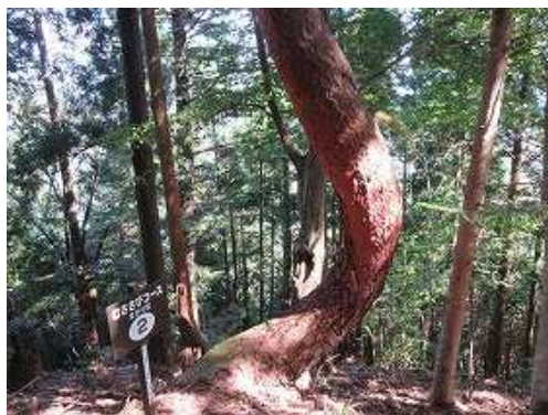
幹が曲がったまがり松を通過する。