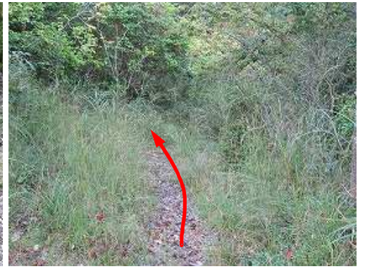
草が生えた踏み跡を下る。