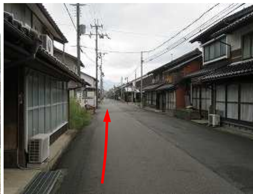
町中の旧街道を竹田駅方面へ向かう。