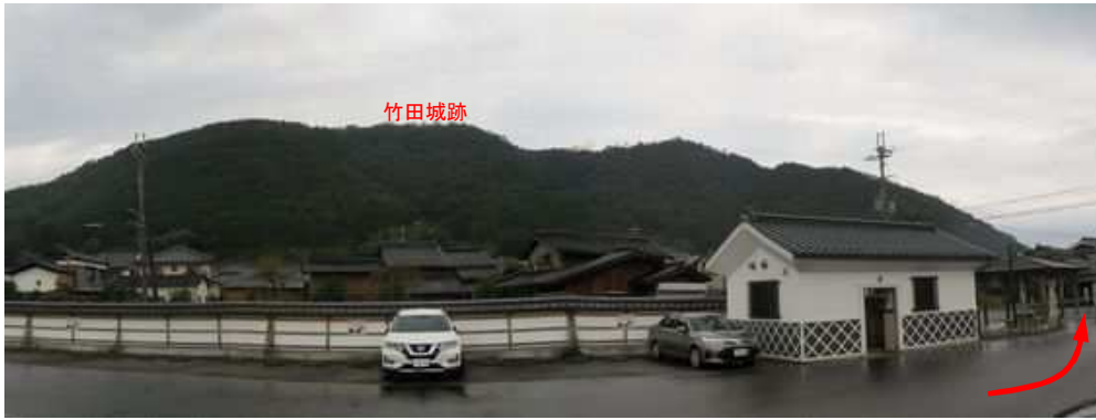
竹田城跡 竹田まちなか観光駐車場に駐車する。背後に竹田城跡の古城山が見渡せる。

観光駐車場→駅裏登山口→料金所→北千畳→天守台(古城山353m)→南千畳→表米神社降口→表米神社登山口→観光駐車場