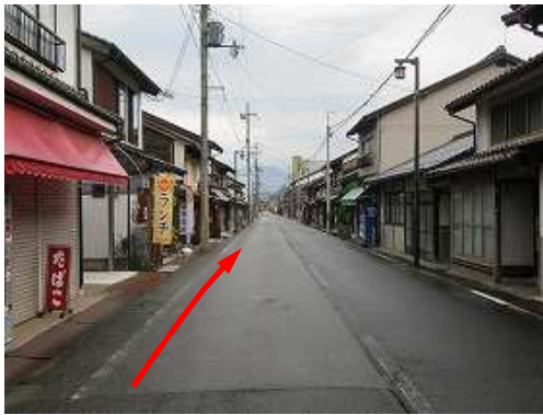
町中の旧街道をJR竹田駅へ向かう。