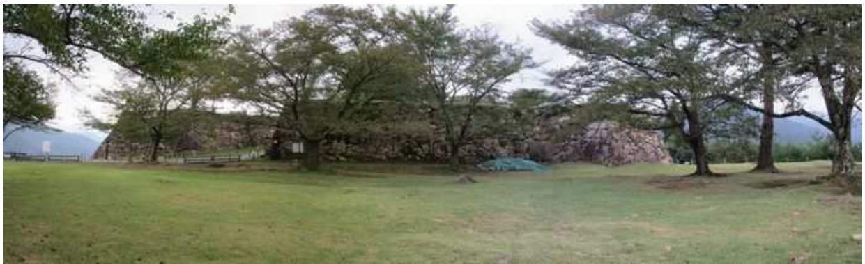
北千畳北端から三の丸を望む。