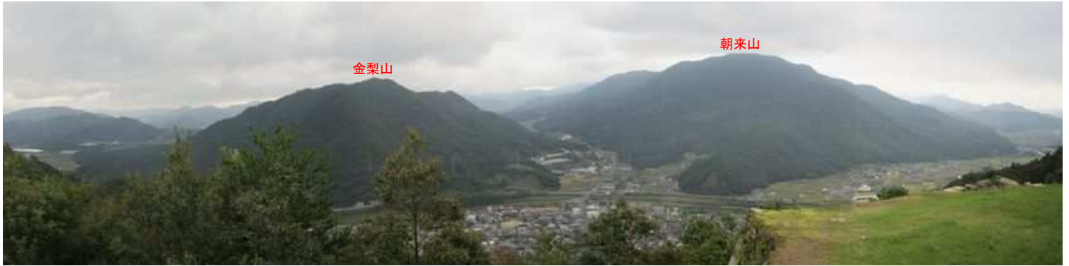
北千畳東端からの東北東～南南東の展望。