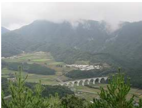
北北西に虎臥城大橋を見下ろす。