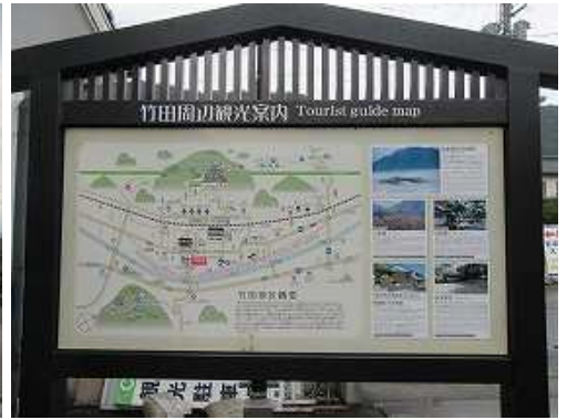
案内板に目を通し歩き始める。