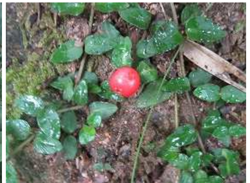
ツルアリドオシ 実