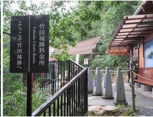
竹田城跡 料金所 に到着。