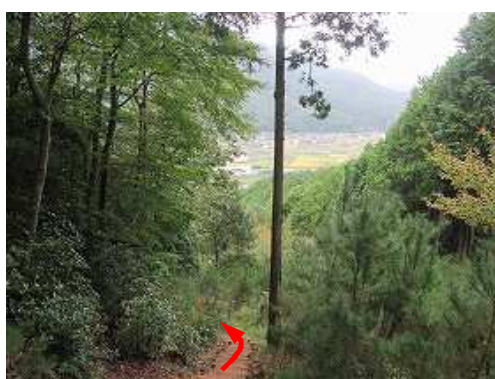
擬木階段を下って行く。