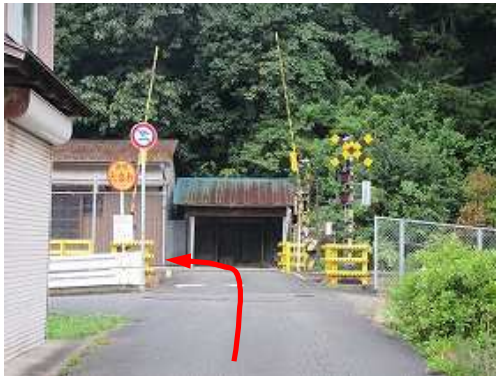
第一米屋町西側踏切を渡り左へ進む。