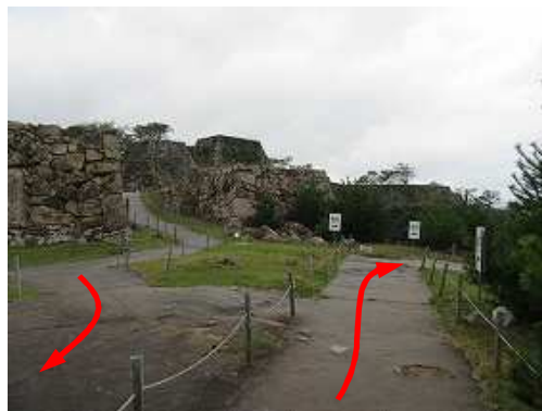
南千畳南端から引き返す。