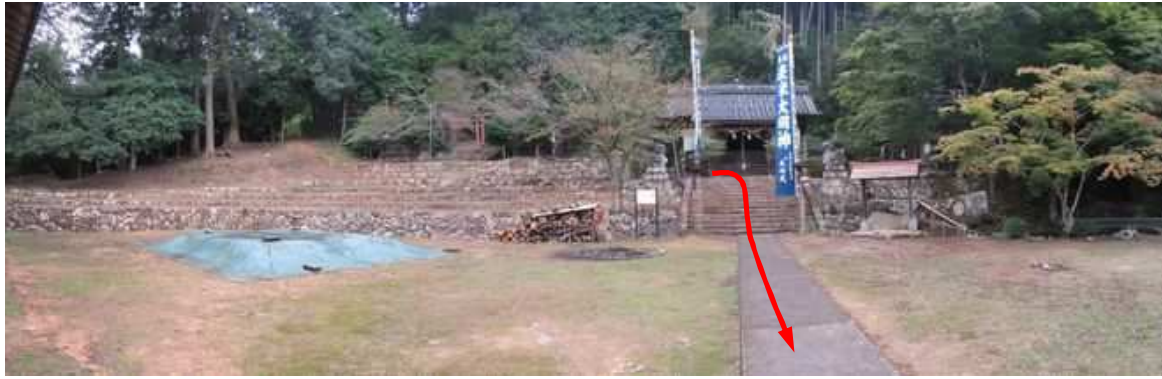
相撲棧敷と表米神社。