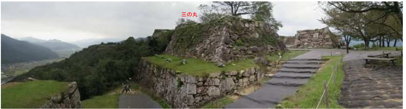
北千畳東端から三の丸を望む。