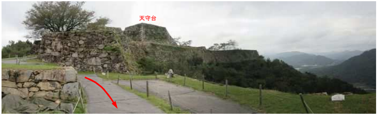
南二の丸から天守台を望む。