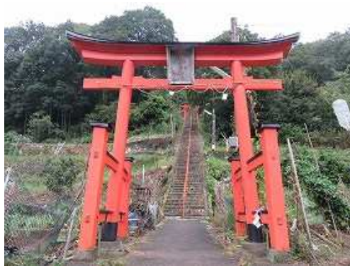
山側に稲荷大明神の赤鳥居を見る。