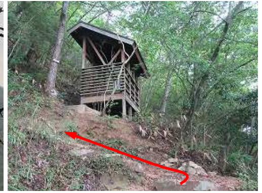
竹田城跡料金所まで200mの所に建つ 東屋 を通過する。