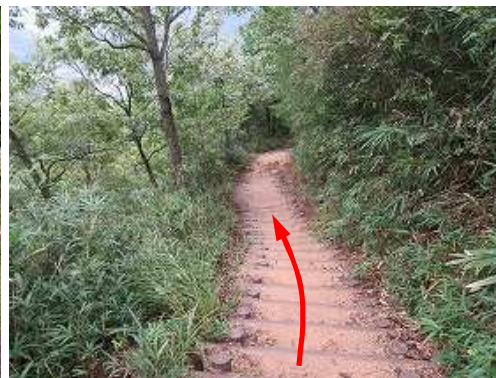
擬木階段を緩やかに下る。