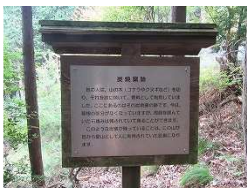
炭焼窯跡の案内板を通過する。