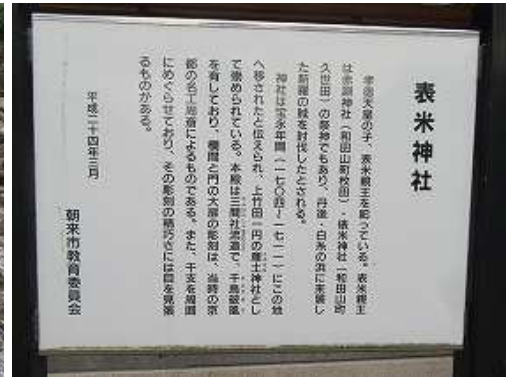
傍に表米神社の説明板を見る。