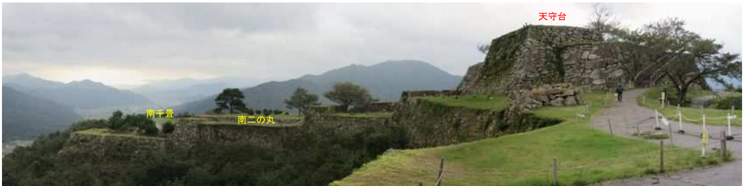
二の丸から天守台を望む。