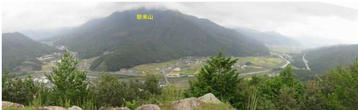
南千畳南端から朝来山を望む。