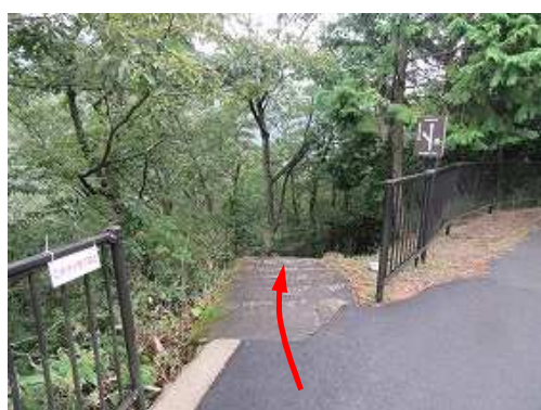
表米神社降口 道路左端の石段を下る。