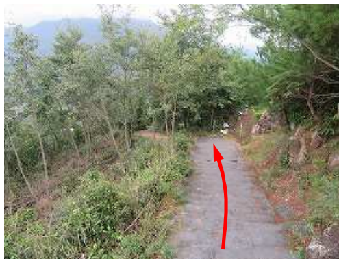
城外へ緩やかに下って行く。