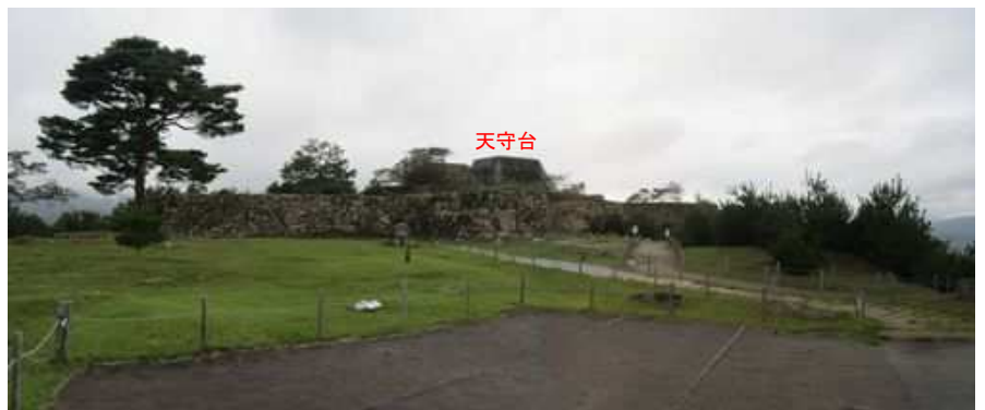
南千畳から天守台を望む。