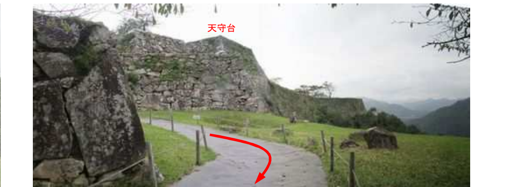
天守台を振り返る。