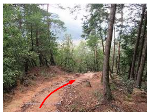
赤土登山道の擬木階段を下って行く。