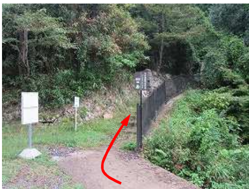
竹田城跡料金所まで800mの案内板を見る。