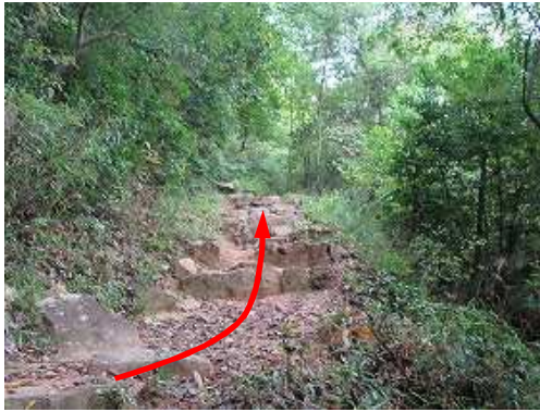
石段を緩やかに登って行く。