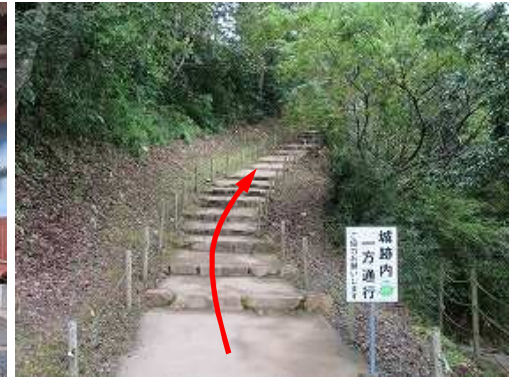
入城料¥500を払い、登城する。