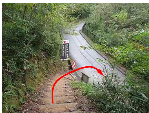
出口に降り立ち、案内板を見て右へ向かう。