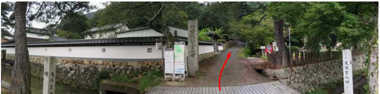
駅裏登山口に出会い、右折する。