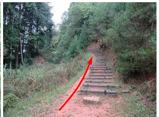
擬木階段を緩やかに登って行く。