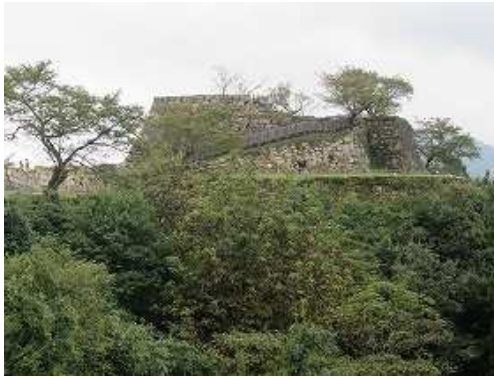
三の丸から天守台を望む。