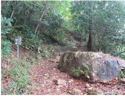
竹田城跡料金所まで400mの案内板が中間点で 展望地 である。東に金梨山(464m)が望まれる。