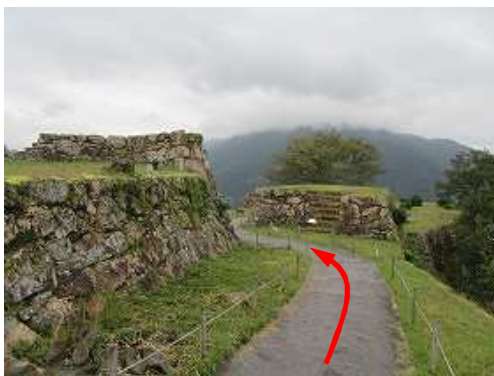
南二の丸へ向かう。