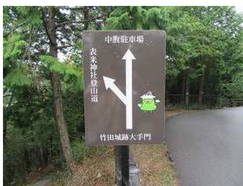
降口右に立つ案内板。