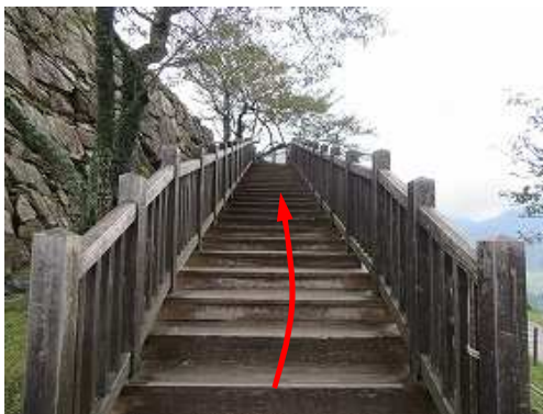
本丸への階段を登る。