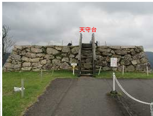
本丸の一段高い所が天守台。