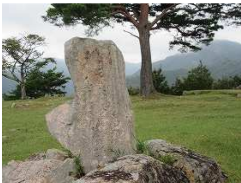
アカマツの手前の句碑には「夏草や 兵どもが 夢の跡」と刻まれている。(芭蕉の句)