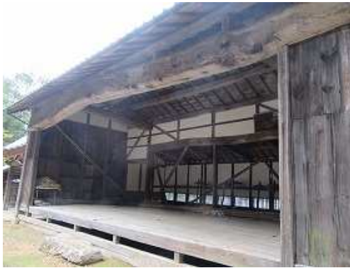
太い梁の架かる舞台。