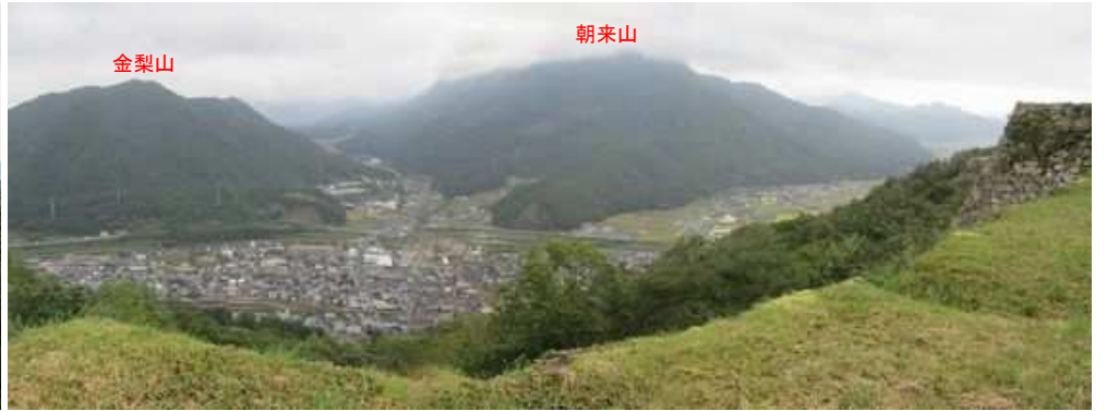
三の丸から竹田の町中を見下ろす。