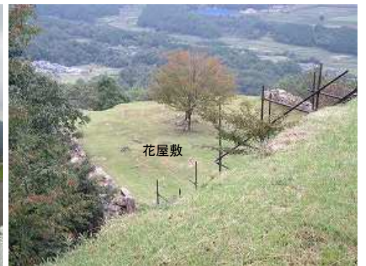
一段低い所の花屋敷。