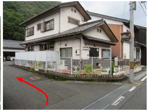
竹田駐在所を左折する。