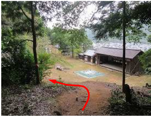
表米神社が見えた。