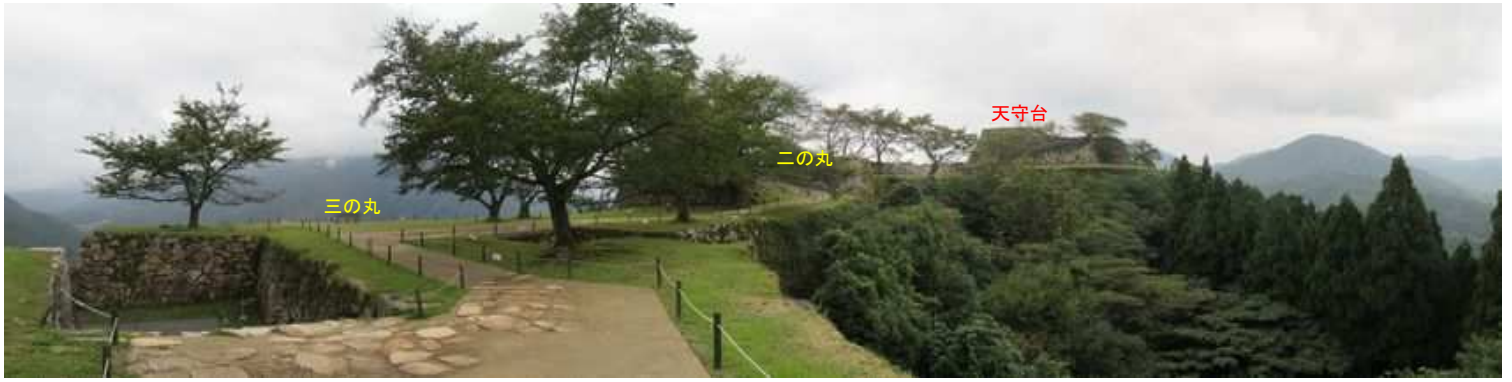
三の丸石段から天守台方面。