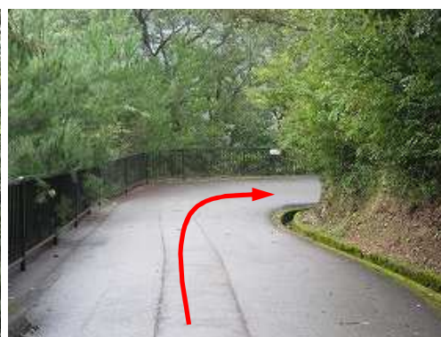
歩行者専用道路を緩く下って行く。