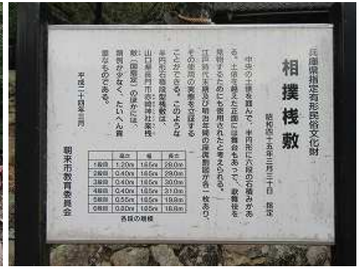
相撲棧敷の説明板。