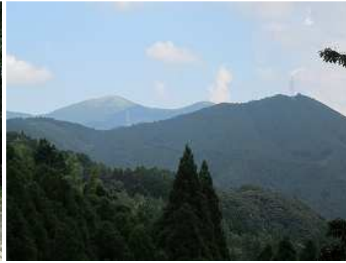
開けた所から天山が望まれる。