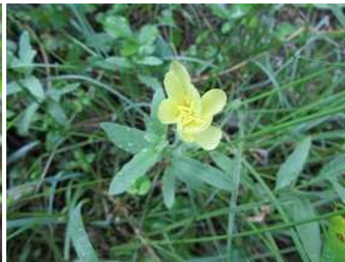
ヒメマツヨイグサ