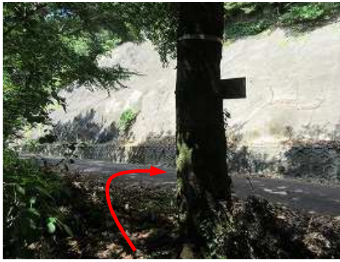
登り始めると出口。