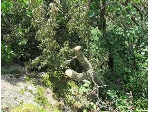
南側のヤマボウシが切り倒されていた。