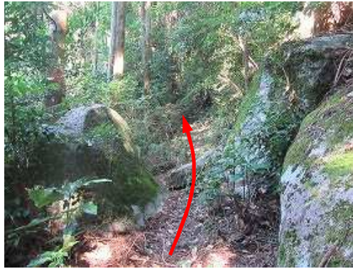
小岩の間を抜ける。