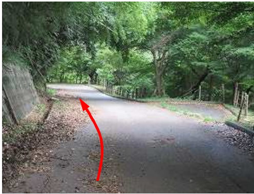
道なりに下って行く。