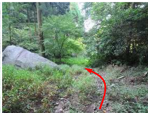
ナマコ岩を下り抜ける。