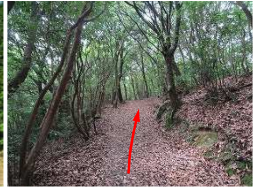
緩やかに登って行く。