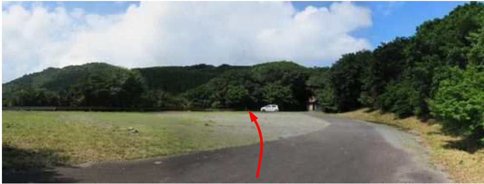
9合目駐車場に到着。