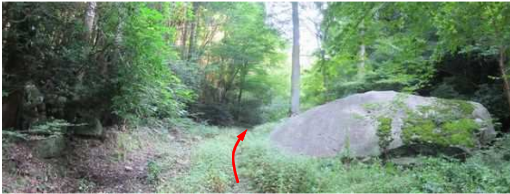
ナマコのような大岩の左を抜け先へ向かう。