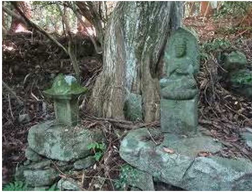
右手に移動し山中に入ると大日如来像を見る。本来の滝への道筋か？