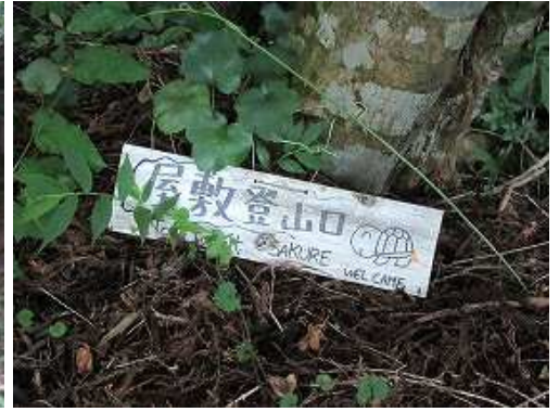
登山口左側のモミジの下に案内板を見る。