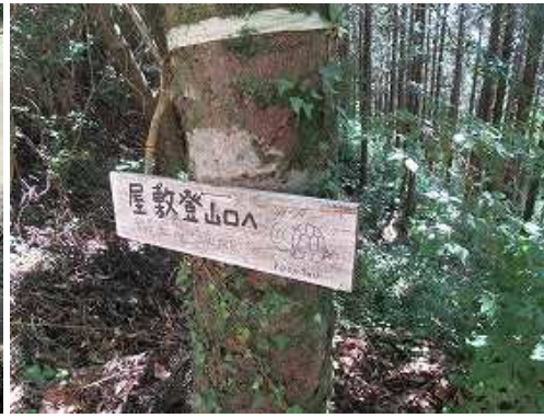
道路側から見た案内板。