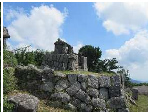
作礼神社上宮が鎮座する東峰(880m)に到着。