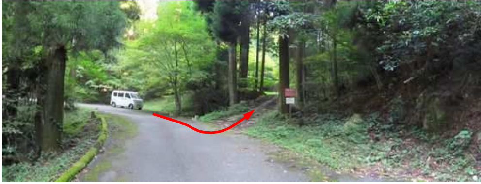
9合目駐車場への作礼林道へ入り、左カーブの曲がり始めが屋敷登山口で、傍の路肩に駐車する。

屋敷登山口→屋敷滝→滝分岐→小滝→案内板3→出口→9合目駐車場→東展望岩→東峰(880m)→モアイ岩→道路出合→駐車地