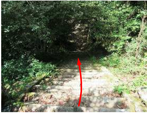
参道の石段を降る。