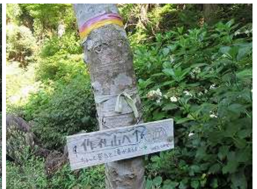
右に滝分岐の案内板を見る。作礼山への矢印方向はアジサイが繁茂しており進入できない。