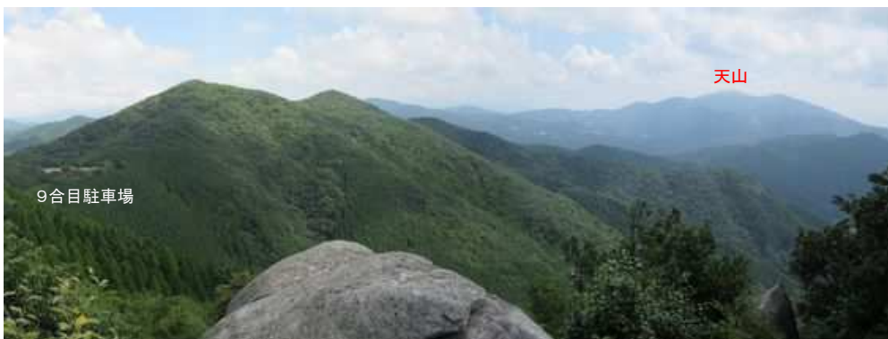
東展望岩からの眺望。