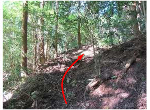
薄く弱い踏み跡が延びており、これを伝う。