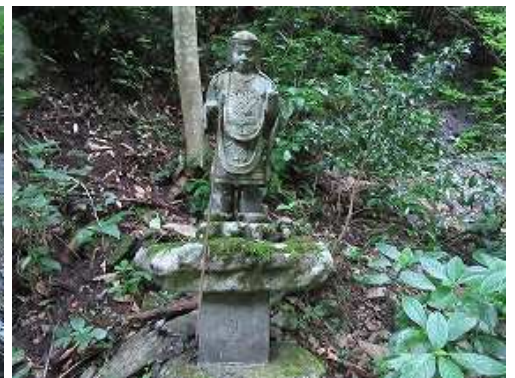
傍に立つ毘沙門天像。