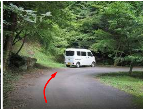
駐車地に帰っていた。