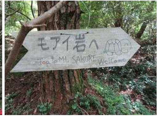
モアイ岩分岐の案内板。