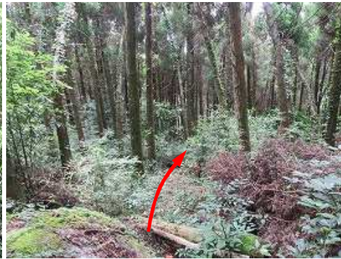
スギの植林地が現れた。