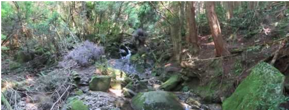
沢筋の前方に小滝が見えた。