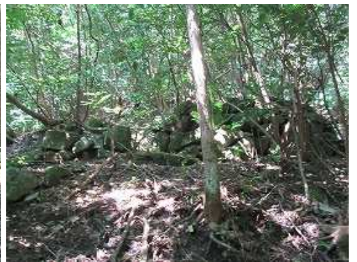
炭窯2を山側に見る。