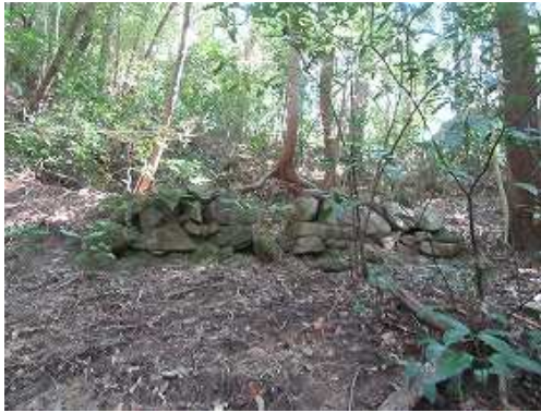
炭窯1を山側に見る。