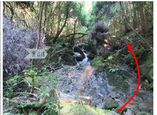
案内板から左岸側を伝う。