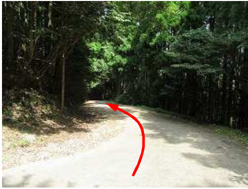
道なりに下って行く。