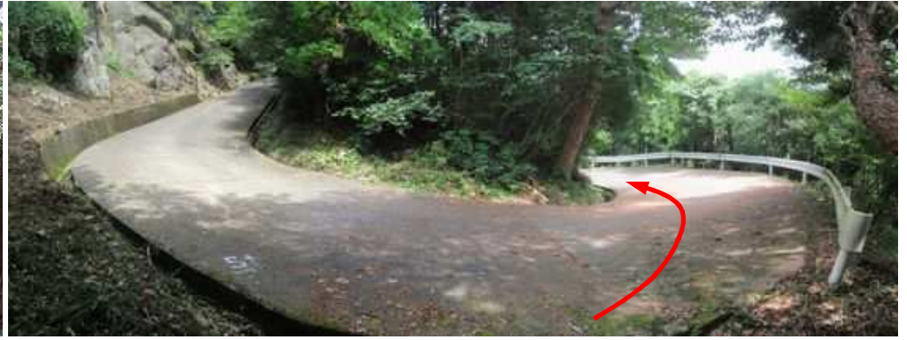
道路出合 右へ下って行く。