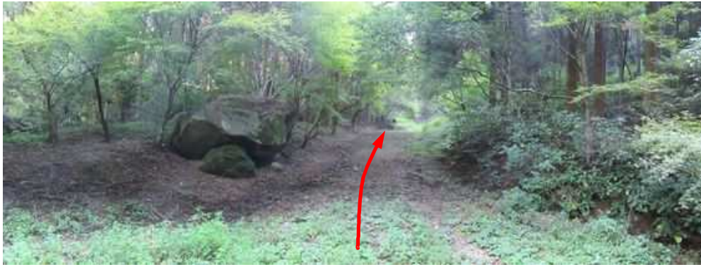
舗装された草付きの道路が奥に伸びて、これを緩く登って行く。