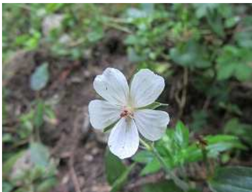
ゲンショウコ 白花