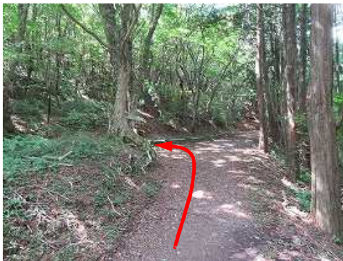
東展望岩分岐に出会い、左折する。