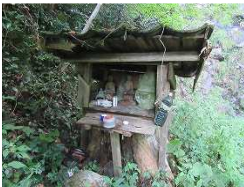
石仏が安置された祠。