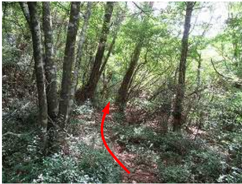
モアイ岩へ向かう。