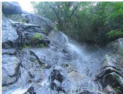
落ち口を見上げる。