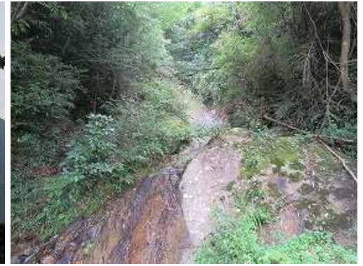
左に滝が落ちている。