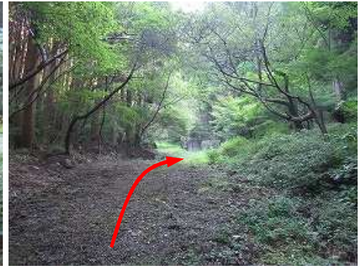
両側にアジサイが植えられている。