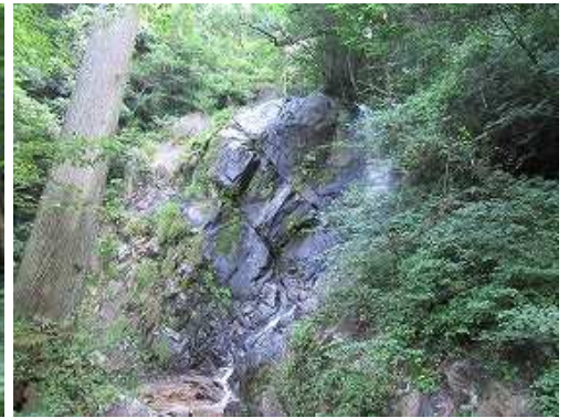
落差6m程の屋敷滝が現れた。