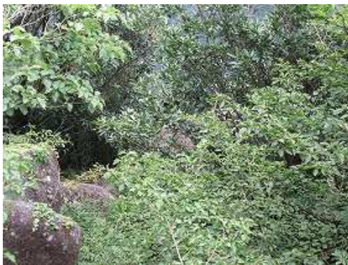
すぐ下にモアイ岩が見えている。