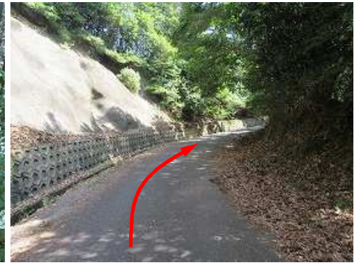
道路を緩やかに登って行く。