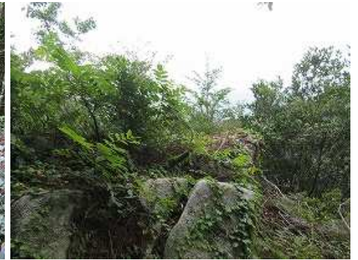
モアイ岩上段の岩場。