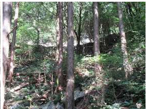
前方上部に道路が見えた。