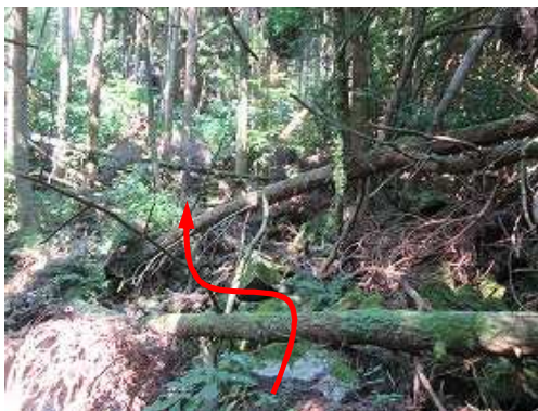
倒木帯を越えて行く。