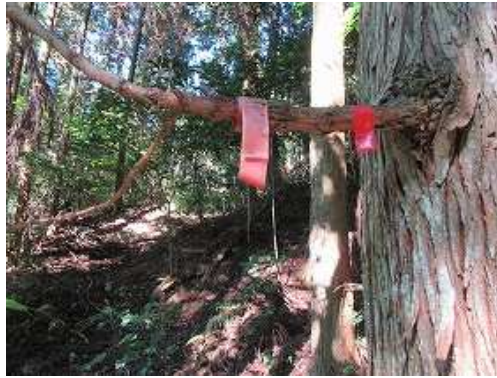
スギ植林斜面を迂回して引き返すと赤テープを見る。