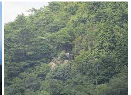
西斜面の遠見岩を望む。