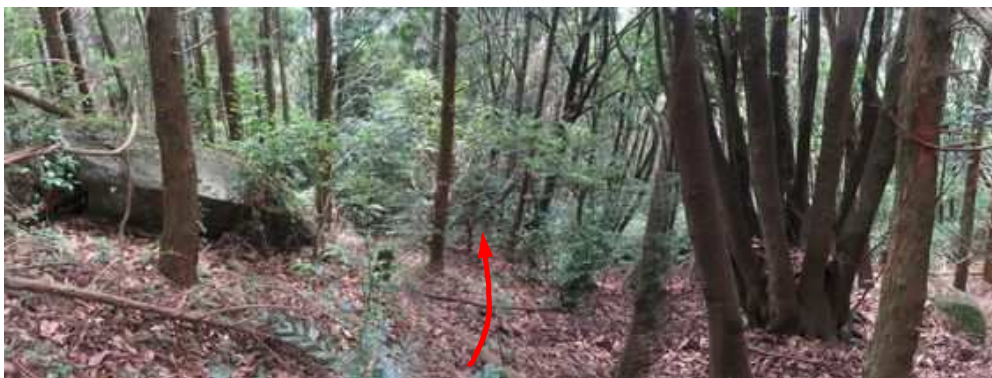
尾根筋A 引き返しスギ植林地の尾根筋を降る。