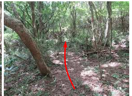
南西に向きを変え緩やかに登って行く。