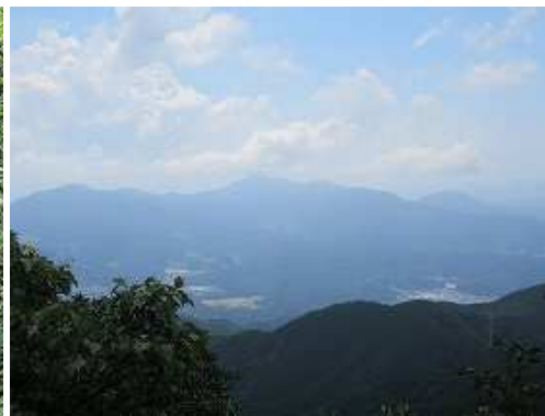
岩場から南の展望。