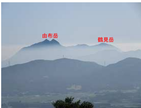
展望地から北東に由布岳を望む。