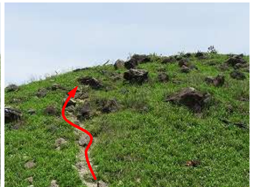
小にぎり山分岐に立つ案内板を見て斜面を登って行く。