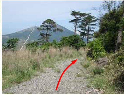
作業路を北東へ向かう。