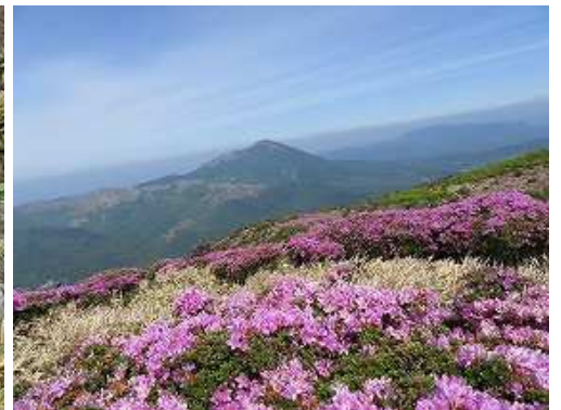
大崩ノ辻から涌蓋山。