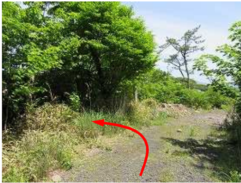
此処から作業路と分れ左の山中に入る。