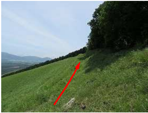
牧野上部の草生す作業路伝いに東へ向かう。