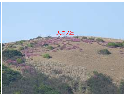
南西に大崩ノ辻の北東斜面を望む。