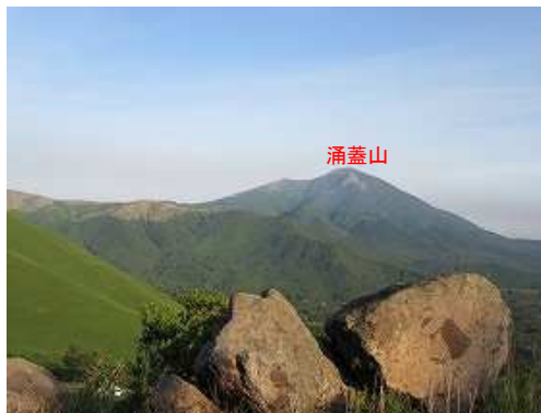
北西に涌蓋山を望む。