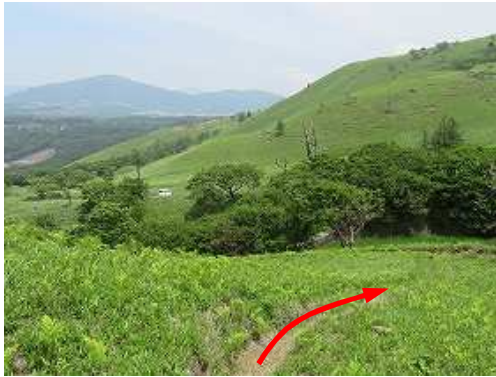
小にぎり山分岐まで引き返し、斜面を進むと駐車地が見えて来た。