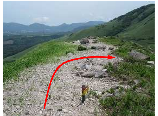
尾根筋東寄りにある矢印案内板から南へ降る。