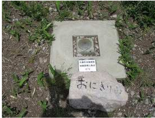
傍に九重町が設置した図根三角点がある。