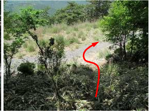
縦走路取付きを出る。