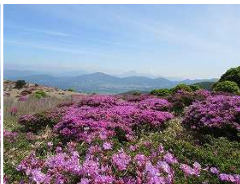
大崩ノ辻から由布岳。