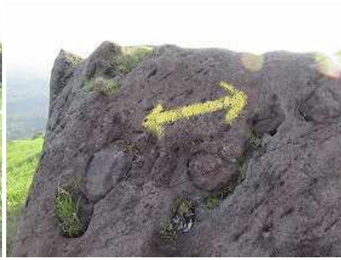
岩に矢印を通過する。