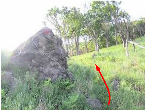
赤印岩を通過する。