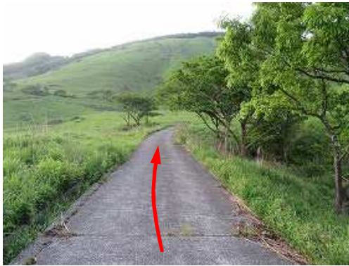
南へ舗装資材路を緩やかに登って行く。