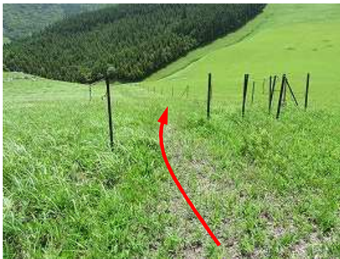
古びた鉄柵支柱を抜ける。