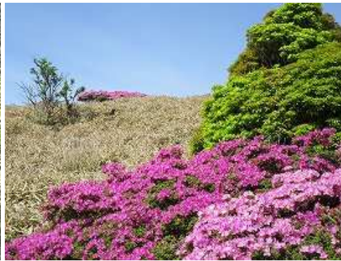
コザサ斜面を登って行く。