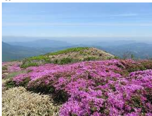
大崩ノ辻から万年山。