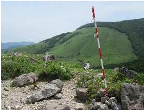
おにぎり山(1083m)に到着。