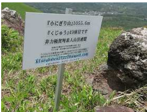
小にぎり山(1051m)の山頂に立つ私設案内板。