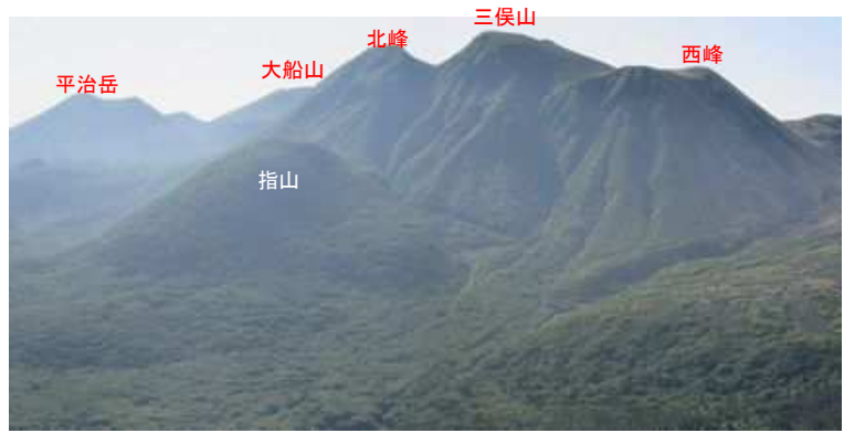
上泉水山から東を望む。