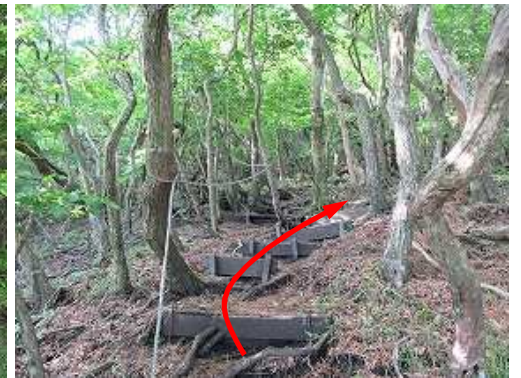
板階段を緩やかに登って行く。