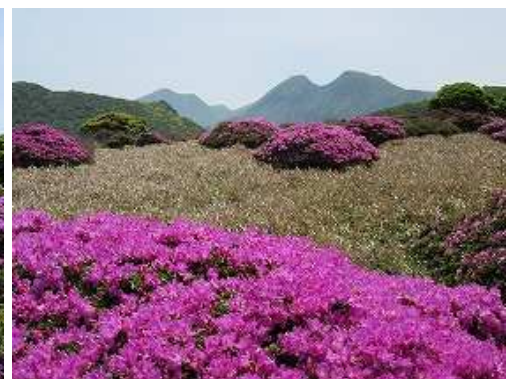
大崩ノ辻から三俣山。