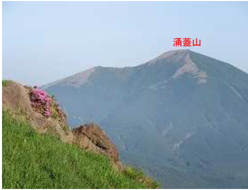
北西に涌蓋山を望む。