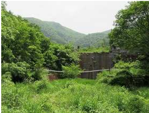
上流に砂防ダムを見て小さな流れの古井川を渡る。