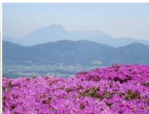
尾根筋から由布岳。