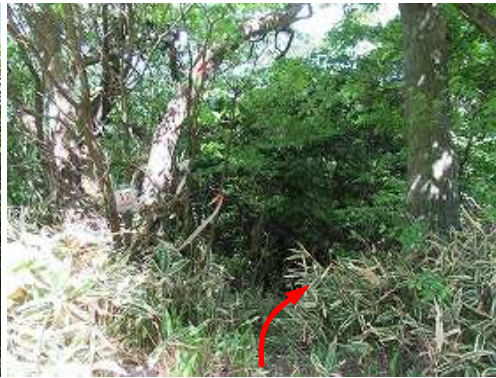
降り口には赤テープやヒモ、九青小17などが見られる。