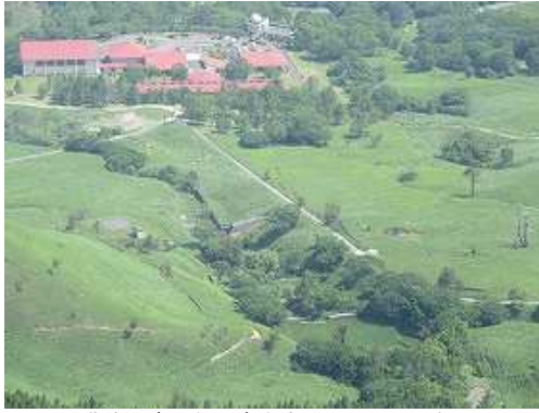
北東に青少年の家や古井川を見下ろす。