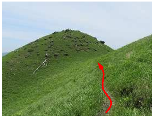
小にぎり山が見えて来た。