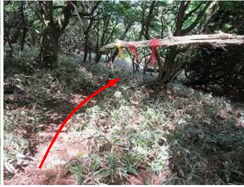
樹林帯を降って行く。