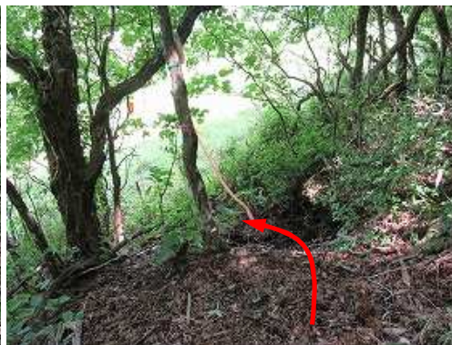
牧野出口が見えて来た。