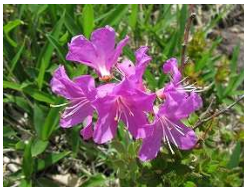
傍に咲くミヤマキリシマ。