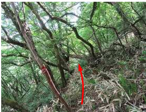
やや急な山腹斜面を横断する。