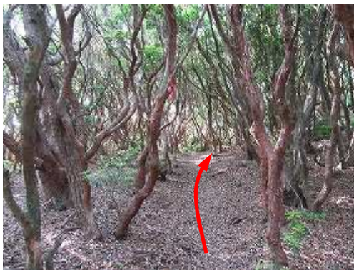
アセビ林のトンネルを抜ける。