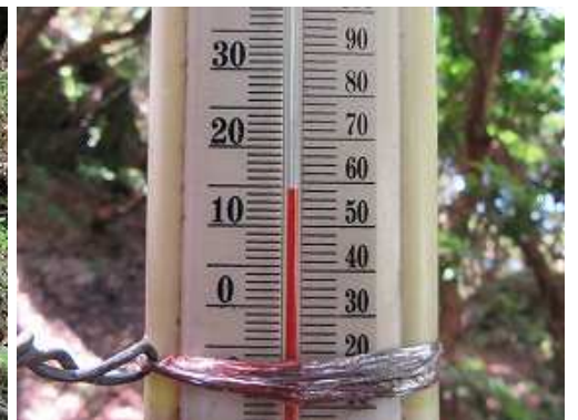
傍の寒暖計は14℃を示していた。