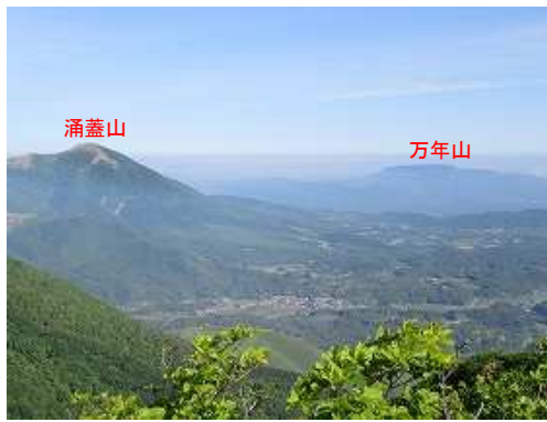
上泉水山から北西を望む。