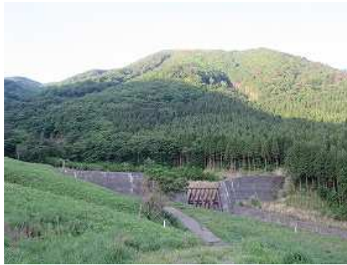
右の潤れた古井川に砂防ダムを見る。