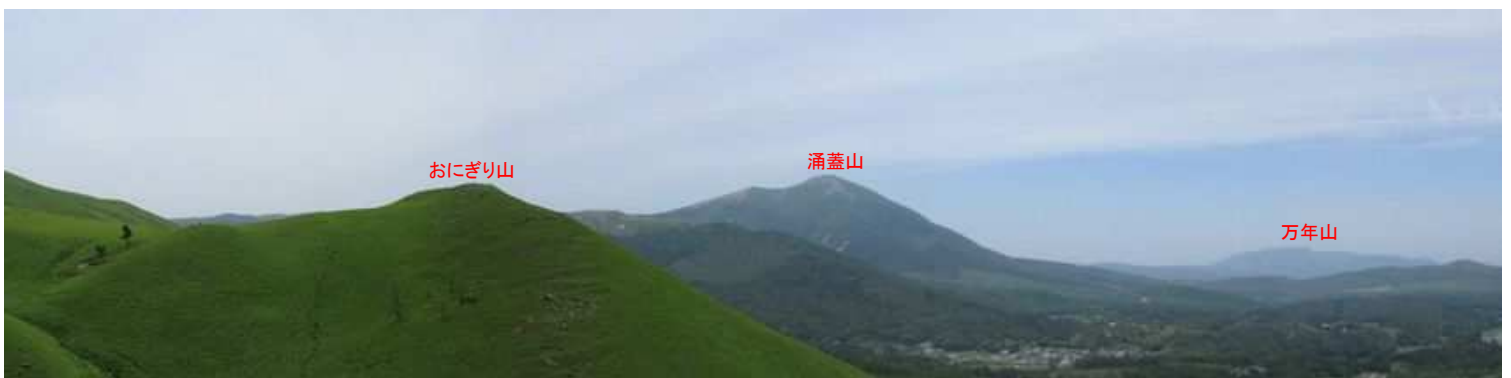
小にぎり山から北西を望む。