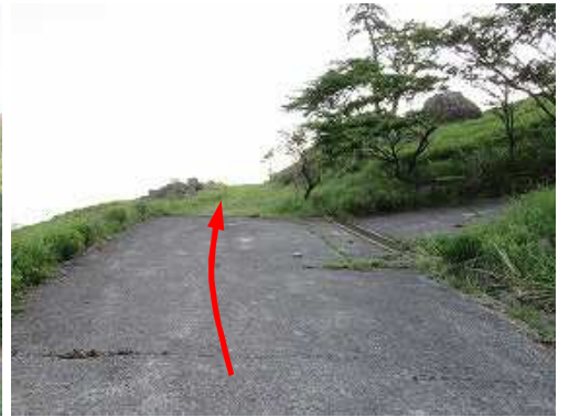
資材路分岐に出合い直進する。