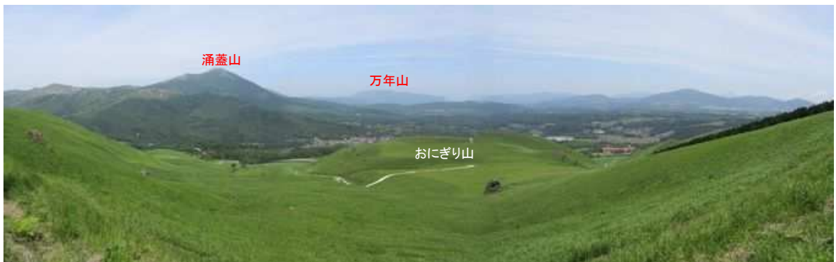
牧野出口からの展望。