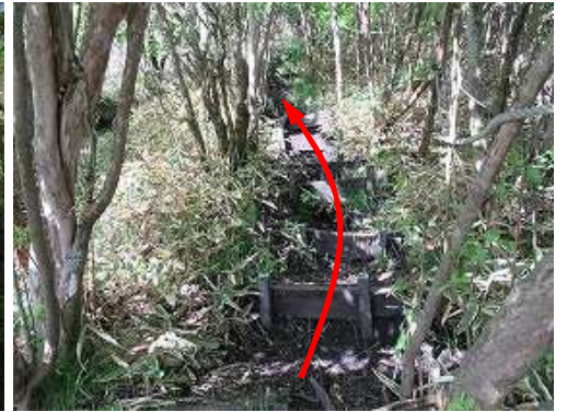
上泉水山への急な板階段を上る。