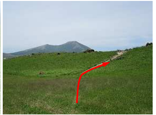
おにぎり山へ緩やかに登って行く。