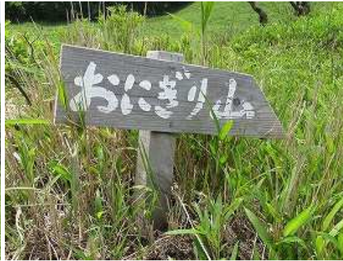
降ると、おにぎり山案内板を見る。