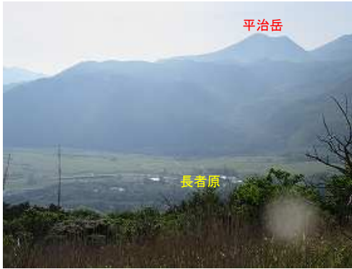
東に長者原と平治岳を望む。