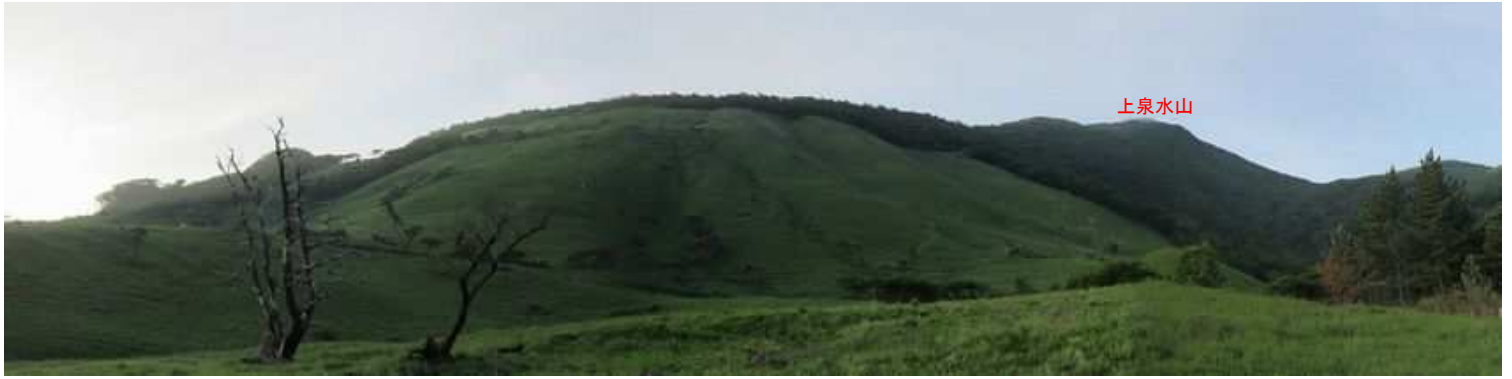
駐車地から南東を望む。