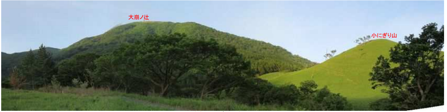
駐車地から南西を望む。

駐車地→資材路分岐→三角点→岩に泉水山→縦走路出合→下泉水山(1296m)→上泉水山(1447m)→たぬきピーク→大崩ノ辻(1458m)→縦走路取付き→牧野出口→おにぎり山(1083m)→小にぎり山(1051m)→駐車地