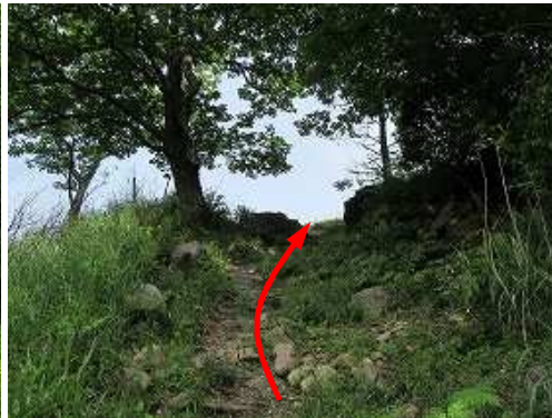
作業路の前方が開けて来た。