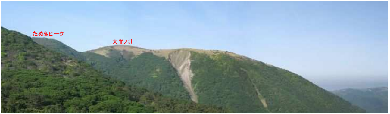
南西に大崩ノ辻を望む。