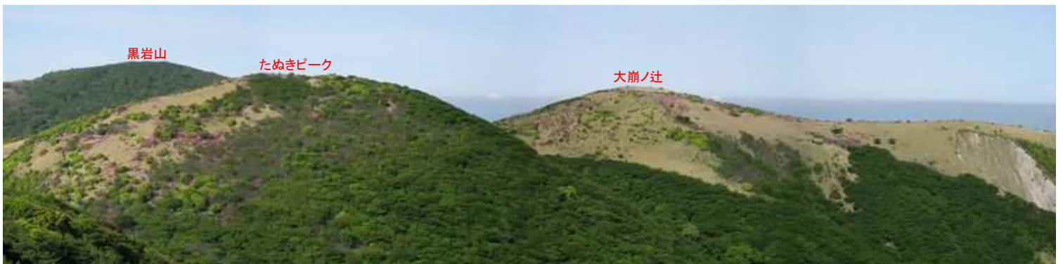
上泉水山から西南西を望む。