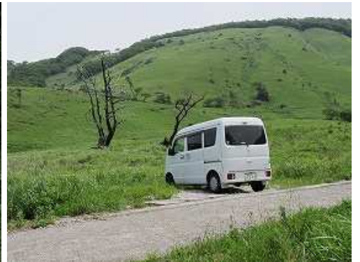
駐車地に帰り着いた。