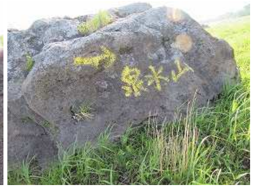
岩に泉水山を通過する。