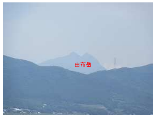
小にぎり山から由布岳を望む。