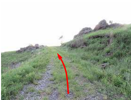
未舗装の作業路を緩やかに登って行く。