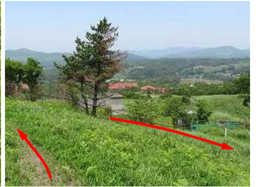
作業路を北へ向かい金網の手前から古井川へ下る。