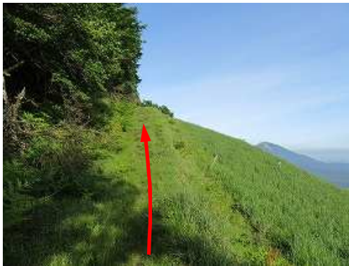
牧野上部の草付き路を進む。