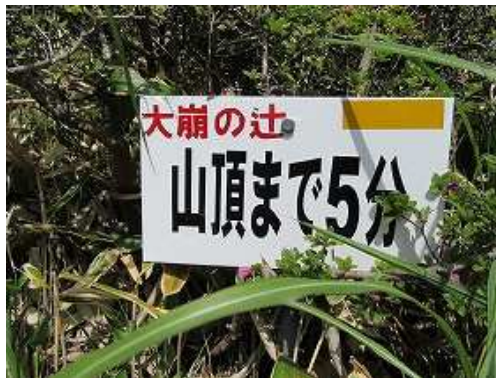
北西斜面を下り登り返すと山頂まで5分の案内板を見る。