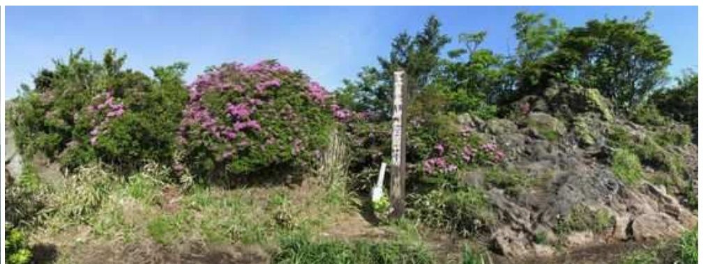
尾根筋にある上泉水山(1447m)の山頂。