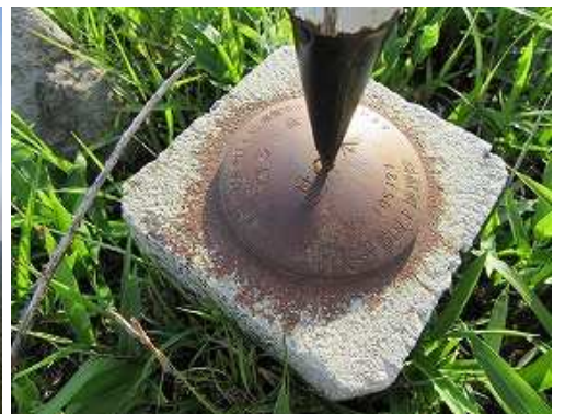
四等三角点: 泉水に立ち寄る。