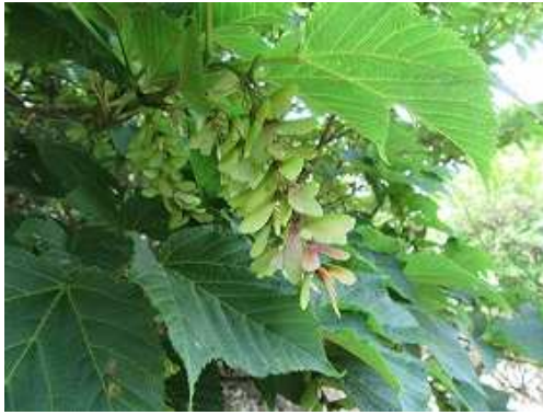
ウリハダカエデ 実