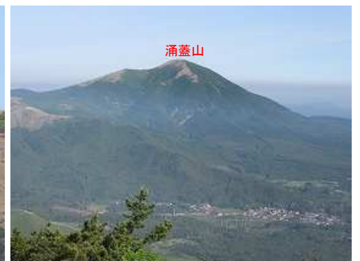
西北西に涌蓋山を望む。