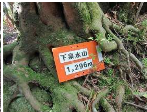
下泉水山(1296m)の山名板を見る。