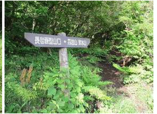
傍に立つ縦走路の案内板。青年の家方面への案内板は見当たらない。