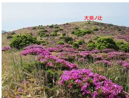
北へ延びる尾根筋から大崩ノ辻を振り返る。