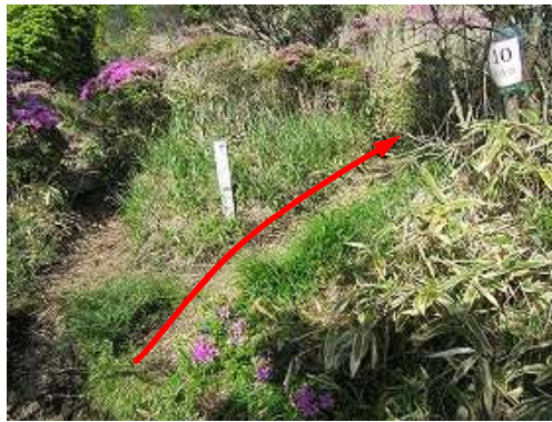
たぬきピーク分岐からササの斜面を登って行く。