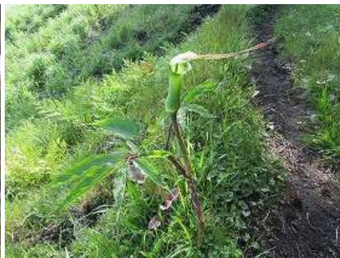
ツクシママムシグサ