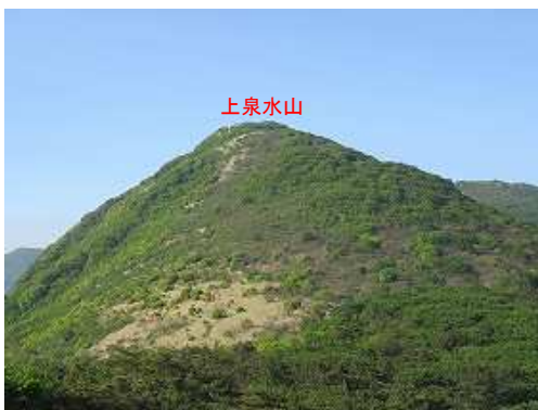
背後の展望岩に上がり、南南西に上泉水山を望む。