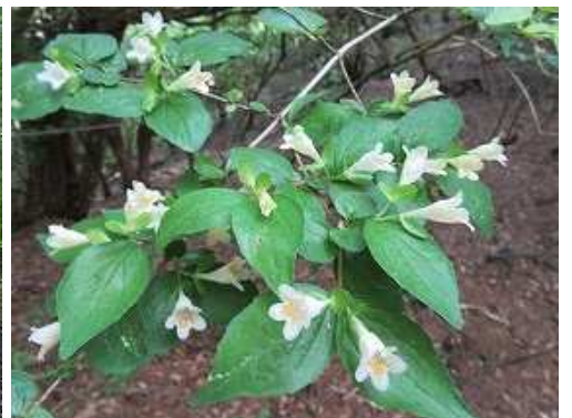
コツクバネウツギ