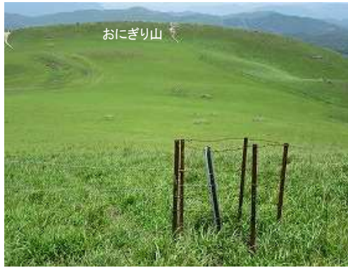
牧野の草付き斜面を北に緩やかに降り、有刺鉄線出入口を抜ける。