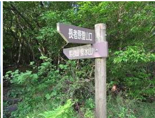
この案内板から山中に入る。