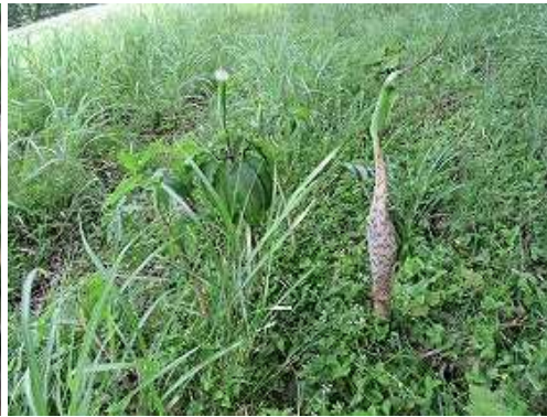
ツクシヒトツバテンナンショウ