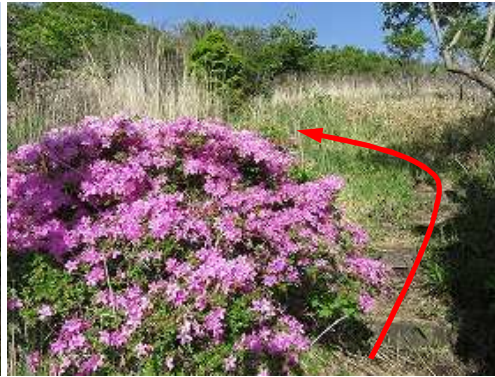
コルから緩やかに登って行く。