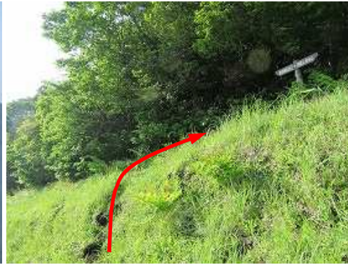
前方に案内板が見え、縦走路に出会う。