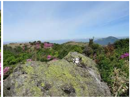
たぬきピークの狸の置物。