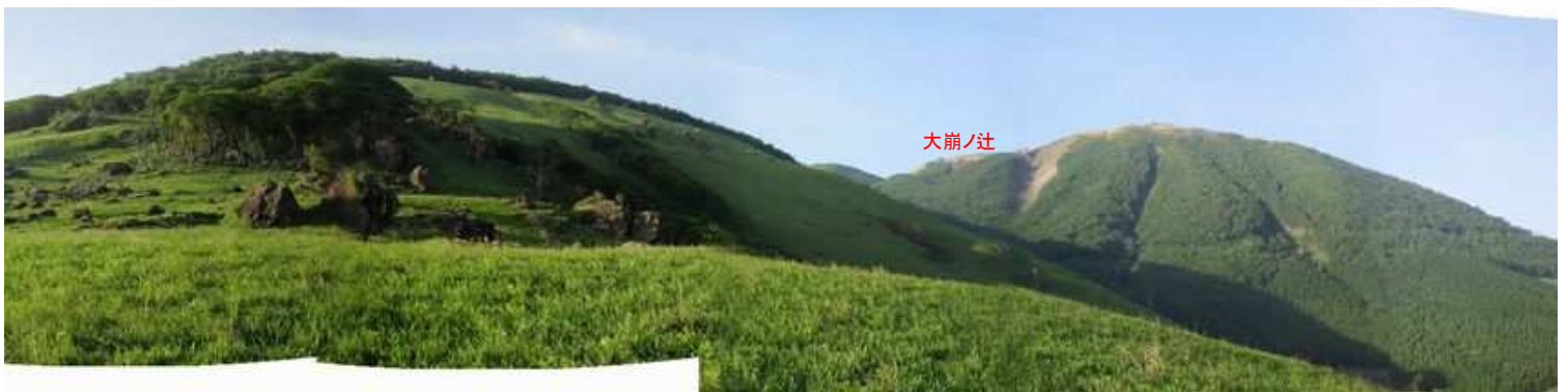
三角点から南南西に大崩ノ辻を望む。