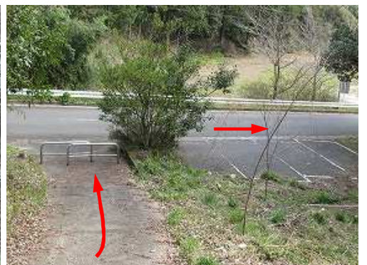
第2登山口に降り、右へ向かう。