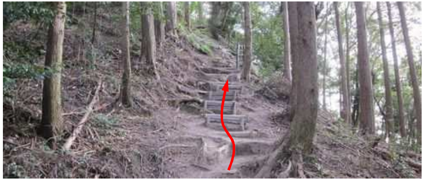
擬木階段を登って行く。