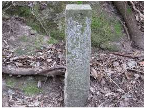
切通の右側に道標が立つ。