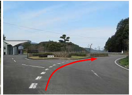
華石苑を左に見て通過する。