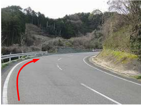
道なりに緩やかに上って行く。