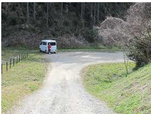
駐車場へ帰りついた。