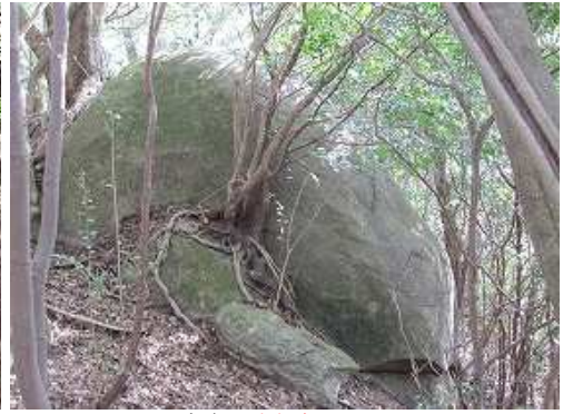
右奥に坊主岩を見る。