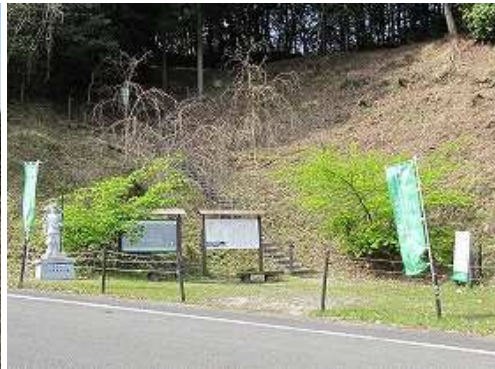
梶原登山口を左に見送る。