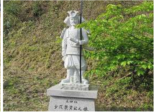
傍には少弐景資像が立つ。