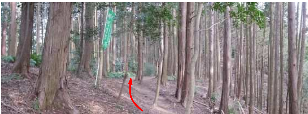
スギの植林帯を進む。