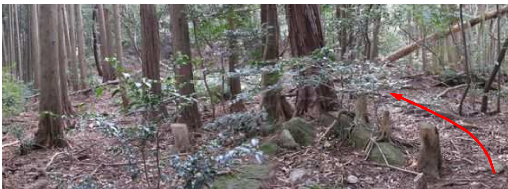
鈍頂の弱い尾根筋を緩く登って行く。