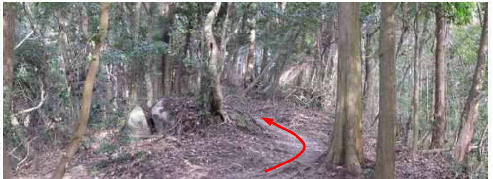
尾根筋を緩やかに登って行く。