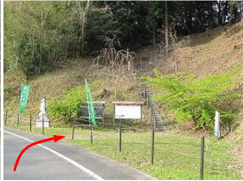
右側の 梶原登山口 に到着。