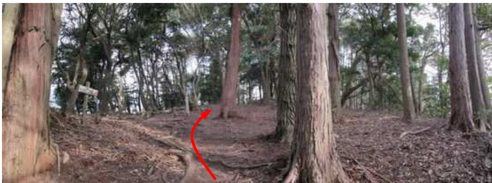
城山(195m)に到着。岩戸城の主郭部で曲輪群の最高峰に位置し平坦面積約180㎡。