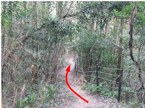
トラロープの土塁を抜ける。