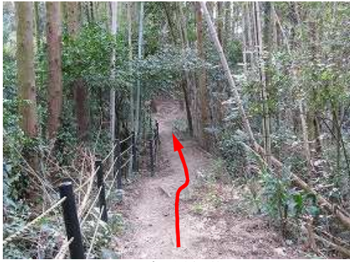
トラロープの土塁を抜ける。