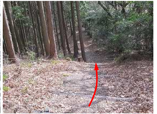
上梶原森林公園内に入り擬木階段を下って行く。