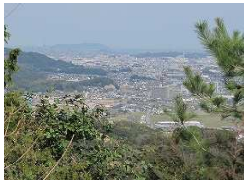
北西に福岡市街を望む。