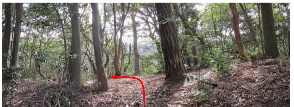
矢岳分岐の尾根筋に出会い、左折する。