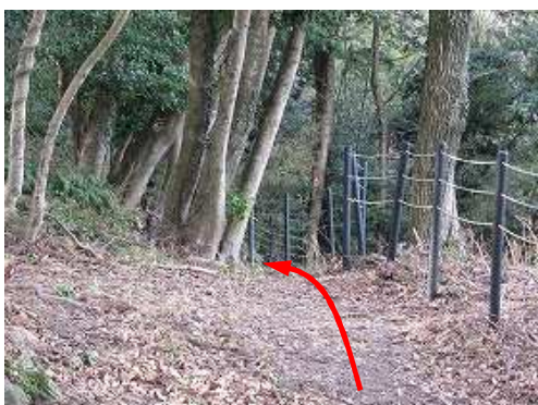
西側の柵に沿って主郭の中腹を迂回する。