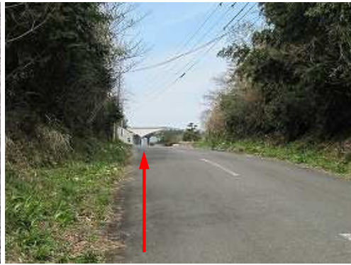
第2登山口へ引き返し、市道を道なりに進む。