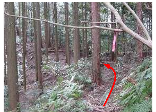
赤テープ沿いに弱い踏跡が延びている。