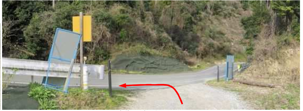
市道に出会い左に向かう。