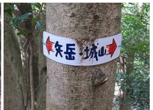
幹に←矢岳・城山→の案内板を見る。