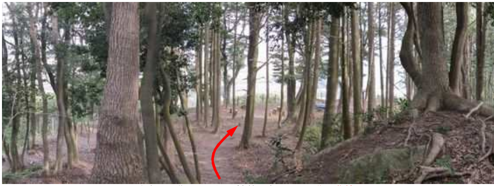
主郭から北へ向かうと、植林の奥が開けた北の曲輪。