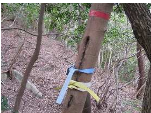
右の雑木の幹に巻かれたテープやヒモ。