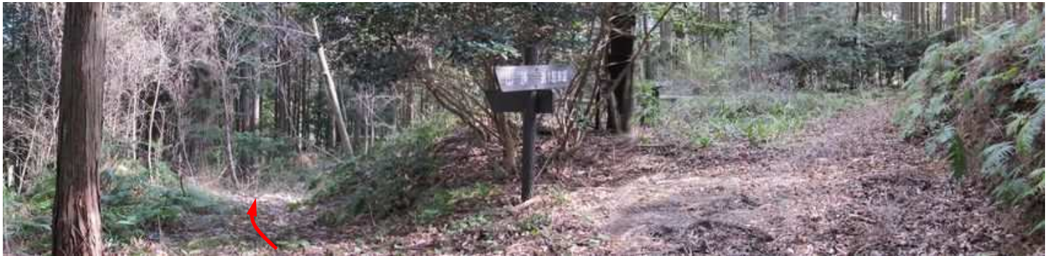
緩く下るとベンチ分岐に出会う。平場にベンチがある。左の東屋へ下る。