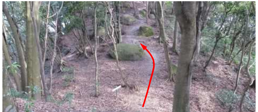
堀切へ下り、登り返す。