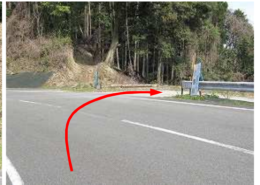
駐車場へ右折する。