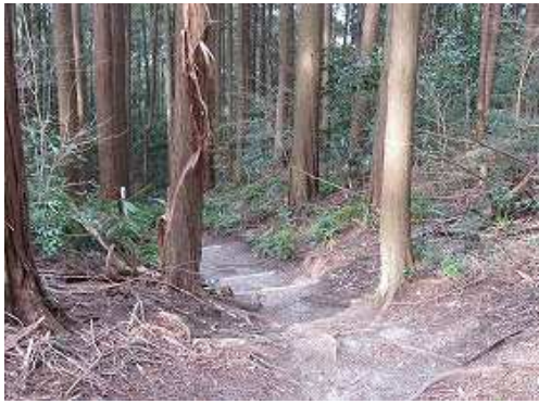
西へ下ると高津神社を経て山田へ至る。