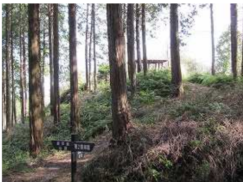
下ると東屋分岐に出会い、その奥に東屋を見る。