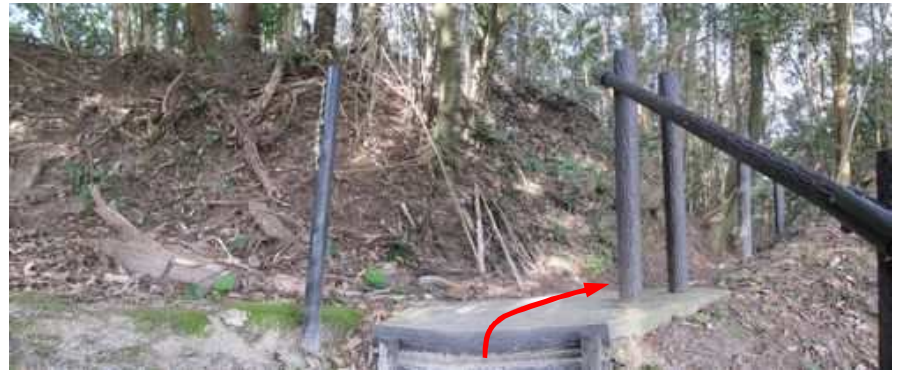
城山～矢岳の 縦走路 に登り上がり、右へ向かう。