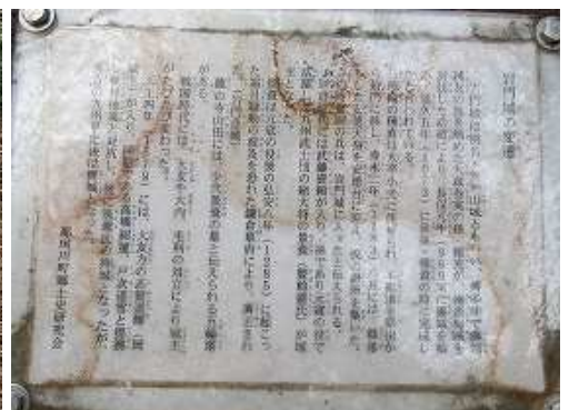
主郭に立つ説明版。