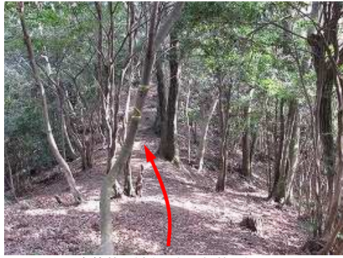
自然林の緩やかな尾根筋に行く。