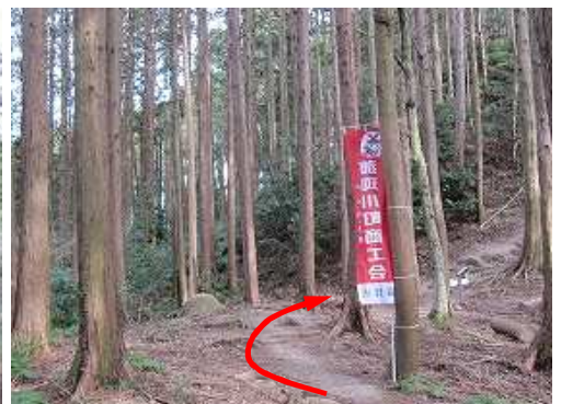
尾根分岐に出会う。