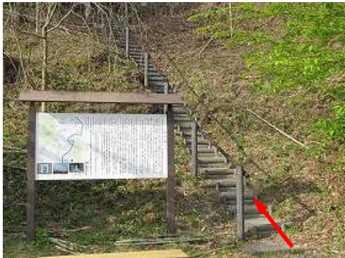
案内板に目を通し、擬木階段に取付く。