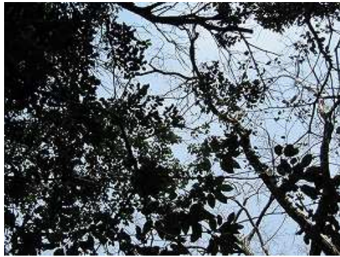
赤杭の上空。周囲を雑木や植林に囲まれ展望は得られない。