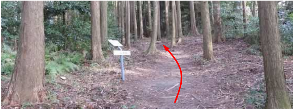
三の曲輪に到着。奥へ向かう。