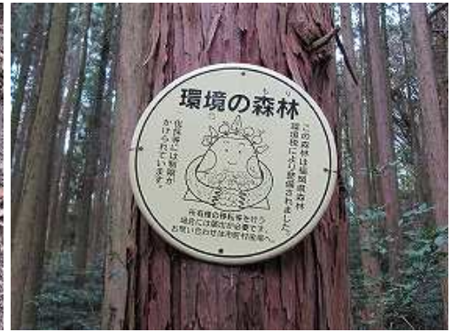
スギの幹に森林看板を見る。