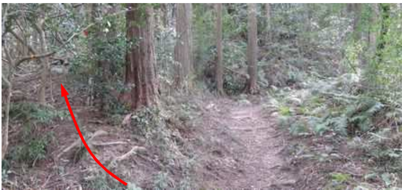
森林公園分岐 此処から左の山中へ入り上梶原森林公園を目指す。案内板はないが枝に赤テープがある。