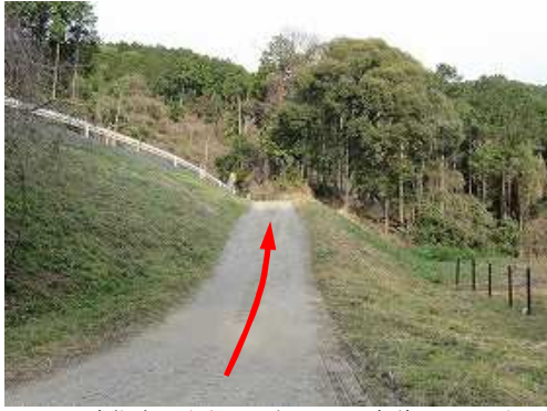
那珂川市指定の 駐車場 に車を止め、市道に引き返す。