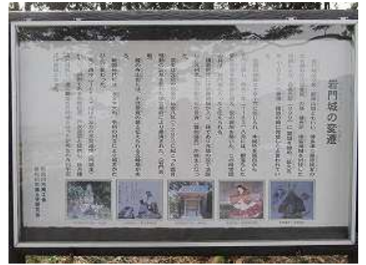
北の曲輪に立つ案内板。