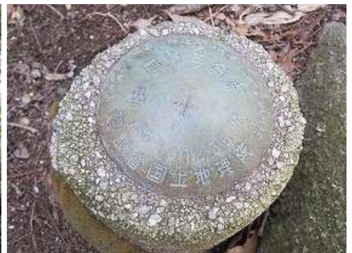
四等三角点:城ノ越が設置されている。