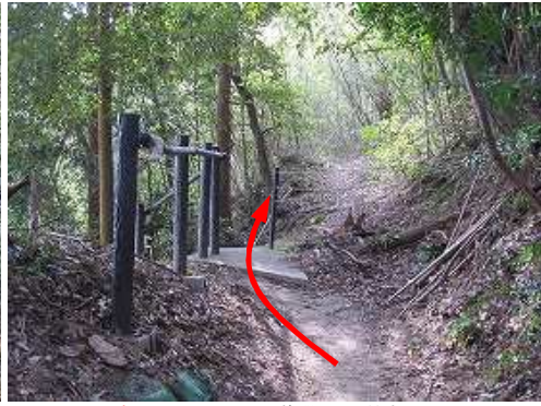
梶原登山口への階段を通過する。