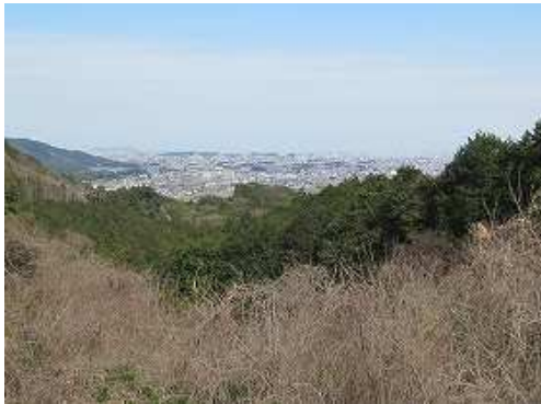
市道の開けた所から福岡市街を望む。