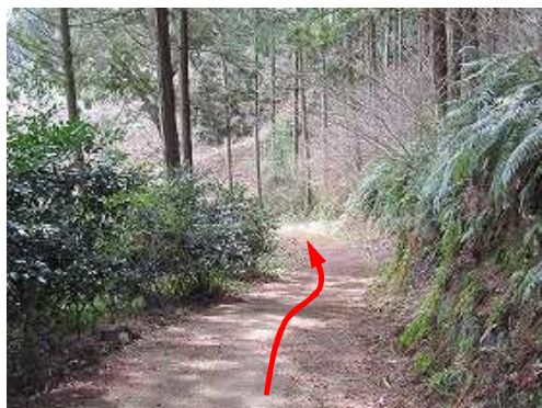
引き返し、舗装路を緩く下って行く。