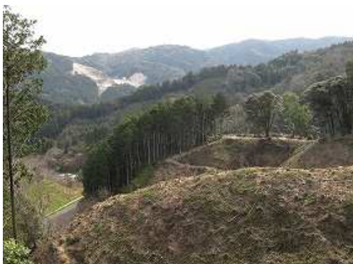
東の展望所を望む。