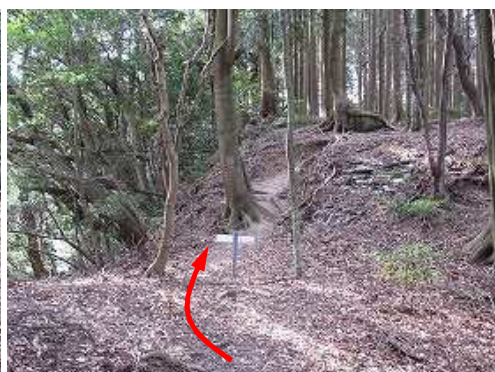
堀切に出会い、二の曲輪へ向かう。