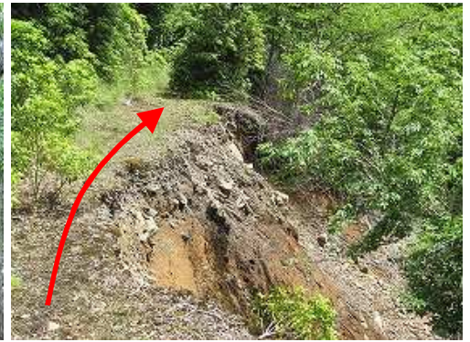
路肩崩落地を通過する。