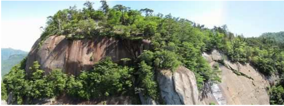
北に鋒岳(雄鋒)を望む。