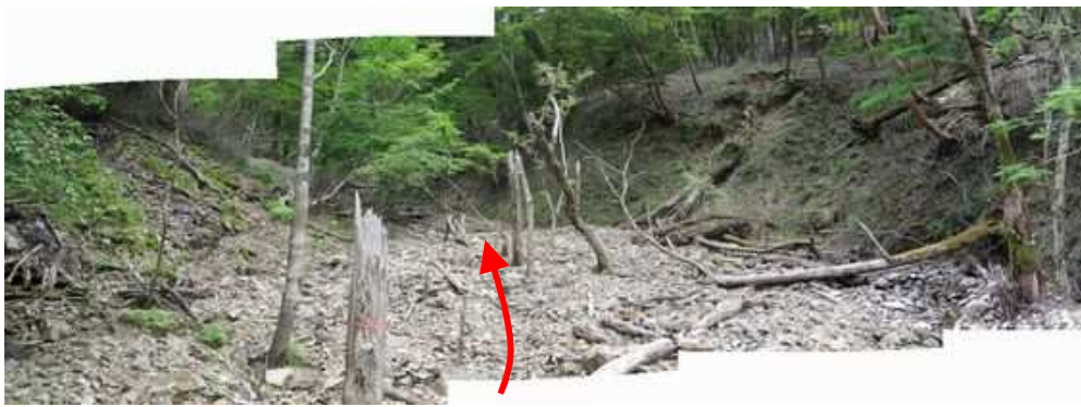
林道が消失し 濁沢 の赤テープを拾いながら上流へ進む。