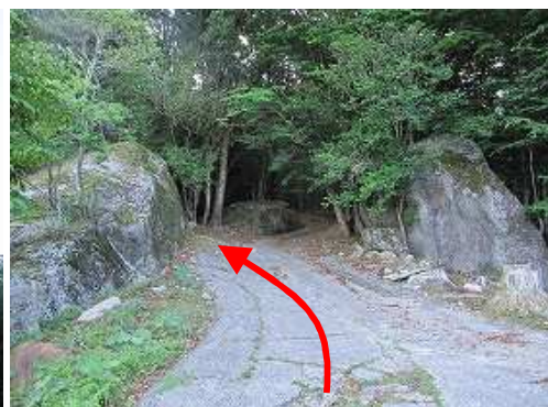
二ツ岩の間を抜ける。