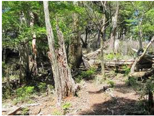
緩やかに尾根筋を進む。