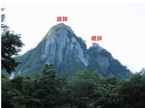
雄鉾(オンボコ)雌鉾(メソボコ)を見上げる。