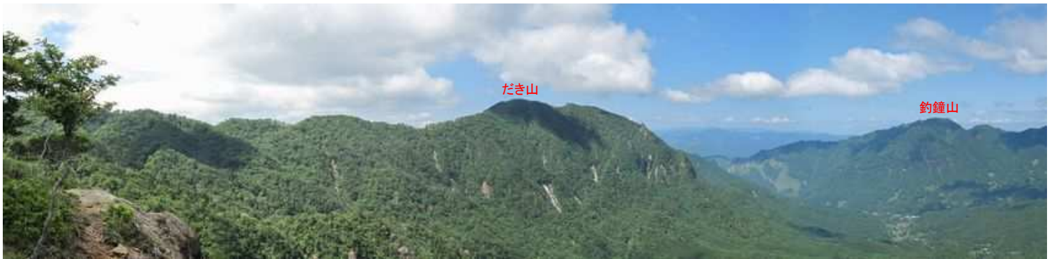
展望地からの眺望(1)