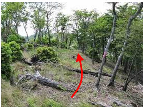
鈍頂の尾根筋に行く。