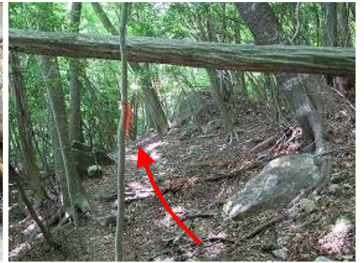
緩やかに自然林を下って行く。