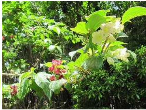
ツクシヤブウツギ