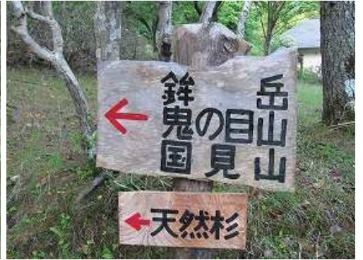
入口右に立つ案内板。