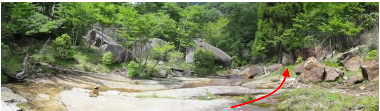
明るいナメ床の河床を流れに沿って下って行く。