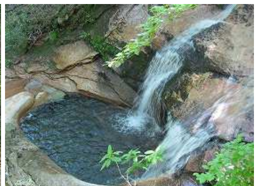
左下に2条滝を見送る。