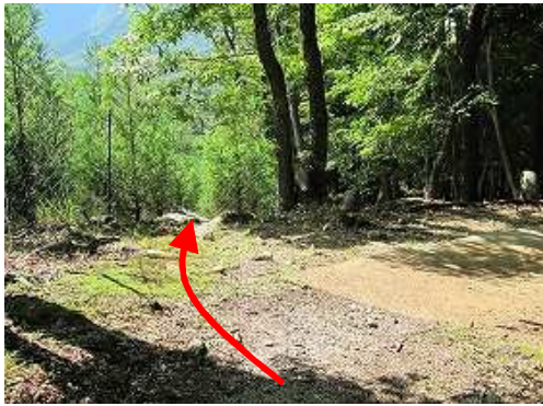
林道終点に出会う。