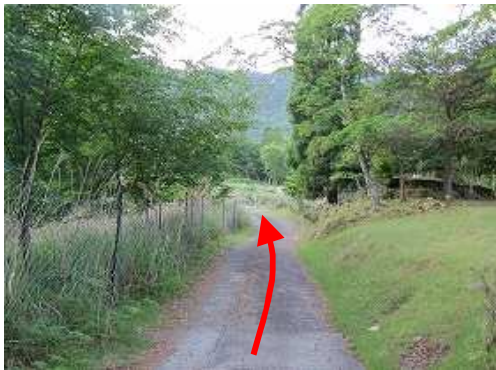
緩やかに舗装路を登って行く。