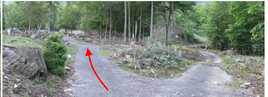
天然杉分岐に出会うが、左へ進む。