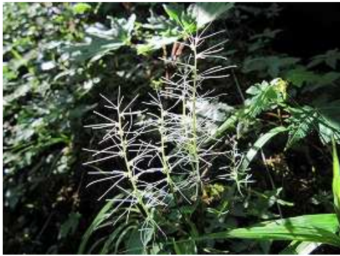
チャボシライトソウ