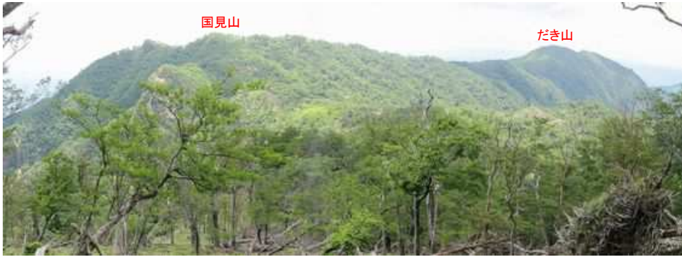
国見山からだき山を眺望する。