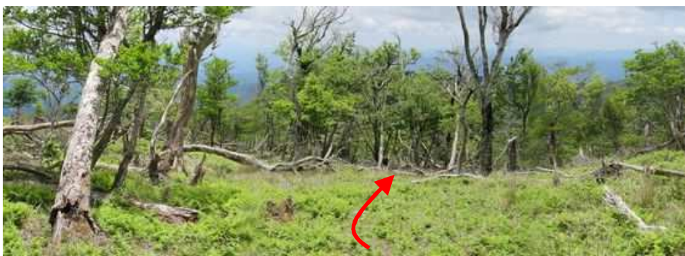
南へ緩く尾根筋を降って行く。