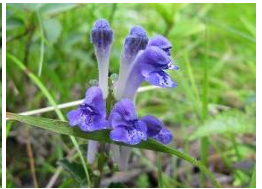
ツクシタツナミソウ