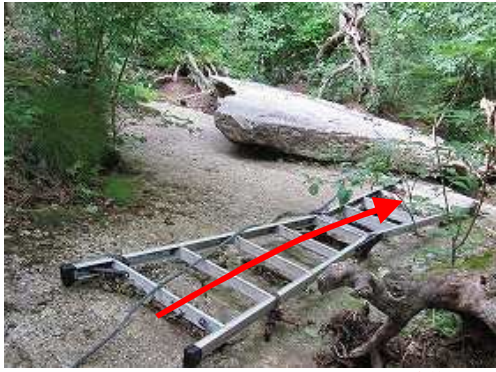
ハシゴ場の2つのハシゴを下る。