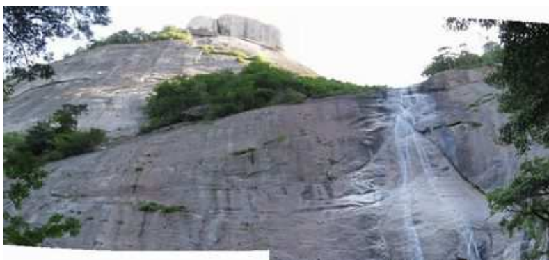
鉾岳大滝を見上げる。