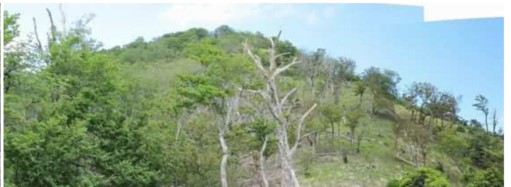
尾根筋から鬼の目山を振り返る。