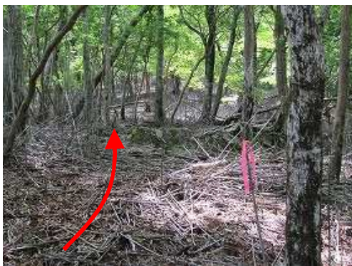
枯れたスズク斜面の赤ヒモを拾いながら緩く登って行く。