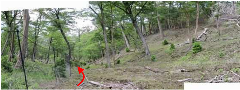
ネット沿いに緩く降って行く。