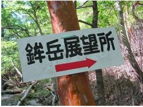
右に鉾岳展望所の案内板を見る。