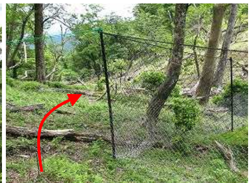
緩く降ると弱いコルで ネット に出会う。