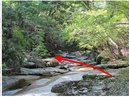
渡渉B 右岸へ渡渉する。