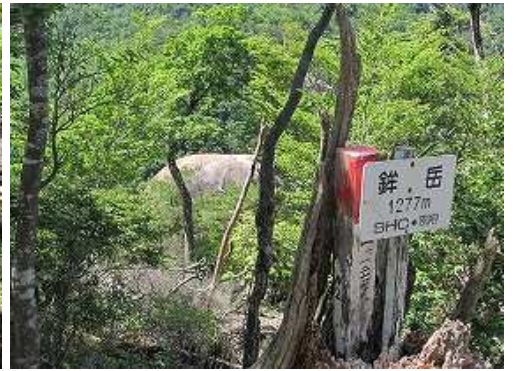
鋒岳(1277m)の山頂で背後は雌鋒。此处からの展望は得られない。