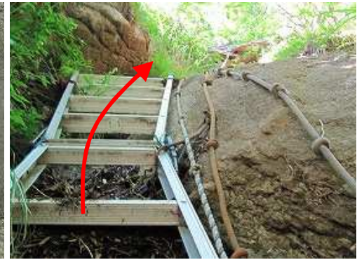
雌鉾下部のハシゴを登り上がる。