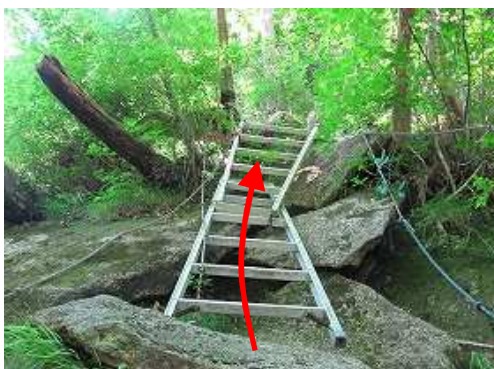
ハシゴ場で2ヶ所のアルミ梯子を乗り越える。