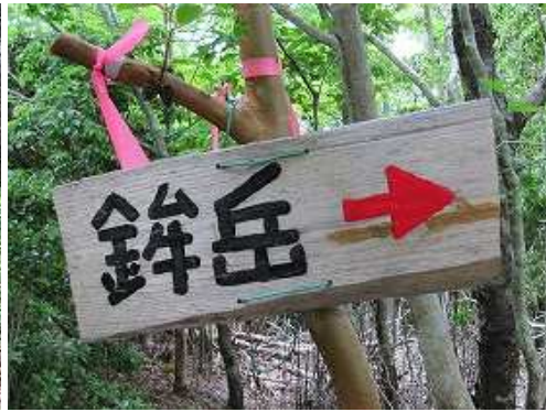
出口の枝に掛けられた案内板。