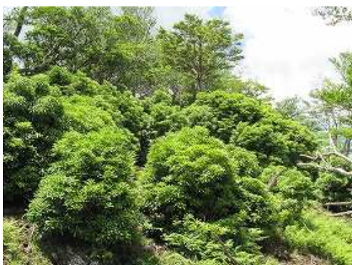
P1291はアセビに囲まれたピークであるが展望は得られない。