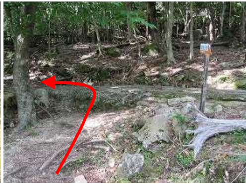
登山口を通過する。