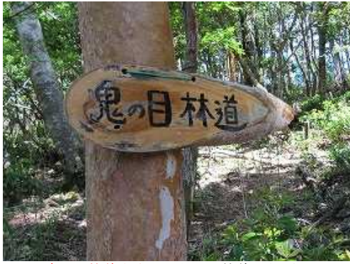
鬼の目林道分岐まで引返し、林道へ向かう。