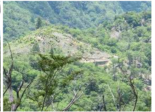
南西に鉾岳林道を確認する。