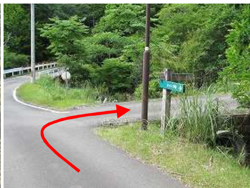
駐車場へ右折する。