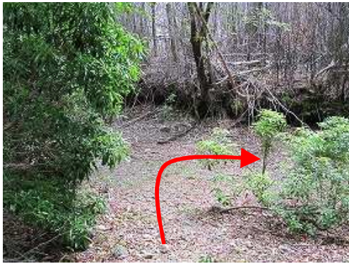
林道に出合い右に向かう。