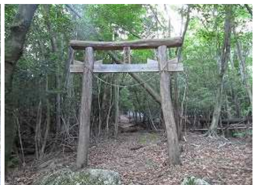
左に鉾岳大明神の鳥居を見送る。