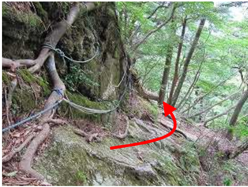
残置ザイルのトラバース。