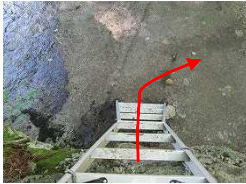
沢のハシゴを下る。