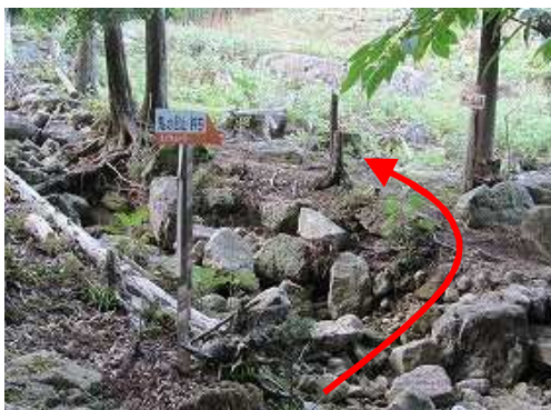
直ぐ、右の登山口に出合い林道から離れる。