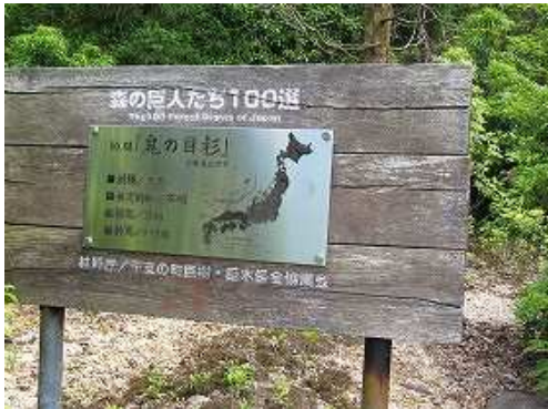
鬼の目杉の案内板。樹高20m 幹周9.99mとあるが付近に、そのような大スギは見当たらずに二代目も枯死しているようだ。