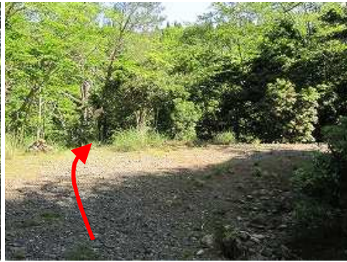
鉾岳入口 林道が右カーブする所から下る。