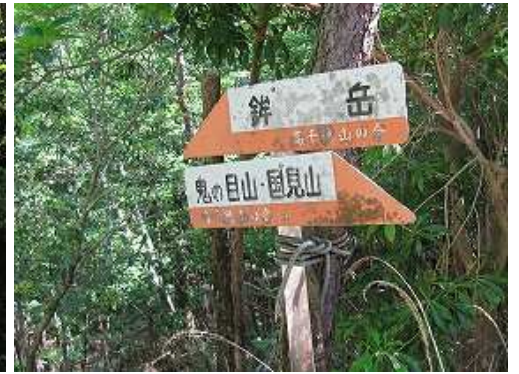
入口に立つ案内板。