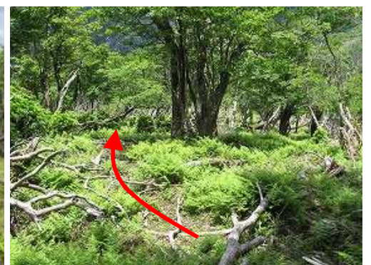
赤ヒモを拾いながら下って行く。