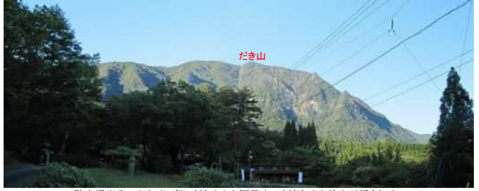
駐車場出入口からは、南にだき山から国見山へと連なる山並みが望まれる。