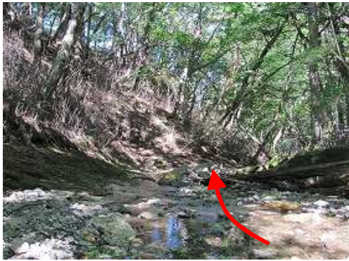
沢沿いに下って行く。