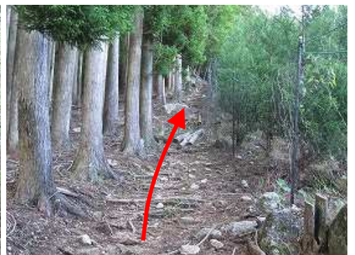
ネットとスギ植林の間を進む。