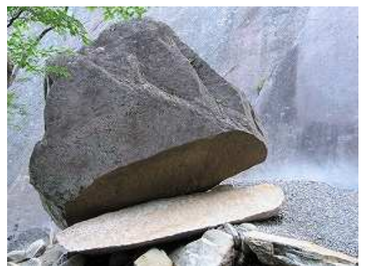
バック岩に立ち寄る。