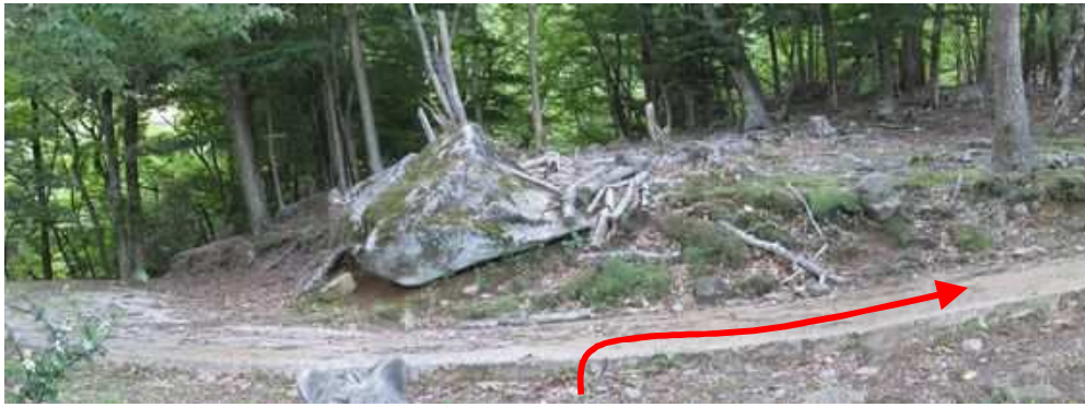
林道終点に出会い右へ進む。