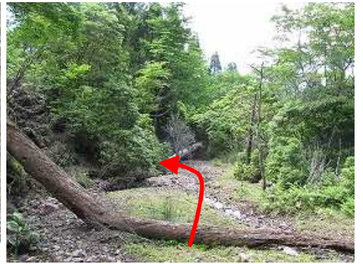
鉾岳林道に出会う。