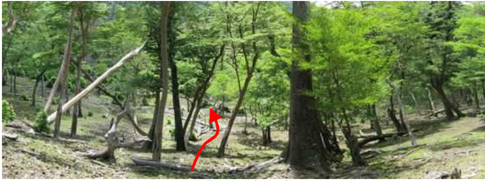
尾根筋から西へ斜面を降る。