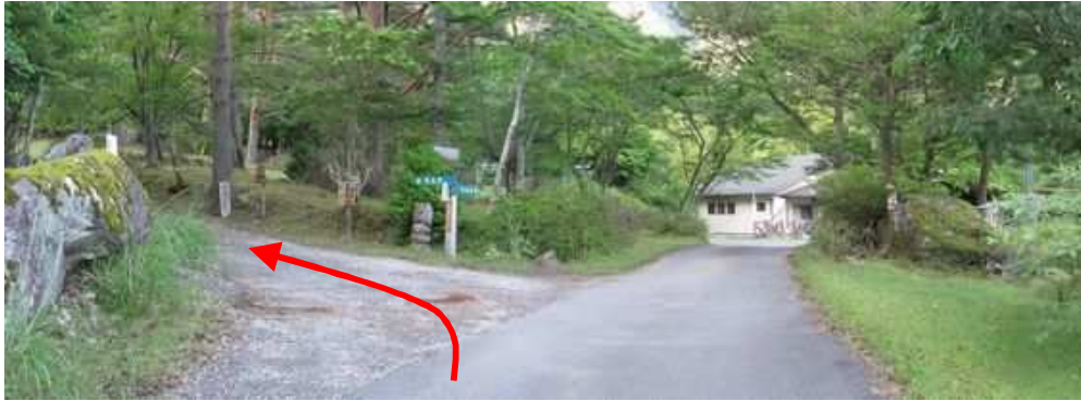
キャンプ場の管理棟に向かう途中、左に林道入口があり左折する。