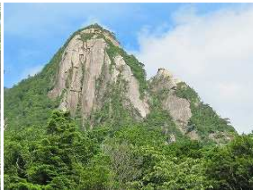
振り返ると雄銚・雌銚が並び立つ。