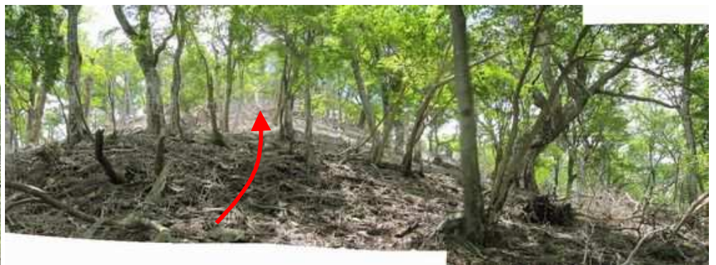
枯れたスズク斜面の奥に 鬼の目山 の山頂が見えて来た。