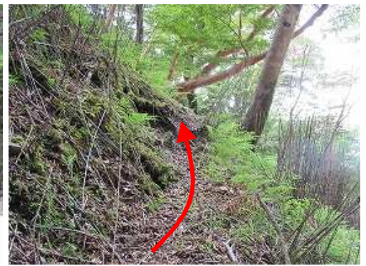
左岸斜面を斜上する。