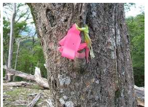
枝に結ばれた赤テープを見る。