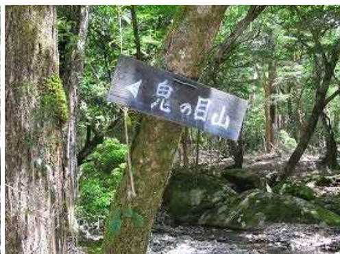
鬼の目山への案内板を通過する。