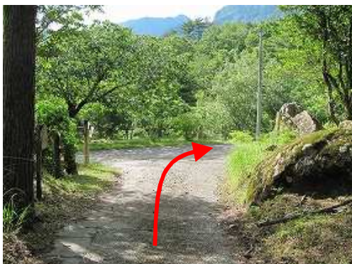
林道入口を右折する。