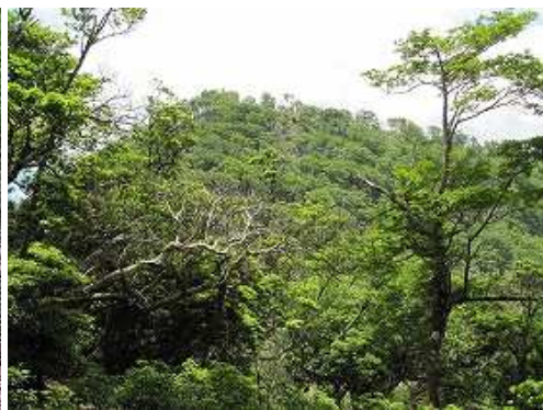
尾根筋から鬼の目山の山頂部が見えた。