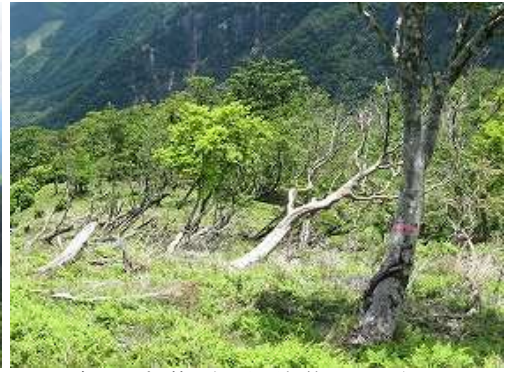
赤テープを拾いながら尾根筋を下って行く。