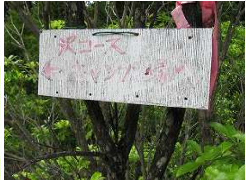
沢コース入口の案内板を見て沢沿いに進む。