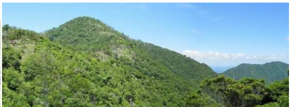
近くの裸地から鬼の目山を振り返る。