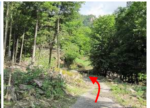
天然杉分岐を通過する。