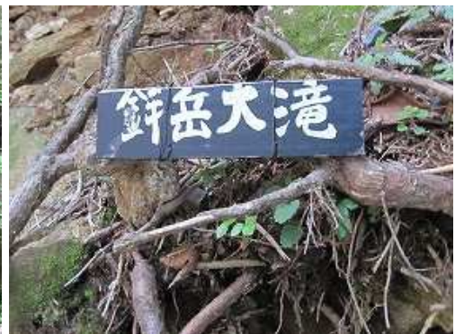
鉾岳大滝の案内板を見る。