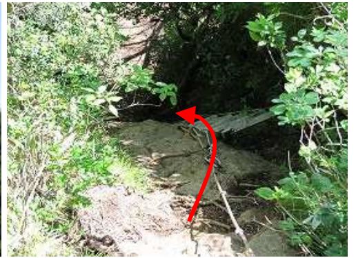
下部のハシゴを下る。