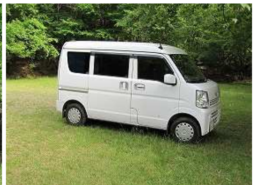
鹿川キャンプ場の駐車場へ帰着いた。