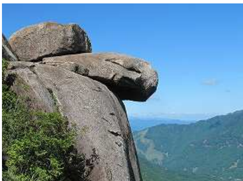
西に雌鉾の亀岩を見る。