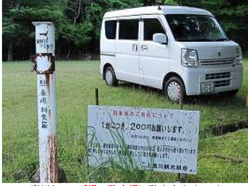
鹿川キャンプ場の駐車場に駐車する。(¥200)

キャンプ場P→登山口→渡渉A→渡渉B→鉾岳入口→雌鉾岳(1231m)→鉾岳(1277m)→潤沢→鬼の目山(1491m)→P1291→沢コース入口→渡渉B→渡渉A→登山口→鉾岳大明神→キャンプ場P