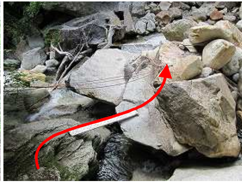
渡渉A アルミ板を渡り右岸へ。