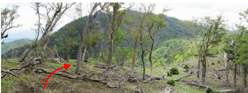
なだらかな尾根筋を国見山へと進んで行く。