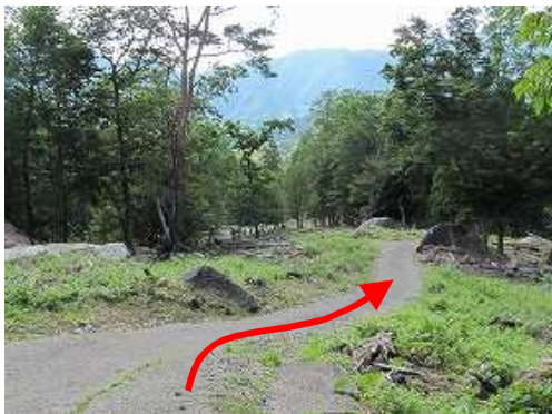
舗装路を道なりに下って行く。