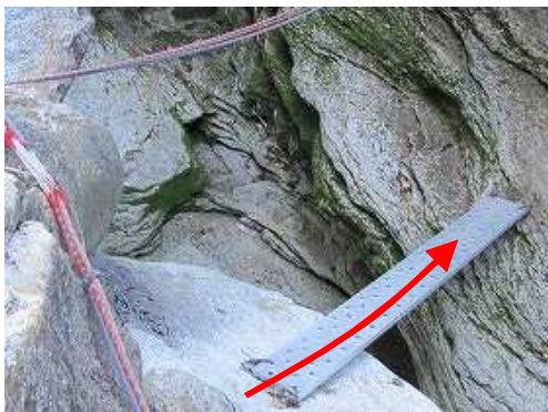
渡渉A アルミ板を渡り左岸へ。