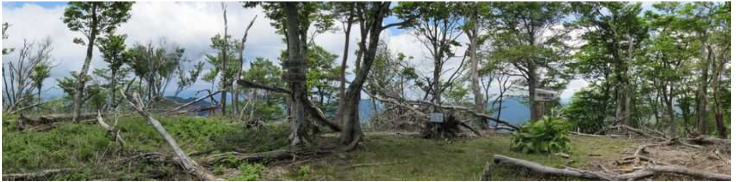
山頂遠景 昔はスズタケが生い茂っていたが枯れ果ててしまった。