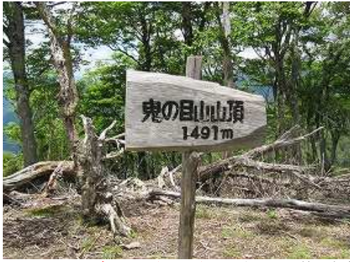
鬼の目山(1491m)の山頂には、三等三角点:鬼目が設置され360°の展望が得られる。