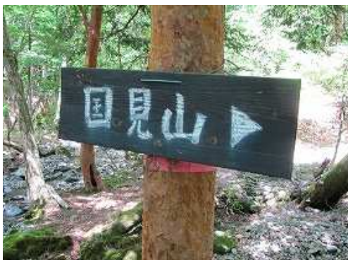
国見山への案内板を通過する。