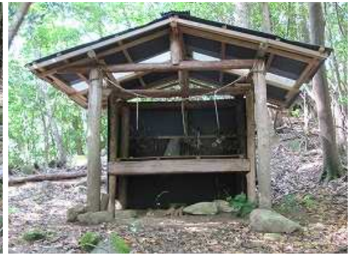
銚岳大明神に立ち寄る。