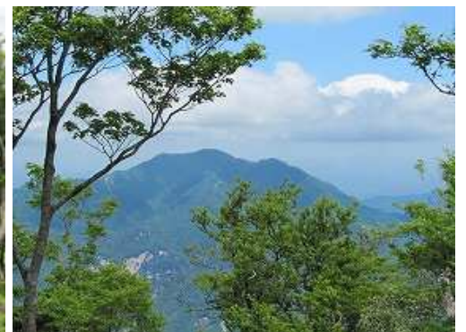
北東に桑原山を望む。