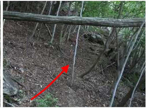
鹿川の右岸側を登って行く。