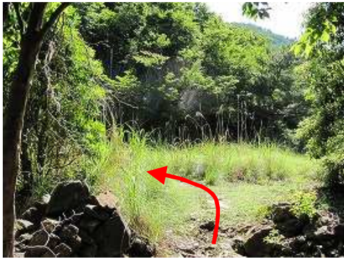
林道に出合い左へ進む。