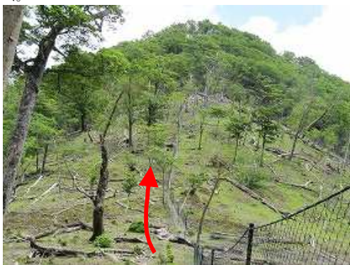
ネット沿いに緩く登って行く。