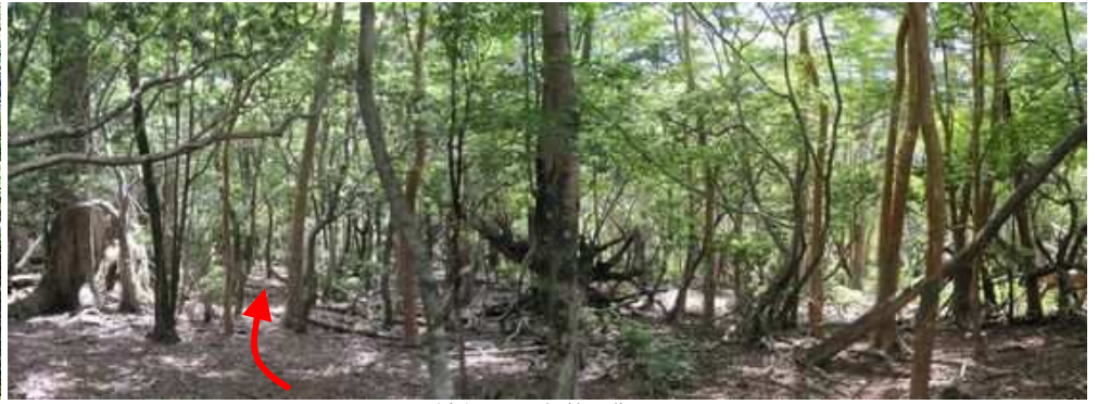
緩やかに尾根筋を進む。