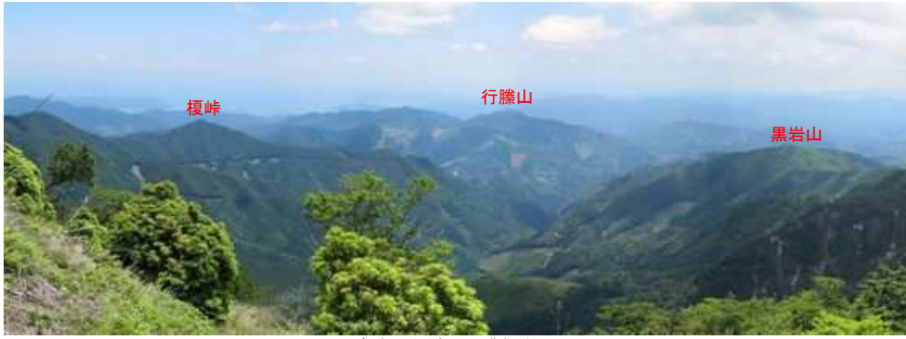
南東に行藤山を眺望する。