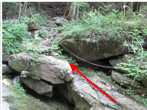
残置ザイルを伝って上部へ進む。