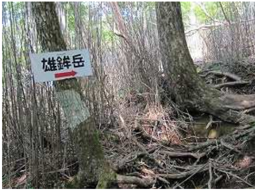
枯れたスズタケの中を雄鋒へ向かう。