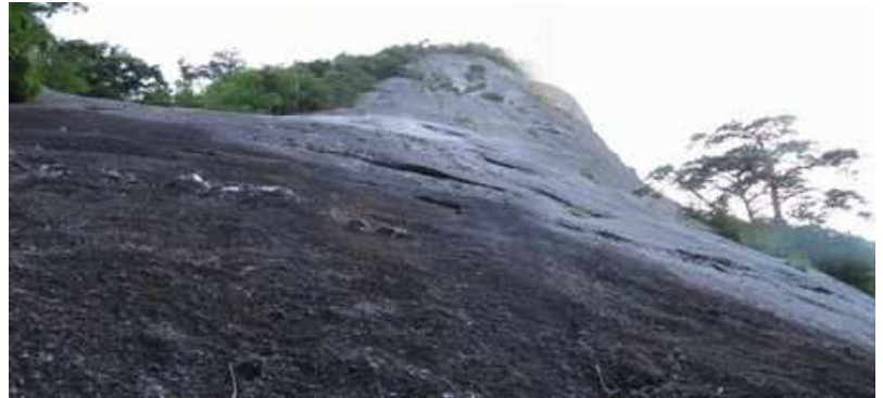
鉾岳スラブに立ち寄る。