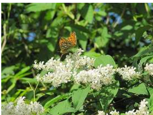
ウツギの蜜を吸うツマグロヒョウモン