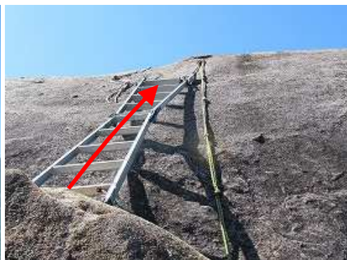
雌鉾直下のハシゴを登り上がる。