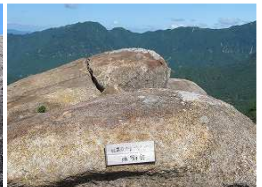
雌鉾岳は標高値で1231m。案内板には日本最大のスラブ(一枚岩)と書いてある。