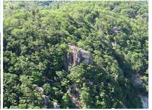
南に鋒岳展望所を見下ろす。